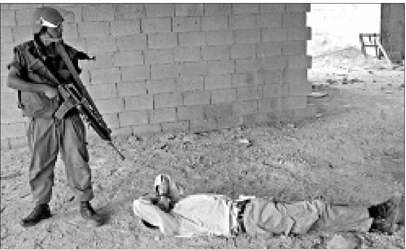
جندي اسرائيلي يصوب بندقيته نحو فلسطيني ملقى على الأرض بعد اشتباكات في مدينة بيت لحم الجمعة

باريس - «القدس العربي» - بيروت - «القدس العربي» - وكالات: ذكرت تقارير عبرية الجمعة ان الاردن وافق على ان تستخدم اسرائيل المدرج الجديد الذي سيقام في مطار العقبة الى حين اقامة المدرج في «عين عربونا» من الجانب الاسرائيلي قبالة مدرج المطار الاردني. ويمكن الاتفاق الذي وقع الأول من نيسان في البلدين الاردني - الاسرائيلي المشترك في عام 2001، ويحل المطار على غرار ما يجري اليوم في مطار جنيف بين سويسرا وفرنسا. وقالت اسرائيل الجمعة انها اتفقت مع الاردن على بدء انشاء المطار المشترك بالقرب من الحدود بين مدينتي ايلات والعقبة الساحليتين، واصر مكتب رئيس الوزراء ايهود باراك بيانا يفيد ان الاتفاق الذي وقعته مسؤولون من وزارتي في البلدين الاردني - الاسرائيلي المشترك في عام 2001، ويحل المطار على غرار ما يجري اليوم في مطار جنيف بين سويسرا وفرنسا. وقالت اسرائيل الجمعة انها اتفقت مع الاردن على بدء انشاء المطار المشترك بالقرب من الحدود بين مدينتي ايلات والعقبة الساحليتين، واصر مكتب رئيس الوزراء ايهود باراك بيانا يفيد ان الاتفاق الذي وقعته مسؤولون من وزارتي في البلدين الاردني - الاسرائيلي المشترك في عام 2001، ويحل المطار على غرار ما يجري اليوم في مطار جنيف بين سويسرا وفرنسا. وقالت اسرائيل الجمعة انها اتفقت مع الاردن على بدء انشاء المطار المشترك بالقرب من الحدود بين مدينتي ايلات والعقبة الساحليتين، واصر مكتب رئيس الوزراء ايهود باراك بيانا يفيد ان الاتفاق الذي وقعته مسؤولون من وزارتي في البلدين الاردني - الاسرائيلي المشترك في عام 2001، ويحل المطار على غرار ما يجري اليوم في مطار جنيف بين سويسرا وفرنسا.