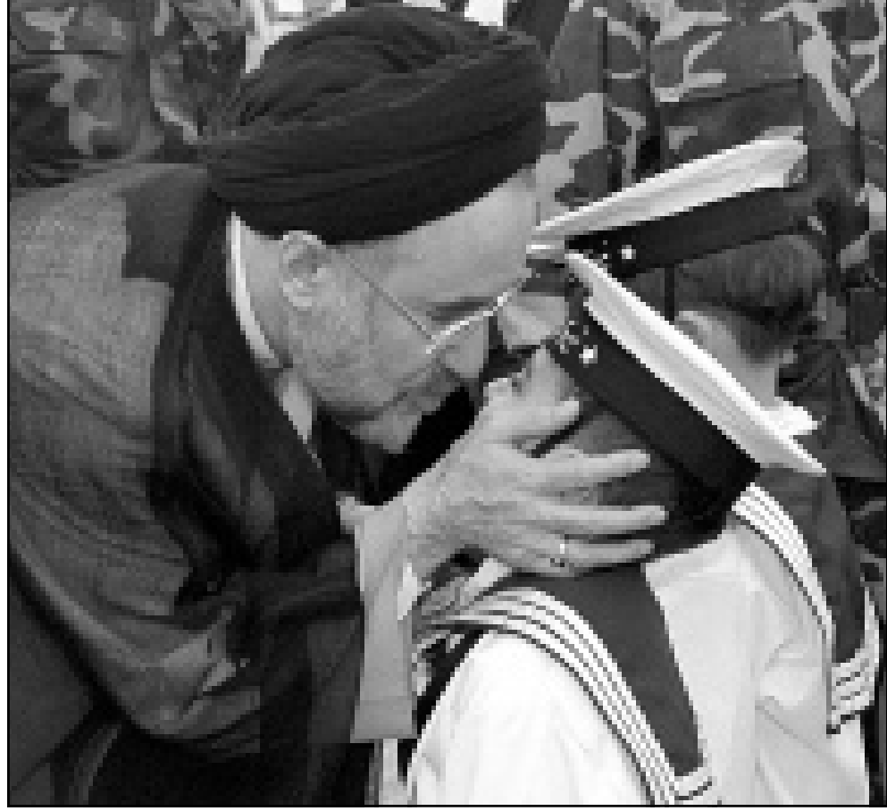
الرئيس خاتمي يتحدث إلى تلميذ في الكلية البحرية الإيرانية خلال مشاركته في حفل تخريج جري الخميس في مدينة نورشهر الشمالية