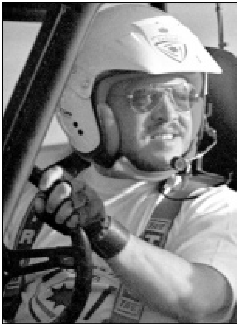
الملك عبد الله يقود سيارته خلال المشاركة الاستعراضية في الرالي