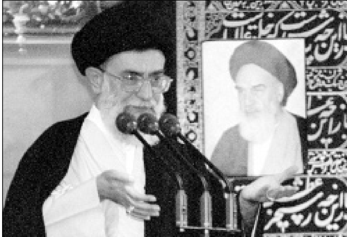
مرشد الجمهورية الايرانية آية الله علي خامنئي اثناء الفاء خطاب في طهران الجمعة

طهران تعلن توقيف عضو في مجاهدي خلق على الحدود العراقية