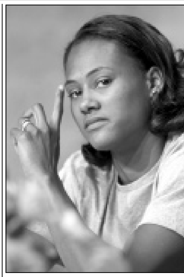
بطلة العالم في سباق 100 متر عدو للنساء الامريكية ماريون جونز خلال مؤتمر صحافي عقدته لاعلان اشتراكها في بطولة اوزاكا اليابانية السبت

ويتاهل الى نصف النهائي الفريق الذي يسبق منافسه الى الفوز 4 مرات في سبع مباريات، وازدادت مهمة يوتا جاز وعلاقه كارل مالون صعوبة لانه بات مرغما على الفوز في المباريات الاربعة المتبقية للتأهل الى نصف النهائي. وتقام المباراة الرابعة الاحد في سولت لاك سيستي، على ان يستضيف بورتلاند الخامسة الثلاثاء المقبل، ثم يستضيف يوتا المباراة السادسة في 18 الحالي، وبورتلاند السابعة في 20 منه. في سولت لاك سيستي وامام 19911 متفرجا، فشل يوتا جاز في تحقيق فوزه الاول على بورتلاند