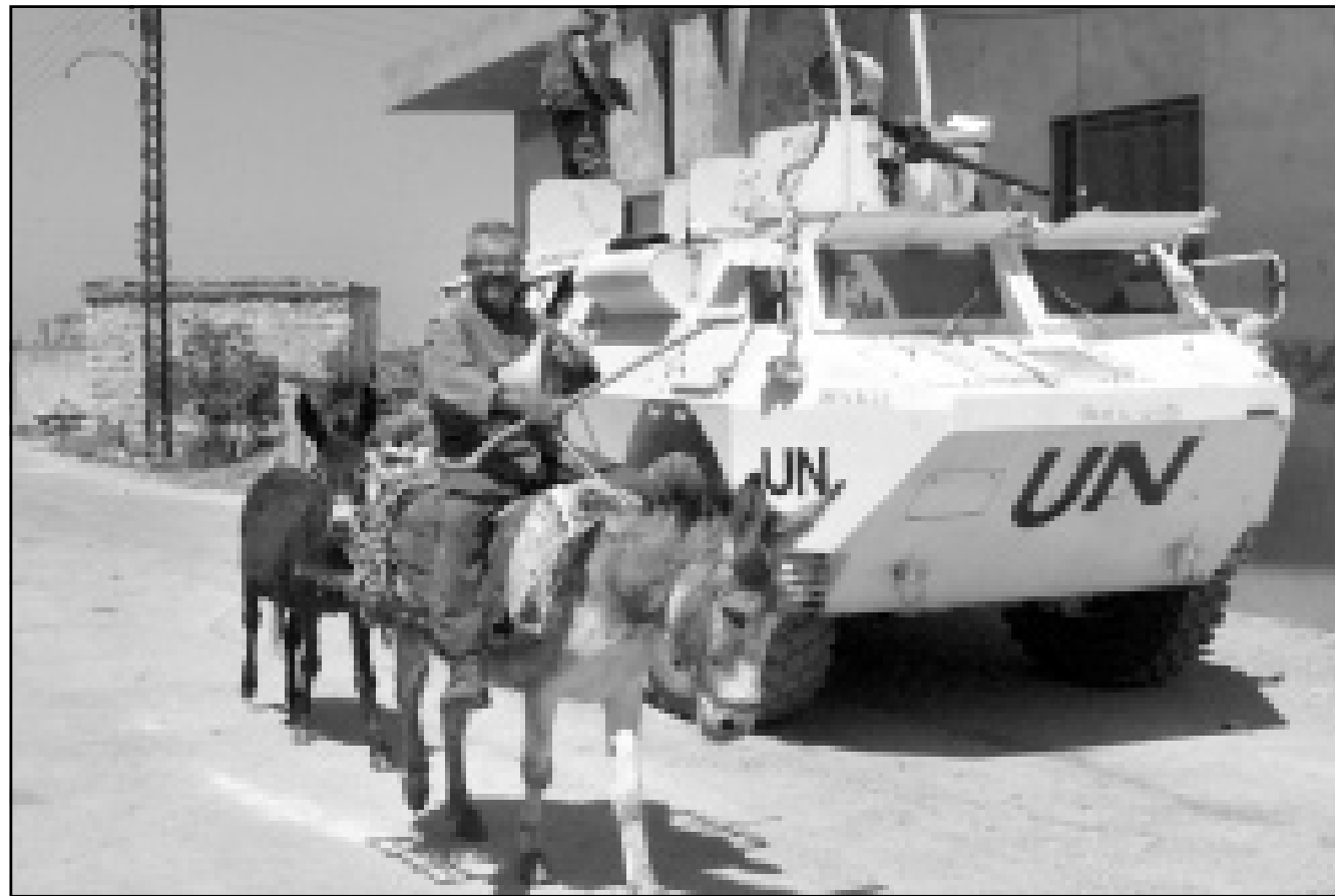
مواطن لبناني يمارا بحمازة امام مدابة للقرة الفرنسية في الجنوب اللبناني (أ ف ب)

مقر حزب الليكود المعارض في تل أبيب كما أوضح هذا الحزب الذي كان أعلن عن حضوره، وحصول مصر حوالي 2500 عنصر في ميليشيا جيش لبنان الجنوبي التابعة لاسرائيل، أكد باراك استعمل من أجل أن تعامل الحكومة اللبنانية عناصر الجنوبي مثلما عاملت ميليشيات أخرى في السابق». وأضاف باراك «ينبغي الغاء الاتهامات الفردية ضد عناصره (ضد عناصر الجنوبي) لاعادة الحياة الطبيعية والامن في جنوب لبنان بواسطة قوات الطوارئ الدولية وعناصر أخرى». وقد طلب لحد في الثامن من أيار (مايو) الجاري من الحكومة اللبنانية عفواً عما لرحاله وقد رفض هذا الطلب. من جهة أخرى أفاد مصدر عسكري أن قذائف هاون أطلقت من لبنان سقطت بعد ظهر الجمعة بالقرب من موقع عسكري في الأراضي الاسرائيلية على الحدود مع لبنان من دون وقوع ضحايا. وقد سقطت قذائف الهاون بالقرب من الموقع على بعد عشرين كلم من البحر المتوسط. واثر ذلك أفادت الشرطة اللبنانية أن الطيران الحربي الاسرائيلي شن ضربة جارات على خمسة أهداف تقع شمال المنطقة التي تحتلها الدولة العبرية في جنوب لبنان. وأوضح المصدر أن المقاتلات الاسرائيلية القت ابتداء من الساعة 16.00 بالتوقيت المحلي (13,00 تغ) 12 صاروخ جو-ارض على هذه الأهداف. جاءت الفارات بعد أن أعلن حزب الله مسؤوليته عن قصف موقع للجيش الاسرائيلي في ضهر الجميل بصواريخ كاتيوشا وقذائف هاون.