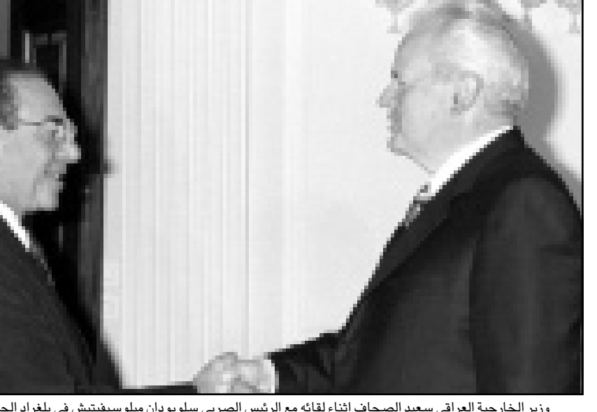
وزير الخارجية العراقي سعيد الصحاف اثناء لقائه مع الرئيس المصري سلوبودان ميلوسيفيتش في بلغراد الجمعة

الكويت - اف ب: اوردت الصحف الكويتية الجمعة ان رئيس الحكومة الكويتية الموالية للعراق الذي تاكد الاسبوع الماضي حكم الاعدام الصادر بحقه، غير محامي الدفاع عنه واولك ملف القضية الى محام آخر. واقادت صحيفة «القبس» ان العقيد علاء حسين علي (41 عاما) قسمر الاستغناء عن محاميه خالد عبد الجليل اثر «خلاف» بينهما. ولم يحضر عبد الجليل جلسة الثالث من ايار (مايو) الحالي التي تم خلالها تأكيد حكم الاعدام الصادر بحق علي الذي عين رئيسا للحكومة الكويتية التي اقامها العراق خلال احتلاله الكويت (اب - اغسطس 1990 - شباط - فبراير 1991). وكان عبد الجليل استأنف الحكم قبيل ان يقرر على الاستغناء عنه، ومن المفترض ان