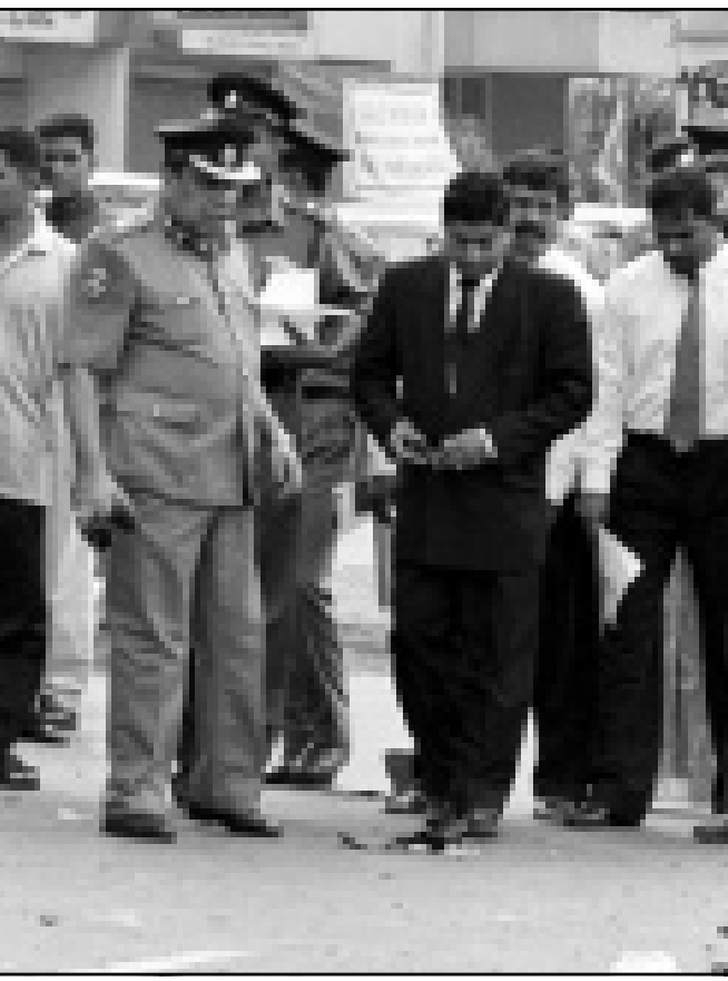
شرطة سريلانكا تتفقد مكان الانفجار الذي اودى بحياة وزير الصناعة و20 آخرين امس

جاكرتا - يتكولو (اندونيسيا) - اف ب - رويترز: قالت صحف جاكارتا امس الاربعاء ان الرئيس الاندونيسي عبد الرحمن وحيد استبعد تدخل الجيش ضد انصار الاستقلال في بابوازيا الغربية (غرب غينيا الجديدة) التي ضمت الى اندونيسيا في 1969.