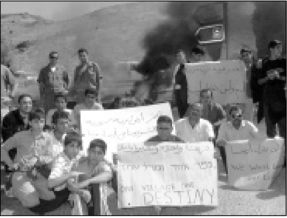
سكان الحجر يحتجون على تقسيم القرية (أ ف ب)