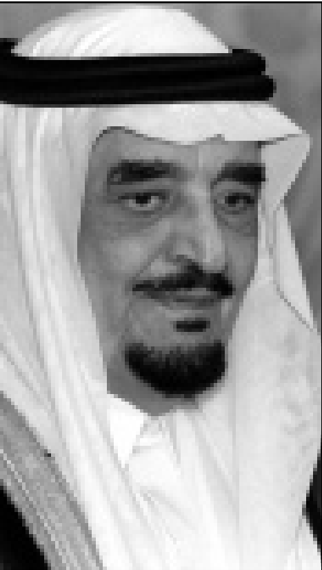
الملك فهد بن عبد العزيز

قبل العائلة التي كانت تعمل لديها، واتهمت خطأ بإقامة علاقة عاطفية مع السائق الذي كان يعمل لدى نفس العائلة. ثم إلقاء القبض على دي لوس ريس، واجبرت على التوقيع على «اعتراف» وحكم عليها بالسجن لمدة سبعة شهور وبسبعين جلد، وقالت دي لوس ريس ان مصيرها مماثل لمسير آلاف الفلبينيين الذين يسافرون الى السعودية بحثاً عن العمل، والذين يعانون من سوء المعاملة من قبل العائلات التي يعملون عندها وتم من قبل النظام القضائي قبل ان يغيبوا لأشهر أو حتى لسنوات فاشارت الى ان السعودية، اما المرضة الكندية مارغريت مايدل فاشارت الى ان الشركات التي تبعت بالموظفين الاجانب الى السعودية لا تخبرهم بحقيقة ما سيحدثون عند وصولهم الى المملكة، وقالت المرضة انها كانت خارجة تتسوق مع صديقات لها في الرياض ذات يوم عام 1993 عندما حاصرهم مجموعة من المطاوعة (التابعين لهيئة الامر بالمعروف والنهي عن المنكر) واجبرت سائق التاكسي الذي كان ينتظرهم على اخذهم الى مقر المطاوعة في المدينة. عندما وصل السائق الى المقر، تم احتجاز المرزوات لساعات داخل التاكسي تحت أشعة الشمس الحارقة، وعندما حاول الهرب، تعرض للضرب من قبل حراس المقر. واتهم بارتداء لباس غير محتشم وبشرب الخمر، رغم انهم كن يشربن عصير البرتقال في احد المطاعم، وقضين ثلاثة ايام في السجن قبل ان يفرج عنهن اخيرا بدون توجيه اي تهمة لهن.