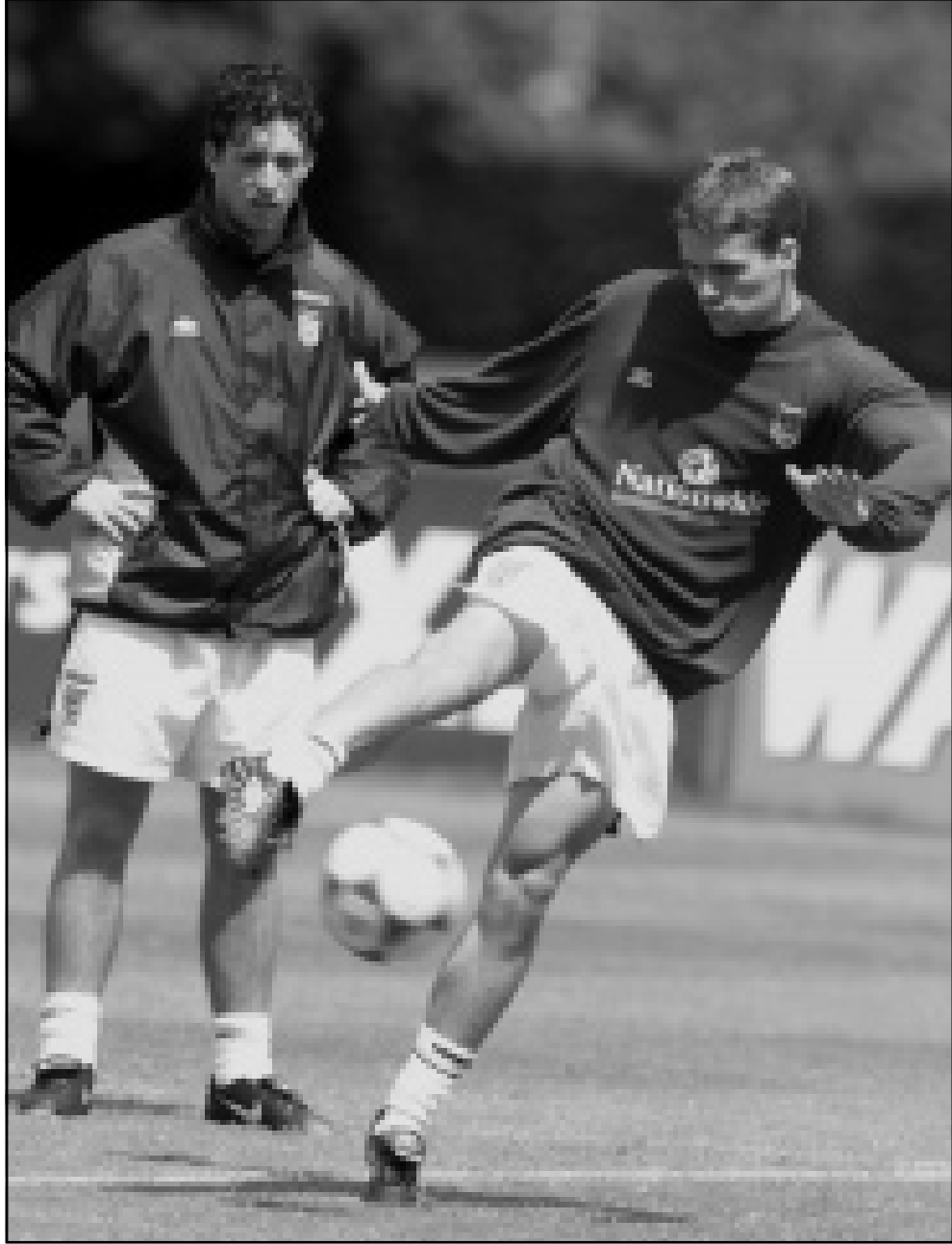
لاعب منتخب انكلترا مايكل اوين (الي المين) خلال التدريب