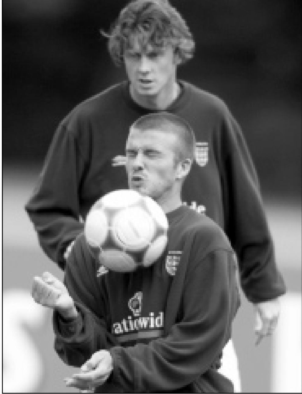
فيغيد بيكهام لاعب انكلترا خلال التدريب (ف اب)

ويحاول كلويغرت اللاعب ان يبيق في الملعب كلويغرت نفسه، لكن ذلك ليس سهلاً على الدوام. وفي مونديال 98، طرد في المباراة الاولى بين هولندا وبلجيكا بعد ان رد على استغراب احد اللاعبين البلجيكين الذي ذكره بمشكلاته في حياته الخاصة. وفي برشلونة، وبقيادة المدرب الهولندي لويس فان غال، اسكت كلويغرت النقاد بتسجيله اهدافاً حاسمة.