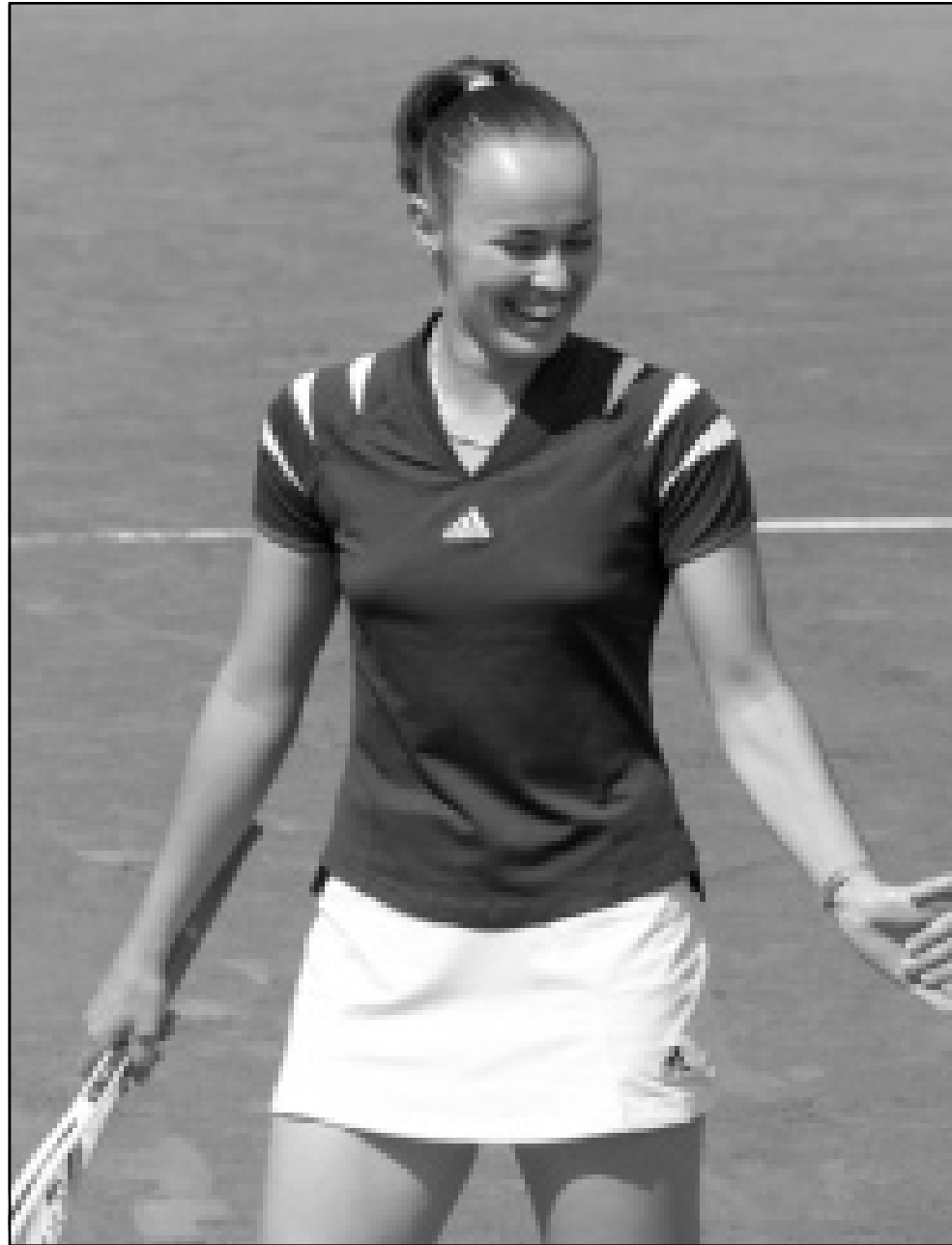
السويسرية مارتينا هينغيس

سكوياري قبل نهائي بطولة فرنسا للتنس وتاهل الارجنتيني فرانتكو سكوياري امس الاربعاء للدور قبل النهائي في بطولة فرنسا المفتوحة للتنس ثاني بطولات الجراندي سلام هذا العام بعد فوزه على الاسباني البرت ماريو في دور الثمانية في احدى مباريات دور الثمانية للبطولة البالغ مجموع جوائزها