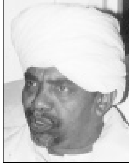
الرئيس عمر البشير

وقال البشير بأن رئاسة الجمهورية السودانية ظلت طوال الفترة الماضية حريصة على عدم انزلال الصراع إلى القواعد لثقافتها بأنه خطيئة لا يمكن التبشير بها واتخاذها وسيلة للاستقطاب. وكذلك أبدى الرئيس البشير عن استيائه الشديد حول الاسماء التي طالت قيادات الصف الأول الإسلامية التي أثرت الانقسام إلى السيرة الصحفية حيث اتهمها البعض بشراء المناصب وبيع الذمم، واصفا تلك الحالة بأنها ضربة للحركة الإسلامية التي تقف على أساسها الحركة الإسلامية في التمرد على اوضاع ما قبل التصحيح وقيادة مسيرة التغيير في المجتمع السوداني قائلا لقد جئنا متجربين إلى الله وتريكم متجربين لتغيير القيم التي اجسنت. واضاف قائلا اية قضية ضد التغيير هي قضية انصافية وحرمة ضد السودان والشوجه الحضاري. وأشار البشير إلى ان الحكومة قامت بوضع اللوائح والأسس غير انها لن تتخلى عن المنهج الرباني الذي يتبناها البعض بانخاذه ذريعة لتجنب الالتزام بالنظم في السودان وقال البشير بان توجيه صارما سيتم تعميمه على كافة ولايات السودان بهدف منح الصلاحيات الكاملة لانقاذ الشباب الإسلامي الجديد وتمكينه من اداء مهامه على اكمل وجه. وعلى صعيد متصل أكد الرئيس البشير لدى مخاطبته نقرة ولاية نهر النيل بشمال السودان على قيام الانتخابات الرئاسية في السودان في تشرين