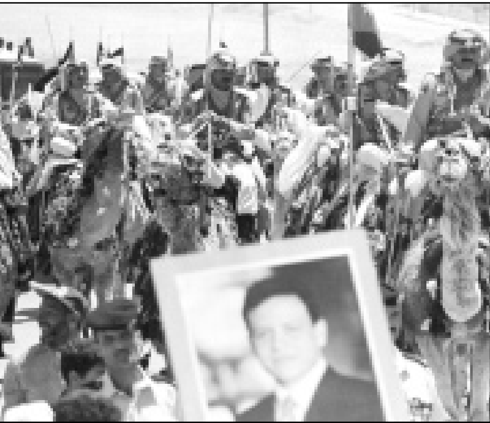
قوات البادية الأردنية تجوب مشرق عمان احتفالاً بمرور عام على تولي الملك عبد الله العرش في المملكة

عقلية وذمينة القيادة الفلسطينية حتى تتمكن من التعاون المنتج مع الدولة الأردنية.