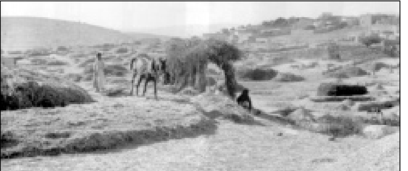
بيادر الفمح القريبة من قرية صفورية في الناصرة (صورة التقطت حوالي عام 1940)