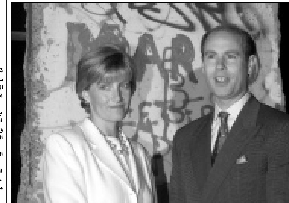
الأمير امدارد ابن ملكة بريطانيا وزوجته صوفي بيلغان بجوار جزء من جدار برلين (السابق) لدى زيارتهما للجناح الاتماني في معرض اكسبو 2000 في مانوفر

■ القاهرة- اف ب: بدأ ترميم ثلاثة قصور من اصل 13 قصرا كانت تكون مجتمعة قصر محمد علي باشا الكبير في منطقة شبرا الخيمة (شمالى القاهرة) في اطار مشروع ترميم الآثار والقصور العثمانية وازالة التعديلات القائمة عليها تحت اشراف وزارة الثقافة المصرية. والقصور التي اعلن فاروق حسنى وزير الثقافة المصري بدء ترميمها صباح امس اثناء جولة ميدانية قام بها مع الصحافيين في قصور «الفسقية» و«الساقية» و«الجبلية»، وهي القصور الثلاثة التي بقيت من اصل مبانى القصر الـ 13 التي بدأ بناؤها عام 1808 وامتدت في عام 1821. وقد قام ببناء القصر المهندس ذو الفقار تخددة استنادا الى التصميم الذي وضعه فنسلا العام في مصر. كان اخر القصور التي تهدمت او ازيلت من القصور العشرة التي اندثرت قصر الحريم الذي يعتبر من اهم مباني القصر حيث ازيل بقرار من الملك فؤاد الاول عام 1926 في اطار مشروع شق طريق القاهرة الاسكندرية الزراعي. وكانت مساحة القصر بما فيها الاراضي التي شكلت حديقة الواسعة تبلغ اكثر من 60 فدانا (هكتار)، وتحتل جزءا واسعا من الحديقة الى كلية الزراعة التابعة لجامعة عين شمس بقرار جمهوري صدر عام 1958 الى ان اعيد مجددا قبل