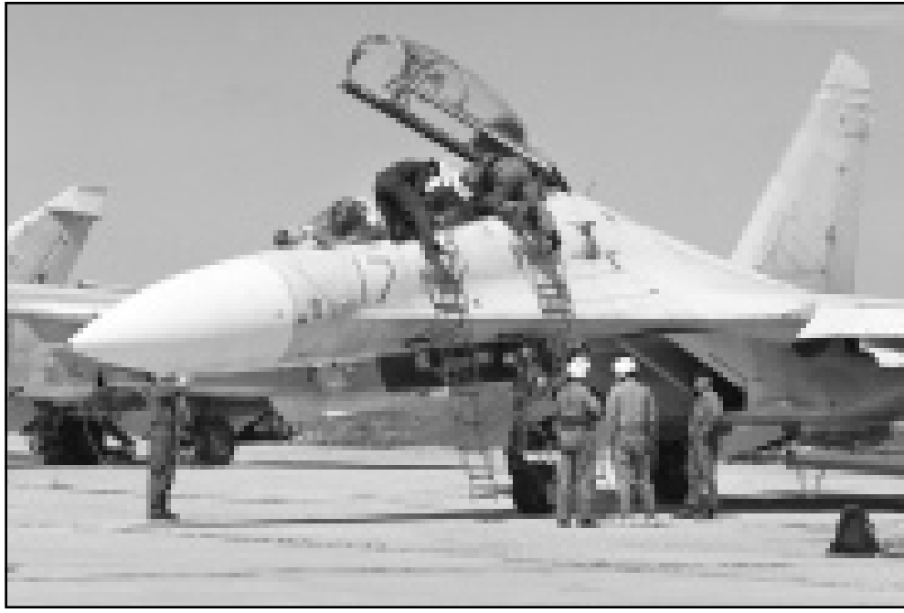
ضابط الطيران الروسي يضعون للمسات الأخيرة على طائرة حربية قبل إقلاعها نحو الشيشان

■ موسكو - وكالات: حاولت موسكو اسس الخميس دعم حكمها في الشيشان بتعهدات باعادة بناء الاقتصاد وتنظيم الإدارة المحلية هناك بعد موجة من هجمات للمقاتلين الاسلاميين على الاهداف الروسية التي تحتل المنطقة.