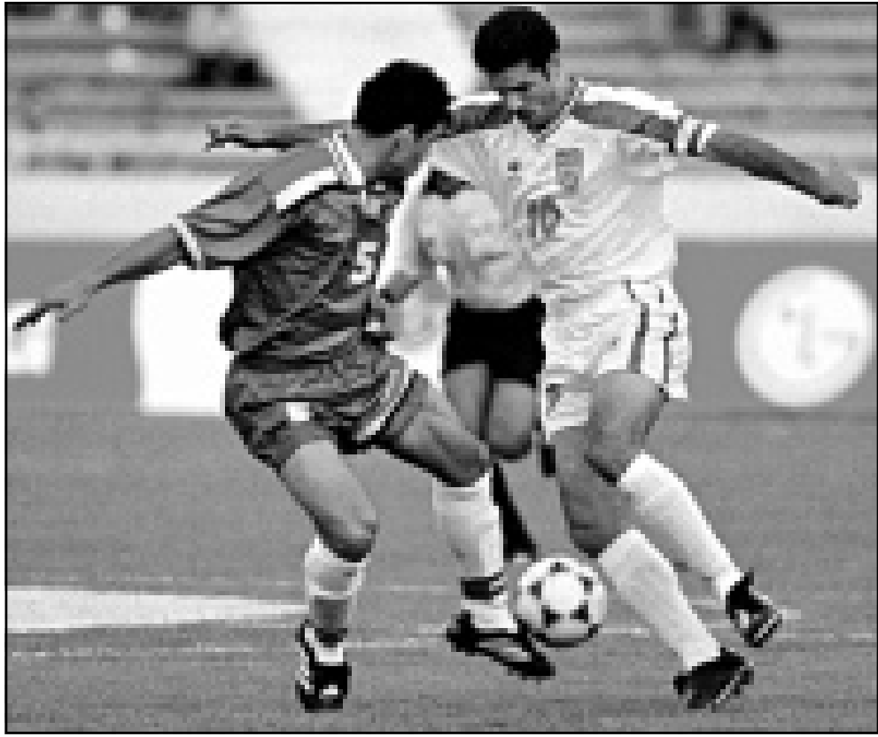
نجم الكرة الإيراني علي داني (الى اليمين) والنجم المصري سمير كمنو في منافسة على الكرة