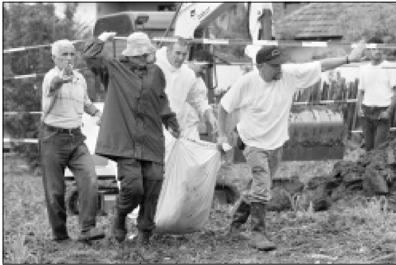
عمال الاغاثة الدولية ينتشلون جثثاً من مقبرة جماعية من آثار حرب كوسوفو