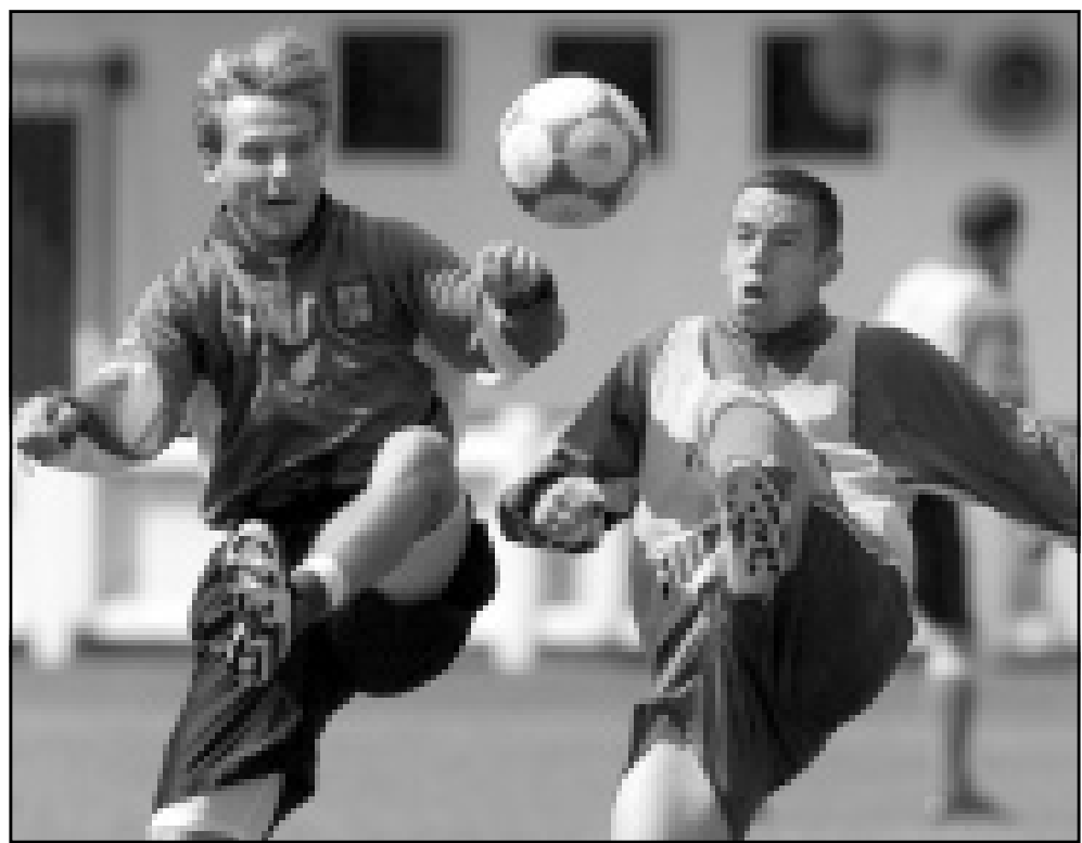
منتخب تشيكيا خلال التدريب

في ذلك... وأضاف «اعتقد ان لدي تشكيلة متجانسة تستطيع ان تقدم عرضا جيدة في النهائيات». وعالما ما تخالف الدنمارك جميع التوقعات، فعندما شاركت للمرة الاولى في النهائيات عام 1984، رشحتها للجمع للخروج من الدور الاول، بيد انها بلغت نصف النهائي وخسرت بركلات الترجيح امام اسبانيا مع انها كانت الطرف الافضل طوال المباراة. وفي مونديال مكسيكو عام 1986 وبعد ان تصدرت المجموعة الاولى في الدور امام المانيا الغربية اعتبر النقاد بانها ستبلغ المباراة النهائية نظرا لعرضها المشيرة، لكن ما حصل انها منيت بخسارة ثقيلة امام اسبانيا 5-1 منها رباعية للنجم السابق اميليو بوتراغويو. ولم يعطها كثيرون املا في مونديال فرنسا 98. لكنها بلغت ربع النهائي وخسرت بصعوبة امام