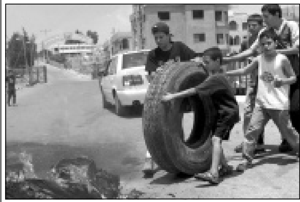
شبان من قرية الفجر يحرقون الاطارات احتجاجا على تقسيم القرية