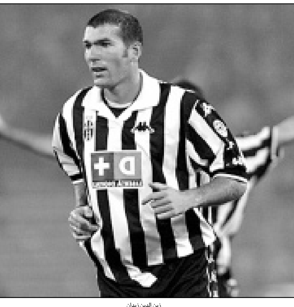
زين الدين زيدان

نيكوسيا - آ ف ب: تخوض فرنسا تحديا كبيرا يمثل في احرازها بطولة الامم الأوروبية مباشرة بعد ان توجت بطلة العالم في المونديال الذي اقيم على ارضها عندما تغلبت على البرازيل 3-صفر في المباراة النهائية. ولم يسبق لاي منتخب ان احرز كأس العالم ثم بطولة اوروبا، علما بان المنتخب الانماني احرز بطولة اوروبا عام 1972 ثم المونديال بعد عامين. ويملك الفرنسيون اليوم منتخبا يقرب الى حد ما من منتخب الثمانينات بقيادة ميشال بلاتيني الذي احرز لقب البطولة الأوروبية عندما استضافها على ارضه عام 1984. وإذا قدر لفرنسا (58 مليون نسمة و550 الف كلم مربع) ان تحرز اللقب فانها ستعيد بعض الجميل الى ابنها هنري دولوني الذي كان وراء فكرة انطلاق المسابقة عام 1960. ولم يكن مشوار فرنسا الى النهائيات مفروشا بالورود ذلك لانها انتظرت الجولة الاخيرة وفوزها الصعب على اسبندا 3-2 على ارضها، واحتاجت ايضا الى هدف اوكراني في الثواني الاخيرة ضد روسيا لتضمن بطاقتها مباشرة، في حين لعبت اوكرانيا مباراة فاصلة. وبدا واضحا ان غياب صانع العابه والعب يوفتوس الايطالي زين الدين زيدان عن