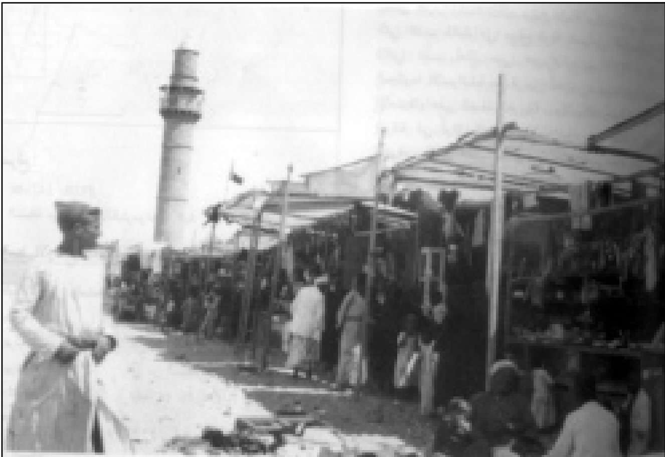
اكتشاف في جوار مقام النبي روبين ايام الموسم (صورة التقطت قبل سنة 1935)