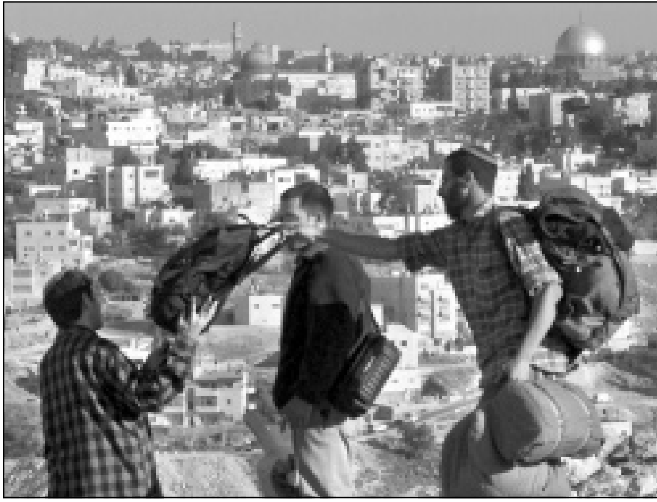
الشرطة الاسرائيلية تجلي مستوطنين كانوا يحتلون موقعا في بلدة ابو ديس

■ القدس - غزة - اف ب: أكدت الاذاعة الاسرائيلية امس الخميس ان الفلسطينيين والاسرائيليين يتفاوضون سرا حول وضع القدس في اطار الاتفاق النهائي للاراضي الفلسطينية. وقالت الاذاعة ان وزير الامن الداخلي شلومو بن عامي ورئيس المجلس التشريعي الفلسطيني احمد قريع يتفاوضان منذ عدة اسابيع حول تعديل الحدود البلدية للمدينة لضم احياء فلسطينية مثل شعفاط وبيت حنينا الى الدولة الفلسطينية المقبلة. وقالت الاذاعة ان المفاوضات مستمرة رغم النفي الرسمي، ورفض مكتب بن عامي التعليق على النبا. واكتفى وزير العدل يوسي بيلين بالقول من جانبه «يخطيء من يظن بإمكانية التوصل الى اتفاق دائم دون البحث في قضية القدس، لانه سيكون اتفاقا لا يعترف بالقدس عاصمة لاسرائيل». ويطالب الفلسطينيون بالقدس الشرقية التي احتلتها اسرائيل وضمتها في 1967 عاصمة لهم، وتعتبر اسرائيل القدس «عاصمة ابدية موحدة لها». وبنيت اسرائيل احياء استيطانية في القدس الشرقية استكت فيها حوالي 200 الف يهودي.