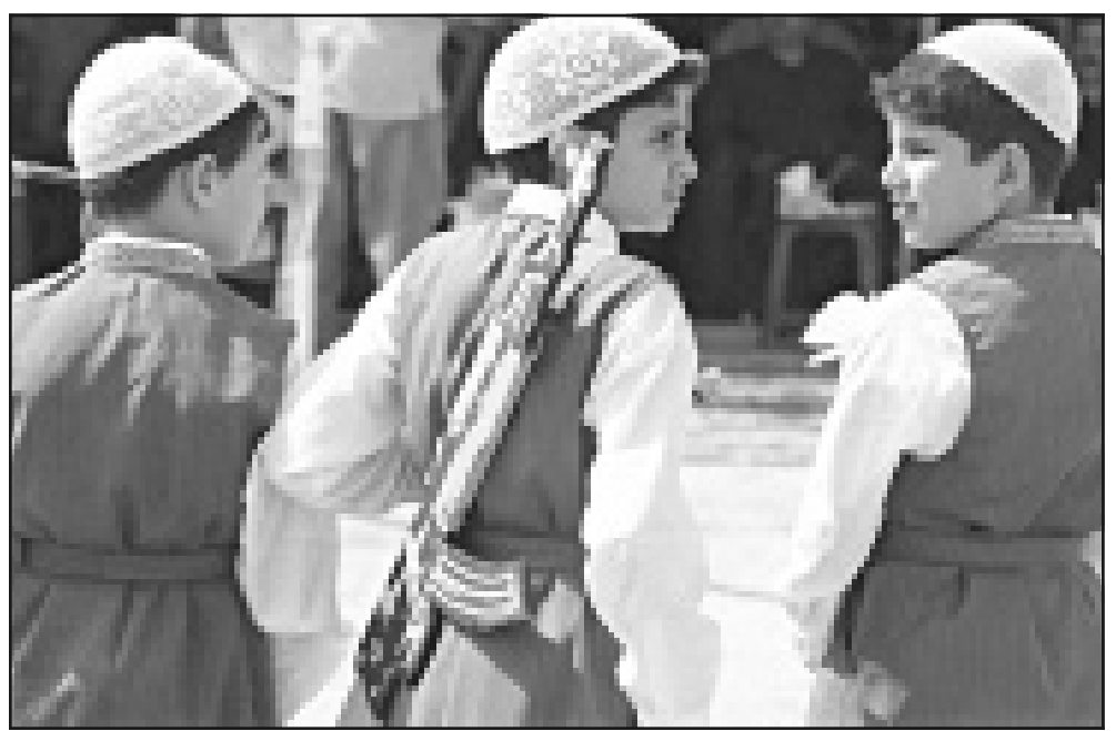
اطفال عراقيون في الزي التقليدي يشاركون في الاحتفالات باكمال تنفيذ مشروع على نهر دجلة في بغداد امس

اصطلح اساتذة الجامعات في أحد شوارع وهران التي توصف بـ«الباهية» عساهم يشكون حالهم، فاعتدوا إلى ترديد شعارات تعبر عن غضبهم إزاء الفؤوليين، منها «حقارين... حقارين»، أي ظالمين. غير ان الرئيس خانه سمعه فالتقطت اذناه «طحانين» و«الطحان» في اللهجة المحلية وصف يطلق على الديوث، وفيه من الاحترار والالامة ما يكفي لاثارة فتنة بين رجلي لا تنتهي. عندئذ توجه بوتفليقة إلى جمع الاساتذة فاسمك بأحدهم من قميصه قائلًا: «لو كان ما كنتش إزاه في البلاد هذي كنت توريك شكون الطحان» (لولا مكائتي كرئيس لأريتك من هو الديوث). ورد احد الذين فاجأهم الموقف «لا سيدني الرئيس، نخرتمك المكائتي وصفت كرئيس وسلك» وشوه ضباط الشرطة والدرك ملتفتون جميعاً نحو المجموعة التي قصدها الرئيس، فلم يجرؤ احد على توقيف الرئيس تقادرا لرد فعله العنيف. كان المشهد بدرجه من السويالية اقدت المراقبين للرئيس سيطرتهم على المكان، خاصة ان بوتفليقة دفع احد حراسه من امامه قائلًا «بعثوا من قدامي» (ابعدوا عن طريقي) متوجها نحو جمهور كان يمكن ان تصدر منه أي «مفاجأة». الواقع ان رد فعل بوتفليقة ينبع من صدمة شخصية،