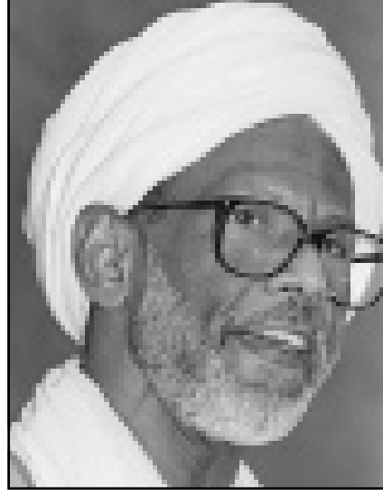
د. حسن الترابي

الاول (أكتوبر) المقبل مشيرا إلى ان هذه الانتخابات ستكون حرة وتزيهية وخالية من التزوير والغش ومن كل الاعمال الفاحشة. وقال البشير بان قرارات الثاني من صفر قد انتهت الاندواجية على مستوى الدولة والحزب مؤكدا بأنه لا رجعة ولا تكوص عنها.