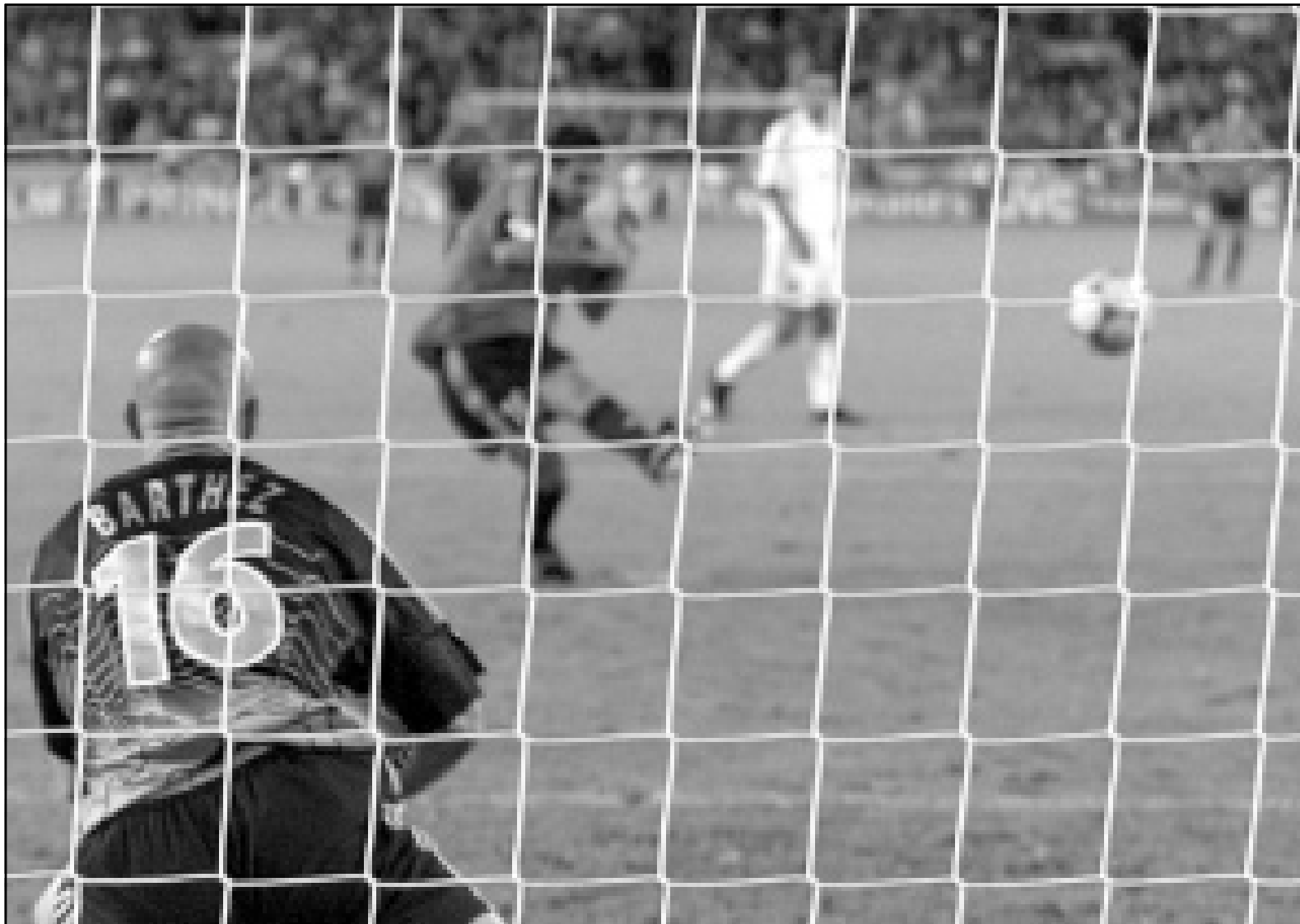
حارس مرمى فرنسا فابيان بارثيز (الى اليسار) يتاهب للصدى ضربة جزاء قذف بها لاعب اسبانيا راؤول