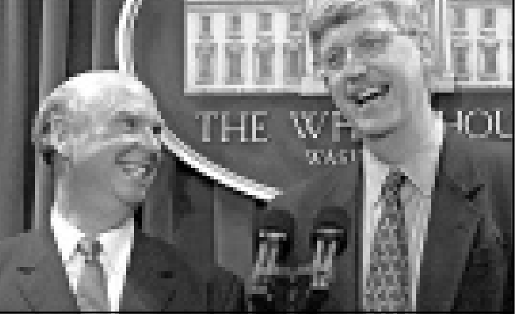
كريغ فنتر مدير المؤسسة الوطنية لبحوث الجينات وفرنسيس كولينز بيلغان اسم في البيت الأبيض نتاج ابحاث شركتهما في كشف خارطة الخزون الوراثي البشري