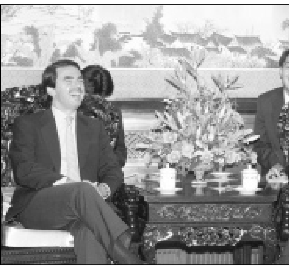
الرئيس الصيني جيانغ زينين انفجر ضاحكا خلال حديثه مع رئيس الوزراء الاسباني خوسيه ماريّا اثناس امس الاثنين بالعاصمة بكين

■ كولومبو - اف ب: أعلن مسؤولون في كولومبو ان متطرفين من التاميل فجروا في عملية انتحارية امس الاثنين سفينة تجارية قبالة الشواطئ الشمالية الشرقية لسريلانكا قبالة مدينة جافنا. وأضاف المصدر نفسه ان عناصر جبهة تمور تحريض ايلام التاميل استقلوا زورقا محملا بالمتفجرات وصدموها به السفينة التجارية بينما كانت تقترب من مدينة جافنا التي يحاصرها المتمردون. وتابع المصدر نفسه ان النار شبت في السفينة وتم اقتناذ جميع افراد طاقمها الـ 21.