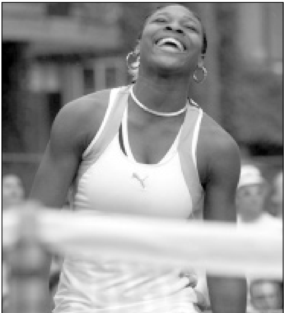
اللاعب الأمريكية سيرينا وليامس