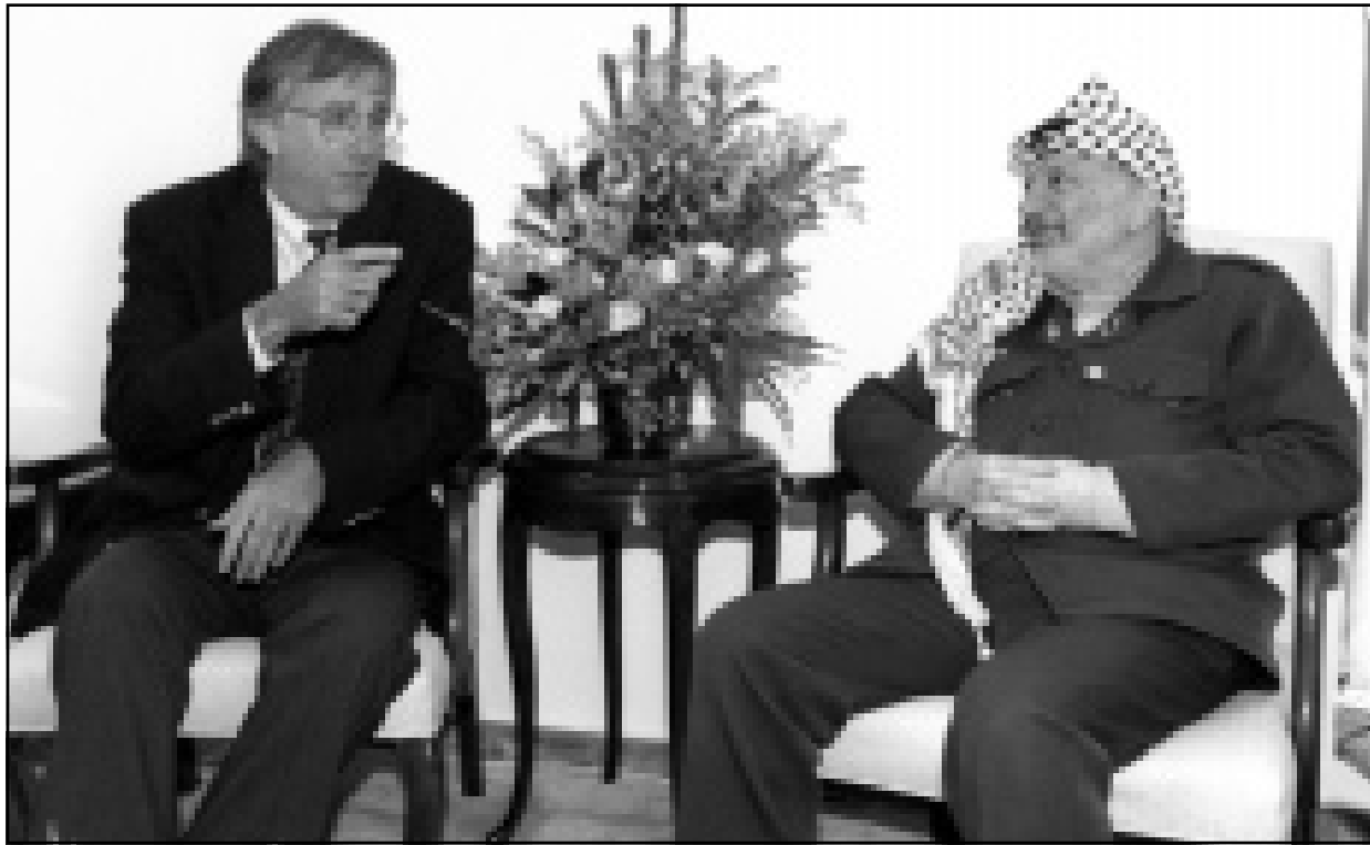
الرئيس الفلسطيني ياسر عرفات لدى استقباله المبعوث الامريكى الخاص دنيس روس امس في رام الله