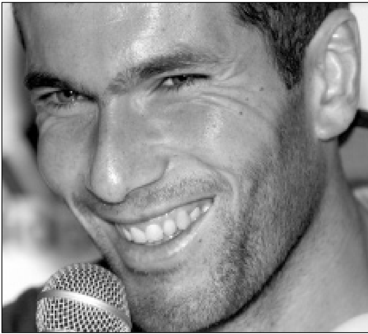
نجم المنتخب الفرنسي زين الدين زيدان

■ باريس - أف ب: اعتبرت الصحف الفرنسية الصادرة أمس الاثنين ان المنتخب الوطني بذل جهودا كبيرة لتخطي نظيره الاسباني «الرائع جدا» وبلوغ الدور نصف النهائي من بطولة كأس الامم الاوروبية لكرة القدم. وركزت صحيفة «ليكيب» الرياضية الواسعة الانتشار على «الدقائق الاخيرة من المباراة المليحة بالآثاره والاحداث الدراماتيكية» في اشارة الى ركلة الجزاء التي منحتها الحكم لصالح اسبانيا واهدتها نجمها راؤول غونزاليز. واضافت «اثبت المنتخب الفرنسي انه كبير وكان المنتخب الاسباني مكافحا». واعتبرت صحيفة «لوفيفر» بان «الفوز الضيق على منتخب اسباني عنيد كان شاقا للغاية». وأشارت صحيفة «فرانس سوار» و«لو باريزيان» تحت عنوان واحد «كم كان الامر شاقا»، وقالت الاولى في تعليقيها ان «فرنسا كانت اقوى من الحكمة»، في حين اعتبرت الثانية ان «فرنسا خرجت من الجحيم الاسباني لكنها اضطرت الى بذل كثير من الجهود من اجل ذلك». ورأت صحيفة «الليبارسيون» بان المنتخب الفرنسي اثبت بأنه أصبح «ما كان عليه المنتخب اللاتني في العقود الثلاثة الاخيرة، حتى عندما يواجه الضغوطات فانه لا يخسر».