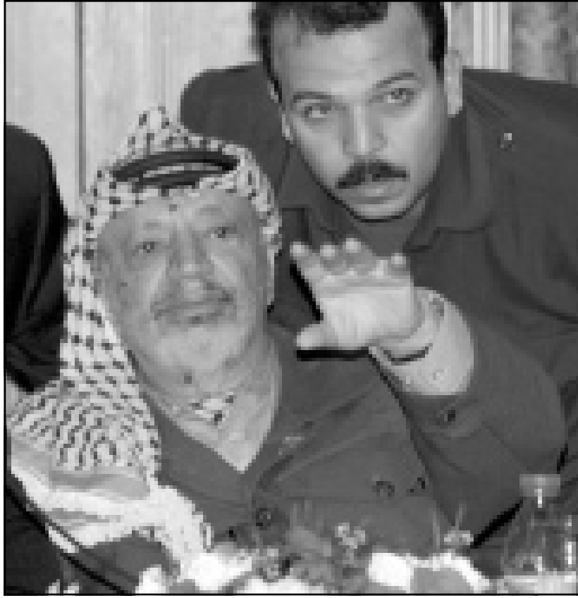
عرفات في اجتماع المجلس المركزي الفلسطيني

تحدث في البلاد والعالم هزة توضح للاسرائيليين ان لا مفر من التنازل الحقيقي. داني روبنشتاين (هآرتس) - 2000/6/26