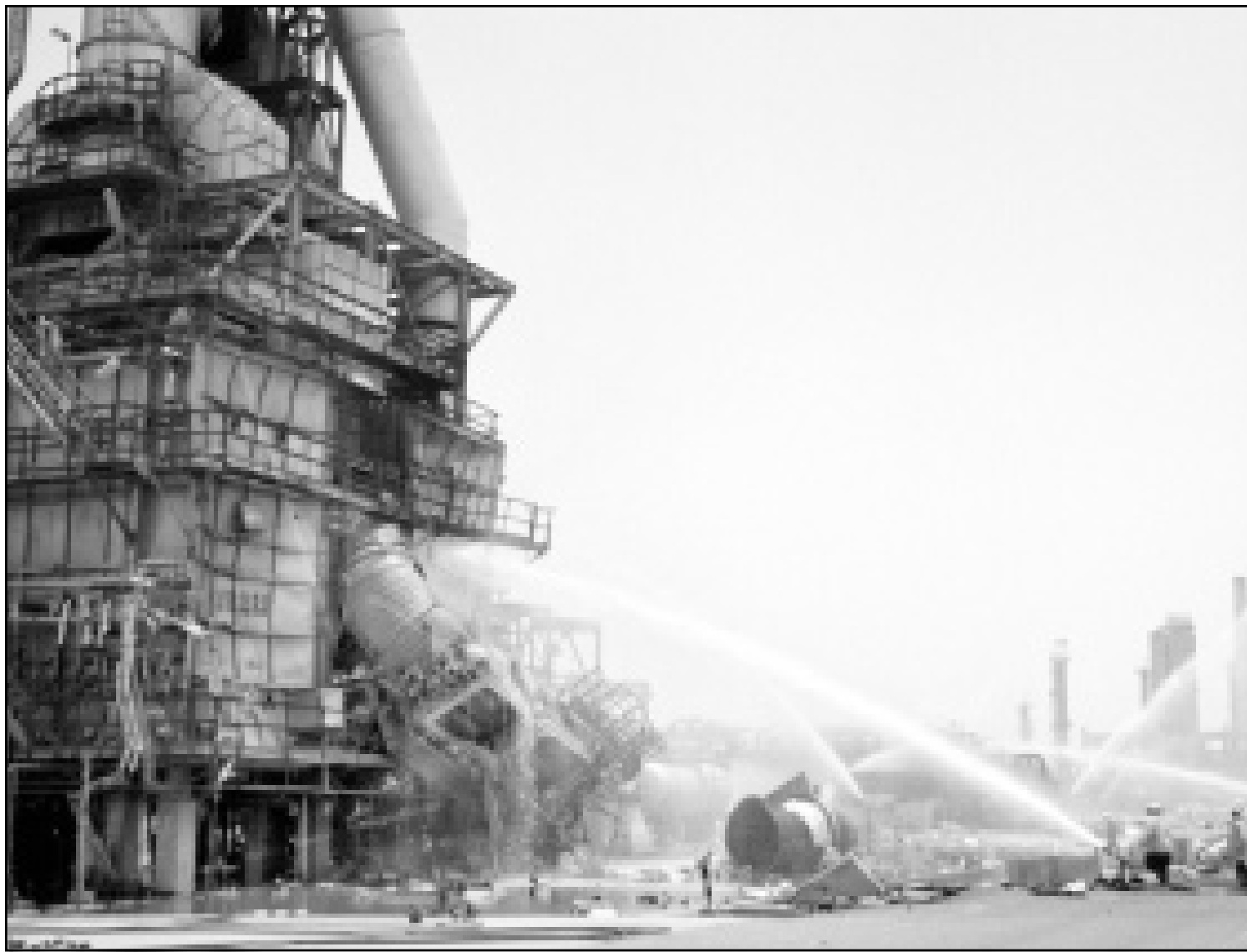
عامل اطفاء يوهون خراطيم المياه لخماد حريق مصفاة الاحمدي

وأوقف مصفاة الكويت انتاج البولي ايثيلين بعد توقف منتجات الاحمدي المستخدمة في انتاجه. وقال مسؤولون ان انفجار الاحمدي لم يؤثر على صادرات الخام مضيفين ان خطوط انابيب التصدير ومنافذ التصدير في الاحمدي تستخدم من قبل شركات النفط وطبقا لاتفاق اوبك مؤخرا ستزيد حصة انتاج الكويت من اول نموز (يوليو) 2,037 مليون برميل نفط من 1.98 مليون برميل يوميا حاليا.