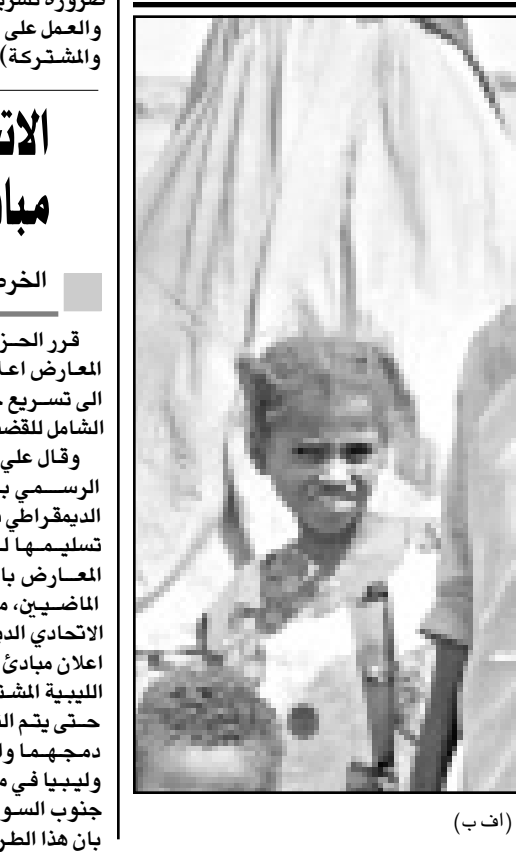
لاجئات ايرتبات في كسلا في السودان

وقال اسماعيل إن السودان لا يرغب في مواجهة الولايات المتحدة التي شنت هجوماً بالصواريخ على مصنع ذرية في الخرطوم عام 1998 فشالته قاتلها ينتج مكونات للغازات السامة. ونفى السودان هذا الاتهام. وتوترت علاقات السودان مع الولايات المتحدة بسبب التوجهات الامريكية للخرطوم بانها تتساند «الأرهاب الدولي»، وتنتهك حقوق الانسان. ولكن الجانبين بدأ حواراً بعد أن عيقت الولايات المتحدة العام الماضي مبعوثاً خاصاً للسودان وزير المبعوث هاري جونستون الخرطوم في آذار وحزيران من هذا العام.