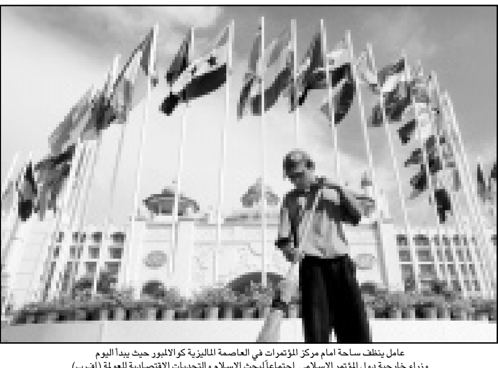
عامل ينظف ساحة امام مركز المؤتمرات في العاصمة الماليزية كوالالمبور حيث يبدأ اليوم ورءاء خارجية دول المؤتمر الإسلامي اجتماعا لبحث الإسلام والتحديات الاقتصادية للعولمة (اف ب)

الرباط - رويترز: اعلن بنك المغرب المركزي امس الاثنين رفع الحد الادنى لسعر الفائدة على المدخرات من 3,89 في المئة الى 4,48 في المئة. وقال البنك ان السعر الجديد سيسري بدءا من اول تموز (يوليو) وحتى نهاية العام. وقال البنك في بيان ان المتوسط المرجح لسعر الفائدة على اذون الخزنة لاجل 52 اسبوعا الصادرة في مزادات خلال النصف الاول من عام 2000 بلغ 5,48 في المئة ولذا فقد تقرر رفع الحد الادنى لسعر الفائدة على المدخرات الى 4,48 في المئة. وبلغت ودائع حسابات الادخار في القطاع المصرفي المغربي في نهاية ايار (مايو) نحو 28,4 مليار درهم (2,69 مليار دولار) من بين اجمالي الودائع البالغ نحو 205 مليارات درهم في نهاية نيسان (ابريل). الدولار يساوي 10,545 درهم.