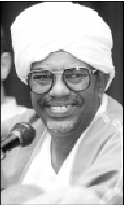
الرئيس عمر البشير