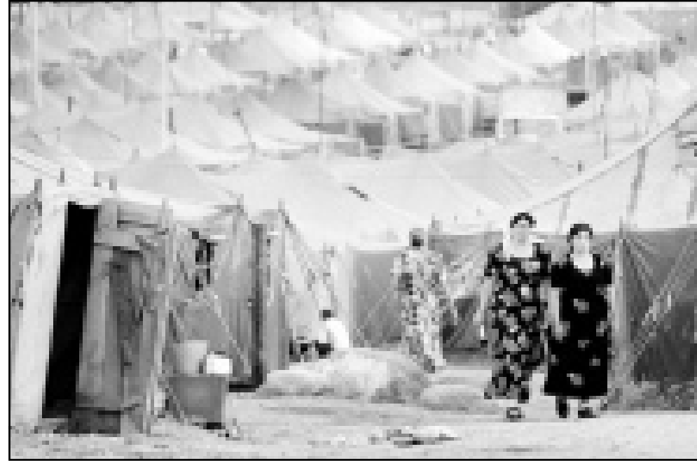
لاجتان قرب مخيمات المدنيين الشيشان في أراضي اغوشيا

■ موسكو - رويترز - اف ب: قال المتحدث باسم الكرملين فيما يخص روسيا ستواصل استخدام الهجمات الجوية والمدفعية ضد الثوار الانفصاليين. وجاء تصريح المتحدث بعد ان نقلت وكالة «انترفاكس» الروسية للافان عن الجنرال غينادي تروشيف قائد القوات الروسية في الشيشان قوله الاحد ان الحرب التي دامت تسعة اشهر ضد الثوار انتهت تقريبا وروسيا والقوات الروسية «لن تشن هجمات ولن تقوم بعمليات جوية او مدفعية». ولكن بعد تردد تقارير عن استمرار الغارات الجوية قال المتحدث سيرغي ياسترجمبسي لرويتز ان تصريحات تروشيف سيء تفسيرها والافتراءات الجوية ستستمر على معازل الثوار في المناطق الجبلية الجنوبية. وأضاف في اتصال هاتفى «اريد ان اوضح ان غينادي تروشيف قال ان المدفعية لن تستخدم الا في حالات الضرورة وخرج المناطق العمومية». وتابع «وقال ان اللجوء الى استخدام الطيران سيقبل كثيرا، ولكن هذا لا يعني انه لن يستخدم على الاطلاق».