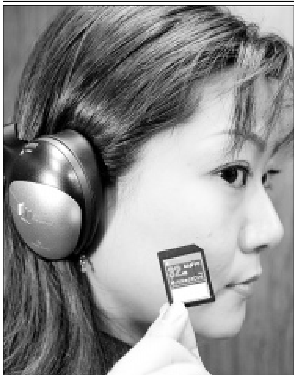
عارضة من شركة سانوي اليابانية للالكترونيات تقدم امس في طوكيو جهازا رقميا لسماع الموسيقى دون اشرطة او اقراص حيث يمكن تحميل الموسيقى على الرقاقة التي تمسك بها العارضة من شبكة الانترنت مباشرة عبر جهاز الكمبيوتر وتوضعها بالجهاز

الرياض-رويترز: قال مسؤول سعودي الاحد ان دعم مساعدا ملك الثروة الحيوانية في البلاد في مواجهة ارتفاع اسعار الشعير. واضاف المسؤول ان هذا الامر الذي صدر في الاتونة الاخيرة يضاف الى اجراءات اتخذت في وقت سابق هذا الشهر لوقف الارتفاع الحاد في اسعار الشعير. وتابع المسؤول الذي طلب عدم الافصاح عن اسمه قوله لرويترز ان «الهدف من الخطوة هو مساعدة المستثمرين في الثروة الحيوانية». وامتنع المسؤول عن اعطاء الرقم الدال على حجم الدعم، ولكنه قال ان الدعم سيصل الى «مليارات الريالات» وانه سيظل قائما ما دامت هناك حاجة اليه. واعلنت وسائل الاعلام السعودية في وقت سابق هذا الشهر ان اسعار الشعير ارتفعت الى 30 ريالا (8 دولارات) للكيس الذي يحوي خمسين كيلو غراما من الشعير ارتفاعا من 21 ريالا في العام الماضي. وعزت مصادر في هذا المجال الزيادة بالاساس الى ارتفاع الاسعار العالمية وواردات القطاع الخاص.