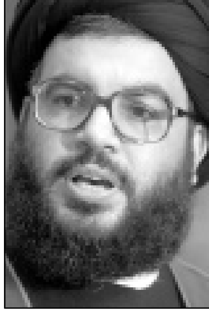
حسن نصر الله

المؤشرات، ثمة اذن مجال للتفاوض ولكن كلما تعلق الامور بلبنان كلما كان علينا توخي الحذر. يوسي اولرات (يديעות احرونوت) - 2000/6/26