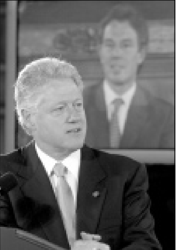
رئيس الوزراء البريطاني والرئيس الأمريكي يعلنان في وقت واحد امس التوصل لخريطة الجينات الوراثية البشرية

الكويت - رويترز: حسم الساسة الاسلاميون في الكويت لصالحهم معركة ضد الحكومة أمس الاثنين خاصة بالاختلاط بين الجنسين في الكليات والمعاهد الأهلية الخاصة. وفي جلسة ساخنة في البرلمان تمكن الاسلاميون والنواب القبوليين من تمرير قانون يشرع بفترة تنص على الفصل بين الطلاب والطالبات في الكليات والمعاهد الأهلية الخاصة وفروع الجامعات الأجنبية في البلاد. وحصل القانون لدى عرضه للمرة الثانية والأخيرة على موافقة 37 من أعضاء البرلمان الحاضرين وعددهم 60 عضوا، وامتنع عضو واحد عن التصويت، واثارت هذه القضية الكثير من التوتر على المستوى الداخلي في البلاد، وتار الكثير من الجدل في الآونة الأخيرة بين طلاب جامعة الكويت التي تديرها الحكومة والاسلاميون وغيرهم من الساسة، وأعربت كثير من الجمعيات التي توترت عن غضبها الشديد من التصريحات التي صدرت في الآونة الأخيرة عن بعض الساسة الاسلاميين الذين حشدوا الدعم ضد الاختلاط الذي يعترضه شيئا مهيئا. وقال وزير الخارجية الكويتي الشيخ صباح الاحمد الصباح في البرنامج التلفزيوني النهائي «إن استخدام الأهراب (القفظ) في بعض المساجد والتدوات مرفوض ونرجو ألا يتكرر».