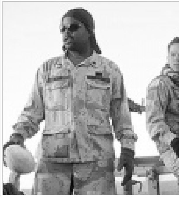
لقطنان من فيلم «ثلاثة ملوك»

تم الترويج لحرب الخليج على أساسه إعلاميا، فقبل بدء العمليات العسكرية وحتى قبل انتهائها كان الإعلام الأمريكي و حتى قبل الدولي الذي يقلب عنه يروج للحرب على أساس أن هدفها هو تحرير الكويت وإسقاط النظام الحاكم في العراق ولكن بعد انتهاء الحرب وبالأسرى توقف القتال تواليت الفتاوى العسكرية الأمريكية بنان إسقاط النظام العراقي لم يكن بأي حال من أهداف «التحالف الدولي» (في هذه الأثناء رد الإعلام أبناء عن خلاف مزموع بين الجنرال ثورمان شورتنوكوف قائد الزراع الأخلاقية التي سوغت التدخل عسكريا لإنقاذ الكويت والكويتيين من بطش النظام العراقي لا يمكن أن تتسرع لجاسة أن يكون الغالب هو التدخل عسكريا لإنقاذ العراقيين من بطش نفس النظام. ولسا بصدد فرض قراءة أخلاقية لمنطق حرب الخليج، وهي قراءة تحسيفية لا تستقيم أصلا وإنما أفضل السبق في هذا يعود للاعلام الأمريكي أو لا وأخيرا، ولا حتى أثناء العمليات السياسية الأخرى أصلا يمكن أن يقع أحدا هنا كما في التذرع مثلا بأن الدستور الأمريكي يحرم التدخل لقب أنظمة الحكم في بلدان أخرى إذ تدبر محاولات لانتقال رؤسائها أو اعتقالهم (كما حدث في بنما على سبيل المثال)، أما مسألة دعوة الشعب العراقي للثورة ضد النظام الذي رئيسه صدام حسين خذلم مرتين الأولى حين يحكمه قائل ما يمكن أن توصف به أي أنها كانت ذرا للرماد في العيون أو محاولة لحفظ ماء وجه العم سام، ولا فلينشرح لنا فقهاء النظام العالمي الجديد كيف كان يمكن لضبط العراقي أن ينجح أصلا فمثل هذه تحالف تضم ثلاثين دولة بزعاة القوة العظمى الوحيدة في العالم، هذا بالطبع إذا كان التحالف قد فشل لأن هذا لم يكن أصلا من أهدافه. إن الفرق بين الموقف التدخل لانتقاد الكويت وشعره وعدم التدخل لتجدة العراقيين كغيل