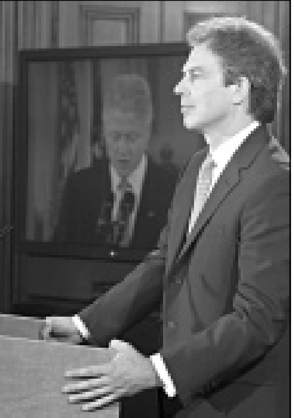
رئيس الوزراء البريطاني والرئيس الأمريكي يعلنان في وقت واحد امس التوصل لخريطة الجينات الوراثية البشرية (رويترز)