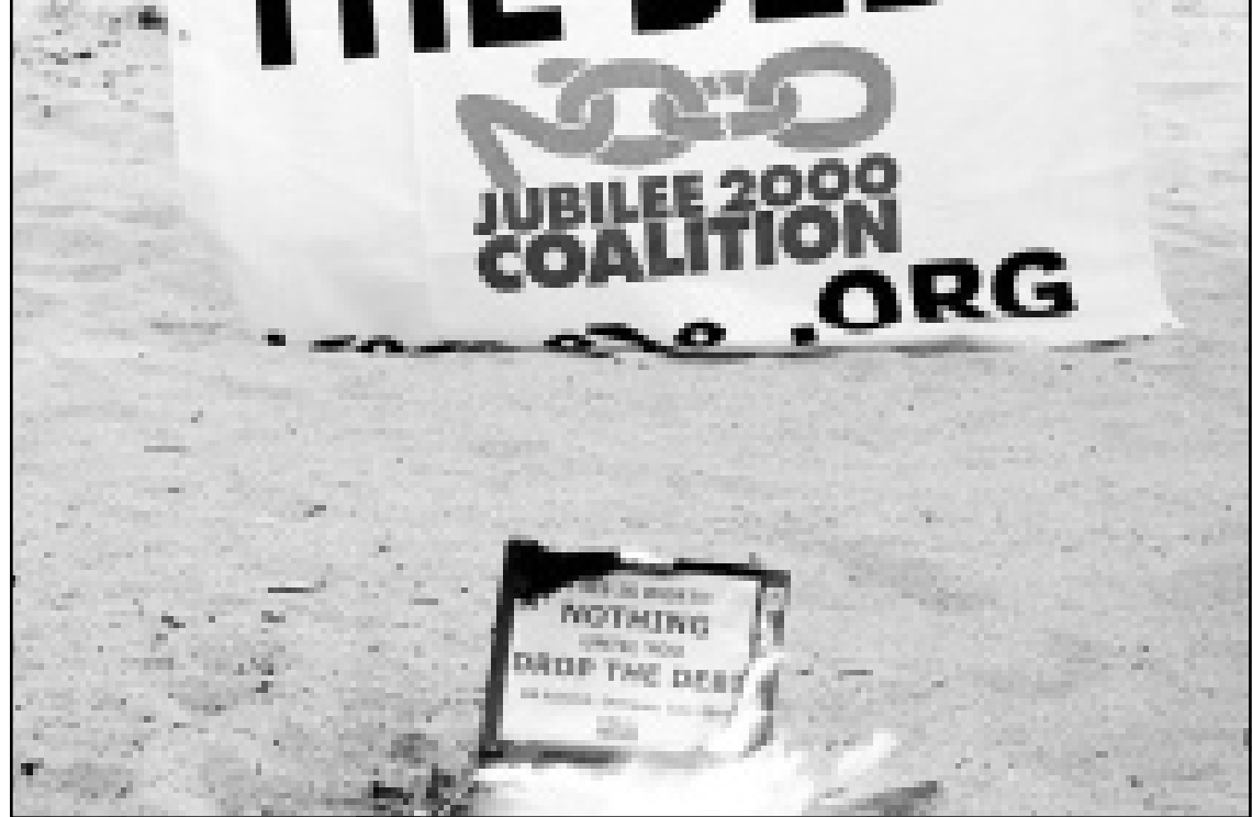
عضو في جماعة اليوبيل 2000 وراء باعلمة تدعو الى اسقاط ديون العالم الثالث وامامه جهاز كمبيوتر محمول يحترق

وسعى رؤساء دول وحكومات مجموعة الدول الصناعية الثماني الكبرى الى اعطاء صورة اكثر انسانية للعولة مكرسين جزيا مهما من اعمالهم في اوكينوا (اليابان) لقضايا التنمية لكنهم لم يتوصلوا مع ذلك الى اقتاع المدافعين عن العالم الثالث. وفي نص يتألف من 29 صفحة، اقترح