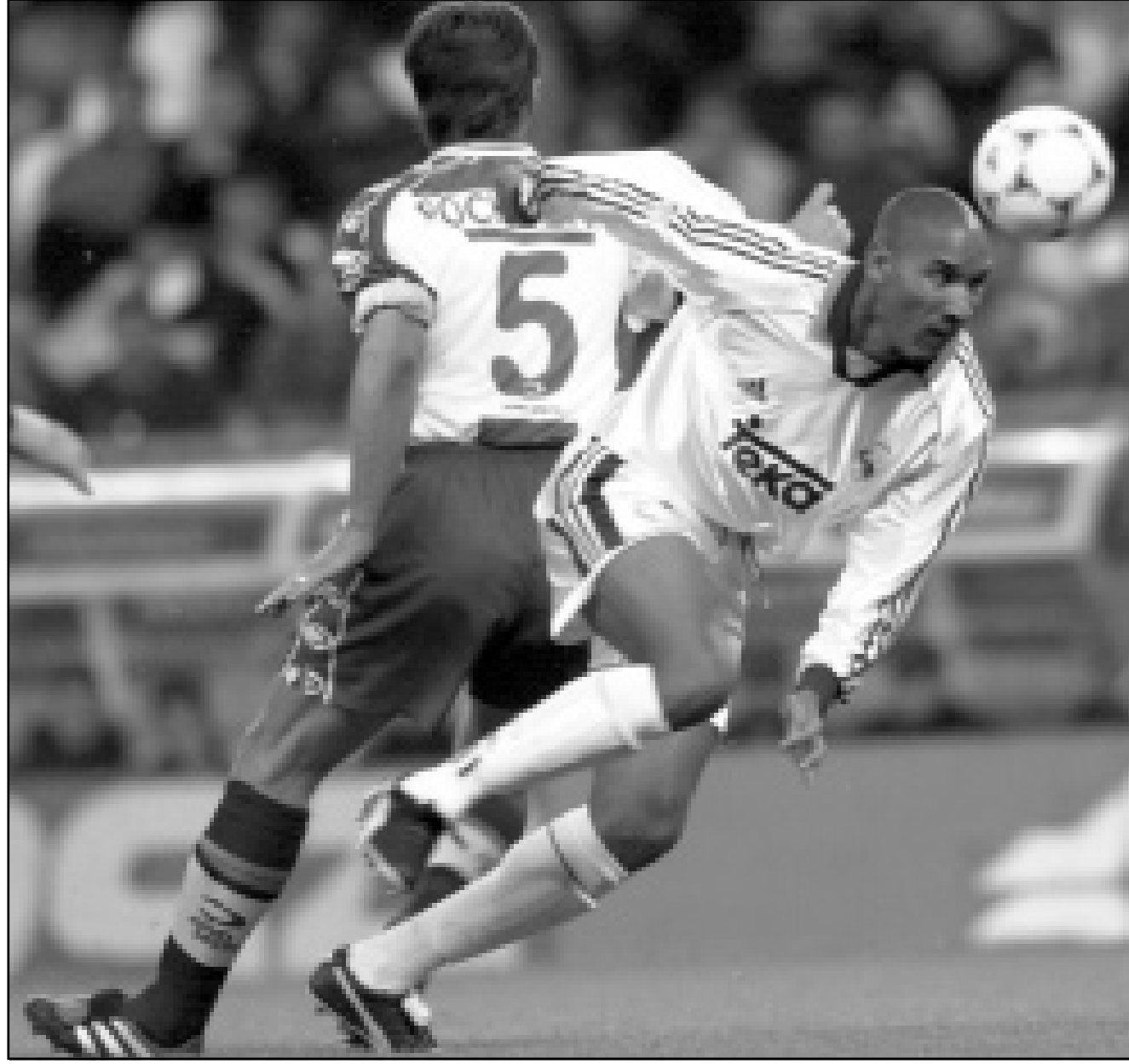
نيكولاس انيلكا في احدى مبارياته ضمن فريق ريال مدريد

وفيدخل في دائرة المنافسة ايضا الروسي مارات سايفن الذي صنف في المركز الثالث خلف كوريتشا، في حين كان المركز الرابع من نصيب الكوادوري نيكولاس لابنتي والسادس للمغربي يونس العيناوي. جنيف (سويسرا) حقق لوغانو العائد الى الدرجة الاولى فوزه الثالث على التوالي وكان على زيوريخ 1- صفر في الرحلة الثالثة من الدوري السويسري لكرة القدم فيقف منفردا بفوزه على الولايات المتحدة 3-صفر. اضافة الى لقب بطل دورة غشتاد السويسرية الاثني الماضي. وسيحاول حامل اللقب الاسباني البرت كوستا (35 عاما) تكرار انجاز العام الماضي ليرفع عدد القابه في هذه الدورة الى 4 بعد اعوام 95 و98 و99، وفي حال فوزه سيعدّل الرقم القياسي المسجل باسم الارجنطيني غيريمو فيلاس (77 و80 و82 و83)، علما بان كوستا صنف في المركز السابع.