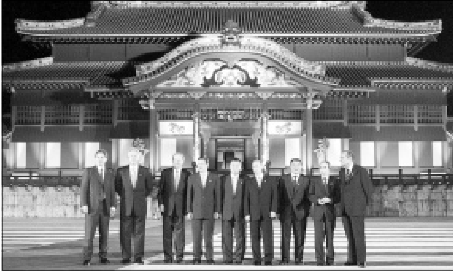
قادة مجموعة الثمانية في صورة تذكارية أمام مدخل القلعة التي عقدت فيها القمة (رويترز)

750 مليون دولار اهدروا في نفس الوقت فرصة تاريخية في الغاء ديون البلدان الأكثر فقرا، واهدروا اهل البلدان الأكثر فقرا في العالم في اطلاقه جديدة مع مطلع الالفية المقبلة.. واعتبرت الجمعية ان الـ 750 مليون دولار التي خصصتها اليابان لقمة اوكينوا كانت تكفي لغناء كامل ديون بعض البلدان الافريقية.