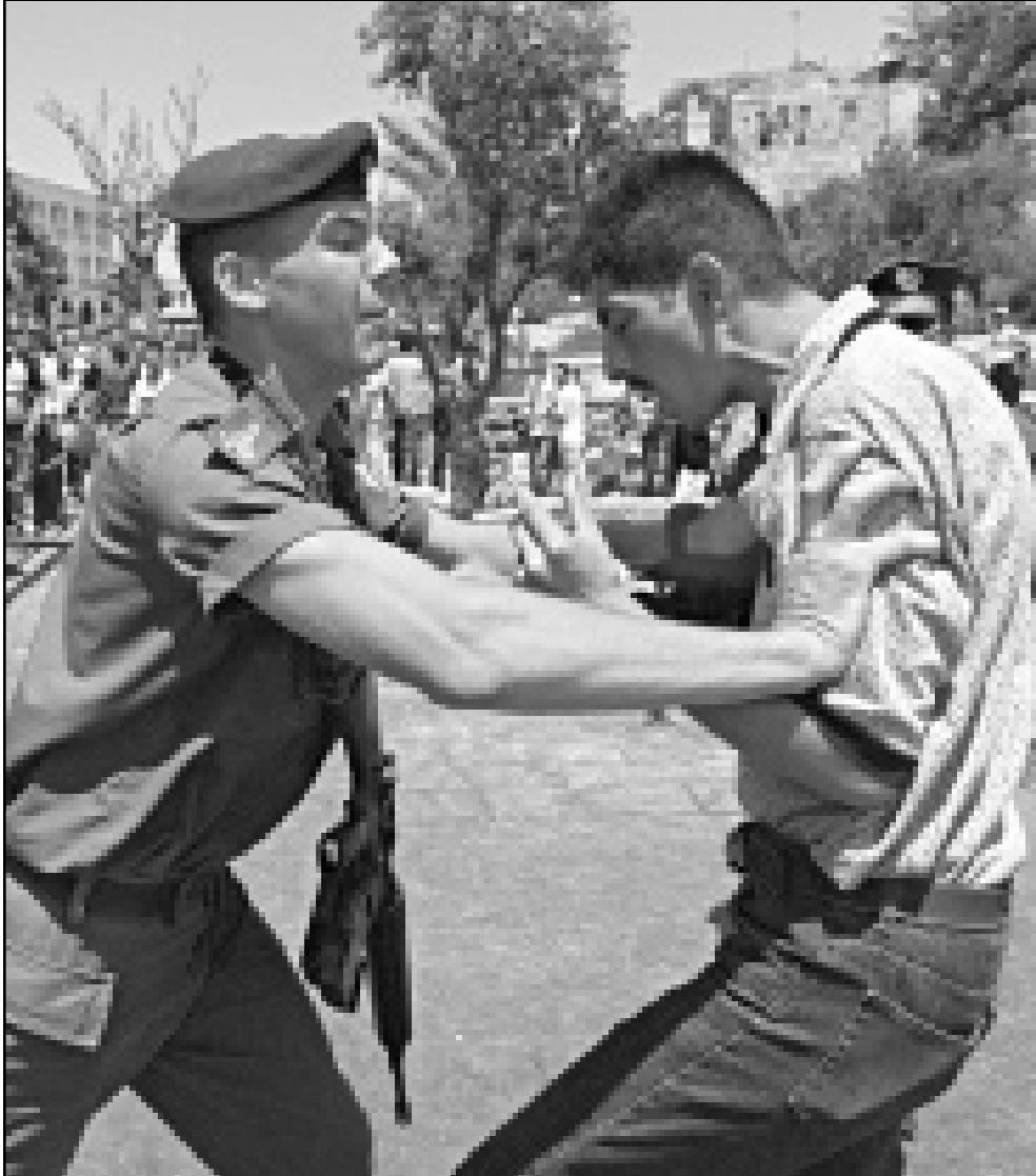
جندي اسرائيلي يحاول منع شاب فلسطيني من المرور عبر بوابة دمشق الى القدس القديمة التي شهدت أمس حادثة طعن موظف اسرائيلي في بلدية القدس