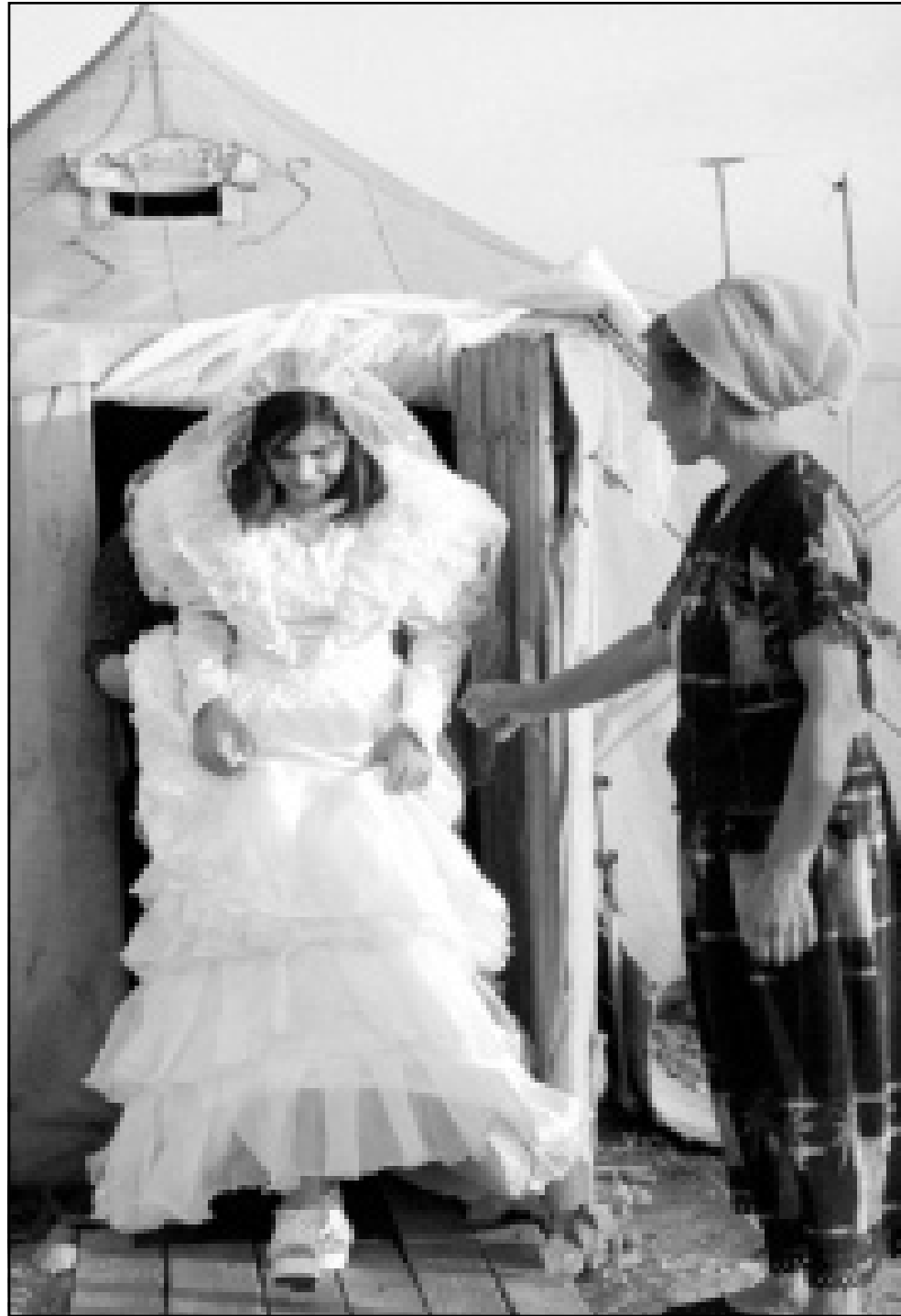
فرح شيشاني في مخيمات اللجوء في انغوشيا بعيدا عن الوطن