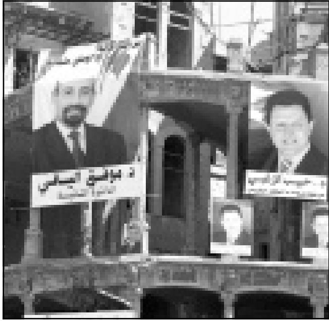
اعضاء الجنوبي ينتظرون نتائج الانتخابات اللبنانية للعودة الى الجنوب

على سيارة الصليب الاحمر واصطحبا نساءهما واولادهم الصغار وغادروا المكان... حتى لو مكث في السجن لعدة اشهر لا شك لديهما انهما قاما بالبطش الصحيحة... قال أحد الرفاق «ليس هناك ما هو اجمل من بيتنا، هذا افضل من الشعور بالغبرة وانه غير مرغوب بك في بيت الجار».