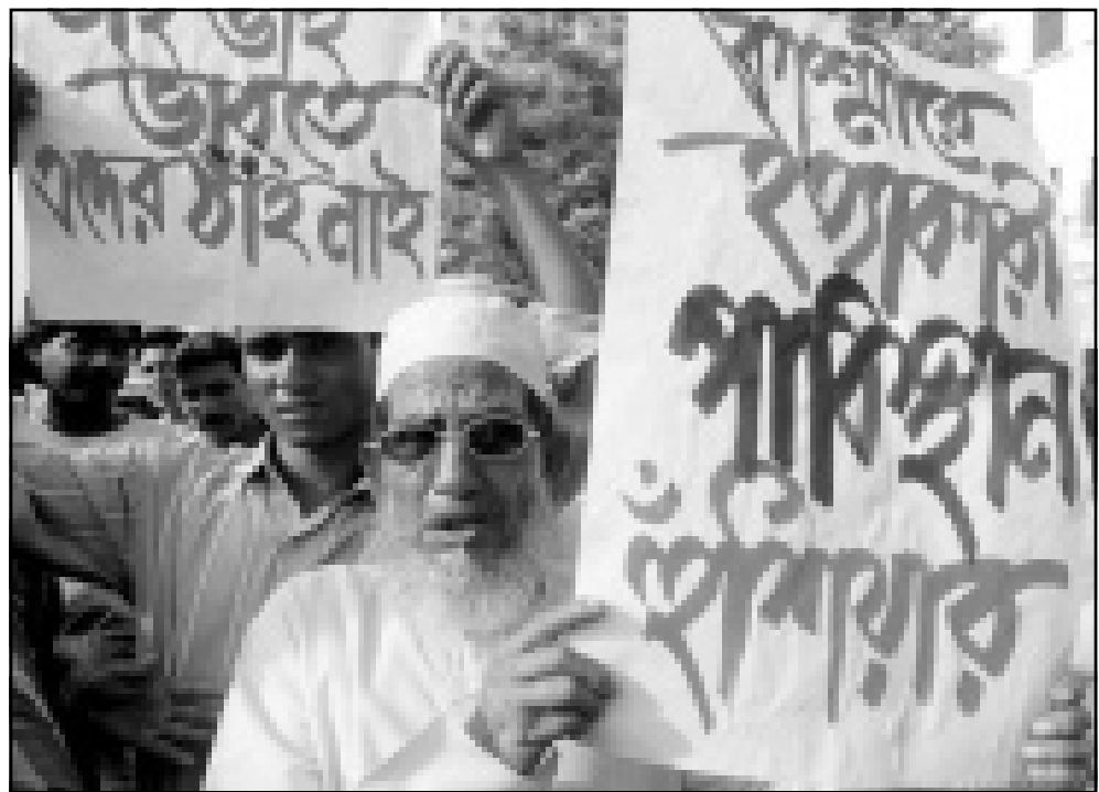
مظاهرة معادية لباكستان يشارك فيها نواب مسلمون في كلكتا امس