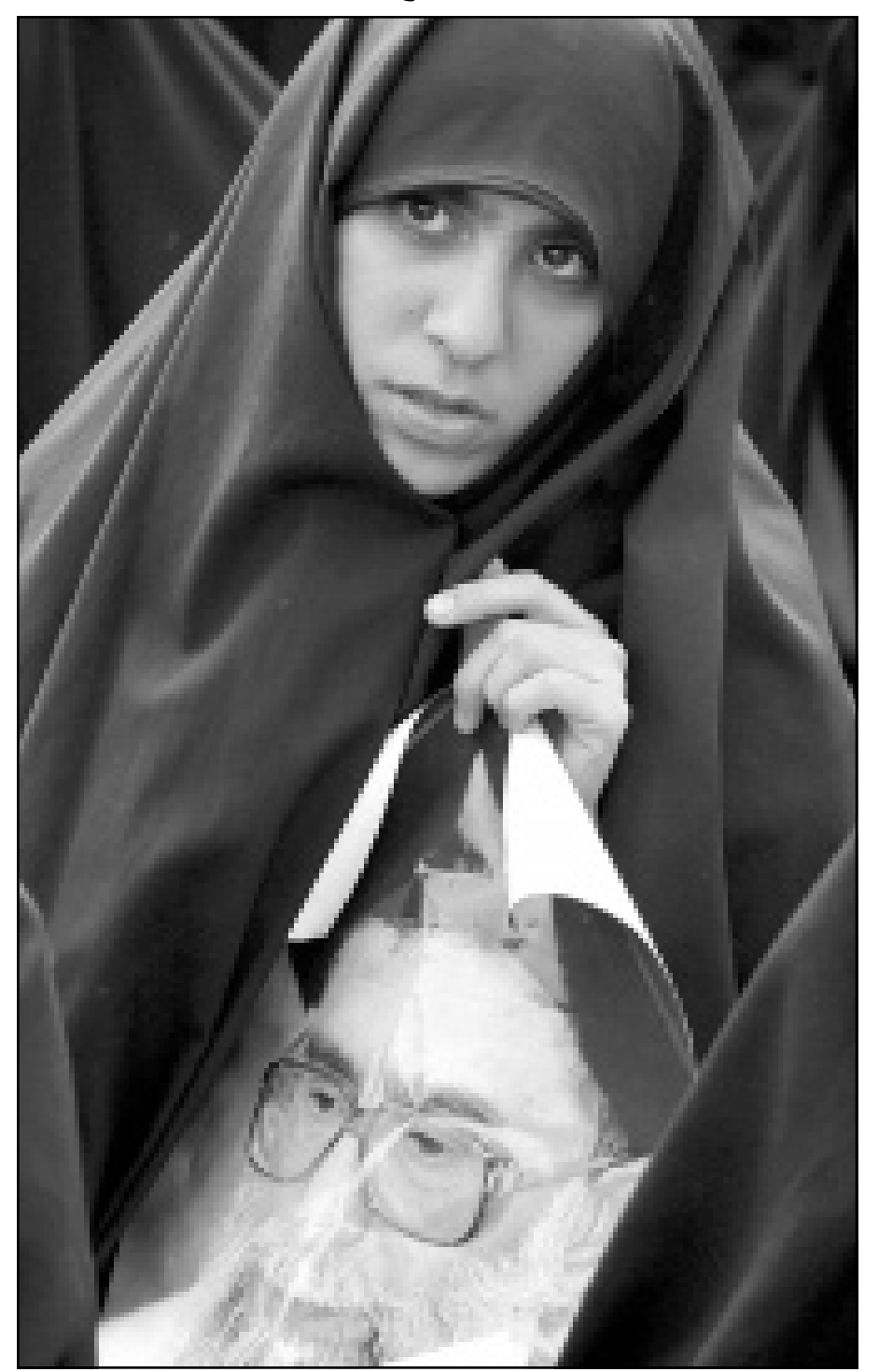
سيدة إيرانية تشارك في مظاهرة تأييدا لخامنئي في طهران أمس

من جهة اخرى ذكرت وكالة الانباء الإيرانية ان حوالي خمسين اصوليا إيرانيا تجمعوا مساء الاحد امام مقر مجلس الشورى الإيراني في طهران للاحتجاج على مواقف النواب الاصلاحيين. وقالت الوكالة ان المتظاهرين ارادوا التعبير عن «استيائهم» مما ادلى به النواب الاصلاحيون الاحد خلال الجلسة التي كان يفترض ان تنظر في تعديل قانون الطبوعات. وكان النواب الاصلاحيون الذي يشكلون الغالبية في المجلس انتقدوا مرشد الجمهورية الاسلامية آية الله علي خامنئي لانه امر بسحب مشروع القانون الذي يدخل تعديلات اصلاحية على قانون الطبوعات الحالي، وجرت مشادات وعراك باليدي بين النواب داخل المجلس ما دفع رئيس المجلس الى تعليق الجلسة التي كانت تنقل مباشرة من الاذاعة.