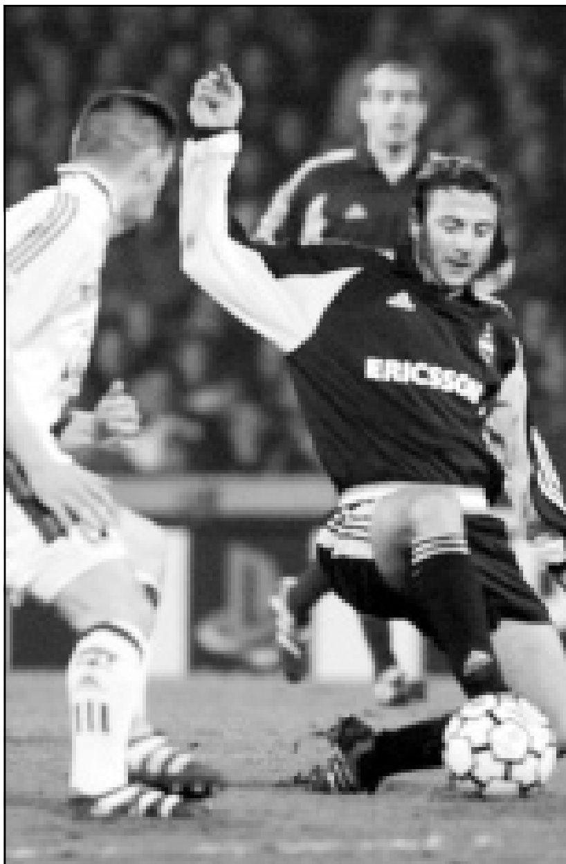
لقطة من إحدى مباريات ليون الفرنسي