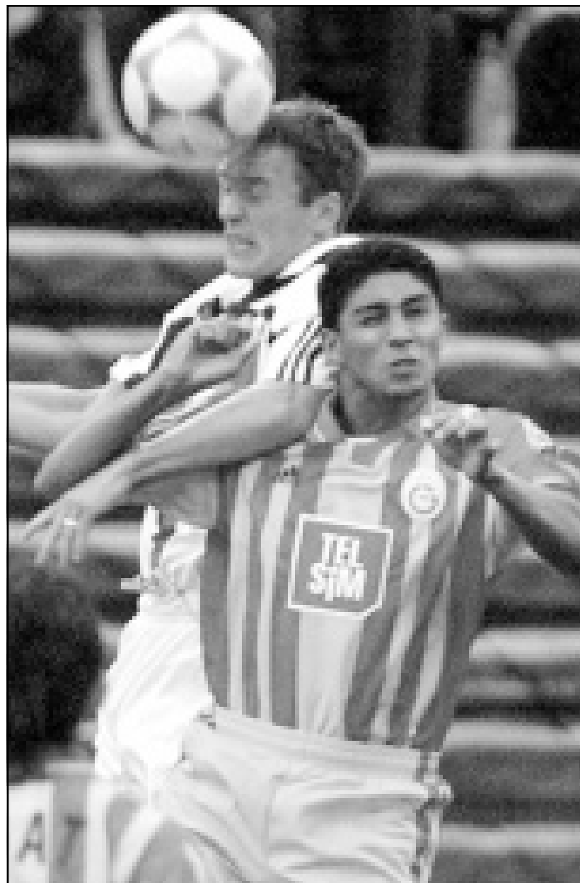
لقطة من إحدى مباريات غلطة سراي التركي