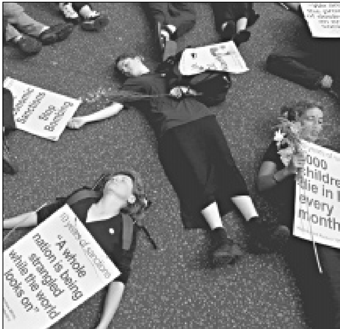
شرطة بريطانيان يعتقلان متظاهرا شاركت في الاحتجاج امام مقر رئيس الوزراء البريطاني... وسط لندن تشبها بالاطفال الذين يقتلهم الحصار في العراق كل شهر