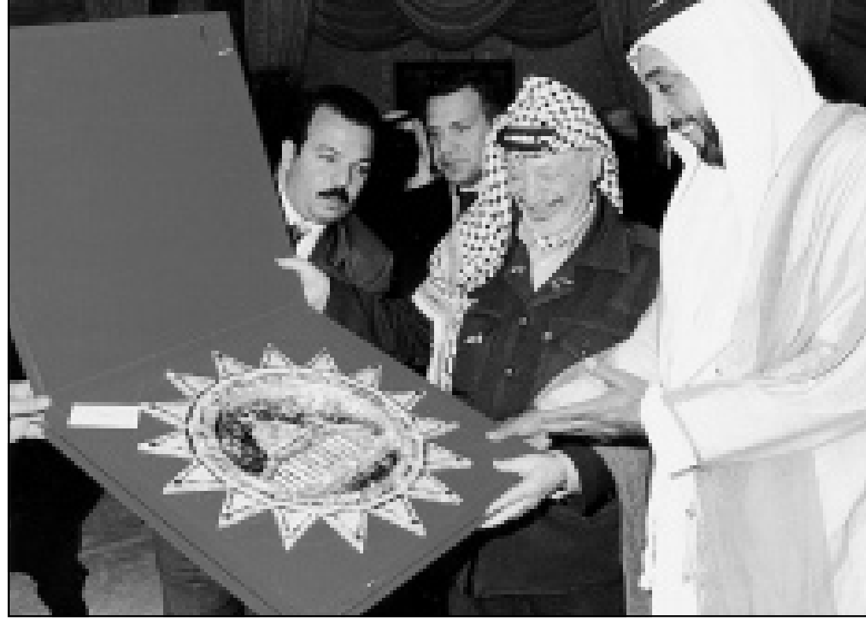
ابوظبي - من عز الدين سعيد: