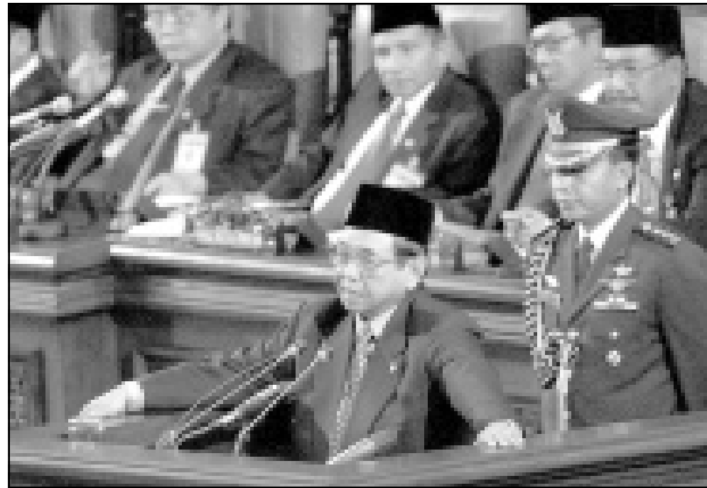
الرئيس واحد يتحدث امام مجلس الشعب الاستشاري في جاكرتا امس