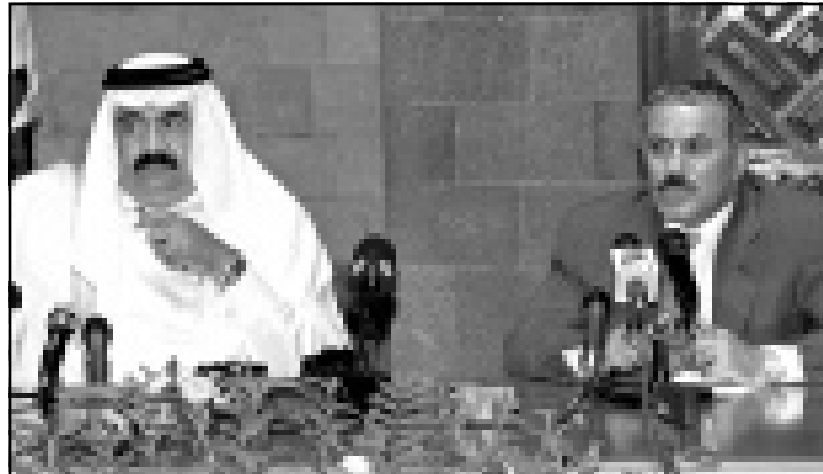
الرئيس علي عبد الله صالح وامير قطر الشيخ حمد بن خليفة اثناء مؤتمرهما الصحافي في صنعاء امس

وقال «ندين بشدة نقل السفارة الأمريكية الى القدس واعتقد انه استفزازي لمساعر العرب المسلمين». ودعا الى ضرورة انتظام عقد مؤتمر القمة العربية الشاملة، ووافق على ذلك امير دولة قطر الذي قال «لا بد من انعقاد القمة العربية الشاملة قريبا مناقشة القضايا العربية العالقة»، مشيدا بالنجاح الذي حققته القامة اللبنانية بالقوة ضد اسرائيل، واعتبره الاول في تاريخ الصراع العربي - الاسرائيلي. واعرب صالح عن استغرابه من موقف الامم المتحدة التي نفذت جميع قراراتها بدقة متناهية ضد العراق وليبيا ويوغوسلافيا، لكنها لم تقم بذلك في ما يتعلق بقرارات الداعمه للحقوق الفلسطينية والعربية، وقال ان بلاده ترفض المعايير الأمريكية المزدوجة «والكل بمعيارين» بشأن القضية الفلسطينية والصراع العربي الاسرائيلي عموما. واعرب آل ثاني عن عدم رضاه ما يتعرض له العراق من الحصار، وقال «نحن لا نقبل ان يكون العراق محاصرا وتتمنى ان يزول هذا الحصار قريبا»، وفي الطرف الاخر اعرب عن تقاؤله بان تخرج ايران من عزلتها عند دول المنطقة. واشاد بالتجربة البرلمانية اليمنية، وقال انه يسعى الى نقل المشاركة الشعبية الى بلاده، وقال