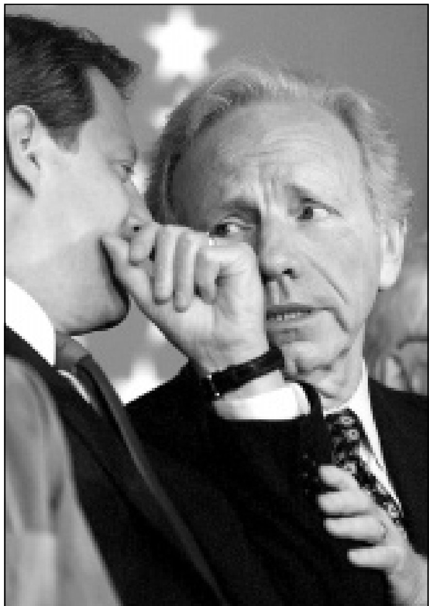
السناتور جوزيف ليبرمان مع نائب الرئيس ال غور