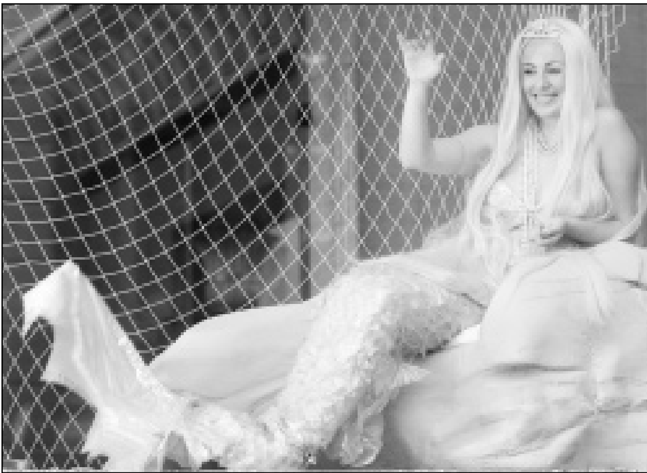
عارضة في واجهة متجر مجوهرات في مدينة سدني الاستراتيجية تتزين بقلادات من لآلئ البحر الجنوبي وتلوح للمامة على طريقة حوريات البحر في نطاق حملة ترويج للمعجز

وقبل وصول شافيز استعرض الملك فهد امام حكومته «الدور الفعال والمهم» الذي لعبته المملكة وفنزويلا