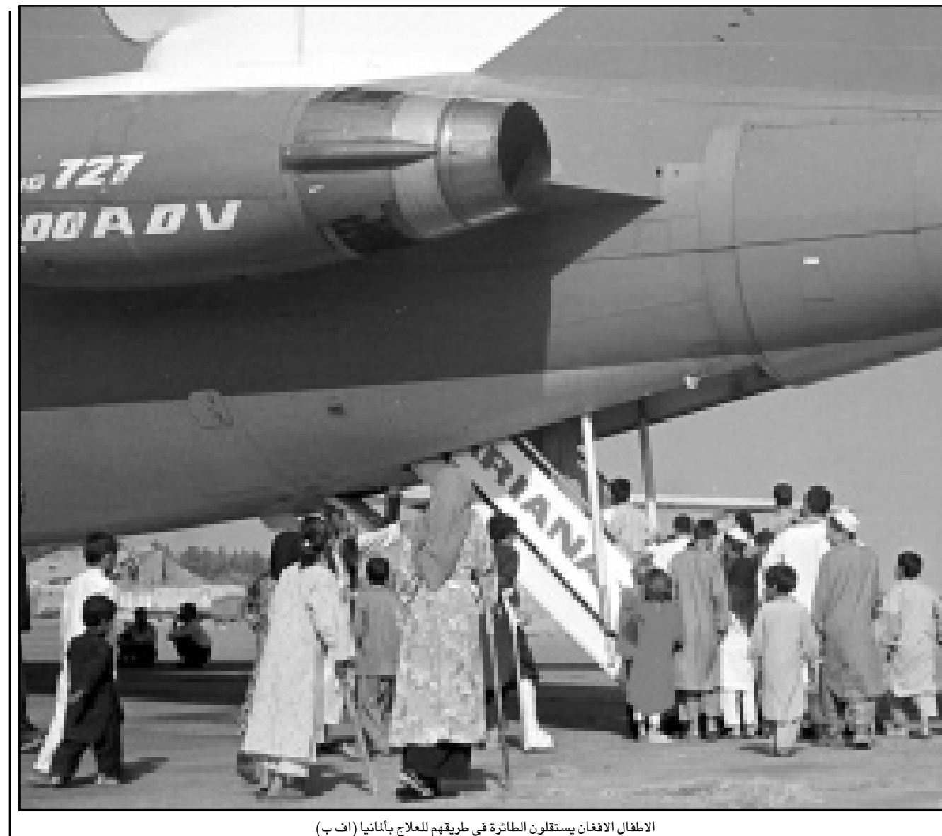
الاطفال الافغان يستقلون الطائرة في طريقهم للعلاج بالمانيا

■ انقرة - رويترز: قالت وكالة الاناضول التركية الرسمية للانباء ان حريقا اشتعل في عبارة ركاب في وقت مبكر الخميس وهي راسية في ميناء على البحر الاسود. وقالت الوكالة انه تم انقاذ طاقمها المؤلف من 12 شخصا ولكن البحث مستمر عن جراح مفقود يعتقد انه مازال داخل العبارة. ولم ترد اي اشارة الى وجود ركاب على متنها. وتنتع العبارة (جورجين) ما يصل الى 350 راكبا و23 شاحنة. وتسافر عادة بين ميناء طرابزون التركي على البحر الاسود ومنتجع سوتشي الروسي. ونقلت الوكالة عن عادل يازار حاكم طرابزون قوله «هناك معلومات متناقضة عن سبب اندلاع الحريق، تردد انه نتج عن ماس كهربائي او اعمال لحام». وابتعدت العبارة عن الشاطئ خشية ان تصل النيران الى خزانات الوقود وتشكل تهديدا للبلدة. وقالت الوكالة ان العبارة مائلة وربما تغرق.