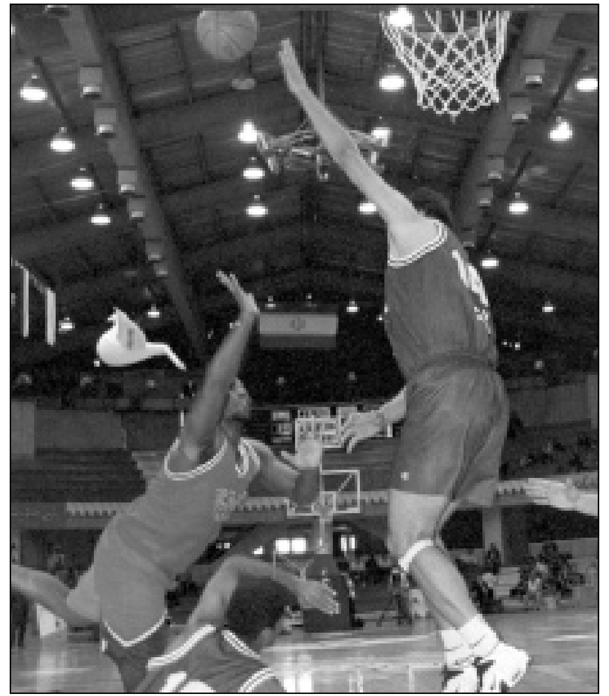
لقطة من مباراة كرة السلة التي جرت في طهران بين فريق غلوبال سبورتنج الامريكي ومنتخب ايران أمس الاول

وكانت مباراة مصر والسويد جيدة من الطرفين لكن المنتخب المصري اكد تفوقه على نظيره السويدي للمرة الثالثة على التوالي في الشهرين الماضيين، الاولى في بطولة العالم للقارات والثانية في بطولة بيرسي