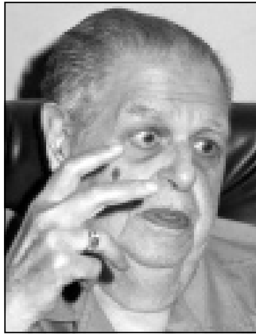
فؤاد سراج الدين

بدرراوي نائباً له، غير أنه حسب كلام المصدر نفسه - فإن إنجاز هذه الصفقة يتطلب إنهاء نزاع عنيف «سيدب بين الطرفين خلال الأسابيع القليلة الماضية». المصدر نفسه يرى أن اختيار جمعة للرئاسة حال حدوثه يصح تغييراً جوهرياً في موقف الحزب.. وسوف يحيل الرؤية الوافية لسياسة متشددة مع الحكومة.. خصوصاً وأننا يجب الانسحاب من الانتقادات التي وجهها لياسين سراج الدين زعيم كتلة الوفد في البرلمان، والتي تلخصت في ضرورة اثبات خطته في بيان مواقف سياسية داخل مجلس الشعب تتعارض مع توجهات الحزب الرسمية، وتقرب أكثر من المواقف الحكومية. وفي إشارة لوقف الحزب من ثورة يوليو والحكومة المصرية قال المصدر: إن الأمور في ظل وجود نعمان رئيساً للحزب سوف تشهد الكثير من التشنج، خصوصاً وأن توجهات الكتلة وأموالها أساسية أخرى، خصوصاً وأن توجهات الكتلة البرلمانية الوافية - خلال السنة والسنين الماضيتين - التي تعتبر مهانة للحكومة في الوقت نفسه، والتي تزعمها ياسين سراج الدين لم تلق أي قبول بين نعمان ومؤيديه، وهو ما اعتبره خروجاً عن سياسات الحزب العامة، إلا أنه في حال فوز ياسين سراج الدين، فإن حزب الوفد ستتغير نبرته «المتشددة» التي تزعمها نعمان إلى النبرة الهادئة لياسين سراج الدين، وهي النبرة التي تزعمها ياسين «صفتها زعيم الكتلة البرلمانية بالجلس، خلال الثلاث سنوات الأخيرة».