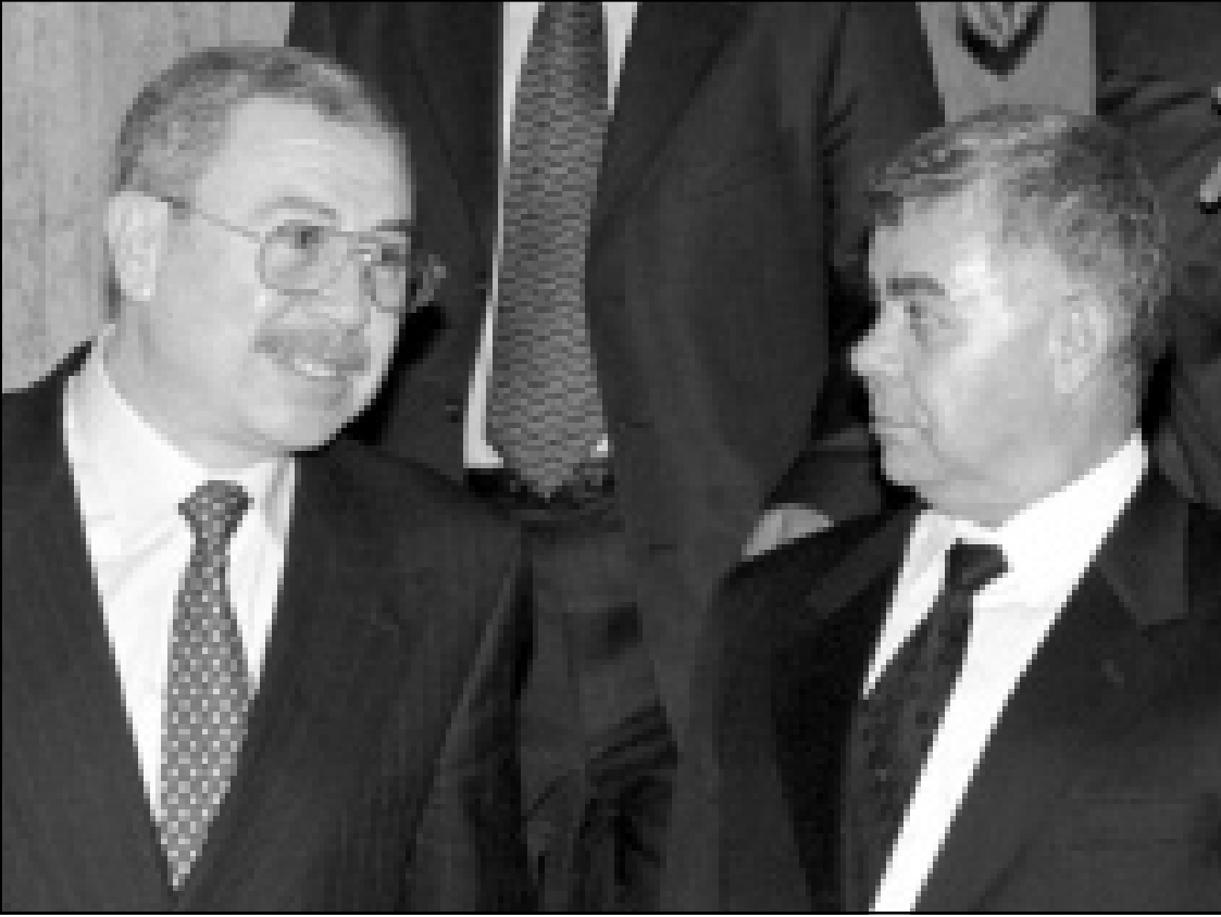
رئيس الوزراء السوري محمد مصطفى ميرو يرحب بنظيره الأردني علي أبو الرابغ في دمشق أمس

مشق - ف. ب: أعلن مصدر رسمي سوري رسالة الخميني ان الرئيس بشار الأسد تسلم رسالة من العاهل الأردني الملك عبد الله الثاني تلقها رئيس الوزراء الأردني علي أبو الرابغ.