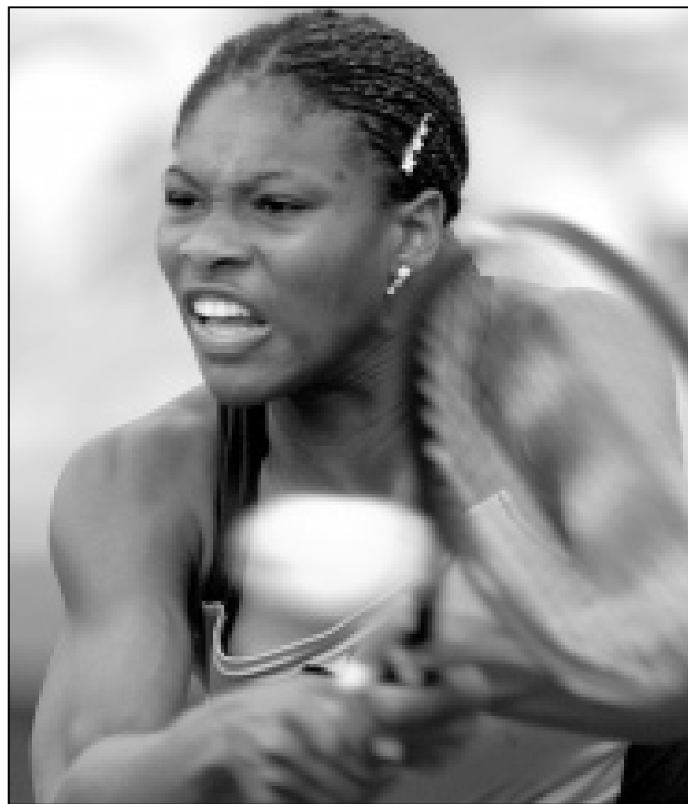
اللاعب الامريكية سيرينا وليامز

■ مونترال-رويتز: تأهلت المصنفة الاولى السويسرية مارتينا هينغيس بسهولة لدور الثمانية للبطولة الكندية المفتوحة للتنس بفوزها على الروسية ناديجدا بتروفا 1/6 و3/6. وصعدت ايضا المصنفة الثانية الامريكية لينزي دافنورت لدور الثمانية ولكن بعد ان واجهت مشقة امام البلجيكية جوستين هينتي التي تحسنت المركز 72 على مستوى العالم وفازت اللاعب