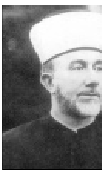
الحاج امين الحسيني

قبل ان تخرج الى اجازتها صادقت الكنيسة بالقراءة الأولى بأغلبية مشددة للانطباع تبليغ 71 نائبا من اليمين واليسار وبحماسة كبرى على القانون الاساسي للقدس التي يضع المصاعب في وجه تغيير حدود المدينة. يجدر بنا ان نذكر النواب الذين يسعون إلى «تعزير القدس» ما هي مخازير قرارهم وما هي الاضرار المدنية الاقتصادية والسكانية والسياسية التي لحقوها بهذه الحدود بل وأكثر من ذلك ما هي المخاطر التي تحدث بالقدس اذا ما استمرت هذه الحدود في الوجود. لقد تبنت هذه السياسة - أي توحيد المدينة - حكومة ليبي اشكول في العام 1967، وما تبني هو اقرار نقطة تفصيلية هامشية وافية مزعومة أخرى هي حدود تلك المدينة الموحدة. وقد عينت الحكومة لهذا الغرض لجنة من الخبراء وضمت مندوبين عن البلدية ووزارات حكومية والجيش الإسرائيلي وخبراء في تخطيط المدن. وقد طرح على اللجنة خيباران استراتيجيتان بديلان وكان يفترض بالخيارين ان يطبقا بأكبر قدر ممكن السياسة التي تضمنت توحيد المدينة ومنع كل امكانية لاعادة تقسيمها في المستقبل. الخيار الاول كان يسعى إلى ابقاء المدينة منطوية على نفسها بعيدا عن المدينة وصغيرة في حجمها؛ ربط المدينة الأردنية (7 كم) إلى المدينة الإسرائيلية (37 كم). والقدس الموحدة حسب هذه الاستراتيجية كانت ستضم عددا