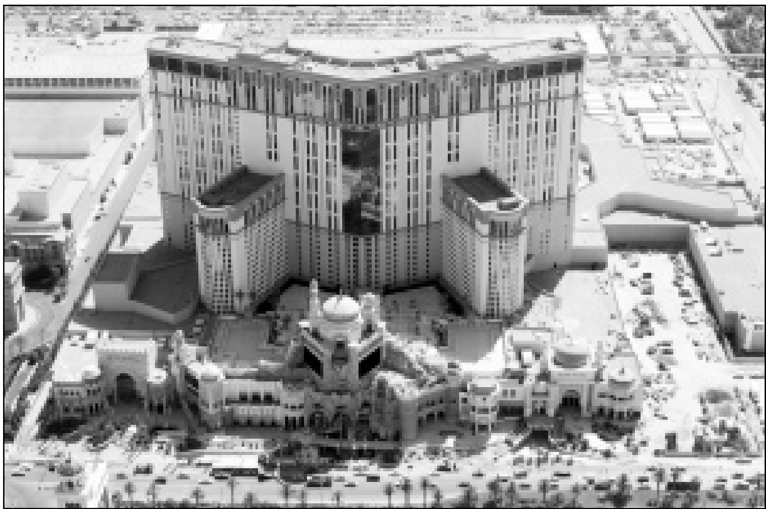
منظر بانورامي لمنتج علاء الدين السياحي القريب من مدينة لوس انجليس الامريكية الذي افتتح امس الخميس بعد ان تكلف بناؤه 1,4 مليار دولار. وقد الحق بالمنتج الذي سيعمق فندقا ذا 2567 غرفة، كازينو للقمار مساحته 135 قدم مربع بني على الطريقة الشرقية على أمل ان يجتذب سائحين ومغامرين من الدول العربية (رويترز)

ونقلت الصحيفة عن خبراء في اوبك قولهم ان الاسعار المرتفعة ليست مبررا لوضع آلية التناقص السعري للمنظمة موضع التنفيذ.