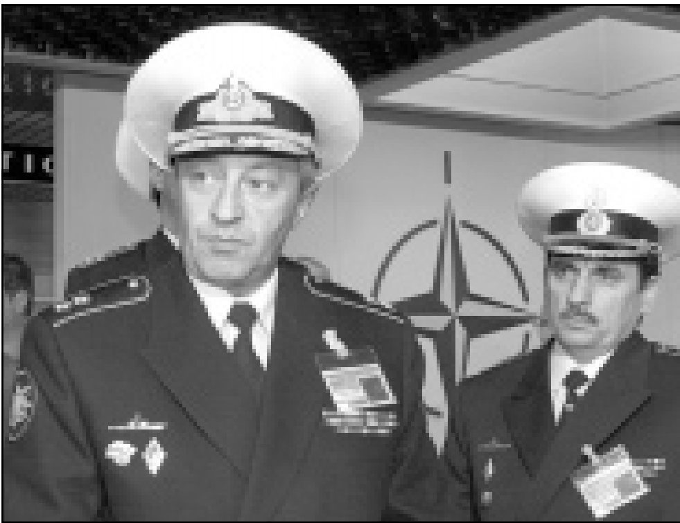
مساعدا قائد القوات البحرية الروسية الكسندر بوبوي (يسار) خلال حديث مع الصحافيين بمقر حلف شمال الاطلسي ببروكسل أمس

■ لندن - موسكو - اف ب: اكدت وزارة الدفاع البريطانية أمس الخميس ان الغواصة الروسية «كورسك» القابعة في قاع بحر بارنتس عرقت اثر تعرضها «لانفجار شديد القوة». وأوضح المتحدث باسم الوزارة ان الاضرار التي لحقت بالغواصة تعد من المقدمة الى المؤخرة مما يجعل كوة الغرفة المخصصة لاجلاء الطاقم الموجودة في المقدمة غير قابلة للاستخدام. ولكنه اضاف انه توجد كوة طوارئ اخرى سليمة في مؤخرة الغواصة ويمكن استخدامها. وتوجهت سفينة نرويجية تنقل الغواصة البريطانية الصغيرة «الار 5» صباح أمس الخميس الى بحر بارنتس للمساهمة في اعمال انقاذ 118 رجلا محتجزين داخل كورسك منذ الاحد.