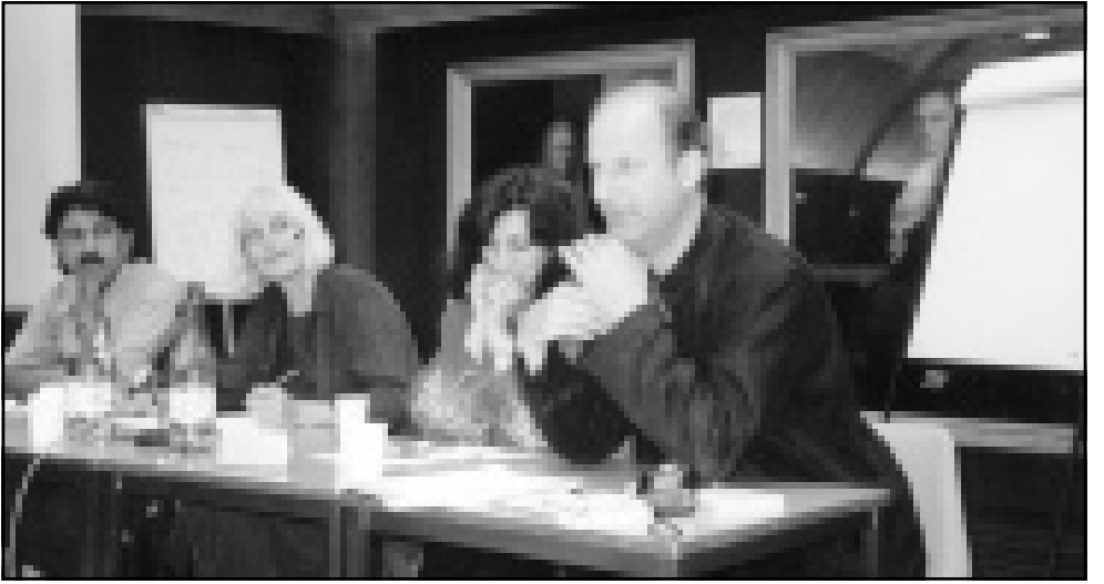
بعض المشاركين في الندوة