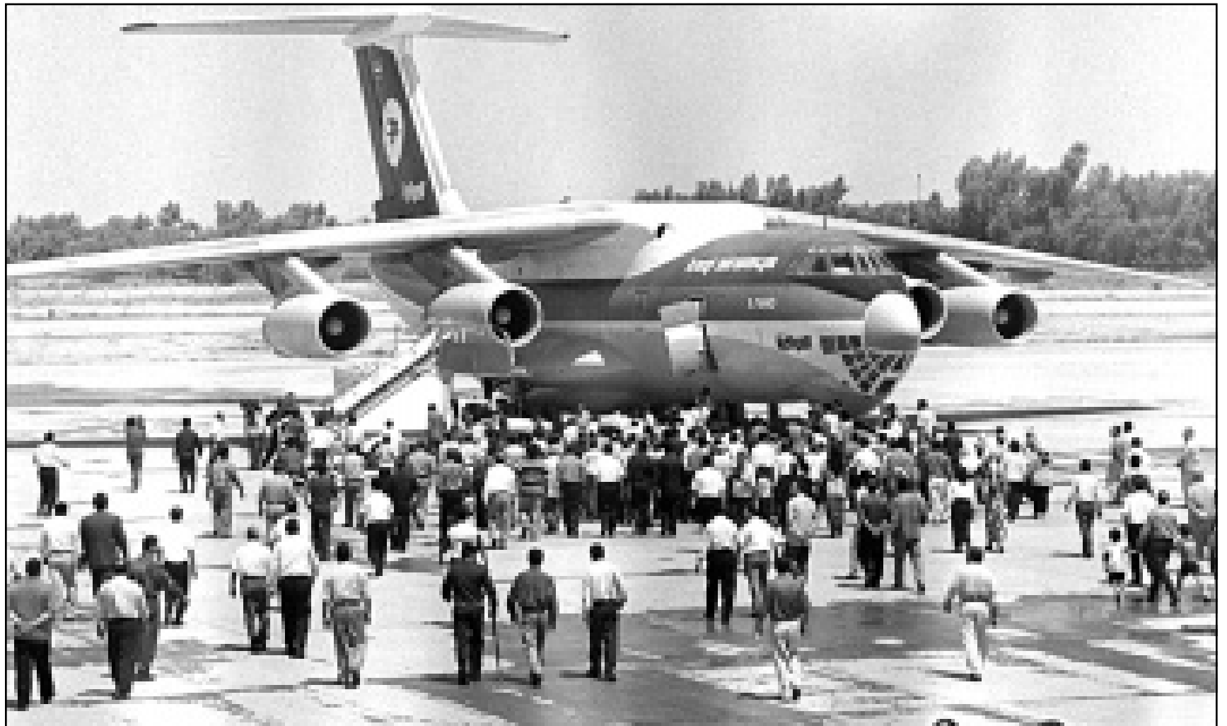
الطائرة العراقية لدى هبوطها في مطار صدام الدولي في بغداد وسط احتفالات باستئناف الملاحة الجوية

وكانت لجنة العقوبات قد رفضت في السابق طلباً من بغداد بعودة هذه الطائرات إلى العراق. ومنذ عام 1997 تحدى العراق عقوبات الأمم المتحدة بإرسال طائرات مدنية محملة بحاجات إلى السعودية. ويقول مسؤولون عراقيون إن سياسيين فرنسيين مؤيدين للعراق وشخصيات أخرى يخطون لانتهاك حظر الطيران ضد بغداد في الشهر القادم.