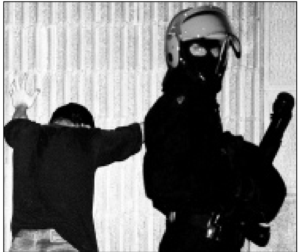
شرطي اسباني من فرق التدخل يراقب مشتبهيا في انتماها إلى «ايتا» بمدينة سان سيباستيان عقب مواجهات جرت امس الاول (رويترز)

وقال مسؤولون حكوميون أن الأعمال الاحتجاجية التي يقوم بها الشباب الموالي لحركة «ايتا»