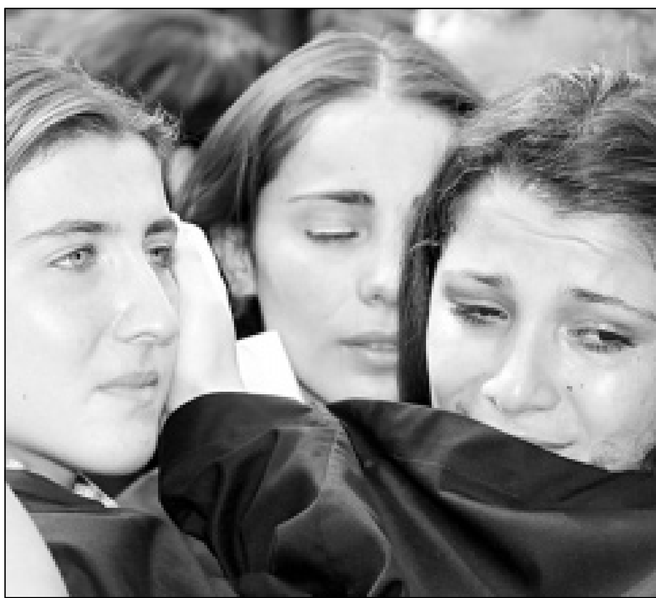
فتيات تركيات يبكين في ذكرى الزلزال في انقرة اس