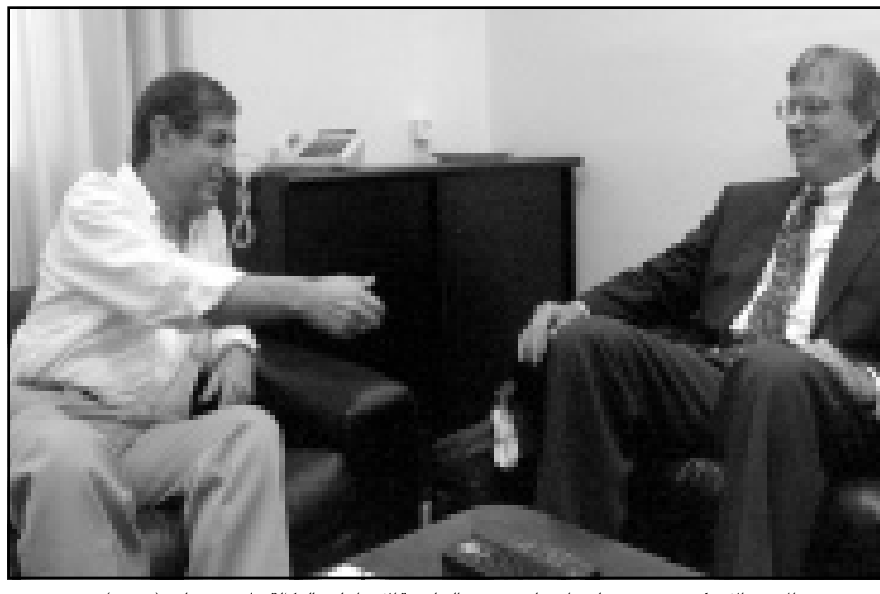
البعوث الأمريكي دنيس روس لدى اجتماعه مع وزير الخارجية الإسرائيلي بالوكالة شلومو بن عامي

ومن غرة اعبر مسؤول فلسطيني كبير امس الخميس عن عدم ثقته بالتوصل إلى نتائج خلال الاتصالات الجارية حاليا مع إسرائيل بشأن القضايا العالقة بين الطرفين. وأعرب الفاوض الفلسطيني ياسر عبد ربه ووزير الثقافة والإعلام في السلطة الفلسطينية لوكتاف فرانس برس عن «عدم ثقته في احتمال التوصل إلى أية نتائج خلال الاتصالات الجارية مع إسرائيل حاليا». وحذر عبد ربه من «أن أي فشل لأية قمة جديدة سيؤدي إلى نتائج وخيمة» مؤكدا على «أن عقد أي قمة على غرار كامب ديفيد يتطلب تحضيرا دقيقا يتم خلاله التوصل إلى حلول للقضايا الأساسية خاصة القدس والحدود والاستيطان واللاجئين والمياه».