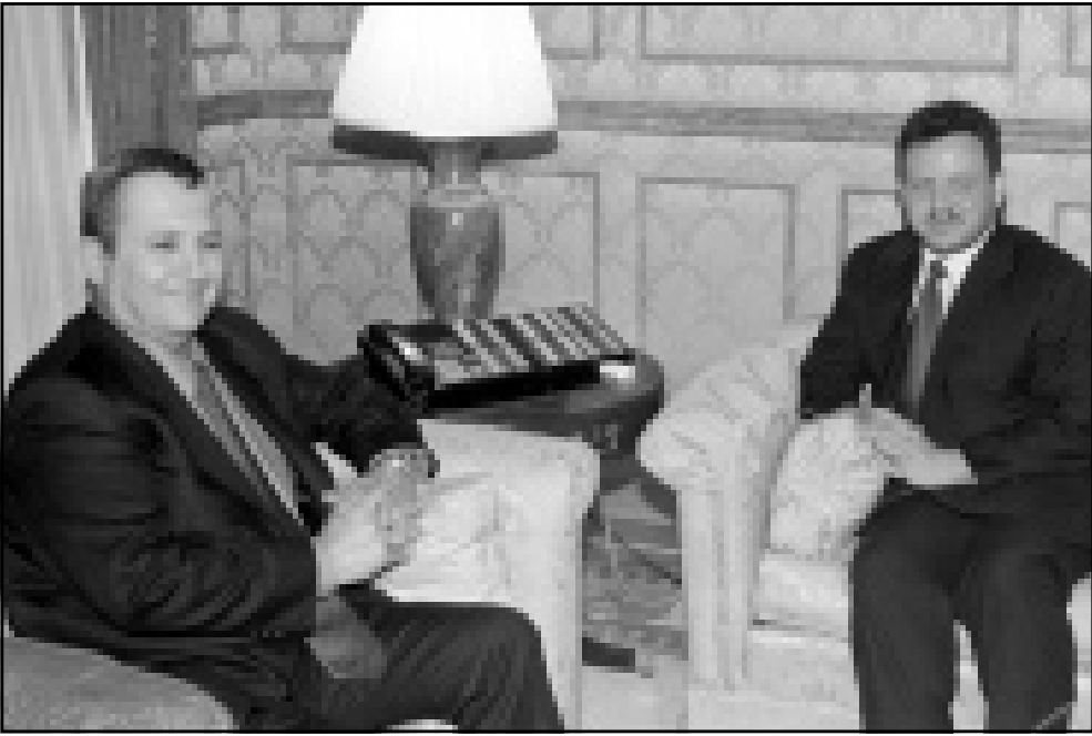
العاهل الأردني لدى استقباله رئيس الوزراء الإسرائيلي مساء الأربعاء