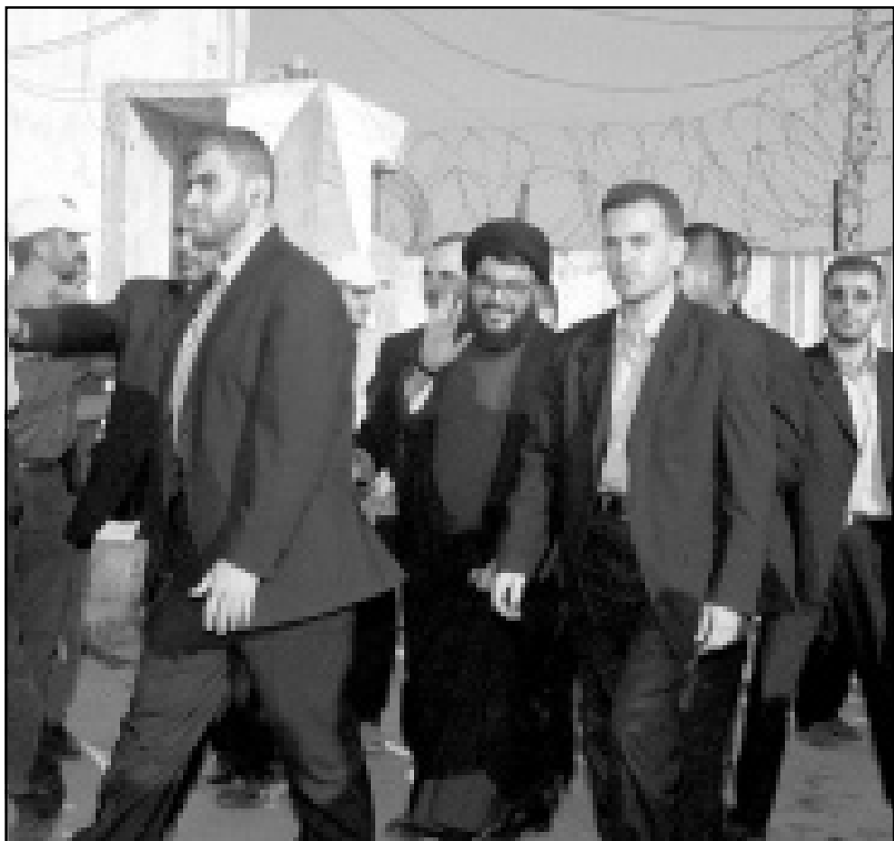
الشيخ حسن نصر الله (وسط) محاطاً بحراسه أثناء زيارة قام بها أمس إلى معتقل الخيام السابق