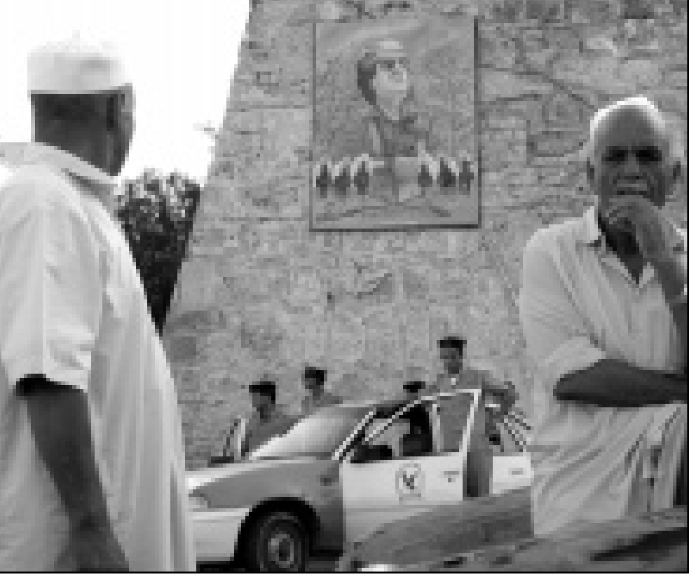
ليبيون في محطة سيارات اجرة في طرابلس