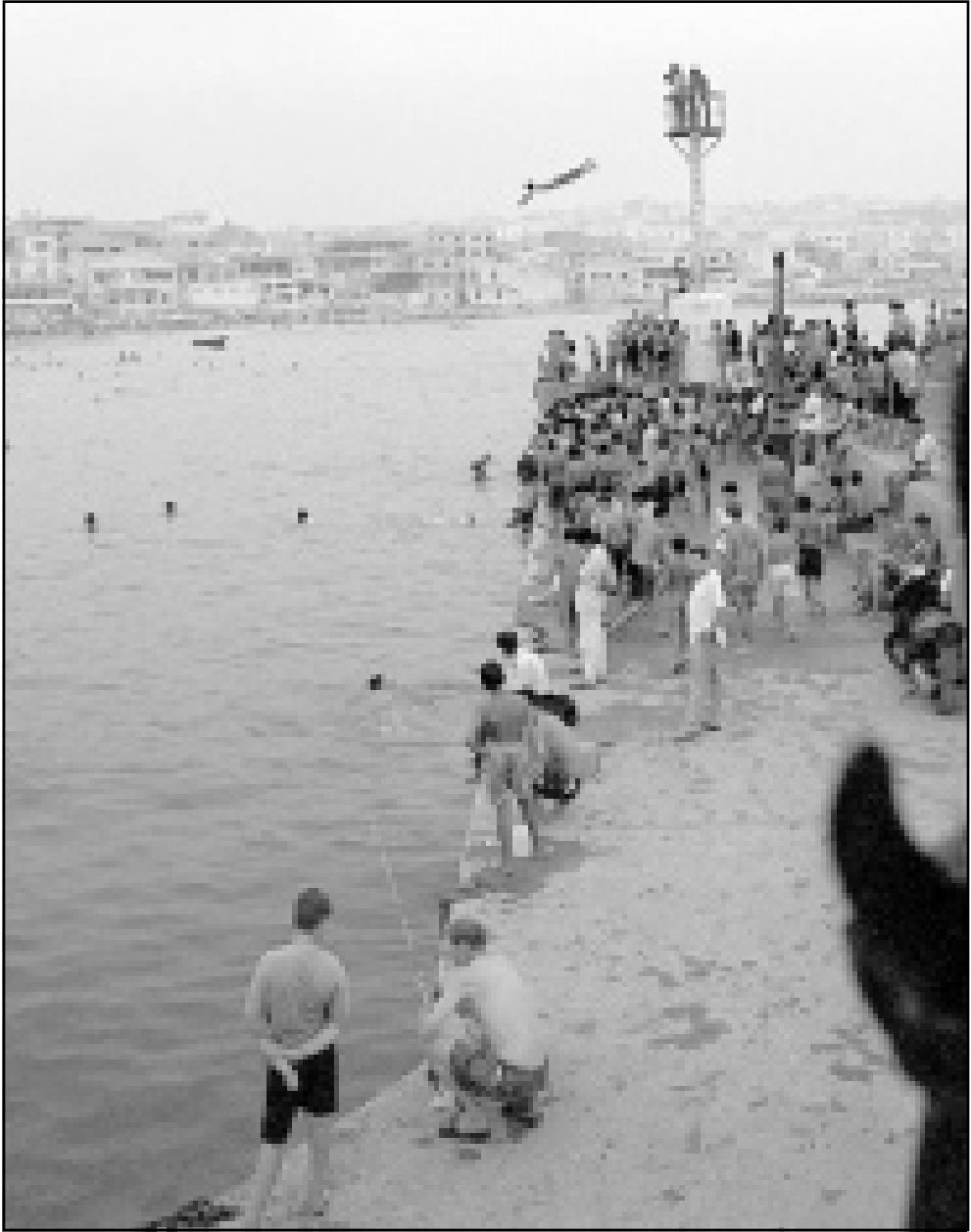
جزائريون يزدحمون على شاطئ قرب العاصمة، بينما فضل آخرون «الافتاء» في البيوت التي حين مرور موجة الحر الشديدة