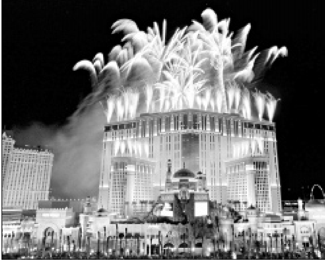
الاسهم النارية تضفي عتمة الليل حول منتج علاء الدين السياحي في لوس انجليس الذي افتتح ليل السبت/ الأحد بعد أن تكلف بنحو 1.4 مليار دولار

■ مسقط - رويترز: افاد مسؤول بوزارة المالية أمس الأحد أن سلطنة عمان ستخفض الضرائب على الاعمال التجارية المملوكة لأجانب من أجل تعزيز الاستثمار الاجنبي في البلاد. وقال المسؤول لرويترز ان المصالح التجارية المملوكة بالكامل لأجانب ستدفع الآن ضرائب لا تزيد عن 30 في المئة فقط كحد أقصى بدلا من 50 بالمئة، وستصبح الضرائب الاجنبية التواجد لها استثمارات في شركات أخرى معفاة من الضرائب على الأرباح التي تحققها الشركات التابعة لها. وأضاف المسؤول أن التعديلات الضريبية الجديدة التي ستصبح سارية اعتباراً من كانون الثاني (يناير) عام 2001 تهدف إلى اجتذاب مزيد من الاستثمارات الأجنبية إلى السلطنة.