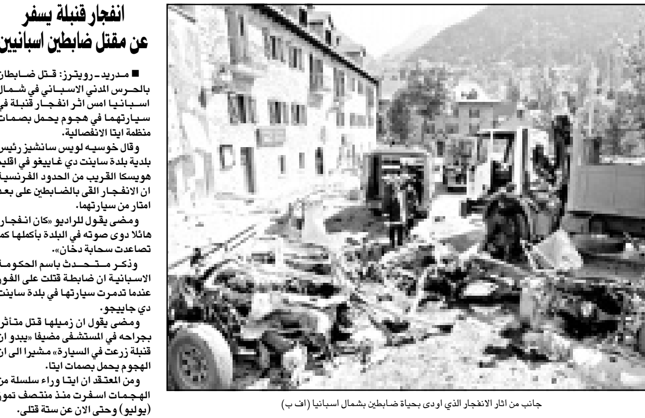
جانب من اثار انفجار الذي اودى بحياة ضابطين بشمال اسبانيا

القدس العربي- وكالات: أكدت وكالة الانباء الجزائرية امس الاحد ان قوات الامن قتلت 25 اسلاميا مسلحا على الاقل وحاصرت 300 آخرين في ولايتي عين الدفلى والشلف الواقعين غرب العاصمة. ومذ سنة قتل الوكالة الرسمية وبقية وسائل الاعلام الحكومية من نقل الاخبار الامنية. غير ان «واج» اوردت امس عن ثلاث صحف بينها «الوطن» قولها انه اثناء عملية تمهيط واسعة في ولايات الوسط الغربي وجبال الظهرة، قتلت قوات الامن المشاركة 25 «ارهابيا» على الاقل. وقامت القوات الامن التابعة للجيش بالعملية يوم الجمعة في عين الدفلى والشلف الواقعين على بعد 200 كيلومتر غربي الجزائر العاصمة ضمن ما وصفته الوكالة باصراع ضد «الارهاب». ومضت الوكالة تقول ان قوات الجيش حاصرت نحو 300 آخرين من «الارهابيين» الملقين انهم اعضاء بكتيبة الاحوال، الا انها لم تذكر المزيد من التفاصيل. وعالما ما تورط الصحف الجزائرية ان اعضاء ما يسمى ب«كتيبة الاحوال» يتمركزون بمناطق عين الدفلى ويتنقلون احيانا شرقا نحو البليدة وغربا نحو الشلف. ولم تتحدث الصحف او مصادر رسمية ولو مرة واحدة عن الوصول الى هذه الكتيبة بشكل او باخر. وعادة ما تستخدم وسائل الاعلام الرسمية وصف «الارهابيين» في اشارة الى الاسلاميين الذين ما زالوا يقومون باعمال عنف ورفضوا العفو العام الذي اصره الرئيس الجزائري عبد العزيز بوتفليقة.