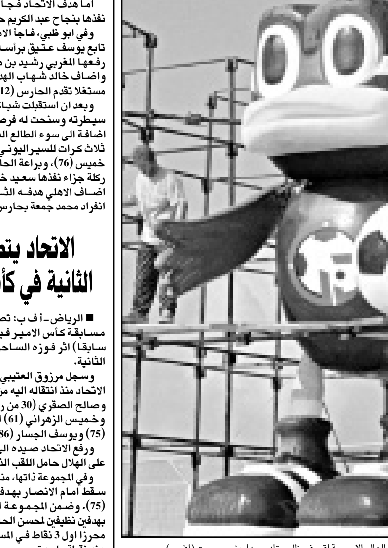
تمثال ضخم لتعبئة كأس العالم الآسيوية اقيم في ظل ستاد صيدا جنوب بيروت