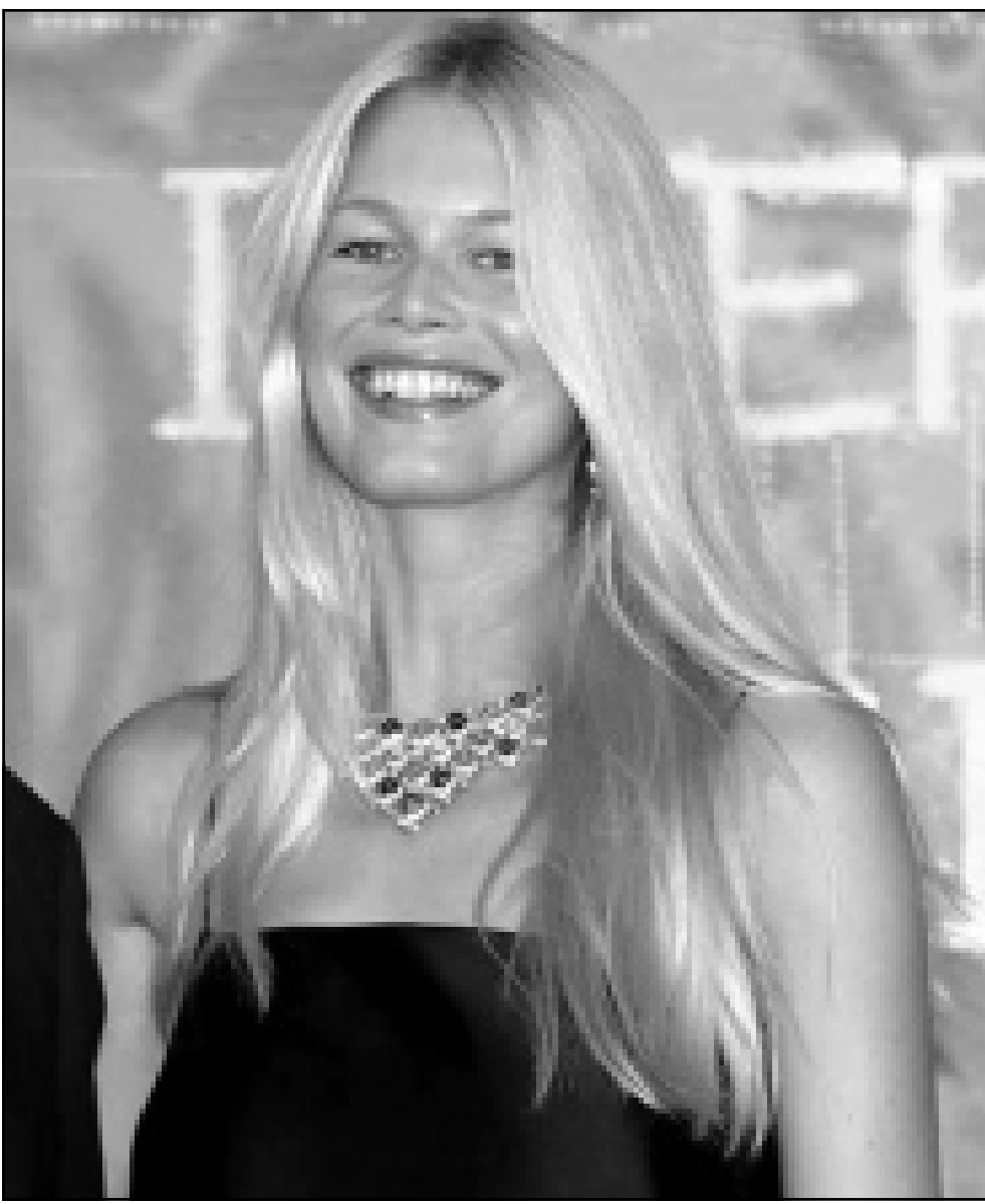
عازضة الأزياء العالمية كلوديا شيفر شاركت في تقديم الفيلم البريطاني «صوت» في مهرجان فينيسا السينمائي في إيطاليا أمس الأول

وكانت وزارة الأوقاف تسعى لازالة المسجد الذي تهدمت بعض اركانها الا ان وزارة الثقافة قامت بتسجيله كأثر وطابت بالحافه بسطها حتى تقوم بترميمه واعتماده كأثر اسلامي.