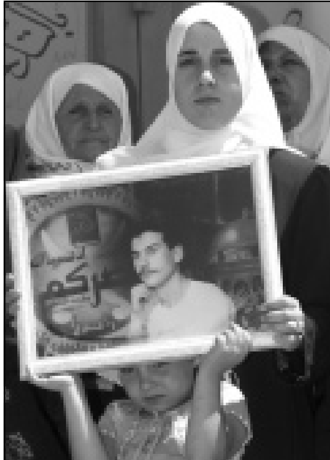
طلقة فلسطينية بصحبة والدتها تحمل صورة والدما العقل في السجن الاسرائيلية أثناء اعتقاله لحركتي حماس والجهاد في مدينة الخليل

غزة - من نضال المغربي: دعا زعيم لحركة المقاومة الاسلامية (حماس) الفلسطينيين امس الخميس الى استئناف الكفاح المسلح ضد اسرائيل من اجل استعادة القدس، كما نصح الرئيس الفلسطيني ياسر عرفات بالا يقبل السيادة الاسرائيلية على شبر واحد من القدس في محادثات السلام. ويعد مصير القدس العقبية الكبرى في طريق المحادثات الفلسطينية الاسرائيلية الرامية الى التوصل لتسوية سلمية نهائية. وقال محمود الزهار وهو احد أبرز زعماء حماس لرويترز ان الكفاح المسلح والانتفاضة بمشاركة جميع الفصائل الفلسطينية هما الحل لسلمة القدس. و اضاف ان الكفاح المسلح هو اللغة الوحيدة التي تفهمها اسرائيل فهو الذي اخرجهم من غزة ونابلس والخليل وهو نفس اللغجة التي اخرجتهم من جنوب لبنان. وكانت اسرائيل انتهت في ايار (مايو) الماضي احتلالا دام 22 عاما لجنوب لبنان بانسحاب سريع تحت ضغط متزايد من غزة وجماعة حزب الله الاسلامي. وقد ولدت حماس بعدما بدأ الفلسطينيون انتفاضهم في