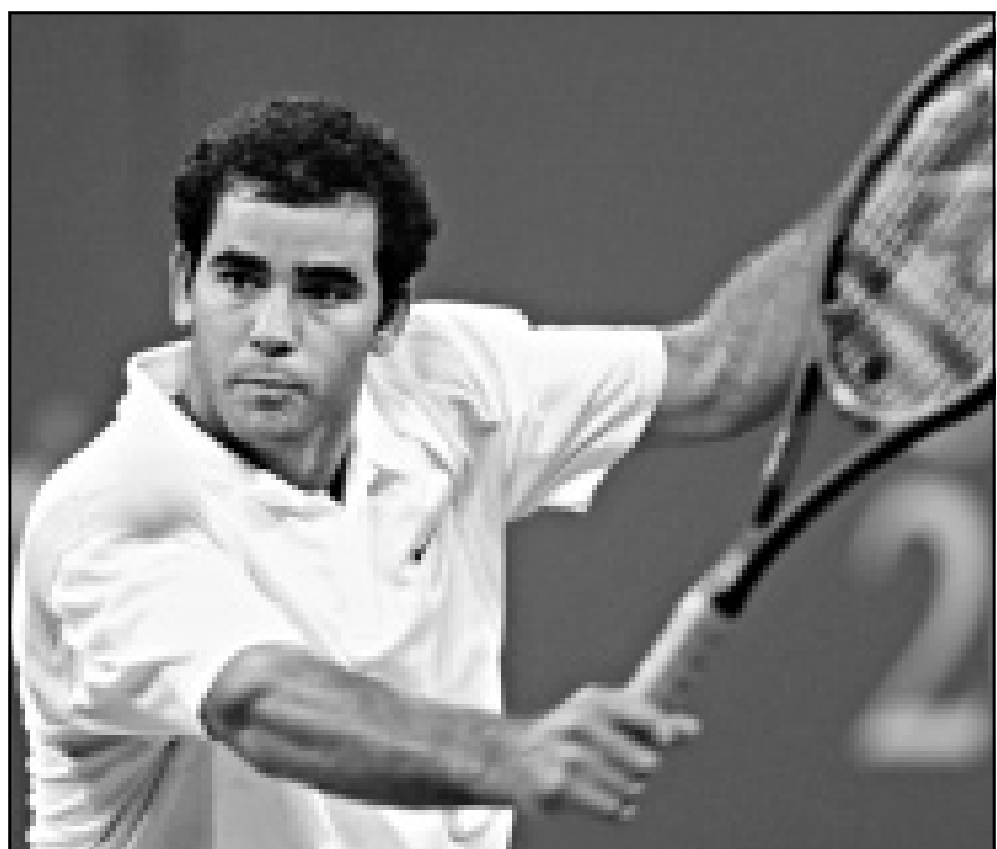
اللاعب الأمريكي بيت سامبراس

ستلقت ديفنبورت في نصف النهائي مع الروسية الينا ديميتيفا المصنفة 25 عالميا التي فازت على الالمانية انكه هوبر العاشرة 6-1 و3-6 وعان بامكان هوبر الفوز بالمباراة عندما ارتفع مستوى ادائها منذ بداية المجموعة الثانية وحتى منتصف الثالثة لكن التعب ادركها فانتزعت الروسية المبادرة وحسنت المباراة في مصحتها.