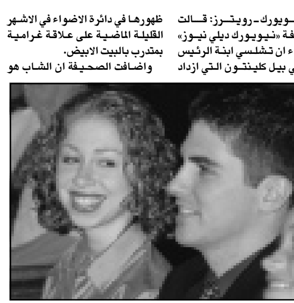
تشلسي ابنة كلينتون (الى اليسار) والى جوارها صديقها جيري كين

■ نيويورك - رويترز: قالت صحيفة «نيويورك ديلي نيوز» الاربعاء ان تشلسي ابنة الرئيس الامريكي بيل كلينتون التي ازادت ظهورها في دائرة الاضواء في الاشهر القليلة الماضية على علاقة غرامية بمدرب بالبيت الابيض.