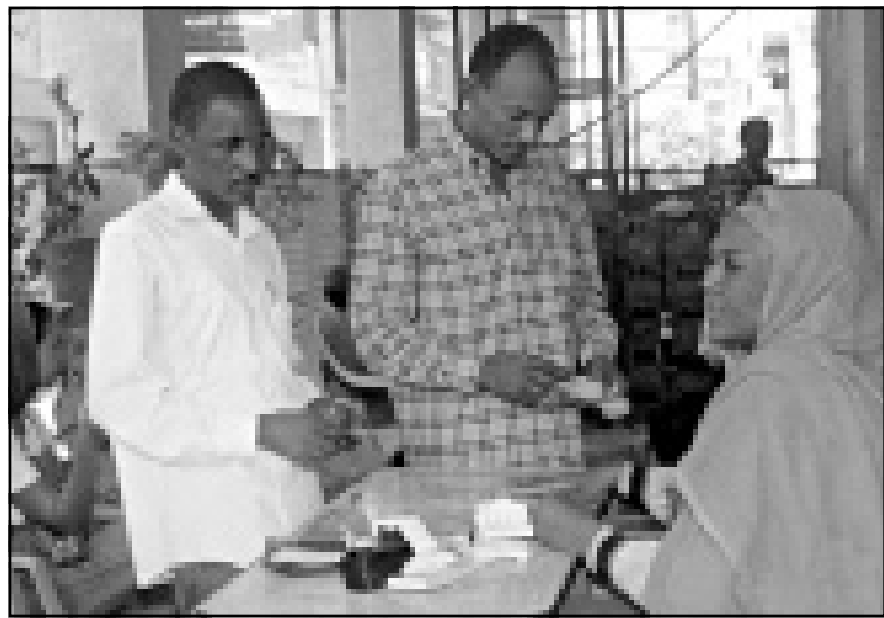
سيدة سودانية تواصل عملها في مفي في الخرطوم رغم الحظر الذي اصدرته الحكومة مؤخرا على عمل النساء في المهامي ومحطات الوقود (أ ب)

وقالت التقارير الصحافية بأن هناك تكهنات قوية حول احتمال عقد لقاء تاريخية على هامش القمة تجمع كلينتون مع رؤساء إيران وكوبا والسودان. ومن جهة أخرى قالت مصادر دبلوماسية سودانية بان الرئيس البشير التقي بمستشار الامن القومي الخرطوم وواشنطن حول قضايا الارهاب وحقوق الانسان وكذلك تناول اللقاء موضوع تحقيق السلام في جنوب السودان وخطوات تطبيع العلاقات بين البلدين. وأشارت المصادر ذاتها الى ان الدكتور مصطفى اسماعيل وزير الخارجية السوداني تباحث مع مساعدة وزير الخارجية الامريكية حول قضايا الديمقراطية والسلام في السودان. وكان الرئيس السوداني عمر البشير حسب قول المصادر قد التقى بالشيخ جابر احمد الصباح امير دولة الكويت الخرطوم احتفالاً بقدوم القائم بامر الرئيس البشير والرئيس الامريكي بيل كلينتون على هامش قمة الالفيه التي بدأت اعمالها خلال اليومين الماضيين، السودان ودولة الكويت.