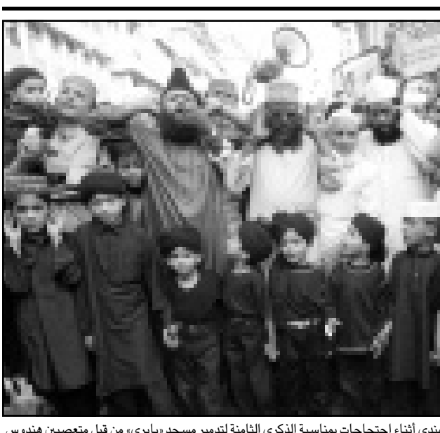
رجال مسلمون يصلون في الحي المسلم لمدينة بومباي الهندي اثناء احتجاجات بمناسبة الذكرى الثامنة لتدمير مسجد «بابري» من قبل متحمسين هندوس

هي حجم المفوضية الأوروبية بعد توسيع الاتحاد، وتتواجه الدول الصغيرة والكبيرة في هذا الشأن. إذ تطالب الاولى بحماية مبدأ مفوض لكل دولة بينما تدعو الدول الكبيرة لمفوضية مصغرة، وذلك باسم حماية فعاليتها. وقد استغرق مناقشة مسألة اصلاح المؤسسات حتى يوم انعقاد قمة نيس 325 ساعة. لكن وزير الخارجية الفرنسي هوبير فيديرين قال «لا يمكننا القول عند هذه المرحلة انه تمت تسوية اي موضوع». وتحاول فرنسا التي تتولي رئاسة الاتحاد الأوروبي حتى 31 كانون الاول (ديسمبر) ان تضع ملفات تعيرها اهمية خاصة في مقدمة لائحة الملفات التي ستناقش في قمة نيس، مثل الاعلان عن «ميثاق الحقوق الاساسية» والواقفة على تنفيذ وكالة صحية اوروبية والاعتراف والتقدم في مجال الامن