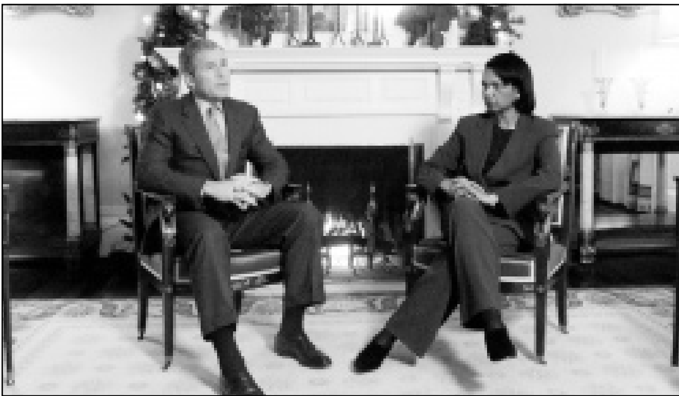
الجمهوري جورج بوش يتحدث في مقره في تكساس مع كوندوليزا رايس التي بنوي بوش تعيينها كمنسشرة الرئيس لشؤون الامن القومي

كلاارك (في منطقة سميثون ذات الـ15 الف صوت) وتيري حلاك (في منطقة مارتن ذات الـ10 الاف صوت) الغاء اوراق الاقتراع فسيكون غور الفائز في فلوريدا بفارق الالف الاصوات. وتعليقا على ذلك، قال ليشتمان ان الامر سيكون بمثابة «العلاج الاخير»، واعتبر ان فرص نجاح هذه الشكوى لن تتجاوز نسبة العشرة في المئة. وتوقع حصول «عاصفة سياسية عنيفة» في حال نجاحها لان غور يطالب منذ البداية باحترساب كل صوت.