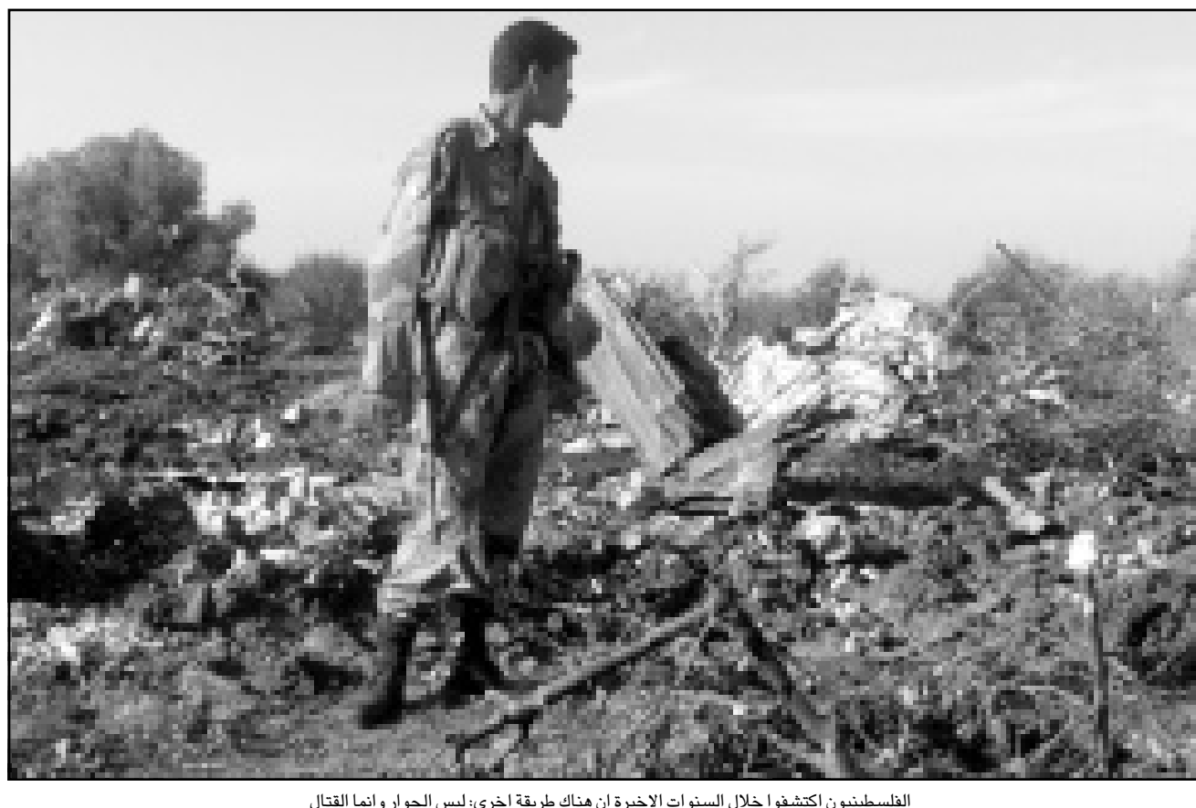
الفلسطينيون اكتشفوا خلال السنوات الاخرى ان هناك طريقة اخرى، ليس الحوار وإنما القتل (يديعوت احرونوت)، 2000/12/6

الاذلال والهانة حتى درجة اليأس. هذا الامر بدأ يفقد منطلقه حتى اقتصاديا، نتيجة للوضع الامني تقوم بخلق واقع نقل البضائع «ظهر لظهور» (شاحنة مع بضائع تصل الطرف الاسرائيلي وتنقل البضائع لشاحنة دخلت الى الجانب الفلسطيني) نتيجة لهذه العملية تبدي نحن احيانا الساذجة - واننا ننسب بالالم، نقل البضائع بهذه الصورة - مهما كانت نوعية الادارة - يؤدي الى اعطاب البضائع على الطريق وتدمير الزهراء وافساد اللحوم وما الى ذلك. نحن حددنا اهداف اوسلو، توقعنا المزيد من الامن على المدى القصير، فيما اعتبر الفلسطينيون انما عملية سيحصلون في نهايتها على الدولة، هذا هو فهم الطرفين لامر حسب وجهة نظري. حسب وجهة النظر الفلسطينية الوسيلة هي التفاوض والغاية هي الدولة، انهم اختاروا التفاوض كقرار استراتيجي، ان انه ليس الوسيلة الوحيدة في نظرهم. العملية من وجهة نظرهم كانت تسوية وتوقعوا من خلال الحوار الحصول على دولة قادرة على البقاء والوجود وفيها عنصر من العدالة، شروط التسوية التي كانت امام انظارهم كانت شرطين اثنين: انه لا توجد وسيلة فعيلة للتوصل للهدف، وان التسوية ستكون مشرفة، هذه الشروط كسرت، والفلسطينيون اكتشفوا خلال السنوات الاخرى ان هناك طريقة أخرى: ليس الحوار وانما العنف، هم تعلموا ذلك من حزب الله وتعلموا ذلك منا في كل مرة. اننا اننا نظرننا للامور من وجهة نظرهم هم لو وجدنا اننا قد اعطيناهم فقط عندما يكون المسدس منصوبا الى رؤوسنا، أو قفنا العملية السلمية الا اننا عذنا اليها في العادة تحت العنف وحده. العملية عرفت ونقلت في حالة جمود عميقة، وعندئذ اندلعت أحداث النفق في ايلول (سبتمبر) 1996 فركضوا الى واشنطن واعطيناهم الخليل، فما الذي يمكنهم ان يستنتجوه من ذلك؟ عموما المجتمع الفلسطيني يبدأ بشكل متزايد في