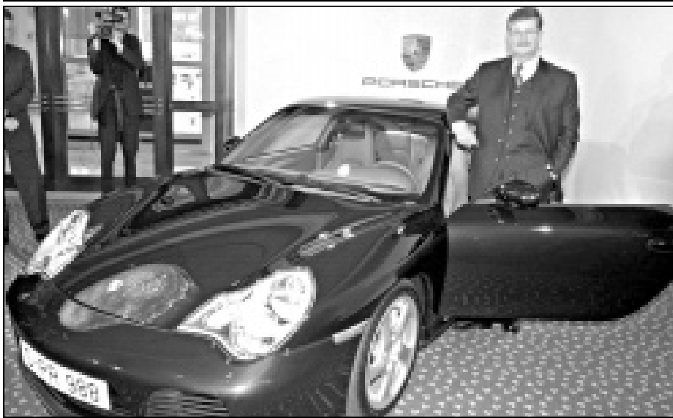
فندان فايدكنغ رئيس مجلس مراء بورش اللمانية يقدم امس في شتوتغارت نموذجا الجديد بورش 911 بعد اعلانه نتائج اعمال الشركة من العام الماضي

وسيكون غلوسر (41 عاما) اول امريكي يدير المؤسسة التي يرجع تاريخها الى 150 عاما والتي تعتبر من اقدم واكبر الشركات ذات الاسم الممتازة في البورصة البريطانية. وسيكون غلوسر ايضا ثاني رئيس غير بريطاني واول رئيس غير صحافي في تاريخ رويتزر. وغلوسر على دراية واسعة بالوسائل الاعلامية الجديدة المرتبطة بالانترنت من خلال عمله الحالي كرئيس لقطاع رويتزر للمعلومات، وهو قسم الاعلام الرئيسي الذي يحقق نحو نصف الإيرادات المجموعة ويشمل خدمات رويتزر المالية وخدمات الاسعار الفورية.