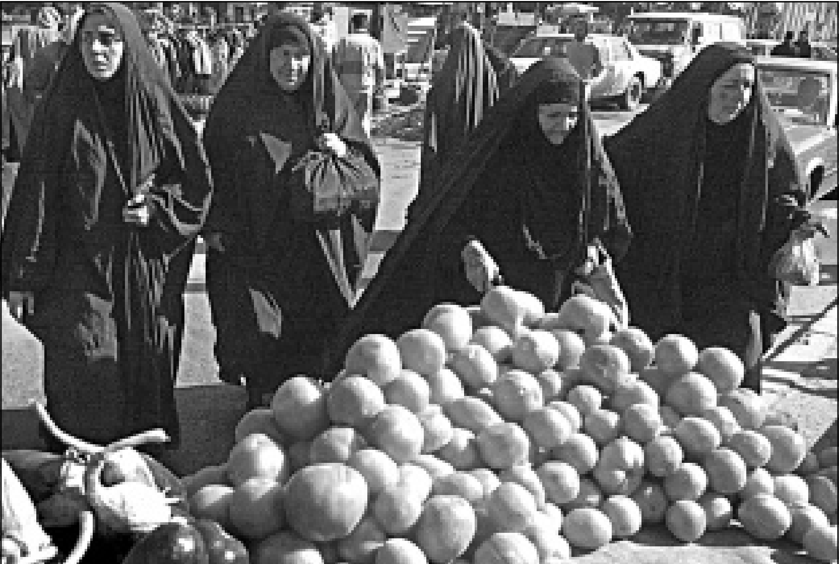
سيدات عراقيات في سوق للخضروات في بغداد امس

واكد ممثل العراق الدائم لدى الوكالة ان هذا الشرط يعني ربط مشاريع ذات طابع تقني انساني بالاعتبارات