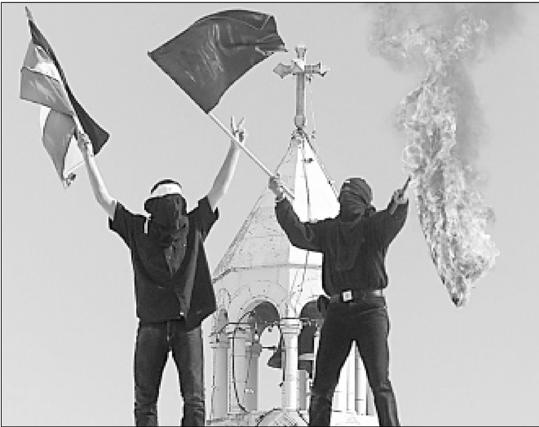
شباب فلسطينيان يحرقان العلم الاسرائيلي ويرفعان علم فلسطين امام كنيسة المهدي في بيت لحم بالضفة الغربية المحتلة