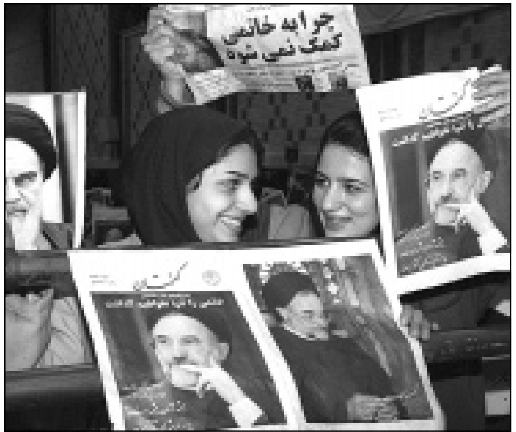
طالبان ايرانيان يحملان صور خاتمي اثناء القاته الخطاب في جامعة طهران امس