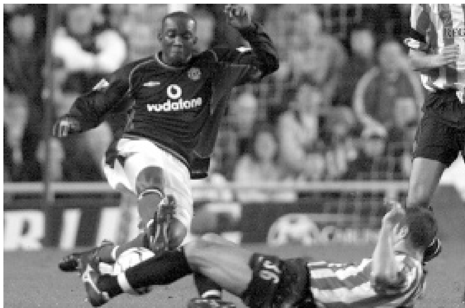
لقطة من إحدى مباريات مانشستر يونايتد الانكليزي

لندن - اف ب: احتفظ نادي مانشستر يونايتد الانكليزي للعام الثالث على التوالي بالمركز الاول في قائمة الاندية الاغنى في العالم التي تجريها شركة «ديلويت اند توش» للاحصاءات والمراقبة. وبلغ رصيد النادي الانكليزي 100.9 مليون استرليني (166.35 مليون دولار)، متقدما على بايرن ميونخ الالماني وريال مدريد الاسباني. وشهدت لائحة الاندية العشرة الاولى حضورا لافتا للاندية الانكليزية ان حجزت ثمانية منها مراكزها فيها. وهنا ترتيب الاندية العشرة الاوائل (الارقام عن موسم 98-99): 1 - مانشستر يونايتد الانكليزي 166.35 مليون دولار 2 - بايرن ميونخ الالماني 125.25 3 - ريال مدريد الاسباني 114.15 4 - تشلسي الانكليزي 88.65 5 - يوفنتوس الايطالي 87.75 6 - برشلونه الاسباني 81.15 7 - لاتسيو الايطالي 75.00 8 - انتر ميلان الايطالي 73.65 9 - ارسنال الانكليزي 72.9