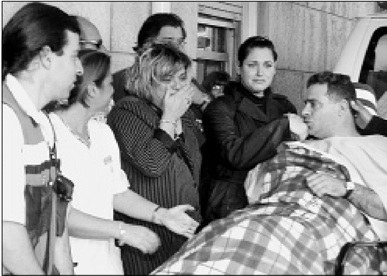
شلومو راتسباي لدى نقله للعلاج في مستشفى في اسرائيل

استمر وجود اسرائيليين في ظل الانتفاضة عبر أمن حقيقي ينتج سلسلة من الازدحامات، وعلى ان الإبقاء على العلاقات الطبيعية مع اسرائيل في ظل ما يجري مجازفة فعلية في الحسابات الداخلية. وحادث الدوار الساع في عمان الغربية مساء الثلاثاء هو الثاني من نوعه خلال اسبوعين والثامن خلال ست سنوات، والاهم ان بعض المفاجآت الفنية حصلت خلاله هذه المرة، فمطلق النار على الدبلوماسي الاسرائيلي اظهروا قدرا من الاحتراف وسط شارع مزدحم في منطقة محروسة جيدا بصورة أمنية.