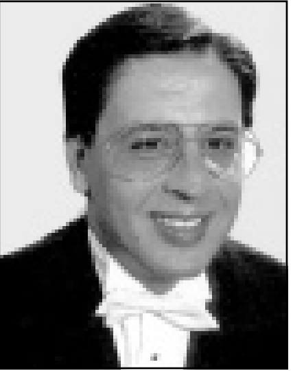
توري كوفي أحد نجوم الطرب الأندلسي الجزائري

من جهة أخرى، تظهر من حين لآخر قناعات مفادها أن بعض تجار اللحوم «الحلال» يشتهرون بضاعتهم من مستودع «رانجيس» في الضاحية الجنوبية الغربية لباريس، ولا يبالون إن كانت فعلاً مذبوحة على الطريقة الإسلامية أم لا.