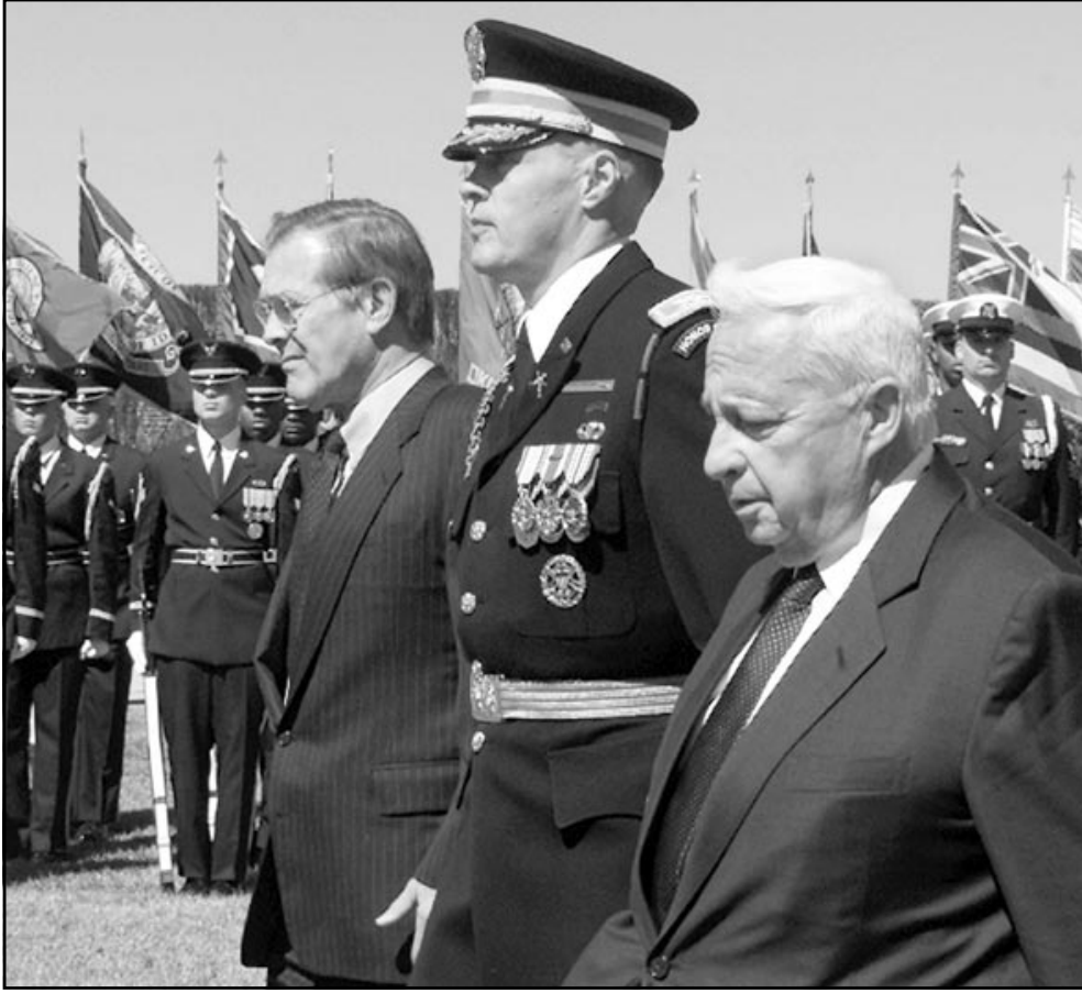
وزير الدفاع الأمريكي دونالد رامسفيلد يستقبل شارون لدى وصوله البنتاغون

عندما يدور الحديث عن اعادة بناء التحالف بين دول المنطقة ضد العراق لا يكون المفتاح بيد اسرائيل والولايات المتحدة على الاطلاق، هذه الدولة التي تحصل على الاقتراح المنهل من حيث الحجم الذي قدمه باراك، وساعدت صدام بذلك لرفع عقبرته والاقتراب جدا من السدة على ان تلتاح سلاح نووي. فهل من الغريب والحالة هذه ان تفرغ صور صدام وراياته في مناطق