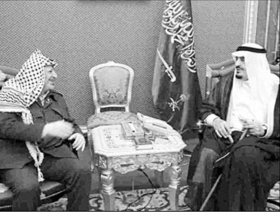
الملك فهد مستقبلاً الرئيس الفلسطيني أمس