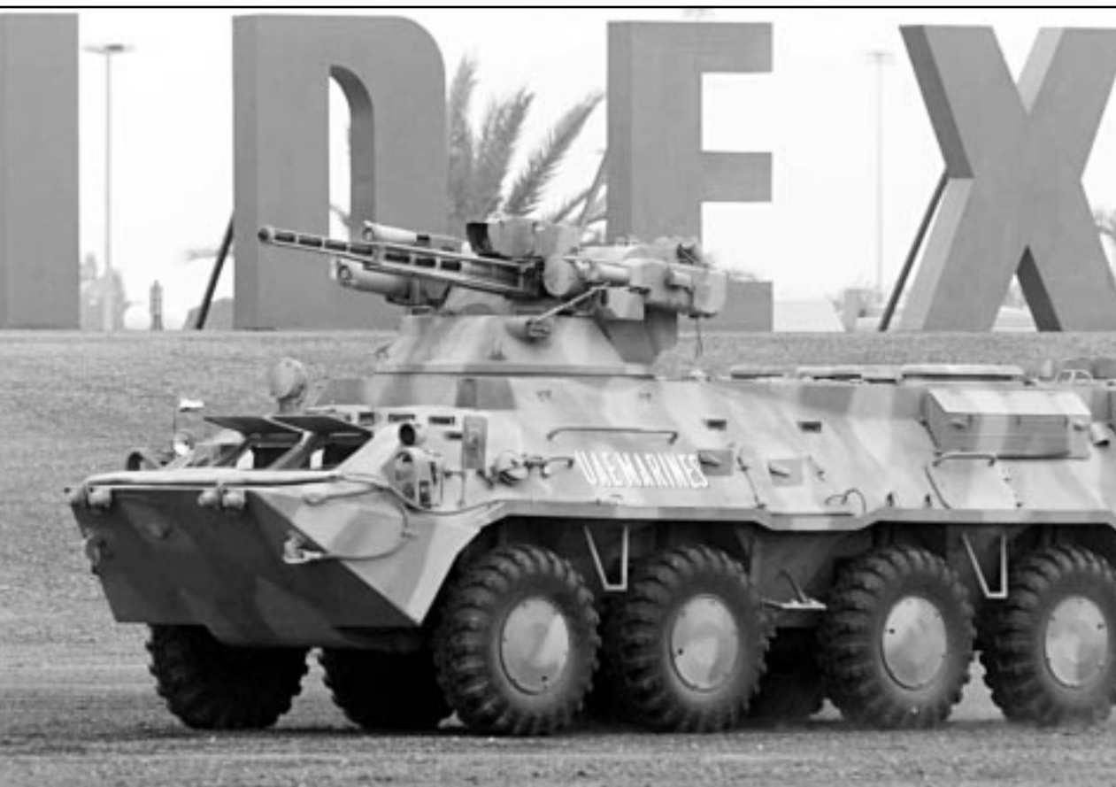
مدرة اوكرائية من طراز BTR-3U ضمن المعروضات في معرض ايديكس العسكري في ابو ظبي

ووجهت الولايات المتحدة اتهامات لابن لادن فيما يتصل بتفجيرين استهدفا السفارتين الأمريكيتين في نيروبي ودار السلام في عام 1998، ويعيش بن لادن وهو سعودي المولد في