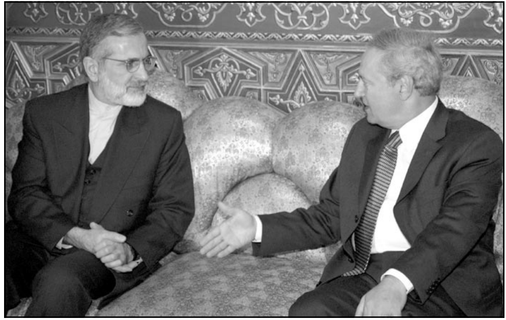
وزير الخارجية السوري فاروق الشرع لدى اجتماعه مع نظيره الإيراني كمال خرازي

الاسد الوزير خرازي الذي يزور دمشق بعد قيامه بزيارة الى بيروت التقى خلالها الرئيس اللبناني إميل لحود، ومن جهة أخرى قال وزير الخارجية الإيراني إسماعيل إمامي في مقابلة مع صحيفة «الشرق الأوسط» في عمان مؤقفا حاسما وموحدا تجاه هذه الحالة يقوم بدعم الانتفاضة... ولفت خرازي في ان «دول المنطقة تنظر بتأييد الى التهديدات الإسرائيلية، فهي (إسرائيل) مصدر كل خطر، واعتبر ان «أخذ المواقف والتنسيق بين الدول ودعم المقاومة الفلسطينية يعتبر اهم استراتيجية واهم سياسة لمواجهة هذه الحالة»... ومن جهته أكد وزير الخارجية السوري فاروق الشرع الذي استقبل خرازي في مطار دمشق الدولي «نحن دائما نشعنا بالري في مع الاشقاء الإيرانيين حول مواضيع تهم البلدين والمنطقة ويأتي في مقدمة هذه الاهتمامات الصراع العربي الإسرائيلي، ومضيفة فلسطين، وبهذا الصدد موافقا على خرازي خلال مؤتمر صحافي عقده في مطار بيروت قبيل توجهه الى دمشق في ختام زيارة رسمية للبنان واستمرت يوما واحدا «بالتنسبة