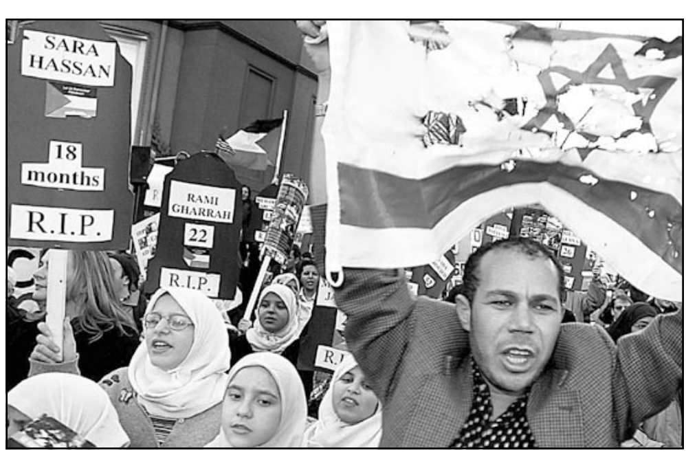
مسلمو امريكا يحرقون العلم الاسرائيلي امام البيت الابيض احتجاجا على استقبال رئيس الوزراء الاسرائيلي ارييل شارون