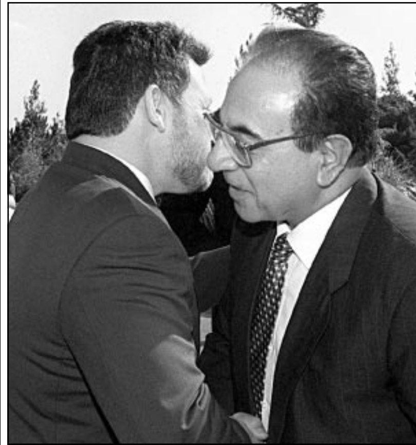
وزير الخارجية الكويتي الشيخ صباح الاحمد لم وزير الخارجية العراقي محمد سعيد الصحافي يلتقيان الملك عبد الله في عمان امس (رويتز)

الدوحة - «القدس العربي» - من مازن حماد: اطلق أمير قطر والبحرين آمالا كبيرة نحو تعاون مشترك في مشروعات عملاقة وتقارب سياسي واقتصادي يصل الى الوحدة، وقد ركزت جلسة المباحثات بين الشيخ حمد بن خليفة آل ثاني أمير دولة قطر، والشيخ حمد بن عيسى بن سلمان آل خليفة أمير دولة البحرين التي عقدت في الديوان الاميري القطري على دعم وتطوير اواصر التعاون الاخرى القائم بين البلدين الشقيقين عقب انتهاء الخلاف الحدودي بينهما. واكدت المباحثات التي حضرها وزراء ومسؤولون عن البنى التحتية للمشاريع على تفعيل كل ما من شأنه زيادة التعاون الثنائي، ولا سيما اللجنة العليا المشتركة التي تم تجميع اعمالها من جانب البحرين في ايار (مايو) الماضي وقبل بدء المفاوضات الشفوية بين البلدين. واكدت جلسة المباحثات على اهمية إعادة تفعيل اعمال هذه اللجنة التي يرأسها ولي العهد في البحرين، وذلك لتحقيق طموحات وتلبية رغبات قيادتي البلدين وشعبيهما الشقيقين. وقال أمير دولة البحرين الشيخ حمد بن عيسى في تصريحات للصحافيين عقب وصوله الى مطار الدوحة في زيارة قصيرة وصفها انها لتنهئة اخيه أمير قطر بانتهاء الخلاف «لقد جئنا الى الدوحة لنلتقي بأخي العزيز أمير دولة قطر، لنتمشى معا بعزيمة مشتركة نحو تعميق روح الأسرة الواحدة بين الشعبين الشقيقين بما يعود بالخير والنفع عليهما على سائر شعوبنا الخليجية، ويفتح امامها افقا واسعة في تعزيز التواصل والتعاون والبناء الراسخ، وأكد أمير البحرين ان لقاءه بالقيادة القطرية بعد صدور