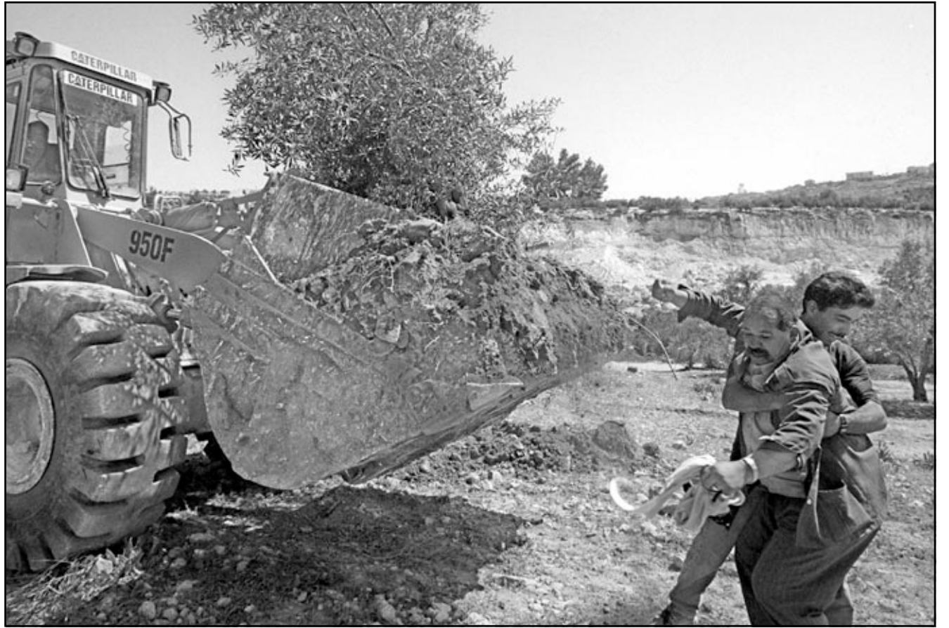
جرافات اسرائيلية تقطع اشجاراً من الزيتون وصاحبها يحاول منعها

نابلس - أ ف ب: اندت موجة جديدة من أعمال العنف التي اصابها اربعة اشخاص بجروح امس الثلاثاء في الضفة الغربية في حوادث متفرقة، وهم ثلاثة فلسطينيين، بينهم طفل في الـ13 من العمر اصيب بيد مستوطن،