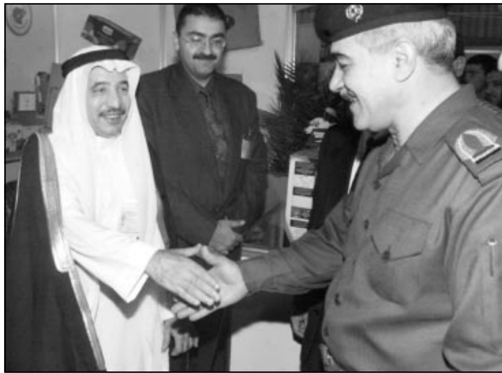
وزير التجارة العراقي محمد مهدي صالح يصافح رجل الاعمال السعودي ابراهيم السليمان الذي تشارك شركته في معرض بغداد

بغداد - اف ب: افتتح في بغداد امس الثلاثاء المعرض السعودي للصناعات الغذائية بمشاركة 12 دولة عربية واجنبية وشركات سعودية وبريطانية. وصرح وزير التجارة العراقي محمد مهدي صالح ان «مستوى المشاركة العربية واسع» مشيرا الى حضور شركات من لبنان وسورية ومصر والسعودية وتونس والامارات. وقال صالح «نرحب بالشركات السعودية المشاركة وتجارنا مع العمل مفتوح امام جميع الاخوة المنتجين والمضربين السعوديين»، وأكد صالح انه «لا توجد اي عوائق على الاستيراد من السعودية وكل دول الخليج العربي وكما لا توجد اي عوائق على الاستيراد من الدول العربية الاخرى»، وأضاف ان «هناك شركات بريطانية مشاركة في هذا العرض»، موضحا ان «اي شخص ياتي الى بلدنا نرحب به والعراق لا يقاطع الشركات البريطانية او الشعب البريطاني وليس ضد الشركات الامريكية او الشعب الامريكي ولكن ضد سياسة حكوماتهم العابدة له». وقال الامين العام للاتحاد العربي للبنوك الاردنية فلاح سعيد جبر ان المعرض يضم 93 شركة تمثل كبريات الشركات الغذائية في سورية والاردن ولبنان وتونس ومصر والعراق وفرنسا وايطاليا وهولندا وايطاليا وتركيا واريتريا. على صعيد آخر أعلن مسؤول في