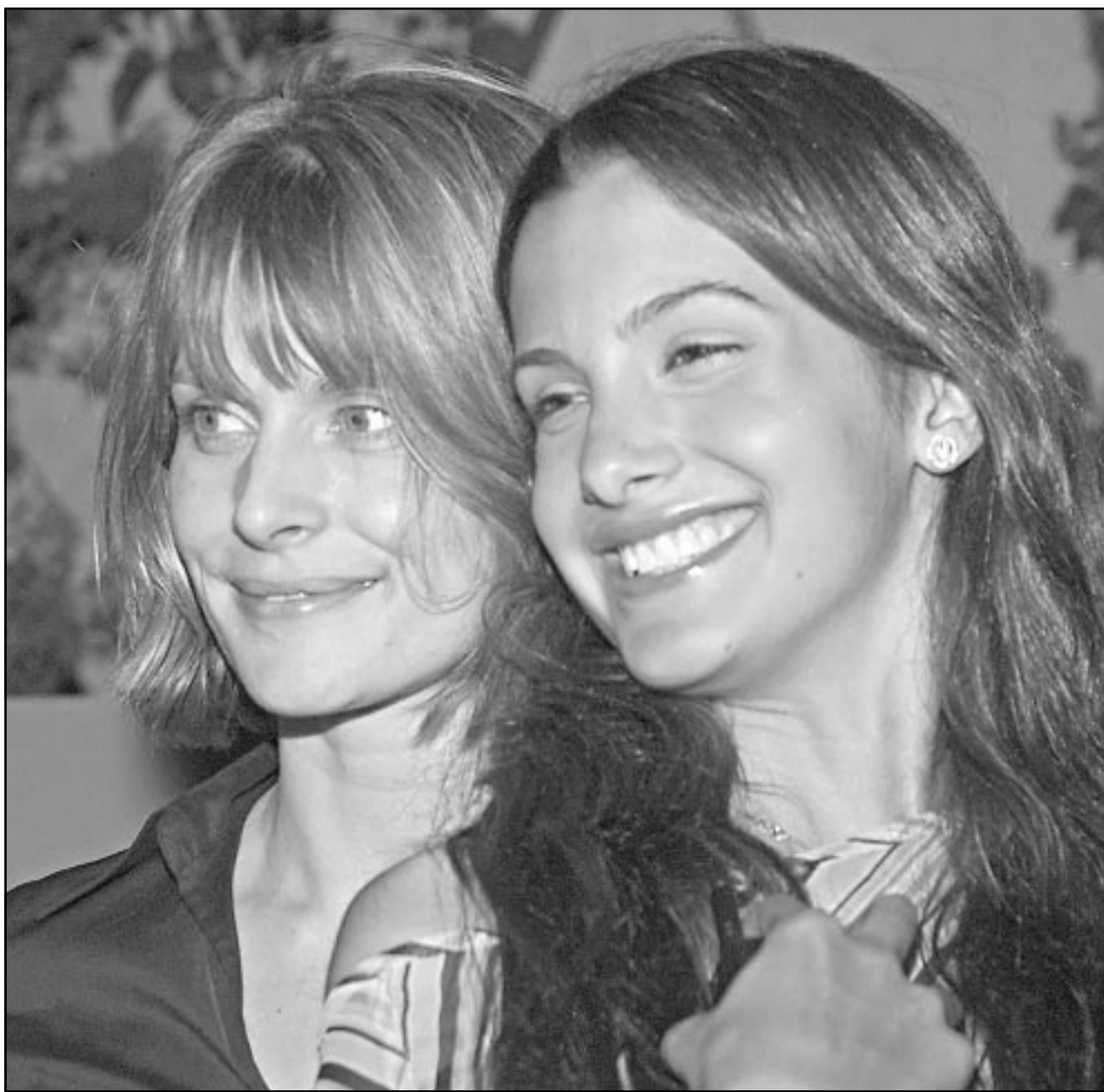
الفنانة ناستاسيا كينسكي (يمين الصورة) وابنتها صوفي في لحظة أثناء الحفل الذي اقامه نجوم هوليوود دعماً لرابطة الاعلاميين المؤيدين للبيئة التي تأسست أخيراً للاهتمام بالحفاظ على البيئة (رويتز)

تبلغ ستة الاف جنيهه (حوالي 1500 دولار)، وقال في رد مباشر على رفض الرقابة للفيلم الفرنسي «لم تكن واضحين عن السيناريو وكنا على استعداد لخوض حوار مع المنتجين من اجل تغيير الاسماء التي حملها بدلا من ان يتقلوا الى المغرب من قيامهم بإباحتها» تشيرش الى ان التصوير نفذ في مصر. ورأى ان «مفتاح الخروج من الازمة يكمن في اطار شركة مدينة الانتاج الاعلامي التابعة لاتحاد الاداعة والفنون التي تحولت الى منطقة حرة لا يحق للرقابة والجمارك ونقابة الفنانين التدخل فيها»، ودعا المزيد الى اصدار القوانين الخاصة لاستثمار علاقاتها في جلب المزيد من الشركات الاجنبية للتصوير في مصر، وكانت الصحافة المصرية شنت حملة على الرقابة والقوانين التي تحد من حرية التصوير مشيرة الى التجربة المغربية والتونسية، خصوصا بعد حصول فيلم «الريز الانكليزي» الذي صور في تونس، في حين تدور احداثه في مصر، على العديد من الجوائز العالمية. (أ ف ب)