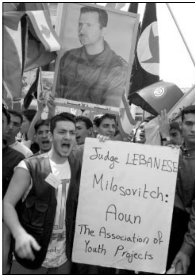
طلاب لبنانيون يظهرون دعما لسورية وضد عون (أ ف ب)

بيروت - أ ف ب: نفذت منظمات طلابية لبنانية وتنظيمات موالية لسورية الثلاثاء اعتصامات في بيروت ومناطق لبنانية أخرى استنكارا للمجزرة التي نفذها في 14 آذار (مارس) عام 1989 العماد ميشال عون المناهض لسورية والمطالب بخروج قواتها من لبنان وتأكيدا على شرعية الوجود السوري كما أفاد مراسلو فرانس برس. ففي بيروت شارك نحو 1500 شخص في اعتصام جرى في ساحة الأونيسكو حيث لقي عشرات من طلاب المدارس مصرعهم عام 1989 في القصف المدفعي التحريبي من الاحتلال السوري، ورفع المعتصمون اعلام حركة أمل الشيوعية التي يتزعمها رئيس مجلس النواب نبيه بري واعلام حزب الله الشعبي واعلام الحزب السوري القومي الاجتماعي ومنظمة حزب البعث العربي الاشتراكي الحاكم في سورية واعلام جمعية المشاريع الإسلامية الخيرية (سنية). ولوح المعتصمون بالاعلام اللبنانية السورية ويهرفون صور «ضحايا الجزرة» التي وقعت في المنان وقد كتب عنها «هذا هو السيادة التي يتكلم بالموضوع»، وتقيم ايران علاقات جيدة جدا مع سورية وقد قام الرئيس الاسد بزيارة الى طهران في كانون الثاني (يناير) الماضي، وقد اقتنع البلدان في 10 آذار (مارس) اول خط قطار بينهما مروراً بتركيا، وتدعم ايران وسورية حزب الله الشيعي اللبناني راس الحربة لمقاومة الاحتلال الإسرائيلي في جنوب لبنان.