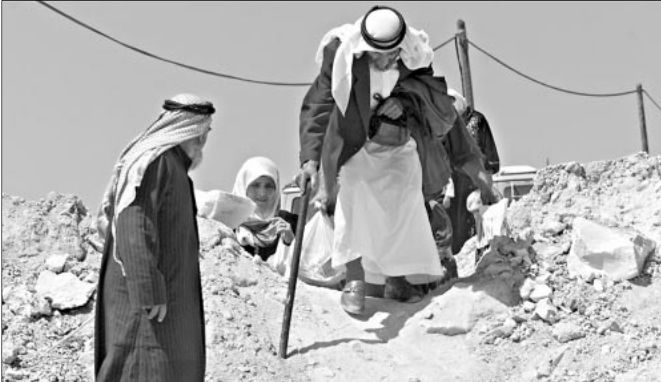
شيخ من تقوع الفلسطينية يدخل قريته عبر طريق ترابي بعد محاصرة اسرائيل للمنطقة

الاسبوع المقبل لتأكيد دعمهم للفلسطينيين. وهي تأتي بعد اعلان وزير خارجيته كولن باول بان القدس «عاصمة اسرائيل»، لكنه تراجع عنه في وقت لاحق، وكان باول استقبل بعاصفة من التصفيق خلال مؤتمر نظمه الاثنى عشر جمعية مؤيدة لاسرائيل في واشنطن على تصريحاته هذه، والتي جوبهت بموجة من الاحتجاجات في العالم العربي. فقد اشاد تيم ووليفنجر رئيس جمعية «اميركان اسرائيل بابلك افيرز كوميتي» بوزير الخارجية الامريكاني الذي كان على المنصة، على تصريحاته بشأن القدس. وقال بوش ان الولايات المتحدة لن «تحاول ان تفرض سلاما» في الشرق الاوسط، وازدادت التصريحات بعد الاجتماع في البيت الابيض «البلغته ان امتنا لن تحاول ان تفرض سلاما، سنستمر تحقيق السلام، سنعمل مع العنيتين بالتوصل لسلام». ويبدو ان تصريح بوش يعزز تحولا كبيرا عن سياسة الرئيس السابق بيل كلينتون الذي شاركت ادارته بقوة في مساعي الوساطة بين اسرائيل والفلسطينيين للتوصل لاتفاق سلام. ومن شأن تصريحات بوش حول السفارة ان تثير غضب الزعماء العرب الذين سيجتمعون في عمان