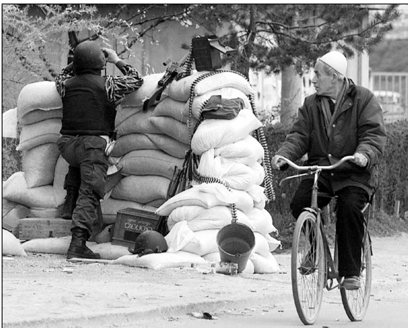
جندي مقدوني يراقب موقعا للثوار في تيتوفو

■ تيتوفو - جنيف - بروكسل - ا ف ب: استؤنفت المارك امس حول مدينة تيتوفو في شمال غرب مقدونيا بين القوات الحكومية والمتمردين الالبان. وصفت القوات المقدونية اربعة منازل تقع على مرتفعات تيتوفو ما ادلى الى اشتعال النار فيها. وتعتبر مدينة تيتوفو (130 الف نسمة) ثاني مدينة في البلاد من حيث عدد السكان وتقع على بعد اربعين كلم غربي سكوبيي وغالبية سكانها من اصل الباني. كما سمع اطلاق نار قرب قرية درينوفا على بعد بضعة كيلومترات من وسط تيتوفو. وازادت مصادر في الشرطة ان القوات الحكومية سيطرت على مواقع لمقاتلي جيش التحرير الوطني لالبان مقدونيا. واعلن المتحدث باسم الجيش المقدوني بلاغويا ماركوفسكي لوكالة «فرانس برس» ان الدبابات التي ارسلت الى تيتوفو على سبيل الدعم لم تتدخل بالمرار بعد. وكانت قافلة تتألف من دبابات وآليات مدرعة واخرى لكيلومترات الى تيتوفو وتوجهت فور وصولها الى ثكنة المدينة. وارسلت قوات تابعة للجيش الى تيتوفو لمساندة قوات الشرطة التي تشتبك منذ الاربعة عشر من آذار (مارس) الجاري مع المتمردين الالبان وتسعى الى اخراجهم من مرتفعات تيتوفو. وعرفت المنطقة هدوءا نسبيا ليلة الاثنين الثلاثاء وسجل سقوط قذائف مدفعية بشكل متقطع. ويسرى منع تجول في تيتوفو من الساعة 18,00 تخ الى الساعة الخامسة تغ صباحا. وجالت في المدينة ليلاد دوريات ضمت نقاتل جند مجهزة برشاشات ثقيلة. من جهة اخرى اشاد وزير الخارجية الالباني