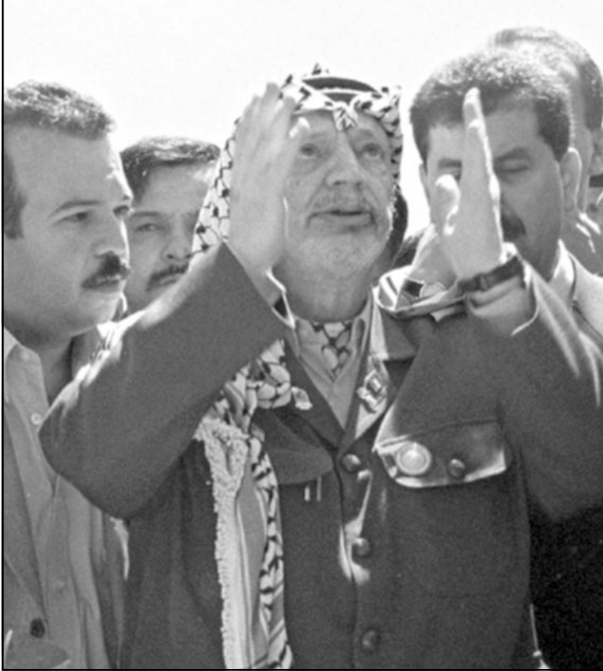
عرفات يصلي اثناء زيارته لقاعدة قوات ال17 في غزة التي تعرضت لضرب جوي اسرائيلي دمير.

ولى وانه لن يترك الامور تخرج عن نطاق السيطرة، مناطق (1) من اجل ضرب البيوت المستخدمة لاطلاق المهاجمة اصلا في الشرق الاوسط. الاردن ومصر يخشيان من ان يتسبب استمرار الواجهات الى الهجان في اوساط الفلسطينيين على اراضيها الامر الذي قد يزعزع الحكم خصوصا في عمان.