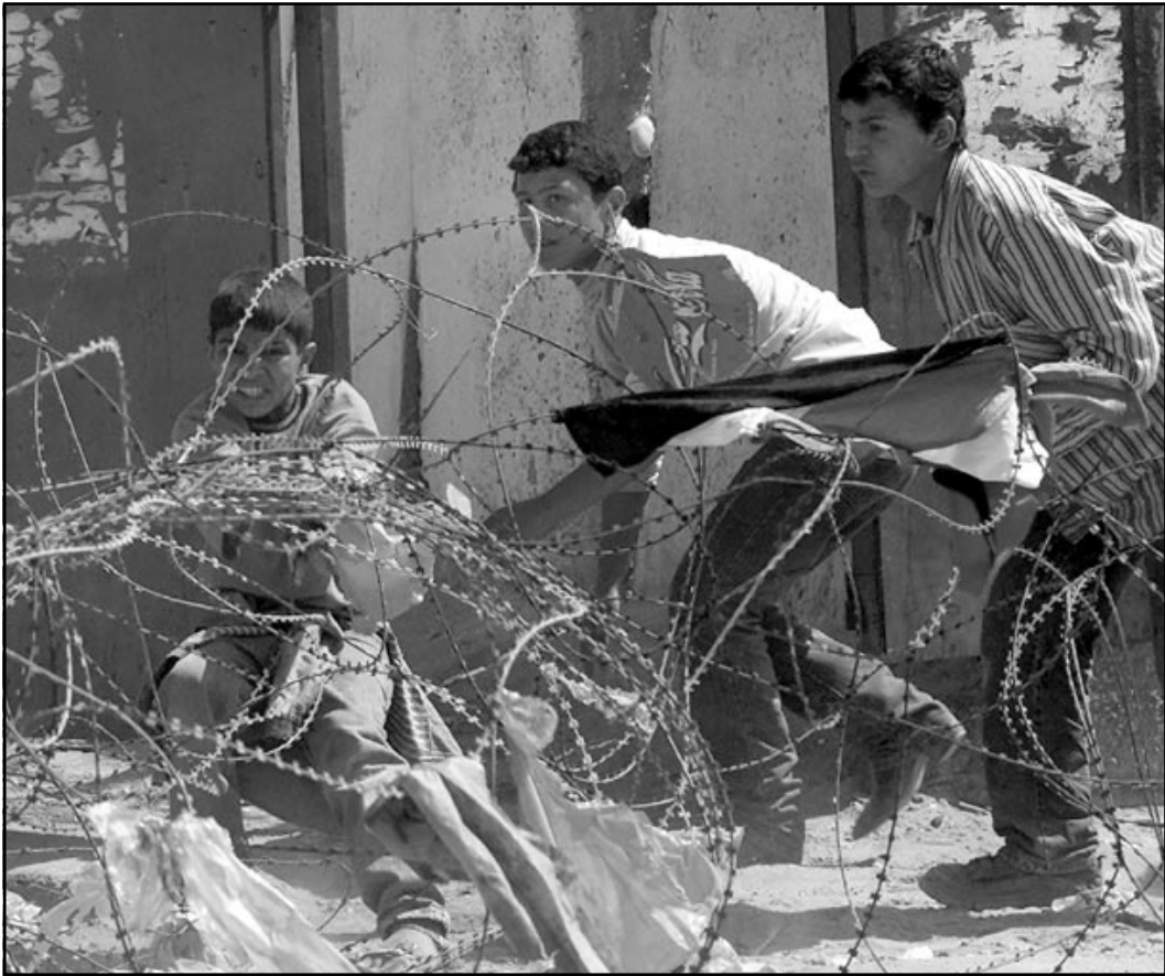
شبان فلسطينيون يحتمون بالاسلاك الشائكة اثناء مواجهات مع الجيش الاسرائيلي قرب غزة

وما ان تلفظ اهارو نيشكي بعبارة «يوم الارض» حتى قطعته رحبجام زيئفي قالا: «ما هذا يوم الارض؟»، المقتش العام اوضح له ان هذه هي التسمية السائدة، الا ان زيئفي لم يقنع. لاحقا اوضح شارون انه لا يقصد في اقواله التي تلفظ بها ان يتحمل اطلاق اي شعار.