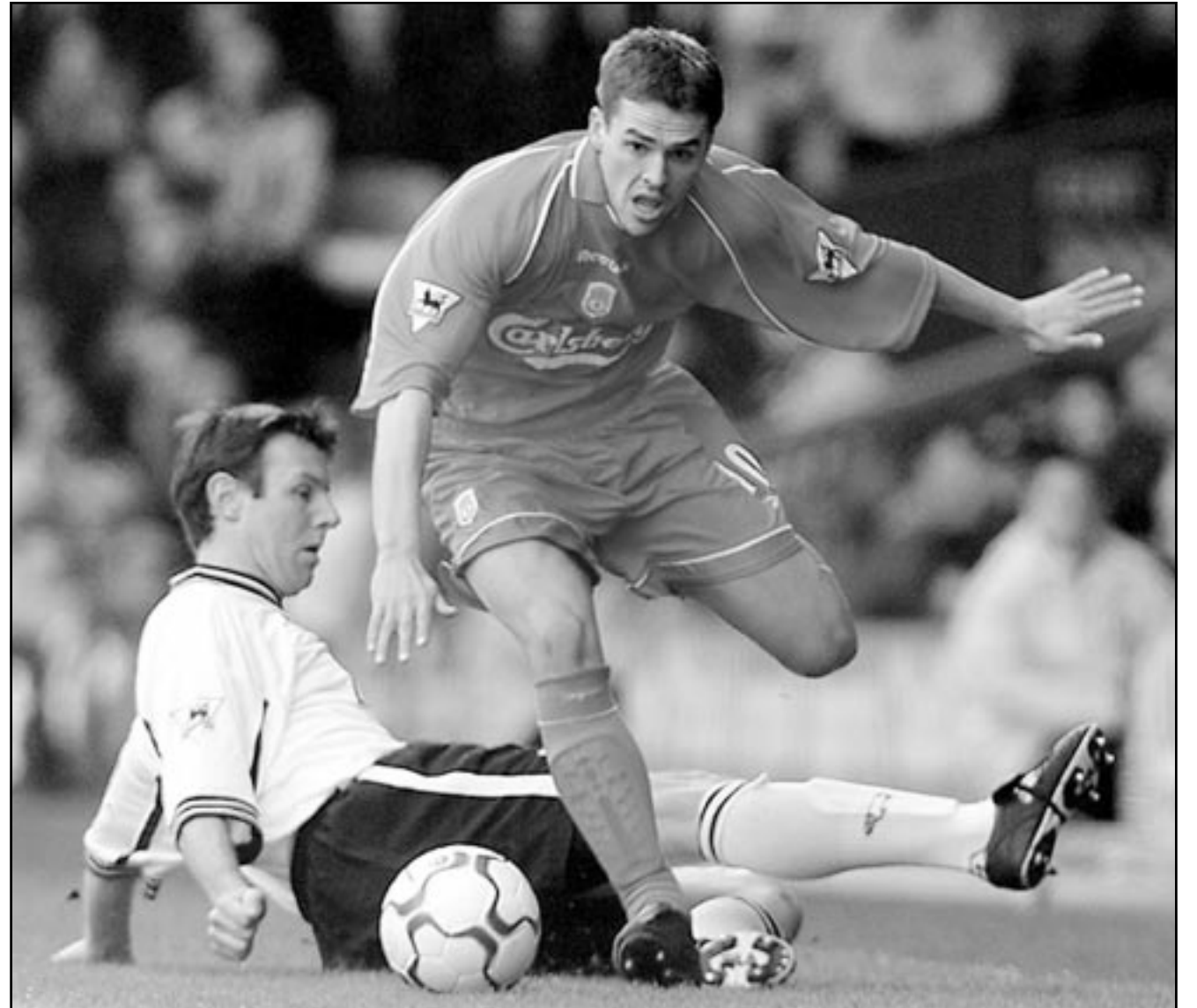
لقطة من إحدى مباريات ليفربول (صورة من الأرشيف)