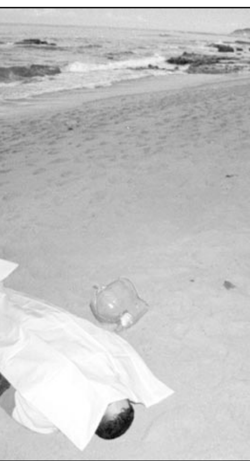
جثة اخرى لمهاجر مغربي لغقتها مياه البحر الابيض المتوسط بالشواطئ الاسبانية قبل ثلاثة ايام (اف ب)

وكان عبد الرحمن اليوسفي يتحدث الخميس امام المؤتمر الوطني السادس للاتحاد الاشتراكي للولايات الشعبية الذي يعقد في الدار البيضاء تحت شعار من اجل مغرب ديمقراطي ومتضامن.