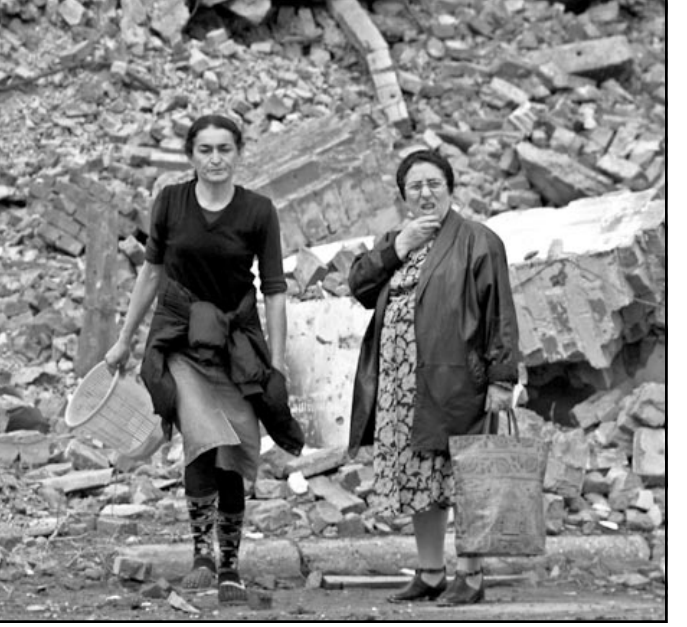
سيداتان شيشانيتان تسيان وسط الدمار الذي خلفته القوات الروسية في غروزني

لكن الخبراء يؤكدون ان كل الدلائل تشير الى ان هذه القوات المؤلفة اساسا من الجندين، غير معدة للقيام بالمهام التي كلفها بها الحكم خلال السنوات الماضية. ويقول الكسندر غولتزر الخبير العسكري في صحيفة ايتوغي ان «الجيش الروسي وراث المبدأ السوفييتي الذي يعتمد على العدد والذي يقوم على اساس انه من غير المهم الا يتمكن الجندي او الدبابية سوى من اطلاق طلقة واحدة قبل سقوطها او تعطيلها». ويضيف ان هذه المسألة اثبتت تقادها خلال حرب الشيشان الاولى (1994-1996) حيث خسرت القوات الروسية اعدادا كبيرة من الجنود في الهجوم على غروزني.