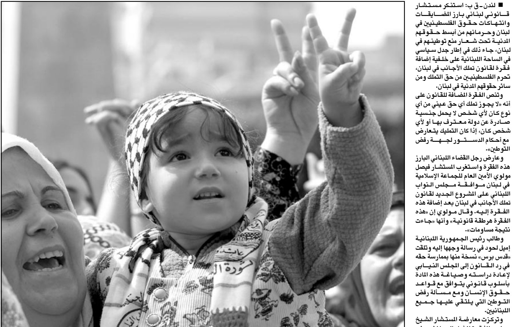
فلسطينية وطفلتها ترفعان شارة النصر خلال اعتصام امام مقر الامم المتحدة في بيروت احياء ليوم الارض