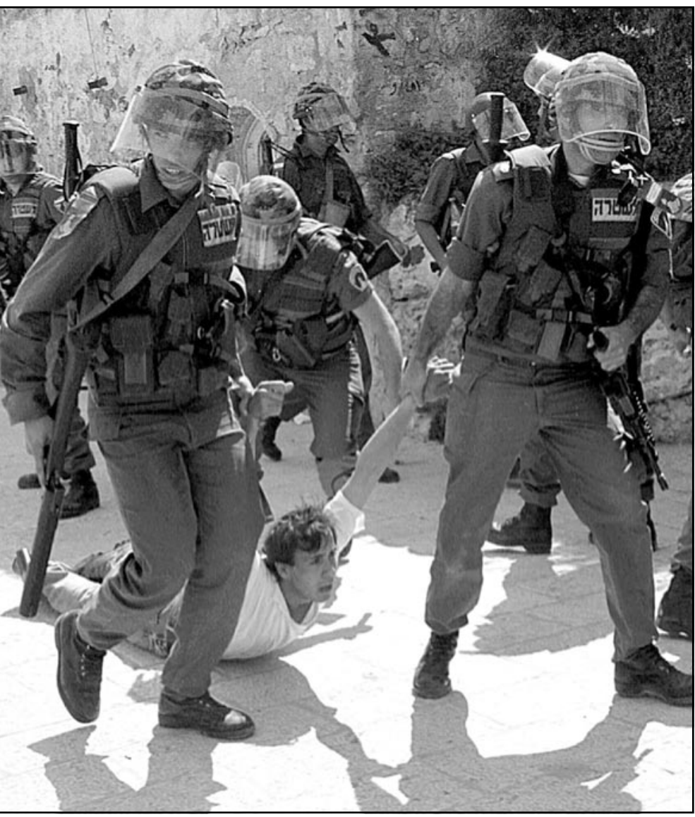
جنود اسرائيليون يجرون فلسطينيا اثر المواجهات في مدينة القدس الجمعة (رويترز)