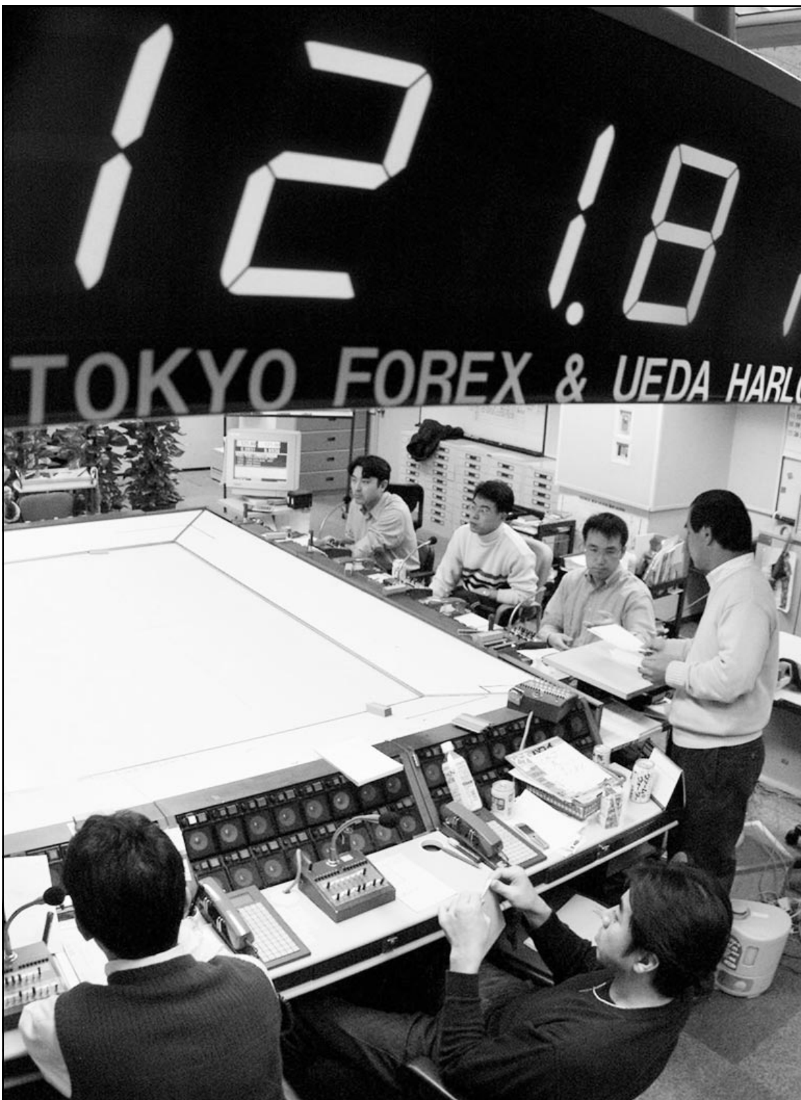
متعاملون في سوق العملة في طوكيو تمت لوحة الالكترونية سَجَل عليها سعر الدولار في المعاملات الصباحية يوم الجمعة قبل ان يرتفع للحفا الى 125 ينا

ويتألف نحو 93 في المئة من صادرات اللحوم الهندية من لحوم الجاموس الجمعد. وقال الانا «قررت السلطات المصرية مراجعة بروتوكولاتها واتفاقاتها القائمة المتعلقة باستيراد الماشية ومنتجاتها. واعلنت مصر تعليقا مؤقتا لاصدار تراخيص الاستيراد لمدة شهر».