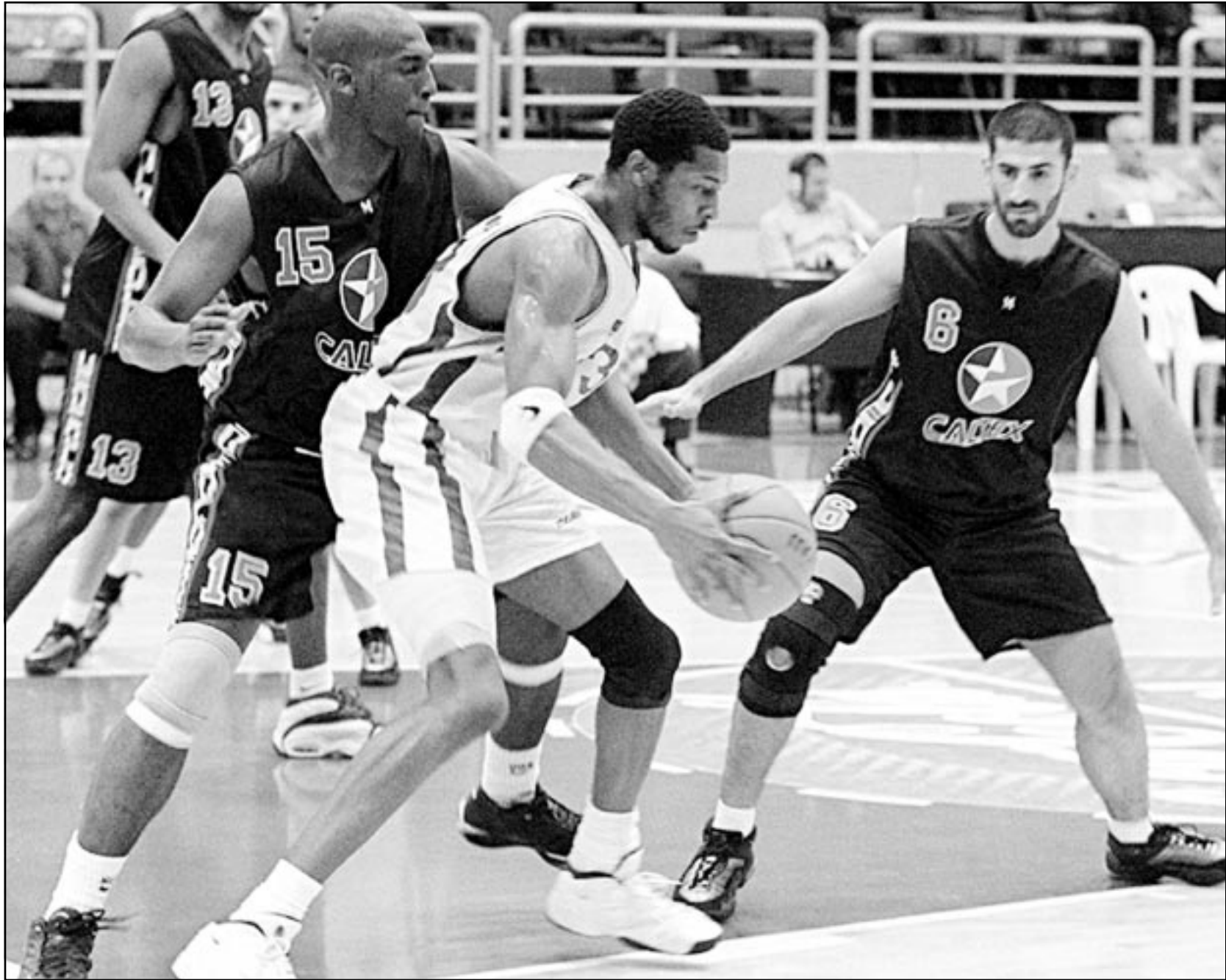
لقطة من إحدى مباريات منتخب لبنان لكرة السلة