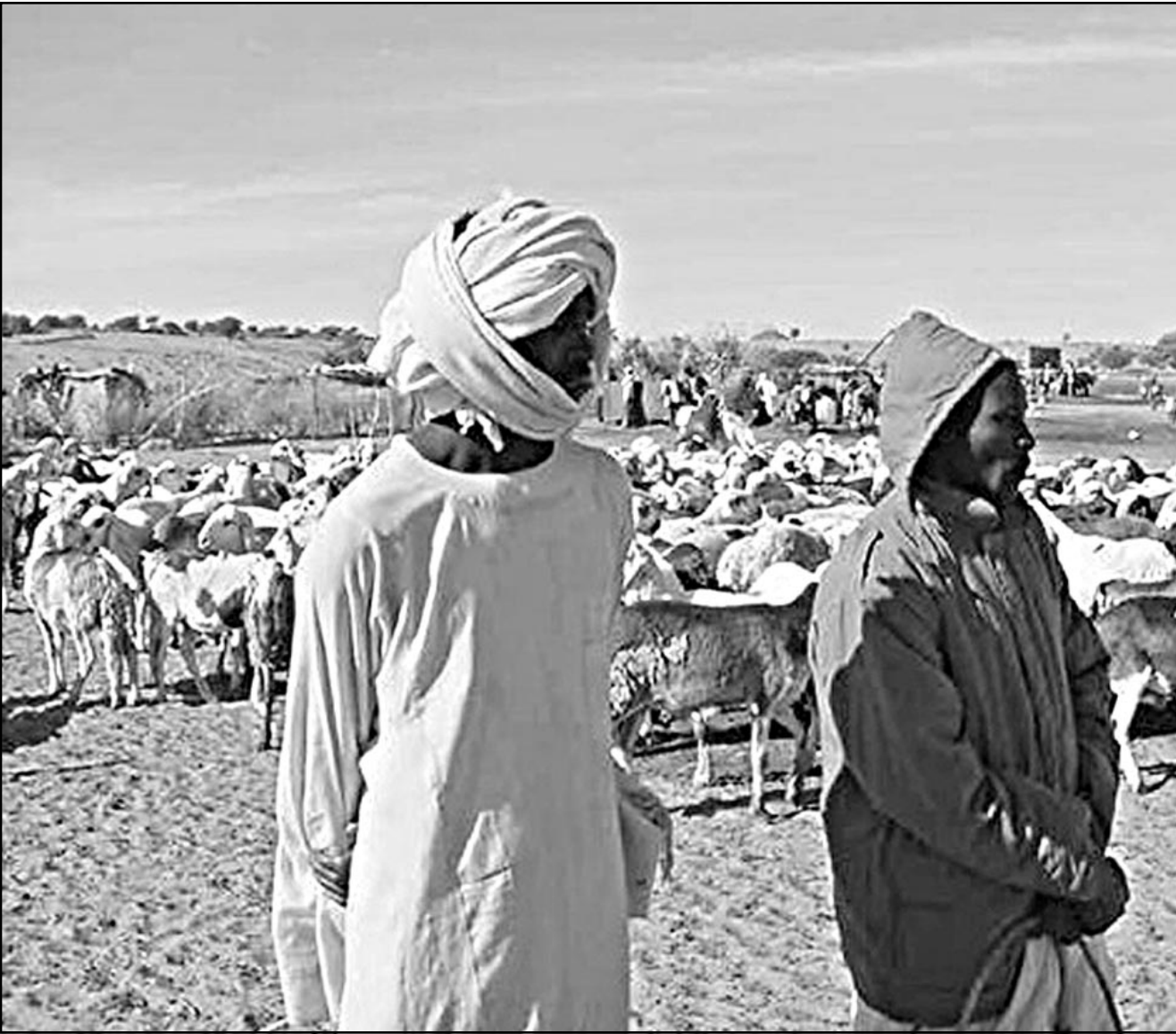
راعيان سودانيان في الجنوب

ويتعامل المخططات التي وضعت تجدي ان الكثير من الدول العربية قد وجدت ضمن الدول التي يمكن ان تخضع للتفتيت وكما سيتم بيان ذلك لاحقاً. ثانياً: تعمل قوى العولة المختلفة على اضعاف الحصص بالوطنية والانتشاء لاسمة وعطن. حيث الصبح بإمكان الأرقام الحصول على المعلومات والاتصال بالثقافات بعيدا عن مخصص الرقابة لأجهزة الدولة المختلفة سواء كانت سياسية أو ثقافية أو اجتماعية وبالتالي قد يحصل التناقض بين ما تحاول الدولة تلتقيته وبين ما يتكلمونه عبر الفضائيات