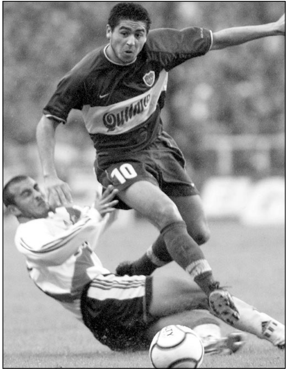
خوان رومان ريكويلم لاعب بوكا جونيورز (يمين) تغرق لنادي برشلونة مقابل 25 مليون دولار

برشلونة (اسبانيا) - رويترز: توصل نادي برشلونة الاسباني لكرة القدم الى اتفاق للتعاقد مع لاعب خط الوسط الاجنسي ريكويلم من الشباب خوان رومان ريكويلم من بوكا جونيورز الاجنسي مقابل مبلغ تكريت تقاير اعلامية انه 4860 مليون بيزيتا (25,75 مليون دولار). واكد غابرييل ماسفورول الناطق باسم برشلونة الجمعة بان الجانب الشخصي من الصفقة لم يتم بعد. وقال ماسفورول للصحفيين «هذا اتفاق من حيث المبدأ.. لا يزال هناك قليل من التفاصيل الدقيقة.. امانا 30 يوما لبحث شروط اللاعب واذ اتفقت فان ريكويلم سيصبح لاعبا في برشلونة الموسم المقبل». واذ وافق الناطق «كثير من الناديية ترغب في التعاقد مع هذا اللاعب الا ان برشلونة في وضع يمكنه من ذلك».