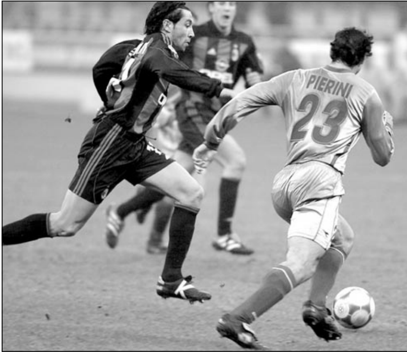
لقطة من مباراة ميلان