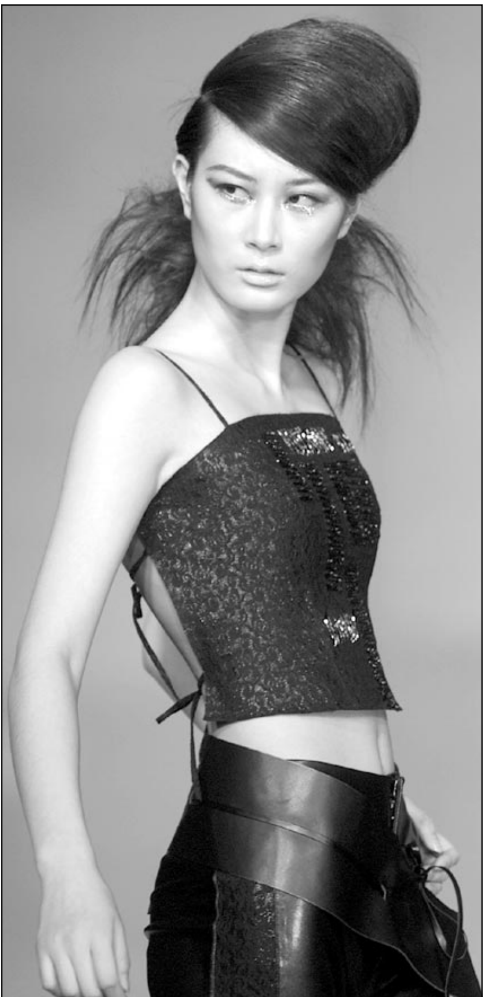
عارضة ازياء صينية قدمة هذا التصميم من ابتكار أحد بيوت ازياء الصينية في عرض اقيم ضمن سوق الملابس الدولية ببيكين

كما قال الباحثون ان نتائج الابحاث تزيد من احتمال توريث العقم الناتج عن انخفاض انتاج السائل المنوي من الام الى اطفالها الذكور مثلما هو الحال في عمى الاوان. وخلال بحثهم عن الاسباب الوراثية لانخفاض عدد الخلايا الانجابية الذكرية في السائل المنوي فان العلماء قصروا حتى الان ابحاثهم على الكروموسوم (واي). ونشرت الدراسة في دورية ينشر جينتكس العلمية المعنية بعلم الوراثة. وقال بيچ في بيان «العلماء وغير العلماء على السواء مطمئنون الى الاعتقاد بان الكروموسوم واي يختص بالخصائص الذكرية.