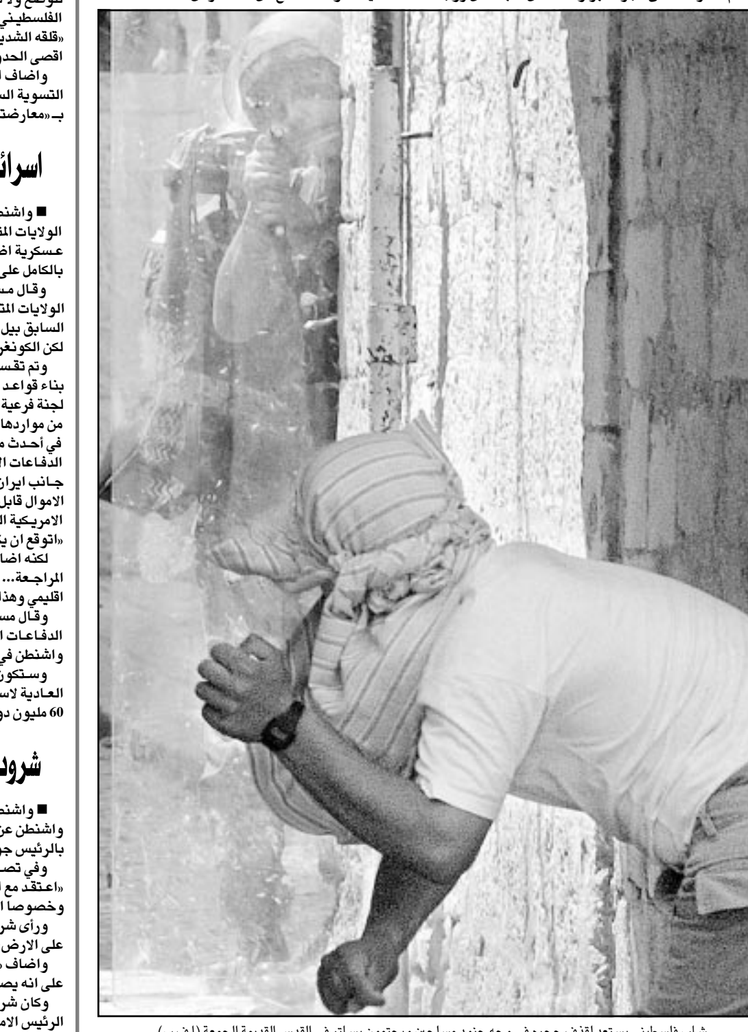
شاب فلسطيني يستعد لقتل حجره في وجه جنود مسلحين ويحتمن بساتر في القدس القديمة الجمعة