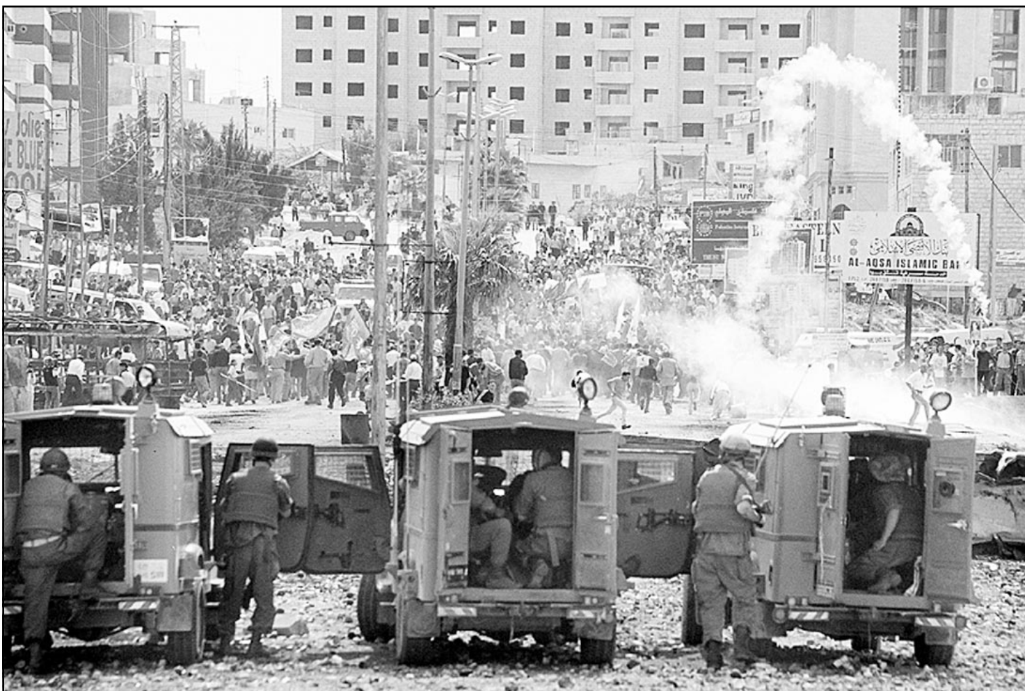
جانب من المواجهات التي اندلعت الجمعة في مدينة رامة الله بالضفة الغربية الحطة

وقال اسماعيل هنية الزعيم لآلاف المحتجين في مدينة غزة ان الفلسطينيين سيحتدون القصف الاسرائيلي بكل الوسائل وتعدده بتوجه ضربات في كل مكان باسرائيل. وأضاف انه اذا كانت لدى اسرائيل طائرات هليكوبتر ومدفعية فان الحركة لديها «قابل بشرية» ستفجر في كل مكان. وكرر ما تعهدت به حماس من قبل بإرسال عشرة انتحاريين الى اسرائيل بعد ان تولى شارون رئاسة الوزراء. واقدم مستوطنون يهود مدججون بالأسلحة الرشاشة صباح اس على إلقاء الحجارة والزجاجات الفارغة والمواد الصلبة باتجاه العشرات من منازل المواطنين وممتلكاتهم داخل البلدة القديمة من الخليل الخاضعة لنظام حظر التجول المشدد والمتواصل ليوم السادس على التوالي وذلك في مشهد اعتدائي يتكرر منذ ستة أيام وأدت هذه الاعتداءات الى إلحاق أضرار جسيمة في العديد من المنازل وتلك على مرأى وسميع جنود الجيش الاسرائيلي وجاءت هذه الاعتداءات لتواصل لعمليات حرق المنازل والمتاجر والسيارات التي ظلت مشتعلة حتى ساعات الفجر الأولى.