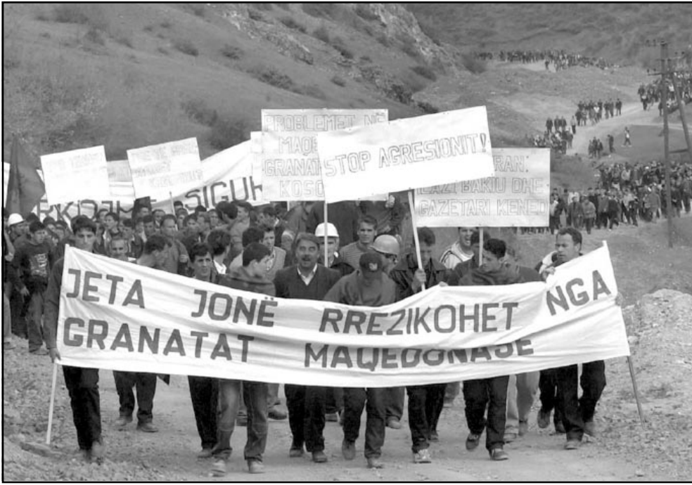
آلاف الألبان يتظاهرون في بلدة كريفينيك التي تعرضت للقصف عنيف مساء الخميس

■ سكوبيي - لوتشاني - اف ب: أكد هانس هيكرروب الحاكم الاداري في كوسوفو (ممثل الامم المتحدة) الجمعة من سكوبيي على اهمية اعادة فتح الحدود بين مقدونيا وكوسوفو، وعلن انه في صدد اجراء «تقييم» لمرافقة الحدود بشكل أفضل. وجدد هيكرروب خلال مؤتمر صحافي «دعم المجتمع الدولي لجهود الحكومة المقدونية للتصدي للمتطرفين» الألبان، معذرا أيضا انه «من المهم أيضا معالجة المشكلة على الصعيد السياسي، حتى لا يكون للمتطرفين أية فرصة في الفوز». وكان حلف شمال الأطلسي والاتحاد الأوروبي قد طلبوا «توضيحات» من سكوبيي حول اطلاق قذائف الهاون التي استهدفت بلدة كريفينيك في كوسوفو مساء الخميس، بينما نفت سكوبيي ان تكون لها أية مسؤولية عن هذا القصف. واعتبر هيكرروب انه «من المهم جدا اجراء تحقيق» في مصدر القصف، وتقع بلدة كريفينيك في مقابل قطاع غراتشاني في مقدونيا، حيث يحاول الجيش المقدوني طرد متطرفي جيش التحرير الوطني لالبان مقدونيا. واعتبر هانس هيكرروب «اننا نقسم السلطة الامم المتحدة قرار الحدودية بسبب الصراع الذي تخوضه مع المتطرفين ولا يجب ان يكونوا فهم «النتائج السلبية لخلق الحدود» على كوسوفو. واضاف هيكرروب «اننا نقسم الهاجس الامني لدى مقدونيا» ولكن «اغلق الحدود لم يكن فعالا في هذا المجال». وقال انه لهذا السبب «اعتزم اجراء