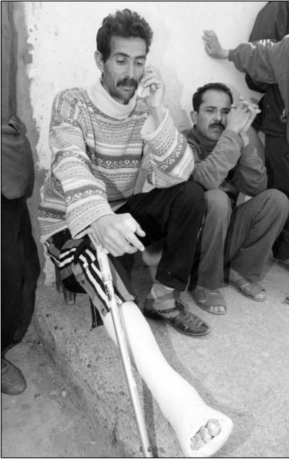
أحد الناجين من مذبحه تيبازة التي وقعت ليلة الجمعة وراح ضحيتها خمسة اشخاص

وأهم دميري تقرير الاتحاد الأوروبي بالتعاضد عن انتهاكات حقوق الإنسان «حتى في دول الاتحاد نفسها»، واقتصاره على حوالي 50 دولة في