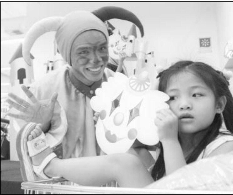
مهرجان يذاع طفلة صغيرة في سوبر ماركت في العاصمة التايلاندية بانكوك حيث بدأت المتاجر الوطنية حملة لزيادة حصتها من السوق والتي كانت خسرتها لصالح المتاجر التابعة لشركات عالمية

وتعتمد مصفاة الاردن بصورة كلية على النفط المستورد من العراق والذي يقدر بخمسة ملايين طن للعام الجاري. يذكر انه في تشرين الاول (أكتوبر) الماضي وقعت شركتا ستار بتروليم البريطانية و بلاك ورك الاسترالية اتفاقا تتساه مع السلطات الاردنية للتطبيق عن النفط في المرتفعات الشمالية للاردن.