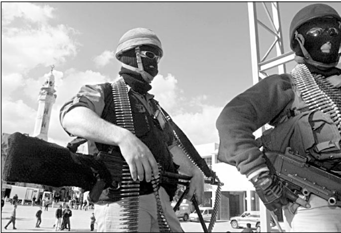
جنديان امريكيان مدججان بالسلاح في الكويت