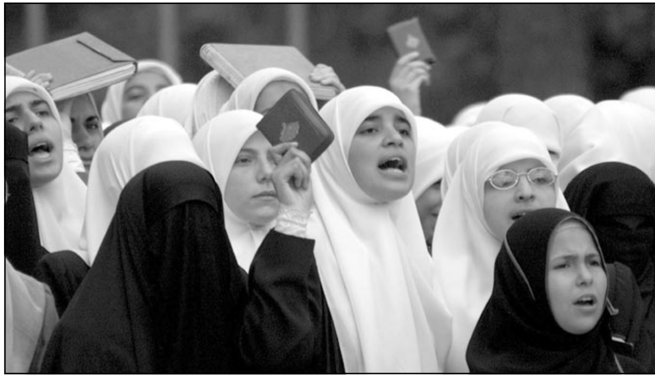
طالبات الجامعة الأردنية يتظاهرن امس داخل الحرم الجامعي في عمان ضد العدوان الاسرائيلي على غزة

الخطابي الذي اقره الملتقى بمناسبة يوم الاسير الفلسطيني في 16 - 4 - 2001 من حيث الموعد بهدف التحضير الجماهيري لانجاحه على نطاق واسع. - التدخل المركزي لتفعيل اللجان الفرعية للجان التنسيق الحزبي في المحافظات وتنشيط الفعاليات الجماهيرية المناهضة والحفاظ على الديمقراطية - الشروع ببرنجان جمع التبرعات تنفيذاً لمشروع «الصندوق الشعبي الاردني لدعم الانتفاضة» وتقديم تصور تنفيذي وواضح لدراسته الاثنيين القادم.