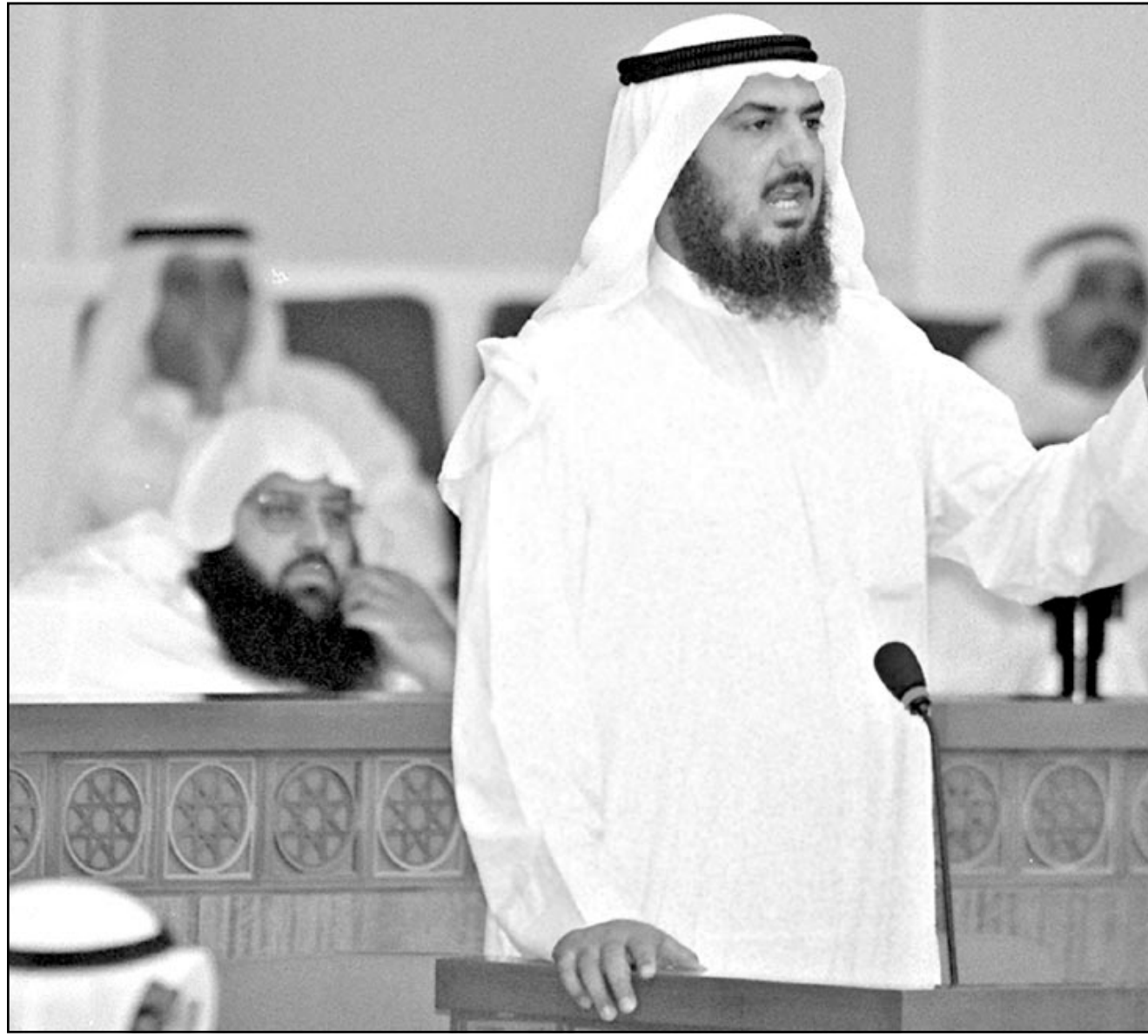
نائب اسلامي يتحدث في جلسة في البرلمان الكويتي