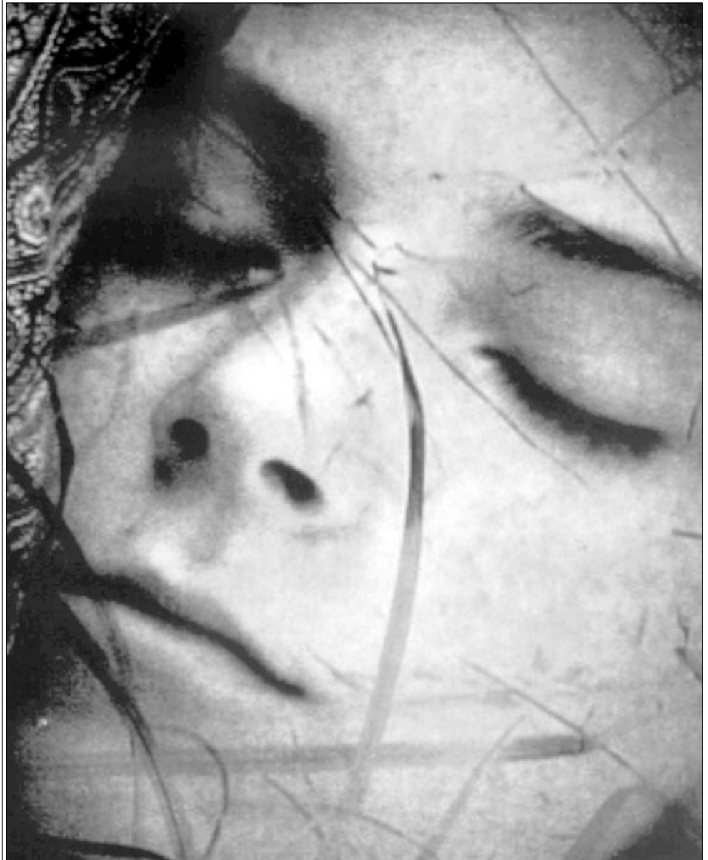
لقطة من فيلم «نسيان» للمخرج الفرنسي كيرار كيراسكي

تعودان إلى منزلهما لمحاكاة حركات الأقدام فوق السرير، وتشويه شريط الصوت، لتجربته ميمناً وشمالاً على طرقة موسيقى «الراب». «إيتيبسيا توري» في رقص، وخلال دقيقة واحدة، تمارس نفس العملية، تعيد ظهور نفس اللقطة، تتعدد أبعادها، تشوه الصورة والصوت. ولكن بينوا ليمان يخرج من قاعة التدرجات إلى اماكن خارجية متعددة، ليعيد لنا رقصاً من نوع آخر، أكثر خشونة، عفاً، وطقوسية، فيستعرض لنا القاعة، وأصوات المدربة تختلط وضربات الرقعي للصوره وطرايق حديثة لعرضها، مثل الإنترنت والـ DVD. وعلى الرغم من تنوع الإقترابات، الحرية، والرغبة التجريبية التي تنطلق منها الأعمال المقترحة، إلا انها تكشف عن علاقة الجيل الفرنسي الجديد مع نفسه والآخرين، وتطرح أسئلة عن دور الكاميرا والصور التلقائية عنها: هل هي أداة للتوجه نحو الآخر، اكتشافه، والتواصل معه؟ أم انها، بالأحرى، وسيلة اضافية لتجربتها في حد ذاتها وعلاقتها مع زميل الدراسة «بانيك جيه» ومع انشأ تكريبات شخصية، إلا أن طريقة الحكمي تتوجه لأخر/ المتفرج الذي يتابع تنوعه، شخصية، وتلقائية القناعة، والتي تنظر إلى عسة الكاميرا كمتفرج، وتفتح قلبها