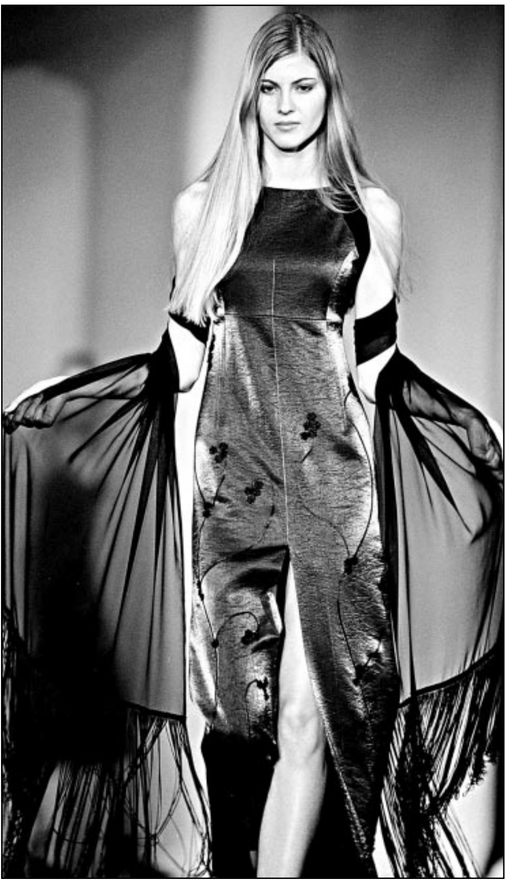
عارضة ازياء من بلغاريا قدمت هذا الزي من مبتكرات «سكارليت»، خلال العرض الذي اقيم في العاصمة صوفيا

وتم القاء القبض على «الجوكر» كما يليق به اتبعه اثر اطلاقه الرصاص وبلغ عدد ماربدا جنوبي العاصمة عمان على صديق له بعد خلافات مالية بين الجانبين.