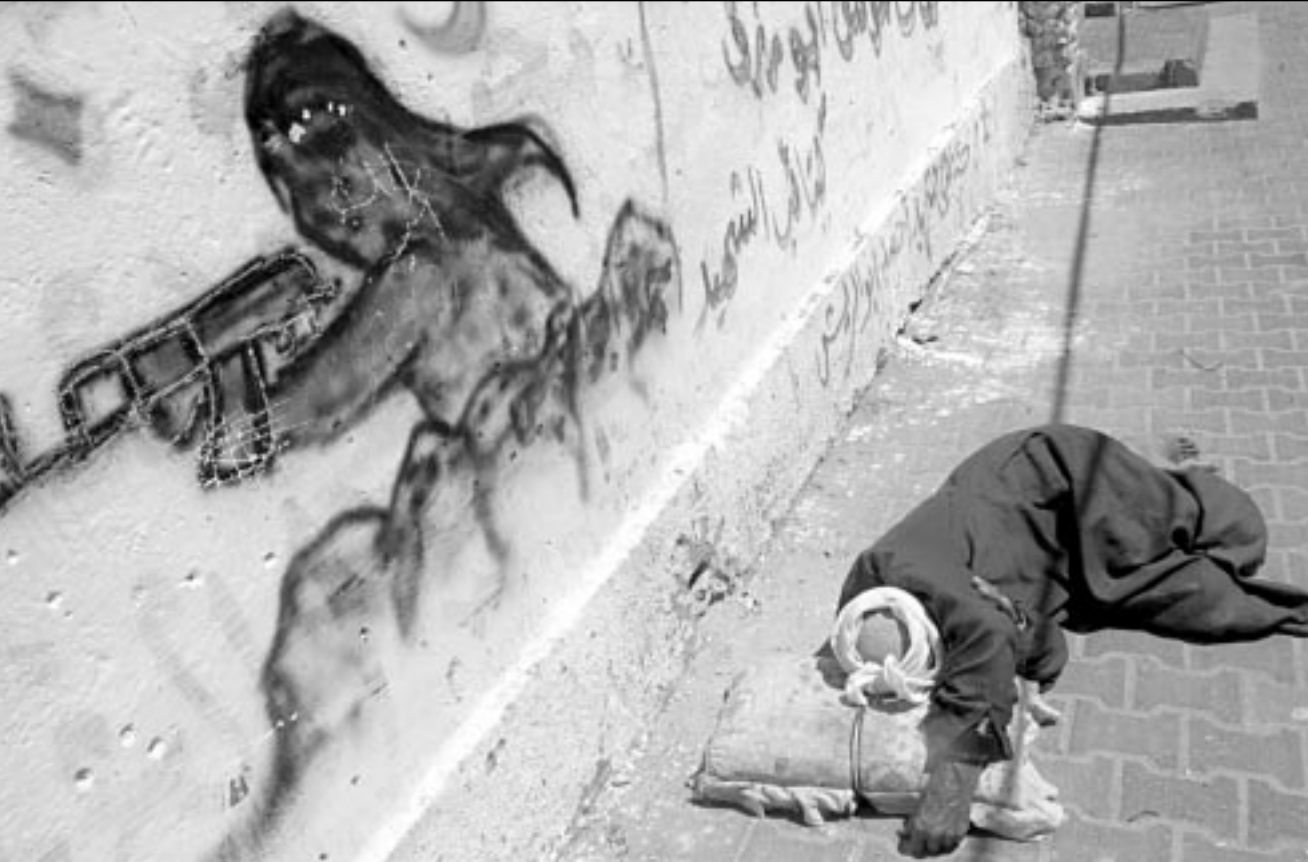
فلسطيني يلجأ للتمويه في الشارع بعد ان هدمت جرافات الاحتلال منزله في مخيم خان يونس