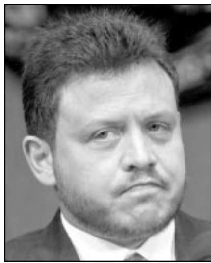
الملك عبد الله في واشنطن

واشنطن - من كارول جياكومو: قال العاهل الاردني الملك عبد الله الاربعة ان الشرق الاوسط في «مفترق طرق» داعيا الولايات المتحدة لوضع «مشروع مارشال» لاتقاع شبان المنطقة بالتخلي عن العنف من اجل النمو الاقتصادي والاستقرار. والبدي مسؤولون اردنيون نقالوه خلال لقاء في نادي الصحافة القومي بخصوص اختلالات اقرار الكونغرس لاتفاق لبناء اوروبا الغربية قائلا انه يريد ان يخرج الجديد جورج بوش من الصراع العربي الاسرائيلي. وقال الملك عبد الله يتحدث في اليوم التالي للقاءه مع بوش في البيت الابيض وفي ظل تصاعد لعنف في الشرق الاوسط. واشار الى اقام الولايات المتحدة بعد الحرب العالمية الثانية على وضع برنامج ضخم وهو مشروع مارشال لإعادة بناء اوروبا الغربية قائلا انها تريد ان يخرج «تحديا واضحاً هنا في الولايات المتحدة». وقال «نحن الان في مفترق طرق. وقد تجتمعت وافرح بالمشروع في اوروبا. واتساع هل يمكن ذلك في منطقة الشرق الاوسط». وخلفا مشروع مارشال الذي جمع بين الامتيازات والقرض خلال العمل الاردني انه لا يطلب مجرد معونة. واضاف «انا اتحدث عن دعم دول فنية تفهم بحسب الطريقة التي يسير بها العالم... اقتصاداتنا... واستمرروا علينا لتحقيق النجاح. واستمرروا علينا ماديا وعمليا لان هناك التوربين من يتابعون ما يحدث في الاردن وما ان يحدث في سورية وما يحدث في المغرب وما يحدث في البحرين». واضاف «صمما خطة طويلة الاجل تحطينا الامل لا