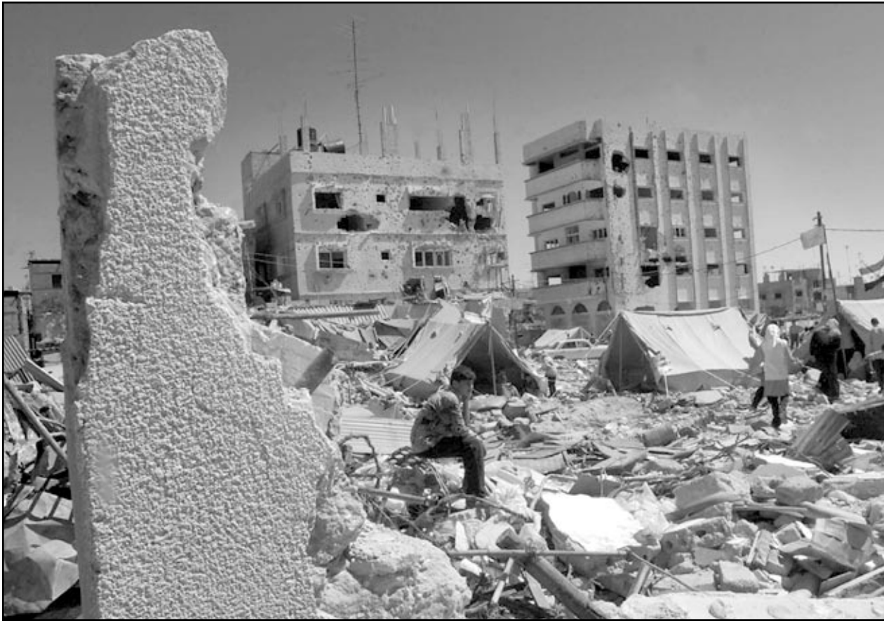
طفل فلسطيني يجلس على انقاض منزله المدمر