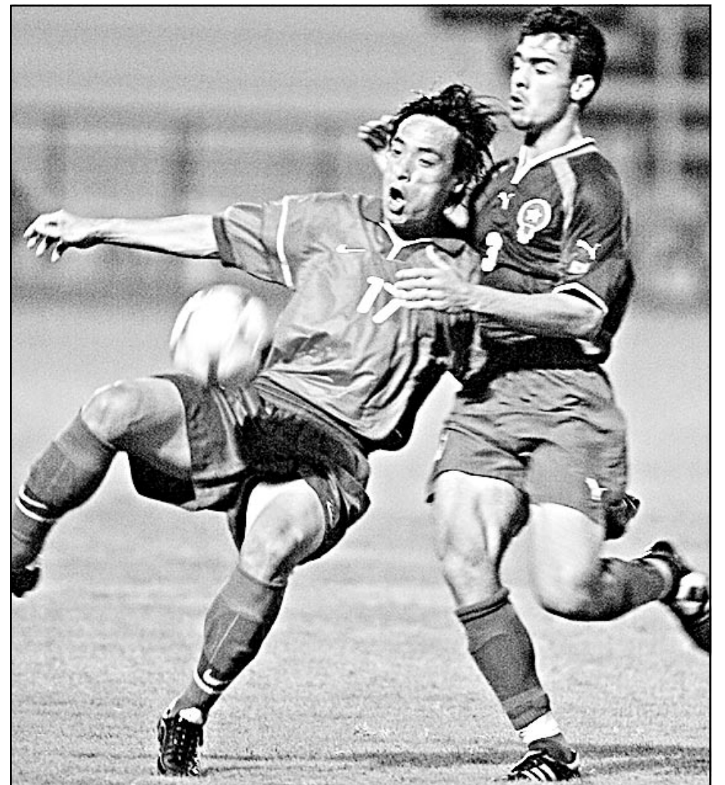
لقطة من إحدى مباريات منتخب الامارات