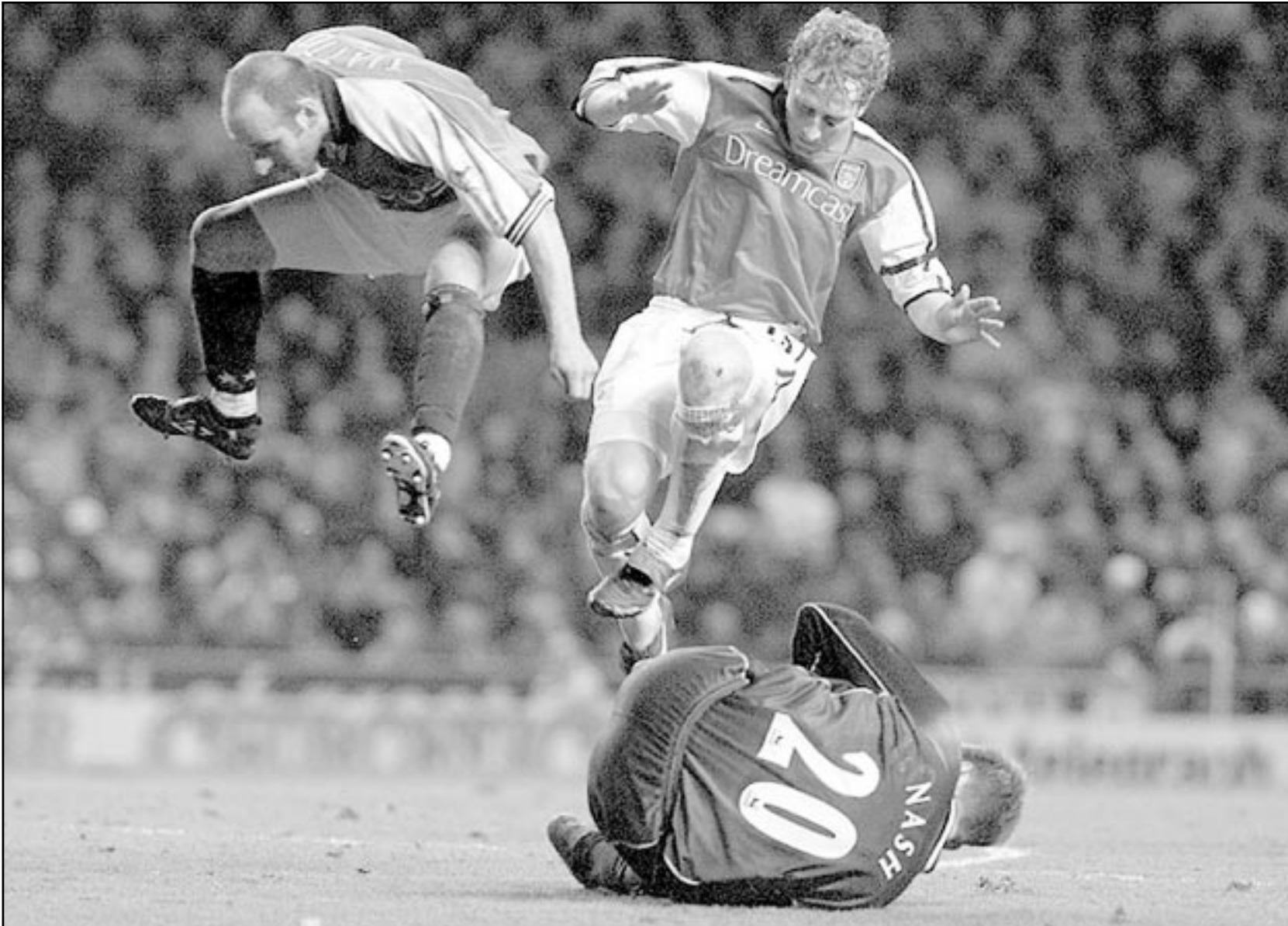
لقطة مثيرة من المباراة التي فاز فيها ارسنال على مانشستر سيتي 4/صفر