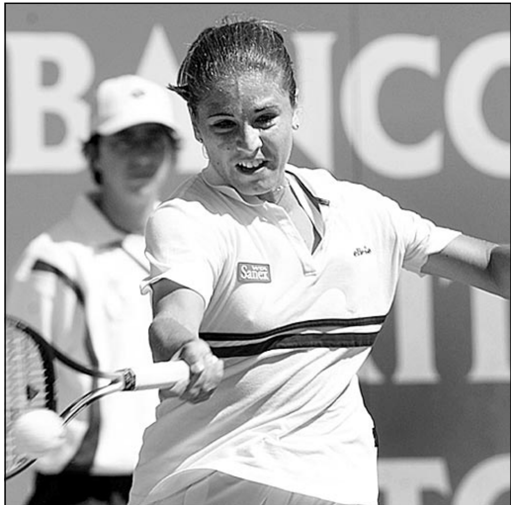
اللاعبة الايطالية ريتا غراندي

التي انسحبت بعد اصابتها بضربة شمس بينما كانت المباراة 3/6 و 3/6. وفازت ايضا المصنفة السادسة الفرنسية اميلي مورسمو على الامريكية غير المصنفة كريستينا براندي 2/6 و 1/6. كما فازت المصنفة السابعة الاسبانية اراشسا سانتشيز فيكاريو على البلغارية بافلينا نولا 3/6 و 3/6. وفازت المصنفة التاسعة الروسية باولا سوليريز على روسانا دي لوس ريوس لاجبة باراغواي 4/6 و 3/6.