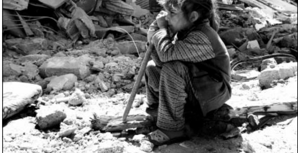
طفلة فلسطينية دمرت الجرافة الاسرائيلية اشياءها الصغيرة، فجلست ترأف ما تبقى من بيتها

بيد انه وخلفا لاسطورة الفصح، والتي تبارك كل ما انجز، فان الرب الاب لم يظهر للعرب ما يعرفه، ولحظنا الكبير فاني لا يوجد اسرائيل لا تنتظر ان يقوم هو عنها بالمهمة، وكان لا يوجد للعرب، يتجند كل عام عشرات الآلاف من ابناء الثامنة عشرة لصفوف الجيش الاسرائيلي، وعشرات