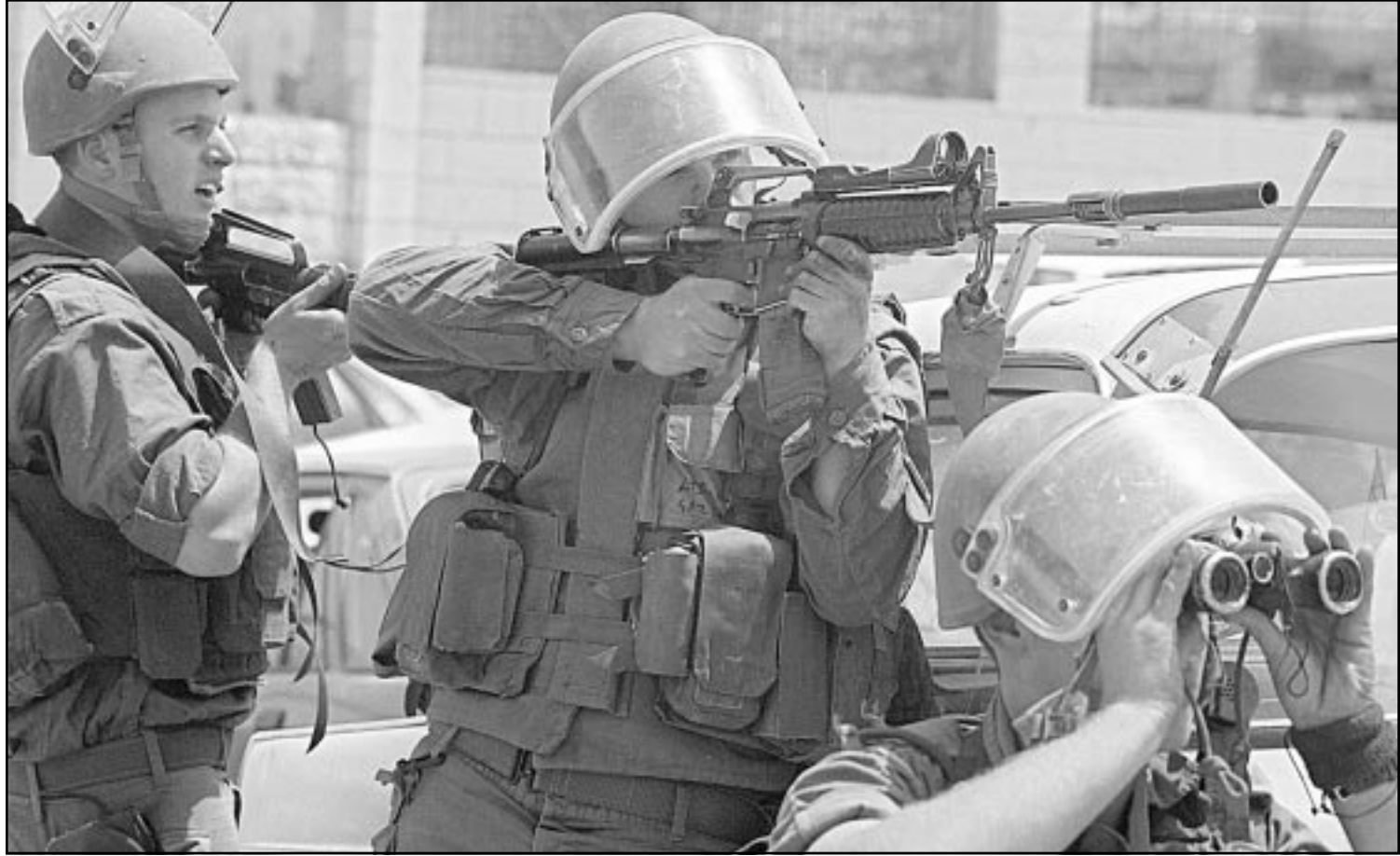
جنود اسراييليون يوجهون بنابقيهم باتجاه متظاهرين فلسطينيين في مدينة الخليل

■ غزة - الخليل - بيت لحم - اف ب - رويترز: دمر الجيش الاسرائيلي امس الاربعة بالجرافات موقعا للامن الفلسطيني ومنزلا بالقرب من رفح في جنوب قطاع غزة، حسب ما افاد مسؤول امني فلسطيني وشهود عيان. وقال المصدر الامني لوكالة فرانس برس ان الجيش الاسرائيلي بدأ اطلاق النار بشكل عشوائي على الموقع مستخدما الاسلحة الثقيلة قبل البدء بجرف الموقع الفلسطيني الذي يبعد حوالي 200 متر عن الخط الأخضر (اسرائيل) عند معبر صوفا شرق مدينة رفح جنوب قطاع غزة والفاصل بين الاراضي الفلسطينية واسرائيل. واضاف المصدر نفسه «ان تبادلنا لاطلاق النار وقع بين جنود اسراييليين وافراد الموقع الفلسطيني عندما قامت الجرافات العسكرية الاسرائيلية التي كانت ترافقها الدبابات بجرف الموقع الامني الواقع في منطقة خاصة للسيطرة الفلسطينية الكاملة».