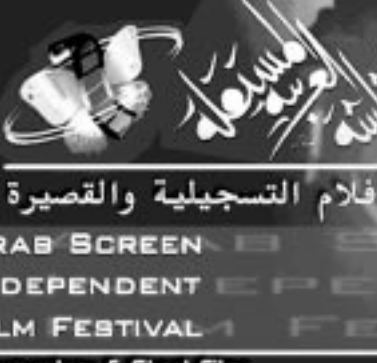
ملصق مهرجان الشاشة العربية

المخرج؛ من مجلة «ستوديو الفرنسية» عدد 838، تشرين الاول (اكتوبر) 1998، من الصفحة 120 الى 123.