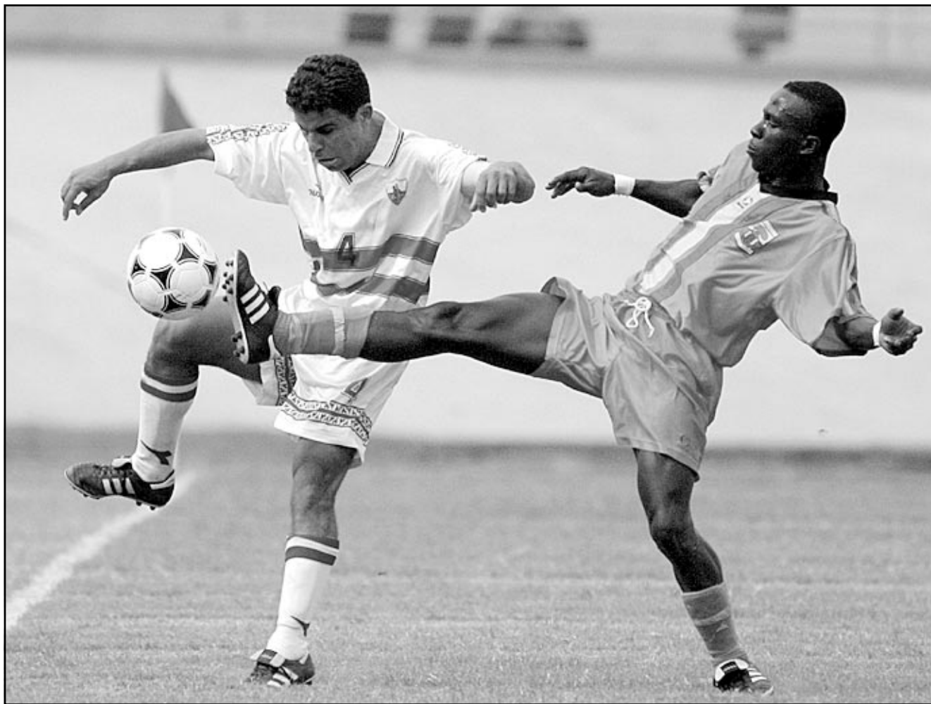
لقطة من إحدى مباريات فريق الزمالك

■ القاهرة- رويترز: خسر نادي الزمالك متصدرا دوري كرة القدم الممتاز في مصر امام مزارع دينا الذي يصارع الهبوط 1/2 في مباراتهما التي اقيمت مساء الثلاثاء والمؤجلة من الاسبوع الثامن عشر للبطولة. واضاعت هذه الهزيمة على الزمالك فرصة تتويجه بطلا للدوري قبل نهايته بثلاثة اسابيع.