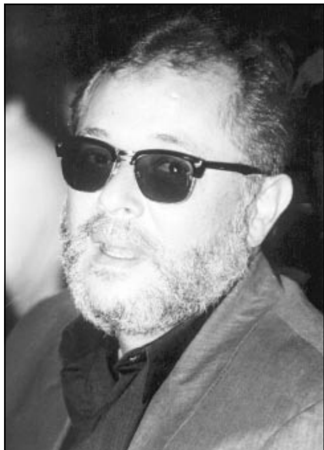
محمود عبد العزيز

يبعدون أن هناك أزمة على وشك الانفجار بين النجم محمود عبد العزيز وبين القطاع الاقتصادي التابع لاتحاد الإذاعة والتلفزيون... وذلك بسبب فيلم «الرحلة»!