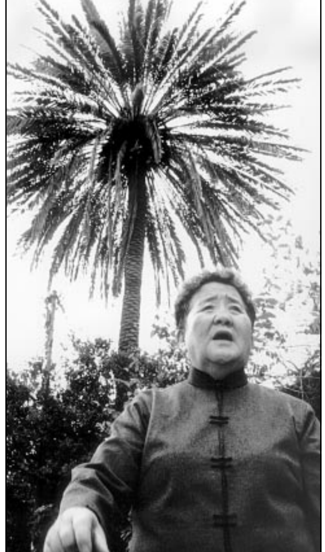
ما يوك. لان امام شجرة النخل قرب منزلها والتي حملها زوجها كمشة لدى عودته من الحج في العام 1953.

وتأسست «جمعية اصدقاء الحاج يونس للثقافة والفن» في نوفمبر 2000 بمبادرة مجموعة من المثقفين والفنانين المغاربة وجعلت من أهدافها تكريم الفنانين المغاربة واحياء التراث الثقافي والأدبي والفني واحياء وإقامة لقاءات فنية تضامنية لعناية