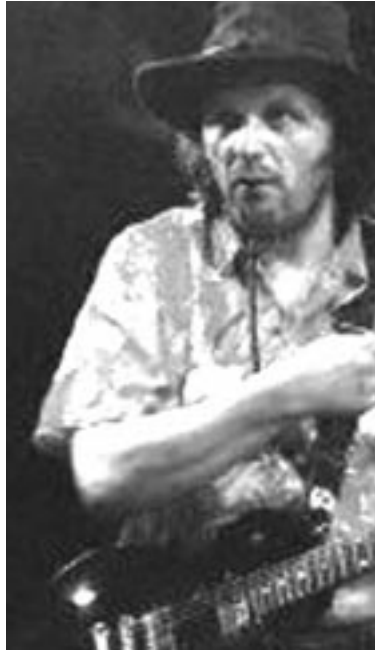
امير كوستاريكا يعزف على العيتار

ليس للمخرج في الحقيقة الاهداف واحد عندما يبادر الى انجاز شريط، ان يكون مستوعبا ما يقوم بتصويره، اعرف ان