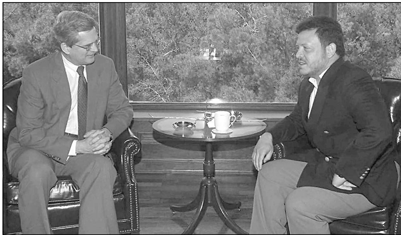
العاهل الاردني الملك عبد الله الثاني اثناء استقباله مساعد وزير الخارجية الامريكي اموارد ووكر في عمان امس