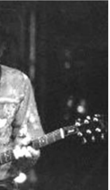
امير كوستاريكا يعزف على العيتار

عندما اشهد مشهدا، ابدا دائما بوضع الكاميرا، ذلك انه بالنسبة لي تتركز السينما على «الاجراج» - بالعبثي اللطيف للكلمة، بمعنى مراقبة الفضاء، وما نرغب مشاهدته داخل هذا الفضاء، ذلك ان مراقبة الفضاء يجب ان تنجز ابتداء من الكاميرا، ويجب على الممثلين ان يخضعوا لاطار الذي سبق تحديده، لا العكس. او لاسباب عملية، يسهل كثيرا ان نطلب