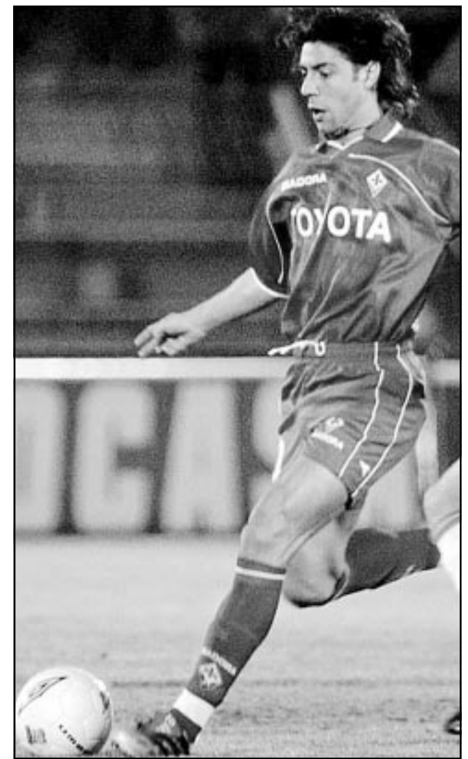
اللاعب البرتغالي روي كوستا

لمصلحة احدى الجمعيات في اوروبا التي ترعى مرضى الاعصاب.