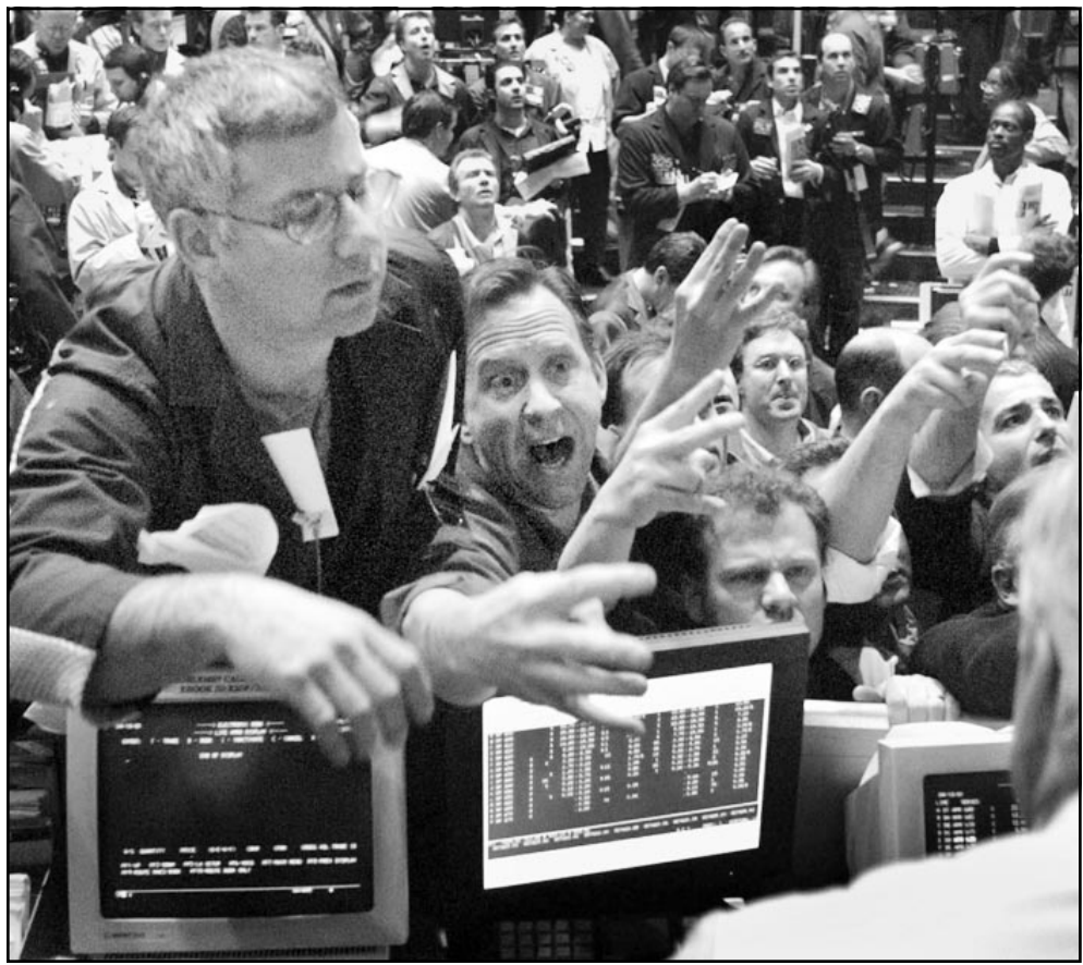
متعاملون في بورصة شيكاغو يتابعون اسعار العملات والبورصات بعد قرص فخر البنك المركزي نسبة الفائدة نصف نقطة

■ وارتفعت مخزونات الخام 40 مليون برميل او نحو 15 في المئة خلال خمسة اسابيع من الزيادات المتعددة. وضاعف من هذه الارتفاعات ذات الاثر النزولي هبوط اقل من المتوقع قدره 58 الف برميل في مخزونات البنزين الى 193.1 مليون برميل مما هون من المخاوف من نقص في امدادات البنزين قبل فصل الصيف. وبلغ سعر البنزين في عقود ايار (مايو) في التعاملات الالكترونية لنايكس 1.0350 دولار للغالون منخفضة 1.52 سنت. وتول سعر عقود زيت التدفئة لشهر ايار (مايو) 78.85 سنت للغالون منخفضا 1.27 سنت.