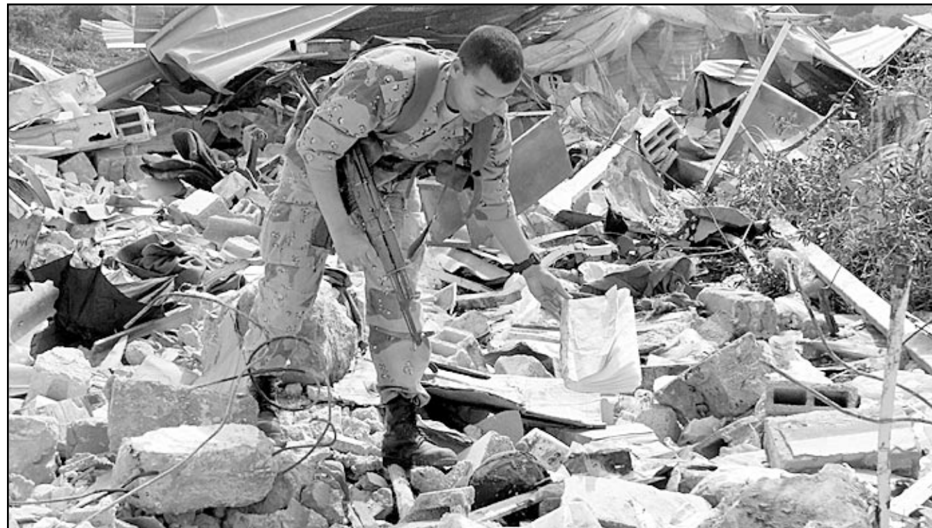
شرطي فلسطيني يتفقد انقاض مقر للشرطة بعد انسحاب الجيش الاسراييلي من مناطق احتلتها في اراضي السلطة الفلسطينية

ويدعو القرار الثاني الذي قدمته السويد باسم الاتحاد الاوربي اسراييل للامتناع عن اقامة اي انشاءات جديدة للمستوطنين في الاراضي المحتلة».