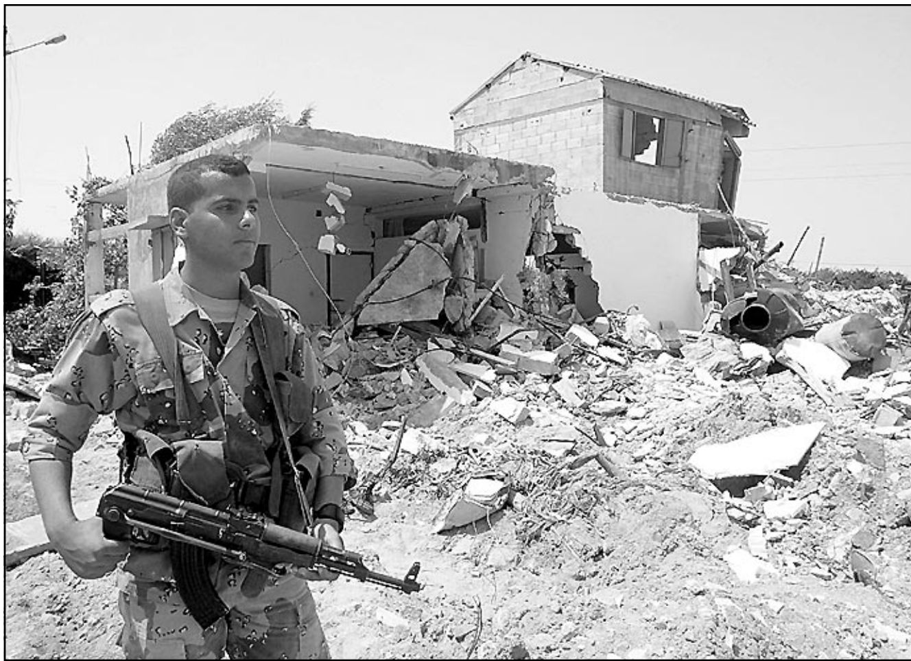
شرفي فلسطيني يقف امام منزل دمر بالكامل بالقصف الاسرائيلي على بيت حانون

■ واشنطن - القدس - غزة - اف ب - وقيتر: اعلنت مصادر دبلوماسية ان اسرائيل حاولت عبثا التثاقل منع الولايات المتحدة من نشر بيان يندد بعملياتها في اراضي الحكم الذاتي الفلسطيني.