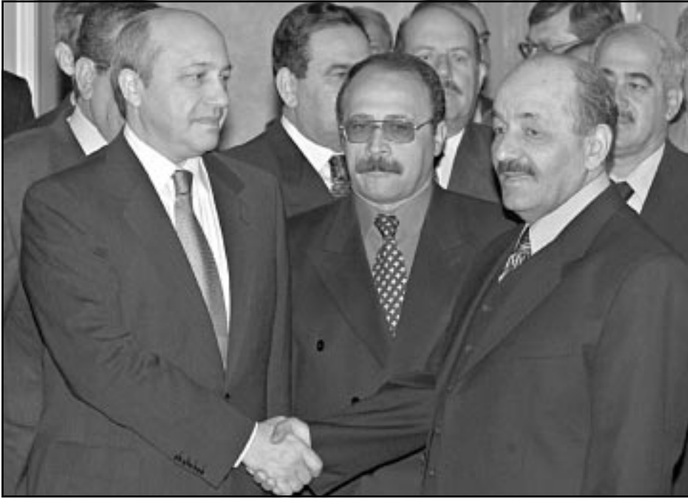
وزير الخارجية الروسي ايفور ايجانوف مستقلاً نائب الرئيس العراقي هله رمضان في موسكو امس

التأخره في الوقت الذي نجح فيه الكويتيون في تسويق قضية اسراهم في العراق واستثمارها كأحدى اهم ملفات الصراع مع بغداد. انضغل فيه العراقيون في حرب اعلامية خارجية طالت حتى الجهات المتعاطفة معهم وحرب اعلامية داخلية قادها عدي، الابن الأكبر للرئيس صدام حسين، وشن فيها