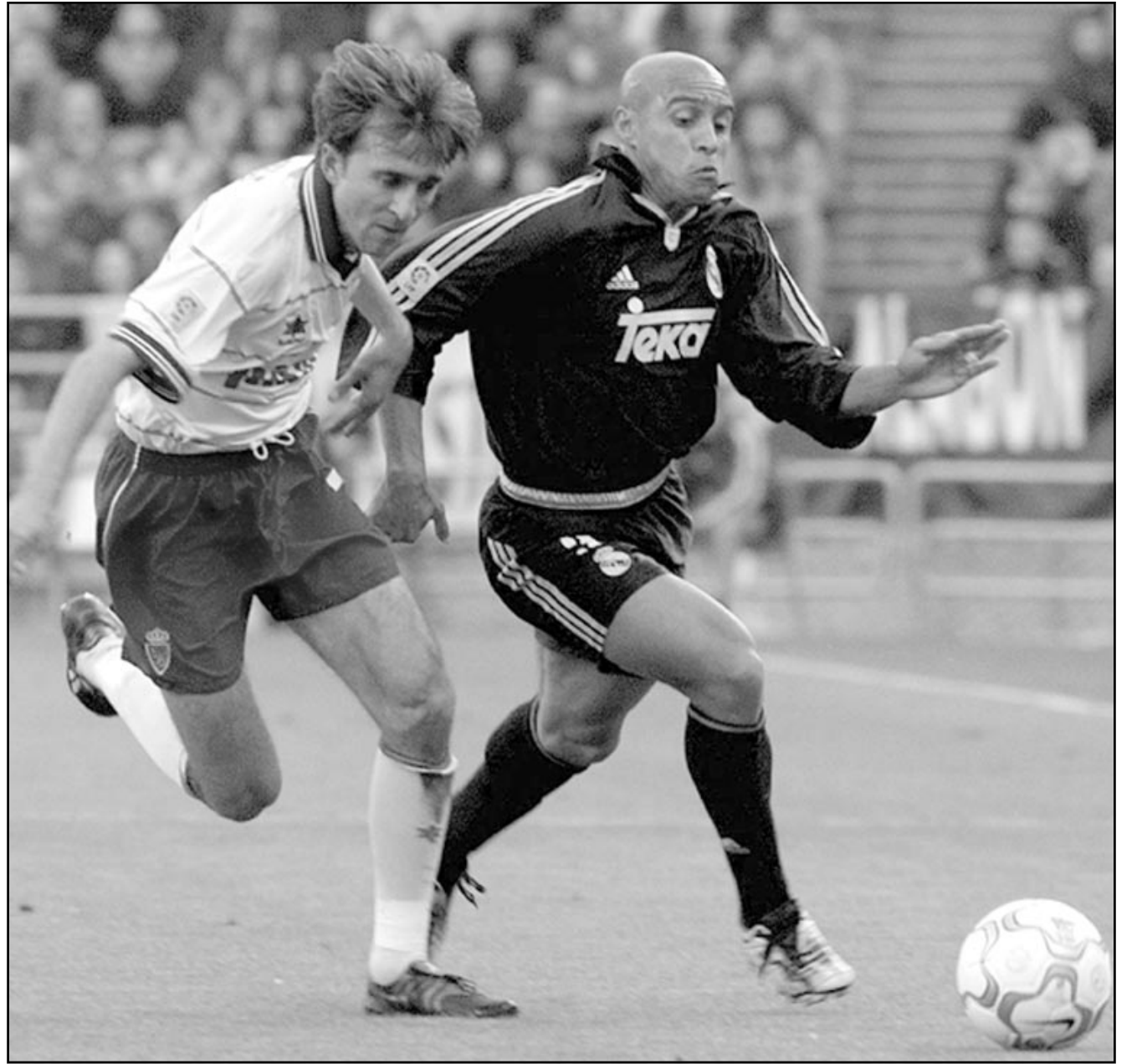
روبرتو كارلوس لاعب ريال مدريد (الى اليمين) يحاول الانفرد بالكرة