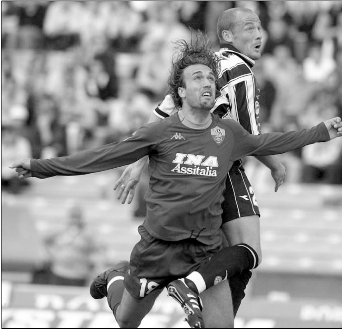
غابرييل أومار باتيستوتا لاعب روما (الى اليسار) في منافسة على الكرة مع ريغيه غينيهو لاعب اودينيسي