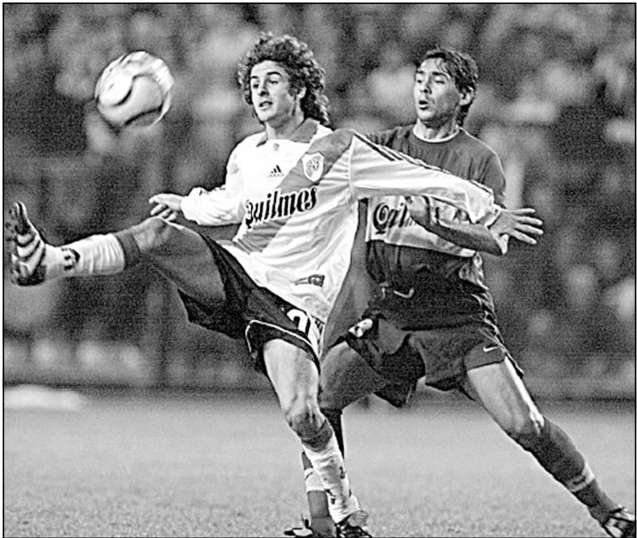
لقطة من إحدى مباريات ريفر بلايت