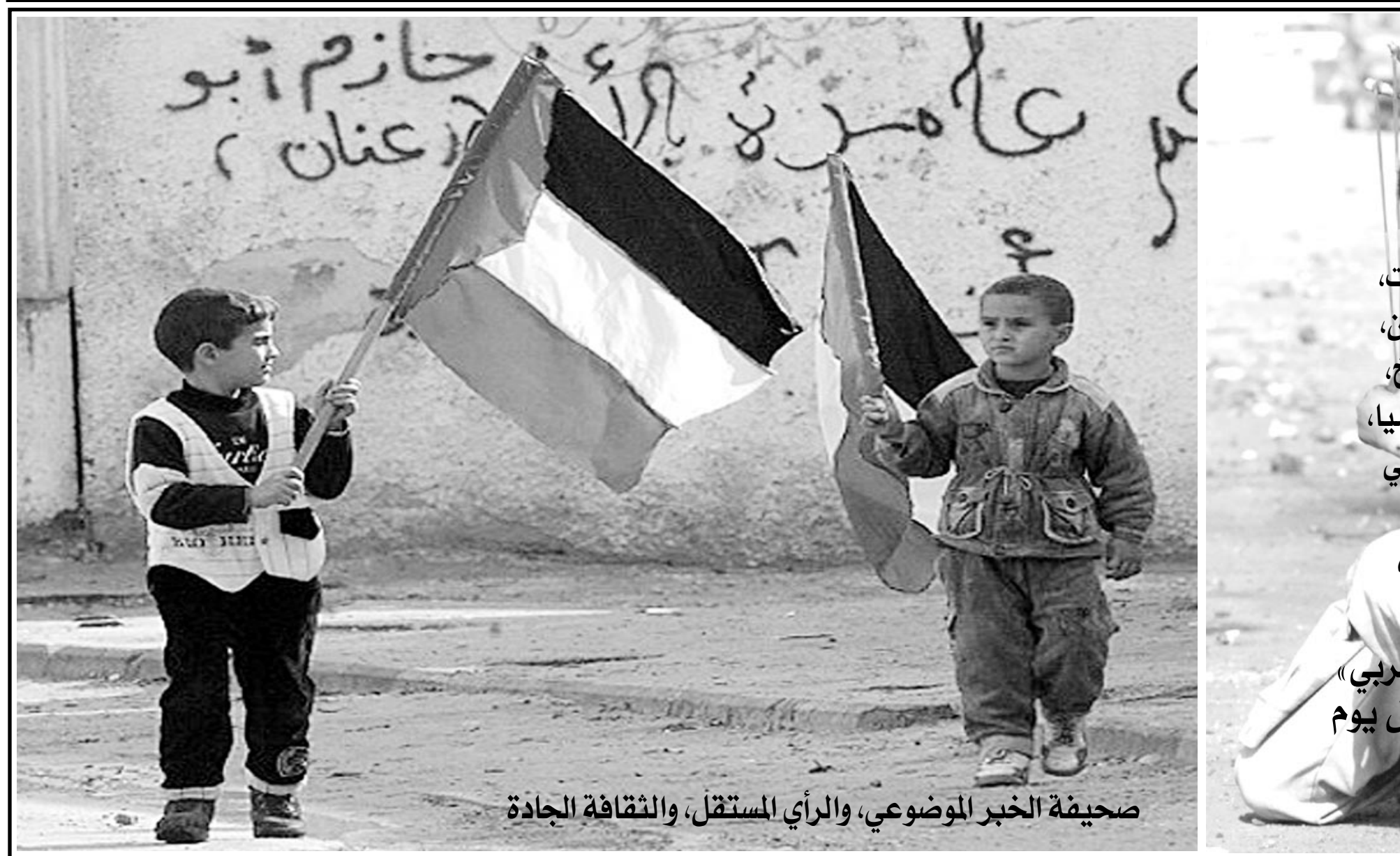
صحيفة الخبر الموضوعي، والرأي المستقل، والثقافة الجادة