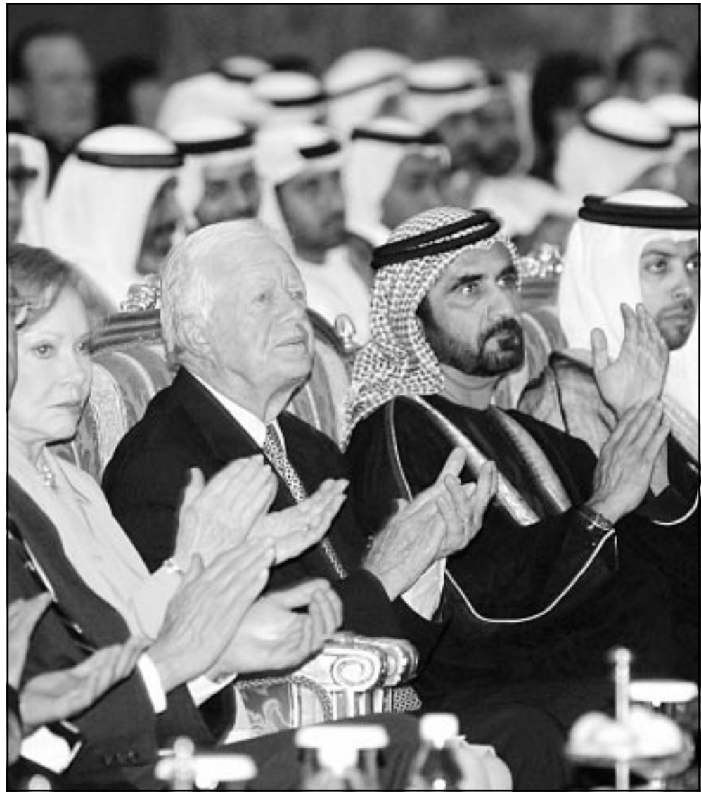
الرئيس الأمريكي الأسبق جيمي كارتر والى جانبه وزير الدفاع الاماراتي الشيخ محمد بن راشد المكتوم في حفل تسليم الجائزة

وقال ان هذا الصعد، انتقد الصادق المهدي قرار الحكومة السودانية بتكوين لجنة عدلية حول التعويضات التي طلبها حزب، مينا بان التعويضات لم تؤخذ بطريقة قانونية، ودعا المهدي الحكومة السودانية لاعادة ما اخذته من حزب الامة بصورة سلسلة دون اجراءات تسليح او تسل، غير ان المهدي ذكر بان الحكومة اوفت حتى بحوالي 10% من قيمة المتطلبات المصدرة وشدد على اهمية اعادة كافة الحقوق لجميع الاحزاب السياسية. ومن جانبه قال الدكتور موسى ماديو القيادي بحزب الامة بان حكومة البشير تتصلت من اتفاقها مع حزب الامة حول التعويضات وتكوين المجلس المنفق عليها ورد المتطلبات المصدرة. واوضح ماديو بان جديده الحكومة في التوصل لحل شامل رهين بالايفاء بالتزاماتها تجاه القوى السياسية الاخرى ومن بينها حزب الامة. وقال ماديو بان رؤيته الشخصية ان يلجا حزب الامة للفضاء لأخذ حقه من الحكومة السودانية كاملا خاصة وانها اقرت عبر ممثلها في اللجنة المشتركة بين حزبي في التعويضات التي طلبها. وشدد ماديو على ان حزب الامة سيكون مواجه بخيار ادراج مستحقته نظير ممتلكاته المصدرة