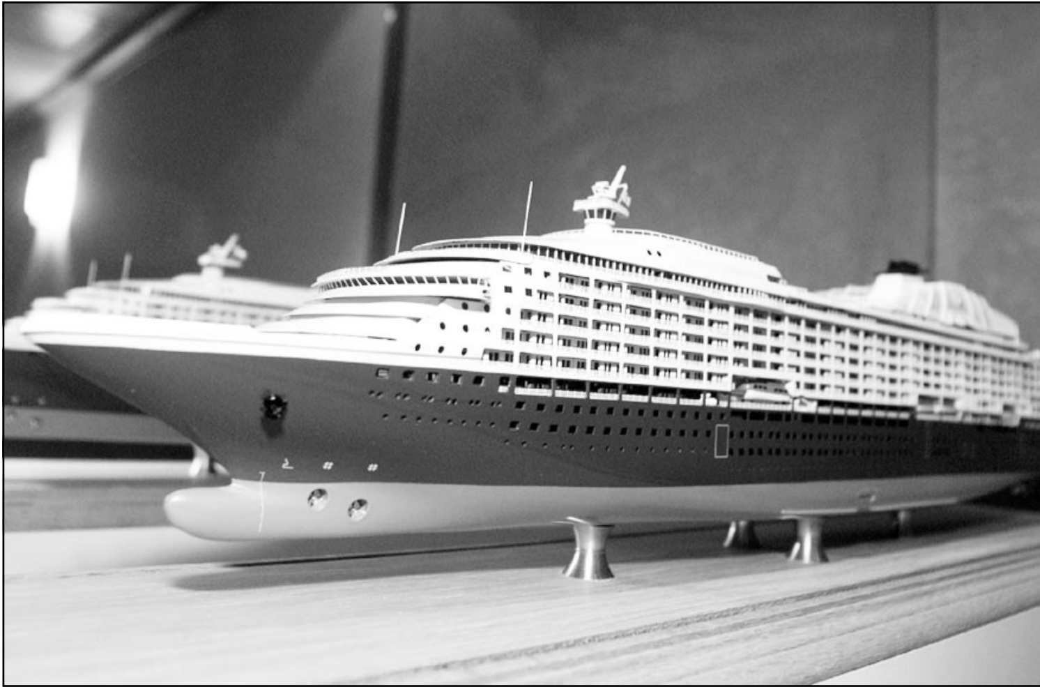
مدبرتا قسم التصميم الداخلي والمبيعات في الشركة المالكة لسفينة ريزيديسي العملاقة تعرضان امس الاول في قرية نسواوية نموذجاً بالحجم الفعلي لإحدى غرف الشقق الموجودة على متن السفينة التي يظهر مجسمها اعلاه. وتضم السفينة البالغ طولها 196 متراً وزنها 40 ألف طن 110 شقق إضافة الى 88 جناحاً للضيوف موزعة على أكثر من عشرة طوابق، ولغاية الآن تم بيع أكثر من 60 في المئة من شقق وأجنحة السفينة لأثرياء يرغبون في عدم الإقامة في دول عادية لغراض ضريبية