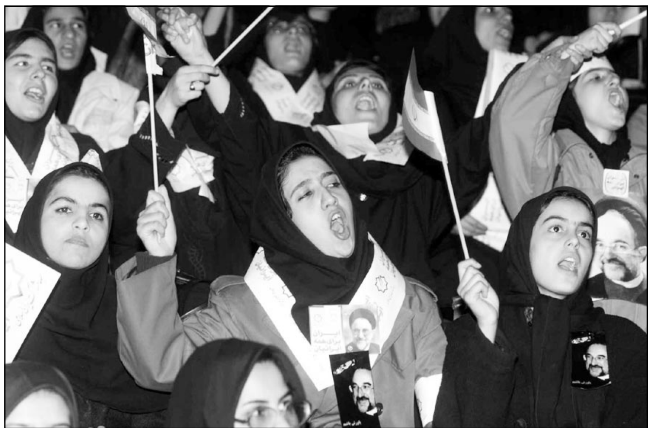
فتيات إيرانيات يحملن صور الرئيس محمد خاتمي

لكن الإصلاح لم يحقق غايته، اعتبر المحافظون أن الحريات التي يتمتع بها الشباب مجرد تقليد لما رسات غربية أخلاقية، وحفز فوز صاحب خلفاء خاتمي في البرلمان خصومه على التحرك، وبدأ مجلس مراقبة الدستور الذي يعين أعضاءه الزعيم الأعلى لإيران آية الله علي خامنئي بغرد عضلته. وبالفعل ألقى المجلس قوانين أصدرها نواب الشيعية في البرلمان، كما فرض القضاء الذي يهيمن عليه المحافظون ويعين تشكيلاته خاتمي