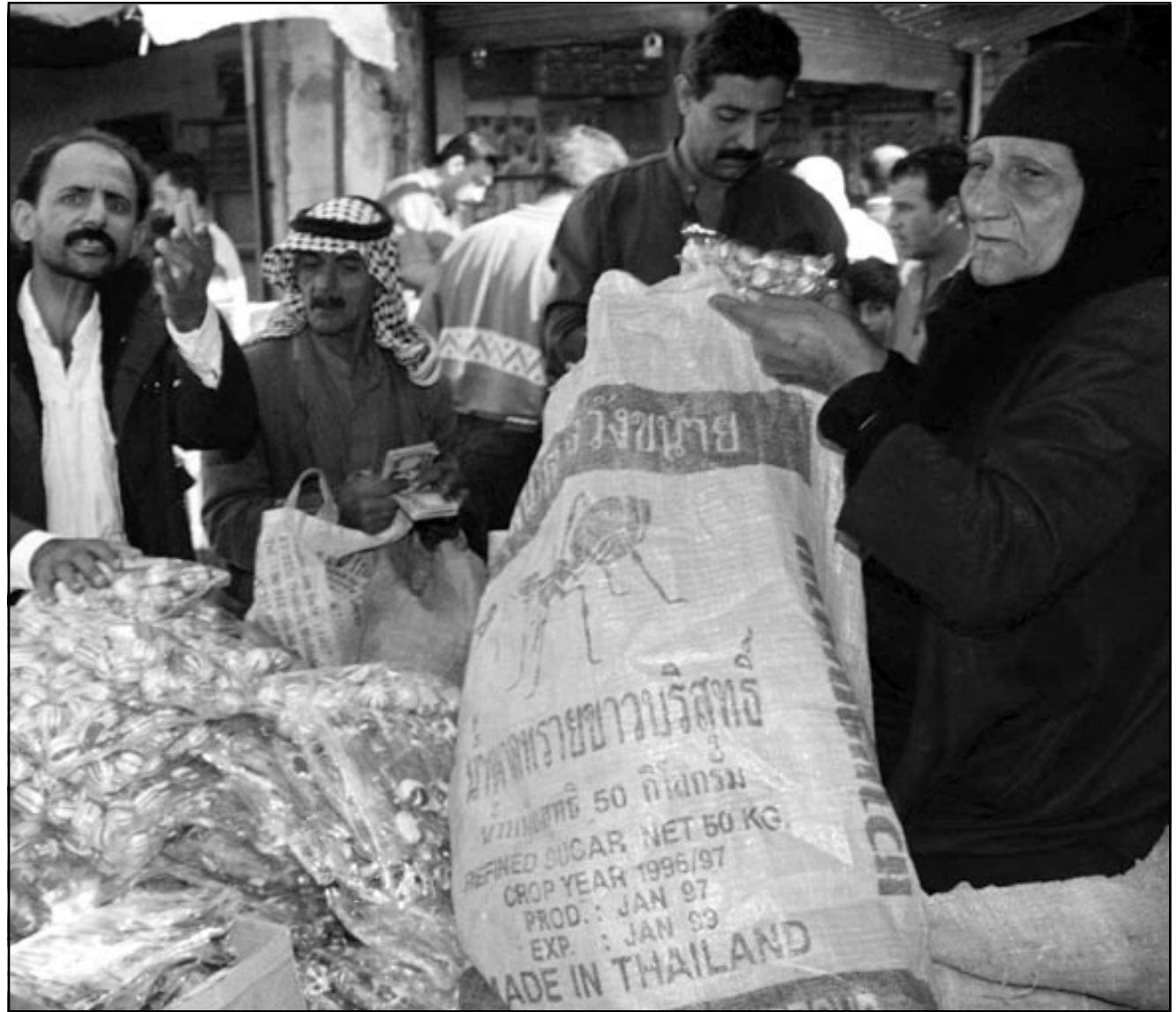
عراقيون يتسوقون في بغداد