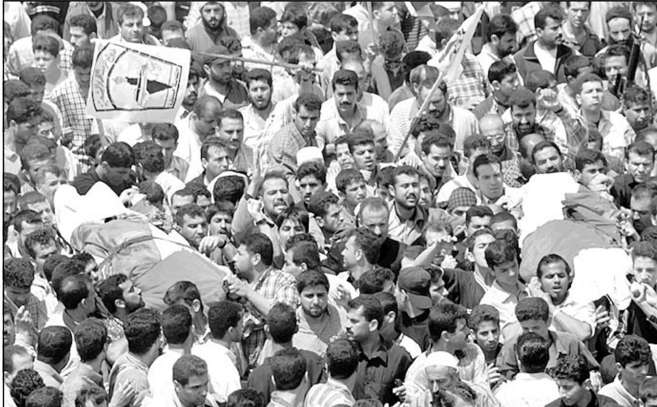
عشرات الالاف يشيعون شهداء فتح في رفح