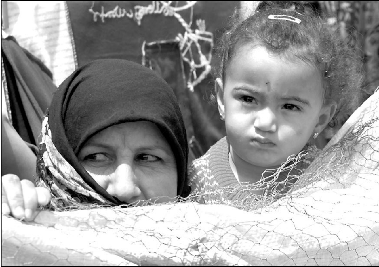
طفلة فلسطينية ترافق مع امها جنازة مشتركة لاربعة شهداء من كوادر حركة فتح في منطقة رفح

واشنطن - «القدس العربي»: ذكر مسؤولون امريكيون أن الولايات المتحدة تنوي ضم حركة «فتح» التي يتزعمها الرئيس الفلسطيني ياسر عرفات الى لائحة «الارهاب» التي ستصدرها وزارة الخارجية الاسوي المقبل. وقال المسؤولون لصحيفة «يو اس اي توداي» انه للمرة الاولى فان التقرير السنوي لوزارة الخارجية الامريكية بشأن «الارهاب» سيشير الى حركة فتح وتنظيم الشبيبة التابع لها، والذي تشير اليه اسرائيل باسم «التنظيم». وتتهم اسرائيل قيادة فتح في الاراضي المحتلة بالمشاركة في العمليات العسكرية ضدها اثناء الانتفاضة الفلسطينية الحالية. وذكرت الصحيفة ان الجماعتين لن توصفا بانهما «منظمة ارهابية اجنبية»، وهو توصيف يستتبعه ان تنهي الولايات المتحدة العلاقات معها. وتلت الصحيفة عن المسؤولين الذين لم تذكر اسماءهم قولهم ان التقرير لن يتطرق بشكل مباشر الى مسألة هل امر الرئيس الفلسطيني ياسر عرفات او مسؤولون فلسطينيون بارزون اخرون بشن هجمات على اسرائيليين. ويحت الرئيس الامريكي جورج بوش الاسرائيليين والفلسطينيين على ممارسة ضبط النفس وبحث الشهر الماضي برسالة قوية الى عرفات حثه فيها على