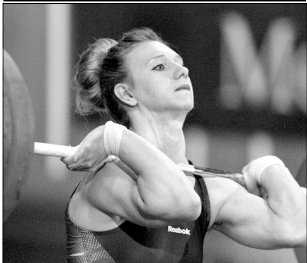
فالنتينا بوبوف الاربعة الروسية فازت بالميدالية الذهبية لوزن 63 كيلو غراما في بطولة دفع الاثقال الاوروبية التي اقيمت في تريانس (سلوفاكيا) امس (1 اف ب)

وخرجت بالتيمنور عن بكرة أبيها يوم الاحد الماضي للاحتفال بفوز عبد الرحمن بالضربة القاضية في الجولة الخامسة على بطل العالم السابق في الوزن الثقيل لينوكس لويس في المباراة التي جرت بينهما في براكينان بجنوب أفريقيا. وجاء فوز عبد الرحمن بالضربة القاضية في الدقيقة الثانية من الجولة الخامسة بعد ان كان فوز لينوكس متوقعا على نطاق واسع من اكبر المفاجآت في عالم الملاكمة. وعكر الحادث يوم تكريم عبد الرحمن في بلدية المدينة حيث اهداه رئيس البلدية مارتن أواملي مفتاح المدينة واعلن ان اليوم يوم عبد الرحمن. وقال عبد الرحمن «هذا يوم بالتيمنور. لقد انجزنا هذا معا. كانت بالتيمنور على الدوام في ذهني وأنا العيب هناك».