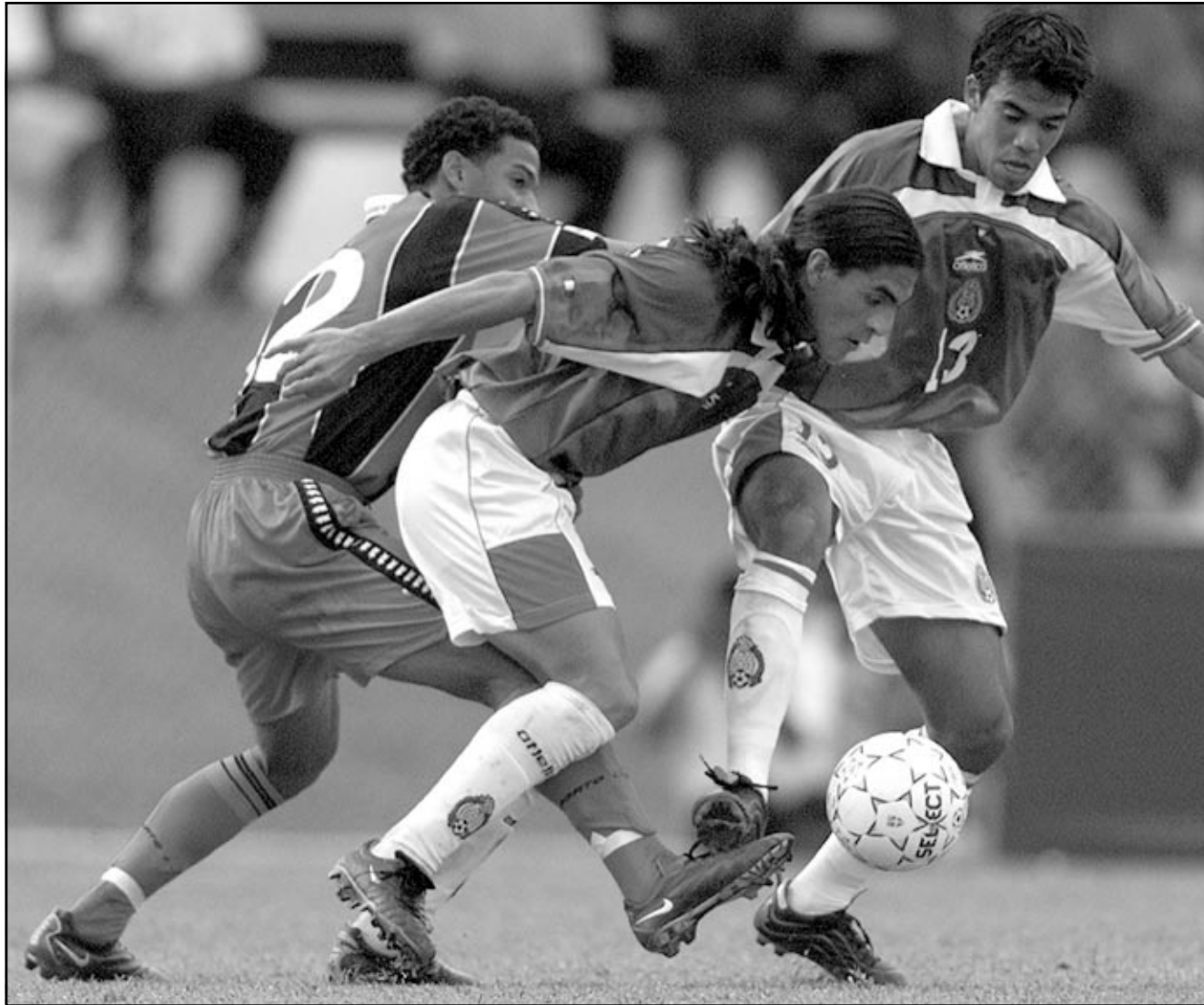
فرانسيسكو بلنسية لاعب المكسيك (في الوسط) خلال المناظرة على الكرة مع لاعبي ترينيداد وتوباغو