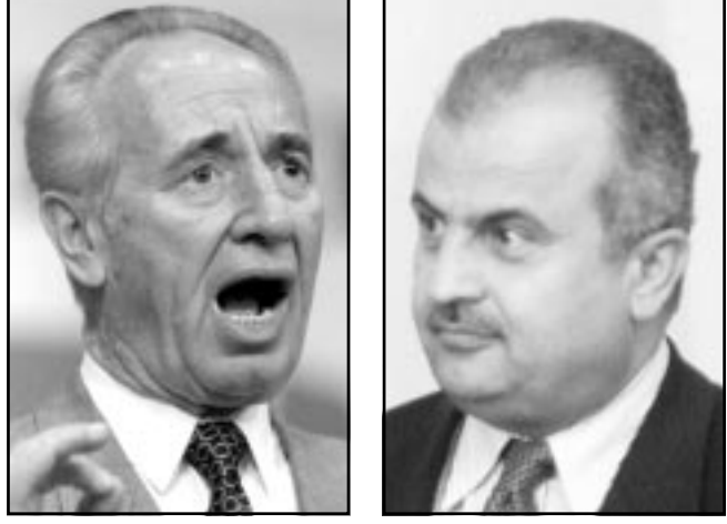
شعرون بيريس وعبد الاله الخليل

وفي الأثناء يبدو ان خلافاً بينه وبين مستوى التنسيق الأردني الفلسطيني بروز خلال الساعات الأخيرة الماضية، ففي الوقت الذي كان فيه الرئيس المصري حسني مبارك يعلن من وسانيا بأنه مستقبلي بيريس قريباً في القاهرة لبحث المبادأة كان الزوران الرفاعي والخليل يعطيان في عمان معا بانهما لايمتلكان أي معلومات عن زيارة وشيكة للقاهرة وعلان سيقوم بها بيريس.