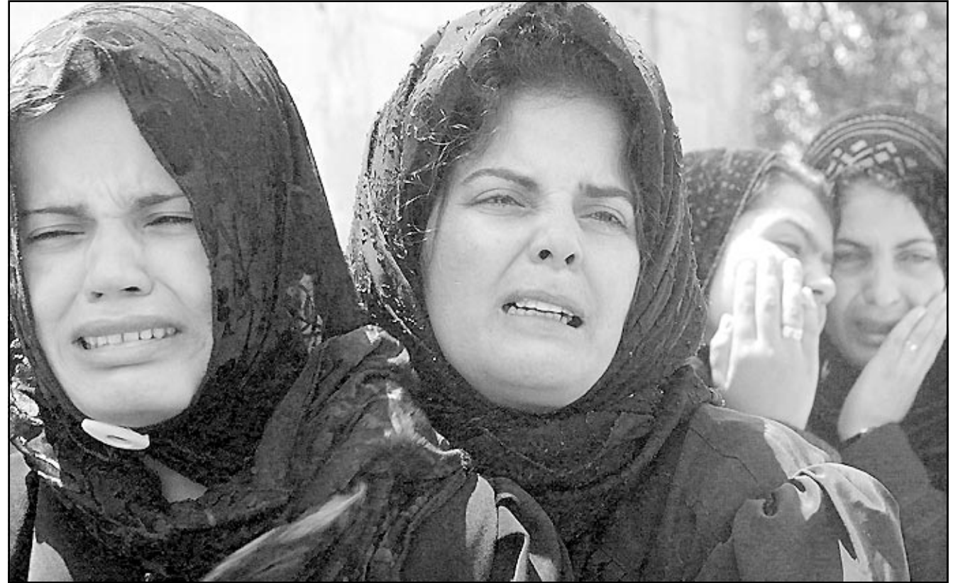
قربيات الشهداء يبكين اثناء التشييع