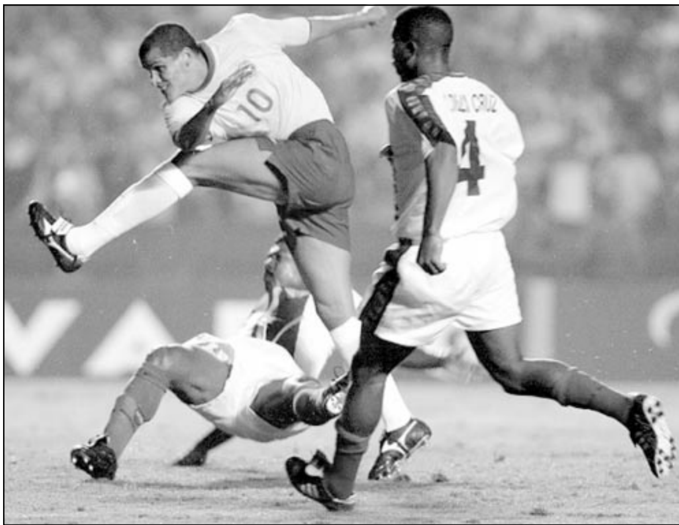
لقطة من إحدى مباريات منتخب البرازيل (صورة من الأرشيف)

واضاف ان التأجيل يعود الى فسح المجال امام البرازيل، بطولة امريكا الجنوبية، للمشاركة في كأس القارات المقررة في اليابان وكوريا الجنوبية