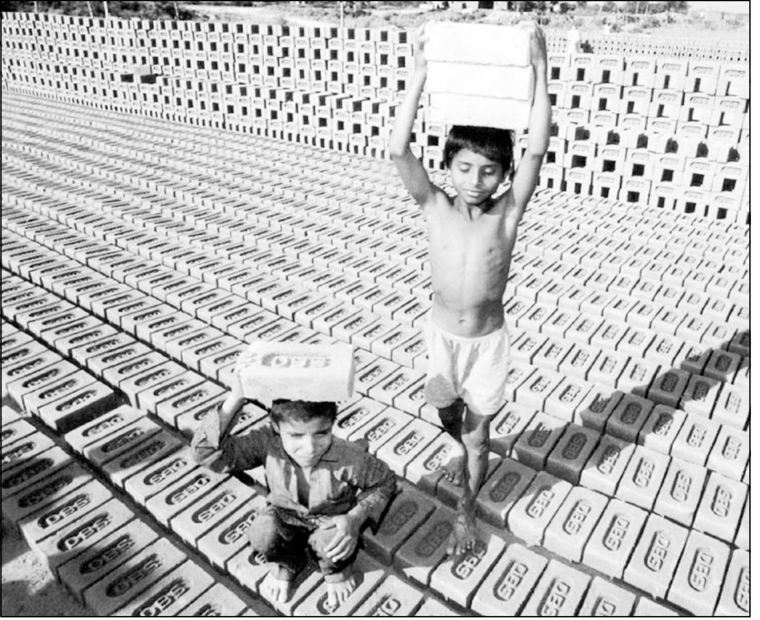
مطلان، نديان يعمان في مصنع للطلب حيث لا يتجاوز الاجر اليومي للعمال البالغين دولاراً واحداً