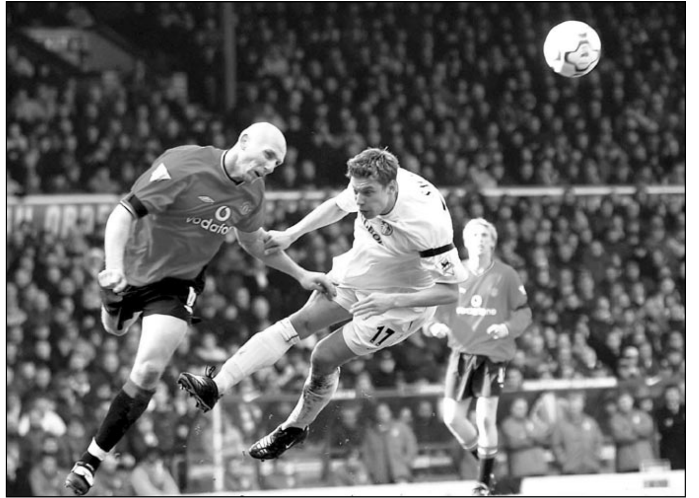
لقطة من إحدى مباريات ليدز يونايتد