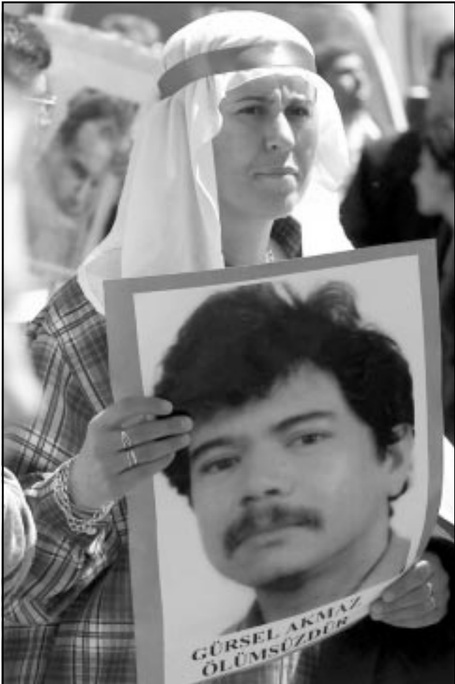
فتاة تركية تحمل صورة سجين مهدد بالموت بسبب الاضراب عن الطعام أثناء مظاهرة في انقرة أمس