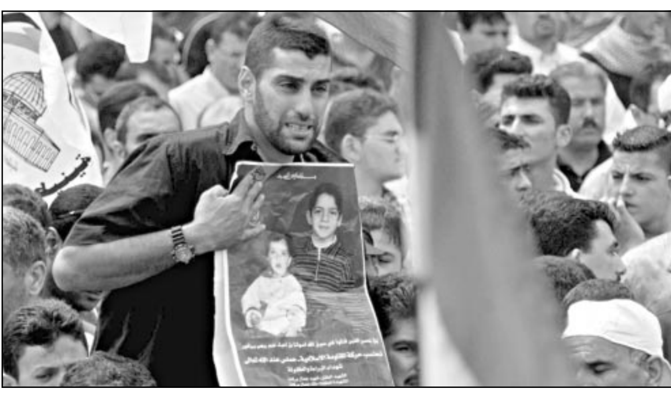
والد الطينين اللذين استشهدا بانفجار رام الله يحمل صورتهما أثناء تشييع جثمانهما

الى ذلك افاد تقرير نشرته إحدى الصحف العبرية الصادرة أمس ان السلطة الفلسطينية تقوم بنشاطات استخبارية لتعقب تحركات بعض الضباط في الشرطة الإسرائيلية. وتكرت صحيفة «معاريك» الصادرة أمس ان السلطة الفلسطينية طلبت من بعض عناصرها التخفي وجمع معلومات حول تحركات ضباط كبار في الشرطة الإسرائيلية. وقد اتضح ذلك من تحريات خاصة قامت بها الشرطة الاسرائيلية.