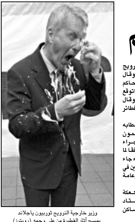
وزير خارجية النرويج ثوربيرون ياجلاند ويمسح آثار الفطيرة على وجهه

الاسرائيلية بالتورط في قتل الاسرائيلي عوفى راحوم (16 عاماً) الذي وجد مقتولاً بالرصاص في كانون الثاني (يناير) الماضي قرب رام الله. وسقط الى جانب القاضي في الانفجار نفسه صبي في الثامنة من العمر اضافة الى شقيقته وهي في الثالثة من العمر.