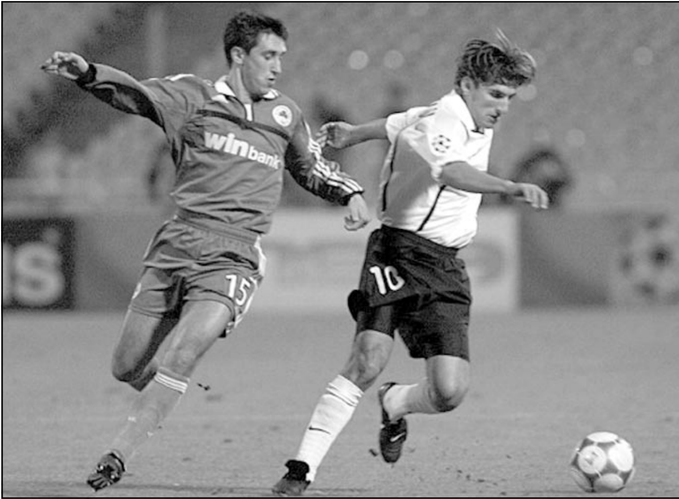
... وأخرى من إحدى مباريات فالنسيا