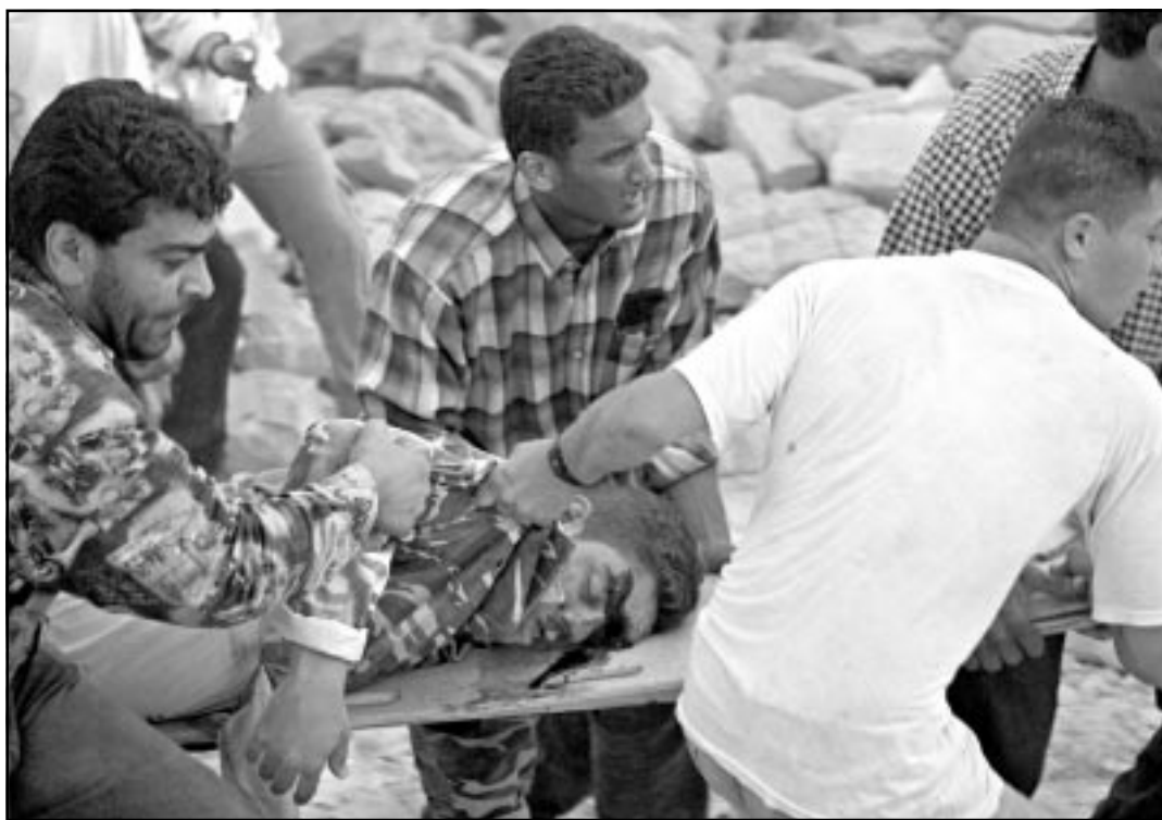
فلسطينيون يحملون شهيدا من تحت انقاض منازل دمرتها الطائرات الاسرائيلية في نابلس امس