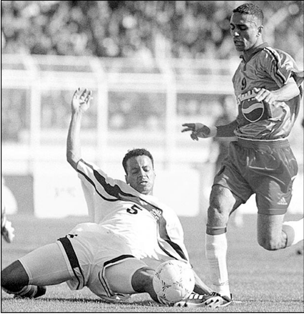
لقطة من إحدى مباريات فريق الشباب السعودي

يهدف ذهبي احرزها هاو هاي دونغ في الدقيقة التاسعة بعد المة من المباراة التي حضرها جمهور قليل لا يتعدى بضعة آلاف. وكان الداليان هو البادئ في التسجيل بهدف البرازيلي اورلاندو في الدقيقة السابعة عشرة اثر ضربة رأسية من وضع طائر انتهت بها كرتة على يمين الحارس الياباني.