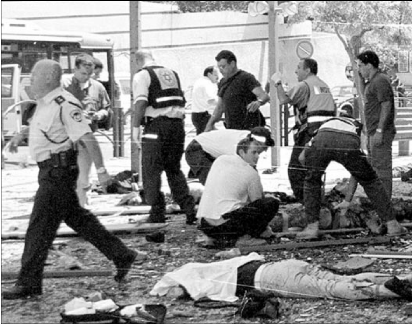
رجال اسعاف يتفقدون جثث القتلى الاسرائيليين خارج مجمع للتسوق في נתانيا