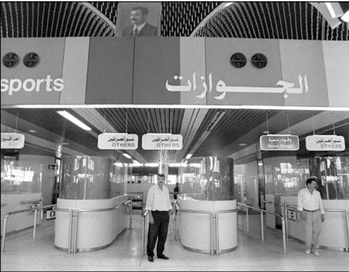
قاعة وصول الركاب في مطار صدام الدولي

الخصص لها، الا انني سرعان ما اكتشفت انه مهجور او «مجنون منظر» فقط. خارج مبنى المطار، وبعد المرور من لوحة المشغرات المعادية لأمريكا والمشيقة بالرئيس العراقي، استقبلنا النخيل البغدادي، نخيل في كل مكان، ما زالت جذوعه منضبة في شيوخ قديم، كيف استطاع النجاة من قاتل أمريكا الغيبية والذكية والمتوسطة الذكاء.