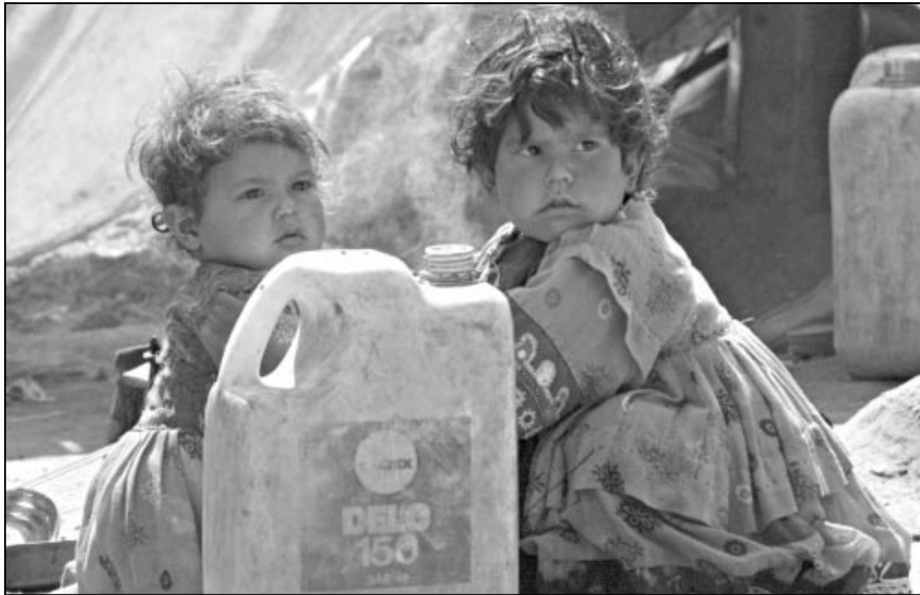
صورة من الترفيه تعبر بوضوح عن معاناة الاطفال في مخيمات اللاجئين الافغان

اسلام اباد - جنيف - اف ب - رويترز: حثت الامم المتحدة الجمعة الاطراف المتحاربة في افغانستان على وقف اطلاق النار لمدة ثلاثة ايام اعتبارا من السبت للسماح بتطعيم اطفال هذا البلد ضد شلل الاطفال.