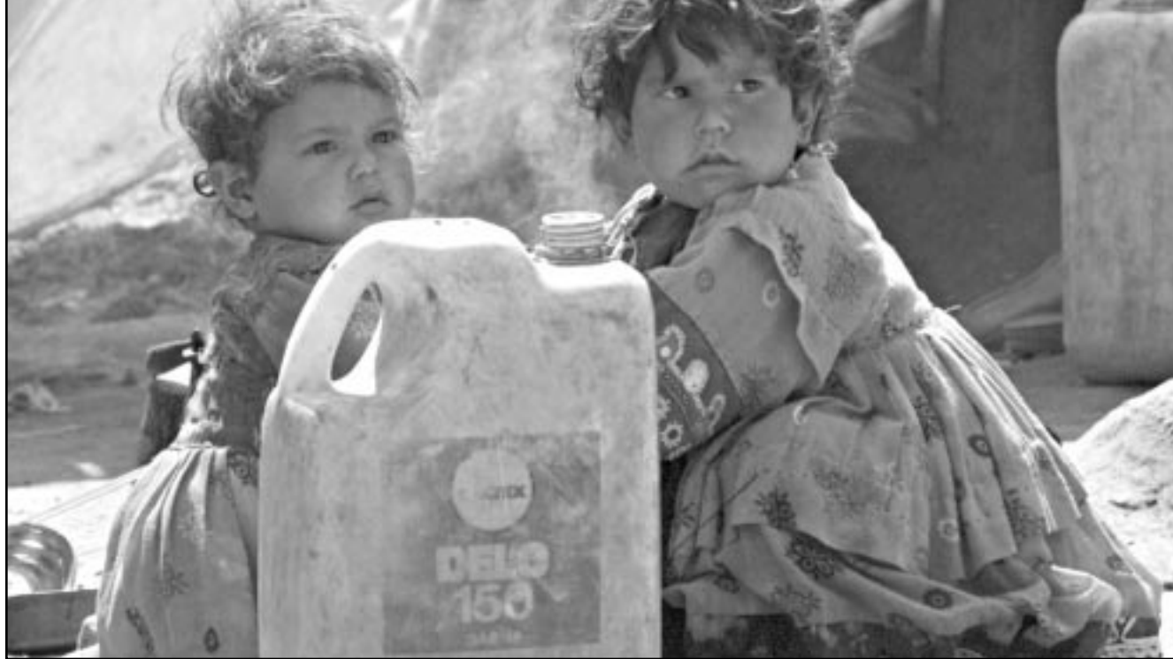
صورة من الترفيه تعبر بوضوح عن معاناة الاطفال في مخيمات اللاجئين الافغان