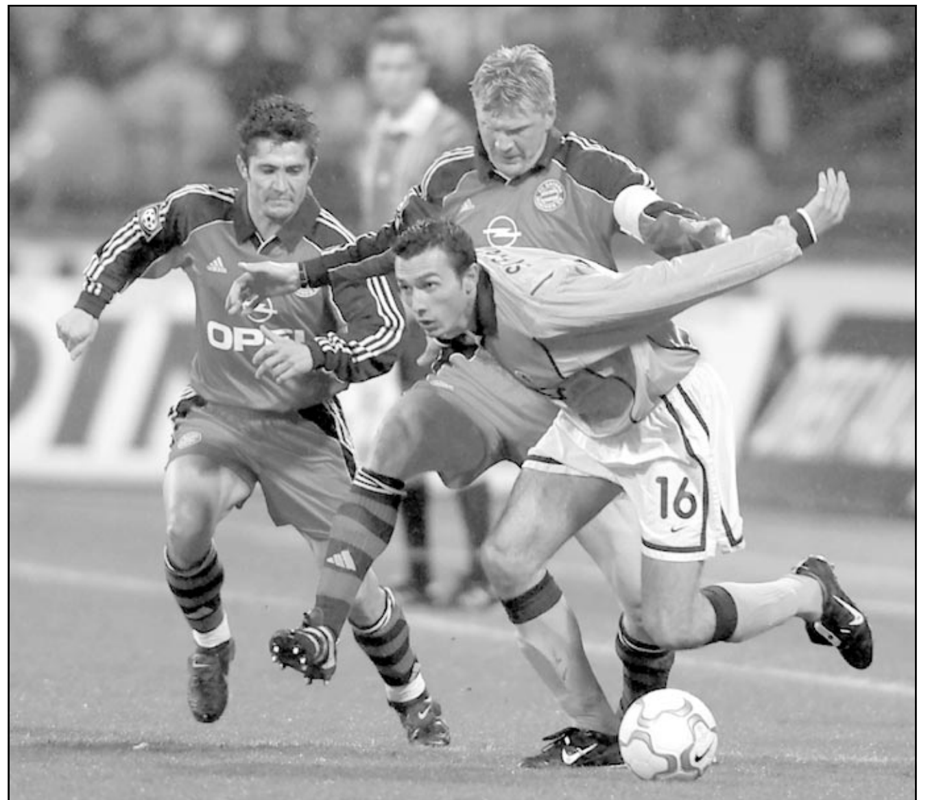
لقطة من إحدى مباريات بايرن ميونخ