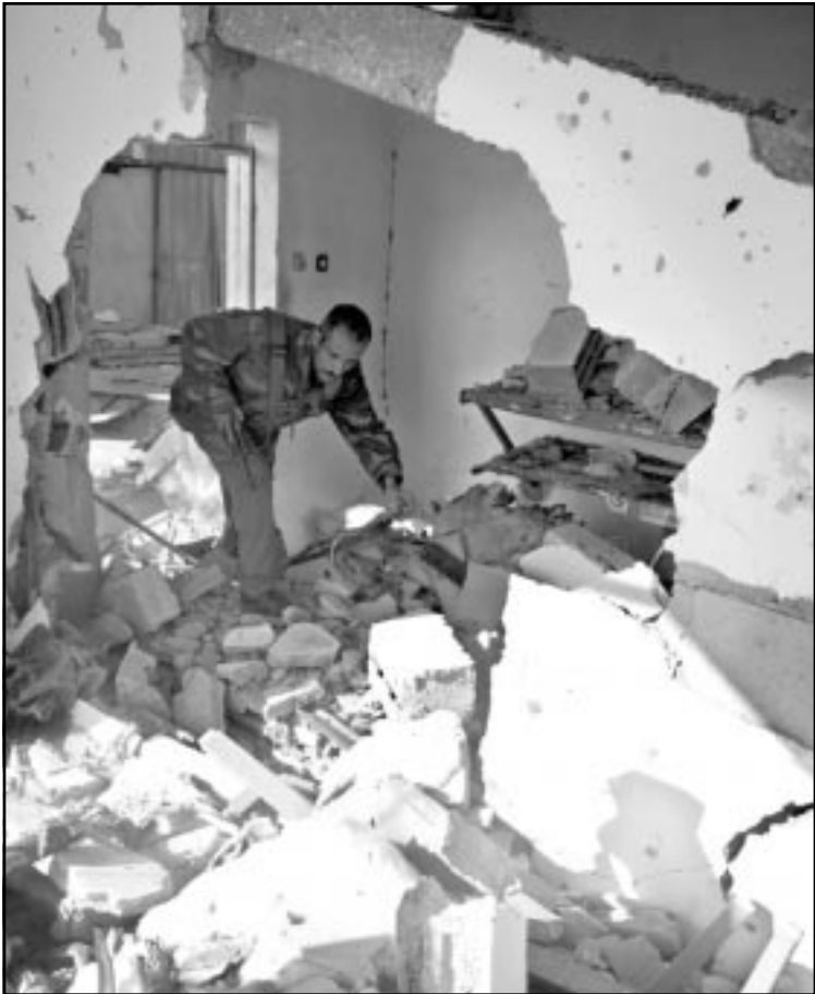
شرطي فلسطيني يبيد بين انقاض مركز الشرطة في جنين والذي دمته الغارات الاسرائيلية

الشرطة، وقد أخذ مسؤولية التحقيق على عاتقه قائد المنطقة الوسطى، اسحق ايتان. وبدأت الاستخبارات العسكرية والخبرات العامة كل في تحقيق داخلي لتسلسل الاحداث لفحص كيفية وقوع الخلل.