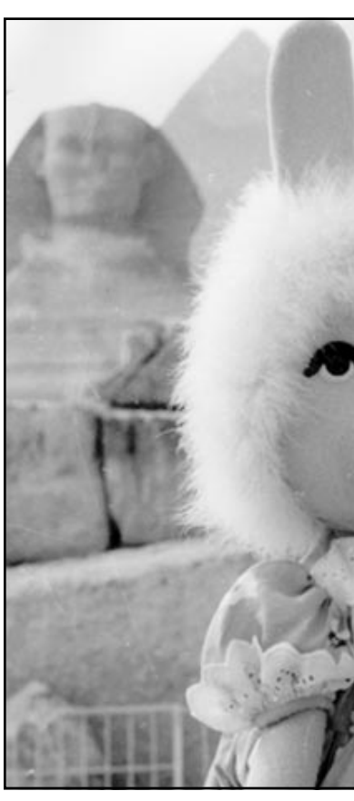
لقطة من مسلسل «بوجي وططم»

■ كيف بدأت زمة مسلسل «بوجي وططم»؟ ■ منذ فترة، عندما طلبوا مني ان اتوقف عن تأليف المسلسل والاختفاء فقط باخراجه. لاسف المسؤولين في T.V نسوا انني مندع في الاصل، وعندما رفضت هذا الطلب قاموا بالغاء حلقات «بوجي وططم» فوراً وعدم اذاعتها على الشاشة رغم انني أقدم هذه الحلقات منذ 18 سنة، ولا استطع تفسير ما حدث معي سوى انها مؤامرة تحاك ضد كل ما هو عربي، ولا فلماذا الخوا «بوجي وططم»، وعرضوا المسلسل الأمريكي المبدع «افتح يا سمسم».