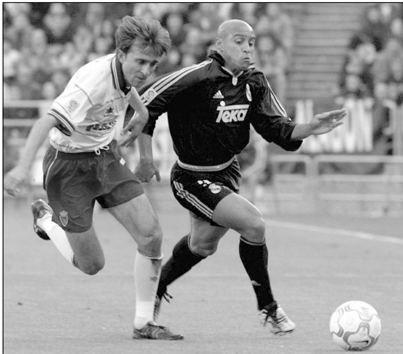
... وأخرى من إحدى مباريات ريال مدريد