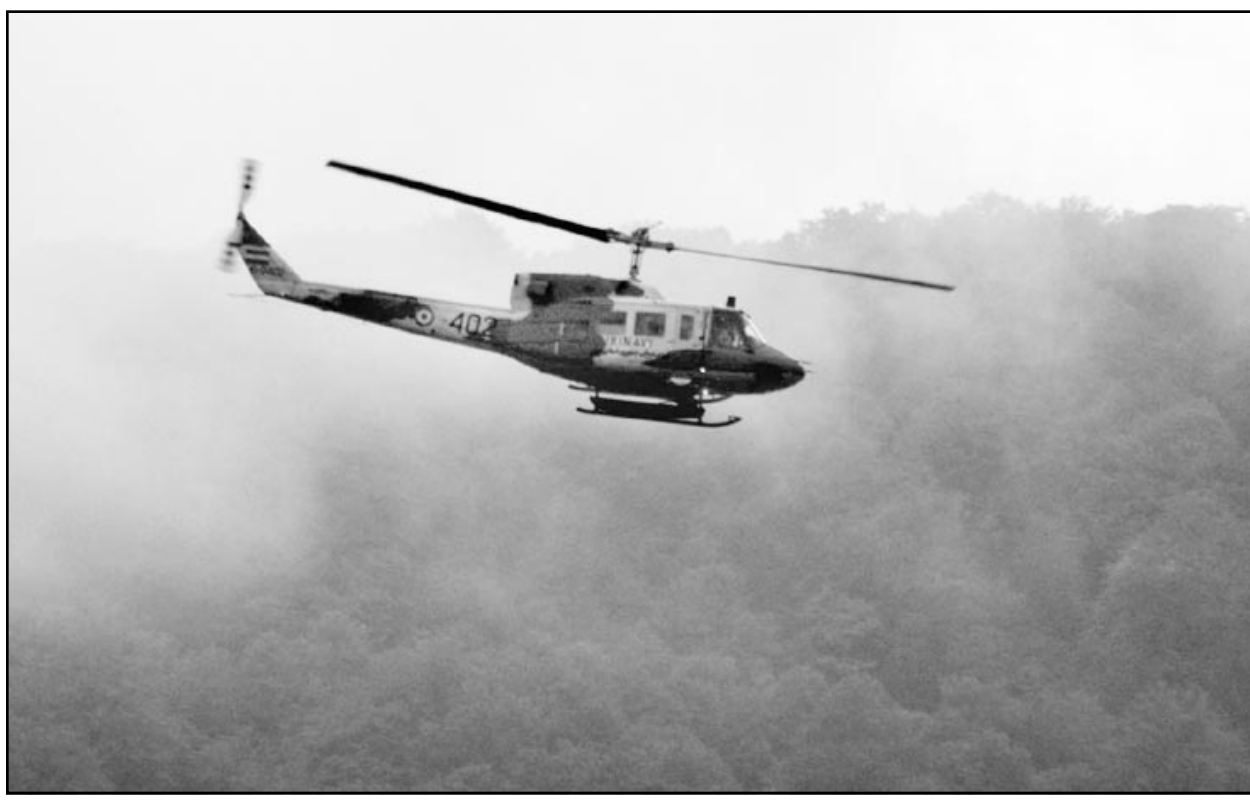
مروحية اغاثة تحلق فوق المسالك الوعرة التي انتشر بها حطام الطائرة المنكوبة بمنطقة خارتشانغ

ويرجع ان يتجنب الرئيس، كما تنوي جمعية علماء الدين المجاهدين وهو حزب الرئيس خاتمي، خوض المعركة الانتخابية مع رئيسها مهدي كرويبي رئيس مجلس الشورى الذي يطغى عليه الاصلاحيون (اف ب)