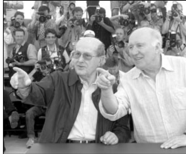
المخرج البرتغالي أمانيول دي أولفيرا (يسار) والممثل الفرنسي ميشيل بيكولي (روبرتز)