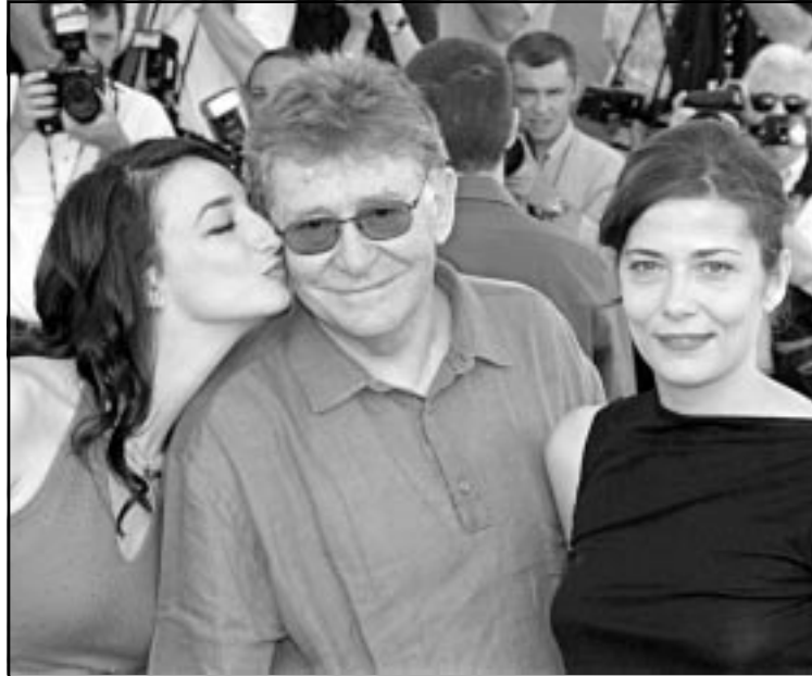
المخرج الإيطالي ارمانو أولمي ومحاطا بساندرا كيتشاريلي (يمين) والمطلة البلغارية ديسي (روبرتز)