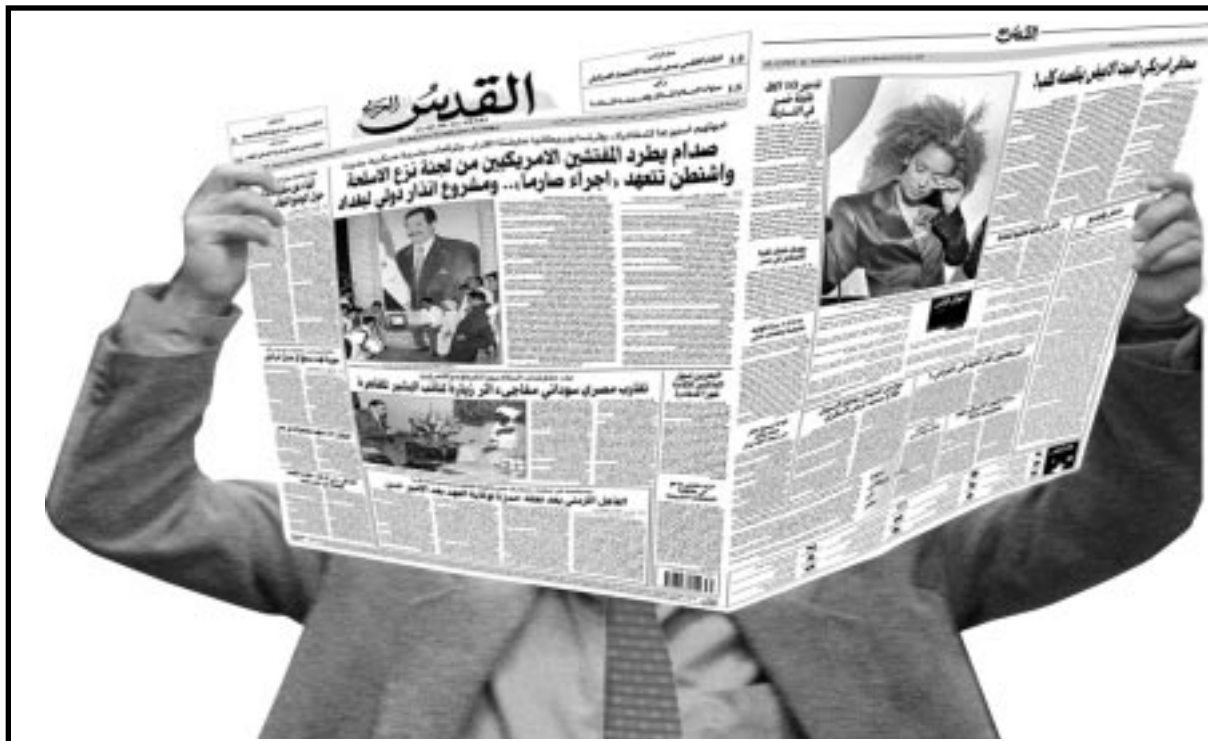
صحيفة الخبر الموضوعي، والرأي المستقل، والثقافة الجادة

وتشارك روسيا في اجتماعات اوبك منذ عام 1998 عندما تعاون منتجوا النفط اللاتشال الاسعار من ادنى مستوياتها في عقد، الا ان روسيا لم تف بعهدها لتخفض صادراتها تماشيا مع تخفيضات حصص امدادات اوبك تاركة احجام صادراتها تتراجع حسب انماط الطلب المحلي.