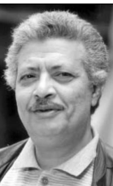
محمود رحمي (القدس العربي)

الاحوال بل ان مردودها سيئ وسلي جدا على حياة اطفالنا خاصة عندما يكبرون لانها تزخر فيهم روح العنوانية والصراع على تدمير حياة البشر. وكل نكد مرفوض على الاقل في بيئتنا الشرقية التي تنادي بالاخاء والتعاون وليس القتل والموت والتدمير.