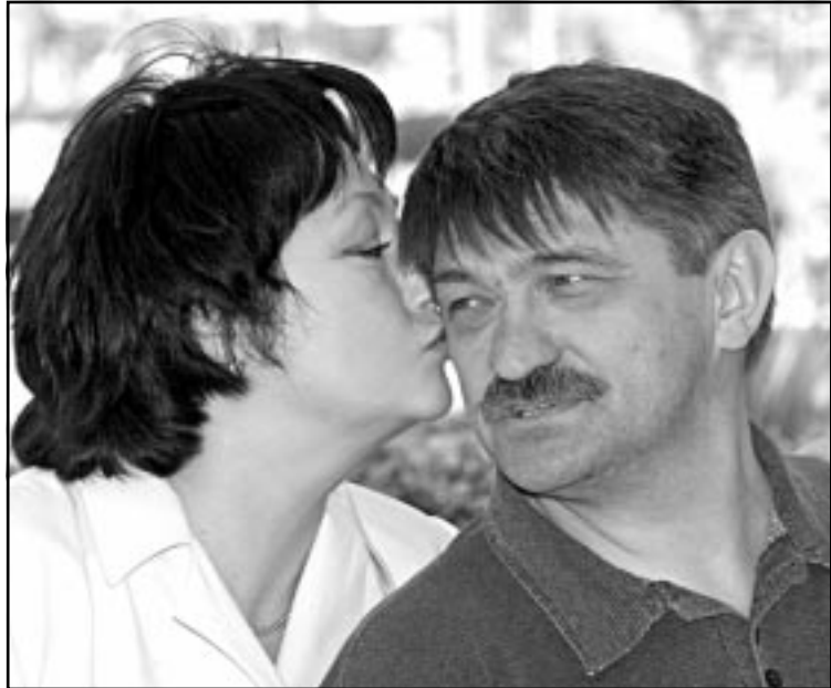
المخرج الروسي الكسندر سوخوروف والمثلة ماريا كوزنتسوا (روبرتز)