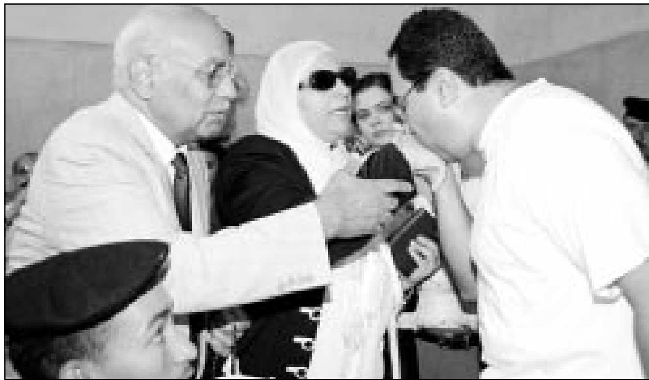
الفيلاي يقبل يد والدته بعد اعلان براءته في القاهرة أمس (رويترز)