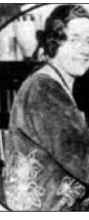
اغانا كريستي في شبابه

في عام 1928 ركبت الكاتبة كريستي قطار الشرق السريع واوربت اكسبريس» وتوجهت الى بغداد بهدف التعرف على الشرق الاوسط. زارت اثناء رحلتها الاولى الى العراق مدينة اولوك التاريخية في منطقة ما بين النهرين. انبهرت باضرحه الملوك التي تم العثور عليها هناك، ولهذا قررت الرجوع مرة اخرى الى العراق. خلال رحلتها الثانية الى العراق المؤرخة في عام 1930 تعرفت الكاتبة على عالم الآثار ماكس مولوان وتزوجته. كانت اغانا كريستي (ولدت عام 1910 وتوفت عام 1976) ولا تزال من اشهر مؤلفي الروايات البوليسية في العالم. ترجمت قصصها التي بيع منها 2 مليار نسخة الى 44 لغة من بينها اللغة العربية. من اشهر مؤلفاتها التي ترجمت الى اللغة العربية «جريمة قتل في قطار الشرق السريع» و«جريمة قتل على النيل».