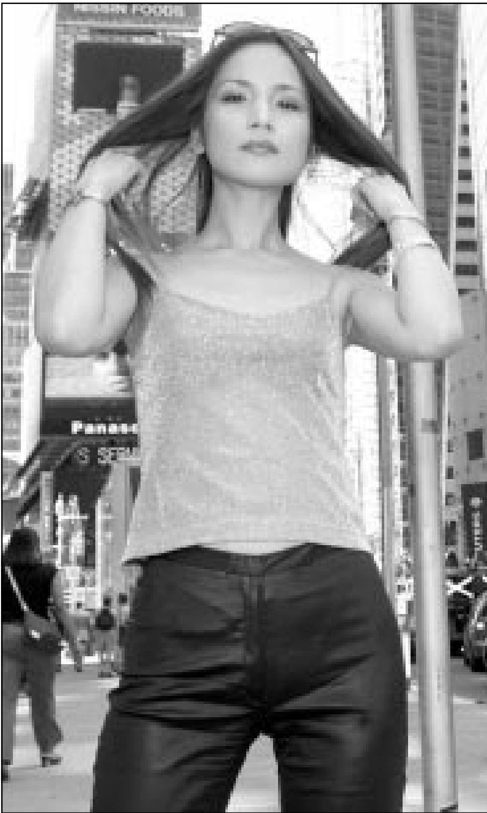
نخمة الغناء اليابانية اكيكي كاكايهارا قامت بزيارة مدينة نيويورك لتسجيل البومها الجديد (رويتز)

ميريك يصنع هذه النعال الخشبية منذ 47 عاما ويتذكر انه كان يحصل على 1.50 جنيه استرليني (دولارين) مقابل 12 قبقابا خشبيا يسبسون من الجدل وكعبص بحدوات من الحديد. وقبل ثلاثة عقود كان يبيع 500 زوج من القباقيب اسبوعيا لشركة فورد لصناعة السيارات ليرتديها العمال في المصنع. قال «كان هذا قبل اختراع ما يسمى الروبوت (الانسان الالي) كنا متخضين بالعمل وقتئذ». وحاليا يبيع ميريك القباقيب بما بين 30 جنيتها 42 دولارا) و50 جنيتها وهو يصنع نحو 100 زوج في الاسبوع وان كان باستطاعته تجميع أجزاء قبقاب في بضع دقائق.