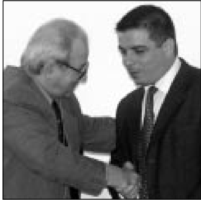
رئيس الدائرة السياسية لمنظمة التحرير الفلسطينية يصاحف وزير الخارجية الكوبي (رويترز)

ممثل الأمين العام للأمم المتحدة كوفي عنان في الاجتماع قائل ان الأمم المتحدة «تقدّم الجهود التي تبذل من أجل مساعدة الشعب الفلسطيني» وتشارك في هذا الاجتماع الذي سينتهي اليوم الخميس وقود رسمية من دول عدة بالإضافة الى جامعيين.