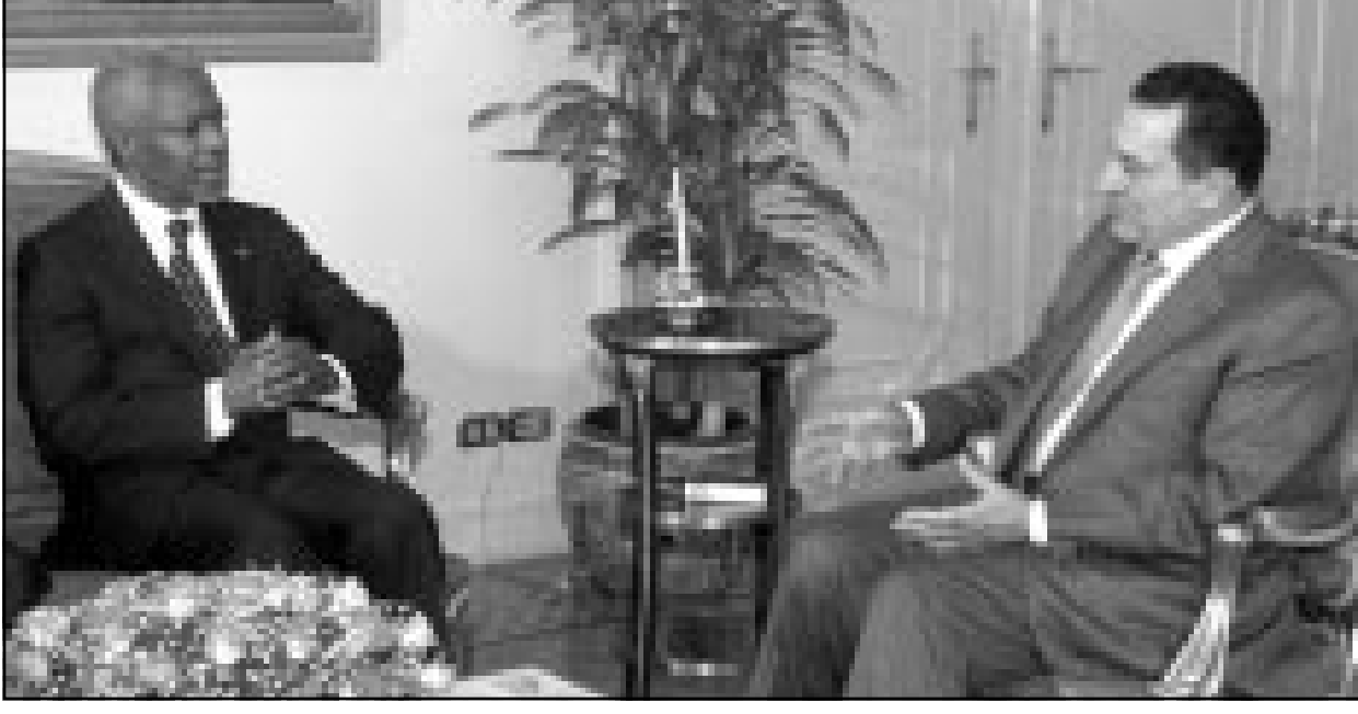
الرئيس المصري حسني مبارك لدى اجتماعه مع الأمين العام للأمم المتحدة في القاهرة أمس

2000 لتأكيد انسحاب القوات الإسرائيلية من لبنان بعد احتلال استمر 22 عاما. وهو ثاني لقاء بين عنان والاسد. وقد زار عنان دمشق قبل عام ليقدّم التعازي للرئيس السوري الراحل في اوجاعه.