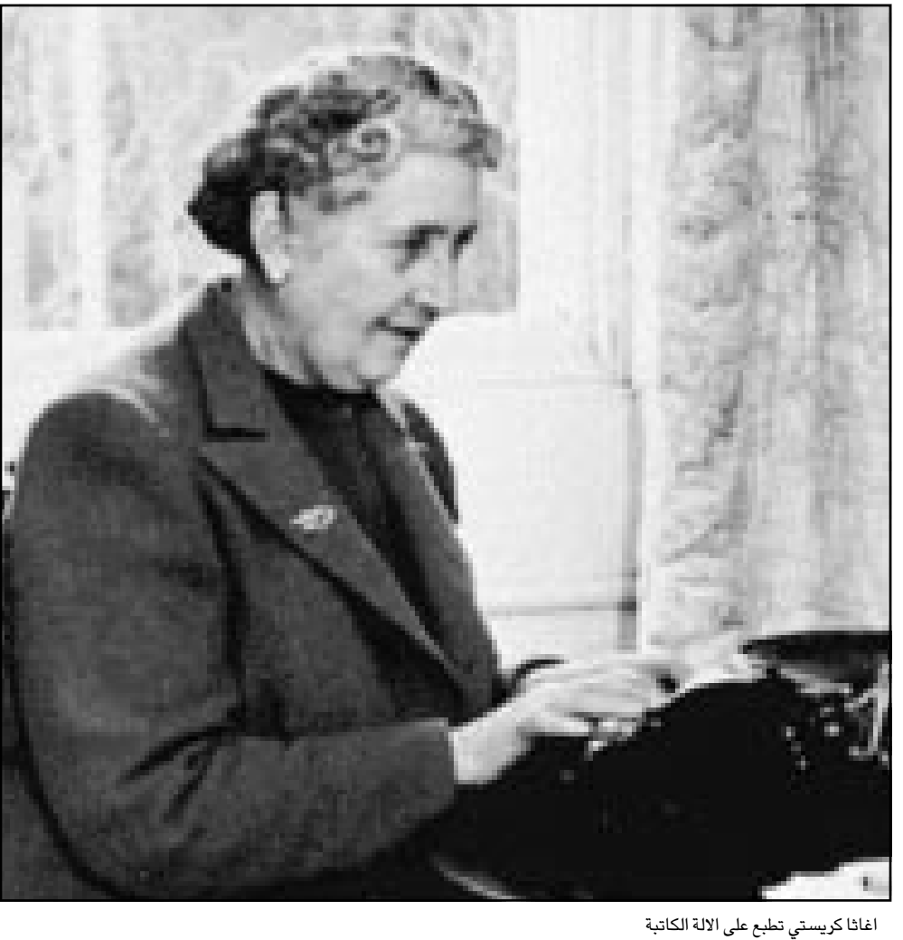
اغانا كريستي تطبع على الالة الكاتبة