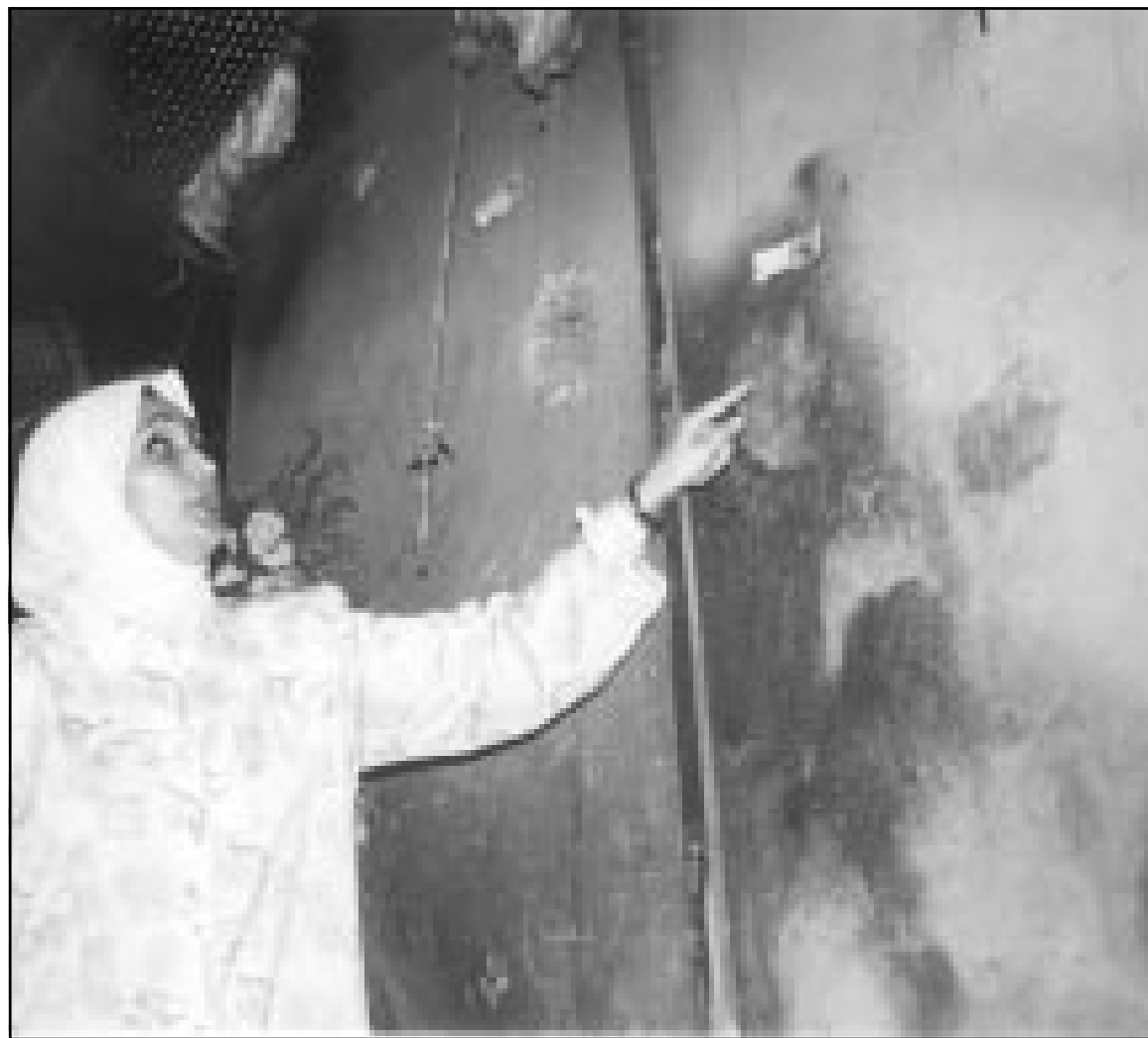
الفتحة التي احديتها سقوط الصاروخ الامريكي على ملجأ العامرية في بغداد والى اليسار اثار جثة محترقة لسيدة تحمل طفلها وقد التصقا على الجدران من شدة الحرارة

لكن عنان قال انه منذ تقريره السابق في هذه المسألة الحساسة الذي قدمه قبل ستة اشهر لم يحدث مثل هذا التغيير في الموقف في بغداد، وأضاف انه كان هناك اهتمام خاص على مدى الاشهر السنة الماضية بالارشيف الوطني الكويتي لان الكويت «محرومة من الاطلاع على تفاصيل تاريخها وهو وضع مؤلم لأي دولة». واحتل العراق الكويت سبعة اشهر عقب غزوه لها في الثاني من اب (اغسطس) 1990 الى ان طرده ائتلاف