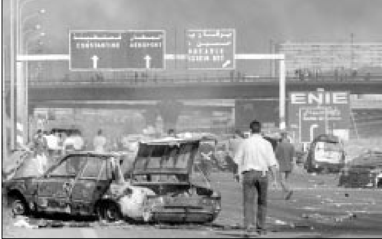
من آثار مواجهات يوم الخميس في الطريق السريع الرابط بين المطار والجزائر العاصمة

سكان «ساحة اول مايو» تجمعوا صباح الجمعة امام عماراتهم وحديثهم كله كان منسوبا حول المسيرة. بعض شاب من سكان الحي شارك في مظاهرة الاثنا عشرين، وقال لـ«القدس العربي» ان ما غاضبه هو عمليات الحرق التي لجأ اليها المتظاهرون فهددت ممتلكاتهم الى جانب تلفت المتظاهرين بعبارات نابية وباشارة مخلية بالحياء امام العائلات. وبينما كان عمال التنظيف والصيانة يعيدون ترتيب الوضع وغسل بقع زيتية تسربت من براميل زيت السيارات التي