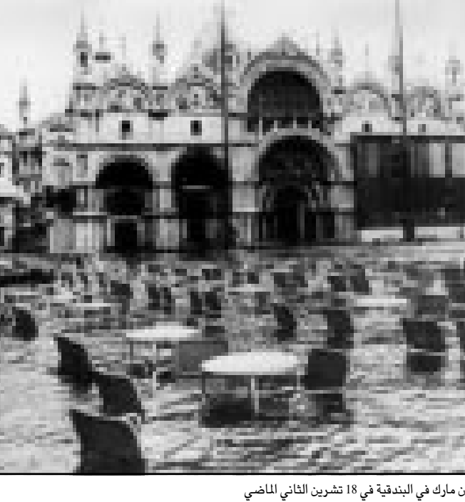
مياه المد تغمر ساحة سان مارك في البندقيه في 18 تشرين الثاني الماضي

القاهرة - «القدس العربي»: استعداد خاص يتم اتخاذه هذا العام للبدء في تنفيذ خطة العمل في مهرجان القاهرة السابع للاذاعة والتلفزيون. كتبت هذه الدورة اهميتها من الارواح الساخنة التي تعانيتها المنطقة العربية بسبب الممارسات الاسرائيلية المتعسفة في فلسطين المحتلة.. حيث تعكس دورة هذا العام صورة من صور التضامن العربي من خلال مشاركة جميع الدول العربية في فعاليات المهرجان. وقد ارسلت اللجنة العليا للمهرجان اكثر من 700 دعوة لحطات وشركات انتاج عربية للمشاركة في المهرجان هذا العام. كما تلقت ادارة المهرجان رسائل من جميع الدول العربية تقديرا بانها توافق على المشاركة في مسابقات المهرجان المختلفة.. حيث تشارك قطر بـ 14 برنامج في المهرجان