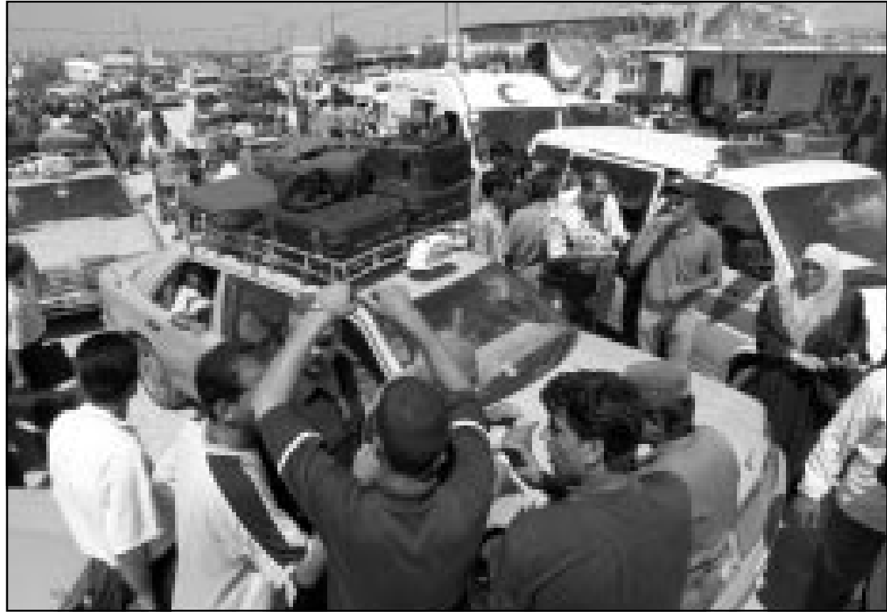
فلسطينيون ينتظرون دورهم على معبر رفح