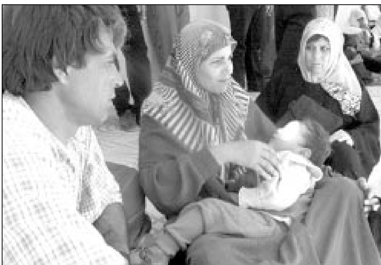
فلسطينية تحمل طفلها الجريح وتنتظر عند حاجز رفح السماح لها بالعبور الى مصر لعلاج