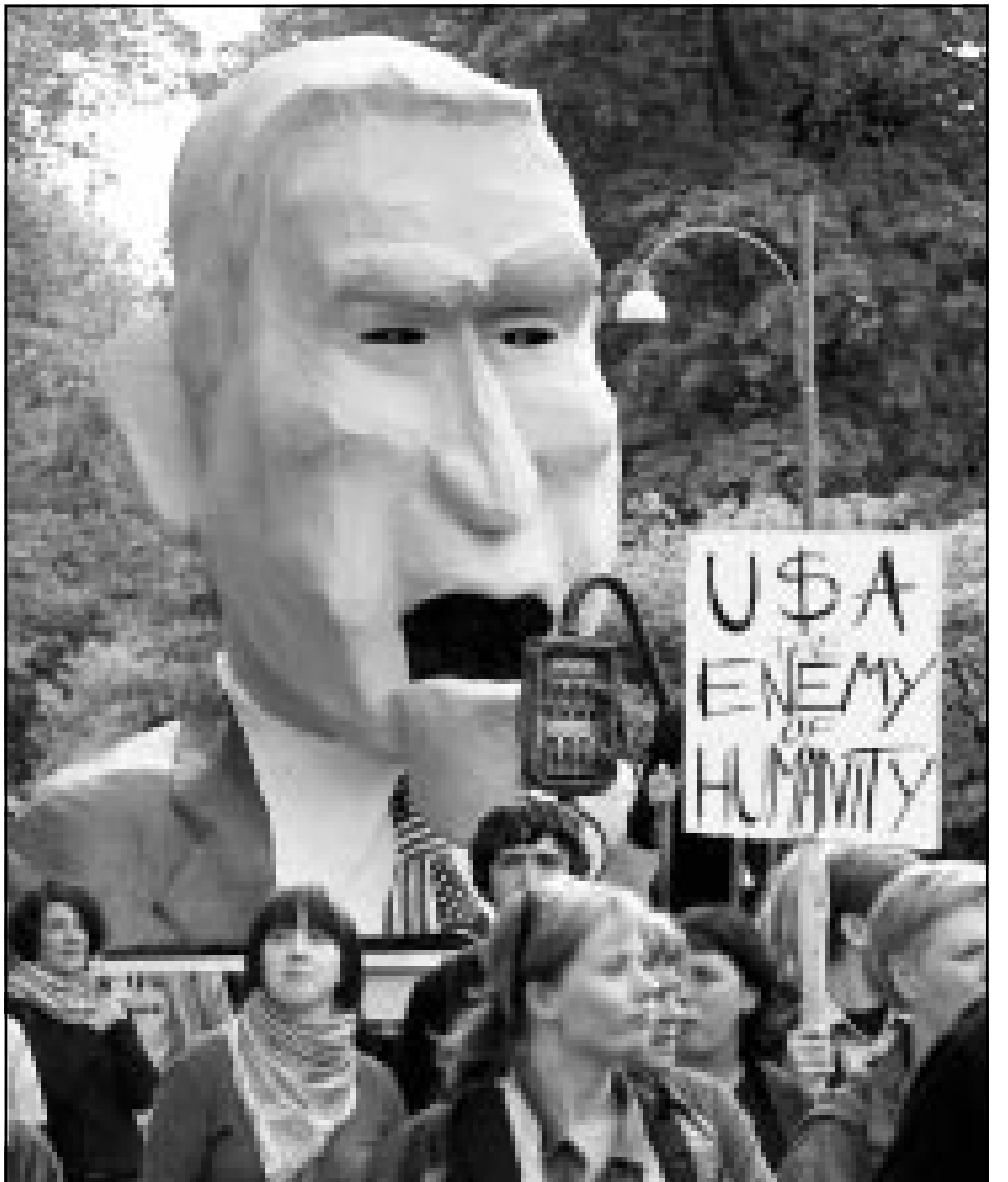
مظاهرات في غوتنبيرغ يرفعون مجسمات كاريكاتيرية للرئيس بوش الى جانب لافتة كتب عليها «الولايات المتحدة عدو الانسانية»

وستحاول البعثة الجديدة تهديد الطريق امام متابعة قضية التغيرات المناخية بعد المباحثات الفاشلة التي جرت العام الماضي في لاهاي عن التغيرات المناخية.