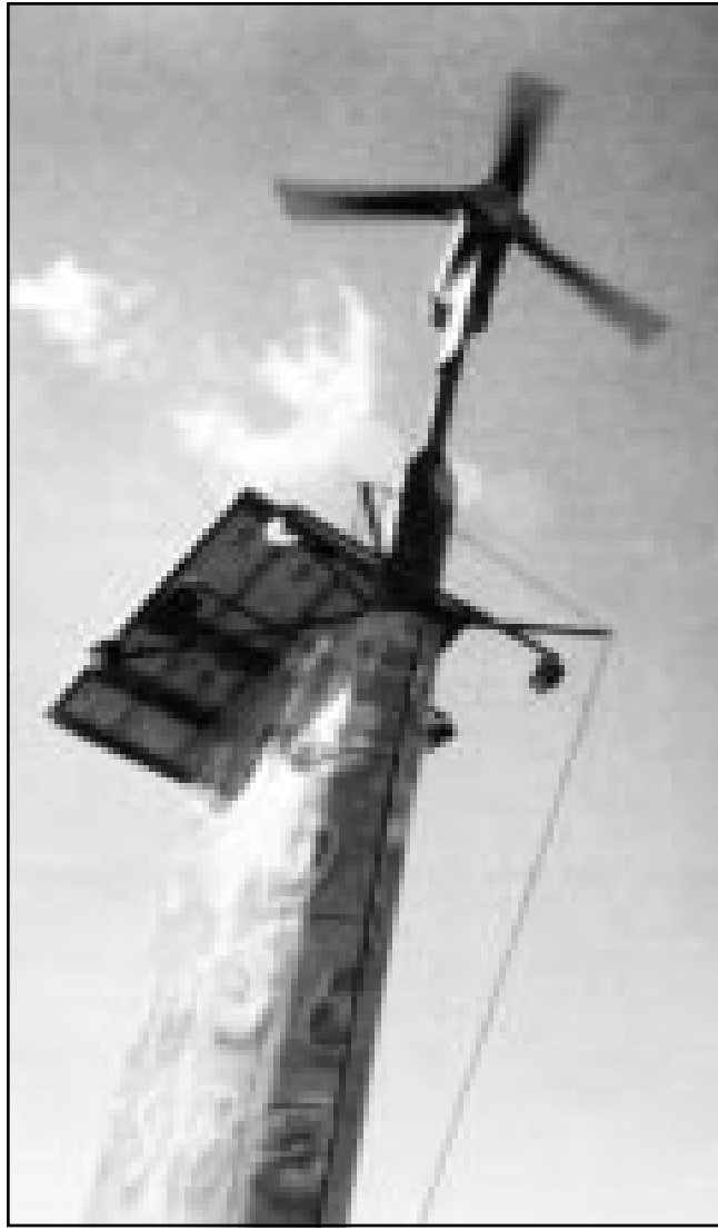
طاحنة هواء فوق سطح متجر لشركة سبيزيري ثبت عليها لوح لجمع الطاقة الشمسية

ومع ان الكثير من الشركات العاملة بانتاج تقنيات لتوليد الطاقة النظيفة لا تزال تسجل خسائر مما دفع اسعار اسهمها الى الهبوط