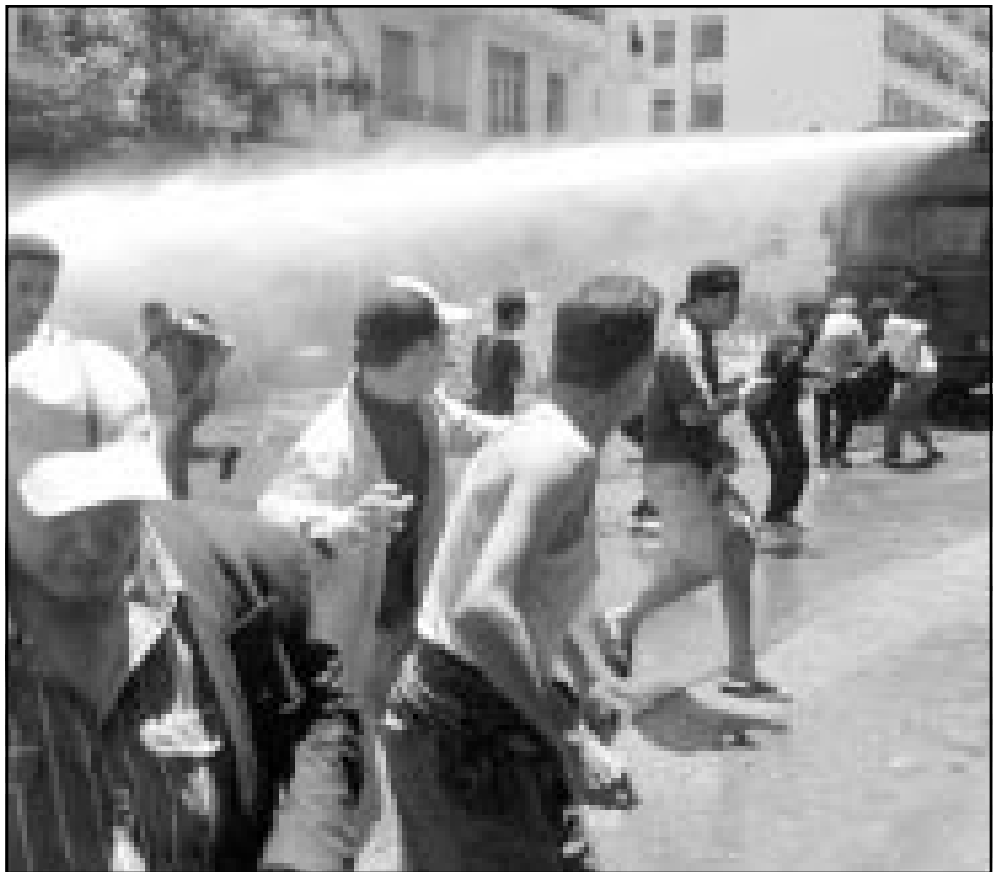
شبان غاضبون يقامون شرطة التدخل التي استعملت الغازات المسيلة للدموع وخرابهم المياه الساخنة

واشنطن - الرباط - اف ب: دعت الولايات المتحدة يوم الجمعة جميع الاطراف الى ضبط النفس في اعقاب المواجهات العنيفة التي جرت الخميس بين متظاهرين وقوى الامن في الجزائر. وقال مساعد المتحدث باسم وزارة الخارجية فيليب ريك «ما زلنا قلقين جدا من جراء وقوع خنسات في تشجيع التكامل الاقتصادي عنف خلال تظاهرات جرت في الاضطرار الى ضبط النفس والسرعة في وقت العنف»، مشيرا الى ان «الحوار هو الوسيلة الفعالة لاحتجاجا على التوتر والرد على مظاهر القلق». وتحولت تظاهرة الخميس في الجزائر العاصمة احتجاجا على القمع في منطقة القبائل، والتي شارك فيها مئات الاف من الاشخاص، الى مواجهات اسفرت عن قتييلين و 168 جريحا كما ذكرت مصادر المستشفى. والقتيلان هما صحافيان كانا يغطيان وقائع التظاهرة، وذكرت ثالثا قتل على الأرجح لدى وقوعه من شاحنة كانت تقل متظاهرين. في ذلك، ذكرت صحيفة «رسالة الامة» المغربية يوم الجمعة ان اعمال