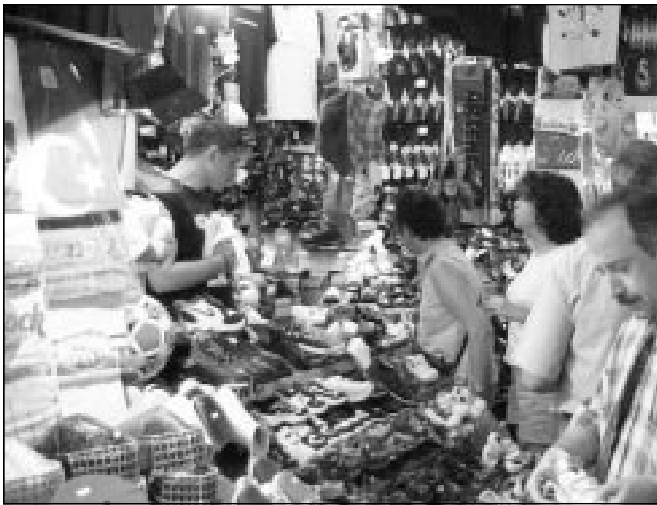
متسوقون في «البيازار المصري» أحد أشهر الأحياء التجارية في الجزء القديم من مدينة اسطنبول

«تحي هذه الخطوة التقييمية بعد تخلف المجموعة عن سداد العائد المستحق في الثامن من يونيو 2001 خلال فترة السماح التي تبلغ خمسة ايام من سندات التي تبلغ قيمتها 100 مليون دولار ويحين أجلها عام 2004.» وجاء في البيان الصادر عن مؤسسة التقييم «وبعد هذا التخليف عن السداد ومع اخذ مستوى مديونية المجموعة في الاعتبار فان فيتش ترى ان 2001 خلال فترة السماح التي تبلغ خمسة ايام من سندات التي تبلغ قيمتها 100 مليون دولار ويحين أجلها عام 2004.» وجاء في البيان الصادر عن مؤسسة التقييم «وبعد هذا التخليف عن السداد ومع اخذ مستوى مديونية المجموعة في الاعتبار فان فيتش ترى ان 2001 خلال فترة السماح التي تبلغ خمسة ايام من سندات التي تبلغ قيمتها 100 مليون دولار ويحين أجلها عام 2004.»