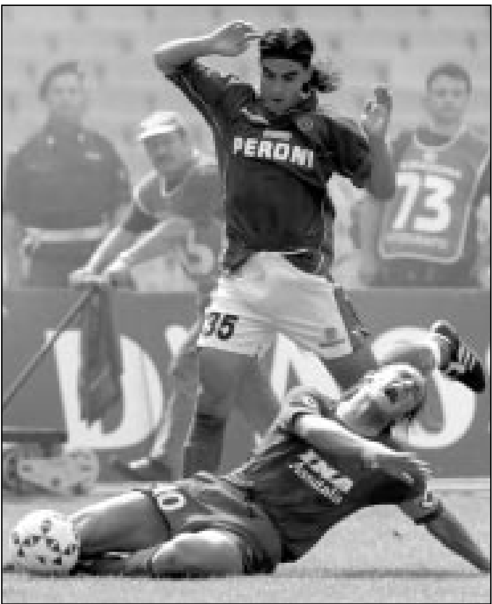
لقطة من إحدى مباريات نابولي (صورة من الأرشيف)

ولم تضد دقيقتان حتى استكت هكتور اومايبيتيس الجمهور المحلي بتسجيله هدف التعادل لكرووز ازول عندما استغل عدم مراقبته داخل المنطقة.