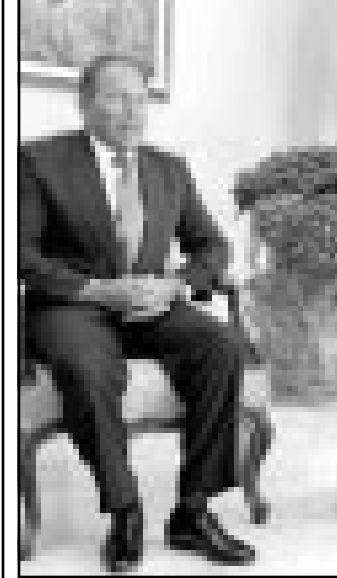
الرئيس اللبناني اميل لحود لدى اجتماعه مع الامين العام للامم المتحدة كوفي عنان

■ القاهرة وانتقل بعدها الى دمشق فعمان وستشم غزة وتل أبيب. وتهدف جولته الى تعزيز وقف اطلاق النار بين اسرائيل والفلسطينيين. وقال عنان للصحافيين عند وصوله الى مطار بيروت «انا مسرور لان هناك وقفا لاطلاق النار بين الفلسطينيين واسرائيل ولكن اعتقد ان ذلك لن يستمر ما لم ينظر اليه الطرفان على انه جزء من عملية تفاوض سياسية اوسع».