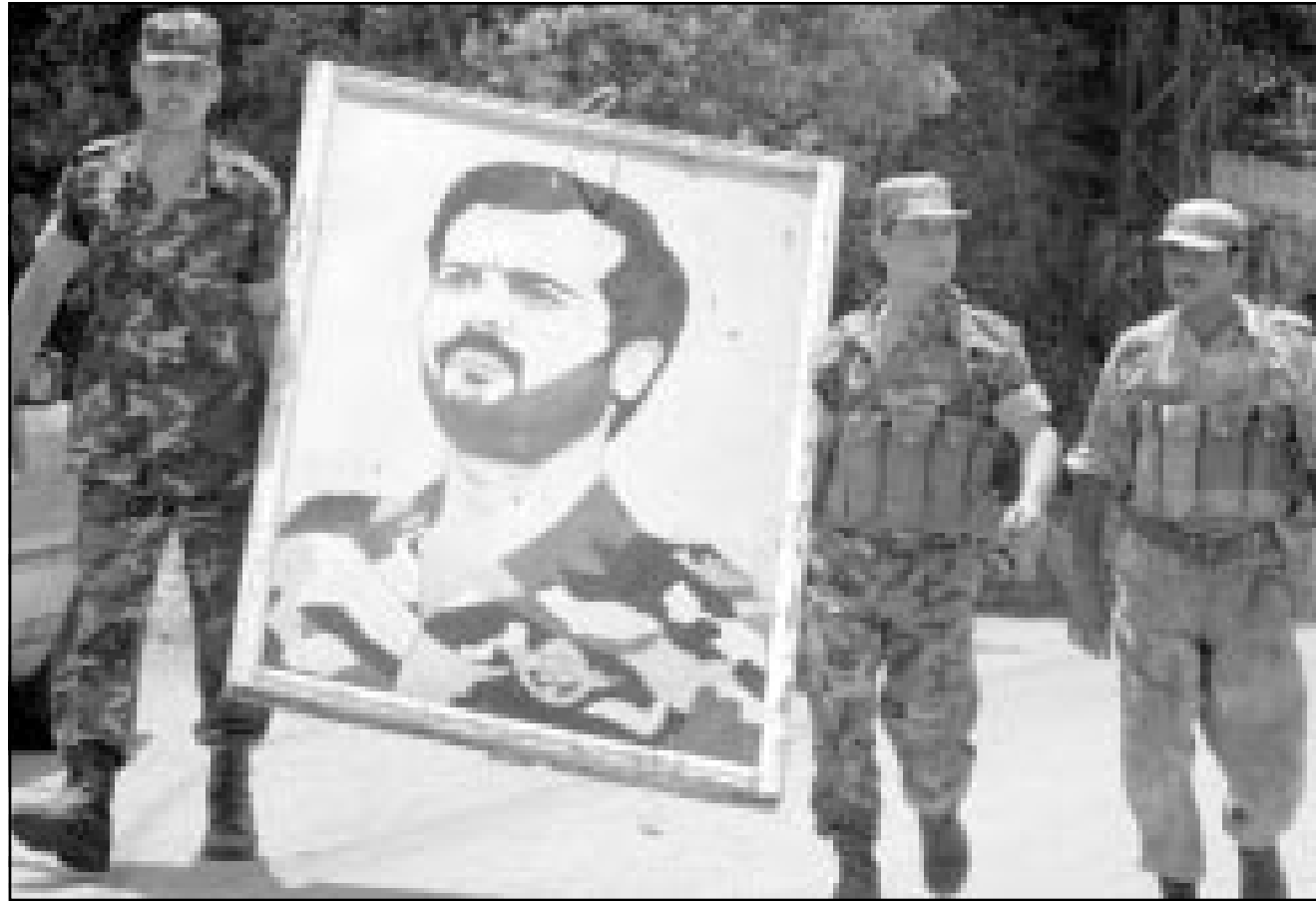
قوات سورية تحمل صورة بآسلاف الاسد شقيق الرئيس السوري بشار الاسد بعد انسحابها من منطقة البرزة

■ دمشق - بيروت - اف ب - رويترز: لزمت السلطات السورية مع وسائل الاعلام الصمت ازاء الاعلان عن اعادة انتشار جزئية للقوات السورية من مناطق مجاورة لبيروت بدأ تنفيذ ليل الاربعاء الخميس. وتجاهلت صحيفة (الثورة) الرسمية الوحيدة التي تصدر الجمعة تماما خبر انسحاب القوات السورية من مناطق قريبة من القصر الجمهوري ووزارة الخارجية اللبنانية في ضواحي بيروت. كما لم ينشر التلفزيون ولا الاذاعة الى الخبز.