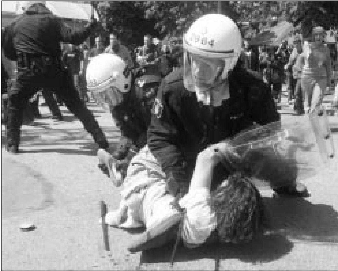
الشرطة تعتقل أحد المتظاهرين في غوتنبرغ أمس

بما يسمح بانضمام أعضاء جدد في 2004. ومن المقرر ان يضم زعماء 12 دولة مرشحة للدخول في الاتحاد الأوروبي الى زعماء الاتحاد في اليوم الاخير من القمة اليوم السبت.