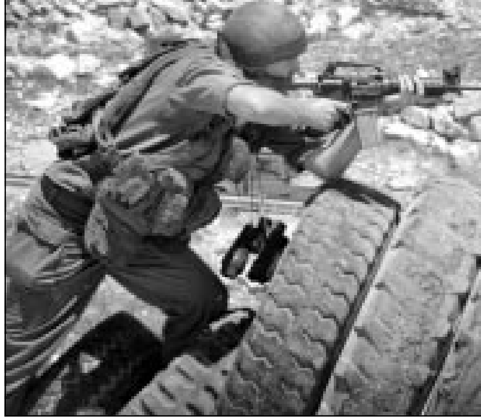
جندي اسرائيلي يطلق النار على متظاهرين فلسطينيين في مدينة الخليل

رام الله - اف ب: شارك الاف الفلسطينيين في مسيرات حاشدة الجمعة ترافقت مع مواجهات في أنحاء مختلفة من الضفة الغربية اسفر عن اصابة 17 فلسطينيا وصحافي ياباني بجروح وذلك بحسب مصادر فلسطينية طبية ومراسلي فرانس برس. وذكرت المصادر ان مدن الضفة الغربية شهدت مسيرات شعبية بدعوة من لجنة التنسيق الوطنية والاسلامية التي تمثل 13 تنظيما فلسطينيا لرفض الضغوط الامريكية والانحياز الامريكي ورفض التنسيق الامني الفلسطيني الاسرائيلي والتشديد على الوحدة الوطنية الفلسطينية واستمرار الانتفاضة.