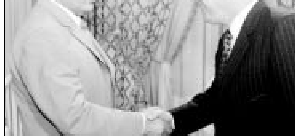
كريس باتن في ضيافة الرئيس التونسي زين العابدين بن علي بقصر قرطاج امس