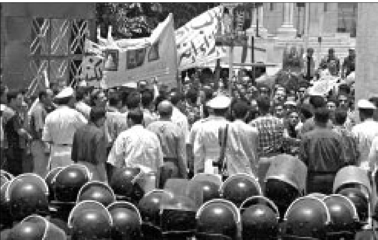
قوات الامن المركزي المصرية تحاول منع المتظاهرين الاقباط من الخروج من مقر الكاتدرائية الى الشارع في القاهرة امس الاول

القاهرة - «القدس العربي»: تصاعدت امس الضغوط الشعبية القبطية على قيادة الكنيسة الارثوذكسية والحكومة في اطار الاحتجاجات على ما نشرته صحيفة مستقلة من صور وتفصيل احادية حول راهب في دير الحرق بمراس الجنس مع سيدات متزوجات داخل الكنيسة، ويسجل اللقاءات معهن على شرائط فيديو لابن زاهر ماديا حسب مزاعم الصحيفة.