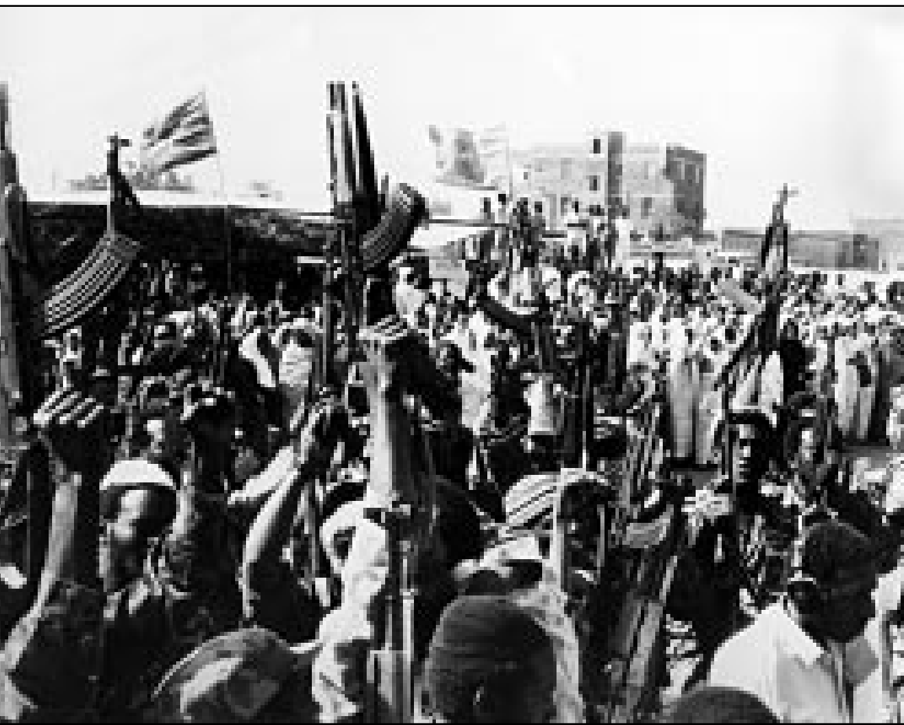
مقاتلون سودانيون تابعون للجيش السوداني

وكشف البشير ان معظم دول الجوار الافريقي لديها مواقف ايجابية تجاه السودان، وذكر ان الحكومات السودانية تسعى لإيقاف التمهيد التي تجدها حركة قرنق في بعض دول الجوار الافريقي، وعلى صعيد محتمل أكد الفريق الركن محمد بشير سليمان الناطق الرسمي باسم الجيش السوداني ان