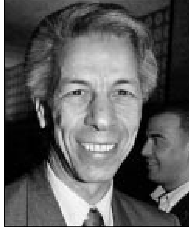
لندن - «القدس العربي» من توفيق رباحي:

وصف رئيس الوزراء الجزائري السابق مولود حمروش قرار الحكومة بتعليق المسيرات الاحتجاجية بأنه «خطا فادح» ودعوة الى العنف. وأوضح حمروش في اتصال هاتفى مع «القدس العربي» امس الثلاثاء ان القرار يحمل في طياته تعبير عن عجز وقال «كان احرى بالحكومة ان تمنع الحرق والتخريب، اما ان تمنع المسيرات السلمية، فهي تشجع الغاضبين على ان يعزبوا عن مطالبهم بطرق اخرى غير الطرق السلمية»، و اضاف: «تمسك غريق بغريق! الحكام الواعون يشجعون على المسيرات الهادئة، اما الحكومة عندما تمنعها، مسجلا ان المسيرات السلمية تمت «خارج القانون»، ونقلت الصحف الجزائرية الصادرة امس ان مجلس الحكومة اتخذ قرارا بفتح المسيرات في العاصمة الى اشعار جديد بسبب الاحداث التي صاحبت مسيرة الخميس الماضي فولتها الى ماسة قومية. بمسبلاه بين 1989 و 1991، فسأخذك ديناميكية جديدة في العمل السياسي والقمي والجمعي كادت تتوج قطعية مع النظام العسكري. ومنذ سقوط حكومته في صيف 1991 اعتزل حمروش العمل السياسي الرسمي الى غاية ربيع 1999 عندما ترشح لانتخابات الرئاسة وانسحب منها عشية الموعد برفقة خمسة مرشحين آخرين احتجاجا على ما قالوا انه تزوير لازم اقتراع القوى الامنية. ويوصف بأنه ملاحظ جيد ودقيق لاحداث السياسية ببلاد، ويطلق عليه «ابن النظام الذي تهرق على النظام». واكد حمروش ان الاحداث التي تعيشها عدة مدن وبلدات جزائرية منذ شهرين لم تلجأه، وقال «... بالعكس، الذي فاجاني فعلا هو العجز الفادح الذي ابدهت السلطة في تعاملها مع هذه الاحداث».