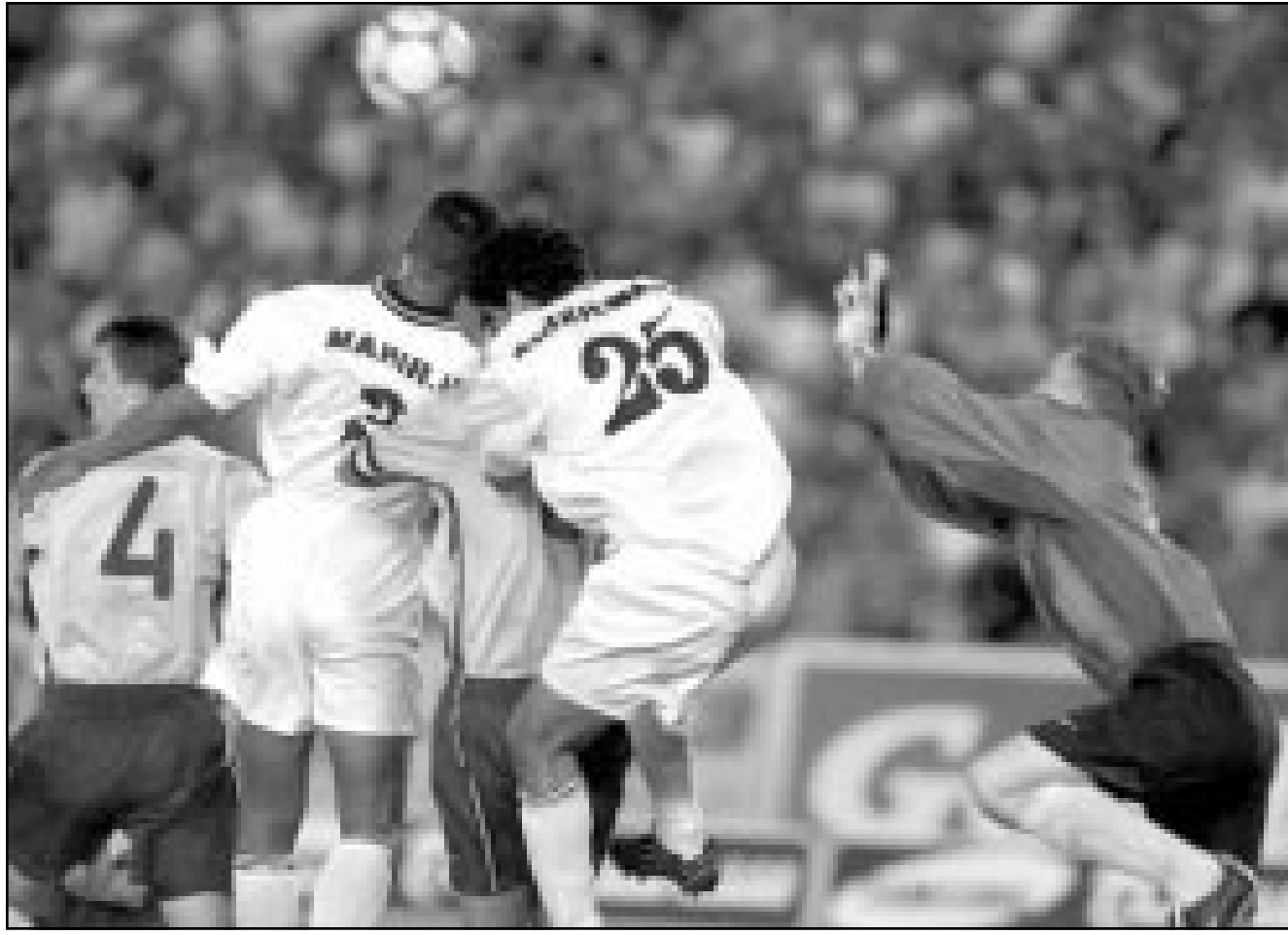
لقطة من إحدى مباريات منتخب العراق

وتتوالى مباريات المنتخب الإماراتي في الدور الثاني في المجموعة الثانية مع قطر وسلطنة عمان والصين وأوزبكستان بعد أن تصدر مجموعته في الدور الأول بصعوبة أمام اليمن.