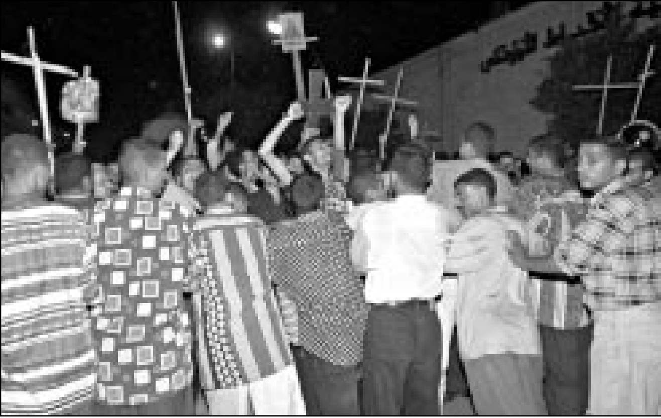
متظاهرون اقباط في مواجهة مع رجال امن في زي منى أثناء محاولتهم الخروج من الكنيسة الى الطريق العام بالقاهرة

وهتفت حشود المحتجين الذين يرفعون صليبا خشبية او صور للسيدة مريم فوق رؤوسهم «بالروح بالدم نفدي الصليب». وحث البابا شنودة الثالث بابا الاسكندرية وبطريك الكرازة الرقسية الاقباط الاثني على التزام الهدوء وعدم التجمهر. ونقلت وكالة انباء الشرق الاوسط عن الانبا يوانس المتحدث باسم البابا قوله ان البابا شنودة ذكر في لقائه مع الاقباط صباح اليوم انه «لا مبرر للتعامل مع الموقف الان بشكل انفعالي خاصة ان الدولة اتخذت على الفور اجراءات ايجابية لتهدئة الاوضاع وضمان تحقيق السلام الاجتماعي والحفاظ على الوحدة الوطنية». وقالت صحيفة القبضة امس ان ما زعمته صحيفة النبا الوطني يهدد الوحدة الوطنية في البلاد. وقال بيان للكنيسة تلقته رويترز ان الموضوع الذي نشرته الصحيفة الاسبوعية امس الاحد يتعلق براهب سابق طرد من الكنيسة قبل خمس سنوات. وقال البيان الصادر بعنوان «بيان وبلاغ من الكنيسة القبطية الارثوذكسية والمجلس الملي العام» ان الموضوع المنشور «يمس ويجرح قيم الديانة المسيحية ويثير الفتنة الطائفية وكانت له ردود فعل عنيفة وسط الاقباط».