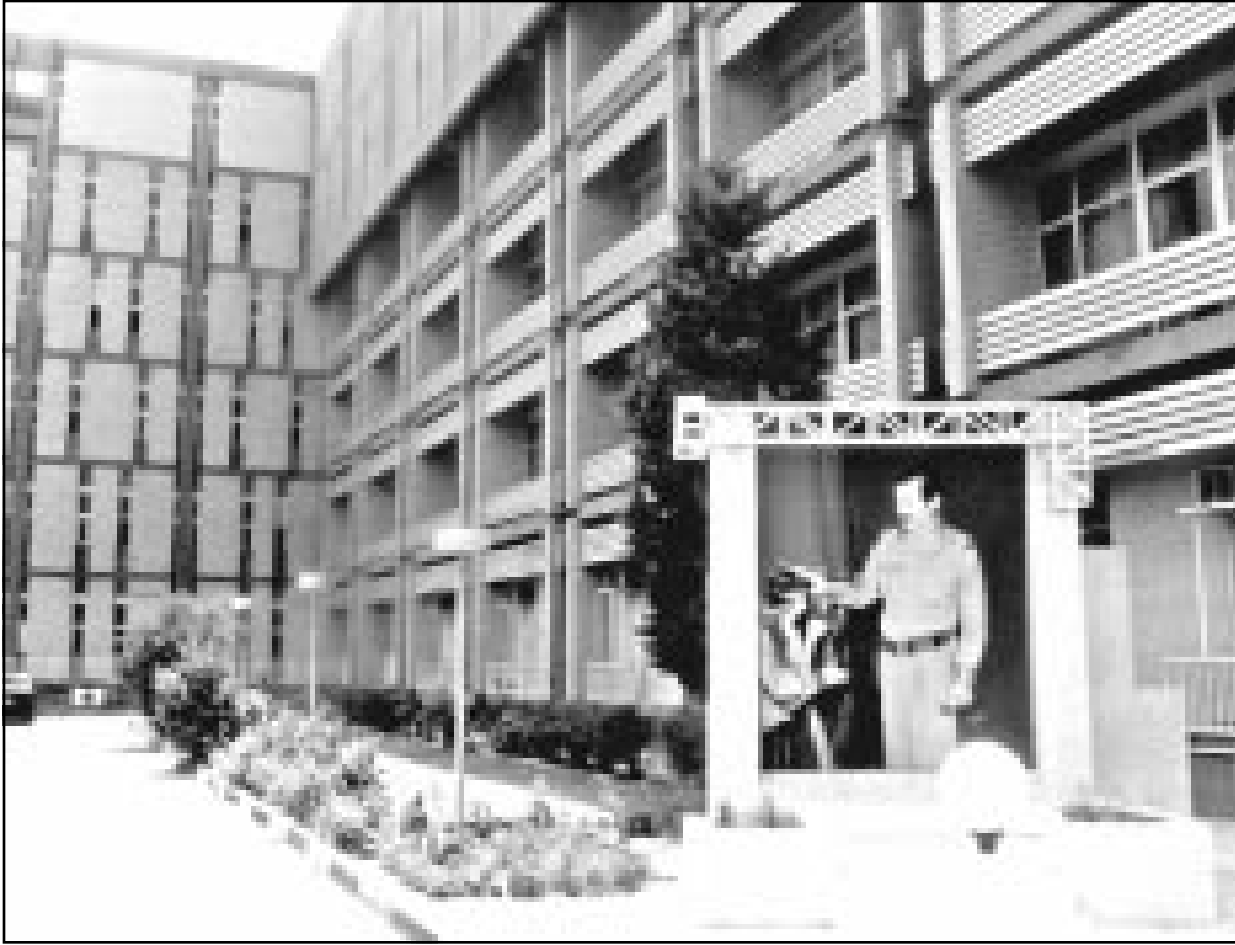
مدخل مستشفى صدام في بغداد

وقال عزيز في رسالته لعنان ان القرار الجديد سيفرض وصاية دولية على العراق لسنوات طويلة ويحرم البلاد من مواردها ويقاوم من الموقف الانساني المتزدي. وقال صحف العراق وزير التجارة محمد مهدي صالح اجتمع الاسبوع الماضي في دبي مع وزير دفاع دولة الامارات العربية وولي عهد دبي الشيخ محمد بن راشد آل مكتوم لمناقشة الخطة. ونكرت الصحف ان صالح ابلغ الشيخ محمد باي بغداد سترفض ان قرار لا يؤدي الى رفع شامل للعقوبات. ونكرت وت في كافة الانباء العراقية ان نزار حمدون نائب وزير الخارجية اجتمع في بروكسل امس مع وزير الخارجية البلجيكي لويس ميشيل لنناقشة الخطة. ونكرت ان حمدون وهو مسفير العراق السابق لدى الامم المتحدة ناقش الخطة من قبل مع تمثيل الدنمركيين. ويسعى مجلس الامن الى تعزيز القرار الجديد قبل الثالث من تموز (يوليو). وايدت روسيا حيلفة العراق في المجلس اعراضات على الخطة. (رويترز)