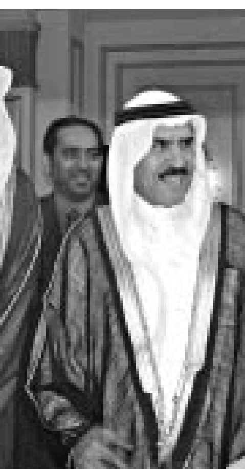
عمرو موسى يتحدث إلى الشيخ عبد العزيز عبد الرحمن بن علي السفير البحريني لدى سورية (وسط) وصقر غياش ممثل الامارات في اجتماع وزراء الاعلام العرب في بيروت

بيروت - اف ب: شدد وزراء الاعلام العرب أمس الثلاثاء في افتتاح دورة مؤتمر الرابعة والثلاثين التي انعقدت في بيروت على ضرورة وضع خطة اعلامية لاقرار سبل دعم الانتفاضة الفلسطينية ومكافحة الضخيل الاسرائيلي في هذا المجال. أكد وزير الاعلام والثقافة الفلسطيني ياسر عبد ربه استمرار الانتفاضة لان لا قانون فوق الارض او قوة مهما بلغت تستطيع ان تمنع شعباً خاصاً للاحتلال من مواصلة مقاومته. وشدد عبد ربه على تأثير نجاح لبنان في ايار (مايو) عام 2000 في حصر الاحلال الاسرائيلي على الانتفاضة الفلسطينية المستمرة منذ ايلول (سبتمبر) الماضي، وقال «اعطانا ذلك الثقة بان النصر في لبنان سيستتبعه نصر في الجولان وفي ارض فلسطين حتى تقوم دولة فلسطين العربية الحرة والمستقلة بعاصمتها القدس الشريف». وانتقدت كلمات الشراكين فشل الاعلام العربي عامة حتى الآن في مواجهة الاعلام الاسرائيلي رغم تسجيل بعض التحسن في شروط المواجهة خلال التمسك وخاصة في ما يتعلق بالانتفاضة الفلسطينية. ورأى العربي عامة حتى الآن في محطة فضائية تبث باللغة العربية «ان مراقبة دقيقة ليزان القوى الاعلامية في المرحلة الاخيرة يجعلنا نرى اسرائيل للمرة الاولى في موقع رد الفعل والقلق من الكلمة العربية فتلجأ الى انشاء محطة فضائية تبث بالعربية تحت