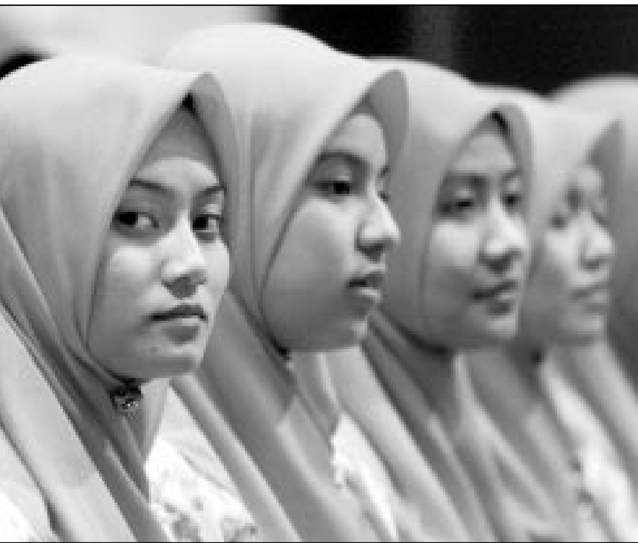
فتيات من ماليزيا يشاركن في الاستعداد للمهرجان السياسي الذي ينظمه حزب ماليزيا المتحدة الوطني بعد غد في العاصمة كوالالمبور ويحضره رئيس الوزراء مهاتير محمد

■ بنجيم (الهند) - اف ب: تريد ولاية غوا الهندية، التي تعتبر منطقة جذب سياحي، وضع حد لسياحة الجنس بعد سلسلة من الحوادث التي كان ابطالها اجانب من راغبين ممارسة الجنس مع الاطفال او القوانين الذين يديرون هذه الدعارة. واوضح المتحدث باسم شرطة الولاية تولوسكو رابوسو ان كل شخص يتهم في جريمة جنسية مستقل صورته سواء ادين بالتهمة او لم تثبت ادانته. وقال «لقد طلبنا من الحكومة اعداد قائمة سوداء باسماء المتهمين بجرائم اغتصاب او متورطين في قضايا دعارة أطفال في الهند او اي مكان آخر في العالم لمنعهم من دخول غوا». وأضاف «إذا لم نتخذ هذا الاجراء فان أطفالنا ولا سيما الأكثر فقرا منهم سيكونون دائما ضحية لتجاوزات جنسية»، وقال رابوسو ان وضع هذه القائمة السوداء امر ضروري نظرا لن العديد من الاجانب المتهمين باستغلال الأطفال جنسيا لم يظلوا ابدا امام القضاء في الهند او يتم طردهم لعدم كفاية الأدلة». وأضاف «نأنا نخطط ايضا هذا العام بالاشتراك مع