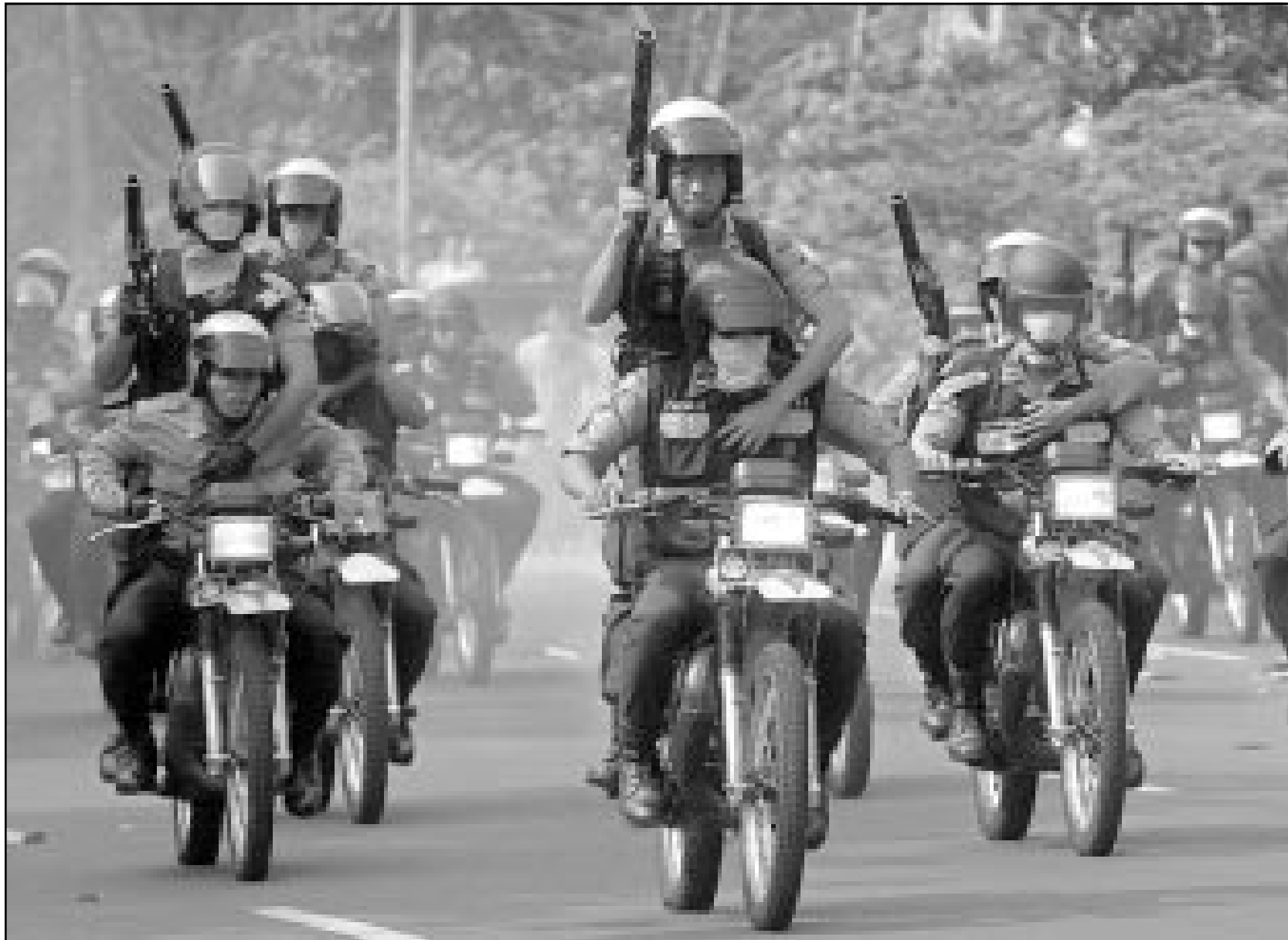
شرطة اندونيسيا تلاحق طلبة متظاهرين بجاكرتا احتجاجا على الزيادة في اسعار الوقود

ويركز المطالبون بنزع الاسلحة اساسا على اقتاع الولايات المتحدة وروسيا اللتين تملكان أكبر ترسانتين نوويتين بخفض اسلحتهما الاستراتيجية. وتنتشر الولايات المتحدة نحو سبعة الاف رأس نووية استراتيجية ولروسيا سبعة الاف. اما حجم الاسلحة التي تخزنها روسيا والمصاف اليها الرؤوس الميدانية فتبلغ 20 الفا وحجم هذه الاسلحة في الولايات المتحدة يبلغ عشرة الاف. والترسانات الفرنسية والبريطانية والصينية اصغر بكثير ويشعر الخبراء ان هذه الاسلحة لن تصبح من العناصر الهامة في الاستراتيجية النووية الا بعد ان تخفض الولايات المتحدة وروسيا ترسانتهما بشكل كبير. ووفقا لمعاهدة خفض الصواريخ الاستراتيجية (سحارت 2) التي تم تفض بعد تعهدت الولايات المتحدة وروسيا بخفض ترسانتهما الى 3500 في كل منهما الا ان