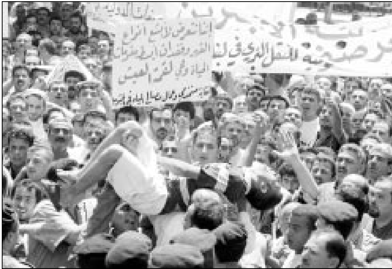
سائقو تاكسي يحملون زميلاً أصيب بضربة شمس خلال تظاهرتهم امس امام البرلمان اللبناني

بيروت - من سلطان سليمان: استأنف مجلس النواب اللبناني امس الثلاثاء مناقشاته لموازنة العام 2001 وسط اعتصامات لقطاعات عمالية مختلفة تطور بعضها الى صدامات مع قوى الامن. ويتضمن مشروع الموازنة نفقات مقدرة للعام 2001 تبلغ 9900 مليار ليرة (6,567 مليار دولار) وايرادات مقدرة تبلغ 4900 مليار ليرة (3,25 مليار دولار) بعجز قدر نسبته 50,50 في المئة. ويتضمن المشروع ايضا نفقات لخدمة الدين العا بقيمة 4300 مليار ليرة. وبنو لبنان بدين عام كبير بلغ في نهاية آذار (مارس) الماضي 24,03 مليار دولار اي ما يوازي 150 في المئة من اجمالي الناتج المحلي. وكانت المناقشات النيابية قد انقطعت في نهاية شهر ايار (مايو) الماضي بسبب انتشاء المهلة الدستورية لدورات انعقاد البرلمان مما استدعى فتح دورة استثنائية لاستكمال النقاش واقرار الموازنة. وقد تاخر انعقاد جلسة امس لدة نصف ساعة بعد ان اعتصم مئات من العمال في قطاعات مختلفة امام مقر المجلس النيابي في الوسط التجاري لبيروت وعقد مطولون عنهم لقاء مع رئيس البرلمان نبيه بري لشرح مطالبهم. وشارك في الاعتصامات عمال ومستخدمون من شركة طيران الشرق الاوسط الوطنية التي تملك الحكومة الغالبية العظمى من أسهمها والتي تم الاستيلاء عن 1400 من موظفيها البالغ عددهم 4500 في إطار خطة لاعادة هيكلة الشركة تمهيدا لخصخصتها.