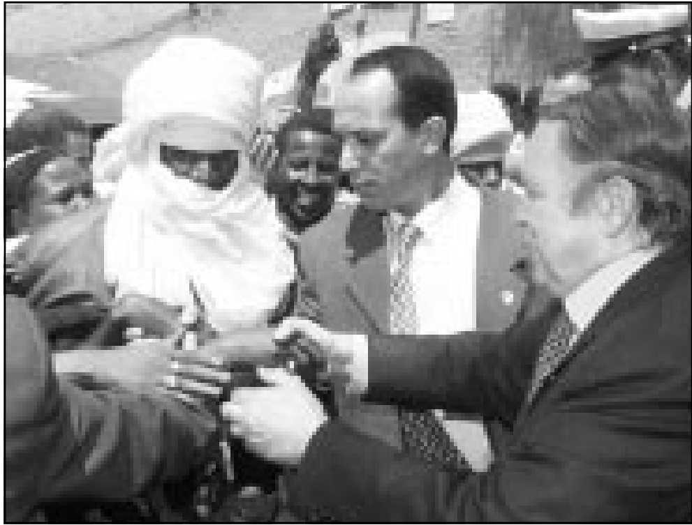
بوتفليقة وسط بعض سكان منقطة تمنراست الصحراوية التي بدأ يترافقها أمس

واكدت مصادر اعلامية مقتل ثلاثة اشخاص من المتظاهرين في بلدة اقبو بولاية بجاية، بينما يوجد دركي في حالة غيبوبة بمستشفى المدينة بسبب الاصابة في المواجهات التي شهدتها المدينة نهار و ليلة أمس الاول. واسفرت تلك المواجهات عن اصابة عشرات الاشخاص بجروح متفاوتة اصابة 11 منهم وصفتها مصادر استشفائية بالخطيرة جدا، من بينهم نساء. وقالت الصحف الجزائرية امس ان قوات الدرك استعملت الرصاص الحي لتفريق المتظاهرين في المدينة، وعرفت مسد بجاية واورلاقن احرقوا محلات تجارية ومقر شركة مواجهاة مماثلة احرق خلالها متظاهرون محطة البريد بالمدينة الاولى وتذكرت مصادر اخرى ان مواجهات مشابهة اندلعت بمنطقة باتنة بالاوراس (400 كلم شرق الجزائر)، وقالت ان متظاهرون خصوصا مبانى بعض الهيئات الادارية في المدينة. وفي تبسة (قرب الحدود مع تونس) خلفت مواجهات وقعت امس الاول مقتل شخصين اثنين عندما اطلق صاحب فندق الرصاص على متظاهرين حاولوا اضرار النار في فندقه، كما اطلق ابناء رئيس بلدية عين مليلة التابعة لولاية ام البواقي (500 كلم شرق) النار على متظاهرين احرقوا مسكنه ومحلات تجارية بملكيها. وتسبب اطلاق النار في مقتل 130 من المتظاهرين واصابة اكثر من 400 آخرين بجروح متفاوتة الخطورة.