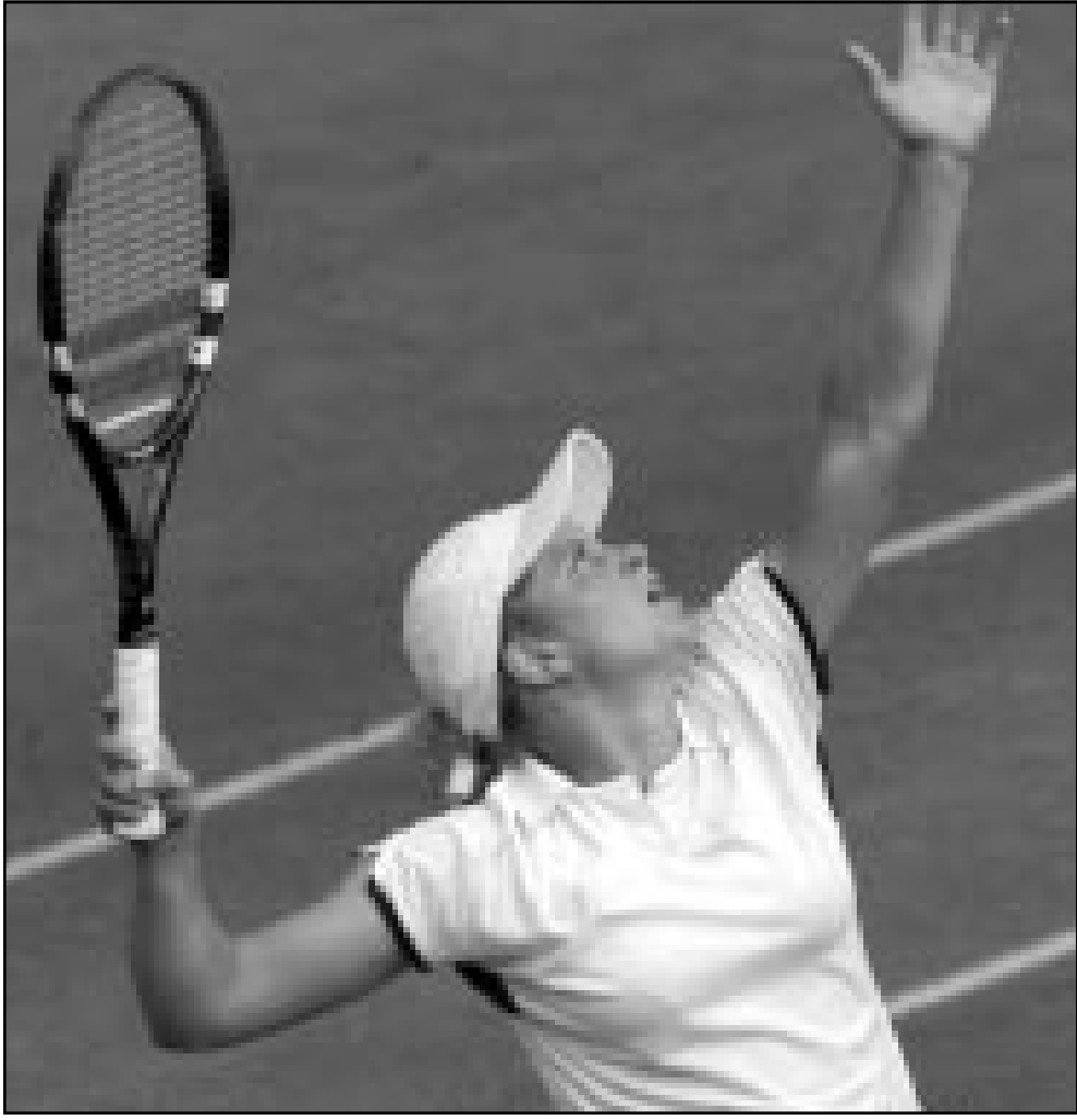
اللاعب البلجيكية كيم كليسترز

■ دن بوش (هولندا) - روبرتز: تأهلت المصنفة الأولى البلجيكية كيم كليسترز للدور قبل النهائي في فردي السيدات في بطولة دن بوش للتنس بولندا التي ينظمها اتحاد لاعبات التنس. في دور الثمانية تغلبت كليسترز على الأمريكية غير المصنفة كريستينا براندي الفائزة بالبطولة عام 1999 بنتيجة 3/6 و 4/6. وكانت المصنفة الثانية البلجيكية جوستين هينان تأهلت للدور قبل النهائي بفوزها على الروسية ايلينا بوفينا 4/6 و 4/6. كما صعدت المصنفة الرابعة اليوغوسلافية ايلينا دوكيتش للدور قبل النهائي للبطولة بعد ان هزمت المصنفة الخامسة السلوفاكية هنرييتا ناجيوفو 2/6 و 6/6. وفي مسابقات الرجال تأهل للدور الثالث المصنفة الرابع السويسري روجي فيديريه بفوزه على الهولندي يون فان نوتوم 6/6 و 1/6. وكان المصنف الاول الاسترالي ليتون هيوتس قد تأهل