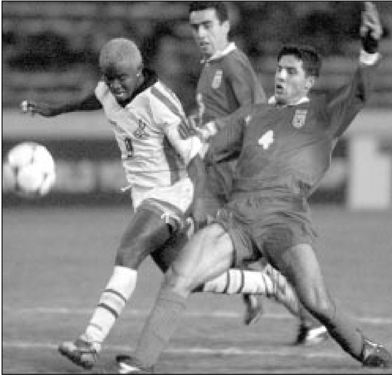
... وأخرى جمعت بين إيران وغانا وانتهت المباراة بفوز الأخيرة 1/صفر