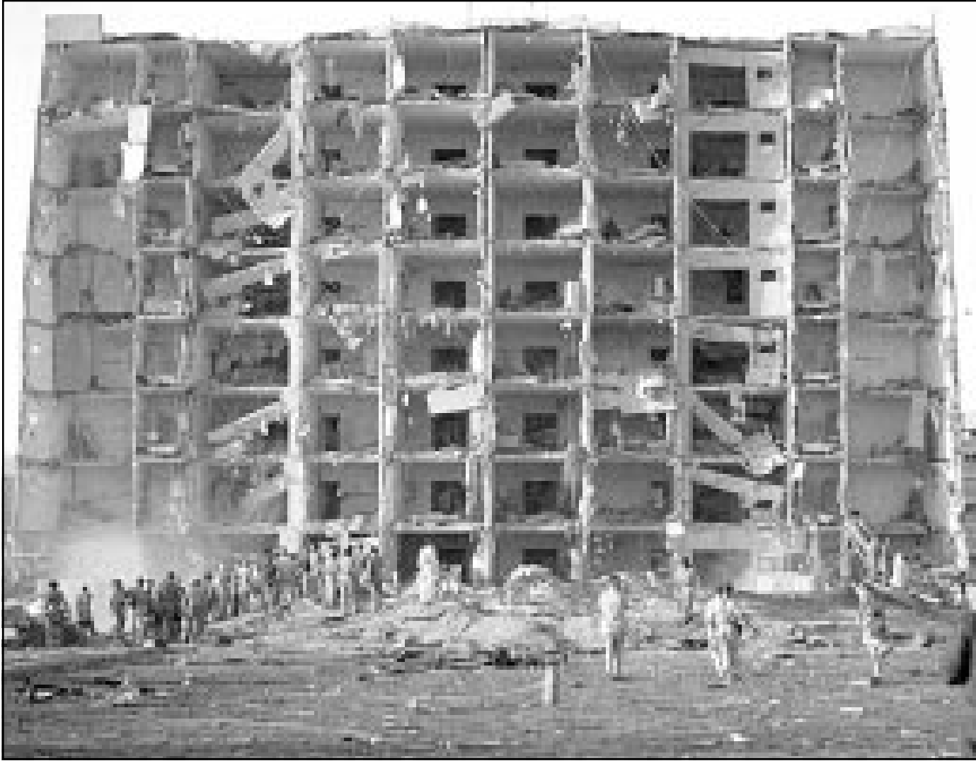
اثر الدمار على برج القوات الامريكية في قاعدة الخبر بعد الانفجار في العام 1996