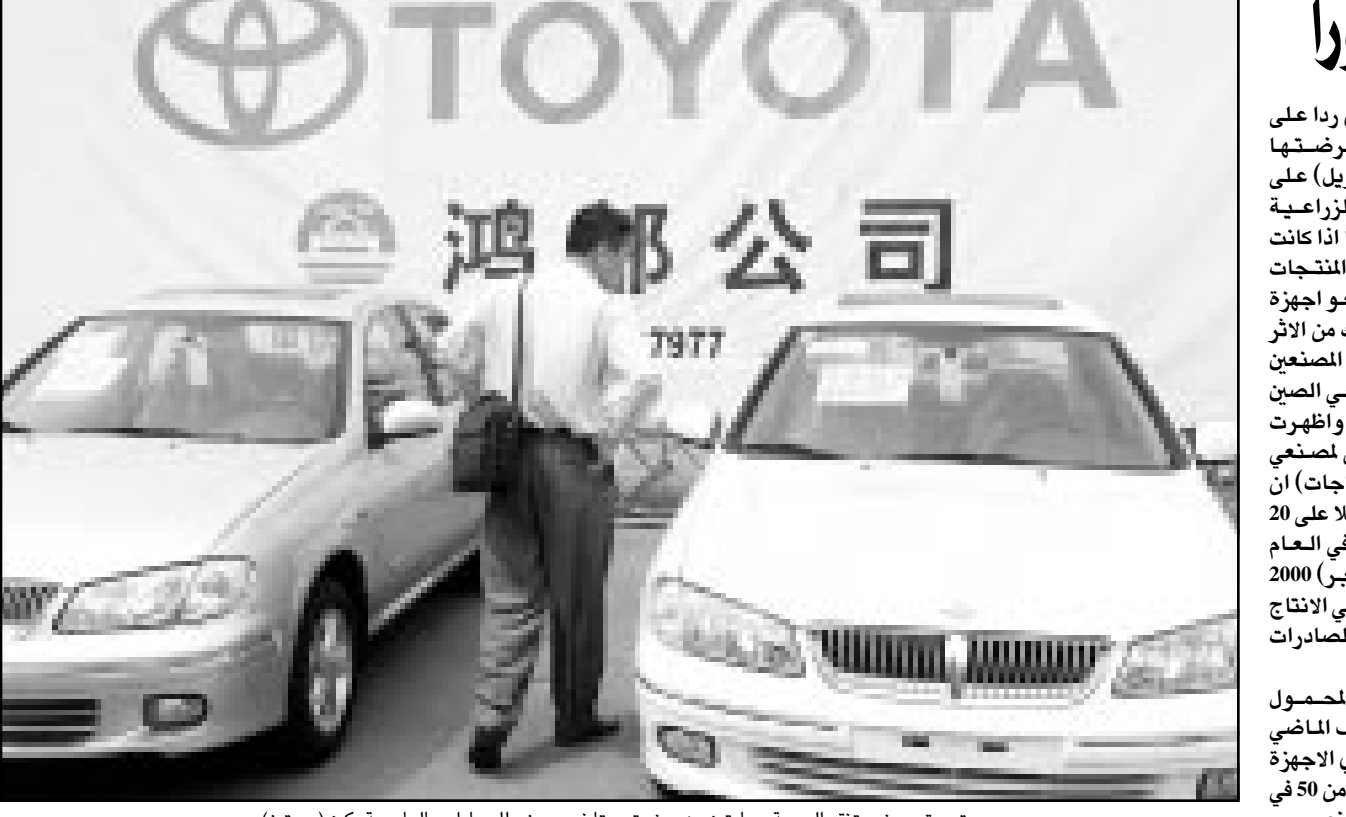
متسوق صيني يتفقد الجمعة سياراتين من صنع تويوتا في معرض للسيارات بالعاصمة بكين (رويترز)

طوكيو - رويترز: قالت وزارة المواصلات اليابانية الجمعة ان هوندا موتور بدأت سحب 11624 سيارة من طراز لايف ولايف دانك الصغيرة لاستبدال مسامير معيبة لربط الاطارات. واضافت الوزارة ان اطارات السيارات قد تتضمن تماما اثناء السير بسبب مشكلة في مسامير ربط الاطارات وذلك رغم عدم الابلاغ عن وقوع اي حوادث. وقالت متحدثة باسم هوندا ثالث اكبر شركة سيارات في اليابان ان الشركة تقدر تكلفة الاصلاح بنحو 230 مليون ين (1,85 مليون دولار). وتشمل عملية السحب سيارات لايف ولايف دانك التي تم تصنيعها في الفترة من التاسع من كانون الثاني (يناير) والثاني من آذار (مارس). وفي السادس من حزيران (يونيو) قالت هوندا انها قررت حب 100571 سيارة من بين 19 طراز تتجهها منها سيجيك و اكورد في اليابان لاصلاح عيوب مشابهة.