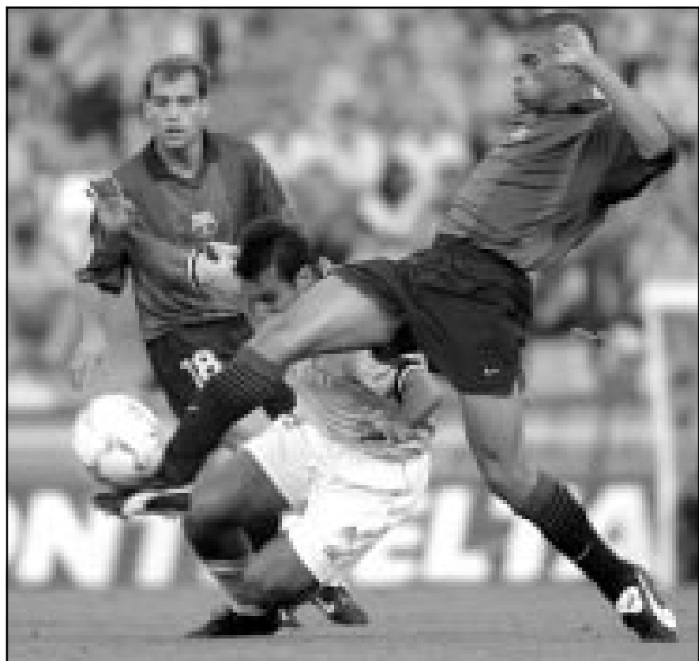
لقطة من إحدى مباريات سلتا فيغو

وقال يوهانسون «كان الاجتماع بناء وتبادلنا خلاله مجموعة من وجهات النظر»، مضيفاً «قدم لنا بلاتر ضمانات بخصومات بخصوص المستقبل خصوصاً ما يتعلق بالشافية والتشاور مع الاتحاد الاوروبي». وتابع «اتفقنا على اشراك اللجنة التنفيذية للفيفا في اتخاذ القرارات الاستراتيجية، كما قدم لنا بلاتر ضمانات بخصوص افكاره الشخصية في المجال التجاري والتي ينوي تطبيقها من اجل مصالح الفيفا».