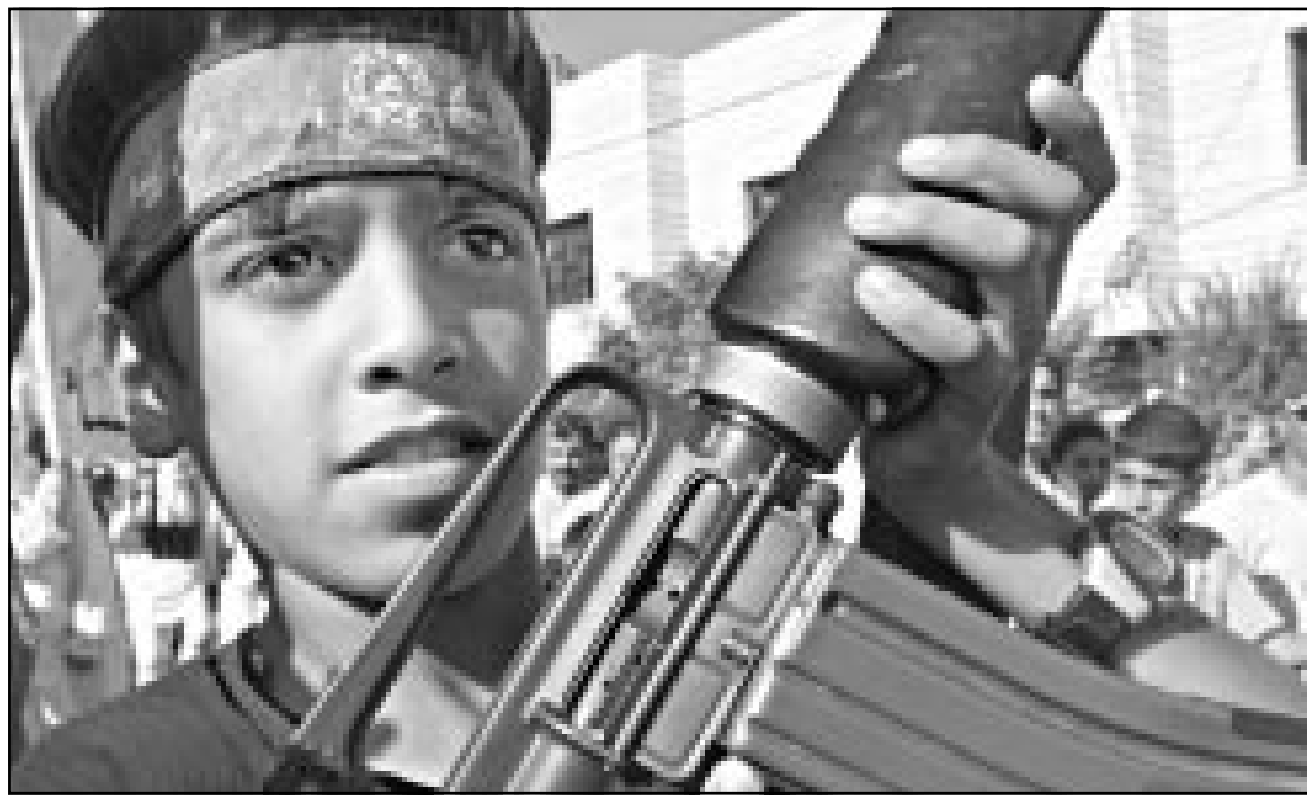
فلسطيني يحمل رشاشا اثناء مظاهرة لحركة حماس في طولكرم الجمعة

فرض تعتيما على الامر في بداية، وقد اصيب جندي ثالث بجروح طفيفة. والعلمية هي اول عملية استشهادية منذ دخول وقف اطلاق النار مع الفلسطينيين حيز التنفيذ في 13 حزيران (يونيو)، وقد اعلنت كاتب عر الدين القسام مسؤوليتها عن العملية. ومنذ ذلك التاريخ قتل ستة اسرائيليين هم ثلاثة جنود وثلاثة مستوطنين. الى ذلك سد عشرات المستوطنين اليهود عدة طرق رئيسية في الضفة الغربية واحرقوا حقل فلسطينيا، وقال شهود عيان ان مجموعة من المستوطنين احرقوا الحقل والقوا حجارة على قرية سجن الفلسطينية في الضفة الغربية. وافادت مصادر طبية فلسطينية ان ثمانية فلسطينيين اصيبوا بالرصاصة الحي وشظايا القاذف المدفعية التي اطلقها الجيش الاسرائيلي على