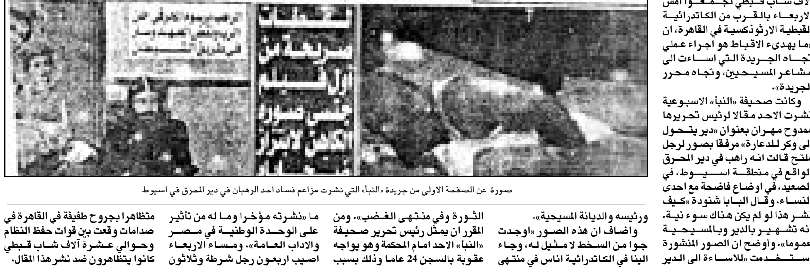
صورة عن الصفحة الأولى من جريدة «النبأ» التي نشرت مزاعم فساد أحد الرهبان في دير المحرق في أسيوط

لندن - «القدس العربي» - من سمير ناصيف: أوضح توماس بيكيريغ، وكيل وزارة الخارجية الأمريكية للشؤون السياسية في ولاية الرئيس بيل كلينتون والسفير الأمريكي السابق في إسرائيل والأردن وروسيا في محاضرة ألقاها في المعهد الملكي للشؤون الدولية في لندن بعنوان «أوروبا والولايات المتحدة.. الماضي والمستقبل»، أن العلاقة الأمريكية- الأوروبية في هذه المرحلة سيئة، وأنه يصعب جدا على الولايات المتحدة الحصول على تاييد الدول الأوروبية (باستثناء بريطانيا) إذا قررت توجيه ضربة للعراق تحت غطاء هيئة الأمم المتحدة ومجلس الأمن. وعبر توماس بيكيريغ عن استهجان واستنكار الشعب اليمني لكل أعمال الغطرسة والإبادة التي يتعرض لها إخوانه من أبناء الشعب الفلسطيني والتي تمارسها قوات الاحتلال الصهيوني في الأراضي العربية المحتلة. وجابت المسيرة التي انطلقت من الجامع الكبير بصنعاء القديمة العديد