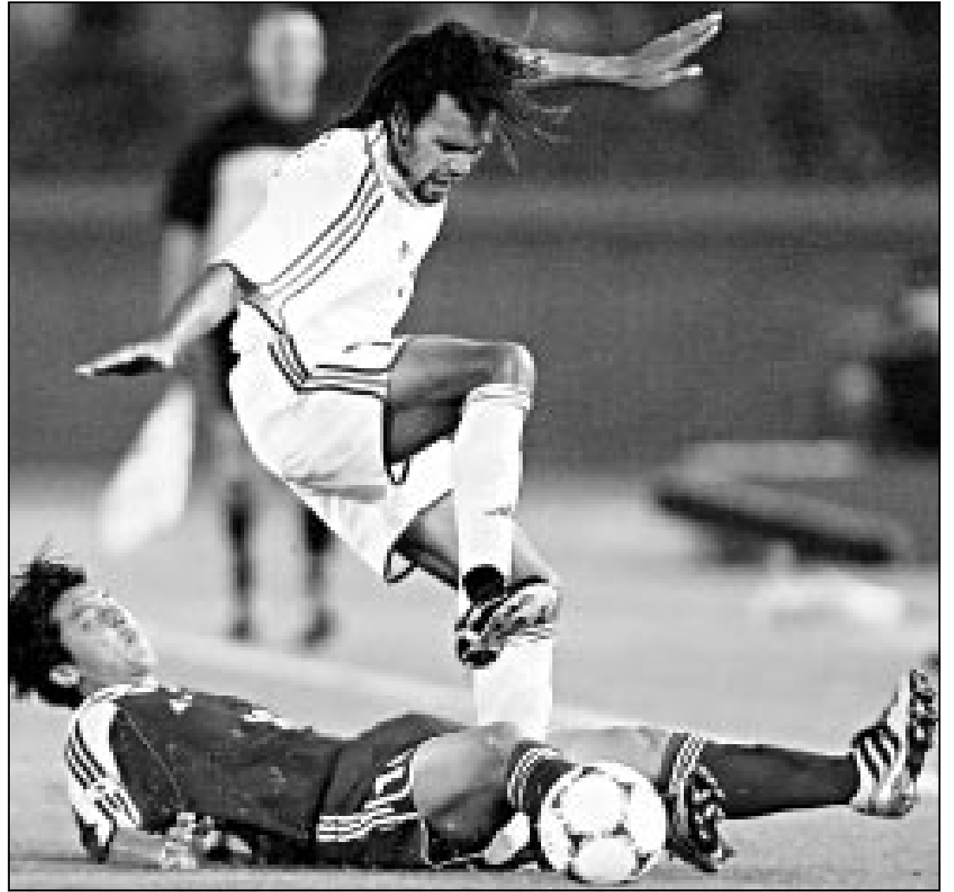
لقطة من مباراة منتخب فرنسا ضمن نهائيات كأس العالم في كرة القدم للشباب (صورة من الأرشيف)