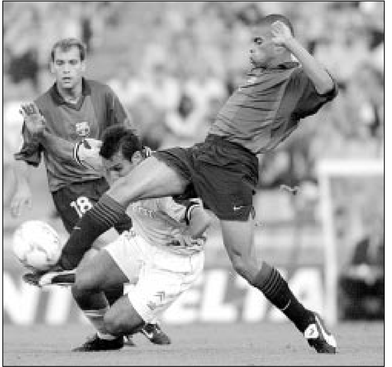
لقطة من إحدى مباريات فريق سلتا فيغو الاسباني

وما - اف ب: بقي فيرونا في مصاف اندية الدرجة الاولى الايطالية لكرة القدم رغم خسارته امام مضيغه ريجينا 2-1 في مباراة الاياب من الدور الفاصل (الملحق). وسجل تسانكيكا (42) وكوتزا (45) هدفي