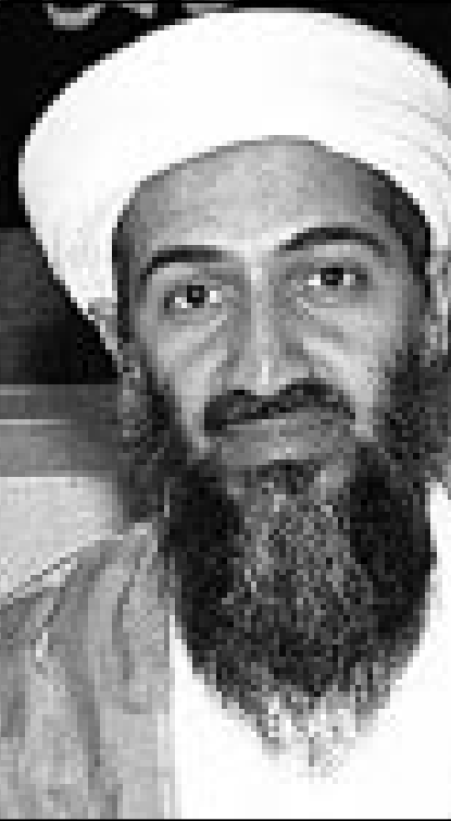
الشيخ اسامة بن لادن

ولجا الى افغانستان منذ 1996، مطلوب من قبل الولايات المتحدة التي تتهمه بتدبير اعتداءين ضد سفارتها في نيروبي ودار السلام او قفعا 224 قتيلًا والاف الجرحى عام 1998. وقد وضعت القوات الامريكية في الخليج في 22 حزيران (يونيو) الجاري في حالة تاهب قصوى لمواجهة اي هجمات محتملة تستهدف المصالح الامريكية في العالم بمناسبة الذكرى الخمسة لاعتداء الطهران في 25 حزيران (يونيو) 1996 الذي اسفر عن مقتل 19 امريكيا.