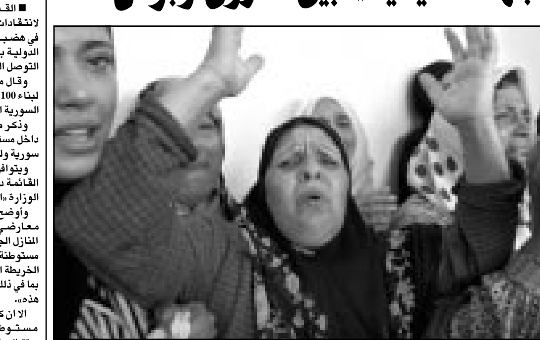
فلسطينية تبكي الشهيد محمد حمدان أثناء تشييع جثمانه في خان يونس

وقال الناطق باسم بليزر ان رئيس الوزراء البريطاني اشاد بـ«صبط النفس» الذي ابداه شارون بعد العملية الجراحية لمعد خضيران (يونيو) الجاري في تل ابيب.