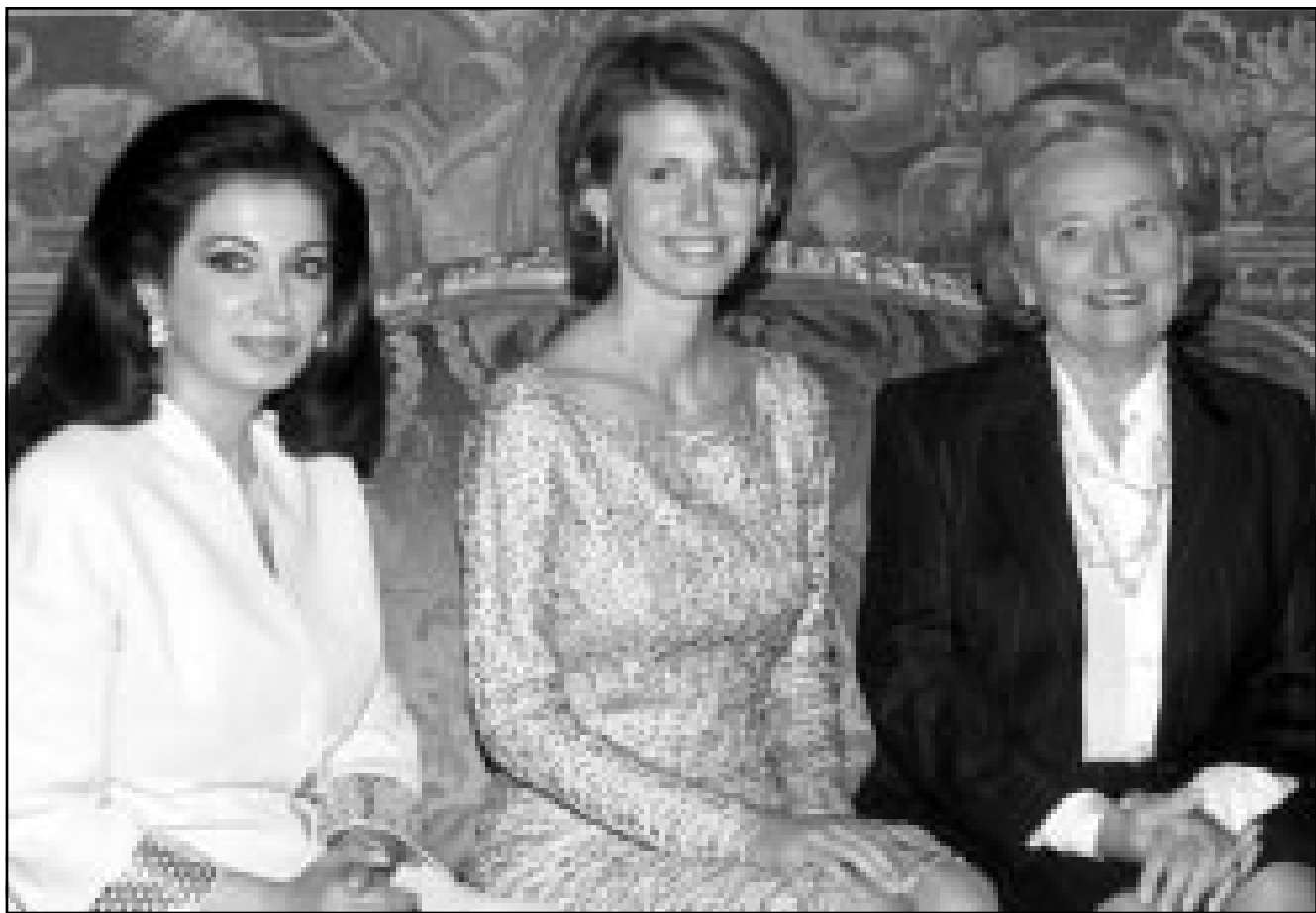
سيدة فرنسا الاولى برناديت شيراك (يمين) والسيدة السورية الاولى أسماء الاسد (وسط) وزوجة رئيس الحكومة اللبنانية نازك الحريزي في قصر الاليزيه

ومن جهته رأى الناطق باسم الحزب الاشتراكي وهو الحزب الاساسي في التحالف الحاكم في فرنسا امس الثلاثاء ان الاحتفاء بحقوق الانسان واحترام الافراد وحرية الرأي» مسائل يفترض ان تشكل «مصميم