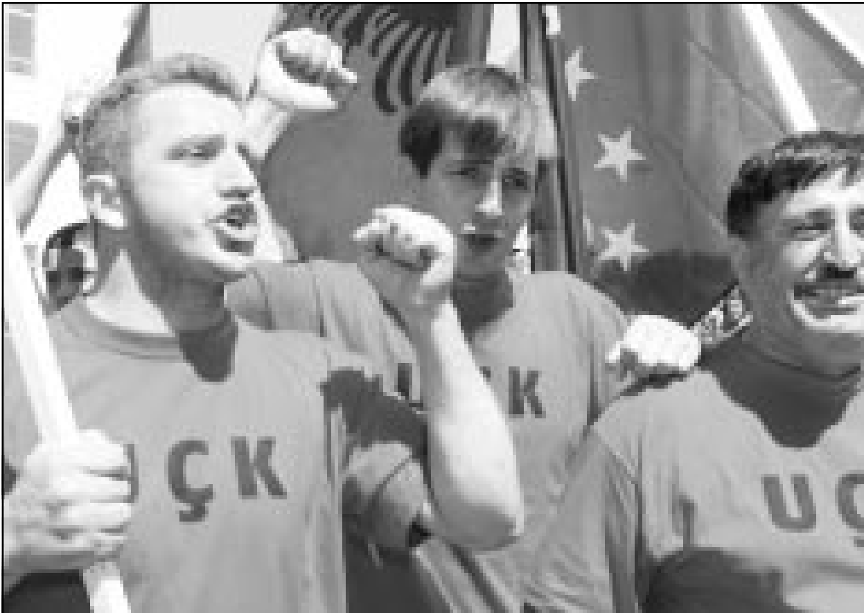
مؤيدون للثوار الالبان يتظاهرون في لوكسمبورغ أمس