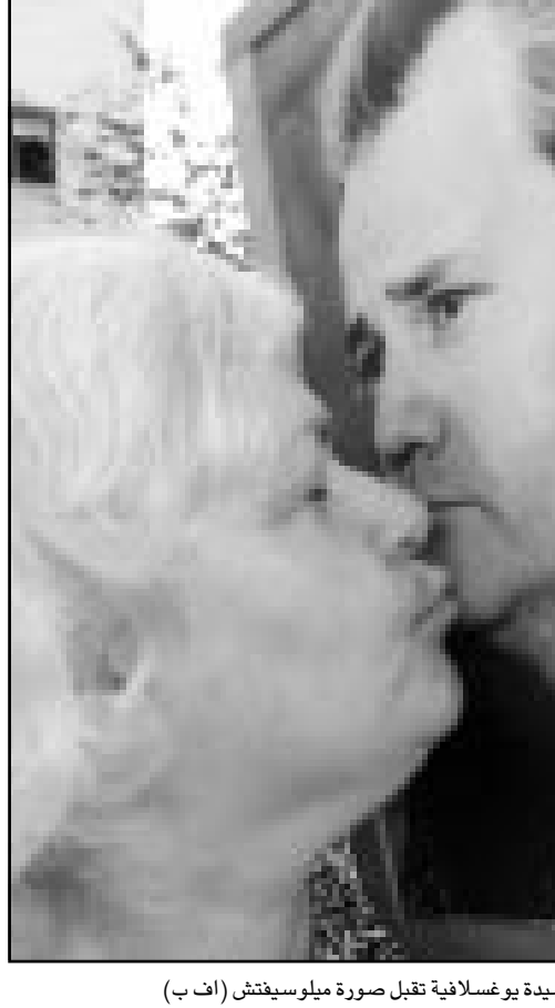
سيدة يوغسلافية تقبل صورة ميلوسيفيتش

■ تيرانا - اف ب: أعلن رئيس الوزراء الاشتراكي الالباني اليرما ميتا أمس الاثنين لوكالة «فرانس برس» بان الحزب الاشتراكي (الحاكم) «قد فاز» بالدورة الأولى من الانتخابات التشريعية التي جرت الأحد في البانيا. وقد أعلن ميتا الذي يرأس الحزب «لقد فاز الاشتراكيون». وكان امين عام الحزب الاشتراكي غراموز روتشي قد أعلن فوز حزبه في 45 دائرة انتخابية وخسر 17 دائرة بينما سيخوض الحزب الديمقراطي (معارضة) دورة ثانية في 37 دائرة. من جهته يؤكد شبيتم روكي احد قادة التحالف المعارض برئاسة الرئيس السابق صالح بيريشا بان الحزب الديمقراطي وحلفاءه فازوا في 34 دائرة. واكد بيريشا بان الحزب الديمقراطي «أحرز الاكثية الساحقة»، كما حذر الاشتراكيين من استخدام «طرق غير مشروعة» في محاولة لحرمانه من الفوز. وكان نحو 60% من الناخبين المسجلين والبالغ عددهم 2,5 مليون، ادلوا باصواتهم الأحد لانتخاب 140 نائبا في البرلمان الالباني. ويتوقع إجراء دورة ثانية بعد 15 يوما.