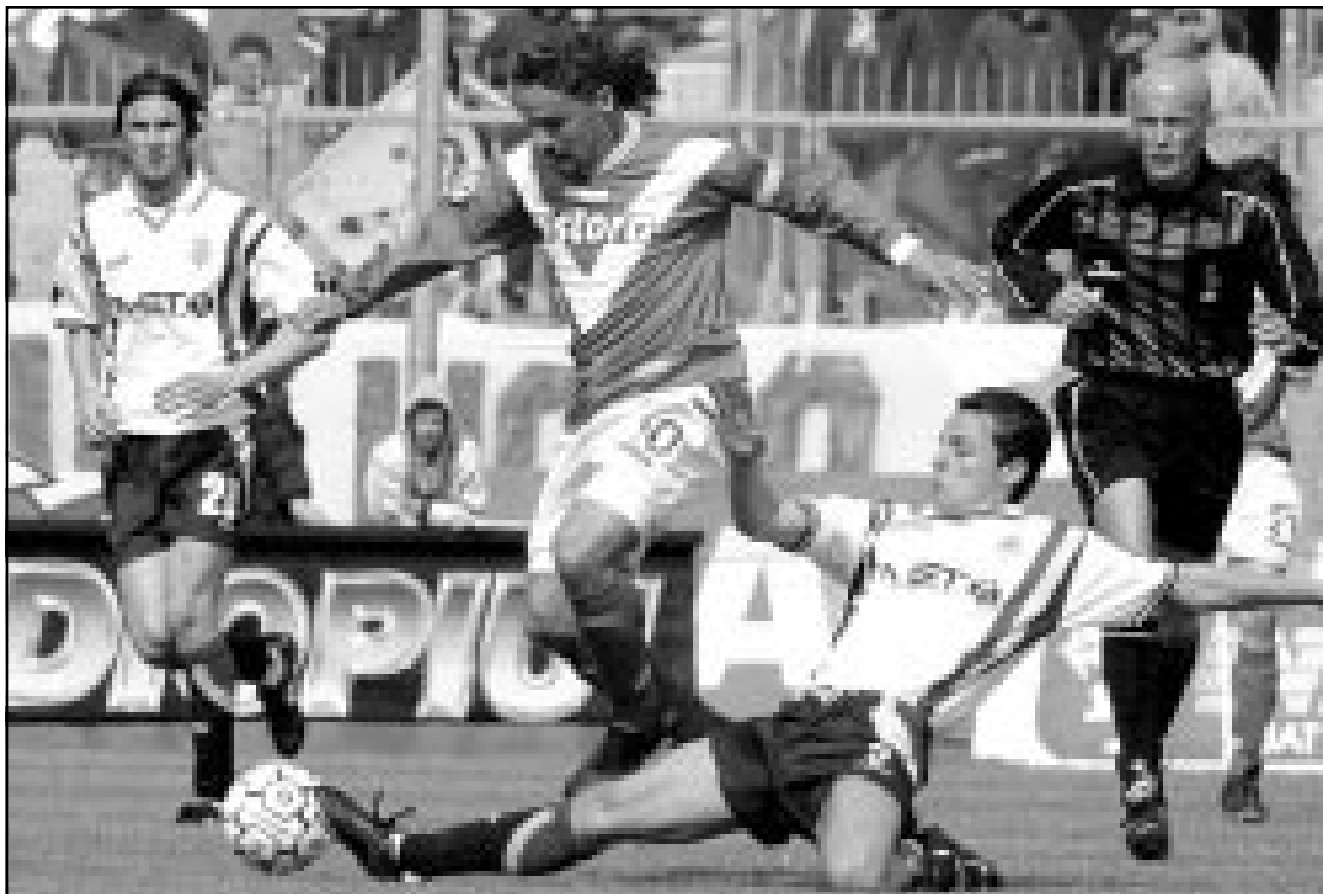
لقطة من إحدى مباريات فيرونا الايطالي

برصيد 37 نقطة لكل منهما، لكن نظام البطولة لا يأخذ بفارق الأهداف، فلعبا ملحقاً من ذهاب واياب لتحديد الفريق الرابع الذي سيرافق فينشتازا و نابولي وباري الى الدرجة الثانية. ريجينا، وكوساتو (85) هدف فيرونا، وكان فيرونا فاز ذهاباً على أرضه 1 - صفر الخمس، فهبط ريجينا. وقد احتل ريجينا المركز الرابع عشر وفيرونا الخامس عشر في ترتيب البطولة الثانية.