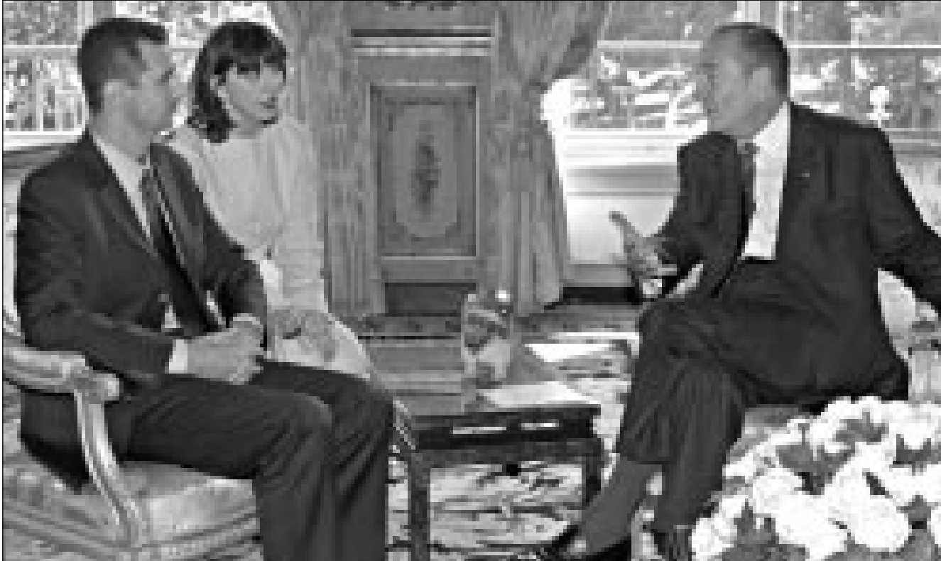
الرئيسان الفرنسي جاك شيراك والسوري بشار الاسد اثناء محادثتهما في قصر الاليزيه امس

لوجهات النظر حول المسائل ذات الاهتمام المشترك، وعلى الاثر اتسع اللقاء ليشمل اعضاء الوفدين من اجل مناقشة القضايا الثنائية وافتاح التفاوض حول اتفاق شراكة بين الاتحاد الاوروبي وسورية. ورأى الناطق باسم الحزب الاشتراكي وهو الحزب الاساسي في التحالف الحاكم في فرنسا امس الاثنين «ان الاهتمام بحقوق الانسان واحترام الافراد وحرية الرأي» مسائل بغرض ان تشكل «صمغ الحوار مع الرئيس الاسد». ورأى فنفسنا بايون في لقائه ما صحافي الاسبوعي «انه امر شرعي تماما انتقاد ما قاله بشار الاسد». فلم يحمي الى اقواله التي هاجمت اليهود بعنف اثناء زيارة البابا الاخيرة الى سورية. كما اشار المسؤول الاشتراكي «ولكن ينبغي طبعاً ان يفتح الحوار مع سورية التي تحاول تحديث نفسها مجالا لاولوياتنا الغربية وهي انشاء ديمقراطية ما تزال منهارة في سورية وايضا قضية المعتقلين الاسرائيليين وهم كثر». وشارك حوالي ستة الاف شخص مساء امس الاثنين في باريس في تجمع نظمته المجلس التمثيلي