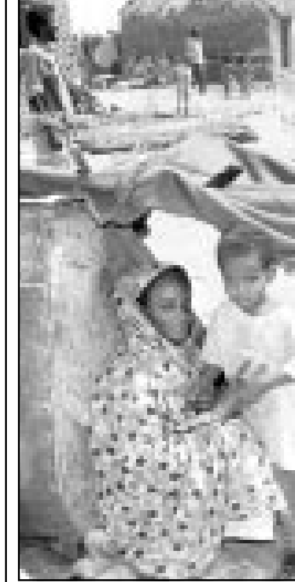
لاجئون اريتريون شردتهم الحرب مع اثيوبيا

المؤقتة مما أخرج عودة 300 ألف نسمة هربوا أثناء حرب الحدود. تقول الامم المتحدة ان الصراع اجبر المزارعين على تأخير زراعاتهم عدة اسابيع مما سيحعل نصف اجمالي سكان اريتريا وعدهم اربعة ملايين نسمة يعتمدون على المعونات الغذائية الاجنبية هذا العام.