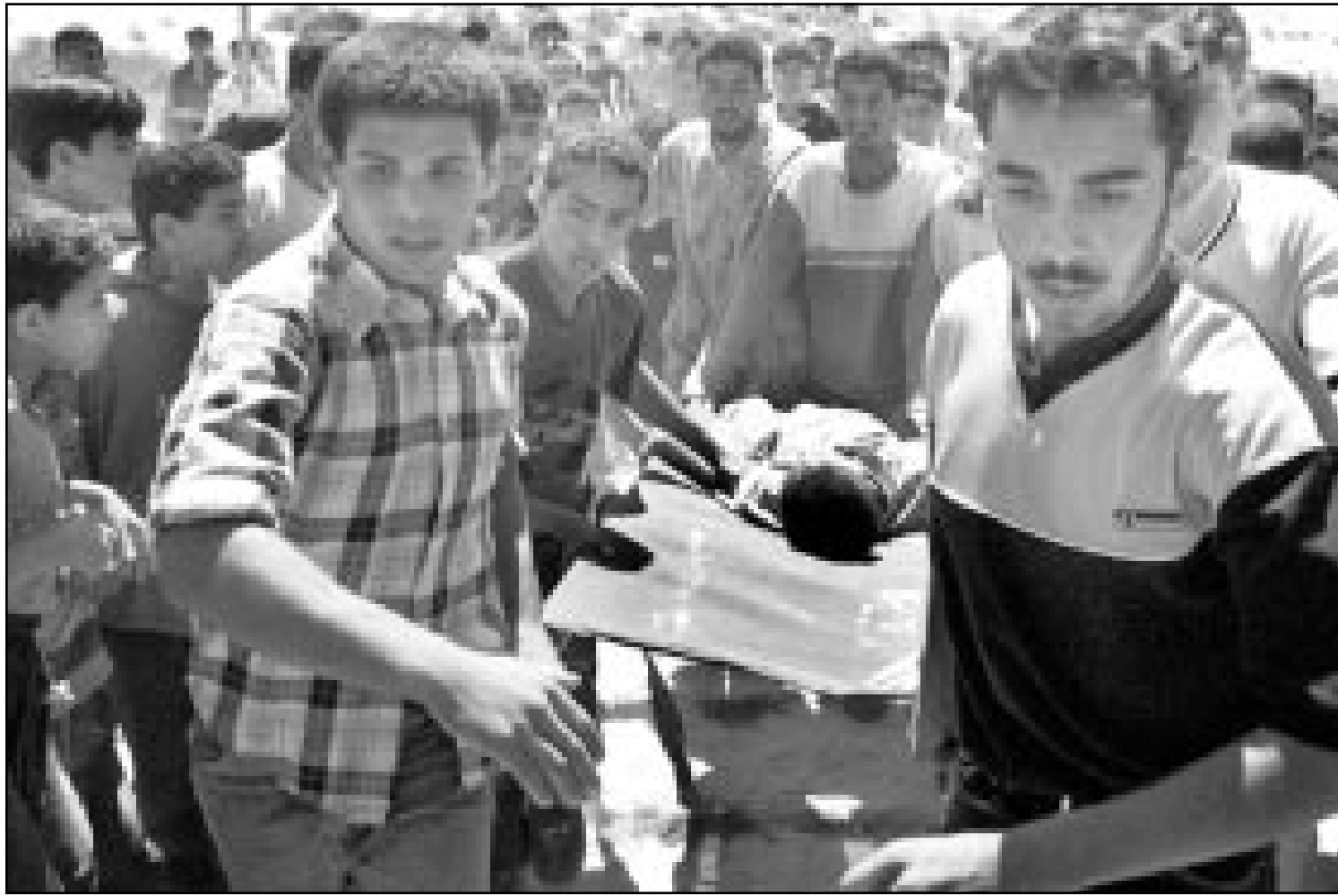
فلسطينيون يحملون جرحيا اصيب بمواجهات مع جنود الاحتلال قرب مستوطنة غوش قليف في قطاع غزة

مستطعنا من الجانب الاسرائيلي بهدف اغلاق المعبر.