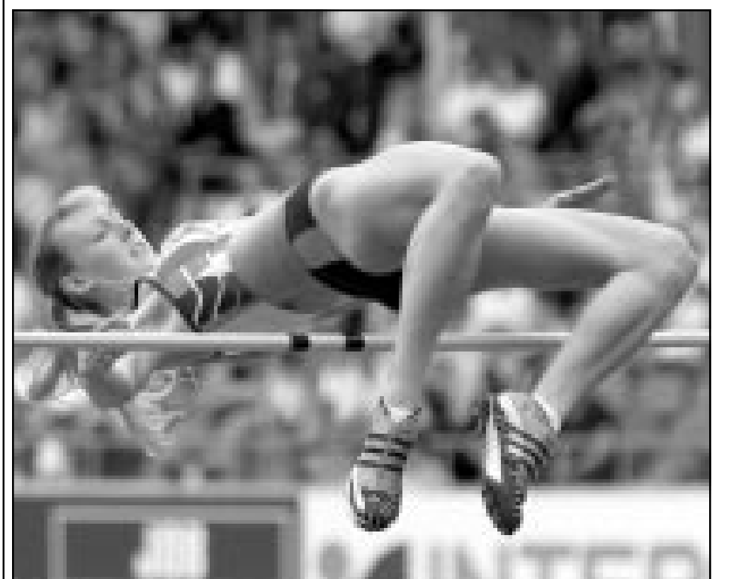
بطلة القوى البريطانية سوزان جونز خلال سباق الفعق العالي للنساء في البطولة الاوروبية في بريمنز بالمانيا وقد فازت بارتفاع 1,95 م

ستدافع عن لقبها في سباق 100 م وستشارك ايضاً في سباق 400 م وستشارك ايضاً في سباق 400 م. وكانت جونز احزرت ذهبية سباق 100 م في بطولة العالم الاخيرة في اشبيلية (اسبانيا) عام 1999، لكنها اصيبت في ظهرها خلال الدور نصف النهائي من سباق 200 م، علماً بانها احزرت برونزية مسابقة الوثب الطويل ايضاً، وبيات الخضرمة ريجينا جايكوبس اول عداءة منذ 17 عاماً تحتل المركز الاول في سباق 800 م و 1500 م كما حلت ثانية في سباق 5