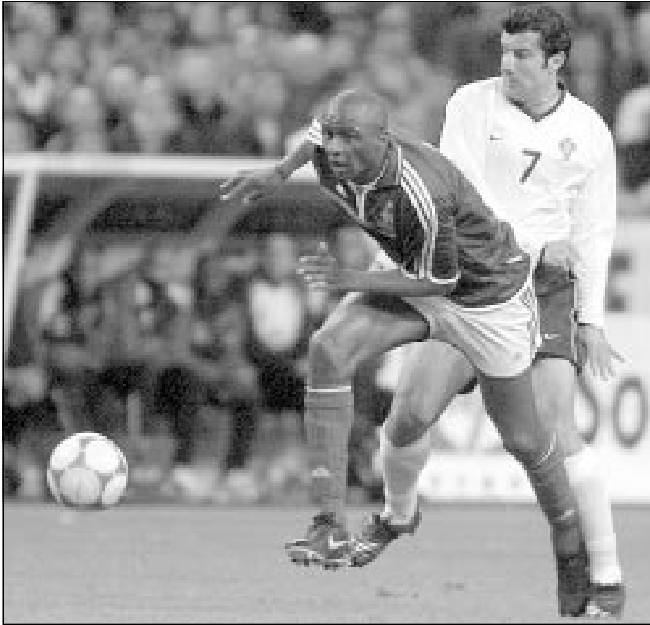
اللاعب الفرنسي باتريك فييرا (يسار)