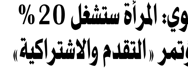
الرباط - «القدس العربي»