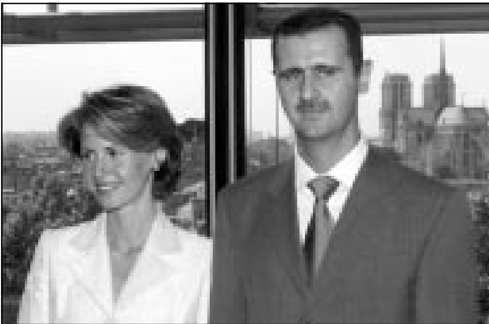
الرئيس السوري وعقيلته اسماء اثناء زيارتهما لمعهد العالم العربي في فرنسا (رويتز)

يحضر قمة الفرنكفونية في بيروت في تشرين الاول (اكتوبر) المقبل بصفة مدعو خاص، وقال في مؤتمر صحافي من المحفل ان تشارك سورية لاننا بلد ذو ثقافة فرنسية، وحتى وان كانت ليست من دول الفرنكفونية فهي لا تشعر بانها بعيدة.