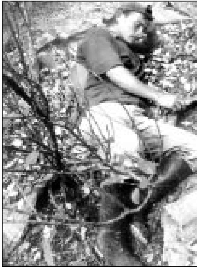
اثنتان من عمال الكوكا يأخذان قسطا من الراحة في ولاية بوتومايو حيث رشت طائرات أمريكية مساحات واسعة من مزارع الكوكا بالبيدات، إلا أن المزارعين يتابعون غرس الشجيرات

التابعة لقضاء بوتومايو ان الرش اكثرت من 17000 فدان من المحاصيل الغذائية والمراعي تعيل أكثر من 4,22 نسمة. وقد اعترف مساعد وزير الخارجية الأمريكية وليام براونفيلد ان الرش طال بعض المحاصيل الزراعية، ولكنه قال ان المزارعين يزرعونها بين شجيرات الكوكا لاخفائها او لمنع الطائرات من الرشها. وقال براونفيلد ان الكامبيونيو الذي يتعدم تخيبة واخفاء الا يحاول حماية زراعة الكوكا وخشخاش الافيون لن يحصل على دعم او اهتمام الجنوبية الكونغرس في الشهر الماضي