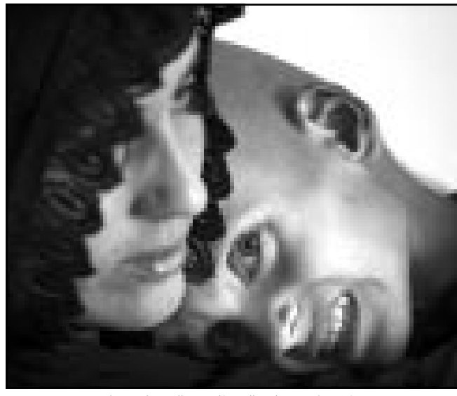
طفل عراقي مصاب بسرطان مع والدته

■ بغداد - اف ب: اعلن مسؤول في المجلس الوطني العراقي ان المجلس طلب من برلمانات عديدة في العالم دراسة امكانية معالجة اطفال عراقيين مصابين بامراض مستعصية في بلدانهم، موضحا ان مجموعة من الاطفال المصابين بسرطان الدم سيوسلون الى اليابان لتلقي العلاج. ونقلت صحيفة «الاعلام» الاسبوعية عن رئيس اللجنة الصحية في المجلس سالم العيشاق قوله ان المجلس «فأخ العديد من البرناتات لمعالجة الاطفال العراقيين المصابين بامراض خطيرة ومستعصية يصعب علاجها داخل العراق بسبب ظروف الحصار الجائر». المفروض منذ حوالي 11 عاما.