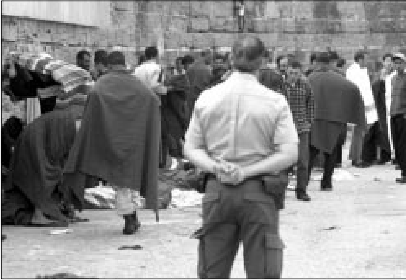
بعض المهاجرين الذين اوقفهم حرس الشواطئ اسبانيا امس الاول بسواحل طرقة

الماضية في مضيق جبل طارق وبالقرق من جزر الكناريه في 71 في حين ان الرقم الاجمالي لعدد الغرقى منذ بداية