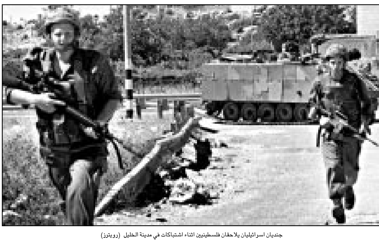
جنديان اسرائيليان يلاحقان فلسطينيين اثناء اشتباكات في مدينة الخليل

الامريكي ليرفع سقف مطالبه من الفلسطينيين. فقد اشترط قبل التحدث عن اي جدول زمني لتطبيق توصيات لجنة التحتد، ان تحترم السلطة الوطنية الفلسطينية وقف اطلاق نار تاما لمدة عشرة ايام، وسيكون الطرف الاسرائيلي مستعدا في اتمامها على بدء مرحلة اختبار للهدنة لمدة ستة اسابيع على الاقل. وشكك شارون بغرض نجاح مهمة باول في المنطقة، معتبرا ان رئيس السلطة الفلسطينية ياسر عرفات اخار طريق «الارهاب» واذا «لم تمارس ضغوطا حثيثة عليه سيستمر على الطريق ذاته». من جهته اقر بوش بضرورة «وقف دوامة العنف»، لكنه شد على الحاجة الى تعزيز التقدم الذي احرز منذ اعلان وقف اطلاق النار، وقال بهذا