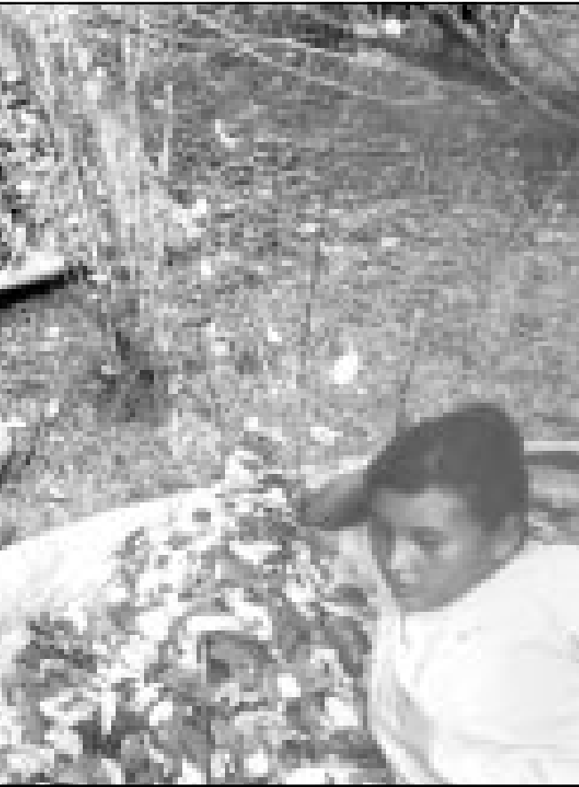
اثنتان من عمال الكوكا يأخذان قسطا من الراحة في ولاية بوتومايو حيث رشت طائرات أمريكية مساحات واسعة من مزارع الكوكا بالبيدات، إلا أن المزارعين يتابعون غرس الشجيرات

في غضون اسابيع قليلة تمكنت طائرات رش الحاصل التي قدمت من الولايات المتحدة من ازالة ثلث المناطق المزروعة بالشجار الكوكايين في هذه الزاوية الرزقاء من كولومبيا. غير ان عدة حقول بدأت تخضر مجددا بشجيرات الكوكا التي غرست حديثا، والفلاحون الذين يعتنون بهذه الشجيرات يقولون انها مصدر رزقهم الوحيد. وقد وعدت واشنطن بأن يوجه هذا الهجوم الجوي ضد عمليات الانتاج على نطاق التصنيع والاتجار. وان يكون مصحوبا بمساعدات للتنمية بملايين الدولارات. وقد وقرت رحلة دامت اربعة ايام في «المنطقة المدمرة» في ولاية بوتامايو مشورات التي حجب بعض الاهداف، ففي قرية الاوروا التي تسيطر عليها المنظمات شبه العسكرية، دمرت مزارع الكوكا مع جماعات سكن العمال تدميرا تاما. ولكن في سان فيسنتي دي لوزون الواقعة على مسافة ساعة واحدة بالسيارة دمرت ايضا حقول صغيرة بمساحة فدان واحد وتخص عائلات مفردة. ويقول بعض المزارعين الصغار انهم لم يخسروا اشجار الكوكا بحسب نتيجة لرش حوالي 85,000 غالون من مبيدات الاعشاب، بل محاصيلهم الغذائية ايضا. ولم يصل إلى الفلاحين الكامبيونوس - أي من مشاريع التنمية طويلة الأمد التي وعدت بها واشنطن من خلال الهجوم الأمريكي على المخدرات والذي كلف مليار دولار. ولا تزال مشاريع التنمية الريفية في المنطقة الجنوبية من كولومبيا، مثل إنشاء معالم لتعليب المواد الغذائية بروس التصدير، حبرا على ورق. ويعرف جورج واخنتهايم، مدير مكتب الوكالة الأمريكية للتنمية الدولية في كولومبيا ان تنفيذ هذه المشاريع سيستغرق وقتا وهي تتطلب الكثير من الالتزام واستمرار الدعم الأمريكي.