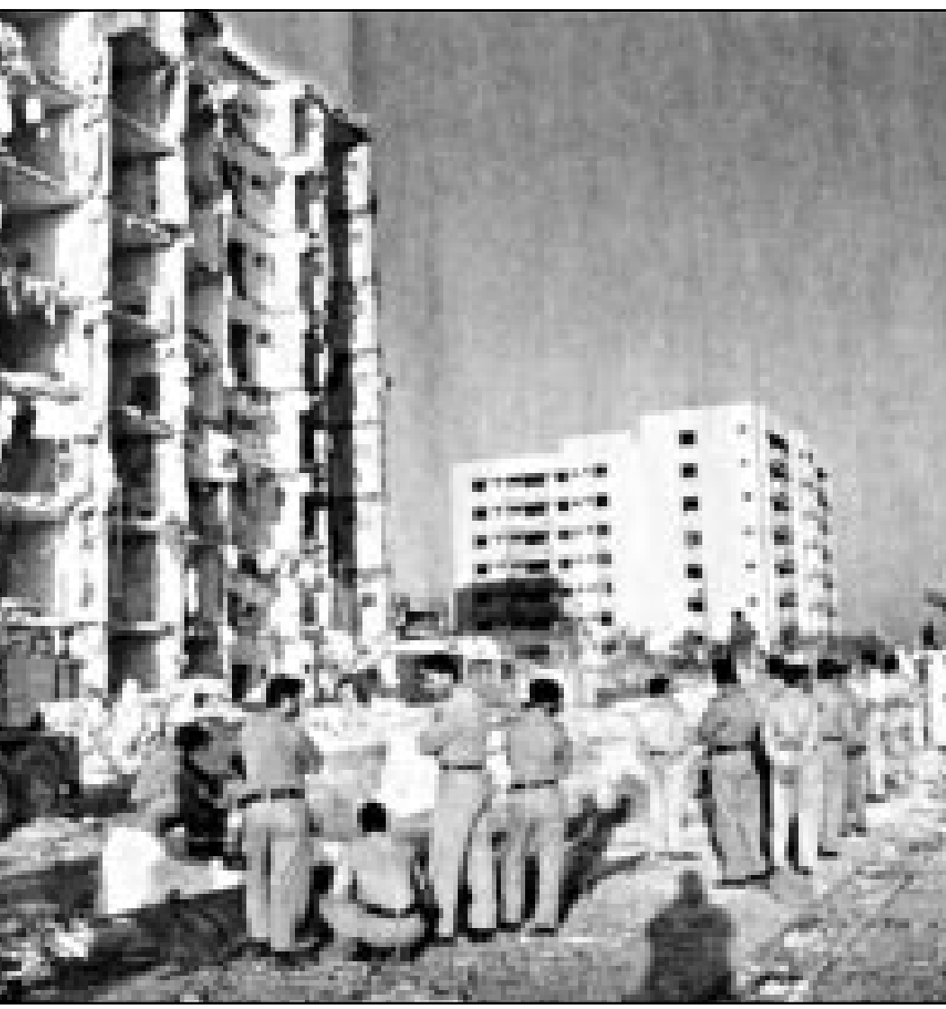
محققون سعوديون وامريكيون امام مبنى المارينز المدمر في الخبر

وفي خريف عام 1995 او عز ضابط عسكري إيراني الى البحر والصايغ امريكية في المنطقة الشرقية بالعربية السعودية بتوجيه من المغسل، واستنادا الى اللائحة راقب البحر مواقع أخرى بإيعاز من ضابط عسكري إيراني. وخلال هذه الفترة أرادت المهون ورمضان والمعلم ان يسيروا اجراء الخبر هو موقع عسكري امريكي هام وبدوا مجهودا في المنطقة لاجراء موقع لتخزين المتفجرات.