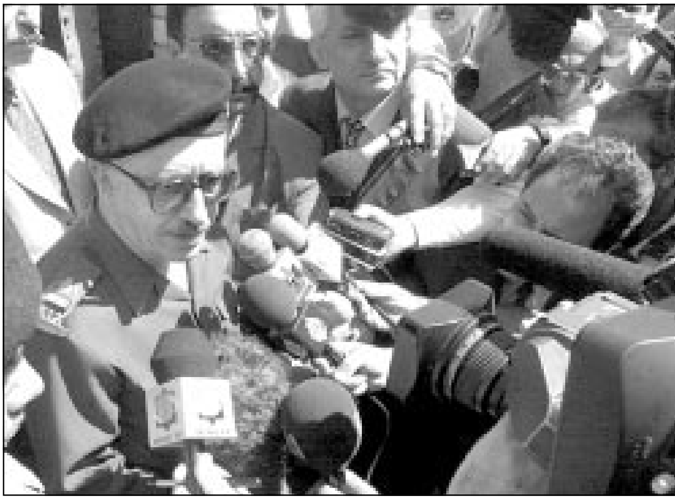
نائب رئيس الوزراء العراقي طارق عزيز يتحدث للصحافيين في بغداد

■ بغداد - اف ب: اتهمت صحيفة «الثورة» العراقية أمس الاربعاء لجنة التعويضات التابعة للامم المتحدة بالقيام بعمليات «نهب منظمة» لاموال العراق عن خلال استقطاع مبالغ من عائدات النفط العراقي، مؤكدة ان المشروع الامريكي - البريطاني يقترح «نهب نسب اخرى منها بذرائع واغذية اخرى».