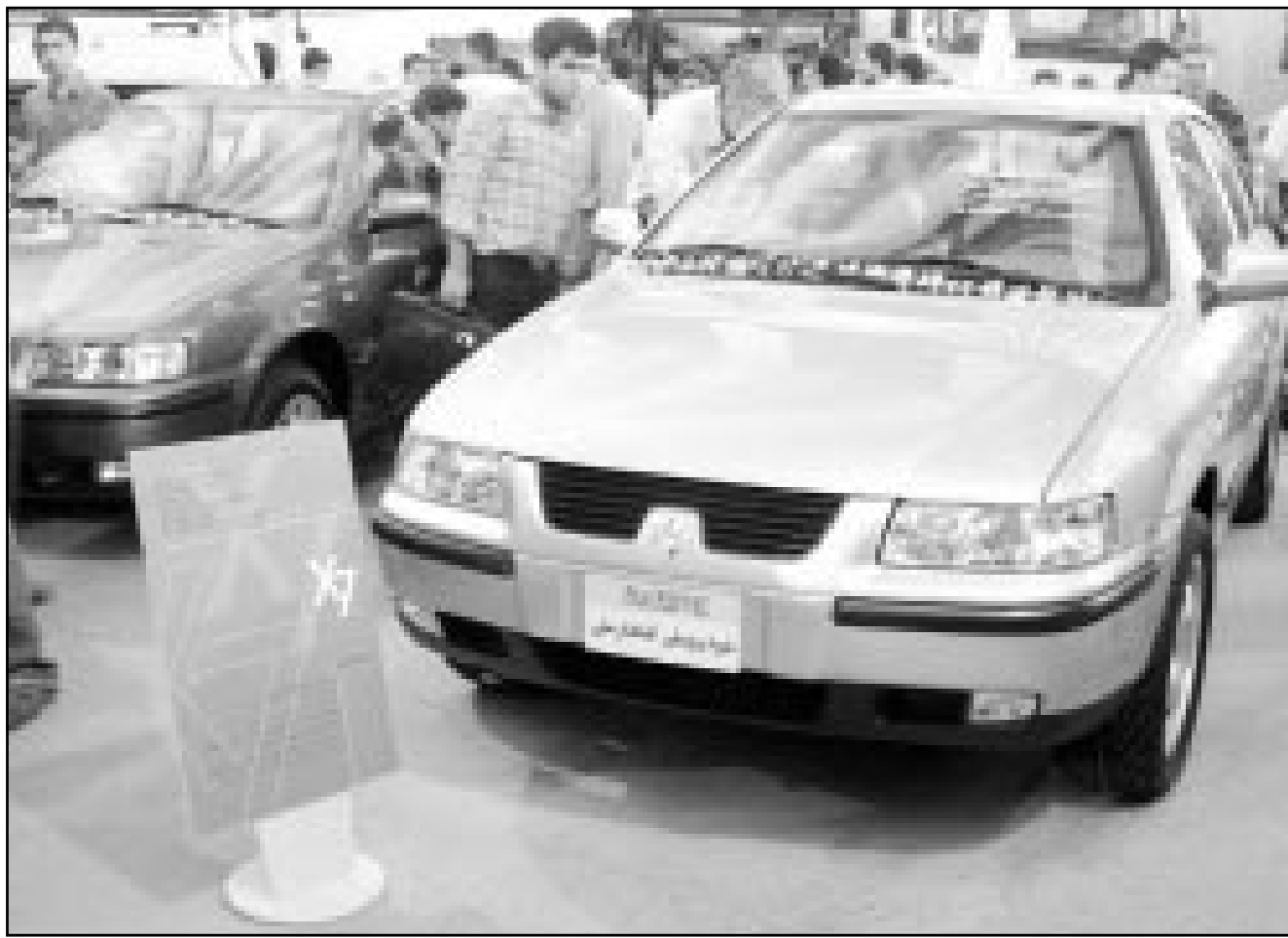
ايرانيون يتطلعون الى سيارة اكس17كس المصنوعة بالكامل بايد وطنية والتي سيدأ تسويقها في ايلول المقبل بسعر يبدأ بما يعادل 9 آلاف دولار

■ طهران-اف.ب: اكد نائب وزير الطاقة الايراني غلام رضى منوشهري مساء الثلاثاء ان ايران التي تواجه في الوقت الراهن نقصا حادا في المياه، لن تصدرها الى الكويت قبل خمس سنوات. وقال المسؤول الايراني للتلفزيون هناك مشروع فقط. وتحقيقه يحتاج في اي حال الى خمس سنوات على الاقل، مؤكدا بصورة ضمنية المفاوضات الجارية التي سبق ان اعلنت عنها الكويت لكنه نفى التوصل الى اتفاق. وكانت شركة غالف بوتيليتي التي تتخذ من لندن مقرا لها قد اعلنت في 18 حزيران (يونيو) ان الكويت وطهران اتفقتا على مد انبوب يبلغ طوله 550 كيلومترا لنقل المياه من شمال ايران الى الكويت. واوضحت الشركة التي تضم مساهمين ايرانيين وقيوتيين ان الكويت ابرمت اخيرا الاتفاق بعد مفاوضات استمرت اكثر من عام لانشاء الانبوب الذي تقدر كلفته بحوالي ملياري دولار (2.3 مليار يورو).