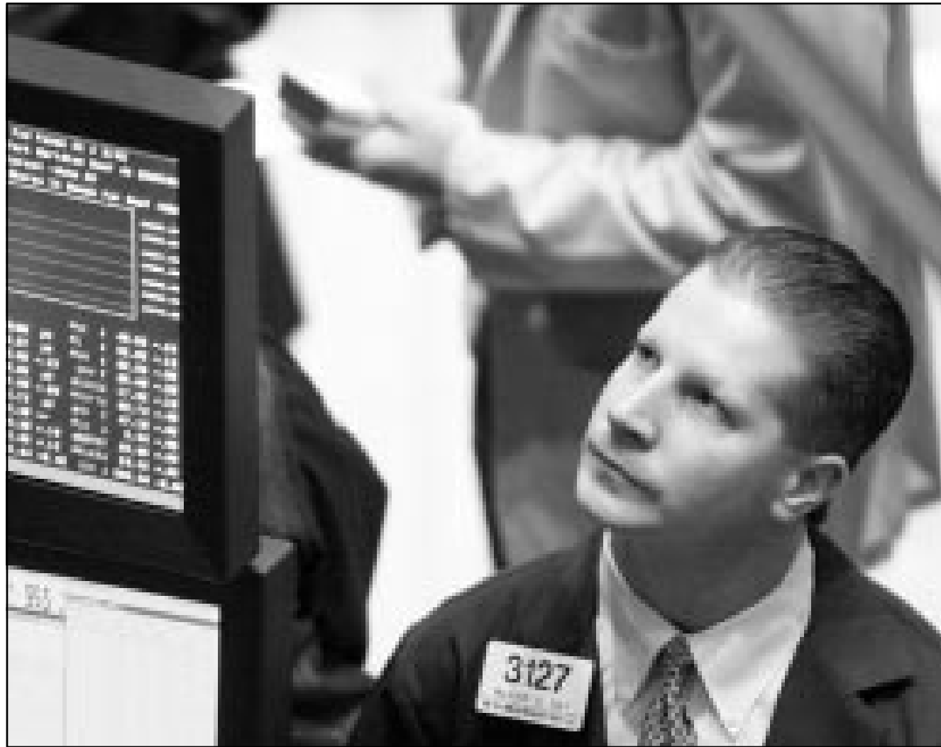
تتعاظم في بورصة نيويورك حيث اصبحت تركيز اهتمام المستثمرين عما سيسفر عن اجتماع لجنة الاسواق المفتوحة في مجلس الاحتياطي الفيدرالي (اف ب)

العالية الثانية». تنخفض 51 الفا في حزيران (يونيو)، ويتوقع صدور بيانات شهر يونيو الاسبوع المقبل. وقال بانرجي انه حدث مرة واحدة فقط منذ الحرب العالمية الثانية ان انخفضت العمالة على مدى ثلاثة اشهر متتالية في خارج حياصة كساد. ويرصد خبراء الدورات الاقتصادية كذلك مستوى الدخل والمبيعات انهم يقولون انها عوامل اقل اهمية، فالدخل الشخصي الذي