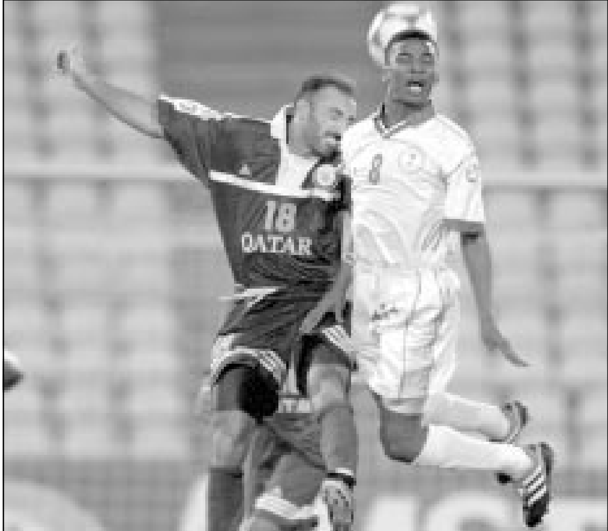
لقطة من إحدى مباريات منتخب قطر لكرة القدم (صورة من الإرشيف)