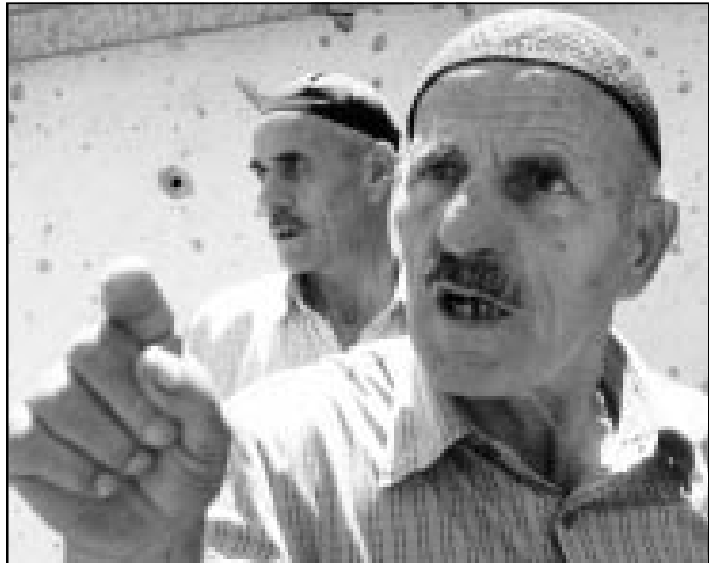
مسن الباني يؤكد للمصاحفين نعمة للثوار بعد مدامعة الجيش المقدوني لقرية ارسينوف

■ سكوبيي - وكالات: قال شهود ان قوات الامن المقدونية قصفت امس قرية يسيطر عليها الثوار الالبان في شمال شرق البلاد. وقال مصور في رويترز ان القوات عززت موقعا عسكريا عند مشارف قرية اومين دول بينما قصفت المدفعية والديابات قرية نيكوستاك القريبة. وطلب من الصحافيين مغادرة المنطقة وسط بوادر هجوم بري على مواقع الثوار.