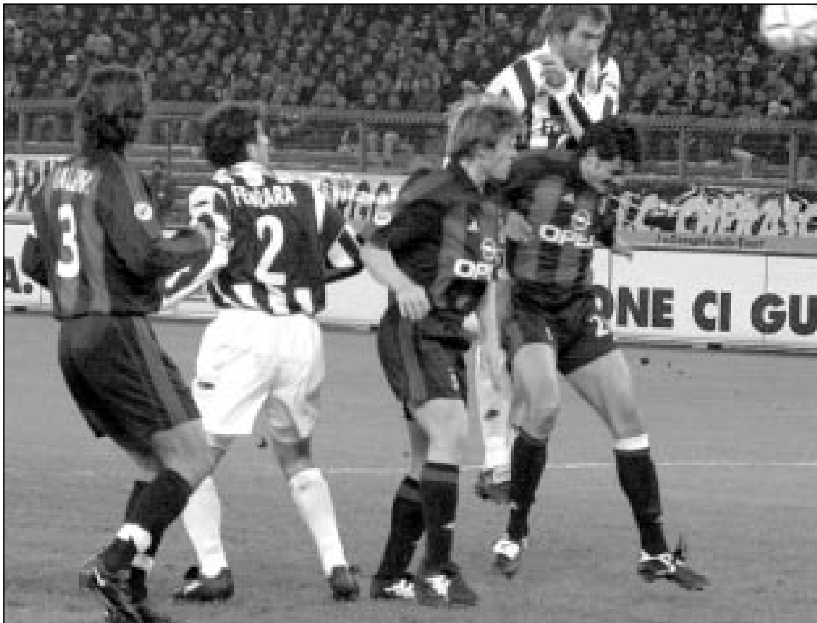
فريق لاتسيو الإيطالي سيفقد لاعبه البرتغالي «كوتو» بسبب وقته دولياً

فقد اشترى المهاجم الفرنسي جيفرزمن ايفرتون مقابل عشرة ملايين جنيهه ولاعب خط الوسط جوفاني فان برونكهورست من رينجرز الاسكتلندي مقابل 8.5 مليون جنيه. وقال الفرنسي ارسين وينجر مدرب ارسنال ان هذا الانفاق الضخم زاد الضغط على النادي لينافس مانشستر يونايتد على بطولة الدوري الموسم القادم بعد ان احتكرها الاخير في المواسم الثلاثة الماضية.