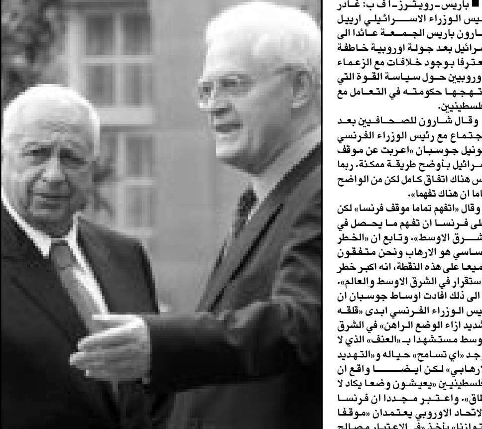
رئيس الوزراء الفرنسي ايجويل جوسبان لدى اجتماعه مع نظيره الاسرائيلي ارييل شارون