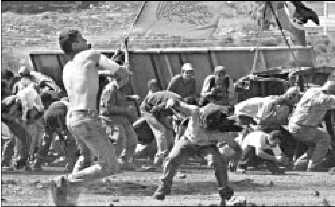
فلسطينيون يرشقون قوات الاحتلال بالحجارة اثناء اشتباكات في رام الله الجمعة

القدس - «القدس العربي»: وكشف في اسرائيل امس عن وثيقة قدمها جهاز الامن العام الاسرائيلي (الششايباك) الى رئيس الوزراء الاسرائيلي ارييل شارون تحسبه على التخلص من الرئيس الفلسطيني ياسر عرفات، وجاء في خلاصة الوثيقة التي اوردتها صحيفة (معاريف) ان «ياسر عرفات الرجل يشكل تهديدا خطيرا على أمن الدولة، والمخاطر التي يخلفها غيابه المحتمل عن الساحة اقل من مخاطر وجوده فيها».