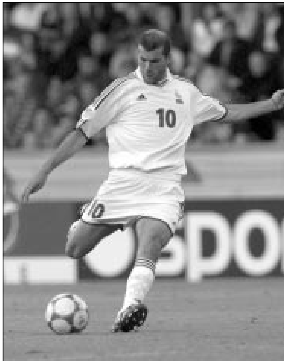
زين الدين زيدان