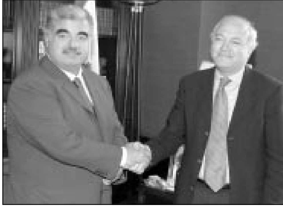
رئيس الحكومة اللبنانية رفيق الحريري لدى استقباله المبعوث الخاص الاوروبي للشرق الاوسط ميغيل انخيل موراتيونس الجمعة

على الحدود اللبنانية الاسرائيلية. وقالت معلومات وعيها مكتب بري عن لقائه ببرينز انه ابلى المبعوثين السوريين والروس والفرنسيين في الاجتماعات لجهة التصعيد العسكري في المنطقة وعدم الوصول الى خطر نشوب حرب اقليمية». واضافت المعلومات ان بري قال «حالة الحرب لا تزال قائمة وذلك من خلال الطعنات الجوية الاسرائيلية في الاجواء اللبنانية وعدم تسليم اسرائيل خرائط الانعقاد التي خلفتها في جنوب لبنان واستمرار احتلال قسم من