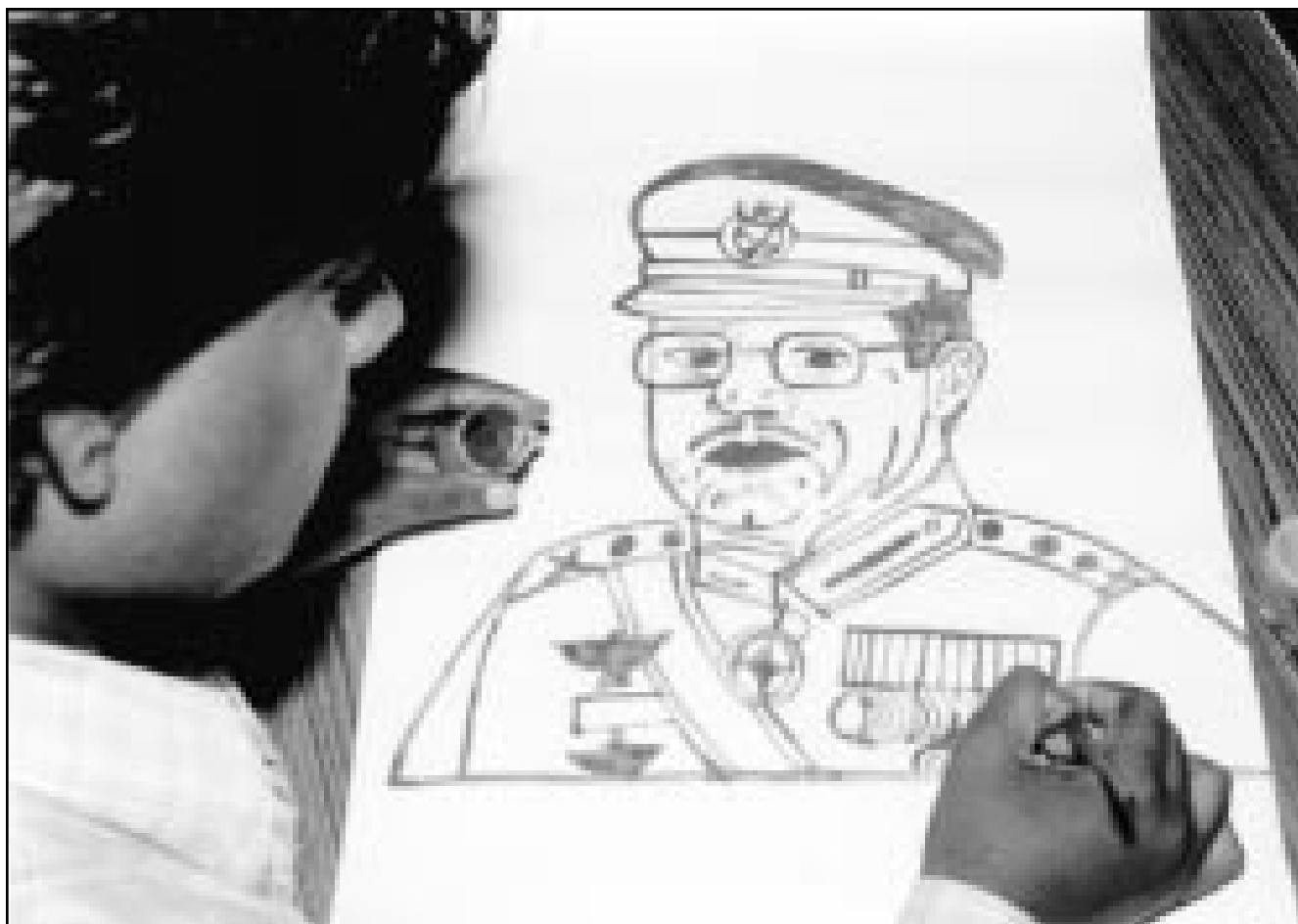
مطل هندي يرميه بسدلاً من الألوان - بورتريه لحاكم باكستان برويز مشرف

نيودلهي - وكالات: تعاود الهند وباكستان الأحد المقبل حواراً صعباً تسعيان خلاله الى ايجاد حل لنزاع كشمير الذي يشك واحد من أكثر النقاط الساخنة خطورة على وجه الكوكب إذ انه يدور بين قوتين نوويتين معلنتين. وقد استبقت حركة الثوار في كشمير الدعوة من اسلام اباد هذا الاستحقاق باعلان رفضها للقمة التي ستعقد في اغرا بالهند بمشاركة الرئيس الباكستاني الجنرال برويز مشرف ورئيس الوزراء الهندي اتال بيهاري فاجبايي. وأعلن أمس ان 11 قتلوا خلال اعمال عنف واشتباكات بين القوات الهندية والثوار في كشمير. من ناحيتها اصرت الهند على ان باكستان ما تزال تحتجز اسرى حرب ترجع الى عام 1971 حين خاضت الدولتان حرباً تمخضت عن قيام بنغلادش. وقالت نيروبايا راو المتحدثة باسم وزارة الشؤون الخارجية الهندية لرويترز: «هناك 54 أسير حرب في باكستان وهذه القضية متار قلق دائم لنا». واعلن الاربعة المتحدث عسكري باكستاني ان بلاده لا تحتجز اي اسرى من الحرب الهندية - الباكستانية عام 1971 في سجونها. وقال المجر جنرال راشد قريشي خلال مؤتمر صحافي الاربعة «لا يوجد اسرى فيما يخصنا». ونظم عشرات المتظاهرين الهنود احتجاجات امام السفارة الباكثانية في مطلع الاسبوع ورتشقوا السفارة بالحجارة مطالبين بالافراج عن اسراهم. ويقد مسؤولون هنود ان هناك نحو 1300 هندي في سجون باكستان من بينهم 54 اسير حرب، بينما تقول باكستان ان سجونها بها 135 هندي فقط. ورأى دبلوماسي في العاصمة الباكستانية من جانبته ان «باب الال» في حدود تقارب بين البلدين حول