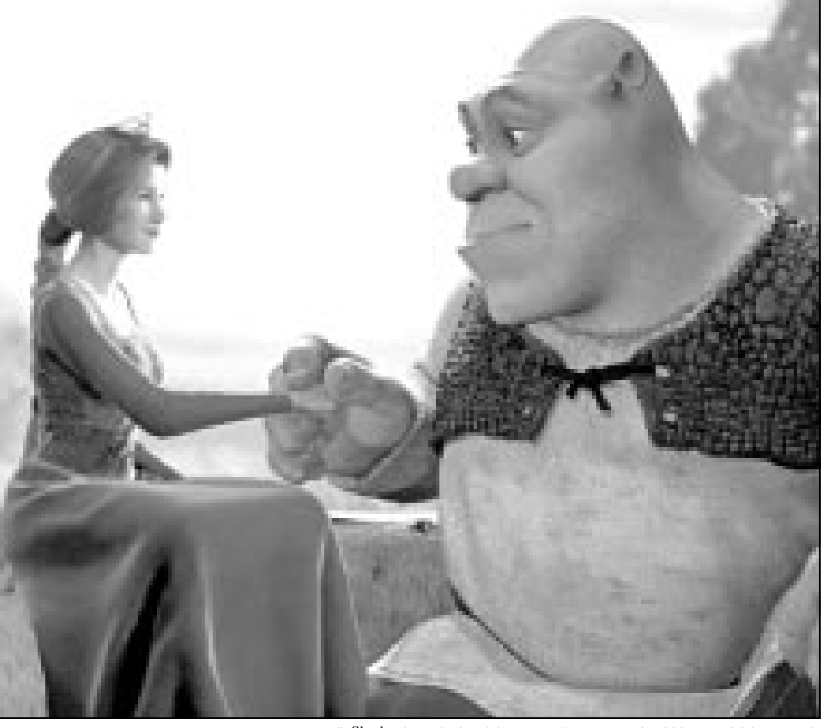
الاميرة فيونا (كاميون دياز) لديها سر تخفيه عن المسخ شريك (مايك مايرز) في فيلم «Shrek» الكوميدي