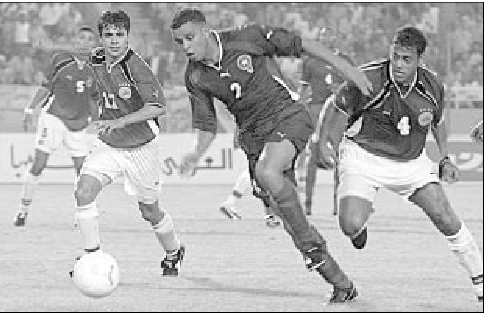
لقطة من احدى مباريات منتخب مصر (صورة من الاريش)

لاعبيه، فاملهم لا تزال قائمة للتلالهل الى النهائيات.»