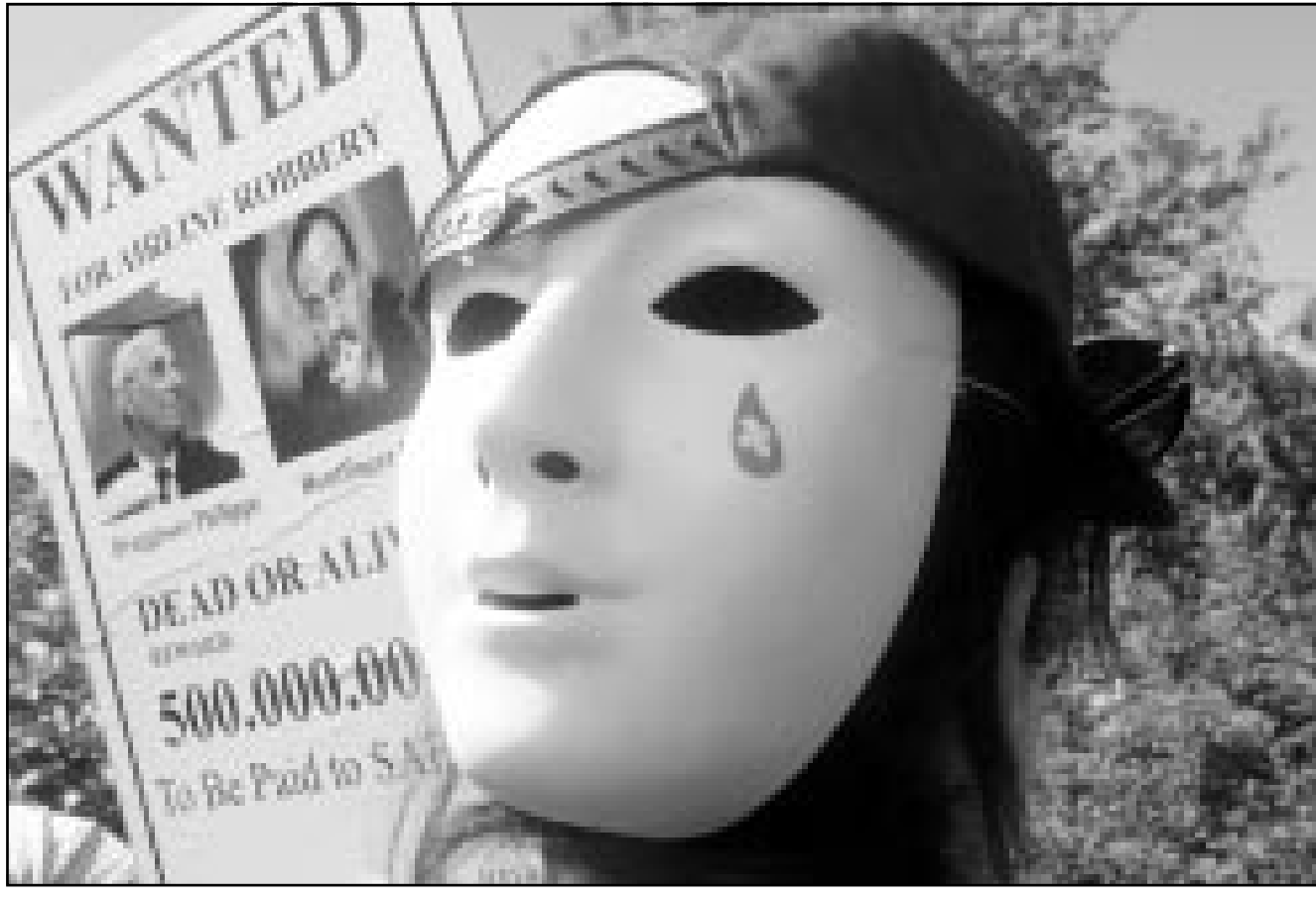
مستخدمة في شركة الطيران البلجيكية سيبينا تتردي على مؤخرة رأسها فتاع الاسي خلال احتجاج جرى امس خارج مقر ادارة مجموعة سويس اير في زيورخ التي ملك حصة رئيسية في الشركة البلجيكية والتي تدرس حاليا خطة لاعادة هيكليتها بخفض المستخدمين ان تتضمن تسريحات واسعة

موسكو - مع سوجاتا راو: قالت شركات النفط الروسية امس الخميس انها تأمل ان تترجم مساندة موسكو للعراق في اللوحة الاخيرة بينها وبين الامم المتحدة الى صفقات مربحة لتصديره وكذلك انتاج النفط الخام العراقي. وقال وزير التجارة العراقي محمد مهدي صالح هذ الاسبوع ان روسيا سيكون لها اولوية فسي الصفقات في المستقبل «تقديرا لمعارضتها