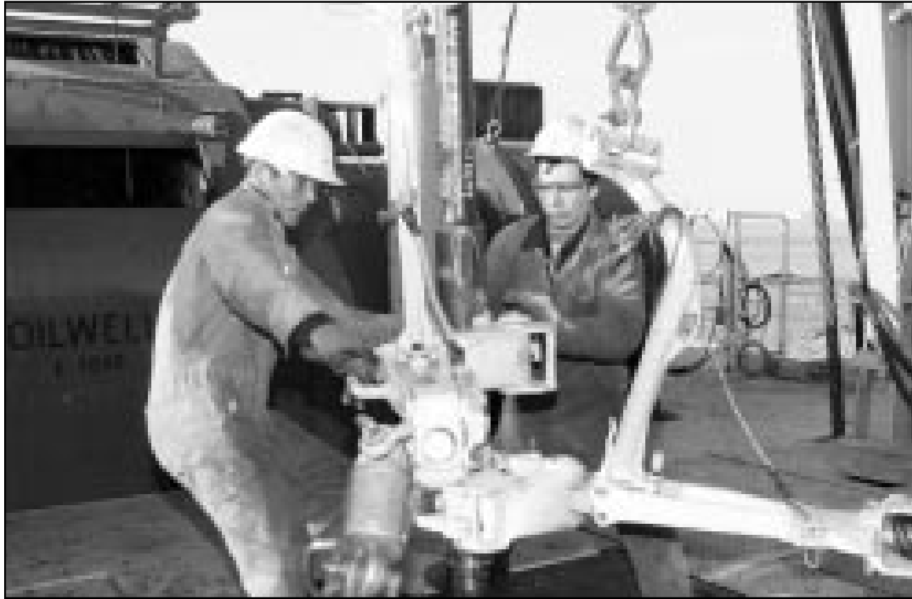
عاملا نطق على منصة بحرية في شمال كازاخستان