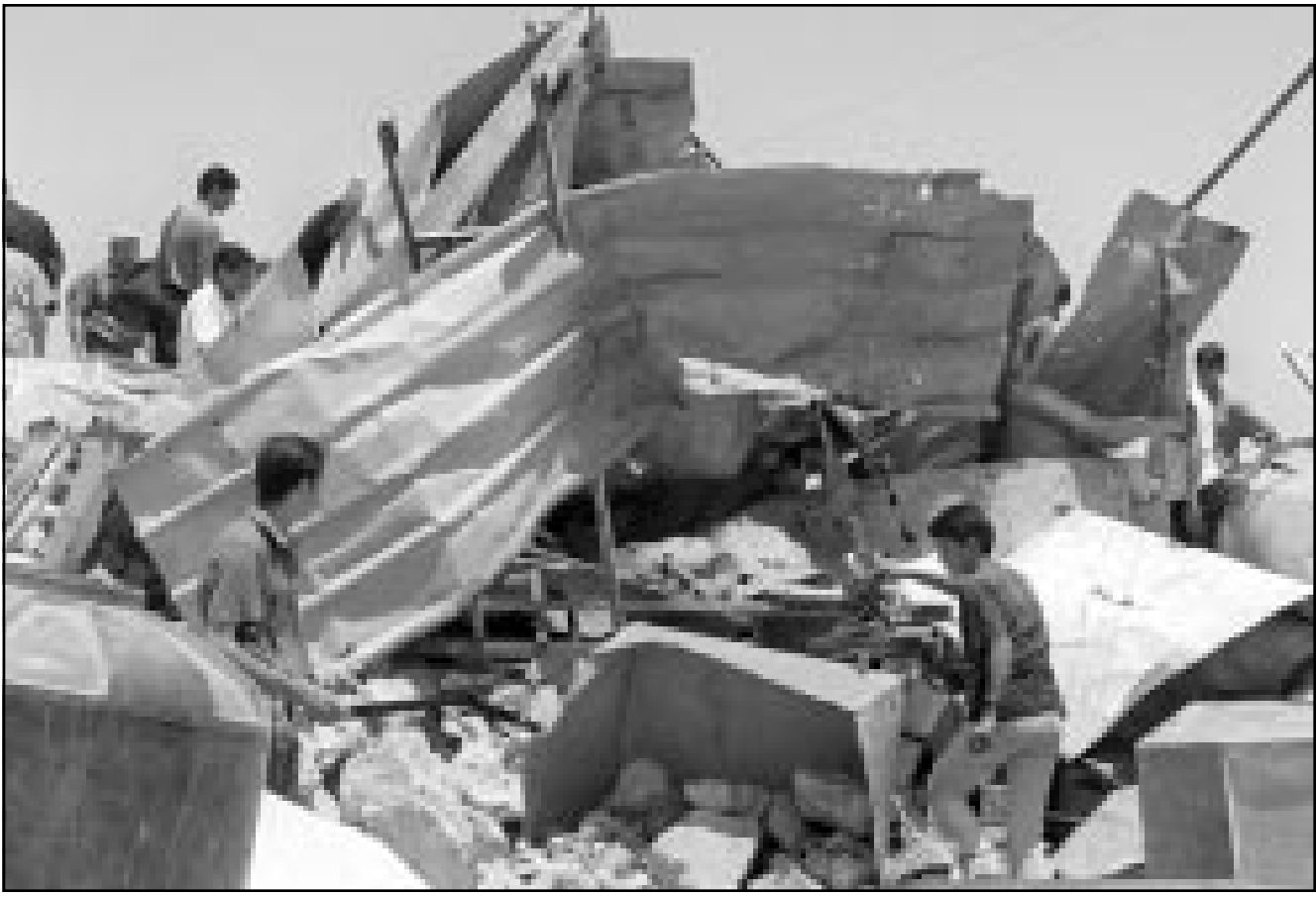
فلسطينيون يتفقدون آثار الدمار بعد القصف الإسرائيلي على مدينة نابلس