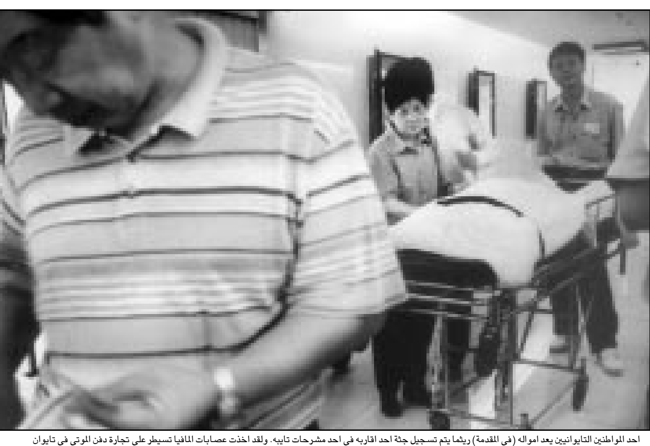
احد المواطنين التايوانيين بعد امواله (في المقدمة) وربما يتم تسجيل جثة احد اقاربه في احد مشرحات تاييه. ولقد اخذت عصابات المافيا سيطرة على تجارة دفن الموتى في تايوان