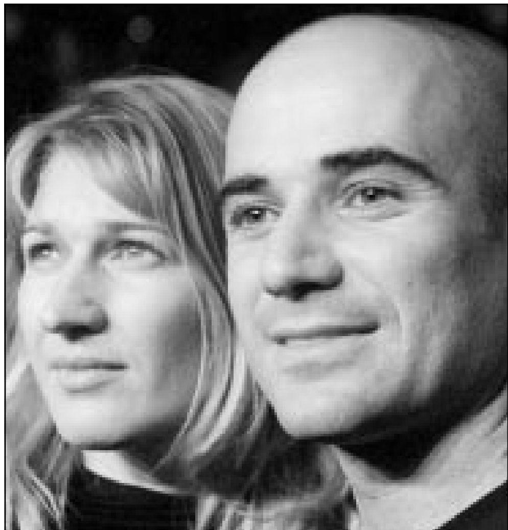
لاعب التنس الامريكى اندريه اغاسي وزوجته لاعبة الالعاب المائية المعتزلة شتيغي غراف ينتظران مولودهما الاول قريباً. (رويترز)