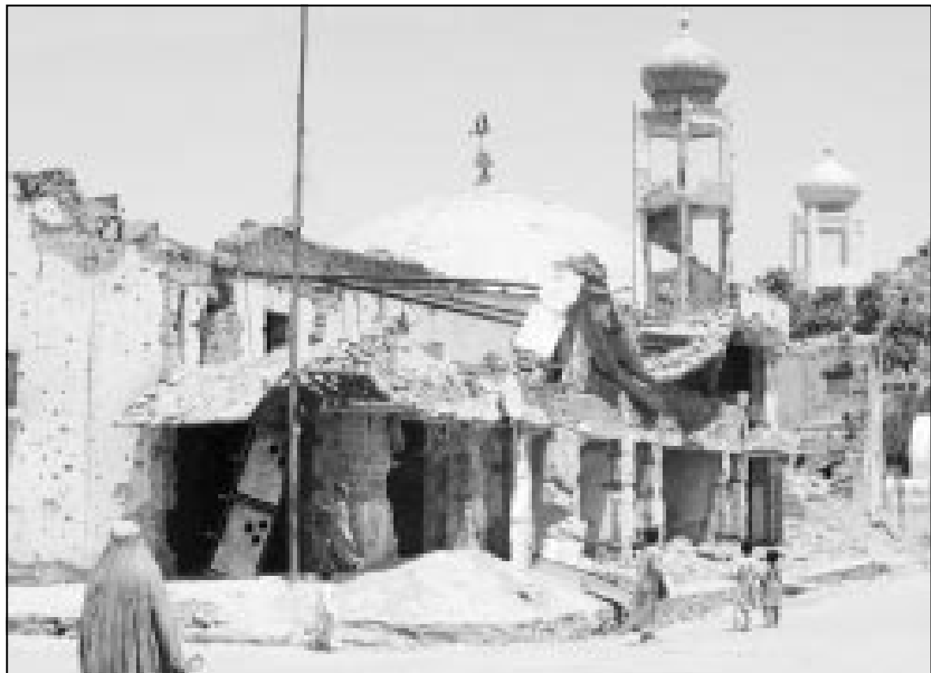
دمار في كابول بطلال اماكن العبادة (رويترز)

وسألها شخص انكليزي من الحاضرين: «اعتقدن ان طالبان بامكانها ان تلعب دوراً في مساعدة العالم في العثور على اسامة بن لادن وتوقيفه؟ فاجابت: «كلا، هل لديك اي معلومات اضافية عما اعرفه في هذا الشأن؟» واختتمت بقولها ان العائلة المالكة الافغانية لن تعود الى الحكم في افغانستان، الا بعد اجماع الافغانين على طلب بذلك. وبما ان اجماع الافغانين يعتبر ان معارضة احمد شاه مسعود والشبيحة الافغانية تشكل بديلاً مقبولاً لاكثرية الافغانين. واشار السفير البريطاني السابق في افغانستان الى ضرورة التركيز على دور رجال الدين (Mullahs) في القرى الافغانية في محاولات مساعدة الشعب الافغاني لتجاوز محنته الاقتصادية ووضاعة الحالية. وافقت معه الحاضرة على اهمية الموضوع، واعتبرت ان هذه المجموعة بامكانها ان تسد الفراغ الذي ادعت حركة طالبان انها تسده في السابق، ولم تعتبر ان معارضة احمد شاه مسعود والشبيحة الافغانية تشكل بديلاً مقبولاً لاكثرية الافغانين.