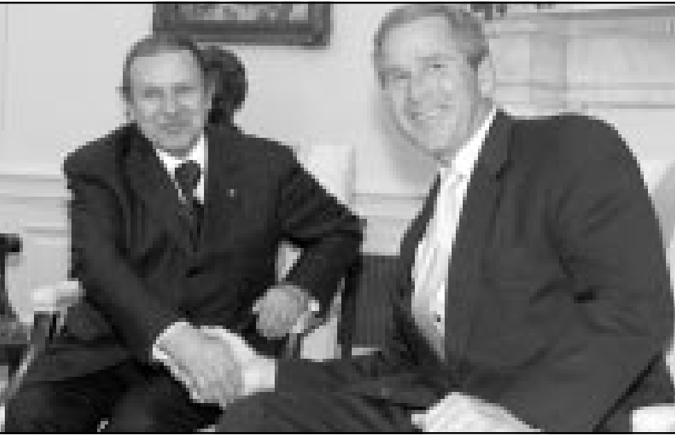
جورج بوش وبوتفليقة في البيت الابيض يوم الخميس

وقال مسؤول امريكي ان بوتفليقة والسلطات الامريكية اتفقا يوم الجمعة على توقيع اتفاق - اطار على صعيد التجارة والاستثمارات.