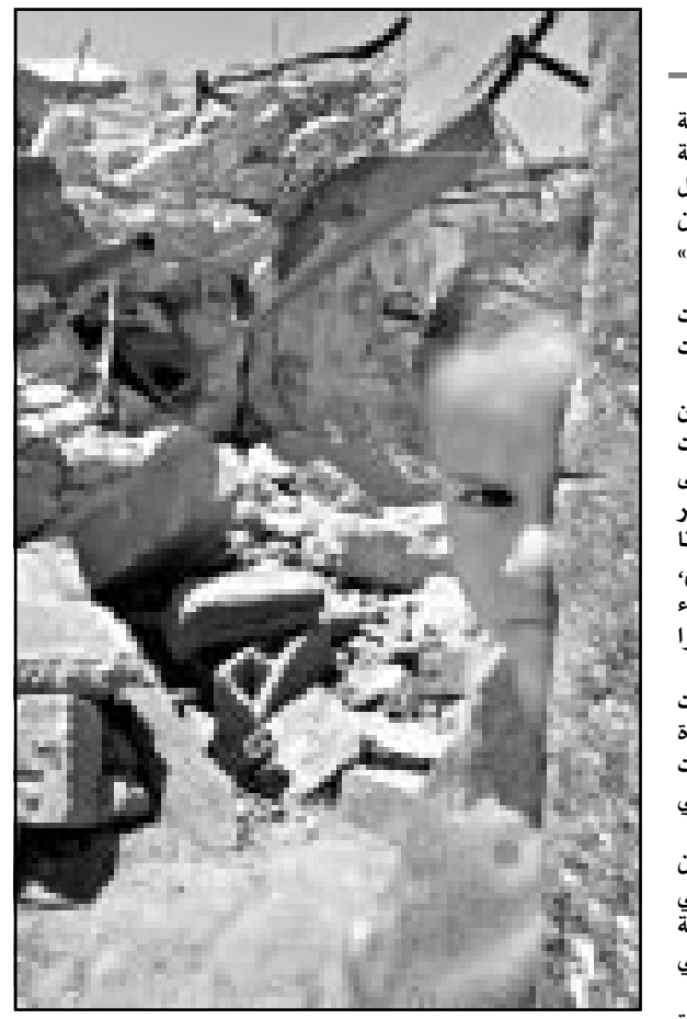
طفلة تغف الى جانب انقاض منزلها الذي دمته القوات الاسرائيلية في رفح

وفي رام الله احرق المتظاهرون صور رئيس الوزراء الاسرائيلي ارييل شارون والرئيس الامريكي جورج بوش ووزير الخارجية الامريكي كولن باول. الى ذلك زعمت صحيفة «هارتس» الجمعة ان سورية اجرت في الثاني من تموز (يوليو) تجربة على صاروخ ارض-ارض من طراز سكود مزود برأس كيميائي، داخل اراضيها. وقال العلق العسكري في الصحيفة ان الصاروخ هو من طراز «سكود-بي» الذي يبلغ مداه 300 كلم. واضافت الصحيفة ان آخر تجارب اطلاق صواريخ سورية حصلت في اليلول (سبتمبر)