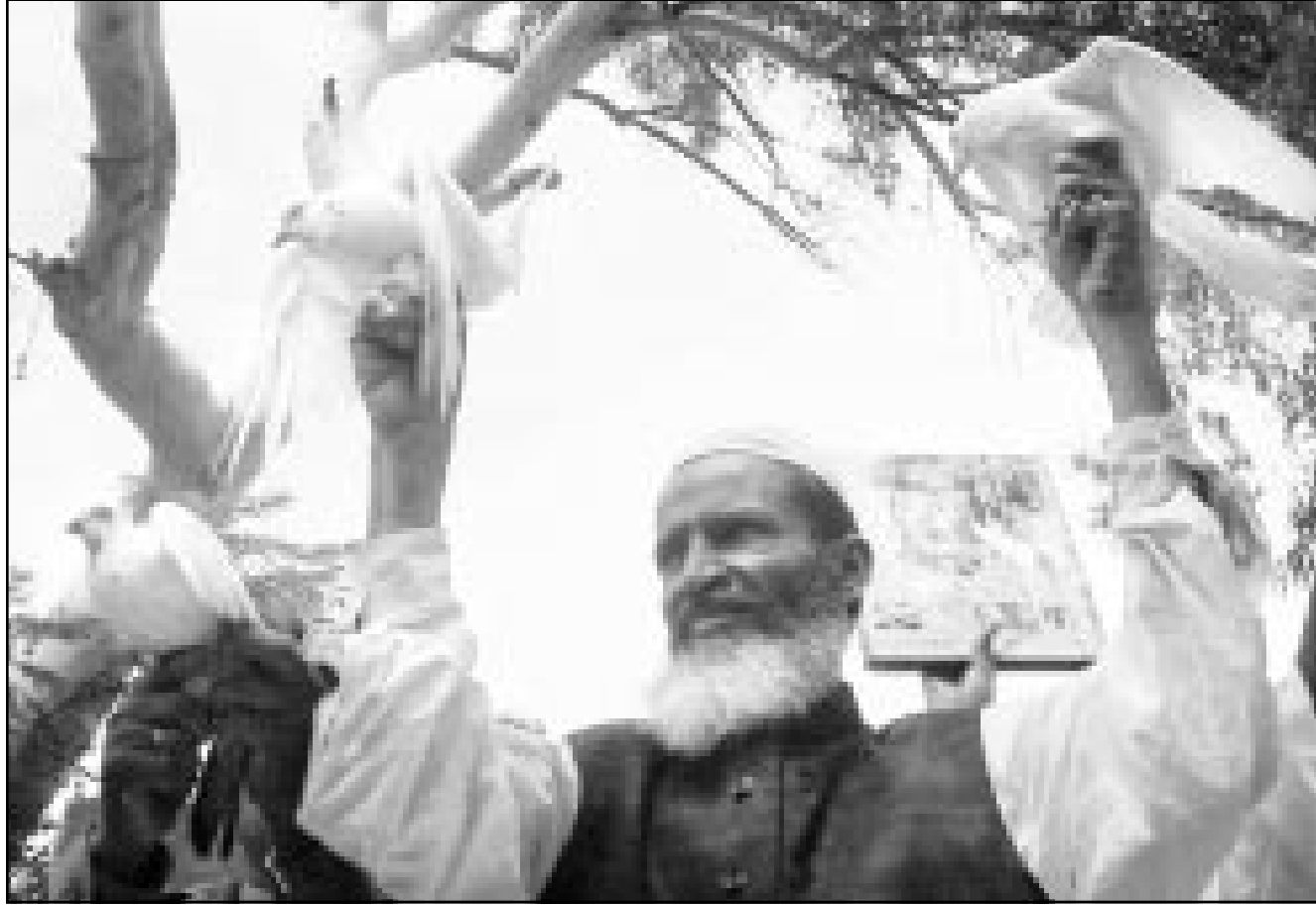
باكستاني يطلق حمامات بيضاء في كراتشي الجمعة تعبيراً عن دعمه للقمة