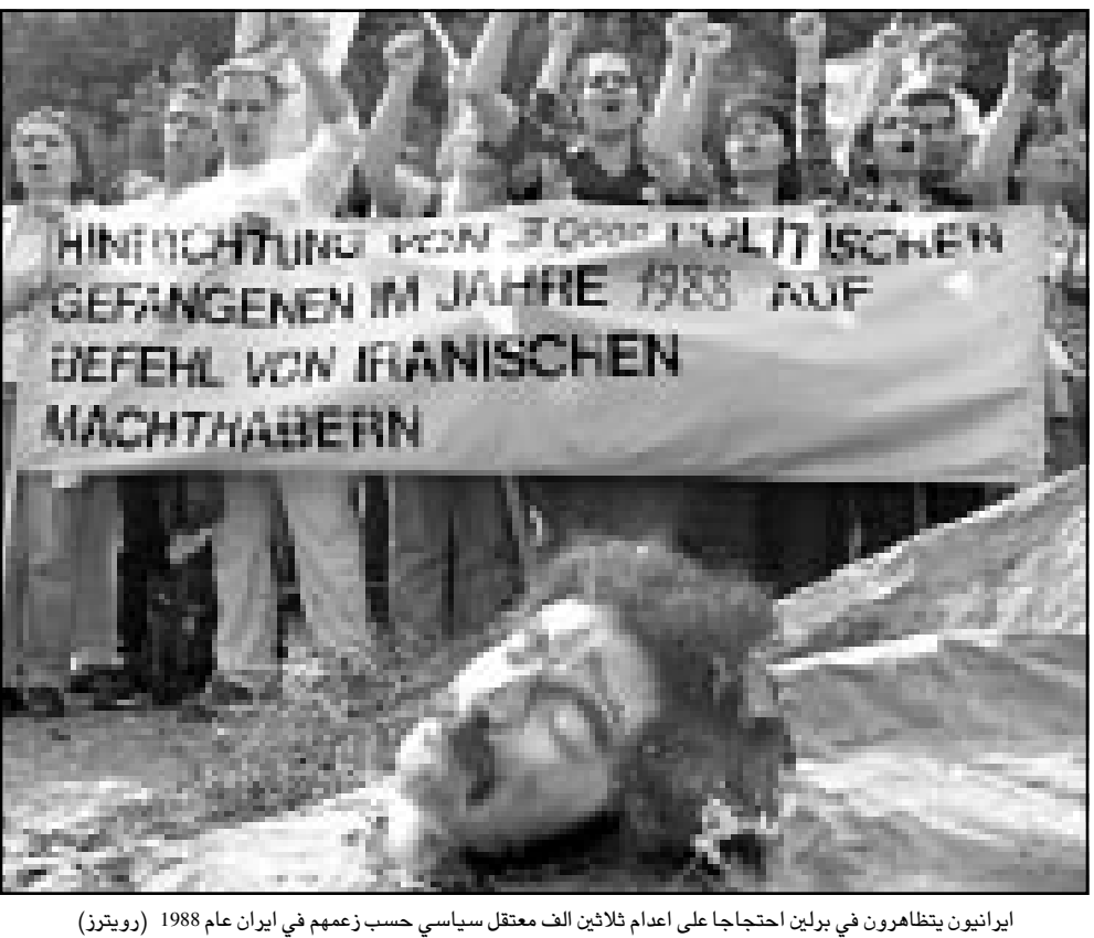
ايرانيون يتظاهرون في برلين احتجاجا على اعدام ثلاثين الف معتقل سياسي حسب زعمهم في ايران عام 1988

الملفات بين البلدين بما فيها المشكلات حول بحر قزوين ستبحث (اواخر هذا الشهر) واثناء زيارة علييف، الى طهران للتوصل الى تسويتها..» (اكدت ايران امس زيارة علييف وشهدت على رغبتها في انهاء سوء التفاهم» بين البلدين كما اوردت وكالة الانباء الازربيجانية الرسمية. (ونقلت الوكالة عن وزارة الخارجية كمال خزاي ونظيره الازربيجاني ولايت غوليف بحثا مساء امس الخميس هاتفيا «لشركات ذات الاهتمام المشترك بين البلدين المسلمين» وكذلك «الزيارة المرتقبة» للرئيس علييف الى طهران. (ودعا غوليف الى «الحوار» بعد بعض سوء التفاهم» في العلاقات بين طهران وباكو كاد يتحول الى ازمة خطيرة اثر قيام البحرية الايرانية في