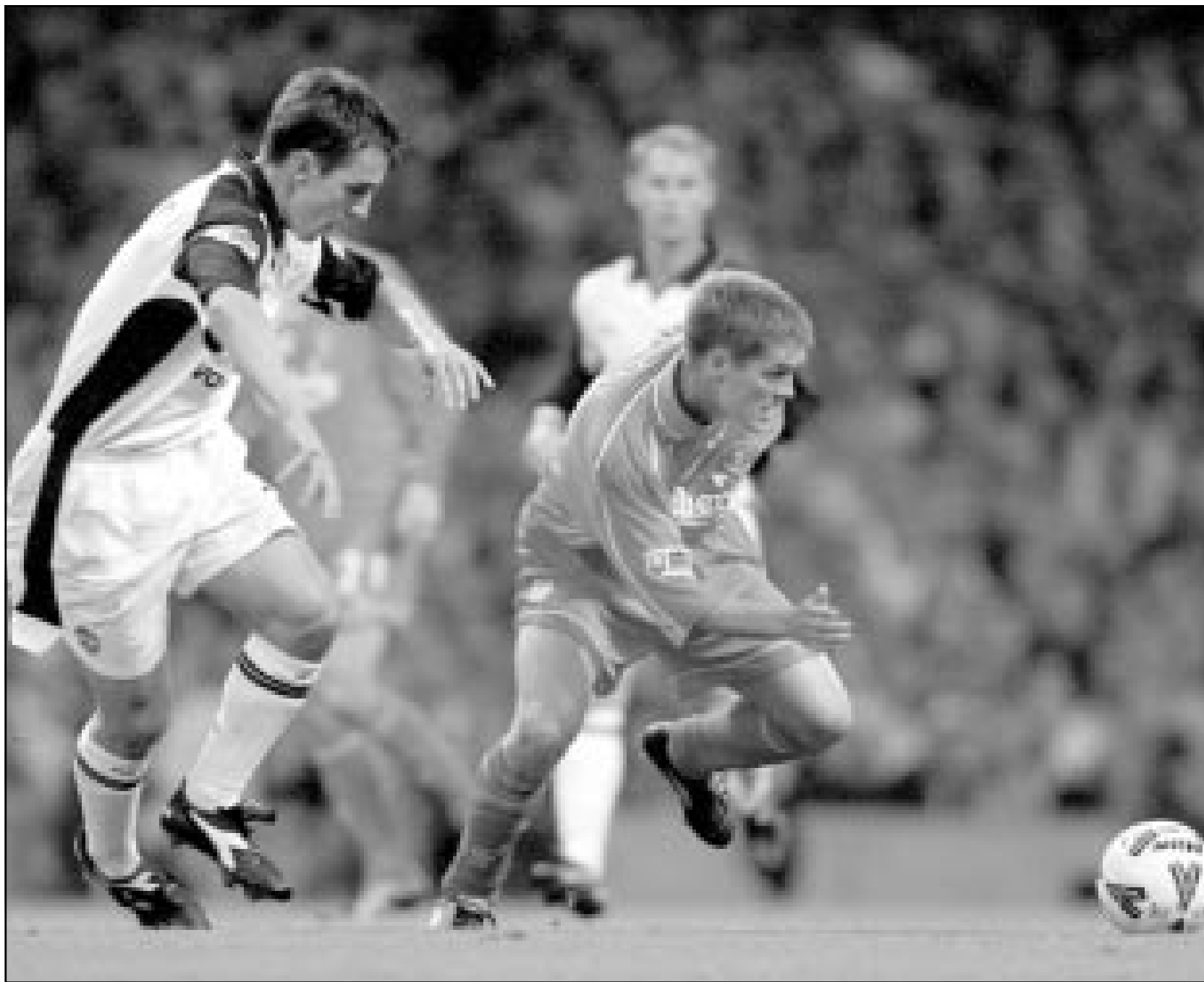
مايكل اوين لاعب ليغربول