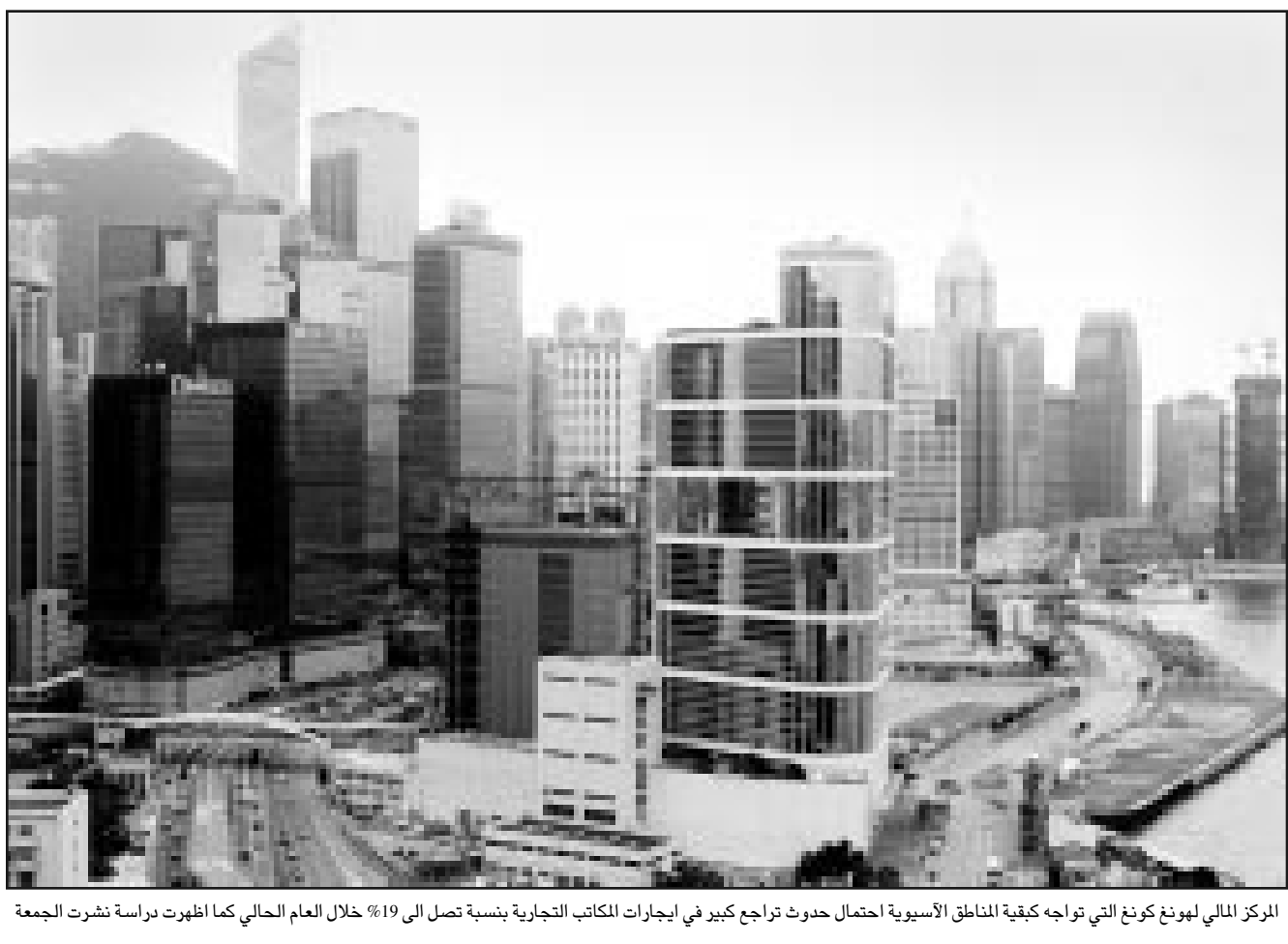
المركز المالي لهونغ كونغ التي تواجه كبقية المناطق الآسيوية احتمال حدوث تراجع كبير في ايجارات المكاتب التجارية بنسبة تصل الى 19% خلال العام الحالي كما اظهرت دراسة نشرت الجمعة

وهبطت الواردات من السلع والخدمات أيضا للشهر الثالث على التوالي الى 115,36 مليار دولار. وبلغت الصادرات والواردات بذلك أدنى مستويات لهما منذ شباط (فبراير) من العام الماضي.