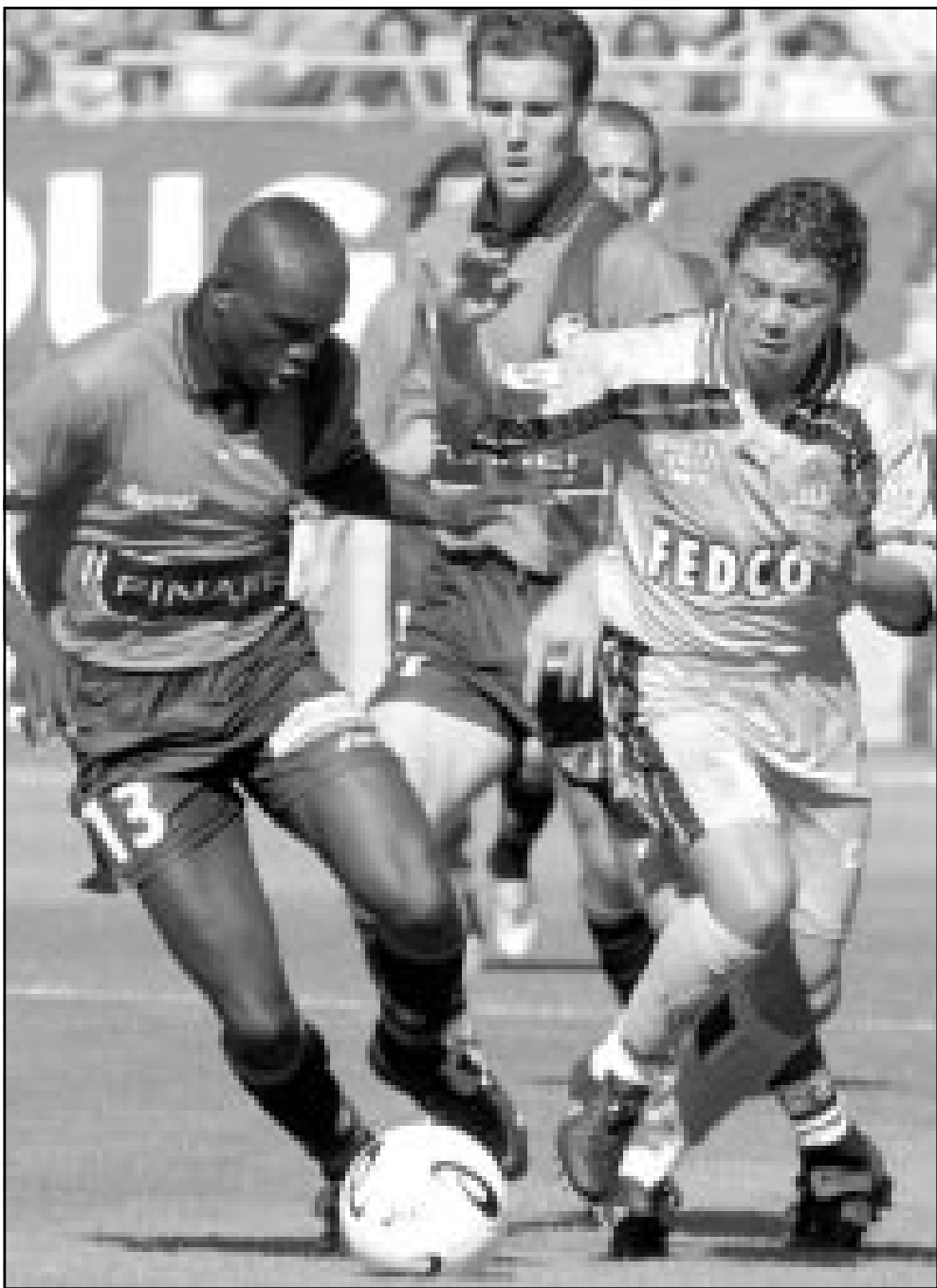
لقطة من إحدى مباريات فريق موناكو