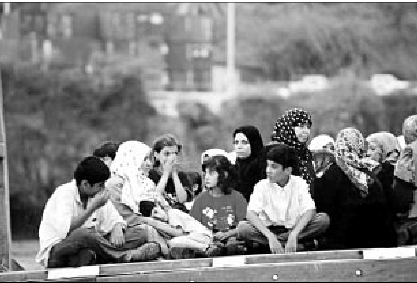
لاجئون عراقيون معظمهم من النساء والأطفال لدى وصولهم استراليا الجمعة (1 آب)

ومضى قائلا «الموقف الروسي هو انهم يريدون منا الا نطور قدراتنا الدفاعية الصاروخية رغم ان لديهم الان قدرات دفاعية صاروخية حول موسكو مزودة بصواريخ اعتراض ذات رؤوس نووية..»