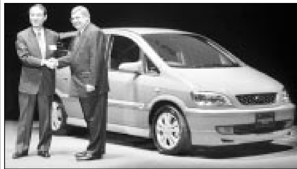
رئيسا شركتي فوجي اليابانية للصناعات الثقيلة (يسار) وفرع جنرال موتورز الآسيوي يقدمان امس في طوكيو سيارة سوبارو الجديدة ترافيك التي تعاونت شركتي في تطويرها وانتاجها. وتدار هذه السيارة التي تسع لسبعة ركاب بمحرك ذي 2.2 لتر. وسيمت البدء في تسويقها بسعر يعادل 16600 دولارا فوق