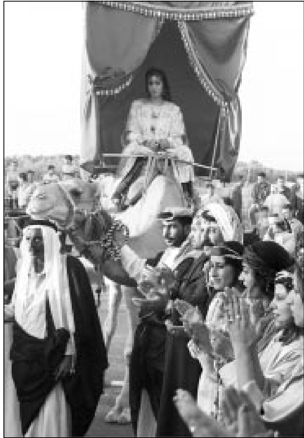
عارضة سورية بلباس عروس في هودج فوق جمل في تمثيل لحفل زفاف تقليدي جرى امس في مدينة دير الزور السورية في نطاق مهرجان لدم السياحة المحلية والعربية

مع العام الماضي حيث وصل اجمالي المساحات المزروعة بالقمح هذا العام الى نحو 1.67 مليون هكتار مقارنة مع 1.68 مليون هكتار العام الماضي. وفيما يتعلق بالشعير الذي يعتمد على مياه الاطوار على عكس القمح الذي تعتمد معظم مساحاته المزروعة على الري العادي فقد انخفضت المساحات المزروعة هذه العام الى نحو مليون هكتار مقارنة مع نحو 1.3 مليون هكتار العام الماضي. وأشار الشيباني الى ان انتاج العدس لهذا العام ارتفع الى نحو 171500 طن مقارنة مع 73810 طنا العام الماضي بينما ارتفع انتاج الحمص قليلا الى نحو 69296 طنا من نحو 64538 طنا عام 2000. وقالت مصادر زراعية ان سورية التي كانت تعاني من مشكلة كبيرة في تخزين حبوبها خلال السنوات الماضية مما اضطرها الى تخزين هذه الحبوب بالعراء بعيدا عن شروط التخزين المطلوبة تمكنت خلال الفترة الماضية من رفع طاقتها التخزينية الى نحو اربعة ملايين طن هذا العام من نحو مليون طن في منتصف التسعينات. ويتوقع ان ترتفع طاقة التخزين الى نحو خمسة ملايين طن بحلول نهاية العام القادم بعد استكمال بناء نحو مليون طن في منتصف العديد من الصوامع في اماكن الانتاج والتوزيع.