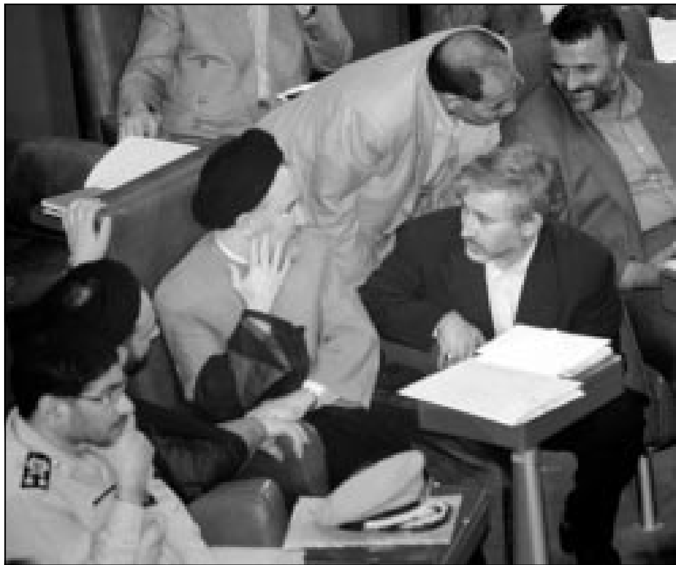
الرئيس الإيراني أثناء جلسة البرلمان