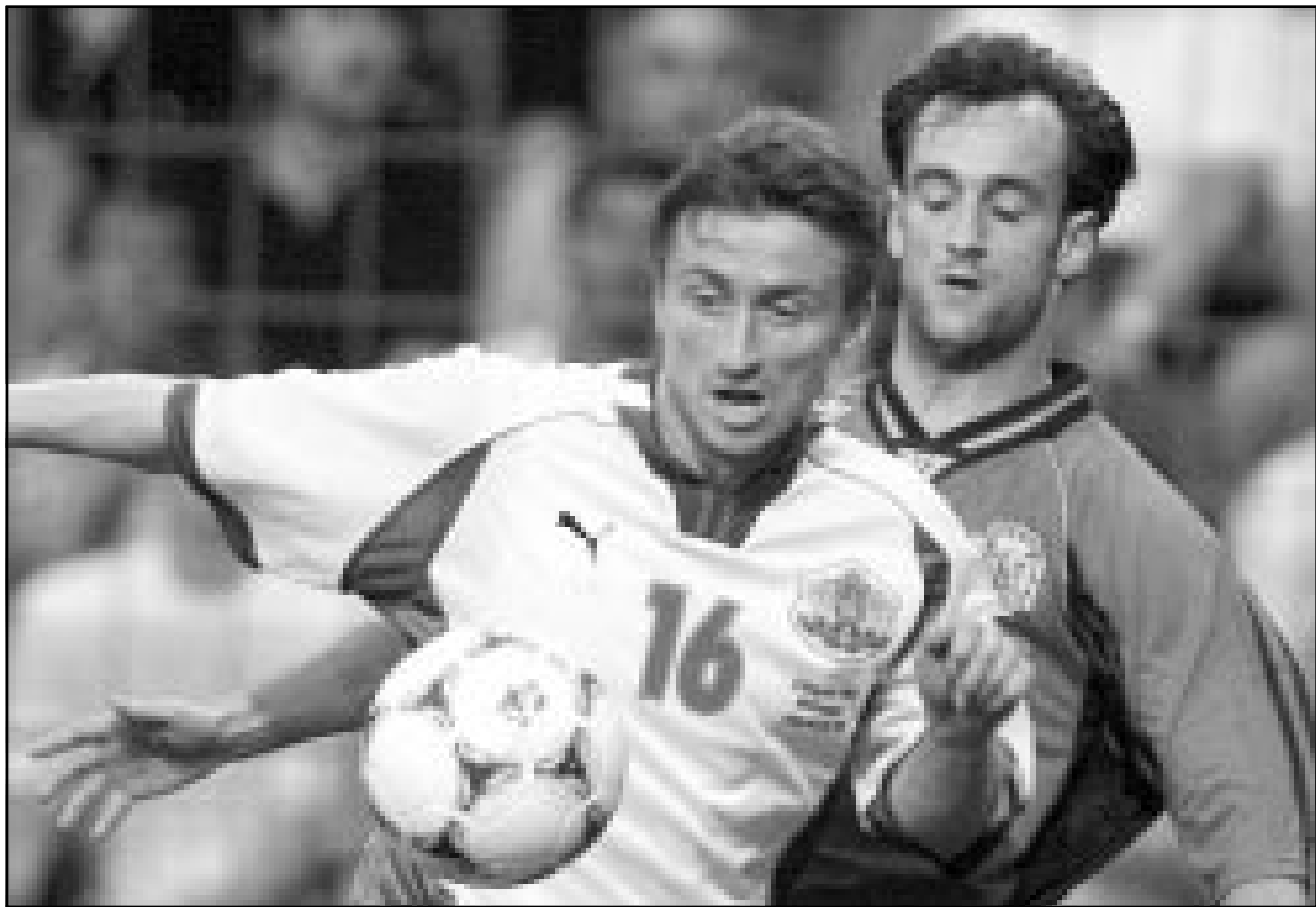
لقطة من إحدى مباريات منتخب اسبانيا (صورة من الارتفاع)

الثلاث نقاط وتبعد ألمانيا إلى المركز الثاني خصوصا بعد الدفعة المعنوية الكبيرة بفوزها عليها 5-1. وتمتلك اسبانيا أيضا فرصة التأهل مباشرة إلى النهائيات بعد أن كانت في وضع محرج قبل أن يتسلم المدرب السويدي زفن غوران أريكسون مهمة الاشراف الفني على منتخبها، وذلك في حال فوزها على اليونان في الجولة الأخيرة بفارق مريح من الأهداف لأنه لن يتكهن لفوز ألمانيا على فنلندا في الجولة ذاتها أي تأثير عليها.