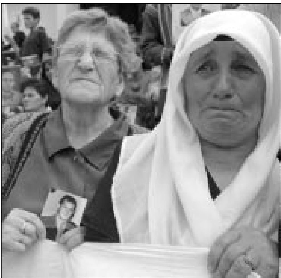
سيدات البانبات يشاركن في تظاهرة في بريشتينا تطالب بالفراج عن اسرى الحرب

■ بريشتينا- رويترز: قال المتحدث باسم قوات حفظ السلام التابعة لحلف شمال الاطلسي ان جنديين روسيين اصيبا في هجوم بالرصاصة في بريشتينا عاصمة كوسوفو في وقت مبكر من صباح أمس الثلاثاء. واهضاف المتحدث ان اربعة من البان كوسوفو تورطوا في الهجوم وادخلوا الى مستشفى كل القرارت المتعلقة بالرئيس ومن بينها مصادرة شريط فيديو لجان كلود ميرى المسؤول عن جمع الاموال السرية للتمتع من اجل الجمهورية يتهم فيه شريك مباشرة بالتورط في دائرة تمويل شبهه للحزب. لم يلب رئيس الجمهورية استدعاء القاضي هالفن في الرابع من نيسان (ابريل) الماضي بحكم منصبه كرئيس للجمهورية حيث لا يمكن محاكمة الرئيس الامام هيئة قضاء استثنائية وهي محكمة العدل العليا. وكانت النيابة العامة طلبت في 22 حزيران (يونيو) الفغا العديد من عناصر التحقيق الذي اجراه القاضي هالفن. واعتبرت الحماية العامة دوميني بلانكليل من مصادرة شريط فيديو جان كلود ميرى في ايلول (سبتمبر) 2000 من قبل القاضي كان باطلان لان التحقيق علق في 22 تشرين الثاني (نوفمبر) 1999 بسبب ايداع طلبات بالابطال. واعتبرت الحماية العامة ان جميع القرارات التي اعقبها ضبط شريط ميرى ومنها قرار استدعاء شريك يجب الغاؤها لوجود عيب في الشكل.