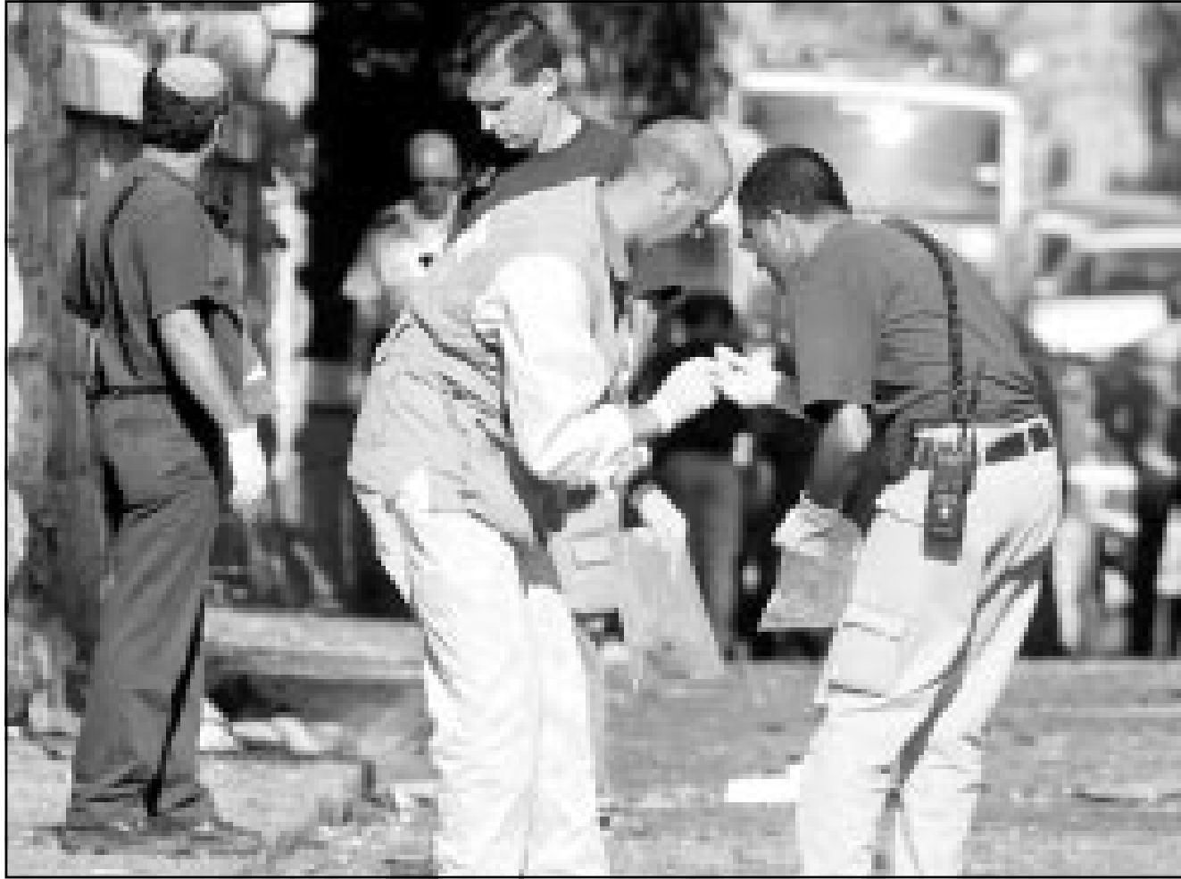
خبراء اسرائيليون يجمعون اداة في مكان العملية الاستشهادية في القدس امس (ف ب)

وقال المتحدث باسم وزارة الخارجية الاسرائيلية يمانويل ناخشوم لغفرانس برس «ان ياسر عرفات والجامعة العربية يدفعا باتجاه الكراهية والعنف المطلق تجاه اسرائيل. لقد بدأ ذلك واضحا في دوربان وفي صفوف السلطة الفلسطينية. هذا الاعتداء هو نتيجة التحريض على العنف والارهاب». من جهته صرح ناطق باسم الحكومة آفي بازنر لغفرانس برس «انني ارى هنا نتيجة مباشرة لسبب الكراهية التي ضختها السلطة الفلسطينية في صفوف شعبها والمجتمع الدولي». واضاف «ما حصل في دوربان كان تشجيعا لحرمان اسرائيل من شرعيتها. وتبرز نتائج هذه السياسة اليوم في سوارع القدس. هذه المسألة هي نتيجة سياسة ياسر عرفات. ونأسف لوقوعها قرب مؤسسة فرنسية راقية». وكان المتحدثان يشيران الى قرار اسرائيل الاثنتين الانسحاب من مؤتمر مكافحة العنصرية في دوربان معتبرا ان المؤتمر اصبح «مصدرا للحقد» على الدولة العربية. كما انسحبت الولايات المتحدة ايضا من المؤتمر بعد فشلها في منع تصديق البيان النهائي اداة لاسرائيل بسبب السياسة التي تنتهجها مع الفلسطينيين. وكان رعتان غيسين المتحدث باسم رئيس الوزراء الاسرائيلي ارييل شارون الذي يزور روسيا منذ الاثنتين صرح لوكالة فرانس برس ان مسؤولية العملية الانتحارية تقع على عاتق الرئيس الفلسطيني ياسر عرفات. وقال غيسين «ان السلطة الفلسطينية مسؤولة بشكل كامل عن هذه الهجمات لانها اثبتت في الماضي انها تستطيع ايقافها عندما تريد». وكانت القدس شهدت الاثنتين انفجارين وتم تعطيل عبوتين اخريين. فقد انفجرت سيارة مفخخة وعبوة ناسفة تحت سيارة اخرى في حي «فرنش هيل» (التهلة الفرنسية) الاستيطاني وفي مستوطنة جيلو على مشارف القدس