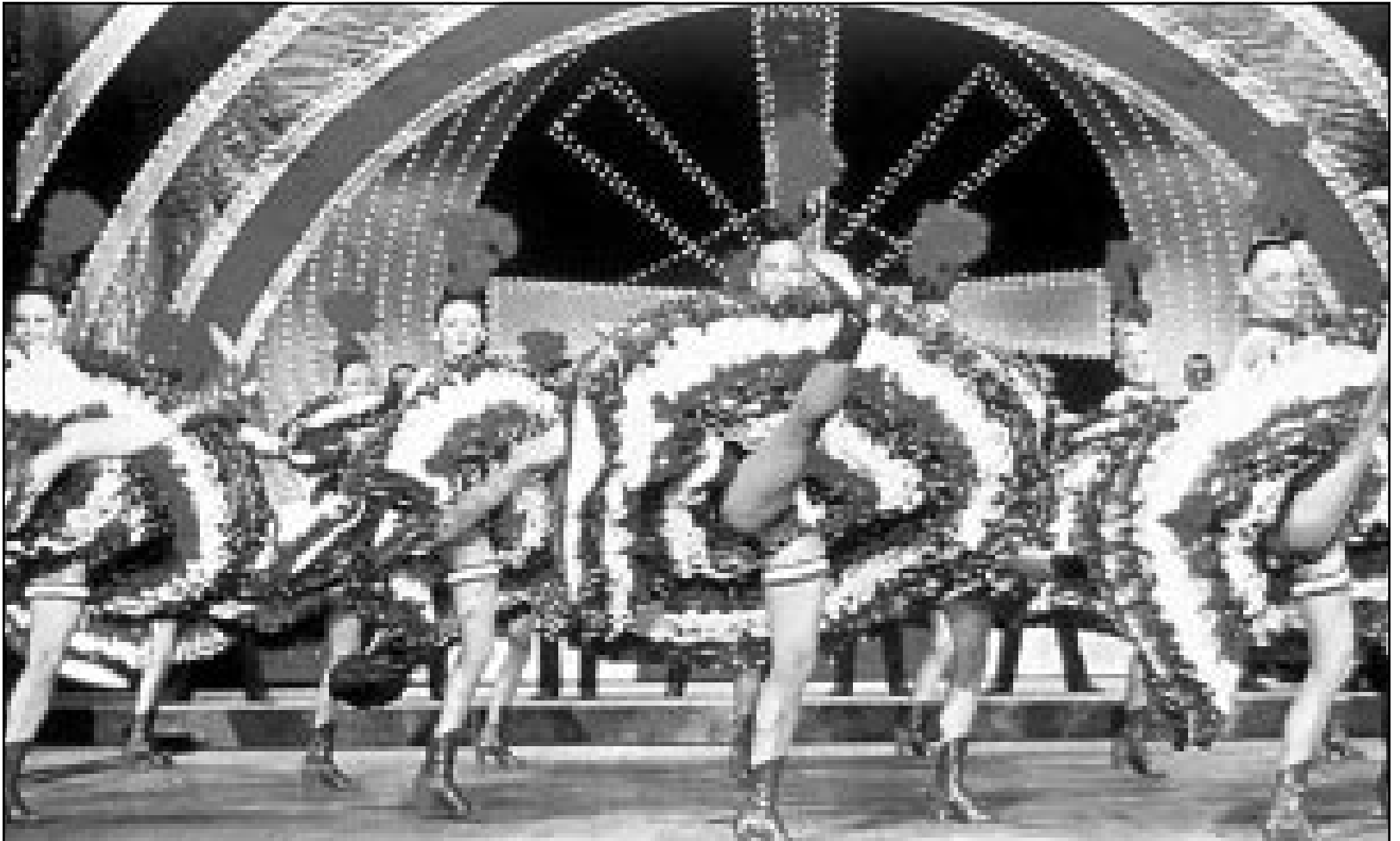
راقصات المولان روج