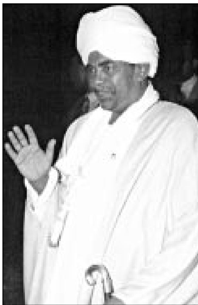
الرئيس السوداني عمر البشير

الخرطوم - «القدس العربي»: يبدو واضحا ان الاجواء السياسية في الخرطوم لا تكاد تهدأ حتى تشتعل حراقتها من جديد في صورة جدل صاخب حول القضية السودانية او خلافات جديدة داخل التيار الحاكم في السودان يمكن ان تؤدي الى ظهور تعقيدات اخرى داخل الساحة السياسية السودانية ولعل ذلك هو الذي حدا بالدكتور ابراهيم احمد عمر الامين العام لحزب المؤتمر الوطني الحاكم بالخرطوم بأن يتحرك على وجه السرعة لنفي الاتهام التي تردت عن مخاوف بعض الإسلاميين والصادق المهدي رئيس حزب الأمة بطرابلس خلال اليومين السابقين، فقد شهدت اوراقه الحزب الحاكم لقاء مطولا ضم قيادات المؤتمر الوطني الحاكم في الخرطوم وقيادات حزب