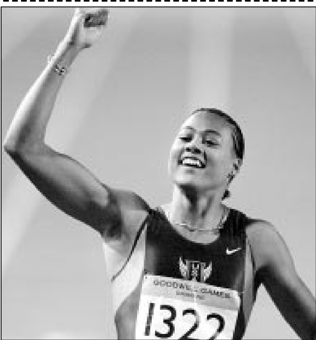
العداء الامريكى ماريون جونز

برلين- (استراليا)- رويترز: فازت العداء الروسية اولغا ايغوروا أمس الثلاثاء ببطولة سباق خمسة الاف متر في دورة ألعاب النوايا الحسنة المقامة حاليا بمدينة بريزبان الأسترالية. الا ان هذا الفوز من اجل الحفاظ هذا العام كلف ايغوروا هزيمة كبيرا حصلت في نهايته على الجائزة الاولى وقدرها 20 ألف دولار. وكادت الاثيوبية بيرهاني اديري ان تفوز فوزا بالسباق عندما انطلقت في اخر 250 مترا مما اضطر ايغوروا بذل جهد اضافي للحاق بها وتخطيها. وقطعت ايغوروا السباق في 15 دقيقة و12.22 ثانية لتلتها اديري، وفازت ايغوروا بذهبية سباق خمسة الاف متر في بطولة العالم للالعاب القوى التي اقيمت في مدينة ادمنتون الكندية الشهر الماضي رغم فضيحة العقاقير التي اثرت حولها والتي اوشكت على حرمانها من المنافسة في البطولة.