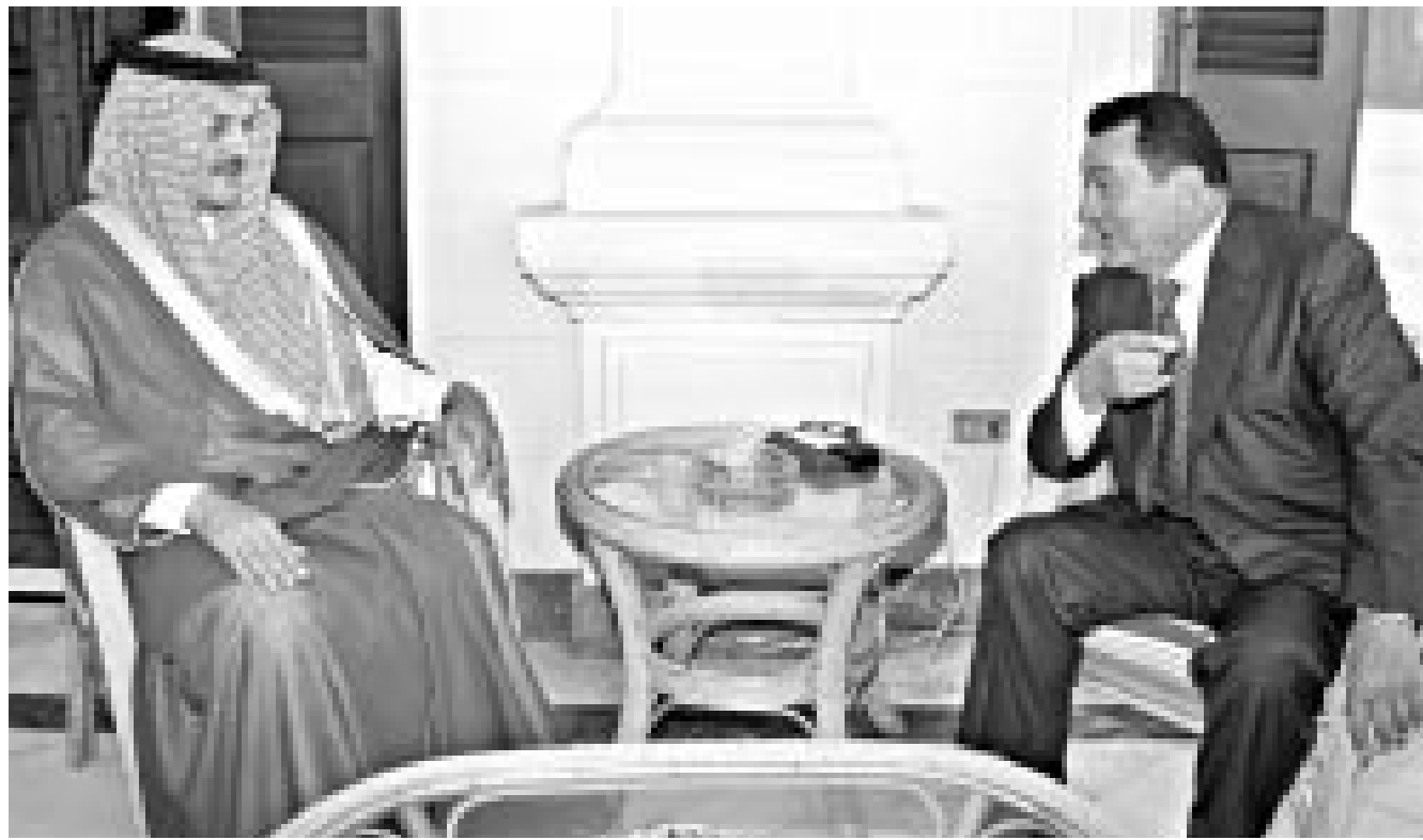
الرئيس المصري حسني مبارك لدى اجتماعه بوزير الخارجية السعودي سعود الفيصل في الاسكندرية أمس

الاسكندرية - الرياض - ا ف ب: استقبال الرئيس المصري حسني مبارك الرئيس الفلسطيني ياسر عرفات أمس الثلاثاء بعد ان اعرب عن قلقه حيال تصاعد العنف في الشرق الاوسط امام رئيس مجلس النواب الايطالي بيار فرناندو كاسيني.