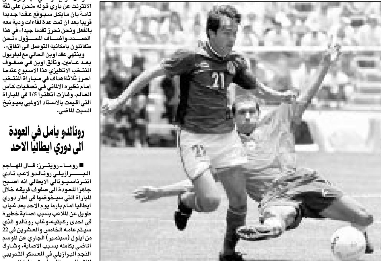
لقطة من إحدى مباريات كوستاريكا (صورة من الارتفاع)

ديبي- اف ب: تقام اليوم الأربعاء مباراة قمة بين كوستاريكا والولايات المتحدة ضمن الجولة الثامنة من تصفيات اتحاد الكونكاكاف (امريكا الشمالية والوسط يو الكاريبي) المؤهلة الى نهائيات كأس العالم لكرة القدم عام 2002 في كوريا الجنوبية واليابان. وتلقى المكسيك مع ترينيداد وتوباغو، وهندوراس جامايكا اليوم ايضا. وتسمى كوستاريكا التي تكتفي صدارتها للمجموعة (16 نقطة) والافتراض أكثر من بطاقة التأهل الى النهائيات عندما تستضيف الولايات المتحدة الثانية (13) لأنها ستبتعد في