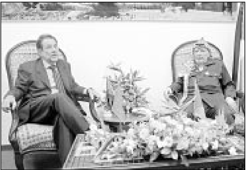
الرئيس الفلسطيني ياسر عرفات لدى لقائه الممثل الاعلى للاتحاد الاوربي خافيير سولانا في غزة

القدس - ا ف ب: جدد الممثل الاعلى للاتحاد الاوربي للسياسة الخارجية خافيير سولانا امس الثلاثاء الامل باعتقاد طاق عمل انتظاره بين الرئيس الفلسطيني ياسر عرفات ووزير الخارجية الاسرائيلي شمعون بيريس بالرغم من استمرار المواجهات في الاراضي المحتلة.