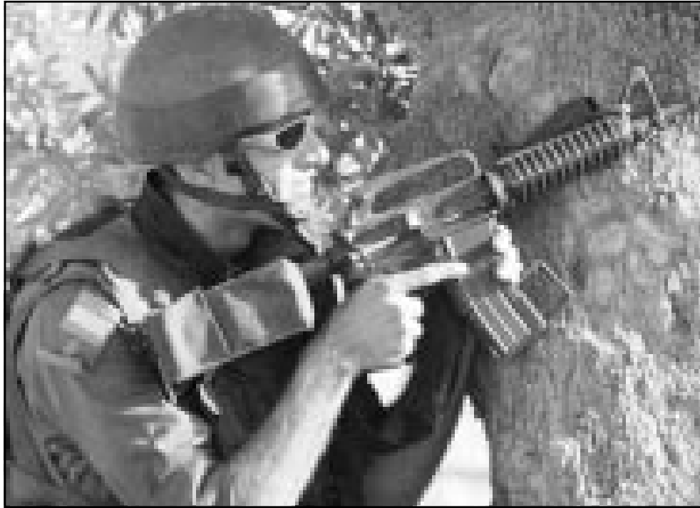
جندي اسرائيلي متخذاً وضعية أثناء تبادل النيران مع مسلحين فلسطينيين

واصابت ثلاثة صيادين فلسطينيين بجروح مختلفة. وقالت المصادر الطبية الفلسطينية «ان ثلاثة صيادين فلسطينيين اصيبوا بجروح مختلفة اثر فتح الزوارق البحرية الاسرائيلية النار تجاههم كما صدم احد الزوارق الاسرائيلية قارب صيد فلسطيني اثناء وجوده داخل البحر جنوب غزة مما ادى الى اصابته باضرار». واشارت المصادر الفلسطينية الى ان الجيش الاسرائيلي «احتجز الصيادين المصابين الثلاثة لعدة ساعات قبل ان يفرج عنهم ثم نقلوا الى مستشفى الشفاء بغزة للعلاج».