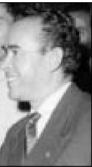
المهدي بن بركة

استقلال الصحراء الغربية ذلك الا فأنها قد تقبله غدا. وتابع الملك «التوصل لحل يحتاج لوقت ويتعين ان نترك الامر ينضج».