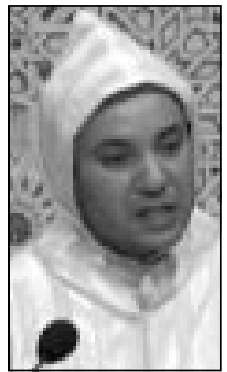
الملك محمد السادس

على صعيد آخر اتخى الملك محمد السادس باللائمة على «مافيا» اسبانية وعام من خلال الوصلة التي يبلدها كل من نظيرتها المغربية في معظم حركة الهجرة غير الشرعية عبر مضيق جبل طارق. وسمعت عمليات تهريب المخدرات والهجرة غير المشروعة العلاقات بين البلدين في الاشهر الاخيرة. وشكت الحكومة الاسبانية رسميا في الشهر الماضي من ان المغرب لا يبذل جهودا كافية للحد من الهجرة غير المشروعة وهو اتهام نفتحه الرباط. وقال العامل المغربي «في المغرب لم نخف على الاطلاق قضية الهجرة... لكن الامر