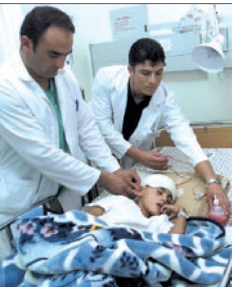
طبيب فلسطيني يعالج احد المصابين برصاص الجيش الاسرائيلي في الخليل

القدس - «القدس العربي» - وكالات: تنكر مقاوم فلسطيني في زي يهودي متدين ملتح ليخجر نفسه في القدس الغربية أمس الثلاثاء مما اسفر عن 15 مصابا. وقال شرطي واجه المهاجم قبل ان يفجر حقيبة مليئة بالمتفجرات على ظهره انه مات وابتسامته على وجهه. وقال ميكي لقي رئيس شرطة القدس للصحافيين «شك رجلا الشرطة في انه عربي منكر في زي يهودي فاوقفوه.. حاولوا دون وقوع مأساة كبرى بإيقافه قبل ان يتوجه إلى منطقة أكثر ازدحاما». ومضى يقول ان المهاجم كان يضع قبعة يهودية تقليدية ويرتدي معطفا اسود اللون متخذاً هيئة اليهود المتدينين وكان يضع لحية مستعارة. وفجر نفسه على حافة منطقة سكنية يهودية في غرب القدس. واعلن وزير الدفاع الاسرائيلي بنيامين بن نتانياهو ان العملية نفذها ناشط من حركة المقاومة الاسلامية (حماس). وافضوا الادلاء باي تعليق آخر في هذه المرحلة من التحقيق. وشجب الرئيس الفلسطيني ياسر عرفات عملية القدس قائلا «انا ضد مثل هذا العمل الذي يضر بمدنيين، سواء كانوا فلسطينيين او اسرائيليين». ودعت منظمة حقوق الانسان لحقوق الانسان في جنيف الى ان اسرائيل تتعذر سورية مسؤولة عن كل الاعمال التي يحاول حزب الله تنفيذها على الحدود الشمالية، مشيرة الى ان ان حزب الله لم يعد عن نيته في تنفيذ عملية كبيرة قريبا. وذكرت وكالة «انترفاكس» ان الرئيس الروسي اكد ان موسكو تحترم تعهداتها في اطار حظر انتشار اسلحة الدمار الشامل بعد ان اثار شارون مبيعات التكنولوجيا العسكرية الروسية الحساسة لايران والعراق.