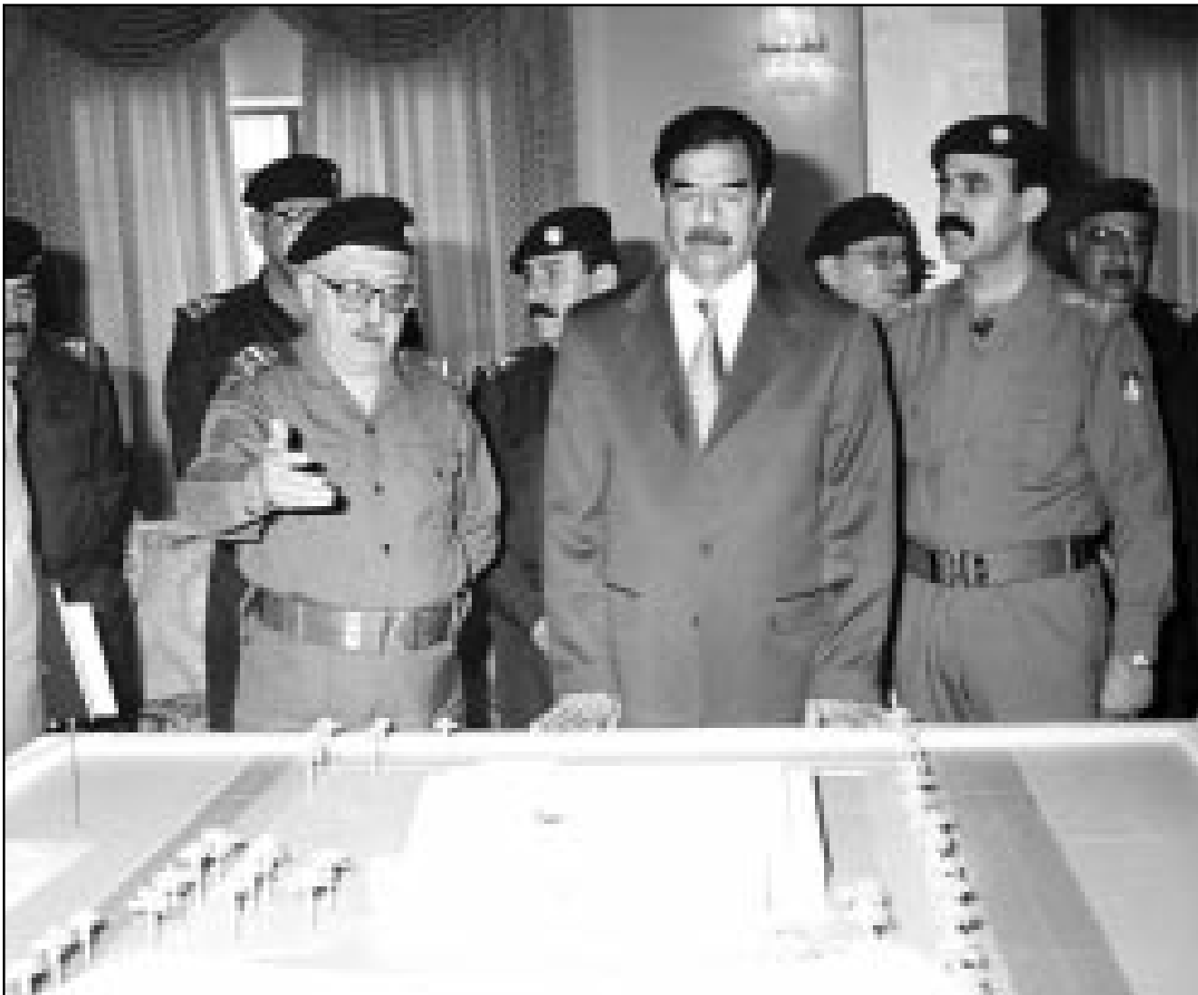
الرئيس العراقي يستعرض نموذجا لنصب تذكاري لضحايا قصف ملجا العامرية والى جانبه طارق عزيز الذي تحدثت صحف غربية مؤخرا عن تقديمه استقالته

استدعى من عمان تصرفا سريعا دون إنتظار التفاصيل، لانها لا تريد إستراتيجية التورط بما «يعكر» علاقاتها مع بغداد. وفي اليوم التالي لإعلانه عن هويته «التزم» المجيد فندقه في عمان وسط حراسة مشددة وأقل هاتقه الخووي، ومنع من لقاء الصحافيين وذلك في مسعى أردني عرس لوضع القضية برمته في «ضيق نطاق ممكن». ويهنئ الطريقة تقدم الحكومة الأردنية أقصى ما يمكنها في سبيل اظهار حسن النوايا والسعي لاستقرار العلاقة بين العرايين سياسيا وأمنيا واقتصاديا، خصوصا بعدما وعدت بغداد برفع مستوى التبادل التجاري الى «مليار» دولار في العام، ووسعت «مفقاتها» مع الطاعات الأردنية. وسلك حسن النية لم يبرز فقط على هامش قضية المجيد، لكن فرض