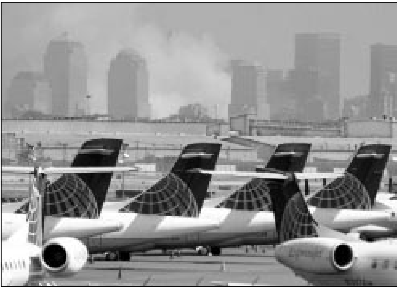
طائرات أمريكية جاتمة بمطار نيو جيرسي بينما يبدو في خلفية الصورة دخان يتصاعد من آثار هجوم الثلاثاء

من ضمن الاجراءات الأخرى التي اتخذتها اسبانيا تشديد الرقابة على الجالية العربية، وخاصة الجزائرية