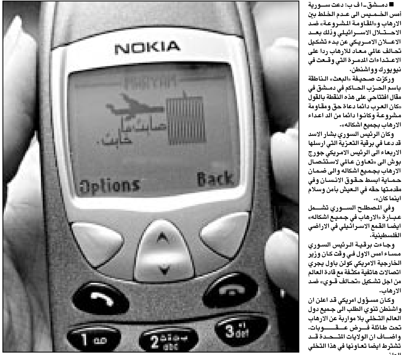
نموذج من الرسائل التي تتناقلها اجهزة الهاتف النقال في سورية والعديد من الدول العربية