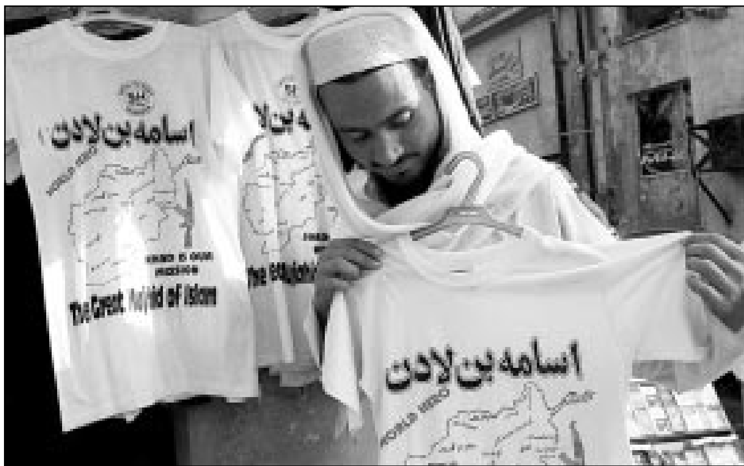
فحصان بن لادن تباع في سوق في مدينة بيشاور في باكستان

السعودي (المولد) الذي يعيش في المنفى اسامة بن لادن». وأضاف ان بن لادن واتباعه يمثلون «تهديدا كبيرا على نحو متزايد لمصالح الولايات المتحدة في الشرق الاوسط وربما في اماكن اخرى». وأضاف التقرير ان الاتهامات الامريكية لتأمر شبكة بن لادن في الماضي «تشير الى ان الشبكة تريد ان تضرب داخل الولايات المتحدة نفسها». وقال كاتزمان «من المرجح بشدة» ان بن لادن واتباعه حصلوا على بعض صورايج ستينجر المضادة للطائرات والتي تحمل على الكتف التي قدمتها الولايات المتحدة للمتشددين الاسلاميين الذين حاربوا الاتحاد السوفييتي في افغانستان في الثمانينيات. وظهر بن لادن وهو متشدد اسلامي ثري يعيش الان في افغانستان باعتباره المشتبه به الرئيسي في الهجمات، وهناك