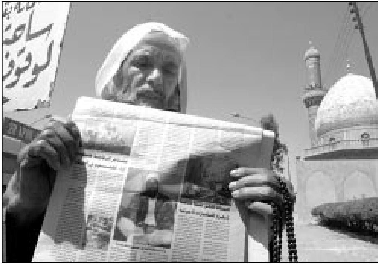
عراقي في بغداد يتابع الأنباء