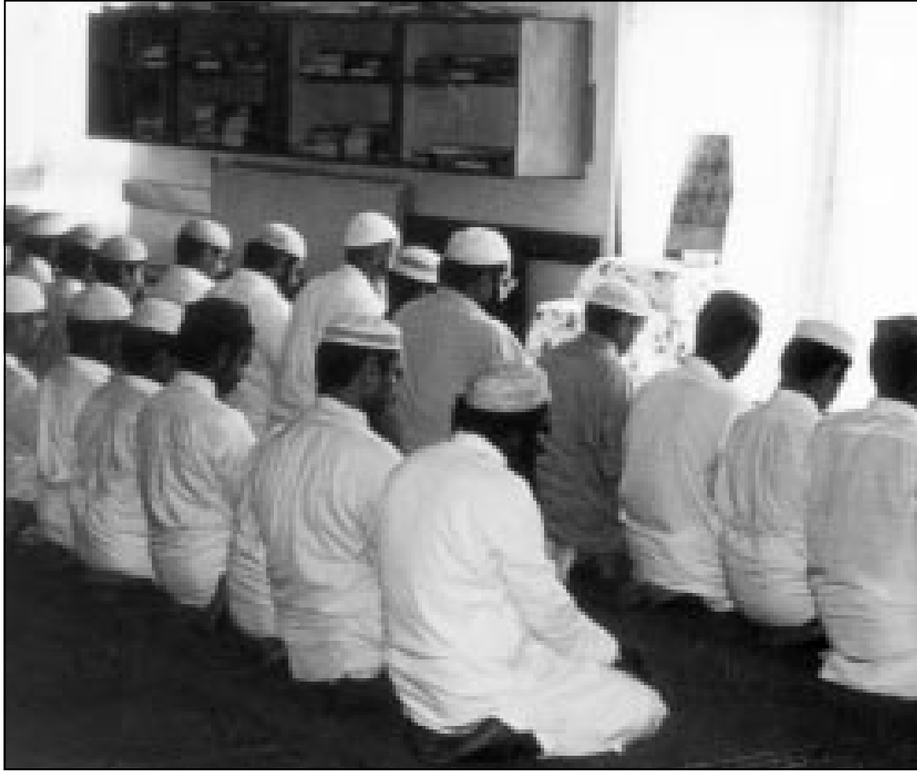
مسلمون بريطانيون يؤدون الصلاة في أحد مساجد لندن