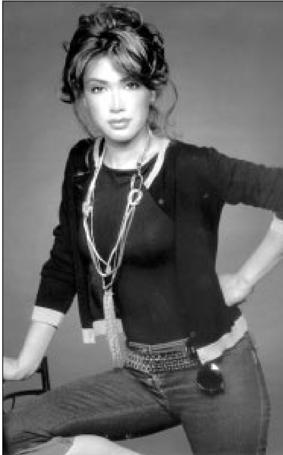
نوال الزغبى (القدس العربي)