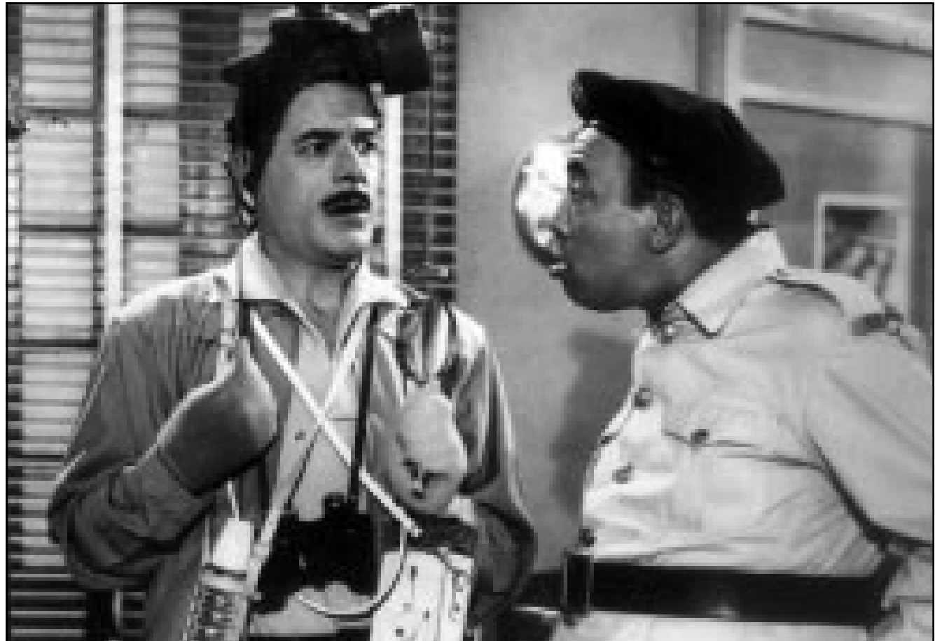
عبد السلام النابلسي مع اسماعيل ياسين في أحد أفلامهما