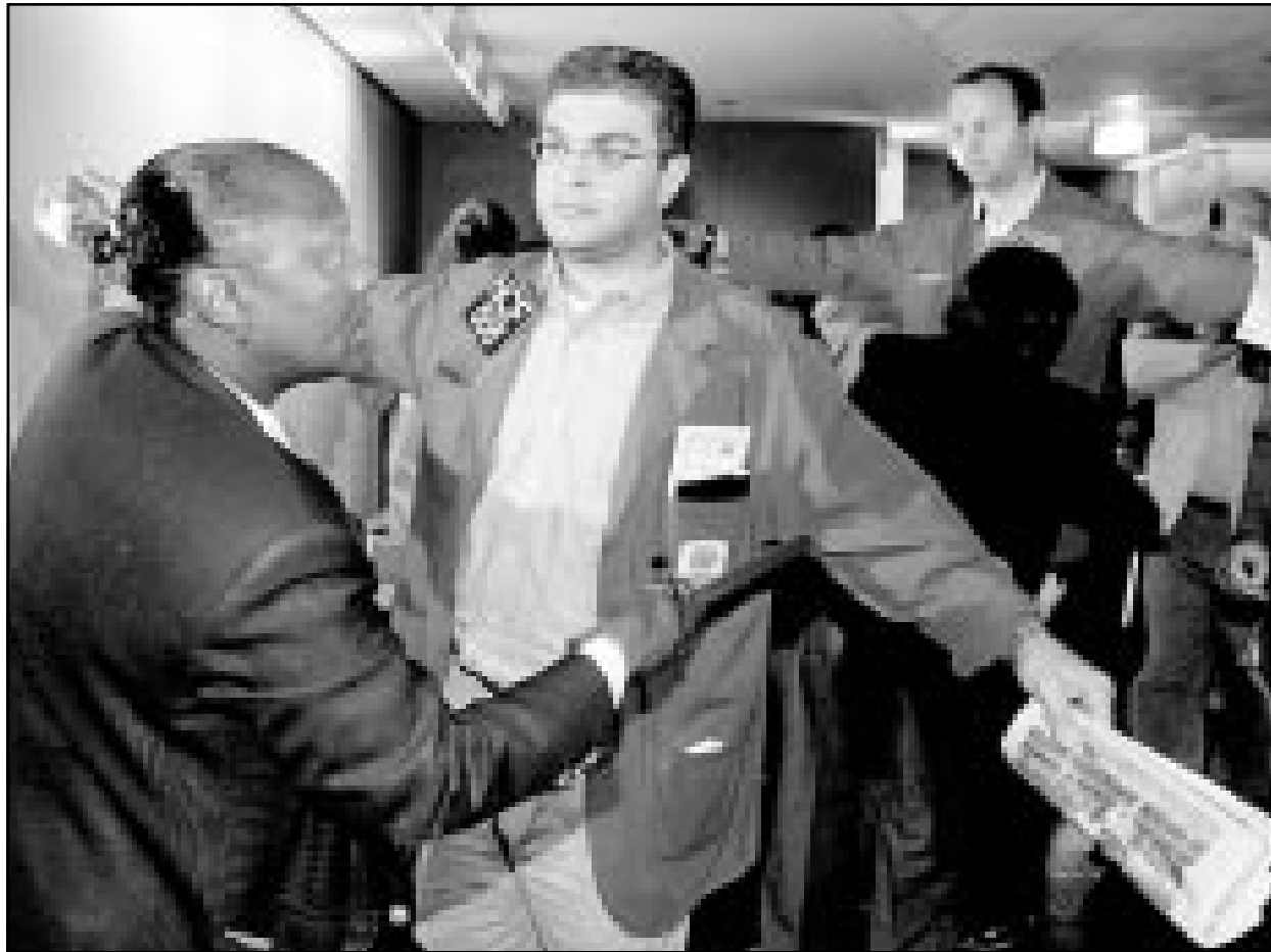
مسافرون يتعوضون لتفتيش دقيق في بورصة شيكاغو

جامعة كولومبيا قال «مثل هذا العمل الروع سيدفع بهم نحو اتجاه قريب من إعادة تفسير الدستور بشأن الدفاع الجماعي، وإذا حدثت استجابة موحدة من مجموعة الثمانية الكبار هل من المنتظر ان تسمح اليابان بتكرار ما حدث أثناء حرب الخليج، اطلاقا». وتعرضت اليابان لانتقادات عنيفة أثناء حرب الخليج، فرغم تأييدها القوي للحلف العسكري الدولي لخارج العراق من الكويت فانها لم تشترك حتى بقوة رمزية، وأمس الاول الاربعة قال رئيس وزراء اليابان جونيتشيرو كوزيومي الذي يحصد تغيير النص الذي يحظر