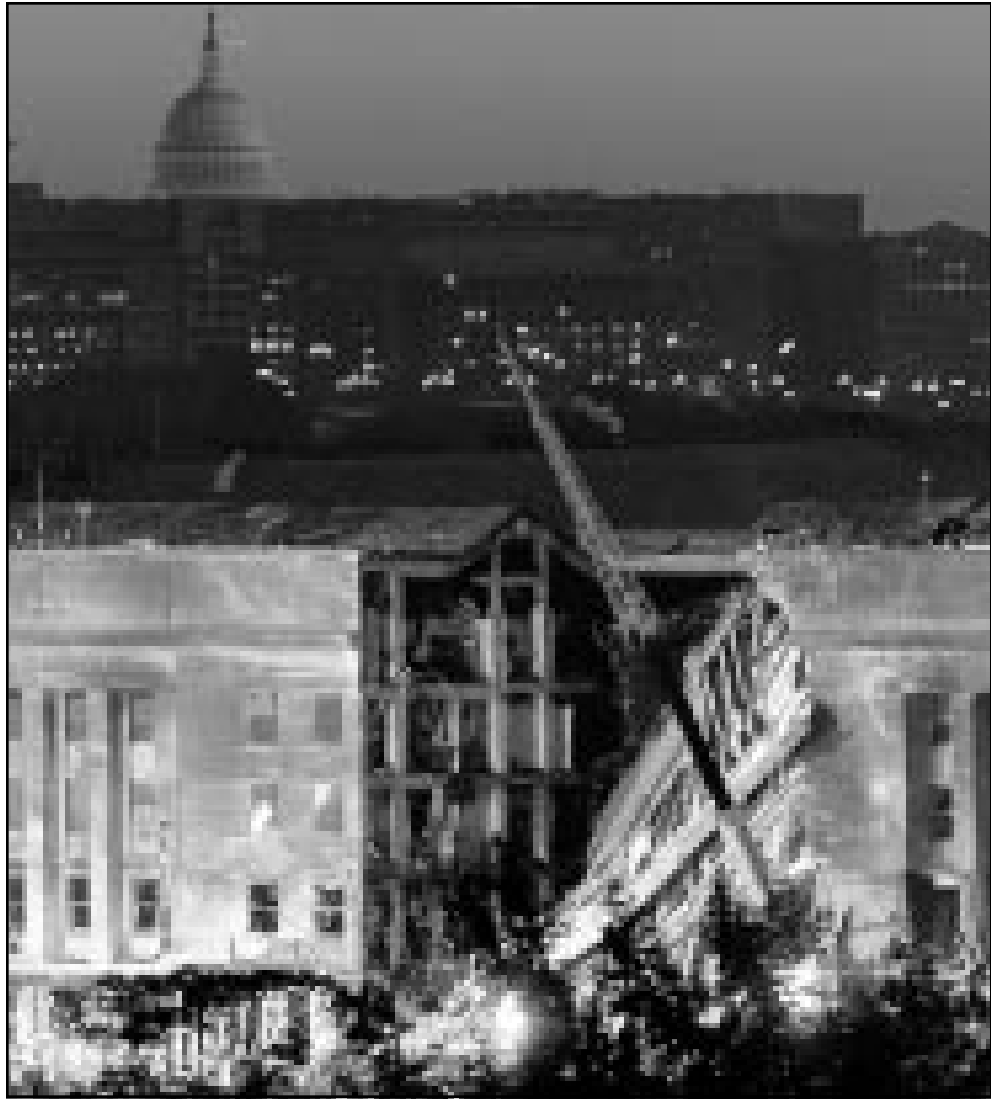
الدمار في البناتاغون بالعاصمة الامريكية واشنطن

أعلن المتحدث الصحفي لشرطة مدينة هامبورغ الالمانية الشمالية راينهارت فالانج عن اجراء تحريات مكثفة واسعة النطاق بشأن جماعة اسلامية يقال ان لها علاقة مباشرة بالهجمات التي وقعت في الولايات المتحدة يوم الثلاثاء الماضي. وقال فالانج لقناة التلفزيون الالمانية الاولى ARD ان دائرة حرسماية الدستور (جهاز الخابريات الالمانية) لا تزال تجري تحقيقات بهذا الخصوص، مضيفًا انها لم تنف وجود صلة للمشتبهين بأسماء بن لادن. وكانت الشرطة الالمانية اعتقلت في الستين الماضيين وبالتنسيق مع الشرطة في دول اوروبية اخرى في ولايت هيسن وبافاريا الجنوبيتين مولين اسامة بن لادن. وعلى الصعيد نفسه نقلت قناة التلفزيون الحكومية ZDF على لسان غيرهارد مولر رئيس شرطة مدينة هامبورغ انه تم اعتقال رجل عربي يعمل بمطار المدينة في اطار التحقيقات ذاتها، مضيفًا ان الشرطة