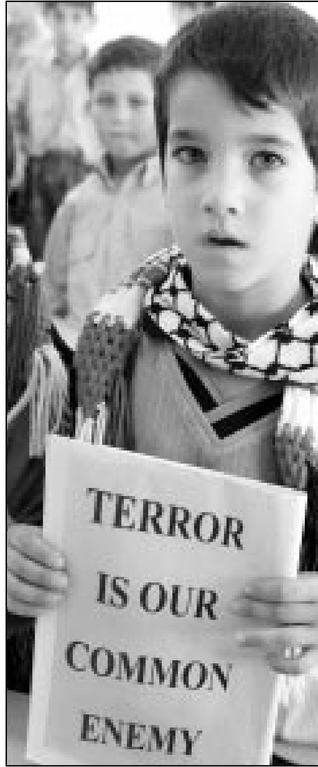
طفل فلسطيني حاملا لافتة تندد بالارهاب العدم المشترك للفلسطينيين والاميركيين اثناء لحظة صمت في مدرسته في مدينة الخليل الحطة (رويتز)

القدس - اف ب: صرحت الناطقة باسم الجامعة العربية حنان عرشاوي لوكالة «فرانس برس» ان الرئيس الفلسطيني ياسر عرفات يدرس مع قادة عرب آخرين امكانية انضمام العالم العربي الى الحملة الدولية المناهضة لارهاب. واوضحت عرشاوي وهي ايضا عضو في المجلس التشريعي الفلسطيني ان عرفات يتشاور في هذا الموضوع مع امين عام الجامعة العربية عمرو موسى.