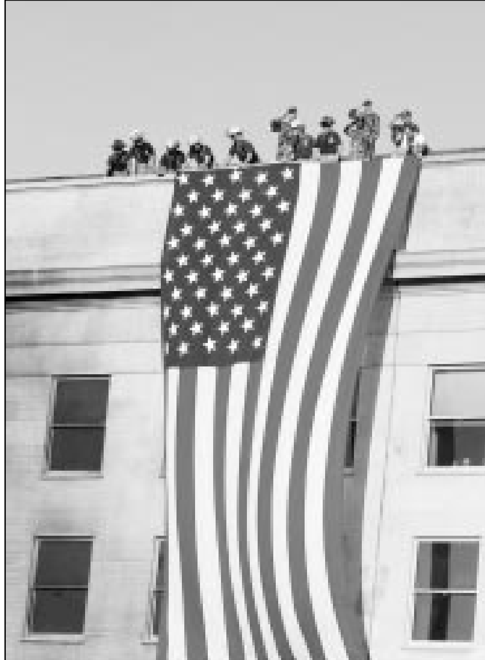
موظفون يسدلون العلم الأمريكي على جناح من مبنى البيتناغون في واشنطن