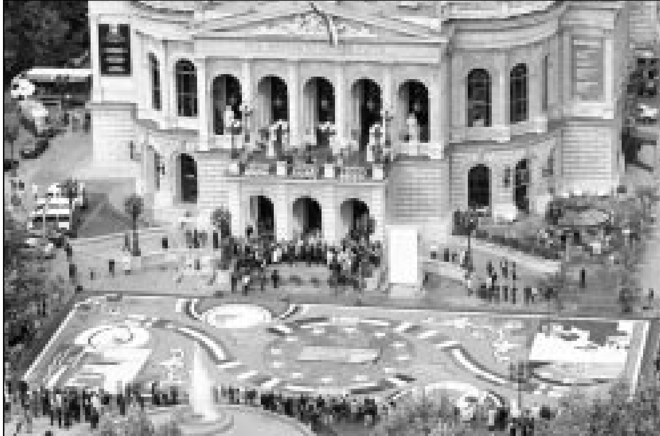
سجادة مائلة من الزهور امام مبنى الأبروا في وسط الحي المالي في فرانكفورت حيث وقف امس العاملون في البنوك القريبة حادا على الذين سقطوا في تحقيقات نيويورك

المركزى الامريكى في مكتبه في واشنطن امس الاول بعد ان قطع رحلته لسويسرا وتمكن من العودة لبلادته على متن طائرة عسكرية. وعلى الصعيد العملي تحركت البنوك المركزية لتوفير السيولة في الاسواق. وضح البنك المركزي في كل من الولايات المتحدة واليابان والبنك المركزي الاوروبى ما لا يقل عن 120 مليار دولار في النظام المصرفى الاربعة. وضح البنك المركزي الاوروبى وحده 38 مليار دولار في النظام المصرفى وهو ما يعادل نحو عشرة امثال المتوسط اليومى. وعاد الان غرينسبان رئيس