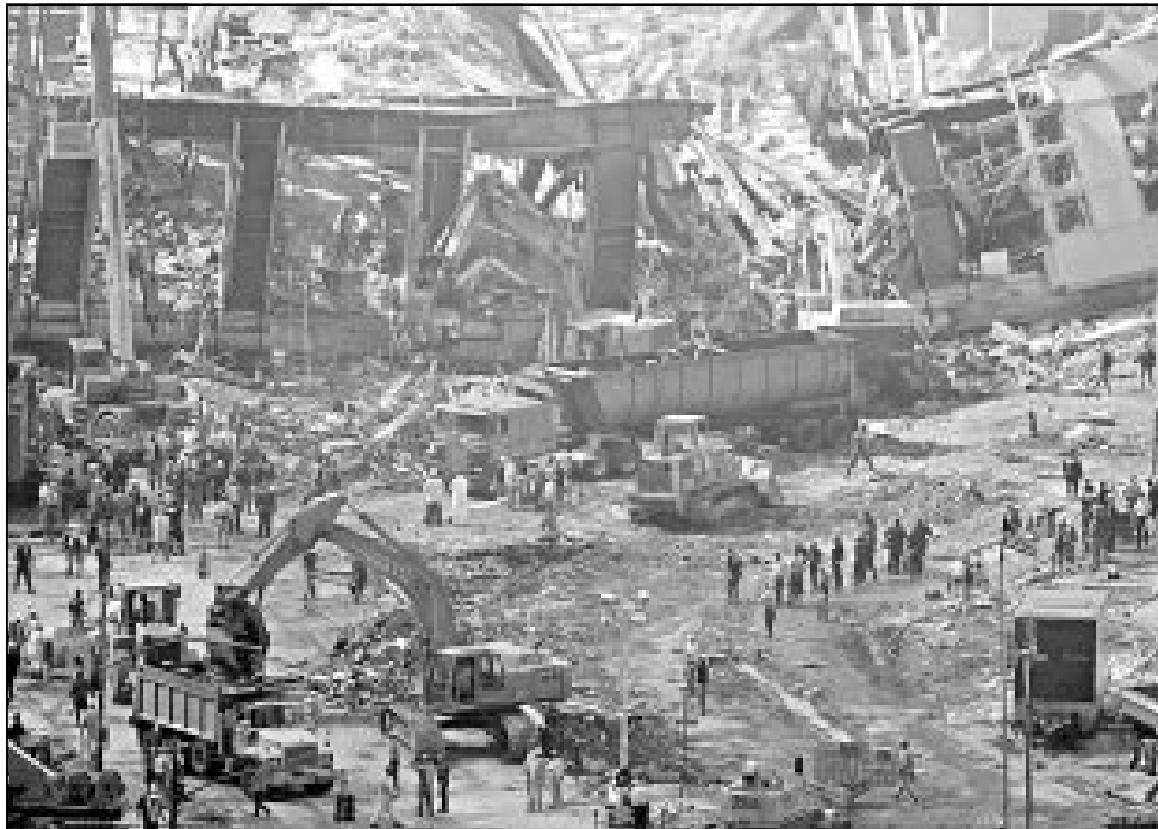
عمال الاغاثة يبحثون عن ناجين في ركام مركز التجارة العالمي في نيويورك امس (ا ف ب)

10 سعاد حسني، خليل حاوي ورافل رزق الله: الموت احتجاجا