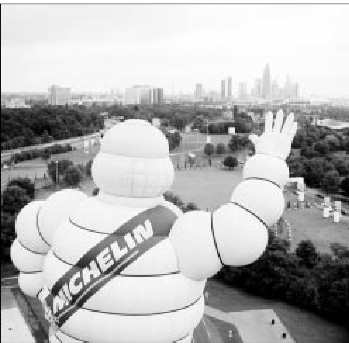
بالون دعائية لاطارات ميشلين الفرنسية قبالة المتزرة الذي يجري فيه معرض فرانكفورت الدولي للسيارات

وسيعقد اجتماع الدوحة الوزاري بين 9 و13 تشرين الثاني (نوفمبر).