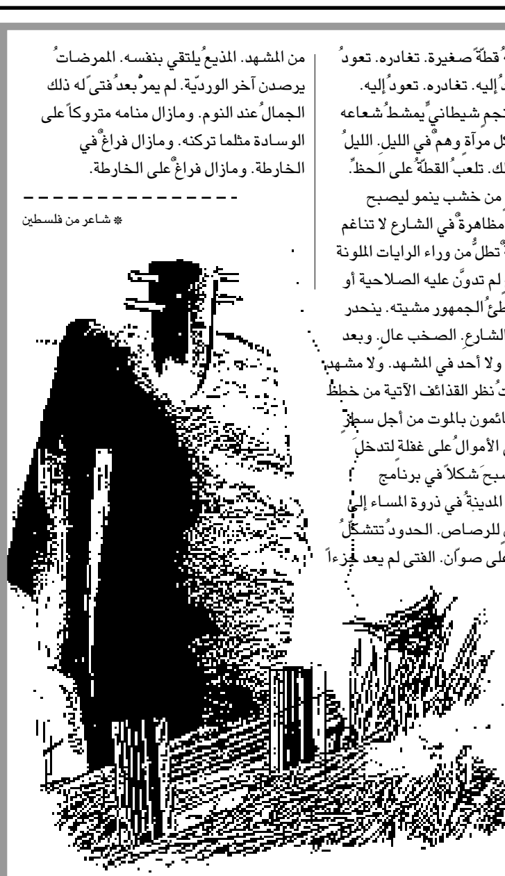
شاعر من فلسطين