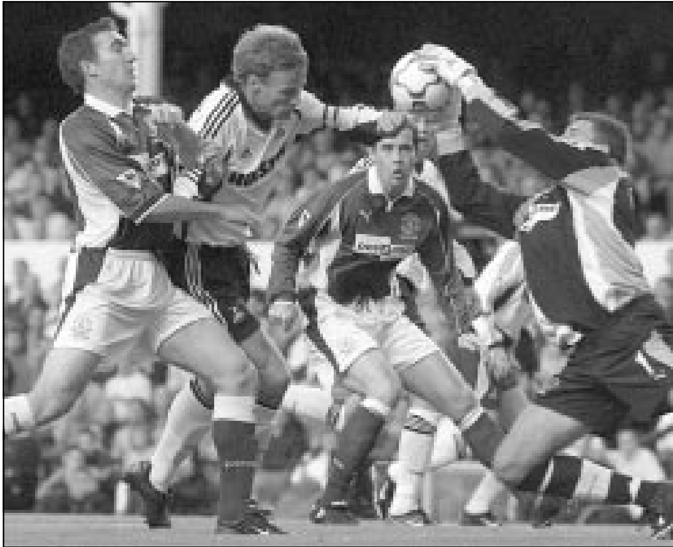
لقطة من إحدى مباريات فريق ايفرتون