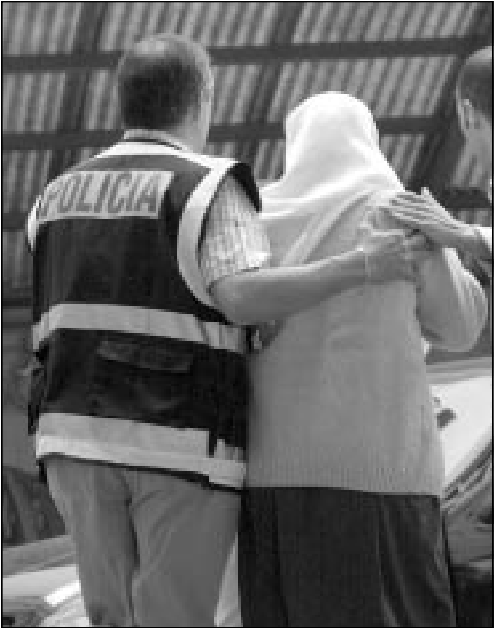
الشرطة الاسبانية تعتقل سيدة عربية في فالنسيا

تجمعوا خارج قاعة المحكمة «يجب على هذا البلد ان يتوقف عن التصرف بطريقة هستيرية. الى اين نتجه في هذا السيناريو».