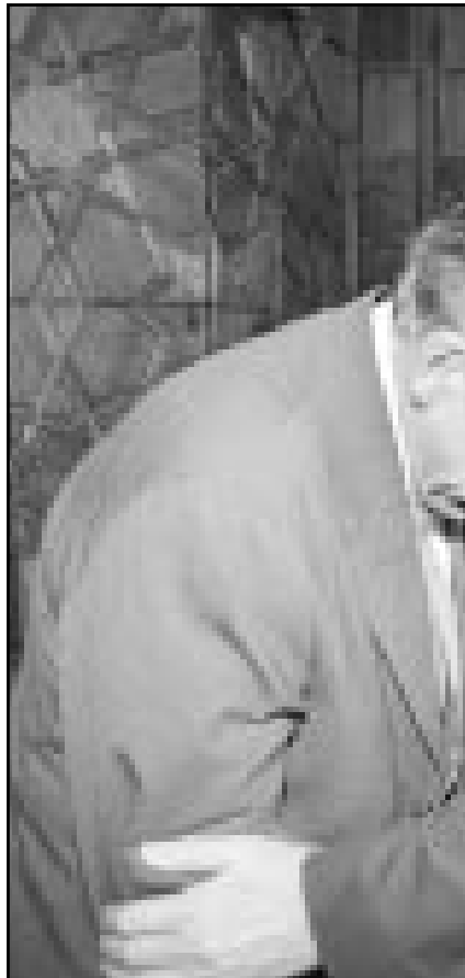
شيخ الازهر الامام الاكبر سيد طنطاوي مستقبلا وزير الخارجية البريطاني جاك سترو

وأضاف الرئيس اليمني «نحن نرفض التدخل في شؤوننا الداخلية من أي كان، ولن نقبل على أرضنا على الإطلاق أي قوة أجنبية مهما كانت الظروف ومهما كانت التحديات»، وقال «نحن نريد ان يكون هناك خصام او صدام بين الديانات السماوية وبين الحضارات والثقافات، نحن نريد