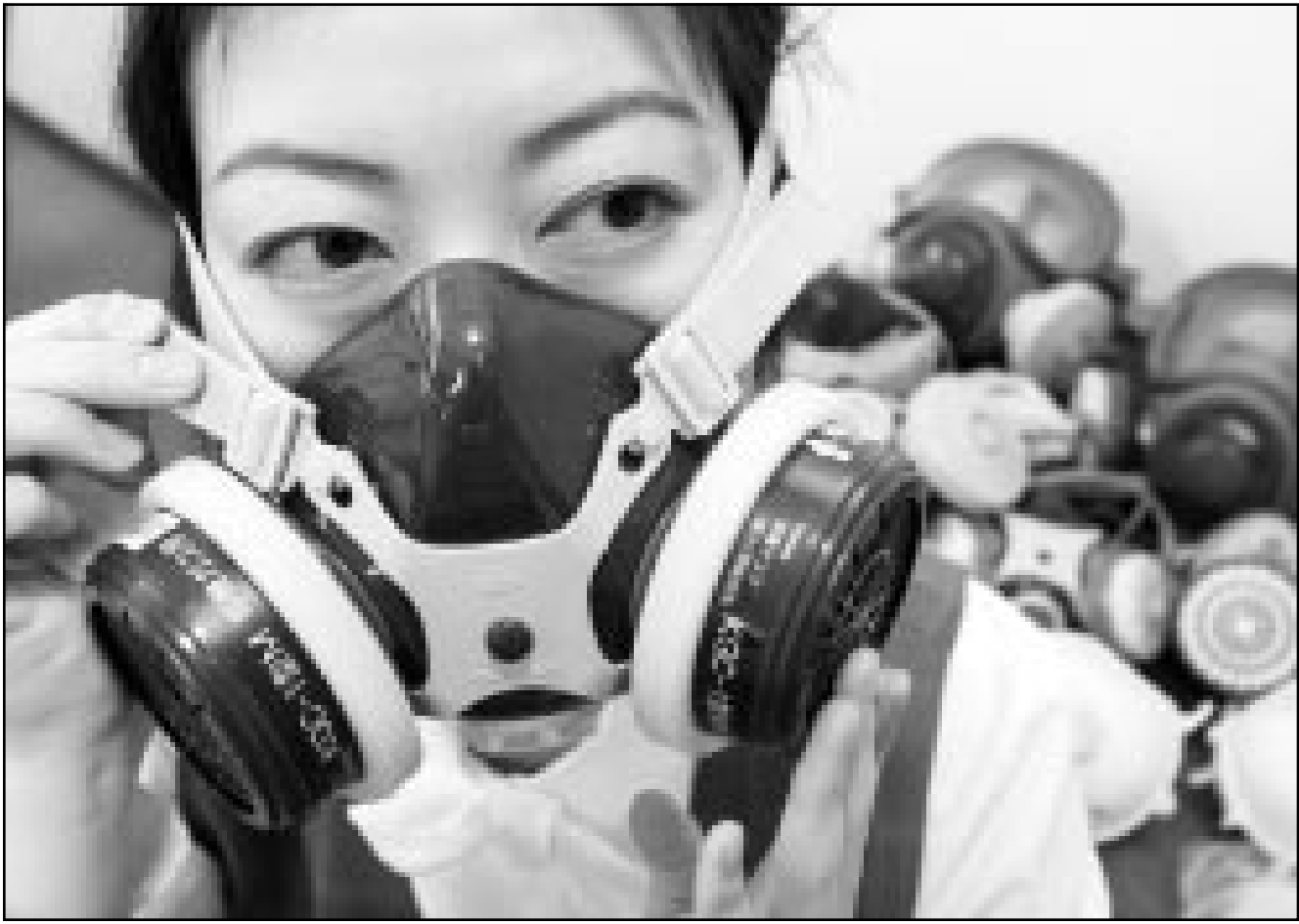
فتاة يابانية ترتدي قناعا واقيا من الغازات السامة

لندن - «القدس العربي» - وكالات: دعت الحكومة البريطانية أمس الأربعاء وسائل الإعلام إلى ضبط النفس في تغطية الاستعدادات العسكرية الجارية