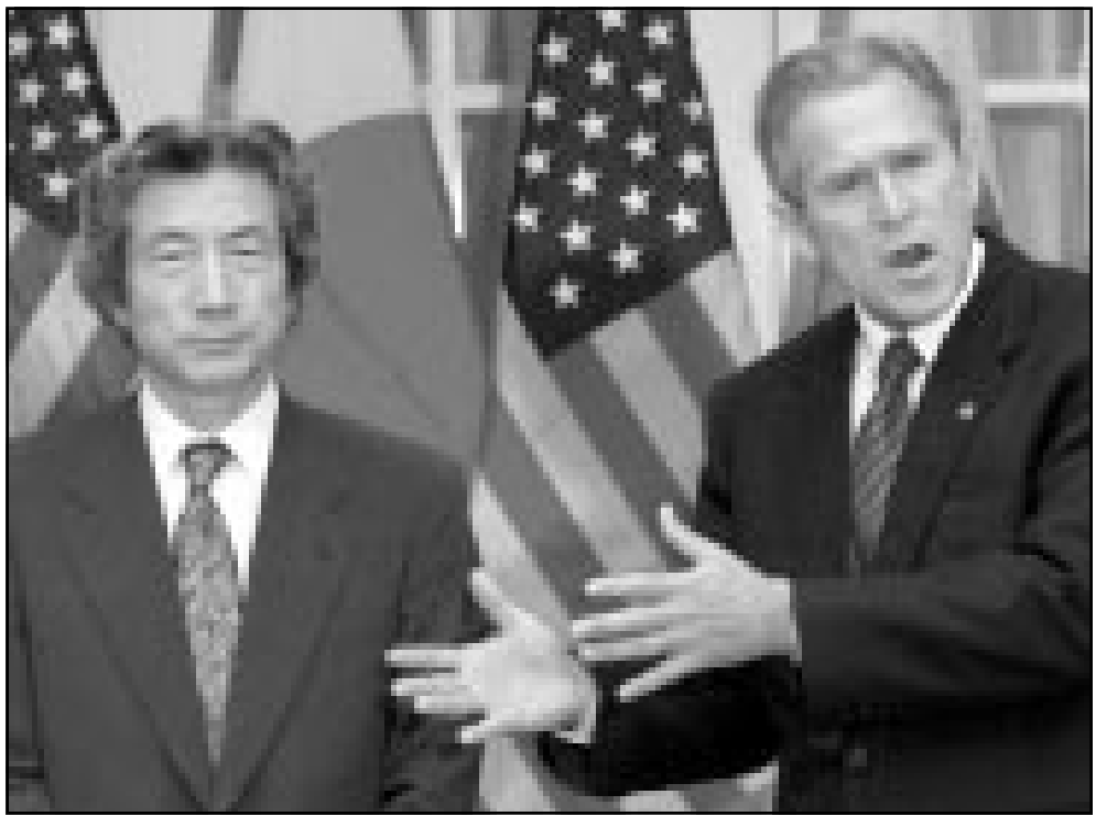
الرئيس الامريكي ورئيس الوزراء الياباني اثناء مؤتمر صحافي في البيت الابيض امس الاول