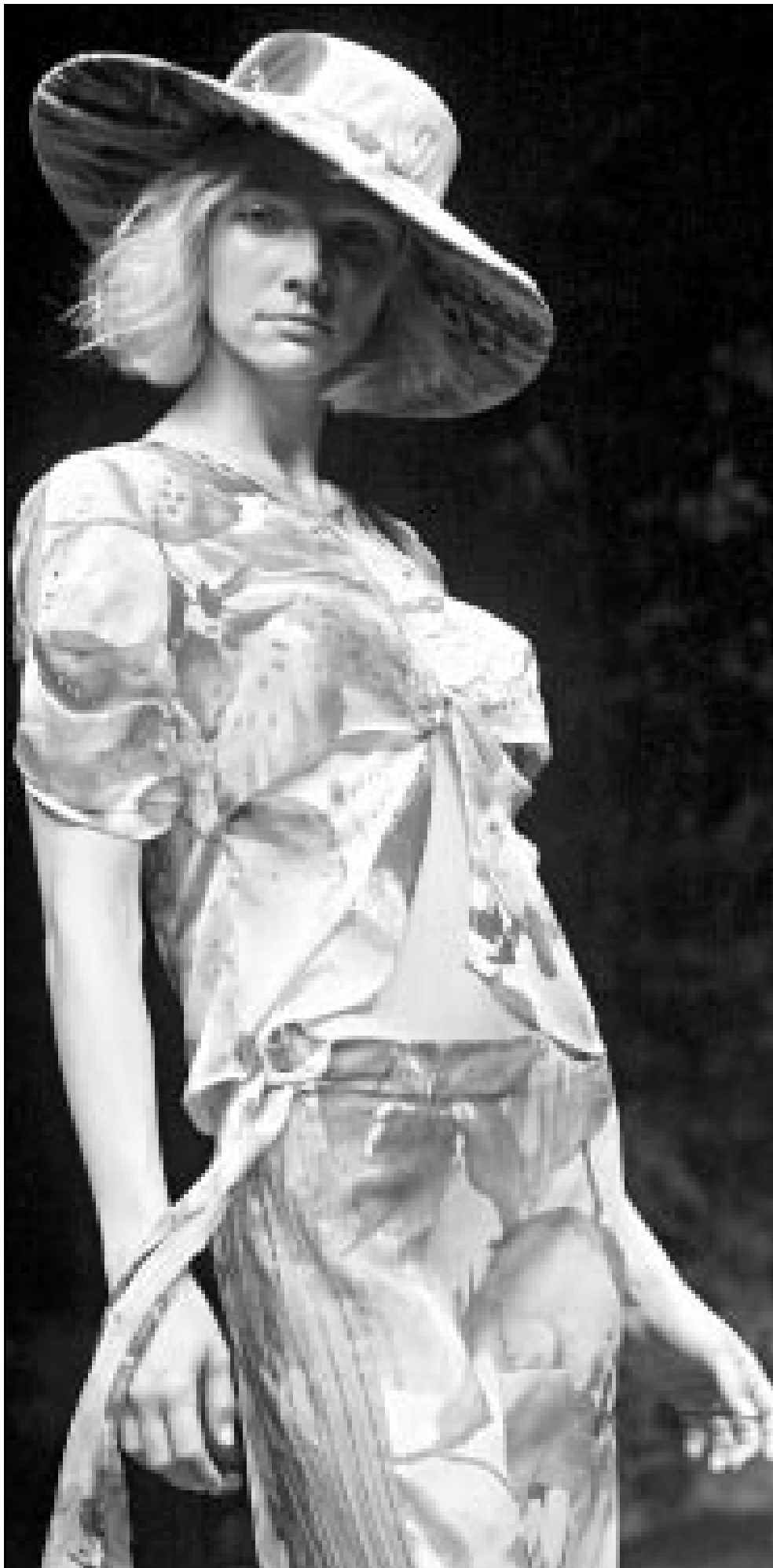
تصميم مبتكر لآزياء موسمي ربيع وصيف 2001 الجاهزة من مجموعة دي بريكو التي عرضت في ميلانو ليلة اسس الاول