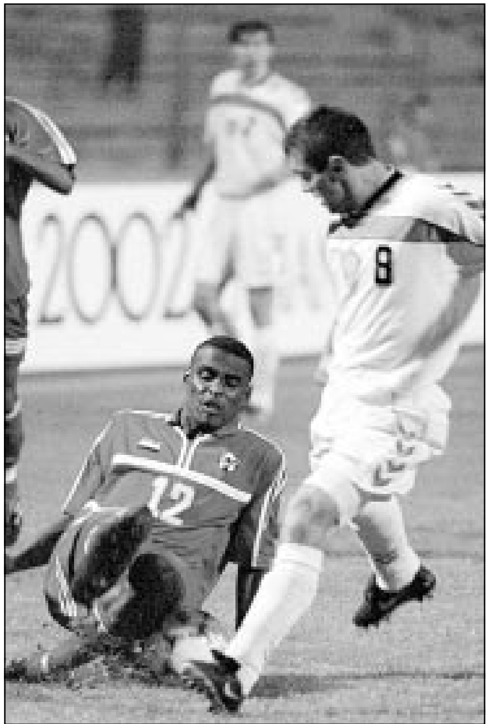
لقطة من إحدى مباريات منتخب الإمارات