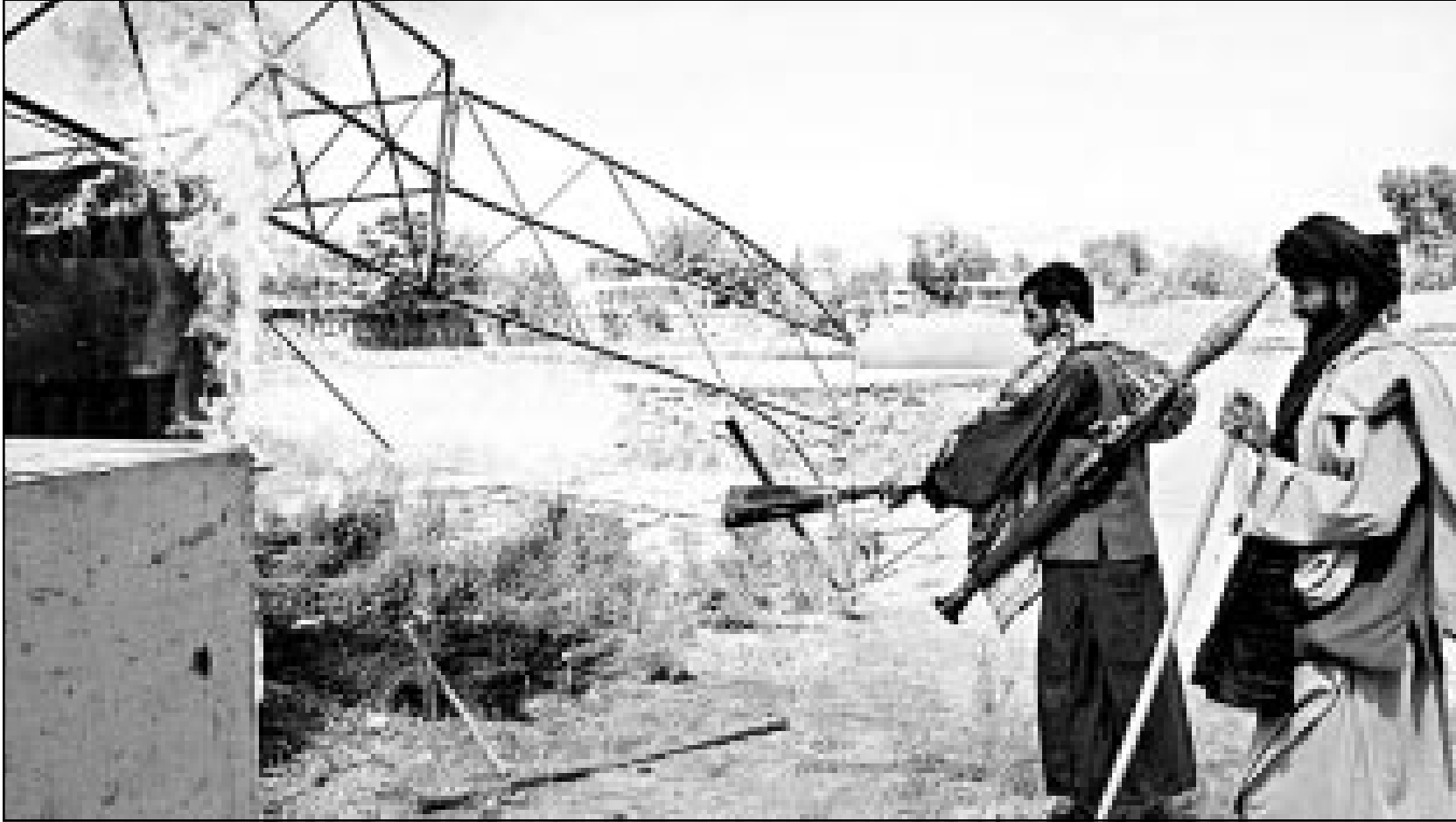
عامل افغانتي يحاول اطفاء النيران المشتعلة في مبنى السفارة الامريكية بالعاصمة كابول امس

كما تظهر ان 84 بالمئة من الامريكيين مستعدون لحرب طويلة في مواجهة الارهاب. (تفاصيل من 2 و3 و4 و7 و8)