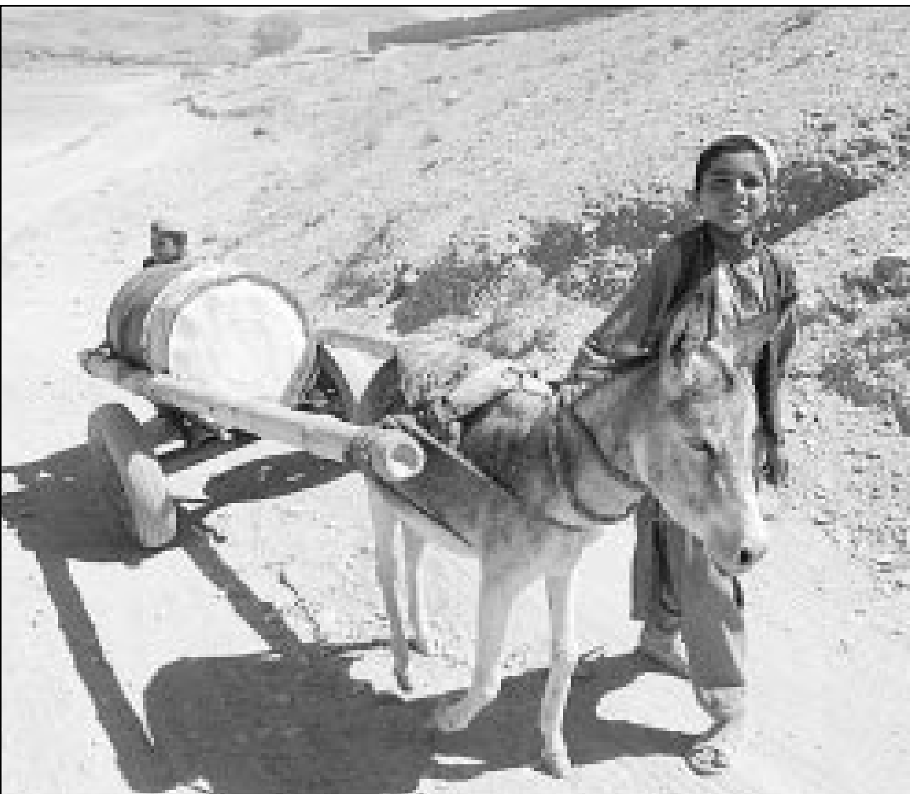
مطل افغاني ينقل مياهها للشرب في قرية قرب حدود باكستان

وقالت الامانة العامة للحزب الحاكم بان السودان يؤسس موقفه في هذه القضية على منهج ديني واخلاقي، ويؤكد الامانة العامة لحزب المؤتمر الوطني الحاكم في الخرطوم السياسات التي انتهجتها القيادة السياسية بالسودان ازاء الاحداث الامريكية الاخيرة ورفضها القاطع لارهاب ارواح المدنيين.