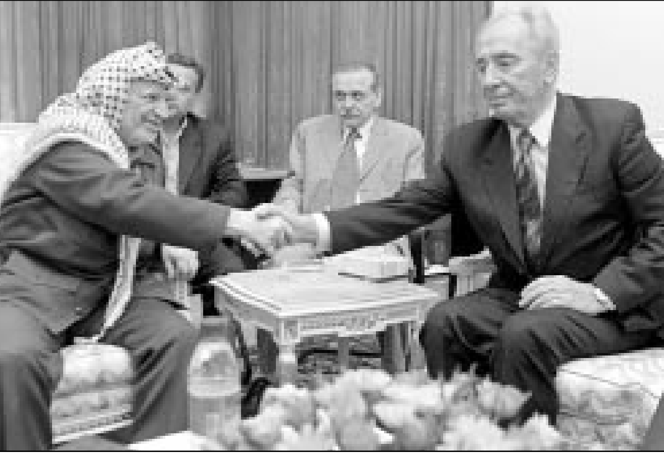
الرئيس الفلسطيني ياسر عرفات ووزير الخارجية الاسرائيلي شمعون بيريس لدى اجتماعهما امس في غزة