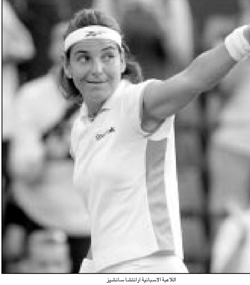
اللاعبة الإسبانية اراانتشا سانشير

وتابعت الصحفية «قدم ماتشالا بالشكر لاعضاء الوفد القطري على هذه الثقة مؤكدا لهم احترامه للعقد الذي يربطه بادارة نادي النصر ورافضا كل هذه الاعراء التي تمنحها اي مدرب». ونقل المصدر ذاته ايضا عن ماتشالا قوله «انا مدرب محترف ومن الممكن ان اتلقى عرضا من اي جهة». واكد ماتشالا «احترامه لناديه الحالي والتزامه بالعقد المبرم ميديا رغبته باكمال مشواره مع النصر وان تركيزه الآن على مباراة الفريق المقبلة في كأس الاتحاد الاماراتي مع الخليج». وكان ماتشالا بدأ تدريب النصر قبل نحو ثلاثة اشهر بعد ان قاد منتخب عمان الى الدور الثاني من التصفيات الاسيوية، ويقدم الفريق تحت اشراف عروضا قوية في كأس الاتحاد حتى الان تدخله في دائرة المنافسة على وعلى رئيس اللجنة التنفيذية لنادي النصر