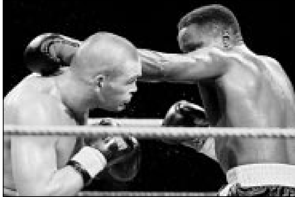
الملاكم الألماني ويلي فيتشر (يسار) ومنافسها الكيني جوسيف موكوتنج أخاسامبا

■ نيويورك - رويترز: احتفظ الملاكم الكيني جوسيف موكوتنج ببرون ميتشيل ببطولة رابطة الملاكمة العالمية عندما فاز على خصمه لاو جونغ في المباراة التي أقيمت بينهما على حلبة ماديوسون سكوير جاردن. وفي ساعة مبكرة من صباح أمس الأحد، وانتزع موكوتنج بطل اتحاد الملاكمة العالمي ومجلس الملاكمة العالمي لقب رابطة الملاكمة العالمية من ترينيداد عندما أوقف الحكم المباراة قبل انتهائها بدقيقة واحدة. ويهدأ يكون موكوتنج قد فاز في 40 مباراة مقابل هزيمتين وتعادل واحد. وكانت هذه أول هزيمة