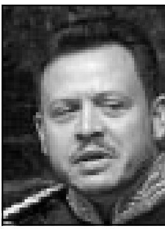
الملك عبد الله

الساحتين العراقية والفلسطينية، وهي حوافز لا تجازف بها واشنطن «مجانا» لأن مقابلها العربي سيكون مخايضة المصالح الإستراتيجية لصعيد الرصيد يفترض أن تتلقت إليه بغداد لاحقا. وأقربيا وبصرف النظر عن المشتكين باللون الأردني عاد الملك إلى عمان بعد أن «صح» بلاده ولو مؤقتا من أخطار الداعين إلى تغيير طبيعة وأصول العلاقات الأردنية العراقية أو على الأقل «لفن صبغهم» وعاد وبين يديه تكثيف شديد خاص بالملك الفلسطيني توارز مع تقديم «بورفات» ما يمكن للعراق أن يقدمه لو «خلصتهم» أمريكا من صدام الإسرائيلي ولو فكتة قبل التوازن في الصراع، وهي رسالة كانت واضحة جدا للعاهل الأردني.