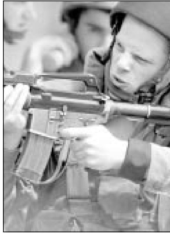
جندي اسرائيلي يوجه ببندقية تجاه مظاهرين في الخليل

وكانت رئاسة الاتحاد الاوروبي واثبات بشدة السبت تجدد المواجهات في الأراضي الفلسطينية معتمدة ان مشاركة الاطفال في التظاهرات في