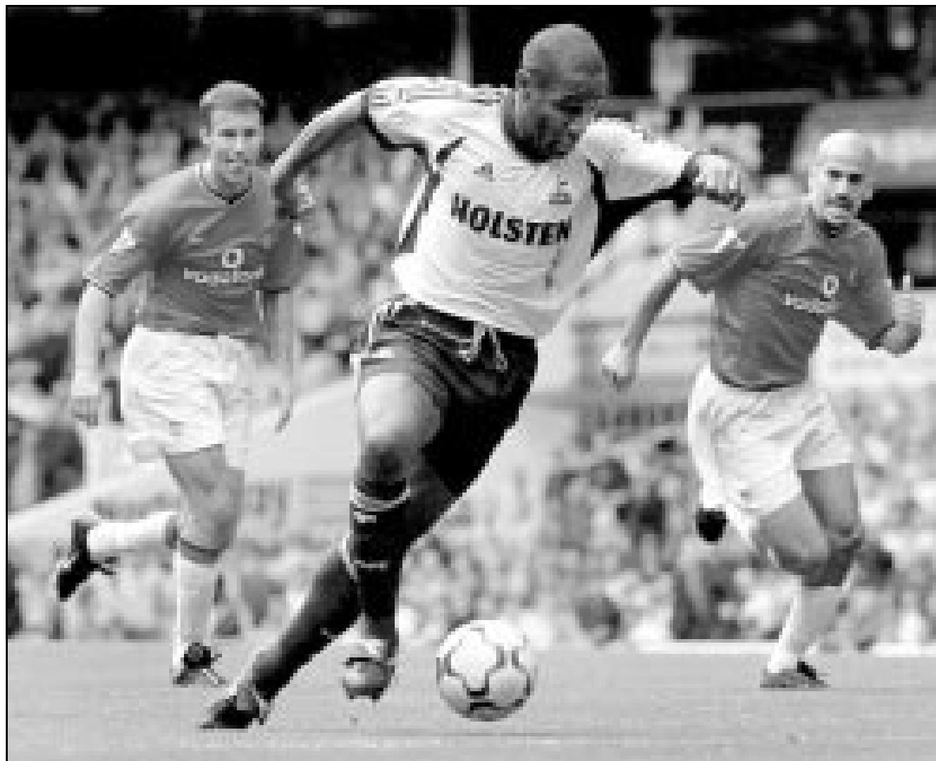
لقطة من المباراة التي جمعت بين مانشستر يونايتد وتوتنهام