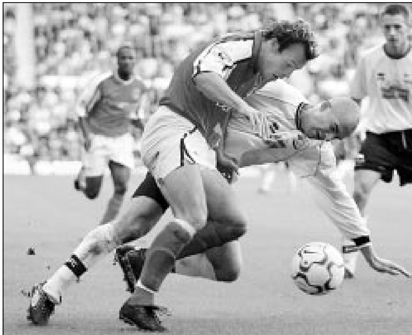
.. وأخرى من المباراة التي جمعت بين أرسنال وبردي