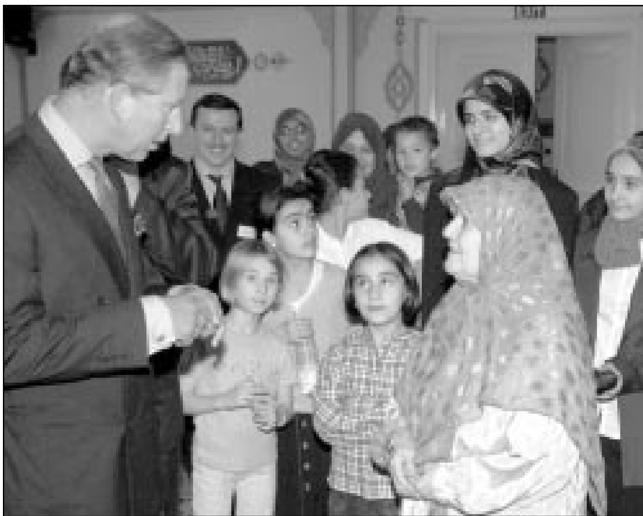
ولي العهد البريطاني الامير تشارلز يتحدث لسيدة مسلمة اثناء زيارته مسجد السليمانية في منطقة «هاكني» شرق لندن

واعتقل خان وجويد اثناء سفرهما دون بطاقات هوية وبعزمتها اشياء وصفتها الشرطة بانها مثيرة للريبة من بينها مبالغ نقدية تصل لالاف الدولارات وصيغة شعر وشفرات مثل تلك التي استخدمت في خطف الطائرات التي اصدمت بمركز التجارة العالمي ومبنى وزارة الدفاع الامريكية.