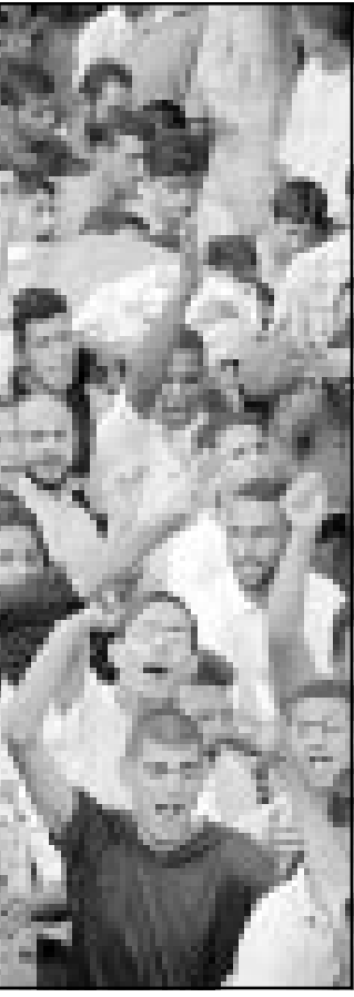
جانب من جنازة شهيدين شيعا في مدينة نابلس

وقال مسؤول أممي اسرائيلي رفض نشر اسمه ان مسؤولين أمنيين فلسطينيين ابغضوا نظراً هم الاسرائيليين في اجتماع يوم الجمعة انهم لن يلقوا القبض على النشطين وهو وصف ذلك المصدر انه قد يحبط الخطوات الاسرائيلية لتخفيف الحصار، واغلت اسرائيل قطاع غزة والضفة الغربية منذ اندلاع الانتفاضة الاسرائيلية في ايلول الماضي، ويصف الاسرائيليون الاطلاق الاسرائيلي بأنه عقاب جماعي، وقال المسؤولون اسرائيل برهفها الصامت لتحمل مجازفة محسوبة بالا ينفذ المتكبدون هجوم بالقبض على عشرة نطفين فلسطينيين بها اسرائيل اذا رفضت السلطة