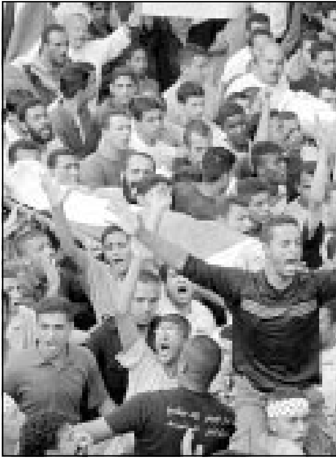
جانب من جنازة شهيدين شيعا في مدينة نابلس (اف ب)

فلسطينيين نفوا انه طلب منو انهم وافقوا على القبض على نشطين وقالوا ان اسرائيل تعهدت بالبدء من يوم الثلاثاء ومن تعهدتهم ولست وانقا ان يكون من الحكمة في ظل هذه الظروف بدء رفع الاطلاق واخذنا خطوات من جانب واحد».