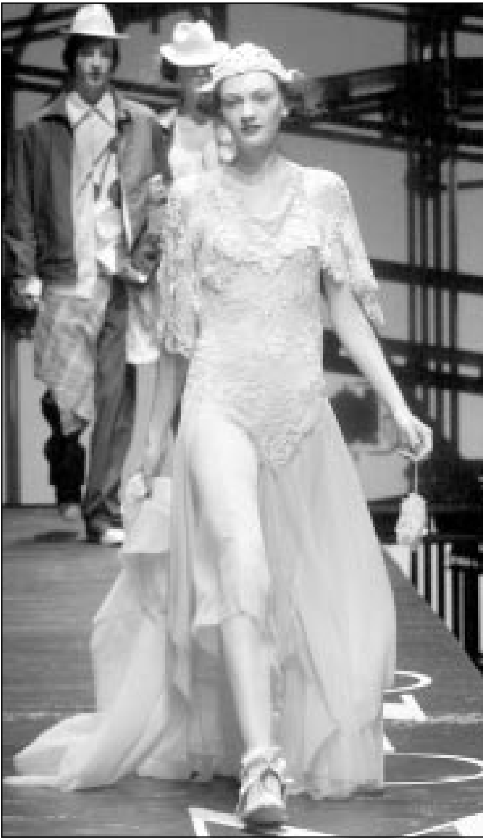
من مجموعة منبكرات ائتونيو مراسم هذا الذي ضمن ازياء موسمي ربيع وصيف 2002 في عرض اقيم بميلانو

■ وأضافت «ان البانوراما تعتمد على اهم المقطوعات الموسيقية في الدول العربية يعتيها عرب تربط بينها الحان وكلمات غنائية مصرية».