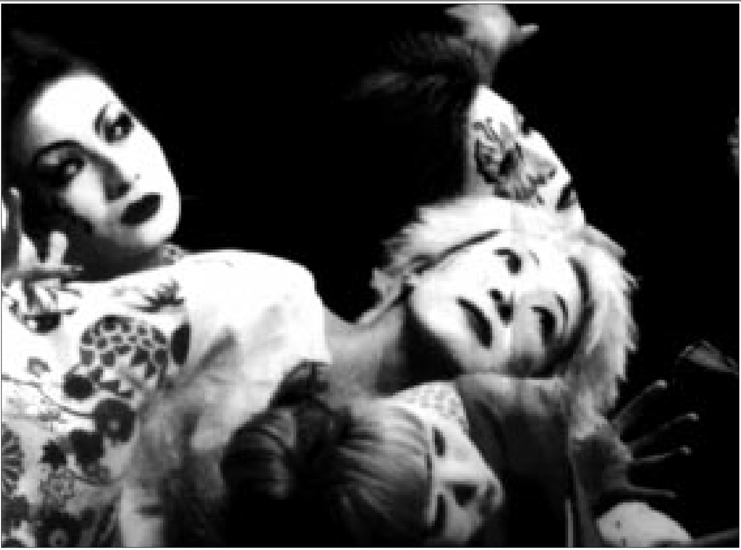
مشهد من إحدى المسرحيات المشاركة في مهرجان المسرح التجريبي

الرباط - «القدس العربي»: أصدر الباحث المغربي إدريس قصوري كتابا تحت عنوان «أسلوبية الرواية، مقارنة أسلوبية لرواية (زقاق المدق) لنجيب محفوظ» هذا الإصدار، الذي يقع في 465 صفحة، على مدخل عام وبابين، في المدخل العام يطرح الكاتب مجموعة القضايا النظرية والمنهجية حول المحاور التالية: «البلاغة في أفق الأسلوبية» - «الأسلوبية من التعبيرية الى الوظيفية» - «الأسلوبية في أفق السيميولوجيا»، «الأسلوبية في ضوء اللسانيات»، وخصص الكاتب الباب الاول ناقشة «عناصر الاشتغال اللغوي الأسلوبية