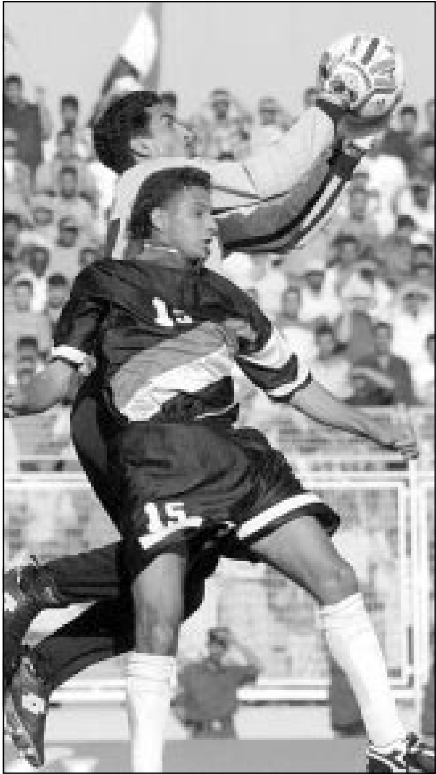
لقطة من إحدى مباريات منتخب العراق