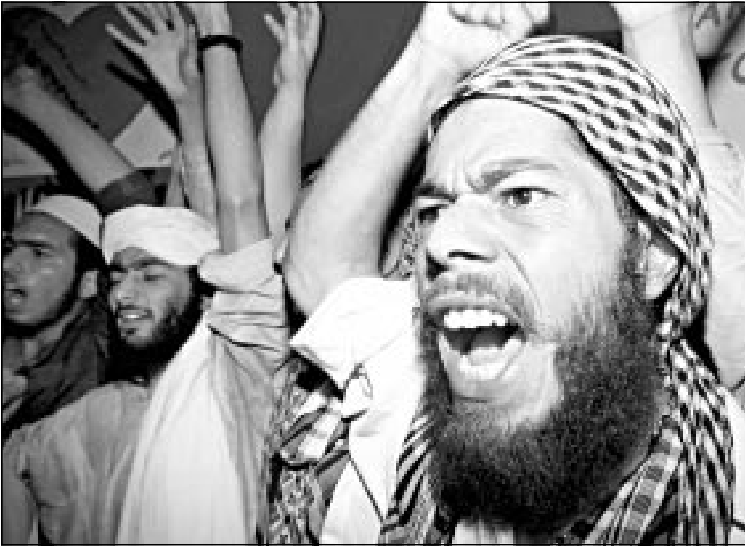
مظاهرون باكستانيون يهتفون بشعارات منددة بالولايات المتحدة وتهديدها لافغانستان

■ لندن - اف ب: اعربت الولايات المتحدة وبريطانيا عن استعدادهما لمهاجمة العسكرة الأفغانية التي يسيطر عليها اسامة بن لادن، الشقيق في الرئيس في اعتداءات الحادي عشر من ايلول (سبتمبر) في نيويورك وواشنطن، في 48 ساعة المقبلة، كما ذكرت الصحافة البريطانية أمس الاحد. وقالت صحيفة «الوايزفر» نقلا عن مصادر أمريكية وبريطانية لم تكشف عنها، ان الهدف من هذه الهجمات ستستهدف، في وقت متزامن، قتل بن لادن وتوجيه ضربات للقوات الجوية والبحرية لنظام طالبان الحاكم في كابول. وأضافت الصحيفة نقلا عن المصادر نفسها ان هذه الضربات الجوية قد تشن اعتبارا من امس الاحد مدعومة بتدخل القوات الأمريكية والبريطانية الخاصة. أما صحيفة «ميل أون صندي» الشعبية فقالت ان قائدا عسكريا في