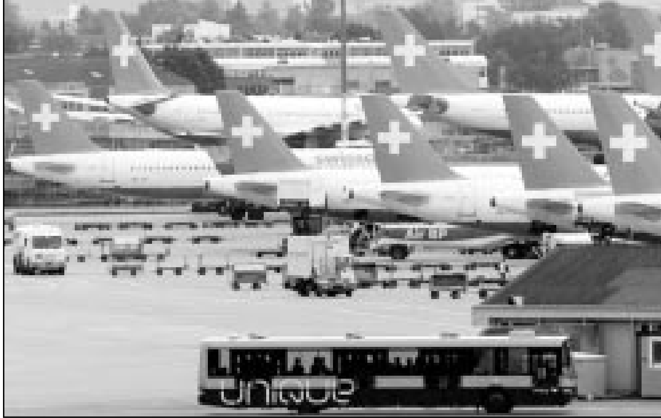
عدد من طائرات سويسر اير يرضخ في مطار زيورخ

الاجل وترتيب اعادة تمويل اطول اجلا. وقال رينز ميير المتحدث باسم سويسر اير «نحن نسعى للتوصل الى حل الا انه ليس لدينا اي تفاصيل حتى الان. السبب محدود، و«اضاف بييس في وسعنا اجتناب هذا الموقف بدون مساعدة حكومية».