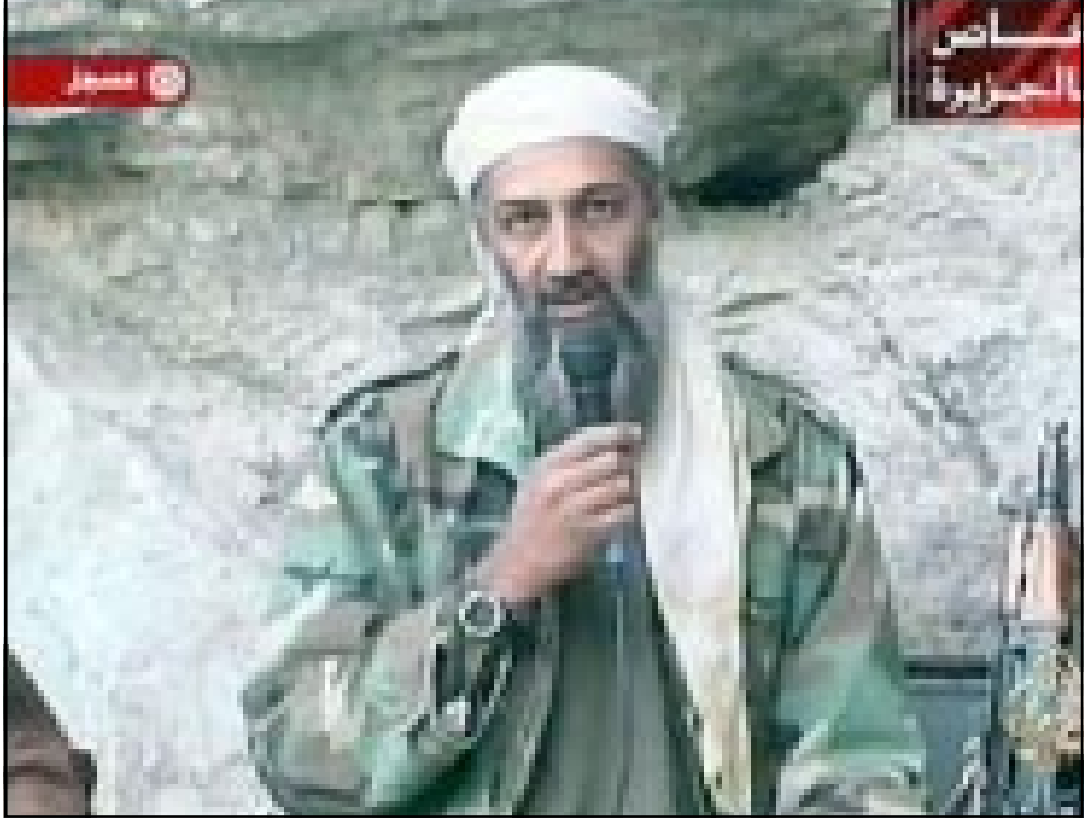
المعارض السعودي اسامة بن لادن يتحدث لقناة الجزيرة من مخبئه في افغانستان اسس

بدأت الحرب.. الصواريخ الامريكية تتساقط كالطمر على المواقع العسكرية، لحركة طالبان، والرئيس جورج بوش الابن، يؤكد لشعبه ان النصر على الازهاب بات قريبا. الطائرات الامريكية التي تقصف المطارات في قندهار، وجلال اباد وكابول تتحول وتجوول دون ان يعترضها احد. فالمطارات مهجورة ومعطلة تماما، وحركة طالبان المستهدفة ليست قوى عظمى تملك الصواريخ والمضادات الارضية الحديثة، ولا حتى القديمة، وكل ما تملكه هو مجموعة من الرجال المؤمن مستعدين للانتقال الى دار البقاء وملاقة ربهم. الغلبة في الايام، وربما الاشهر الاولى، ستكون للقوة العظمى المهاجمة وحلفائها، وللمتعلقين باذئابلها من الضعفاء والانتهازيين، ولكن لا احد يستطيع ان يتنبأ بما يمكن ان يحدث حينما لا تجد الطائرات ما يمكن ان تقصفه من مواقع. كنت احد الصحافيين القلائل الذين زاروا افغانستان، وسنحت لي الفرصة للالتقاء ببعض قادة طالبان، والتجول في بعض المدن الواقعة تحت سيطرتهم، لم ار في حياتي، وانا الذي انتمي الى قاع المجتمع، اكثر فقرا من الشعب الافغاني، فلا توجد عمارات، ولا طرق معبدة، ولا مستشفيات، بلاد انتهكتها الحرب، وتلاعبت بأهلها القوى الكبرى، كل حسب مصالحه واهدافه.