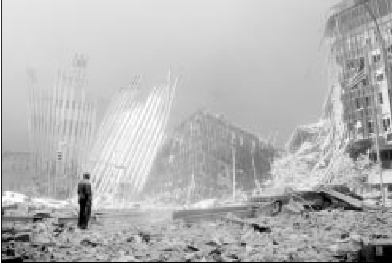
نيويورك - من ميشال موتو:

سيلقي الاعتداء المزدوج على مركز التجارة العالمي في نيويورك، والذي ادى الى تدميره بالكامل، بعبء مالي يفوق التصور على عاتق نيويورك المشتركة بين البلدين. وجاء في البيان المشترك الذي أصدرته اللجنة في ختام أعمالها ان البلدين اتفقا على تعزيز التعاون الاقتصادي والتجاري والصناعي بينهما وتشجيع القطاع الخاص للمشاركة في فرص الاستثمار المشترك والعمل على زيادة معدلات التبادل التجاري. كما اتفق البلدان على العمل لإنشاء مجلس مشترك لرجال الأعمال من كلا البلدين. وتم التوقيع على مذكرة تفاهم بين وزارتي التربية والتعليم في كلا البلدين حول تشجيع استقطاب المعلمين من البحرين للعمل في الإمارات، ودعم وتعزيز التعاون بينهما في المجال الإعلامي والثقافي وتبادل الخبرات الفنية والإذاعية والاستفادة من المنح في المعاهد والمراكز الإعلامية في كلا البلدين. واتفق الطرفان على تشجيع توظيف الأيدي العاملة الوطنية وتسهيل نقلها والتنسيق بين وزارتي العمل والشؤون الاجتماعية في المجالات المتعلقة بأشغالها العمالية والاجتماعية وشؤون الأسرة والفئات الخاصة دعم التعاون بين البلدين في شؤون الطيران المدني، وخصوصا فيما يتعلق بدعم التعاون القائم في مجال المراقبة الجوية والبحث والانقاذ.