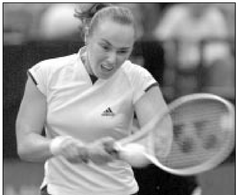
السويسرية مارتينا هينغيس

وتشارك الامريكيتان جنيفر كاربياي وليندسا ديغنبورت في الدورة وذلك لأول مرة بعد الاعتداءات التي استهدفت نيويورك وواشنطن في 11 ايلول/سبتمبر الماضي واقعت ما يزيد عن 5 آلاف قتيل او مفقود.