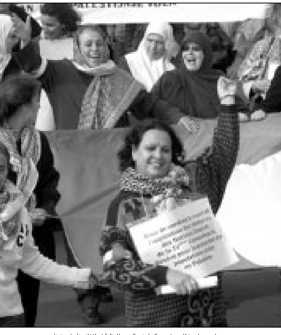
سيارات عبريات يتظاهرون في بروكسل ضد الحرب المرتقبة في افغانستان

روميكا - بروكسل - ا ف ب - رويترز: اعتبر الممثل الاعلى للاتحاد الاوروبي للسياسة الخارجية فاخبير سولانا في مقابلة نشرت أمس الأحد في ايطاليا ان انضمام روسيا الى حلف شمال الاطلسي «لن يكون في مستقبل قريب» رغم التقارب الجاري مع موسكو. وقال سولانا وهو امين عام سابق للحلف لصحيفة «لا ستامبيا» الإيطالية ان «تغيرات عميقة تجري حالياً لكنني لا اعتقد ان الانضمام سيتم في مستقبل قريب». واقرا ان «العلاقات باتت أكثر وثوقاً مع موسكو». ورفض سولانا فكرة تحول الحلف الاطلسي الى منظمة ذات طابع اقل عسكري قائلاً «التحديات العسكرية تغيرت، ان القومات السياسية باتت أكثر وضوحاً غير ان الحلف لن يكون له دور سياسي اذا لم يستند الى جهاز عسكري». واعن الرئيس الروسي فلاديمير بوتين الاربعة في بروكسل ان روسيا مستعدة لراجعة موقفيها الحدودية، حيث المقاطعات الحلف الاطلسي في حال «شهد هذا الاخير تغييرات» و«بات منظمة «كأثر سياسية» وفي حال لم تبقى موسكو خارج هذه العملية». وكان سولانا يتحدث في البندقية في شمال ايطاليا حيث يشارك في عطلة نهاية الاسبوع في منتدى دولي حول العلاقات بين الاتحاد الاوروبي والبلقان ينقله معه اسبن. وفي المقابلة نفسها، اعرب سولانا مجدداً عن التحفظات الاوروبية حيال الحرب التي تشنها موسكو في الشيشان. وقال «المقاربة لم تتغير: ان مكافحة الارهاب والدفاع عن وحدة الاراضي