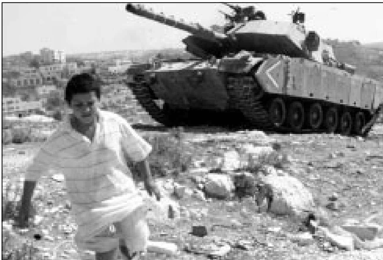
صبي فلسطيني يسير امام دبابة اسرائيلية دخلت مدينة الخليل التابعة للسلطة الوطنية، وتمركزت القوات الاسرائيلية منذ الجمعة في مواقع استراتيجية في المدينة

بناية هداما. من اعلت اليهودي تصريحا للدخول الى داخل مسارا اطلاق النيران لا يمكنه ان يبدي السذاجة، وان يوضح الان سبب «اضطرابه» ان احتلال حي ابو سنينة. همل كل احد ما يسمح اليوم لليهود بان يتوجهوا الى مسقط رأس ابونا ابراهيم في مدينة اور؟ أم توجه في حملة لاعادة بناء قبر يوسف في نابلس؟ هل كان قائد النظفة الوسطى يسمح استوطنى قديم او عوفري في القنبايم بزبنة في جيبال نابلس؟ جيش الدفاع احتل حارة ابو سنينة في الوقت الحالي، هذا الحي لا يخفف عن باقي احياء الخليل التي يبلغ تعدادها مئة ألف مواطن فلسطيني في 500 بيوردي، ذلك انه لو لم تطبق النيران على المحتلين من حارة ابو سنينة، لكانت انطلقت من حارة الشيخ، او من منطقة القبرة وربما من البيوت الخاصة بجانب شارع المشالة لرفقا او التسلالة التحتا، وربما من داخل القصبة، هناك احياء وحارات كثيرة في هذه المدينة العربية، وعشاق صهيون لا يقطنون ايا منها.