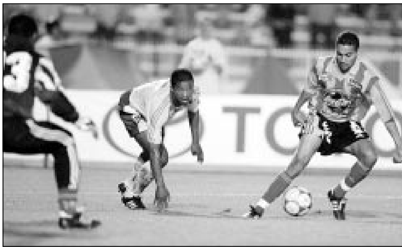
لقطة من إحدى مباريات فريق الترجي التونسي