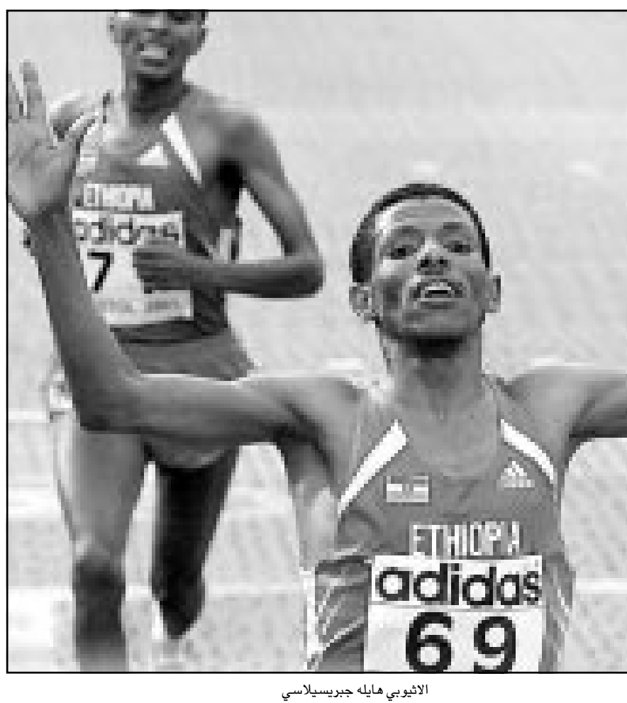
الاثيوبي هاييله جبريسيلاسي

● رودي فولر (مدرب المنتخب الألماني): «انها خيبة أمل كبيرة خصوصا اننا كنا قارب قوسين او ادنى من بلوغ النهائيات مباشرة. لكنني بعد هزيمة سيئة في الشوط الاول، في حين ضغطنا بقوة في الثاني وسنحت لنا فرص عدة للتسجيل لم نحسن استغلالها. اننا نقف ضد فنلندا فلا خوف من عدم التأهل». ● ميكال سيكيه (مساعد فولر): «اللاعبون محبطون بطبيعة الحال، لانهم من جهة فشلوا في الفوز على فنلندا ومن جهة اخرى لان المنتخب الانكليزي ادرك فشل المنتخب الاخيرة. لا نستطيع توجيه اللوم الى اللاعبين لانهم بذلوا جهوداً كبيرة خصوصاً في الشوط الثاني». ● جيرهارد ماير فوفيلدر (رئيس الاتحاد الألماني): «كانت بطاقتة التأهل المباشر في متناولنا، شاهدنا شوطاً اولاً سيئاً قبل ان نتحسن الامر في الثاني». ● انتي مورين (مدرب فنلندا): «انها النقطة الاولى التي ننزعها في المانيا وبالتالي نشعر بفخر كبير. اريد ان اوجه شكرى الى الحارس انتي نيمسي نجم المباراة من دون منازع، تأمل مستقبلها في المشاركة في بطولة العالم وكأس الامم الأوروبية للمرة الاولى في تاريخنا».