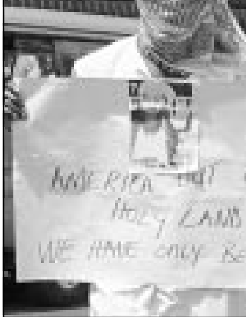
مواطن كيني يرفع لافتة تحمل صورة من لادن وتطالب امريكا بمغادرة اراضي المسلمين أثناء مظاهرة نظمت في نيويورك الجمعة

المساعدات الانسانية للشعب الافغاني. وقال للمجلس الدائم «ننسى الولايات المتحدة الشعب الافغاني. ونحن ملتزمون ايضا بحماية حقوق الانسان لشعب افغانستان».