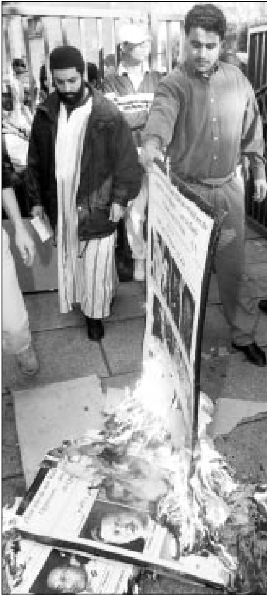
مسلمون يحرقون العلم الأمريكي وصور مشرف عقب صلاة الجمعة بالمسجد المركزي في لندن

بعد الهجمات والتي وثقتها الصحف البريطانية والمنظمات الإسلامية أيضا. ولم يتحدث استطلاعيا «الغارديان» و«ديلي تلغراف» عن موقف البريطانيين من ان الحرب قد تتطور لحرب شاملة كما عبر استطلاع امريكي اخير قال فيه ان الامريكيون خائفون من تطور الحرب قد تضع امريكا في مواجهة مع حلفائها العرب والمسلمين.