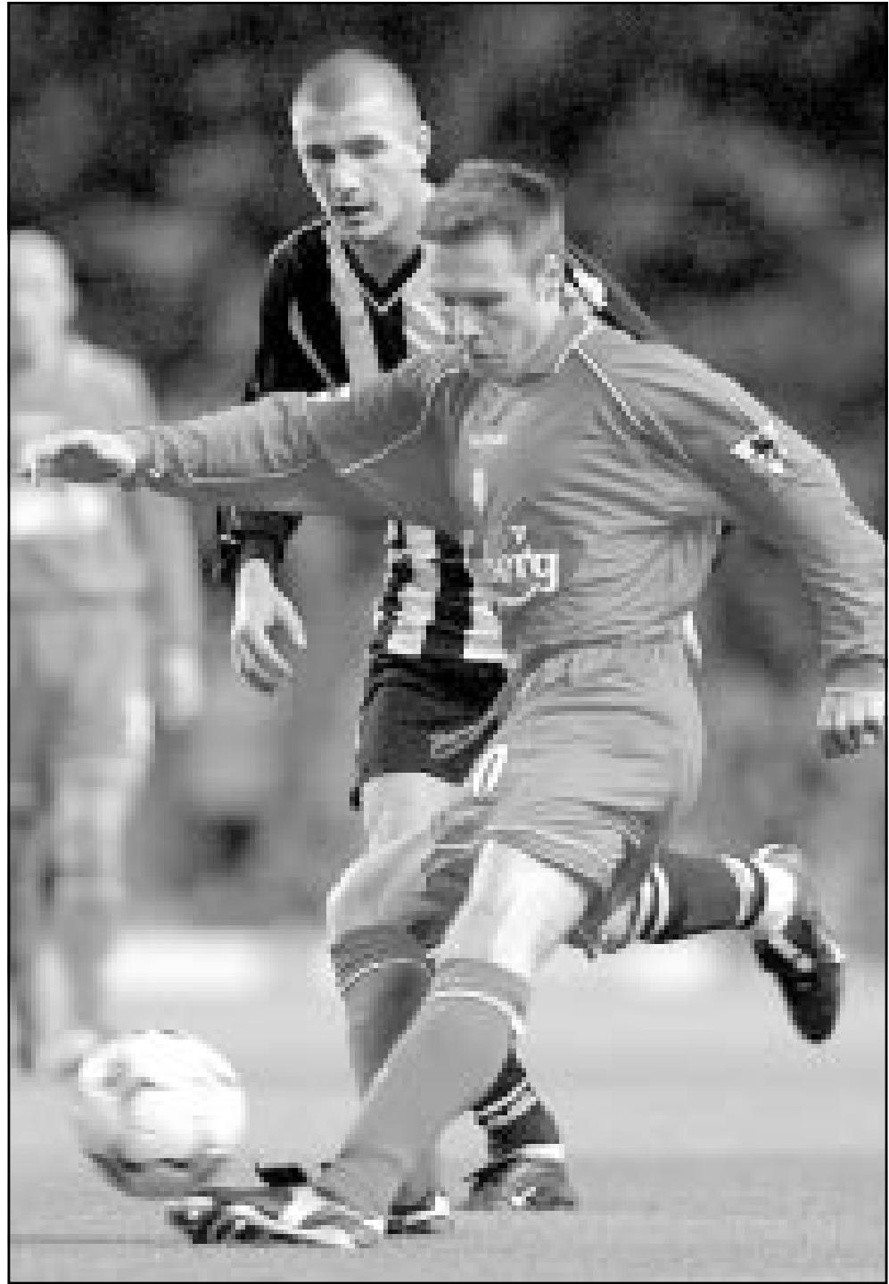
لقطة من إحدى مباريات فريق ليفربول