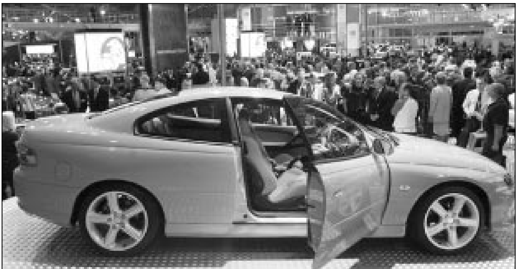
اول سيارة هولاند موارن يتم انتاجها منذ 25 عاما لدى عرضها الخميس في سيدني. وتتميز هذه السيارة بانها انتجت بفضل تقنية تستعملها الشركة الاسترالية المنتجة تقوم على تصميم وتنفيذ مختلف عمليات صنع السيارة بواسطة الكمبيوتر دونما نموذج تجريبي مكلف

على صعيد آخر امرت الولايات المتحدة الجمعة مصارف ومؤسسات مالية بتجميد ارصدة 39 فردا ومنظمة يشتبه في انهم على صلة بالارهاب، ما يرفع على العدد الاجمالي للافراد والمنظمات المشبوهة. واعلن وزير الخزانة الامريكية بول أونيل ان «الافراد والمنظمات الـ39 المذكورين هم