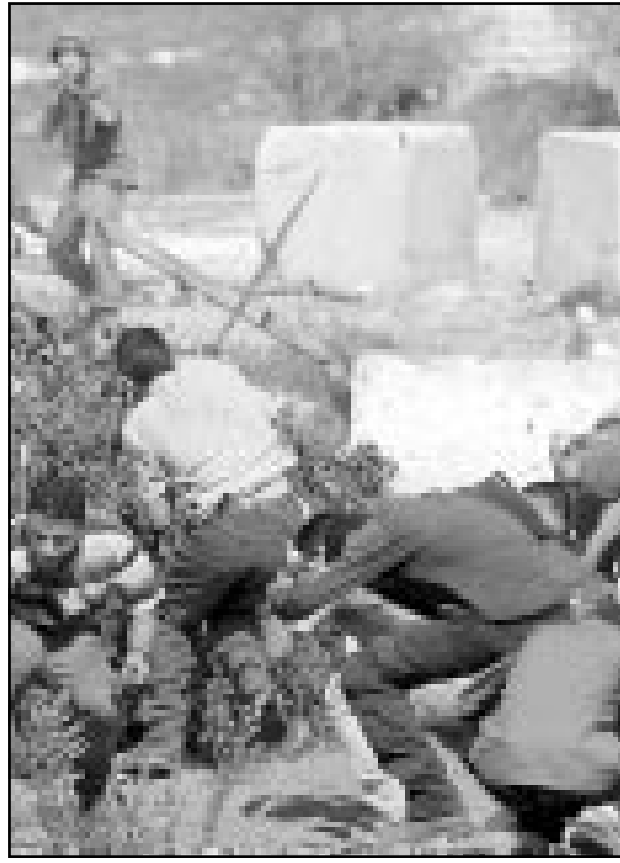
شبان فلسطينيون يخبثون من الرصاص الاسرائيلي خلال اشتباكات في رام الله

غزة - من و فاء عمرو: أعرب فلسطينيون في قطاع غزة عن غضبهم الخميس تجاه مقتل اثنين من المتحججين في وقت سابق من الاسبوع عندما حاولت الشرطة الفلسطينية تفريق مظاهرة مؤيدة لاسامة بن لادن.