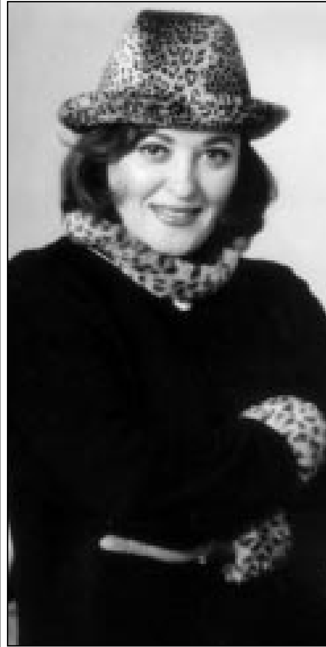
القاهرة - «القدس العربي» - من اسلام صادق: