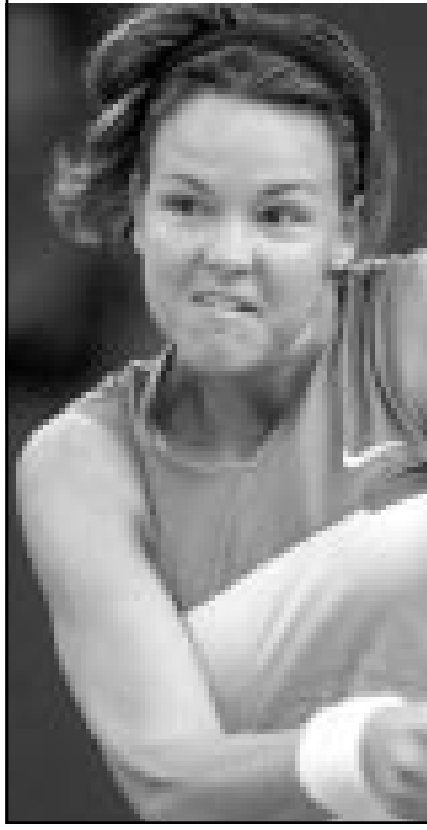
الامريكية ليندساي ديفنبورت

■ فيلدرشات (المانيا) - أ ف ب: تاهلت الامريكية ليندساي ديفنبورت المصنفة ثالثة الى ربع نهائي دورة فيلدرشات الالمانية الدولية في كرة المضرب بفوزها على آن كريم من لوكسمبورغ 5-7 و6-5. وحققت الالمانية انكع هوير المفاجأة الاولى في هذه الدورة بفوزها على البلجيكية كيم كليسترز المصنفة رابعة 3-6 و4-4 و6-3. وقدمت هوير (26 عاما والمصنفة 20 عالميا) التي ستعلن اعتزالها في كانون الثاني/يناير المقبل بعد مشاركتها في بطولة استراليا المفتوحة، مباراة قوية امام جمهورها، ونجحت في كسر ارسال كليسترز المصنفة خامسة عالميا 3 مرات على التوالي في المجموعة الاولى. وفي المجموعة الثانية التي شهدت منافسة قوية تابعته هوير تالفا قبل ان تهدر فرصة الفوز بالبطولة الحاسم لتحسم كليسترز الفائزة بدورة لاينزيغ قبل نحو اسبوعين الامر وتقرض خوض مجموعة ثالثة كانت فيها العلية لهوبر 3-6. وسبق لهوبر ان احزرت نافترايتلوا في نهائي الدورة الاولى. وفازت البلجيكية الاخرى جوستين هينان المصنفة سادسة على الامريكية تشاندرا روبن 7-5 و3-6 و6-3. والفرنسية ساندرين تشنو على الاسبانية ماغي سيرنا 4-6 و6-4.