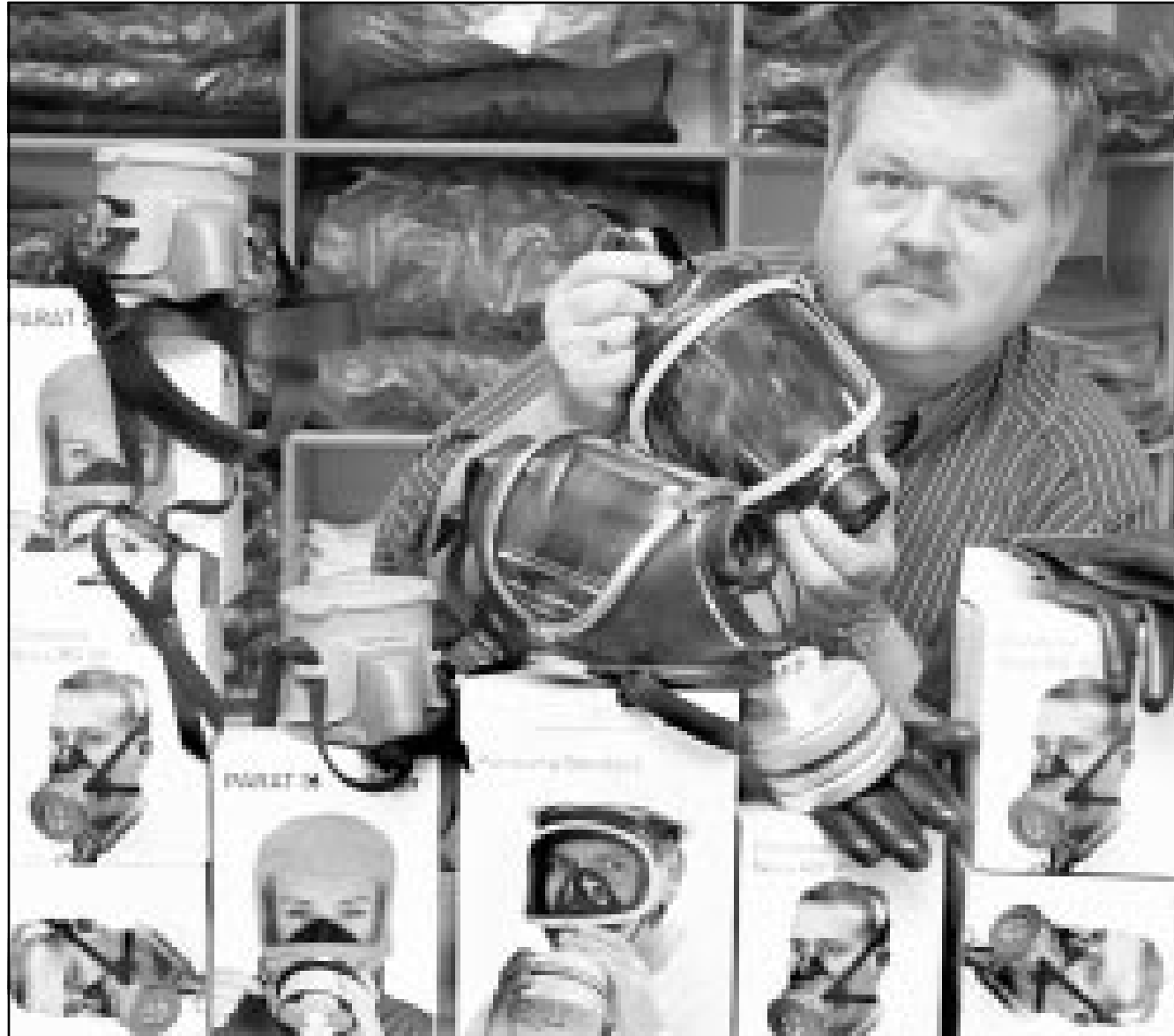
الربيع لايدر مدير شركة المنية تتبع معدات وقاية من الأمراض الخبيثة يعرض واقبات غاز. وكانت شركة «باير» لصناعة الأدوية اشارت الى وجود نقص في مضادات مكافحة الجمرة الخبيثة، معلنة زعمها زيادة إنتاج أنواع «سييرو» و«بييرو» ابتداء من الشهر المقبل استجابة للطلب الأمريكي (ا ف ب)