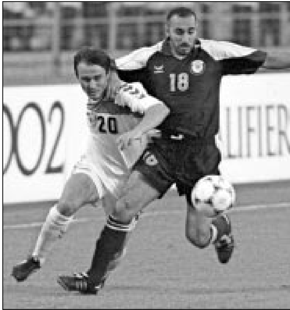
لقطة من احدى مباريات منتخب قطر

■ نيوقوسيا - أ ف ب: تقام السبت ثلاث مباريات ضمن الجولة التاسعة قبل الاخيرة من منافسات الدور الثاني الحاسم المؤهلة الى نهائيات كأس العالم 2002 لكرة القدم في كوريا الجنوبية واليابان. ضمن المجموعة الاولى، لعب تايلاند مع البحرين في بانكوك، وفي الثانية، تلتقي الصين مع قطر في شنغاي، وعمان مع اوزبكستان في مسقط.