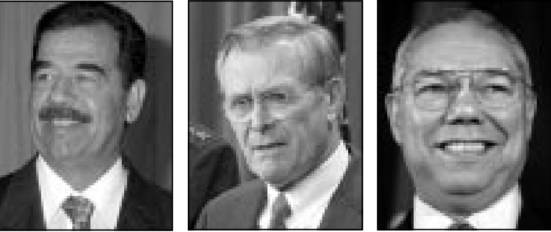
صدام حسين، دونالد رامسفيلد، كارل باول

صيفه لكنها لم تستخدم أي صيغة توجيها لها بأنها تساند حملة المجتمع الدولي الحالية، ولم يعرف بعد ما إذا كانت بغداد ستأخذ بالنصيحة أم ستجاهلها خصوصاً بعد خطاباتها قادتاً بعد استجابه لا توجيها باي تقدم على صعيد ما يقدره الناس الأردنيون. وفي نفس الإطار لدى الأوربيين تقدير آخر يقول بان روسيا قد لا تستطيع مساعدة العراقيين مرة أخرى بعد أربعة أشهر إذا قرر الأمريكيون كما يقولون العودة بقوة مجددا لفرض مشروع «العقوبات الذكية» التي ستضع المراجعة، وهذا يعني تقديم نصيحة ضمنية ثانية تقضي بان تتقدم أي خطوة معقولة لتساعد الروس مجددا، والخطوة المكنة فقط هي السماح بعودة المفتشين.