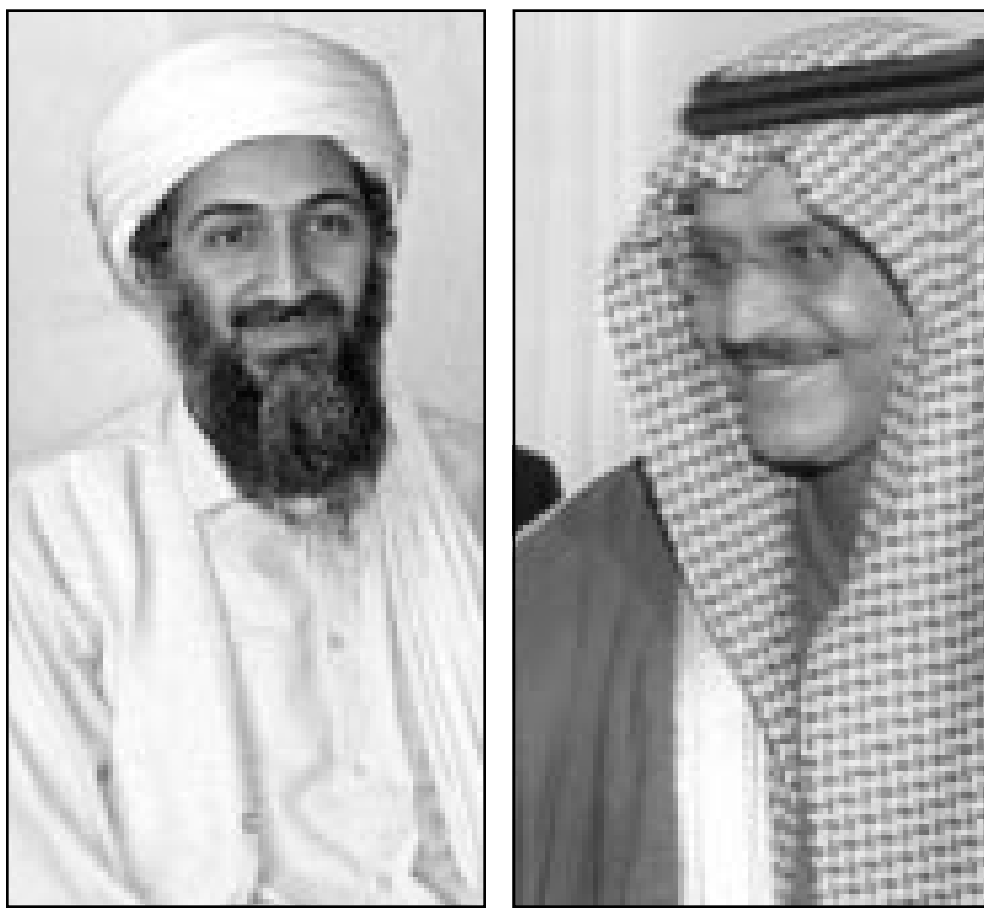
اسامة بن لادن