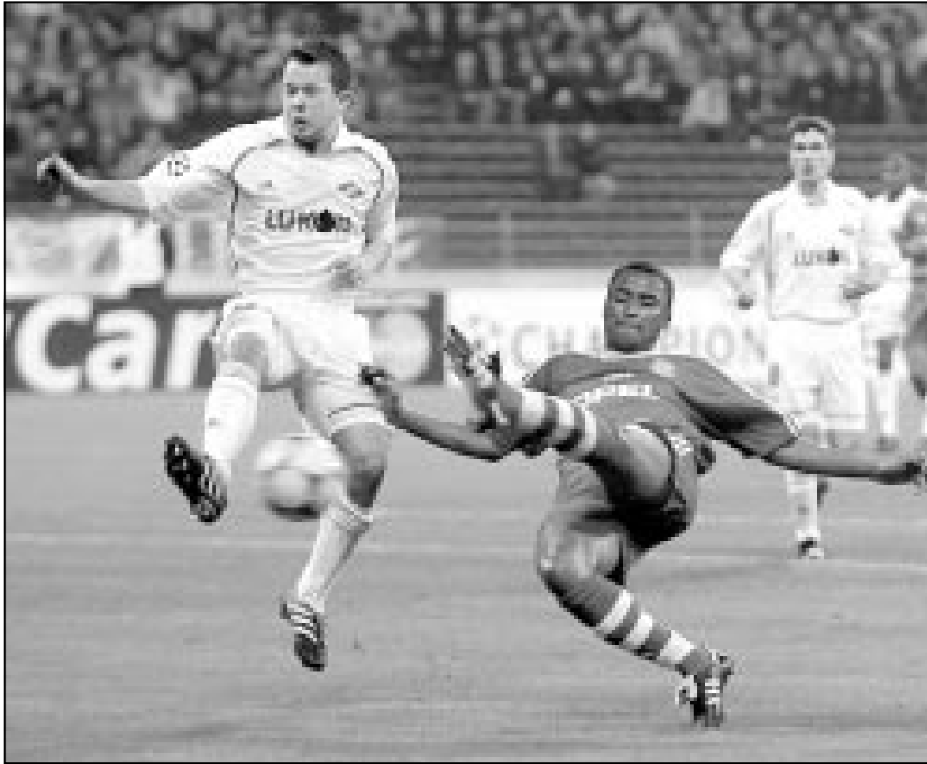
لاعب سبارتاك موسكو (يسار) يتحدى باولو سيرجيو لاعب بايرن ميونخ في الفوز بالكرة