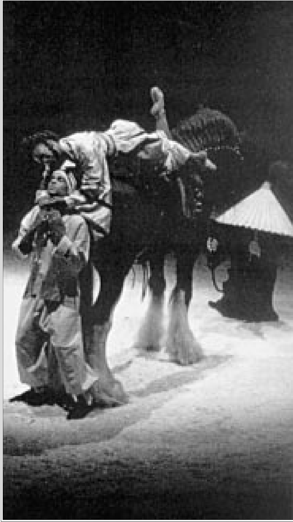
مشهد من اعمال بيتر بروك المسرحية

على التقيضي تماما مما كان سائدا في عشرينات القرن السابق، عندما كان جاك كويو يبجل ويعظم مسرح