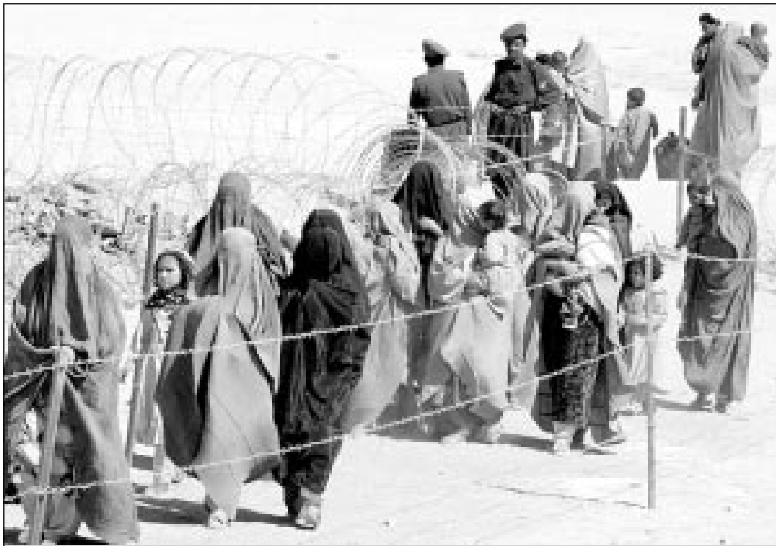
افغانيتا يحملن الماطل عبر الاسلاك الشائكة متجهات الى باكستان هربا من القصف الامريكي