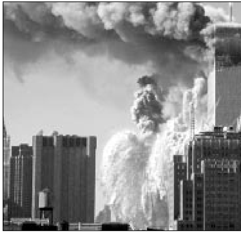
المرکز التجاري العالمي يحترق في نيويورك بعد ضربه في 11 ايلول الماضي

رياضته المغضلة «الملاكمة».. ويبلغ عدد حلقات المسلسل ثلاثين حلقة.. تولت إنتاجها القناة الغربية الاولى. لطيفة رأفت تغادر الى هولندا غادرت المطربة المغربية لطيفة رأفت الرباط الى هولندا لإحياء حفلات غنائية بعدة مدن.. كما ستقدم روبرتوم وذلك ابتداء من 19 أكتوبر الحالي. وتشارك لطيفة رأفت بعد عودتها من هولندا في الحفلة التي سيحياها المطرب العراقي كاظم الساهر مساء يوم السبت 27 أكتوبر الجاري، حيث ستؤدي أغنيات من رصيدها الغنائي.. وصدرت لطيفة رأفت في هذا الصدد «إنه من المحتمل أن تؤدي رفقة كاظم الساهر أغنية مشتركة في الحفل ذاته.. وفق اتفاق مبدئي جمعهما.. وسيلح المطرب كاظم الساهر بالمغرب لاحياء حفلين غنائيين يومي الجمعة 26 والسبت 27 أكتوبر بالقاعة المغناة بالمرکز الرياضي محمد الخامس بالبيضاء. وقال المتحدث الذي تعاقف مع كاظم الساهر بشأن زيارته للمغرب: «إنه سيتم تنظيم ندوة صحفية قبل الحفلين بأحد الفنادق المتواجدة بالبيضاء والتي سيلعن عنها مع اقتراب موعد حلول الساهر بالمغرب».