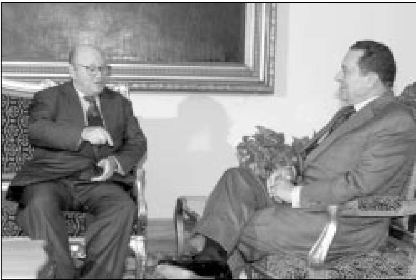
الرئيس المصري لدى اجتماعه مع وزير خارجية إيطاليا أمس في القاهرة (أ ب)

القاهرة-رويترز-اف ب: قالت مصر امس انها تأسف لاغتيال وزير السياحة الاسرائيلي رجبام زئيفي لكنها اتهمت الدولة اليهودية باستخدام الاغتيال كترية لتجنب محادثات السلام. وقال احمد ماهر وزير خارجية مصر في مؤتمر صحافي مشترك مع نظيره الايطالي ريناتو روجيرو في القاهرة «اود ان اعبر عن اسفي لاغتيال وزير السياحة الاسرائيلي». وقال ماهر ان الاغتيال جاء وسط عمليات عنيفة من قبل اسرائيل بما في ذلك مطاردة وقتل متشددين فلسطينيين. و اضاف ماهر «أمل ان يبين هذا لاسرائيل عدم جدوى السياسة التي تبناها واهمية العودة الى التفاوض». وتتهم السلطة الفلسطينية اسرائيل باغتيال أكثر من 67 فلسطينيا منذ ان بدأت انفاضة فلسطينية ضد الاحتلال الاسرائيلي قبل عام. وتتهم اسرائيل الافراد المستهدفين بالتخطيط لشن هجمات ضد اسرائيل او بتفجير هجمات ضدها لكن الفلسطينيين يقولون ان اسرائيل اغتالت ايضا زعماء سياسيين غير متورطين في الهجمات.