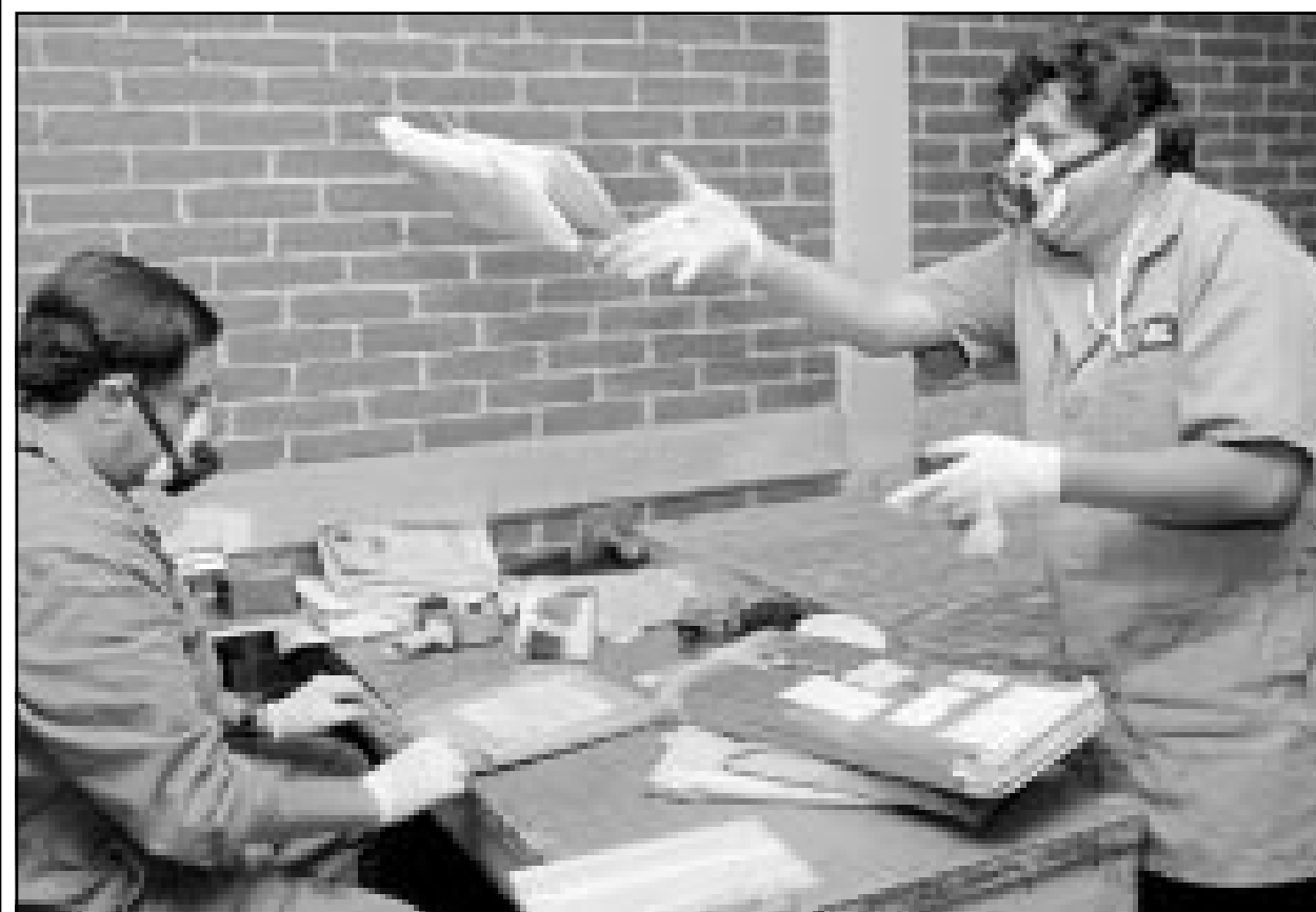
عاملا بوريد يتحصنان باقعة وافية وفزازات اثناء فرزهما الرسائل في احد مراكز مكسيكو أمس (ا ف ب)

وقال ان هناك مكونات للمشروع هما: مكون وطني - إعداد أطر السلامة البيولوجية الوطنية، ومكون اقليمي وشبه الاقليمي - زيادة تبادل المعلومات وتحقيق التعاون.