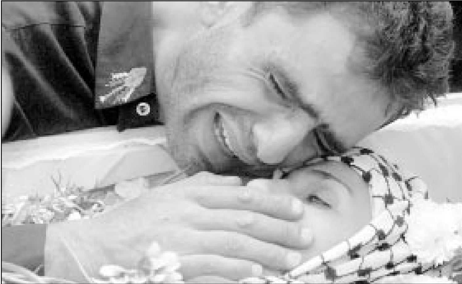
فلسطيني يبكي زوجته التي استشهدت برصاص جنود الاحتلال الاسرائيلي في بيت لحم

واكد مسؤول فلسطيني الجمعة ان الفلسطينيين الذين قتلوا زئيفي لا يقطنون في مناطق تقع تحت سيطرة السلطة الفلسطينية. واعلن هذا المسؤول الذي رفض كشف هويته لغرائس برس «بحسب معلوماتنا فان هؤلاء الاشخاص لا يسكنون في المناطق الفلسطينية ويحملون هويات اسرائيلية». غير ان المسؤول الفلسطيني لم يقدم اي اثبات مادي على ما يقول مكشفا بالاشارة الى ان الشرطة الفلسطينية اعتقلت وتسجوب «عشرات من اعضاء» الجبهة الشعبية لتحرير فلسطين. واتهم مسؤولون فلسطينيون اسرائيل بتدمير المساعي الرامية للعودة الى عملية صنع السلام التوقفة في الشرق الاوسط، وقال الرئيس الفلسطيني ياسر عرفات للصحافيين بعد اجتماعه مع البعثت الروسي اندريه هوفوف في غزة ان القوات الاسرائيلية لديها خطة للتصعيد العسكري وانها تنفذ هذه الخطة في تحد مباشر لكل الجهود الدولية لتهدئة الموقف واحياء عملية السلام. ومن جانبه حذر هوفوف من ان اعمال العنف الاخيرة تمثل «تصعيدا عسكريا كما انه توجد اخطار كثيرة على عملية السلام». سنبدل اقصى جهندا لوقف منطق القوة العسكرية