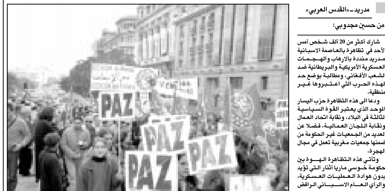
جانب من المظاهرات التي جرت امس بمدريد

استغرب في بيان له «كيف ان اثار يعرض المساهمة العسكرية للبحار لحاربة شعب افغاني، ولم يدفع حتى الآن فلساً واحداً للفقوسية العليا للاجئين لتلبية حاجيات اللاجئين والهاربين من افغانستان أو الباقين فيها». ويرى المراقبون ان تأييد مدريد لوشنطن يرتبط باهداف ترغيب حكومة اثار في تحقيقها في المجال العسكري والامني والدبلوماسي. وقد اعربت عن بعضها علانية، فمدريد ترى في الازادة الدولية لواجبات لخدمة لخدمة لخدمة على منظمة «ايتا». ولذلك تكسف الحكومة الاسبانية وراء اغلب المبادرات الأوروبية لتسويد الماسيسر الاجراءات القضائية والامنية داخل الاتحاد الأوروبي، ووجهة الحركات التي تراهن على العنف في المجال السياسي. ونجح المسؤولون الاسبان من إقناع البيت ابيض بوضع «ايتا» في لائحة