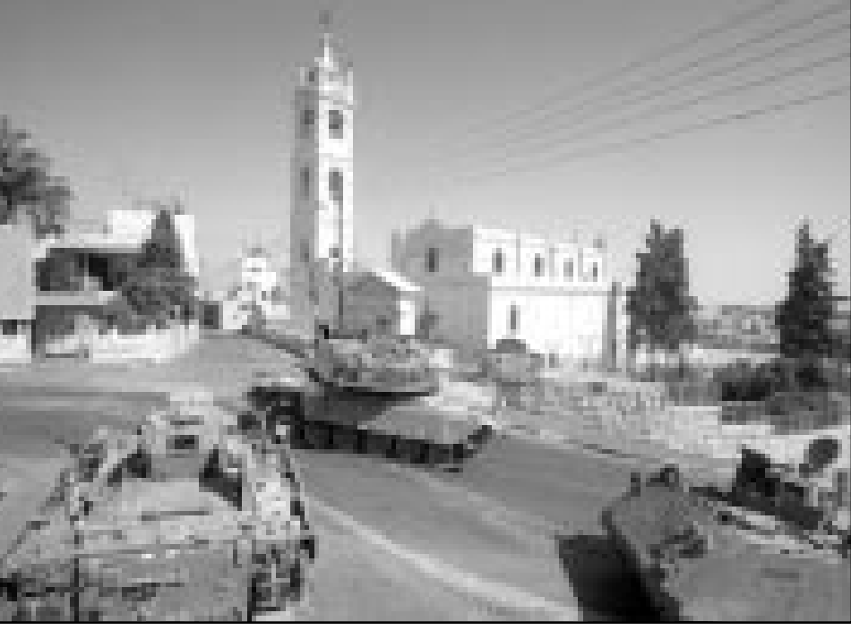
ديابات اسرائيلية على مدخل مدينة بيت لحم في الضفة الغربية بعد الاجتياح الذي يحاول خنق المدن والقرى الفلسطينية والقيام بعمليات سرية لتصفية ناشطين في الانتفاضة

مقتل الوزير ربيعام زينيغ يمارس على السلطة ضغط امريكى واوروبى ومصرى واردني لمعالجة العنف جبديّة، وحتى الان، وباستثناء اعتقالات رمزية، واعلان، بدون رصيد، لاجراج الازرع العسكرية لمنظمات الرفض خارج القانون، لم يتم فعل شيء، وبالنسبة الى ان سيكتور التصعيد العسكري الامريكويون قلقون، انهم يشعرون انهم يفقدون السيطرة على وتيرة الاحداث، والتعبير عن قلقهم الكبير يمكن ايجاده في الطلب الذي وصل في نهاية الاسبوع من واشنطن الى طاوله رئيس الحكومة: «انتم اوقفوا الخطوة العسكرية في الضفة الغربية، وبالمقابل سئلين الخطة احادية الجانب للتسوية السياسية التي اردنا الاعلان عنها في تشرين الثاني (أكتوبر)». ■ معنى ذلك: ان الولايات المتحدة تعد بعدم مفاجة اسرائيل بخطة سياسية غير مريحة اذا حافظت على ضبط نفس نسبي ومعتاد في الشرق الأوسط، والاستنتاج في اسرائيل من هذا التوجه الامريكى: من الممكن الضغط على الولايات المتحدة لدفع ثمن اكبر مقابل ضبط النفس الاممول، وفي هذه الاثناء تبقى مساحة معينة من الوقت لعمارة الضغط على عرفات، وهذا ما سبحدث في الايام القليلة القادمة: النشاطات العسكرية ضد السلطة الفلسطينية ستتواصل وربما تتوسع، وبالمقابل تواصل اسرائيل حملة الدعاية في العالم ضد عرفات، ثمة قلق لشعب يسود، وايضا الفلسطينيين المثقدين بان اسرائيل تسعى الى القضاء على عرفات وعلى السلطة، واذا لم يكن ذلك كافياً فانه منذ