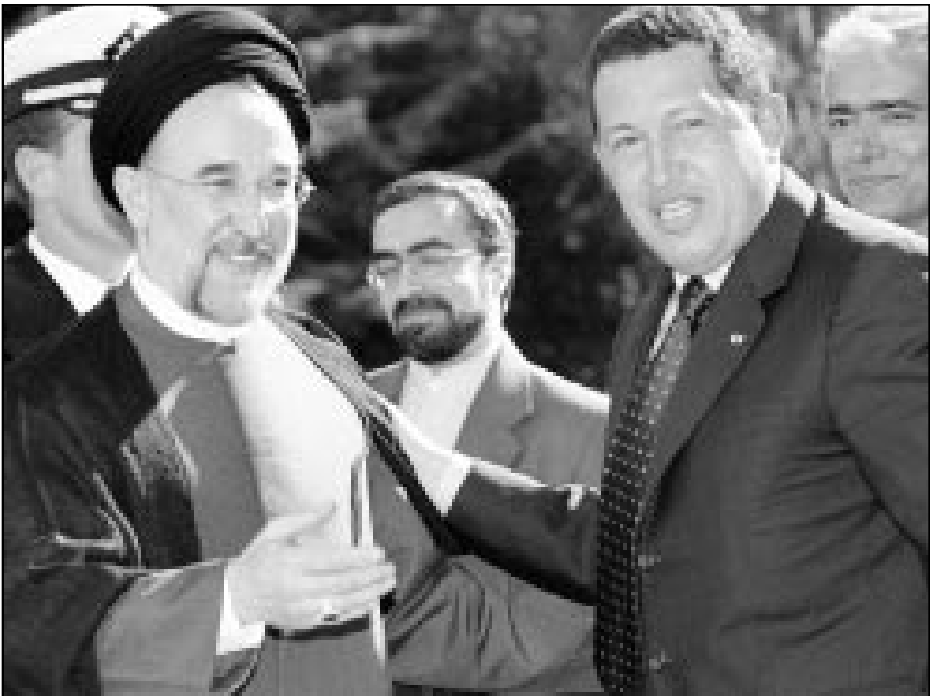
الرئيس الإيراني خاتمي يستقبل نظيره الفنزويلي شافيز (يمين) أمس في طهران

في التاسع والعشرين من الشهر الحالي. وقال المصدر الخليجي «انه مازق لانه حتى اذا خفضت اوبك الانتاج فان انتاج الدول غير الاعضاء في اوبك يتأهب للارتفاع».. وتابع «ليس في وسعنا العمل في ظل اتجاهات متباينة على صعيد الانتاج». وذكرت نشرة ميدل ايست ايكونوميك سيرفي (ميس) في عددها الذي يصدر اليوم الاثنين ان اوبك تسعى على الاقل لتجميد انتاج الدول غير الاعضاء في محاولة لدفع المنتجين المستقلين الرئيسيين للمنشأة في تحمل عبء التثبيت اسعار النفط في السوق. وقالت النشرة النفطية المتخصصة «من اجل الحفاظ على الاستقرار تزيد اوبك من المنتجين غير الاعضاء على مستويات الانتاج الحالية وليس زيادته حتى يمكن ان يقف المنتجون امام العاصفة سويا». وتابعت «تجميد الانتاج يمثل الحد الأدنى الذي تنتظره اوبك من الدول