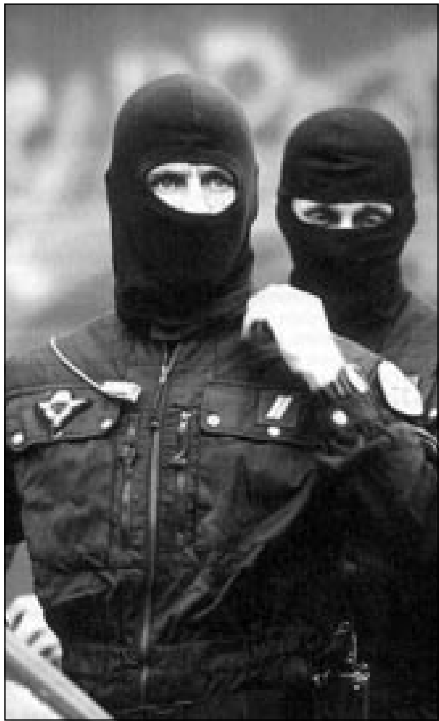
ضابطان من مجموعة «جي. إي. جي. إن» الفرنسية