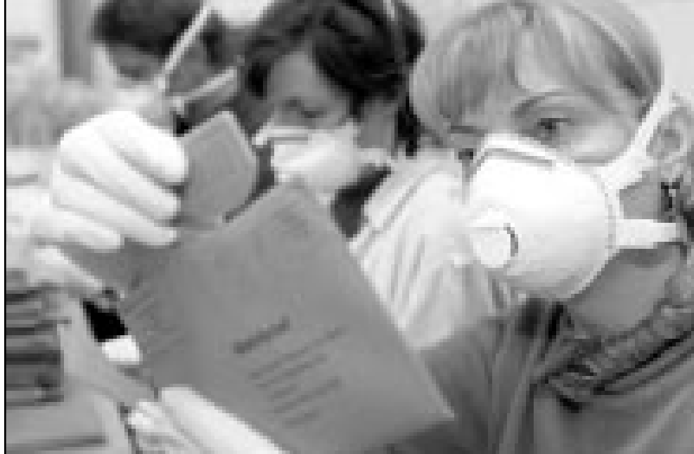
عاملون في لجنة انتخابية يترؤن اقنعة واقية وقفازات خضية الاصافية بيكتيريا الجمره الخبيثة اثناء فرزهم بطاقات المشاركين في الانتخابات المحلية التي جرت في برلين اس (ا ف ب)

طالبان وتنظيم القاعدة ستشنان حرب عصابات، الامر الذي يتطلب مشاركة وحدات خاصة. واستطرد قائلا بان المعركة ستكون بشكل اشتباكاتا بين رجل ورجل وستودي بحياة الكثيرين من مقاتلي طالبان الذين يبلغ عددهم حوالي 50 الف مقاتل، الامر الذي سيؤدي الى تثبيت مهمهم وانسحابهم الى الجبال في فصل الشتاء. واذاف المسؤول بجهود المانيا الدبلوماسية في اطار الحملة الدولية، لمكافحة الراهبا والتي كانت آخرها زيارة وزير الخارجية يوشكا فيشر للعاصمة الباكستانية اسلام اباد واعرابه من خلالها عن تقديره للموقف الباكستاني واعلانه عن وقف بلاده بجانب باكستان. وكان وزير الخارجية الاني يوشكا فيشر قام مؤخرا بزيارة باكستان خلال جولة وسط-اسيوية تباحت خلالها مع المسؤولين الباكستانيين حول احتمال تشغيل حكومة واسعة في افغانستان تشمل مختلف الفصائل والاقليات العرقية الافغانية. وعلى نفس الصعيد نفت وزارة