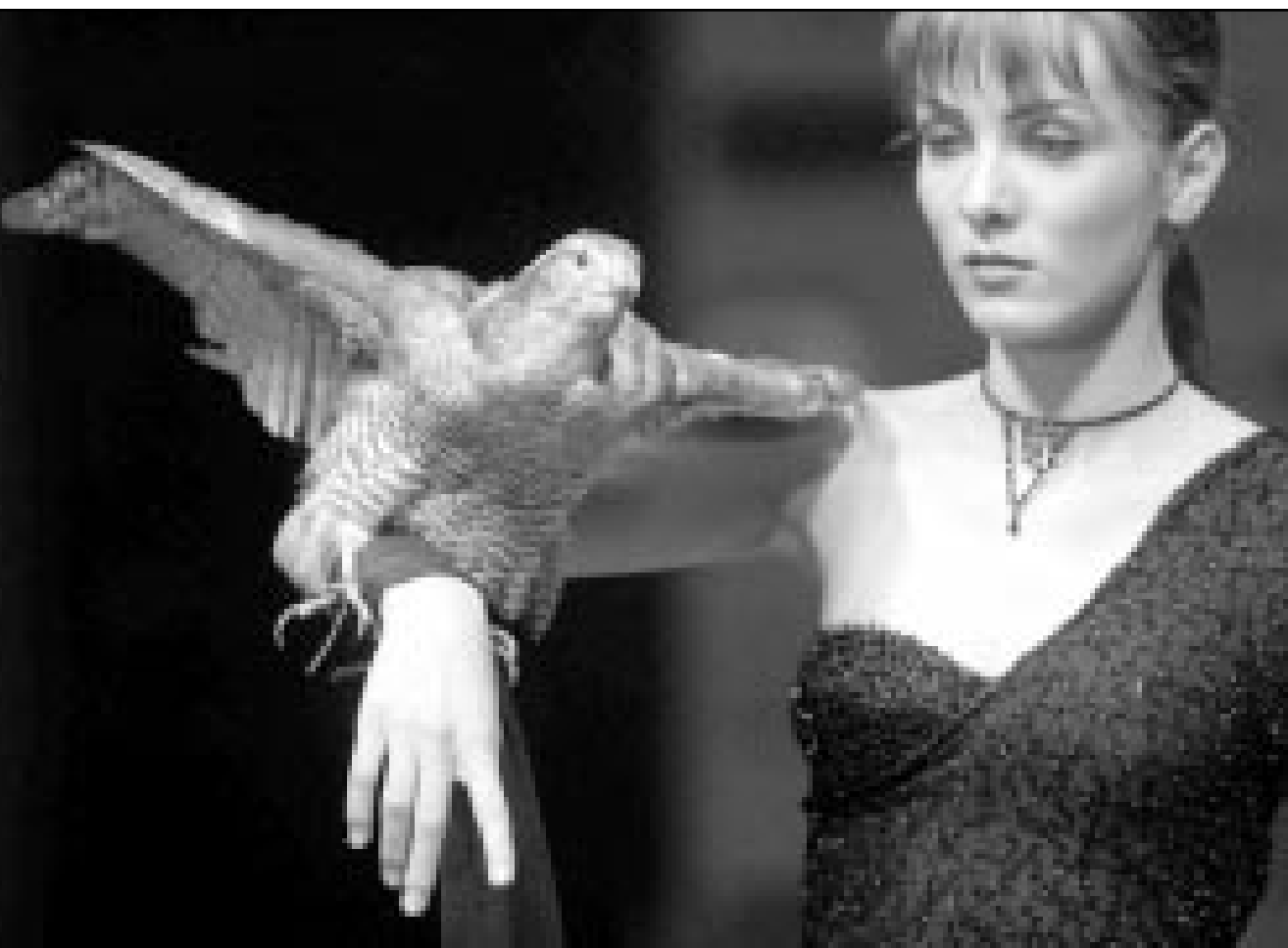
صفر محنت مفيد معصم عارضة الأزياء الرومانية لغت الانتظار خلال العرض الخاص بتصميمات كاتالين بوتزواتو المسمى «الساحرات» خلال اسبوع الأزياء بمدينة «إيسبي» (أ ف ب)

القاهرة- أ ف ب: أثار فوز الفيلم البلجيكي «بولين وبوليت» للبلجيين ديبريو بجائزة الهرم الذهبي المصري «مذكرات مراهقة» لانياس الديوغدي بجائزة أفضل فيلم عربي تساوت انتقاد حول صحة اختيار لجنة التحكيم الدولية للمسابقة الرسمية لمهرجان القاهرة السينمائي التي أعلنت في حفل الختام. وتدور أحداث فيلم «بولين وبوليت» حول شقيقتين عورزين أحدهما متخلفة عقليا والأخرى سيدة أعمال ناجحة وحيوية تقيم العديد من العلاقات الاجتماعية وتشارك في الفعاليات الثقافية والإنسانية بشكل بارز، وتسبب شقيقتها المريضة الكثير من المشاكل المتعلقة بالحياة اليومية مما يدفعها أثر تقاعدها إلى وضعها في دار للعجزة مخصصة للمتخلفين عقليا. ويؤدي شعور الشقيقة بالوحدة إلى إعادة شقيقتها للعيش معها لينتهي الفيلم وهما جالستان أمام البحر، في إشارة إلى الانفتاح الحيا على علاقاتهما. والتبرير لتساؤلات عدة حول مضمون الفيلم البلجيكي وإبرازها ما طرحه الناقد السينمائي محمد صلاح الدين من حيث اعتبارها موضوع الفيلم المركز على العلاقة بين سوي ومتخلف عقليا قد تطرقت إليه السينما بشكل أفضل بكثير مما شاهدنا على شاشة العرض.. وضمن السياق ذاته، قالت الناقدة ماجدة موريس «اعتقد أن الجائزة كبيرة جدا بالنسبة للفيلم حيث شاهدت أفلاما أهم منه كثيرا خصوصا الفيلم الروسي «ذا جنتيل ايج» (الزمن الجميل) للمخرج