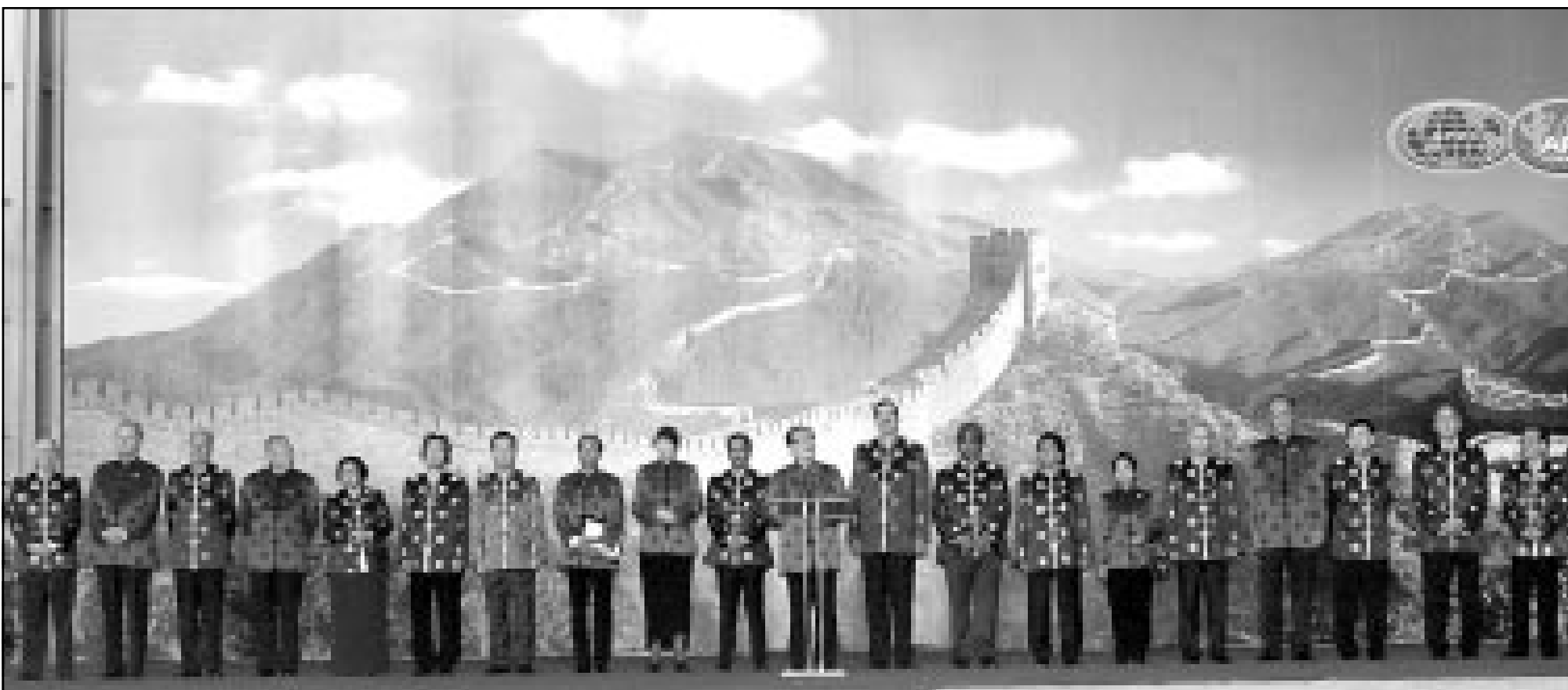
الرئيس الصيني جيانغ زيمين يتوسط زعماء دول ابيك لقراءة البيان الختامي للغة