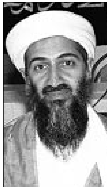
اسامة بن لادن

الاقتصادي الألماني فريدريش شنايدر في الحلقة الدراسية نفسها ان الشبكة التي يتزعمها بن لادن تصل جملة ايرصديتها الى نحو خمسة مليارات دولار، وأن ميزانيتها السنوية تبلغ 50 مليوناً. وأضاف انها تكسب ما يتراوح بين 30% و 40% من مداخيلها من تهريب المخدرات، وادعى بوجه خاص انها تشارك في تجارة المخدرات، وخلال تامين نقل شحنات الحشيش والافيون. وعلى صعيد آخر، قال الخبير الامني الألماني رولف توبهوفن، في مداخلة أمام مؤتمر عقد في العاصمة السلوفاكية براتسلافا تحت عنوان «الديمقراطية: تهديدا وترسيخها - الحرب ضد الجريمة المنظمة وتهريب المخدرات والإرهاب»، ان قتل اسامة بن لادن سيساعد فحسب الخلايا الفردية لتنظيمه لتختبر قدرتها على حشد طاقاتها. وقال ان بن لادن شخصية تتمتع بشعبية كبيرة في عدد كبير من البلدان الاسلامية، وإذا تم قتله فسيصبح أكثر شعبية. ودعا الخبير الامني الألماني الولايات المتحدة الى ضرورة وقف غاراتها على افغانستان خلال شهر رمضان، وقال ان استمرارها سيصيب المسلمين في كل أرجاء العالم بصدمة وسيجلب لن لادن وصف الولايات المتحدة بأنها عدو حقيقي للإسلام. وفيما حذر توبهوفن من عواقب اي رد هستيري على التهديد المحتمل بنش إرهاب بيولوجي، قال إنه لا يمكن بيد اي جهة الرد على هجوم يتم من خلاله إطلاق غاز الأعصاب عبر شبكات الأنابيب في المدن والبلديات المختلفة.