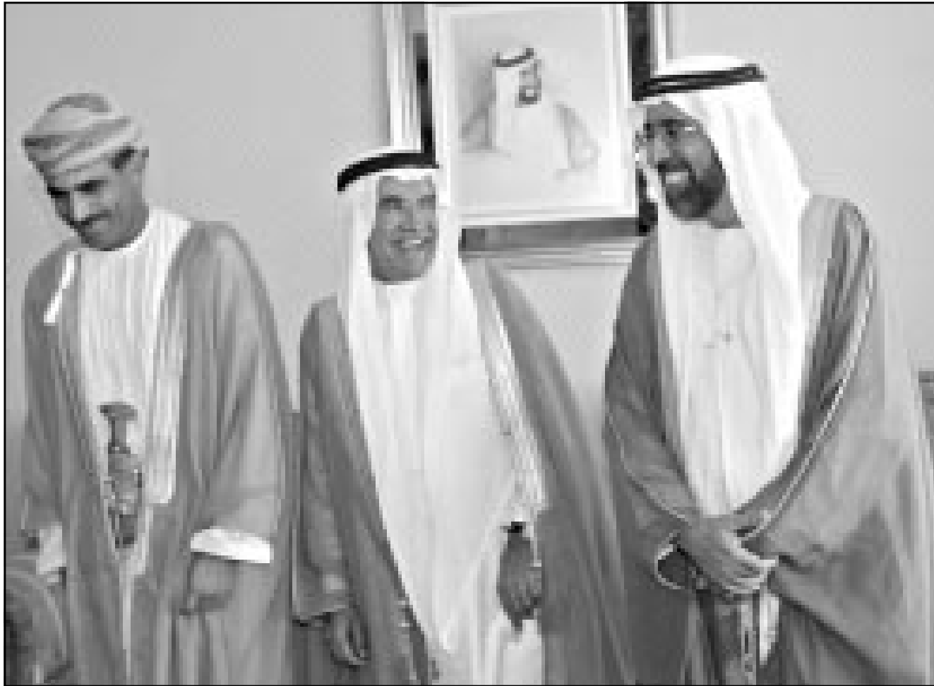
وزراء نفط (من اليمين) الامارات والسعودية وعمان بعد انتهاء اجتماعهم في ابوظبي السبت