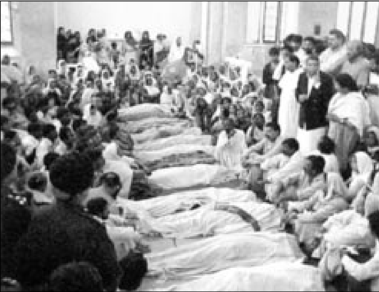
جثث القتلى من ضحايا المجزرة وحولها اقاربهم (رويتز)

هاجم مسلحون الاحد حشدا من المصلين في كنيسة القديس دومينيك الكاثوليكية في بهاو البور (شرق باكستان) ما أدى الى مقتل 16 شخصا على الأقل. وافاد مراسلون ان نحو 2000 شخص تجمعوا بعد ظهر الاحد امام الكنيسة حيث كان العديد من النساء والاطفال يركبون وينجسون فيما كانت جثث الضحايا ممددة داخل الكنيسة بعد ان رفضت السلطات الدينية المحلية واسر الضحايا ان تخضع للتشريح. وبين الضحايا اربعة افراد من عائلة واحدة. وأشار مراسل وكالة فرانس برس من جهة أخرى الى ان الصحافيين منعوا من دخول مستشفى نقل اليه خمسة جرحى بينهم اربعة اطفال بحسب شهود عيان. وافادت الشرطة الباكستانية ان مسلحين ملتحين لم تعرف هويتهم، هاجموا صباح الاحد مجموعة المصلين داخل كنيسة كاثوليكية في بهاو البور، موضعا ان المهاجمين الذين كانوا على متن دراجات نارية، فتحوا النار فورا على المصلين بالسلحة الكلاشنيك داخل الكنيسة قبل ان يلوثوا بالفراغ. ولم تكن اي جهة مسؤولة عن هذا الحادث الذي اوقع ايضا عددا من الجرحى. ودان الرئيس الباكستاني برويز مشرف «الاعتداء