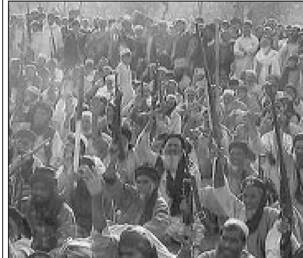
مسلحون باكستانيون يستعدون لعبور الحدود لافغانستان

واشنطن - اف ب: تظاهر مئات الأشخاص السبت في واشنطن احتجاجا على الحملة العسكرية الامريكية ضد افغانستان. وقال منظم التظاهرة براين بيكر «نحن هنا لظهار معارضة متنامية للحرب ضد افغانستان. انها حرب تستخدم الرعب ضد المدنيين الابرياء». وطالب المظاهرون بوقف هذه الحملة التي بدأت في السابع من تشرين الاول (اكتوبر) ردا على الاعتداءات الارهابية ضد الولايات المتحدة التي تعتبر الاسلامي اسامة بن لادن مسؤولا عنها. وحمل المظاهرون الذي ساروا امام مكاتب صحيفة «واشنطن بوست» بافادت كتيب عليها «الحرب ليست الرد». اوقفوا قصف افغانستان. الحرب لا تجلب ما نرغب فيه». وهنقا «جورج بوش، اننا نريد السلام. الامريكيون خارج» آسيا الوسطى.