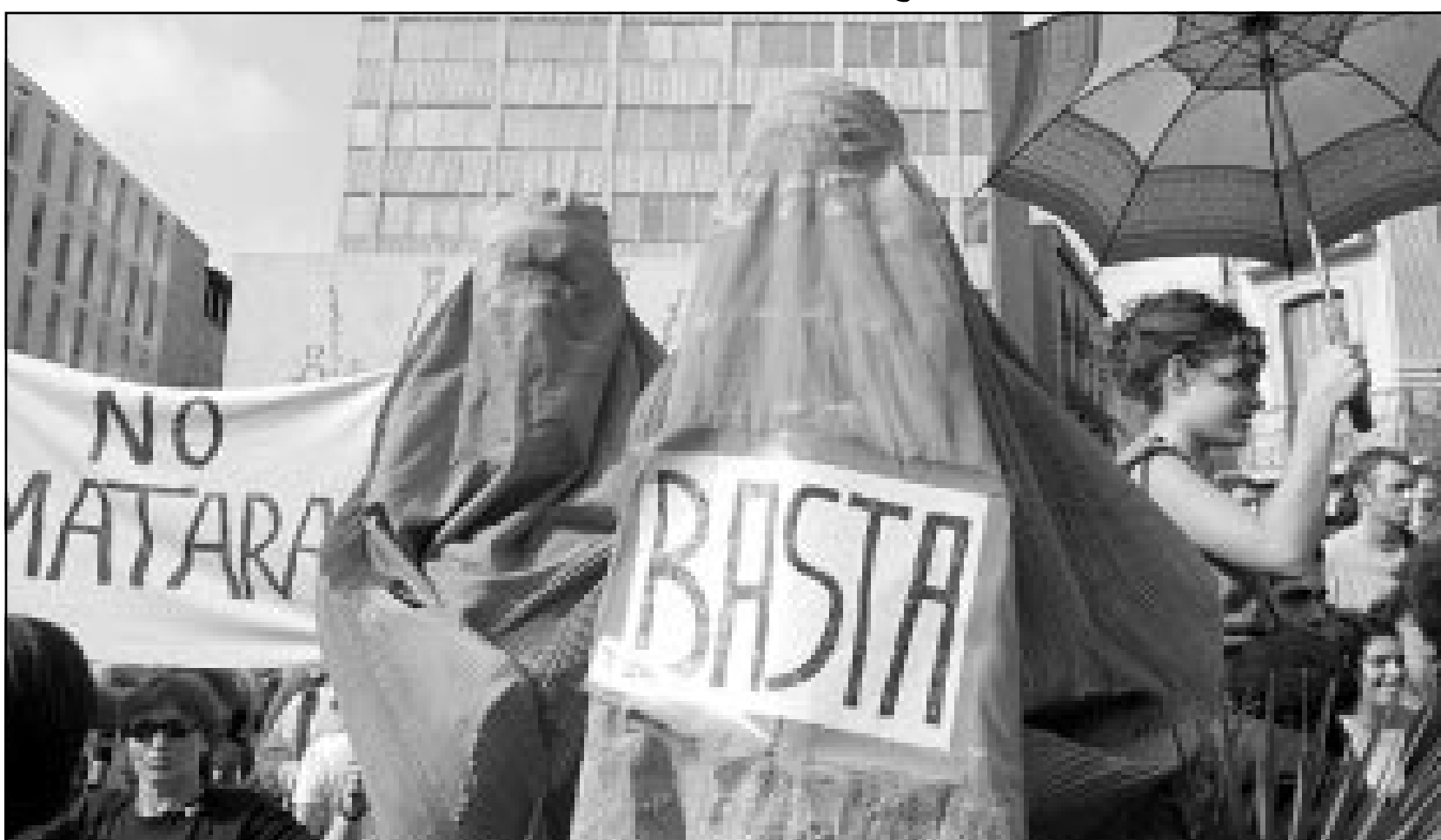
متظاهرون يرتديان النقاب الافغاني اثناء مسيرة في مدينة برشلونة للاحتجاج على الغارات الامريكية