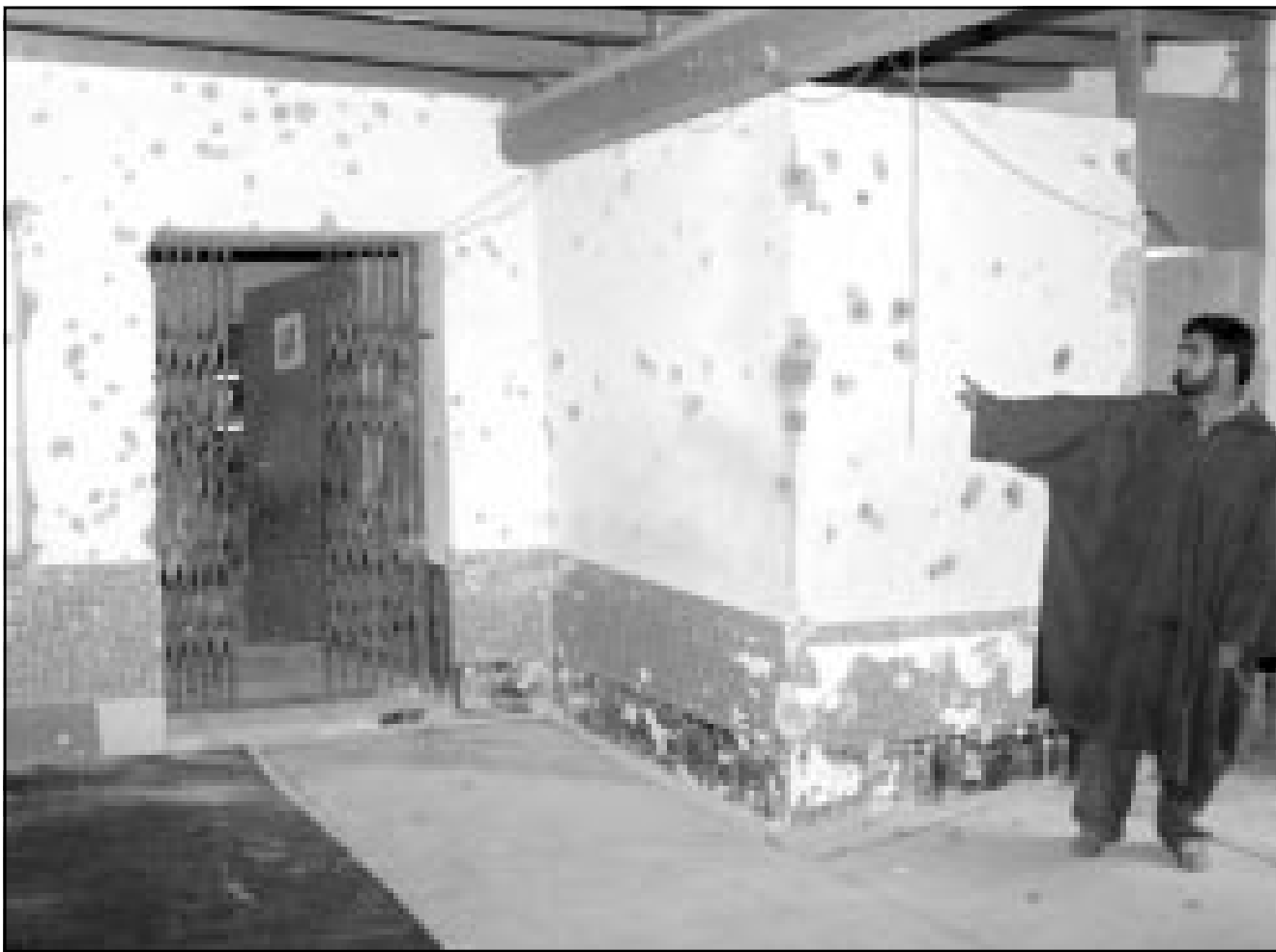
مواطن كشميري يشير الى آثار الرصاص الذي اطلقته القوات الهندية داخل مسجد بانزان في كشمير

■ اسلام اباد - بانزان - رويترز - اف ب: اكدت باكستان أمس الاثنين ان «ارهاب الدولة» من قبل الهند يشهد ارتفاعا في كشمير منذ الهجمات التي نفذت في 11 ايلول (سبتمبر) في الولايات المتحدة ونددت بالاعتداء الاخير على مسجد. وقالت وزارة الخارجية في بيان ان القوات الهندية قتلت 22 شميريا واحرقت 26 منزلا. واكد البيان انه «ارهاب دولة والدليل الواضح هو ان القوات الهندية تشن حملة متعمدة من الارهاب والقتل في كشمير المحتة خصوصا منذ اعتداءات 11 ايلول». وانتهت قوات الامن الهندية حصارا استمر ثلاثة ايام لمسجد أمس الاثنين في منطقة كشمير المضطربة بعد ان قتلت متشددا اسلاميا كان يتحصن به، وهذه هي المرة الخامسة في ستة اشهر التي يلجأ فيها مسلمون الى