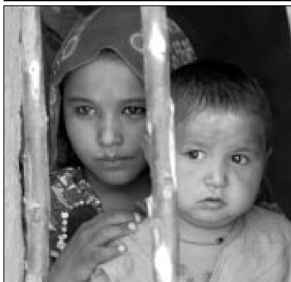
طلتان افغانيتان في معسكر لاجئين على الحدود الافغانية التاجيكية

واشنطن - رويترز: صرح مسؤول دفاعي امريكى كبير امس الاثنين بان الجيش الامريكى يبحث اقامة قاعدة داخل افغانستان لدعم قوات التحالف الشمالي المعارض التي تقا تلطلاحة بحركة طالبان الحاكمة. وقال المسؤول ردا على سؤال طرحة رويترز «انشاء قاعدة من الاشياء التي نبحثها بالتاكيد». واضاف «نبحث مع التحالف الشمالي بشأن امور كثيرة .. السبل التي يمكننا مساعدتهم من خلالها».