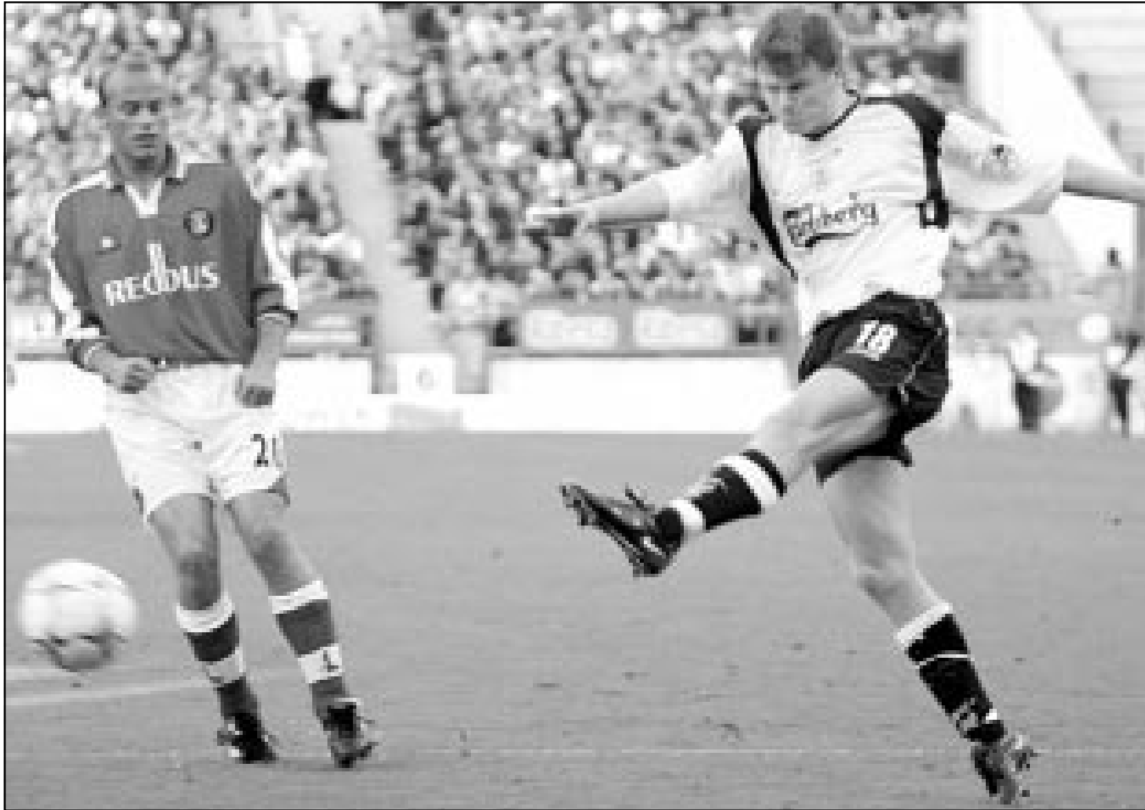
لقطة من احدى مباريات فريق ليفربول (صورة من الارشيف)

كان اودينيزي هو البادئ بالتسجيل من ضربة جزاء سدها روبرتو موتزي في الشوط الاول ولكن كريستيان اموروزو اترك التعادل لفيورنتينا في الدقيقة 74. ووضع هوذ المقابل هرتا برلين في المركز الثاني عشر برصيد تسع نقاط بينما مازال اودينيزي في المركز التاسع