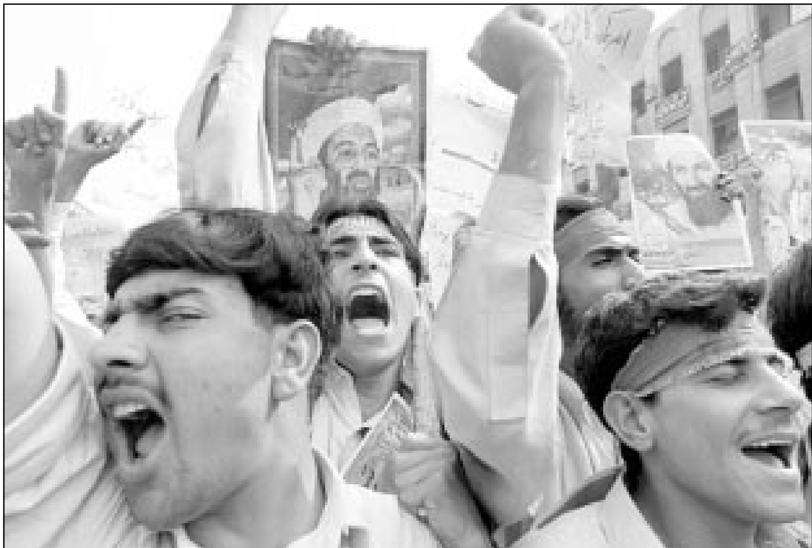
متظاهرون باكستانيون يهتفون بشعارات معادية لأمريكا أثناء مسيرة في مدينة بيشاور