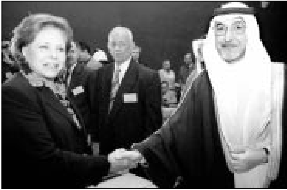
وزير التجارة السعودي أسامة الفقيه يصافح الأمين العام لمنظمة الاسكوا ميرفت التلاوي خلال اجتماع وزراء التجارة العرب في بيروت أمس