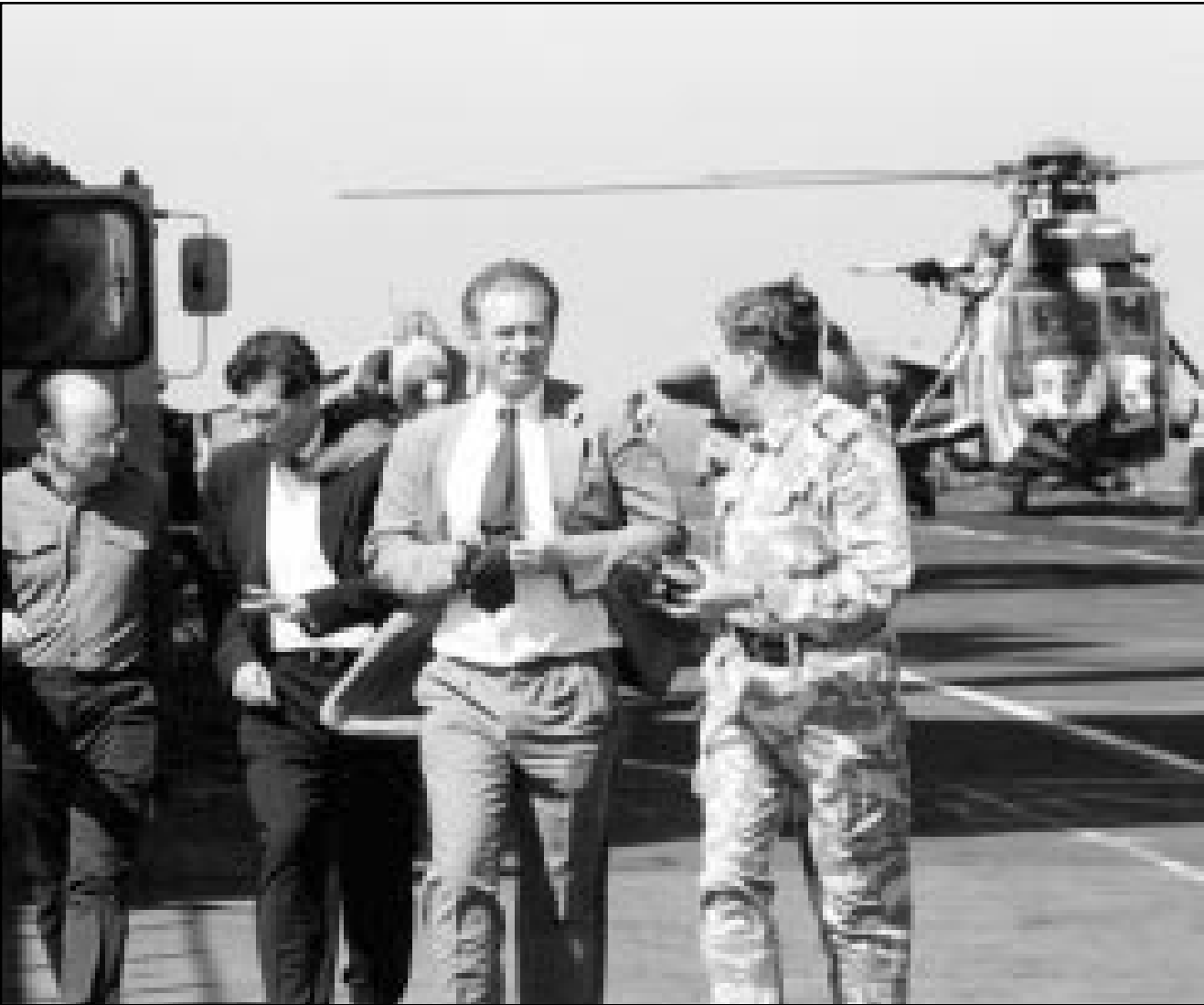
وزير الدفاع البريطاني جيفري هون على ظهر حاملة الطائرات البريطانية المستورس التي تشارك في الحملة ضد افغانستان

قال وزير الدفاع البريطاني جيف هون امس انه ليس هناك دليل حتى الان على ان للعراق صلة بانتشار الجمره الخبيثة في الولايات المتحدة. واصر هون على انه ليست هناك خطة خفية وراء الهجمات على افغانستان وقال هذه ليست مقدمة لحرب اوسع. وقال الوزير البريطاني في مؤتمر صحافي خصص للصحافيين العرب في لندن انه لا توجد انقسامات في التحالف الذي تقوده الولايات المتحدة بشأن اهداف الحرب. و اضاف هون قبل توجهه الى واشنطن لاجراء محادثات مع مسؤولين في ادارة الرئيس الامريكى جورج بوش الحوار المتأزم مستمرا. وحذر هون ايضا مسلمي بريطانيا من عواقب قاسية اذا ذهبوا للقتال الى جانب حركة طالبان الحاكمة في افغانستان. وفيما يتعلق بالعراق سعى الوزير البريطاني الى التقليل من شأن تكهنات بان للعراق صلة بالهجمات على الولايات المتحدة. ومضى قائلا «ليس هناك دليل يربط العراق بأحداث 11 ايلول (سبتمبر). ليس هناك دليل حتى الان يربط بين العراق وهجمات الجمره الخبيثة في الولايات المتحدة. اعتقد ان من المهم ان نؤكد على هذه الامور. ويشبه ما قاله الوزير البريطاني تصريحات ادلى بها في واشنطن الاسبوع الماضي بوب غراهام عضو مجلس الشيوخ الامريكى عن ولاية فلوريدا