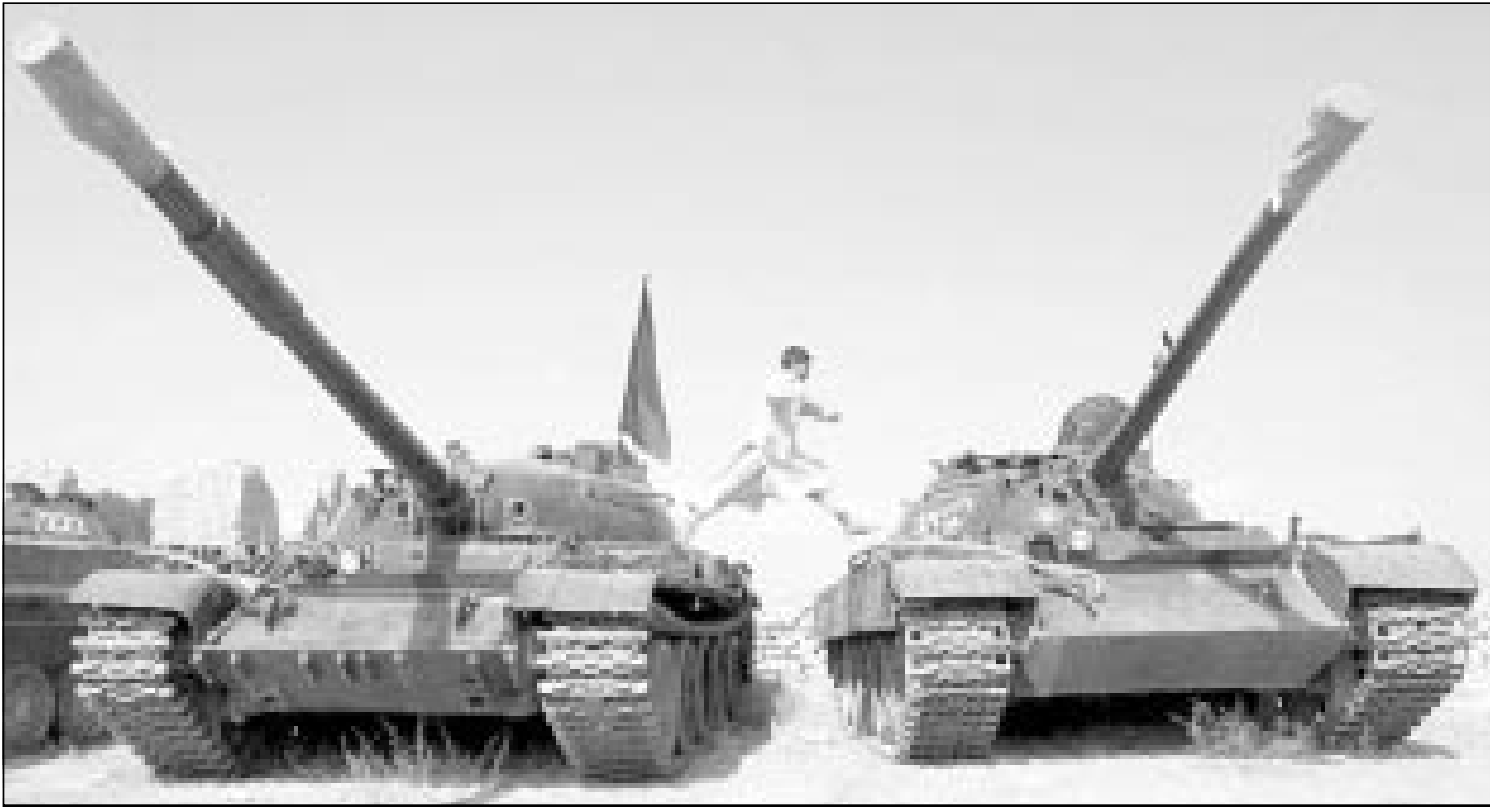
صبي افغاني يقف من دبابة الى اخرى في موقع لقوات التحالف الشمالي المعارض لطالبان