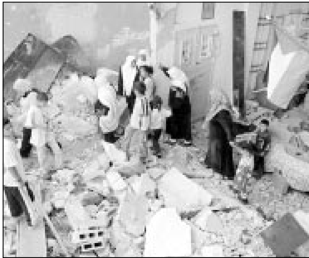
عائلة فلسطينية تتفقد منزلها في بيت لحم بعد الدمار الذي أحدثه القصف الاسرائيلي