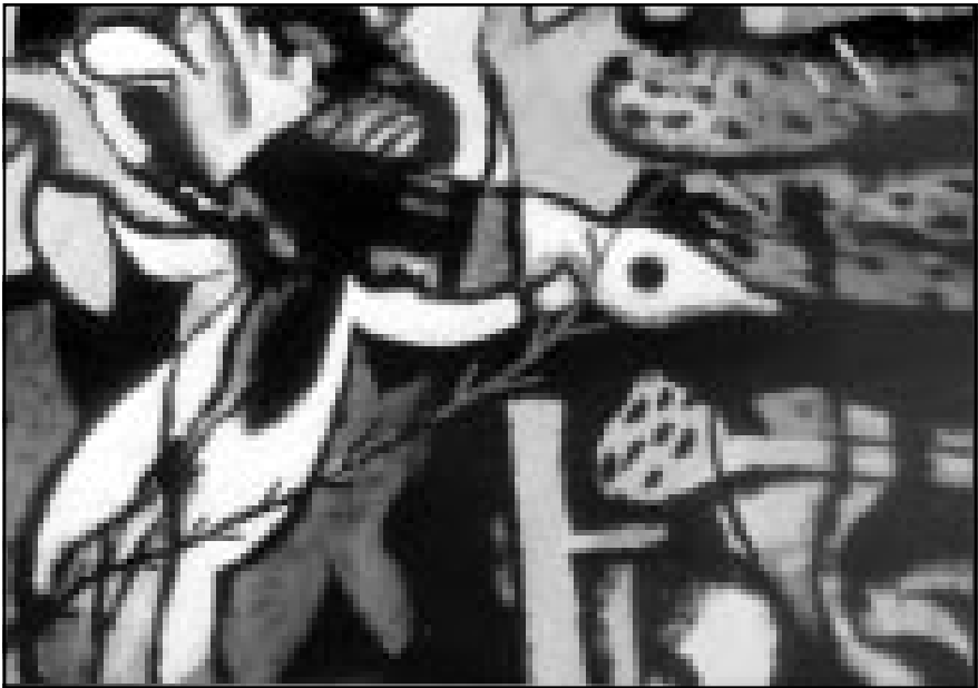
من أعمال ضياء العزاوي

■ بدأ اهتمامي بالخطوط قبل كل شيء، والكتاب ونسخة واحدة، وأول عمل أنتجته هو «الوشود» المطر، والكتاب مع الألف لم أحفظه له. أتعاقل مع النص بهذه الروحية التي أوفر فيها مناخات بصرية ولونية بحيث يغتنى بتناول الصفحات وقراءتها، وهذا العمل يحتاج إلى قاري له معرفة بنوع ما باللغة، ويشكل ما بالرسم، أصبح ضروريا لشغل من الثقافة التي تتعامل مع هذا الكتاب، لأنه لو توفرت ظروف في إنتاج كتاب من هذا النوع وليس نسخة فريدة، كان من الممكن أن نفتح بابا لجمع آخر، منقادا كلياً ما هو قائم، وقسم من الشعراء يجدون هذا النوع من العمل يؤثر على النص، ويربكه بشكل ما. اعتقد بأن الرسم يستولي عليه في الفترات الأولى،