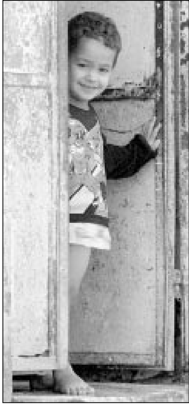
مطل فلسطيني يراقب انسحاب الدبابات الاسرائيلية من قرب بيته في بيت لحم