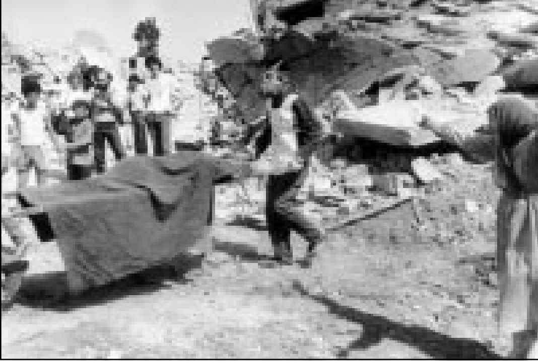
صورة تعود الى 19 ايلول (سبتمبر) 1982 تصور امرأة فلسطينية تصرخ بعد قيام الميليشيات اللبنانية تعاونها إسرائيل بمذبحة رهبية في مخيمي صبرا وشتاتيا. وطلبت محكمة بلجيكية من رئيس الوزراء الإسرائيلي ارييل شارون النتهم بمشاركته بالمذبحة المثل امامها في 28 تشرين الثاني (نوفمبر) الحالي.

الغضب، وقد برز في ذلك اليهود يعاري في شخصية رئيس حكومتنا، ارييل شارون، في حلقات المسلسل الساخر المناهض لاسرائيل في تلفزيون ابو ظبي هو ليس سوى ابلي يتسبان. هنا يمكننا ان نفهم شدة الغضب المصري على الطابع الساخر الذي عرض فيه يتسبان الرئيس المصري حسني مبارك. حينها كان الحديث يدور عن عرض الرئيس المحترم للدولة العربية الاكبر والاولى التي اقامت علاقات سلام مع اسرائيل عديدة الفهم يميل بعض الشيء الى السلوك «القروي». من المهم ان نذكر ايضا ان مكانة مبارك في العالم العربي مصر غير الديمقراطية وهو غير معتاد على توجيه الهزل او السخرية ضد. لقد كان الرد الإسرائيلي على الغضب المصري ضد برنامج يتسبان مصحوبا بالعجب. ذلك لان الحديث يدور عن فتاكة وعمل ساخر يجب على كل مجتمع ديمقراطي ان يحتمله حتى لو كان يمس به. ان القانون يضمن حرية التعبير واضح تماما. لا يوجد لدولة اسرائيل الديمقراطية تقريبا أي اداة لتقييد حرية التعبير، التي تشمل ايضا حرية الالاء بعبارة مهينة ومغضية، استثنائية ومثيرة. لذلك تعجب لرد الاعلام الإسرائيلي الذي نهض كرجل واحد فور بث البرنامج الساخر في تلفزيون ابو ظبي وبدأت باعادة عرض المقاطع الصعبة جدا من بين هذا البرنامج. حين استهلكت هذه المقاطع تم بث مقاطع أخرى حتى وان لم تكن متطرفة مثل سابقاتها، في اطار نفس