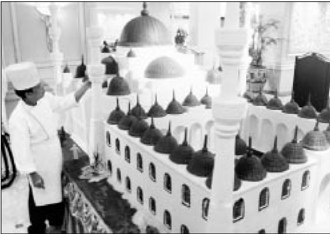
رئيس الطهاة في فندق بالعاصمة الاندونيسية جاكارتا يضع امس اللسمات الأخيرة على مجسم للمسجد الأزرق في اسطنبول مصنوع من الشوكولات. وتحوال الفنادق والمنشآت السياحية في اندونيسيا اجتذاب زبائن محليين لحفلات افطار وفعاليات احتفالية تتعلق بشهر رمضان المبارك للترويج عن تراجع عدد السياح الاجانب.

وفي تصريحات نشرتها صحيفة (الرياض) قال رئيس مجلس ادارة الجمعية الخيرية لمكافحة التدخين عبد الله البداخ ان السعودية التي رفعت تدريجيا الرسوم الجمركية على التبغ من 30 % الى