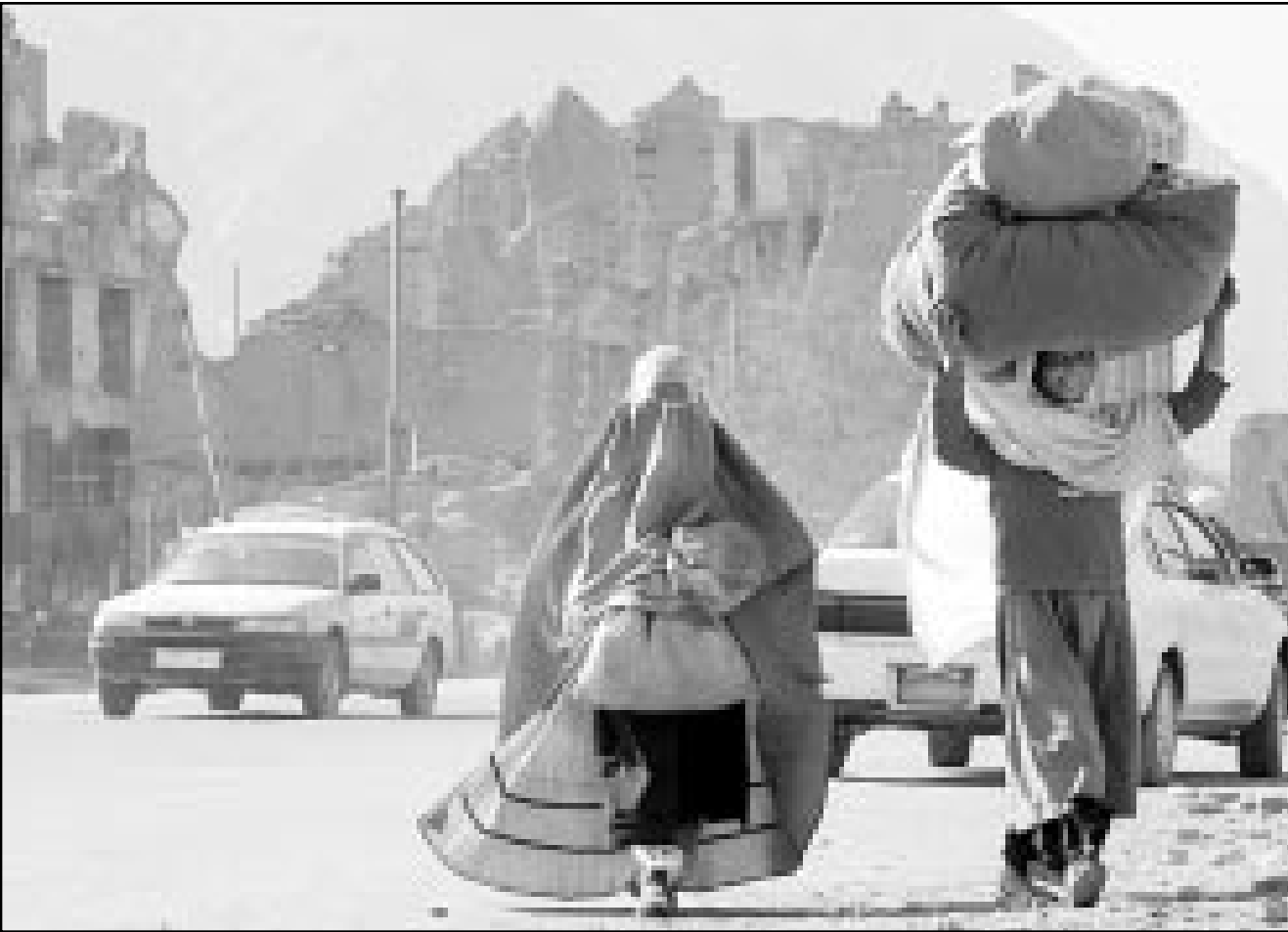
أفغانيتان تسيران امام المباني المدمرة في كابول