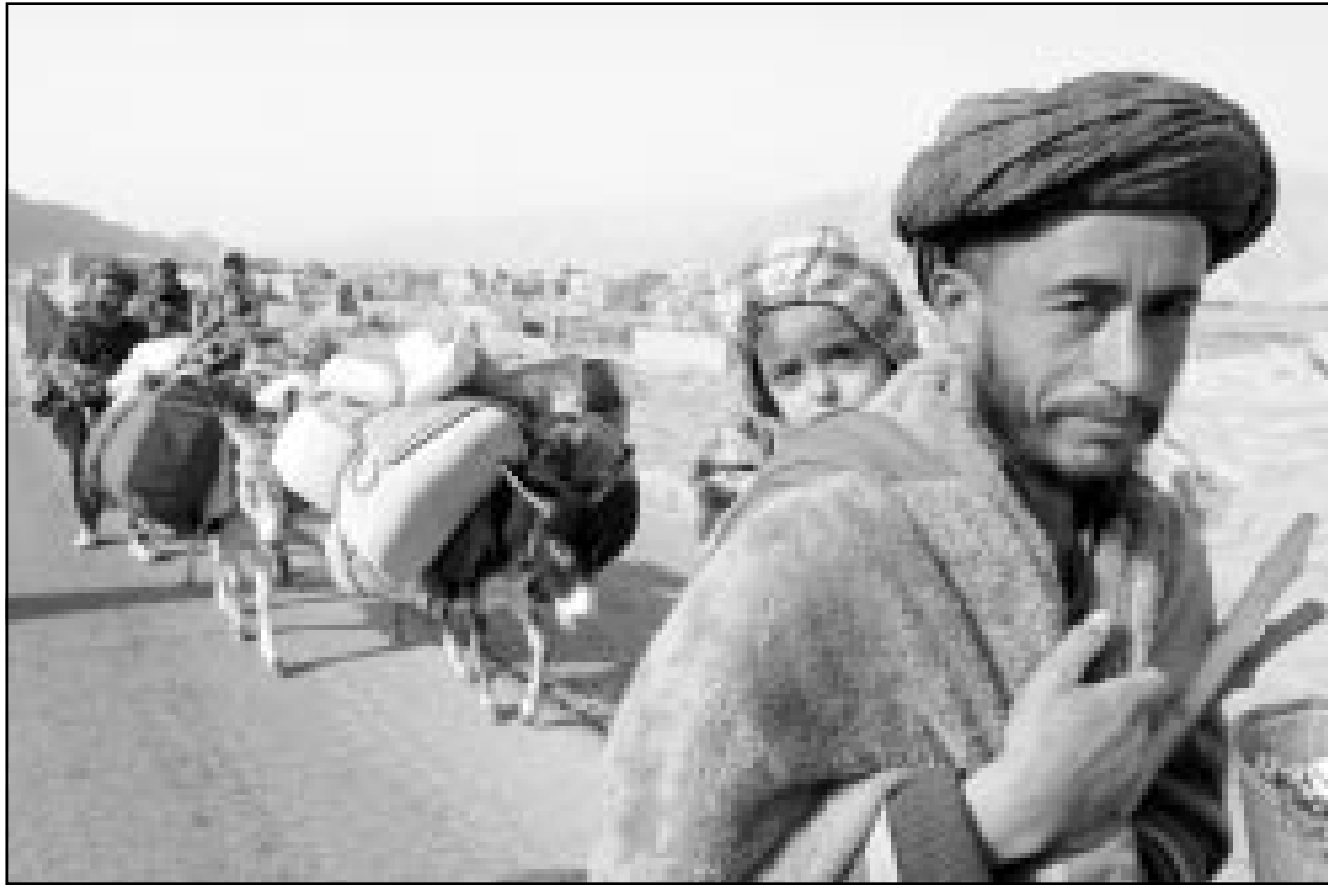
افغان يهجرون قنزل التي تشهد قتالا بين طالبان وقوات تحالف الشمال

مؤخرا مستشارين عسكريين مساعدة الفلبين (340 مليون دولار) في مقابل زيادة لتشييع حماية البيئة في هذا البلد، وستسمح 38 مليون دولار في العام 2002 لدعم جهود مانيتا للسلام في جزيرة مينداناو مع جبهة مورو للتحريروطنى.