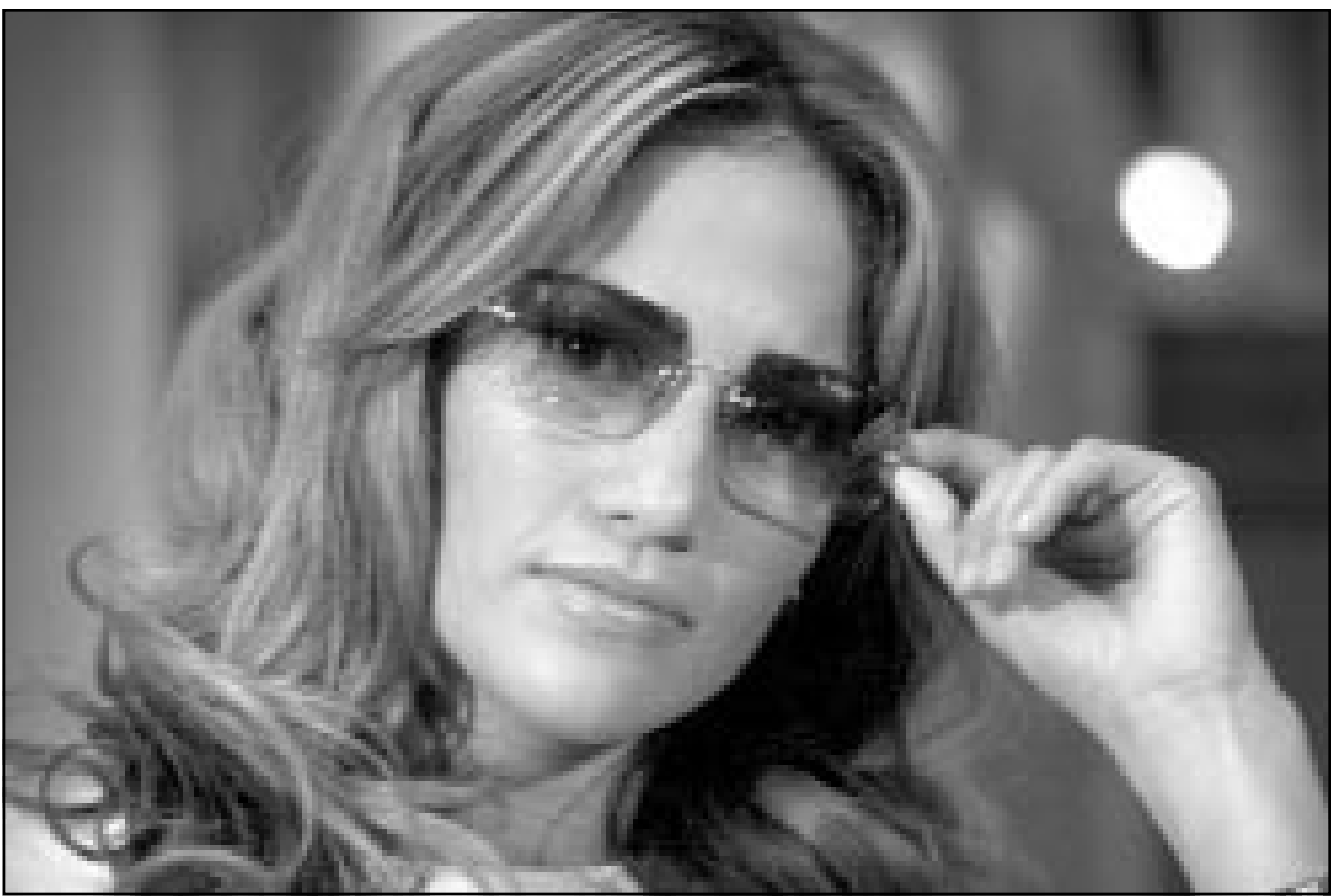
المطلة والغنية الأمريكية جنيفر لوبز عقدت مؤتمراً صحافياً أمس في ستوكهولم عاصمة السويد لتعلن عن قيامها بطولة فيلمين جديدين في العام المقبل. كما ستقوم بحولبة العالم لتقديم حفلات من أغنيات البومبا الجديد.