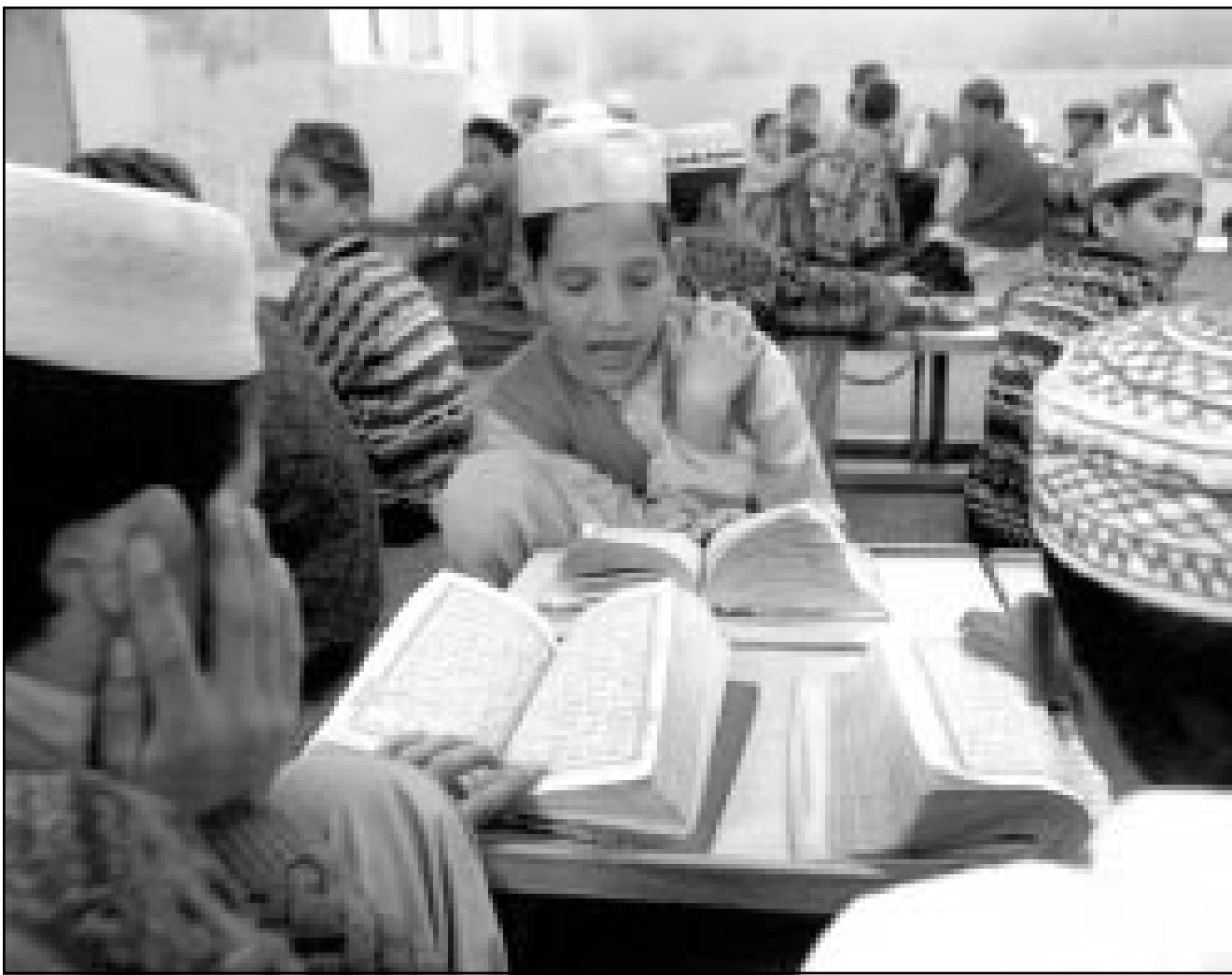
تلاميذ باكتانين يدرسون القرآن في مدرسة ياسلام اباد

■ بيشاور (باكستان) - اف ب: افادت شهادات ان الصحفيين الاربعة الذين قتلوا الاثنين على الطريق بين جلال اباد وكابل قتلوا بوحشية وان هذه الجرائم لم ينفذها سارقون. وقال موظف في اللجنة الدولية للصليب الاحمر التي اعادت جثث الصحفيين من جلال اباد (شرق افغانستان) الى بيشاور في باكستان «لقد قتلوا بوحشية». وأضاف «لقد رجموا بالحجارة واطلقت عليهم عدة رصاصات في الصدر والانزع واجزاء اخرى من اجسادهم». وحملت الجثث اثار رجم وقدمت لاصحابها للتحقق من هوية الضحايا الذين قتلوا في 12 ايلول/سبتمبر في شمال غرب باكستان. وقال جاك ريدن مدير مكتب وكالة رويترز البريطانية في باكستان التي كانت اتان من صحافييها في عداء القتل الاربعة ولم يكن الامر هجوما مسلحا. وحسب الافادات المختلفة التي جمعت بعد المناسدة فان الصحفيين بلادي منذ فترة طويلة. وستنقل جثث الصحفيين الى اسلام اباد لعادتها الى بلدها فيما سيدفن مصور وكالة رويترز في اسلام اباد.