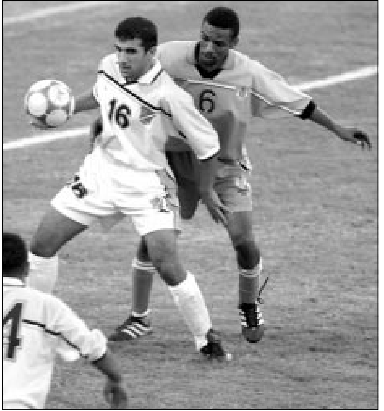
لقطة من احدى مباريات نادي العين الاماراتي

والشباب في مواجهة جديدة صعبة بعد حامل اللقب وهو مطالب بتحقيق نتيجة جيدة بعد تعادلهن 1-1 مع الشعب والنصر، حتى ان بعض اصوات تعالت لاعباده عن الجهاز التدريبي. ويعلق التعاشية اماله على نجم وسط منتخب ايران كريم باقرى الذي لم يظهر بمستواه المعتود في المباراة السابقة مع النصر بسبب الاجهاد جراء مشاركته في التصفيات المؤهلة الى مونديال 2002. وعلى ارضه، يخوض الشباب مباراته الاولى بعد اقصاء المدرب السلوفاكي دوشان عندما يواجه الاتحاد، وظروف الفريقين متشابهة الى حد ما، الاول خسر امام الجزيرة صفر-1 والعين 1-3،