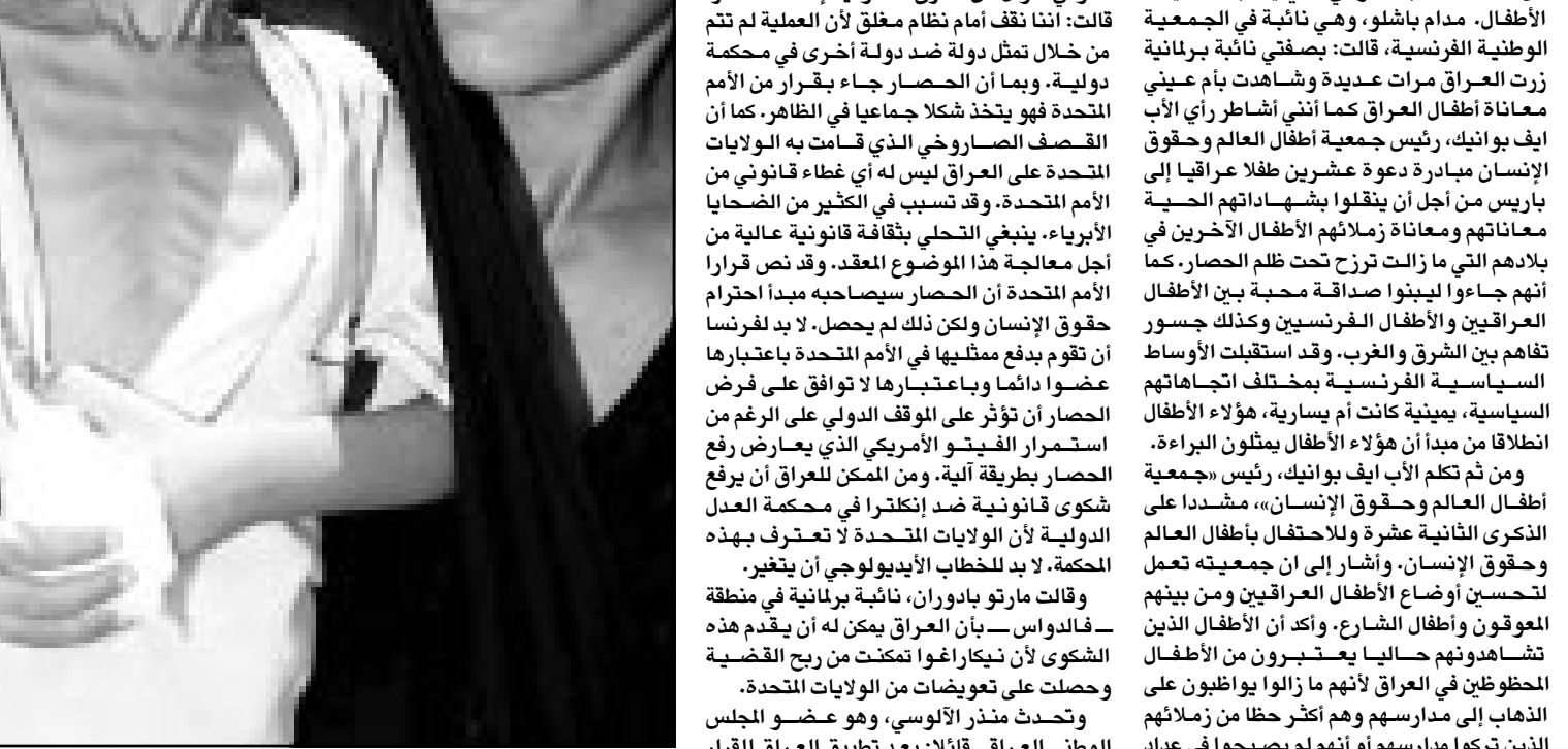
طل عراقى يعانى سوء التغذية

العراق جراء استمرار الحصار. وقال في كلمة القاها في حفل استقبال اقامه في مبنى مجلس الشيوخ على شرف وفد اطفال العراق قائلاً: من المؤلم أن نشاهد اليوم وفي الوقت الذي يحتفل فيه العالم بالذكرى السنوية لتفاقية حقوق الطفل الدولية في العراق يوتون بالآلاف بسبب حرمانهم من أبسط الحقوق في الغذاء والدواء والعلاج وبقرار من قوى عربية كبرى. وأكد الدكتور غازي فيصل، رئيس شعبة رعاية مصالح العراق في فرنسا أن وفد اطفال العراق يحمل رسالة محبة وسلام إلى الشعب الفرنسي وأن هذه الزيارة هي تعبير حي لصمود الإنسان العراقي وكفاحه من أجل الحرية ورفض منطلق الحصار ومواجهته الأسطورية لهذا الحصار الذي تسبب في موت عشرة آلاف طفل شهرياً. وقد استقبل وفد اطفال العراق المكون من عشرين طفلاً برلمانيون في مجلس الشيوخ والجمعية الوطنية الفرنسية ومن