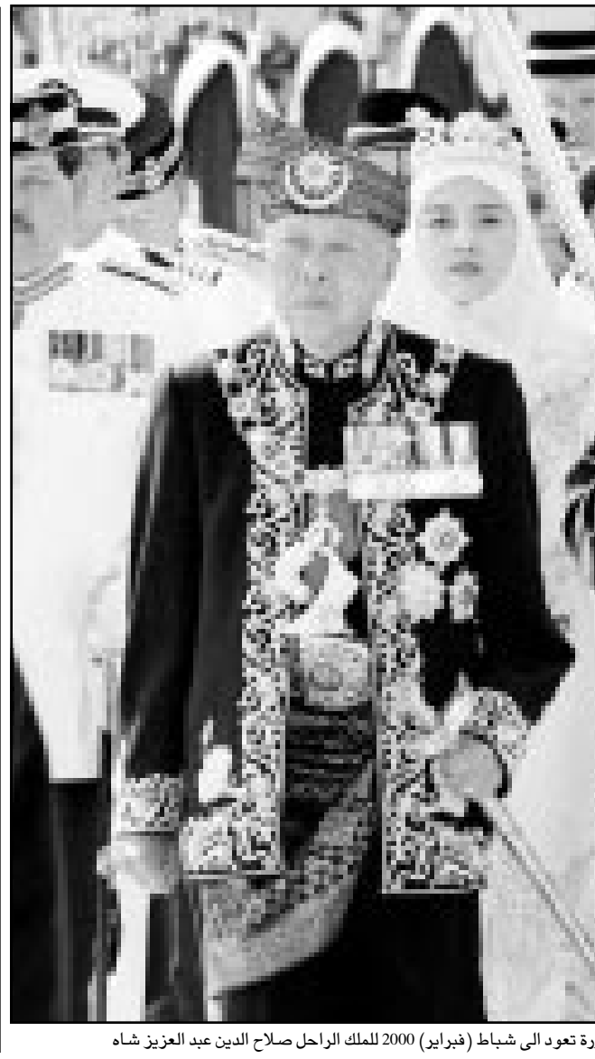
صورة تعود الى شباط (فبراير) 2000 للملك الراحل صلاح الدين عبد العزيز شاه

سكوبييا -رويترز: قالت مصادر بالحزب المعتدل الرئيسي في مقدونيا ان الحزب سينسحب من الائتلاف الحاكم قريبا في خطوة من شأنها ان تصعب جهود تنفيذ اتفاق سلام مدته ثلاثة اشهر تم التوصل اليه مع العر المتحدرين من اصل الباني. وقالت مصادر بحزب التحالف الديمقراطي لشعرانيا لقندونيا للحصافين بعد اجتماع للحزب الليلة قبل الماضية ان قرار الانسحاب من ائتلاف الحكومة سيعلنه رئيس الحزب برانكو كرفنوكوفسكي في مؤتمر صحفي يوم الجمعة.