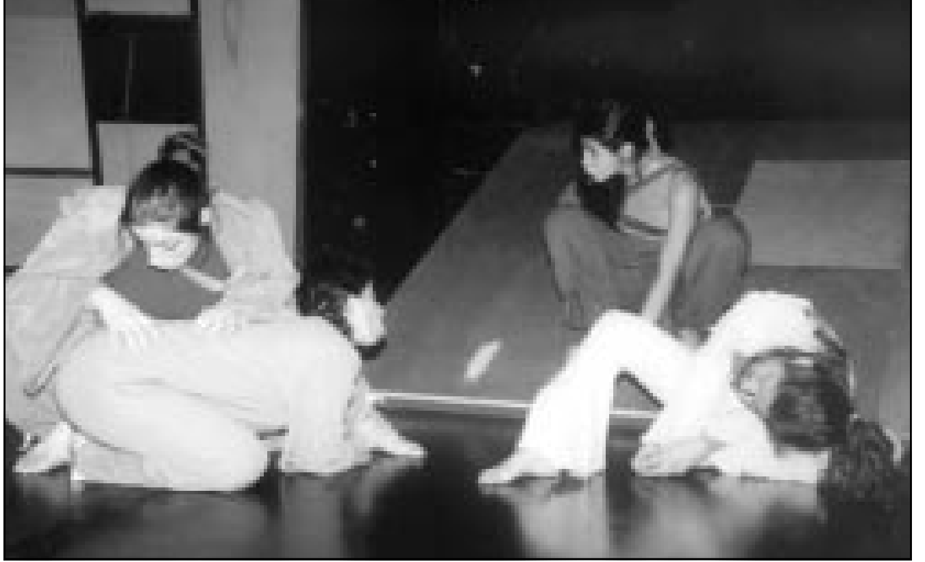
مشهد من مسرحية «لوسي المرأة العمودية»