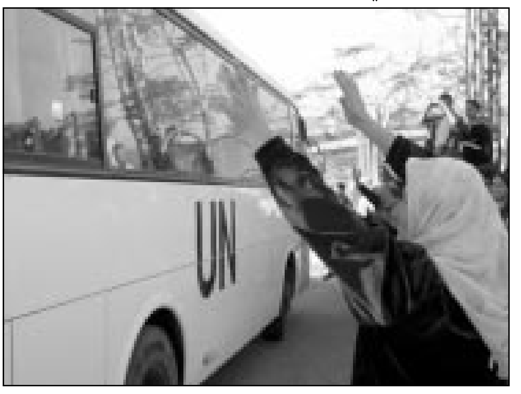
لبنانية تلوح بيدها لاحد اقاربها في حافلة نقل فيها حوالي 80 لبنانيا عادوا من اسرائيل

قررت العودة إلى ديارها احتجاجا على عدم استجابة الحكومة الإسرائيلية لمطالبها. وقالت هذه العائلات في رسالة بعثت بها إلى رئيس الوزراء الإسرائيلي ارييل شارون قبل نحو شهرين «انها