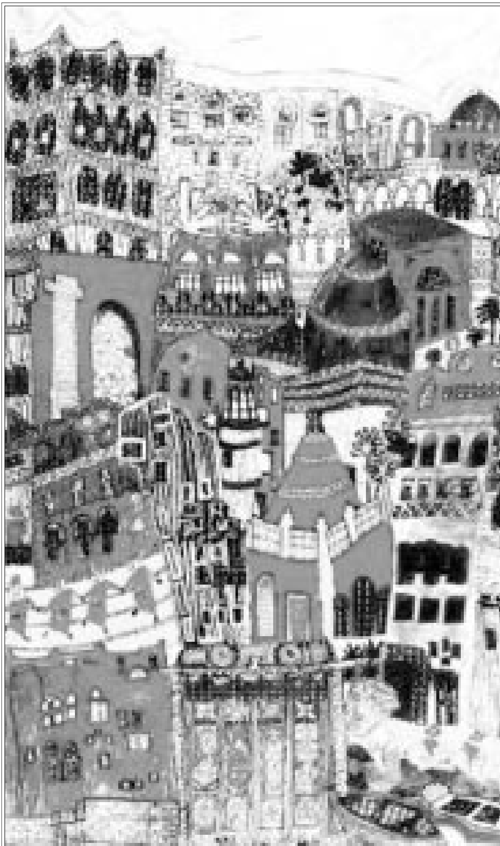
من أعمال الفنانة

الخليل بن أحمد الفراهيدي؛ لكن الفراهيدي باكتشافه بحور الشعر، قدم عملا إبداعيا من موقع مختلف. صنع ابرة فذة من موقع المتلقي الذكي. فرضا! تقول الفراهيدي التي تقياس بحور الشعر واوازنها. فهل منصل مع التقدم التكنولوجي الى امكانية قياس حرارة العاطفة في النص وعمق الشوق، وقطر الحبة ومحيط الكرامة ودرجة التجديد؛ ربما، فمن يملك الاجابة الحاسمة! كاتب فرعونى اسمه سنب، عاش حوالي (2500) قبل الميلاد، قال: (الايلىتى اجد الفاظا لم يعرفها الناس، وعبارات واقرالى بلغة جديدة لم يتقن عهدها، فليس فيما تولك الاسن اقوال وعبارات لم يقلها أبأنا من قبل...). وقال عنتره العبيسي: (هل غادر الشعراء من متردم ام هل عرفت النار بعد توهم) وقال المتنبي: (وانى وان كنت الاخير زمانه لات بما لم يقله الاوائل) وقال الامريكى نورثروب فراي: (لا يمكن ان تجيء وغبة الكاتب في الكتابة الامن تجربة سابقة.. ان الرب لا يستعمل طاقته واشكال تظهره الا من نفسه). وقال الكاتب الايطالى المعاصر، امبريو ايكو: (الكتاب الجديد، قراءة جديدة لكتاب قديم..). واجتهد للكشور احمد الزعبي في تقريب مفهوم (التناس) لقراءه وطبق ذلك على نصوص مختارة ليثبت بان المهارة تكمن في اعادة انتاج ما كتب وما قيل. وافرد الناقد حاتم الصكر فصلا كاملا في كتابه (ما لا تؤدى الصفة) ليلتصق قصيدة النثر كجس ادبي متميز، واستعان بقصيدة الشاعر انسى الحاج (حلم فراشة) ليلتصقا بالجملة والحدث. ولم اعرف (انا) كيف اصنف هذه القصيدة، تحت باب التناس، ام تحت باب توارد الافكار، او تحت باب