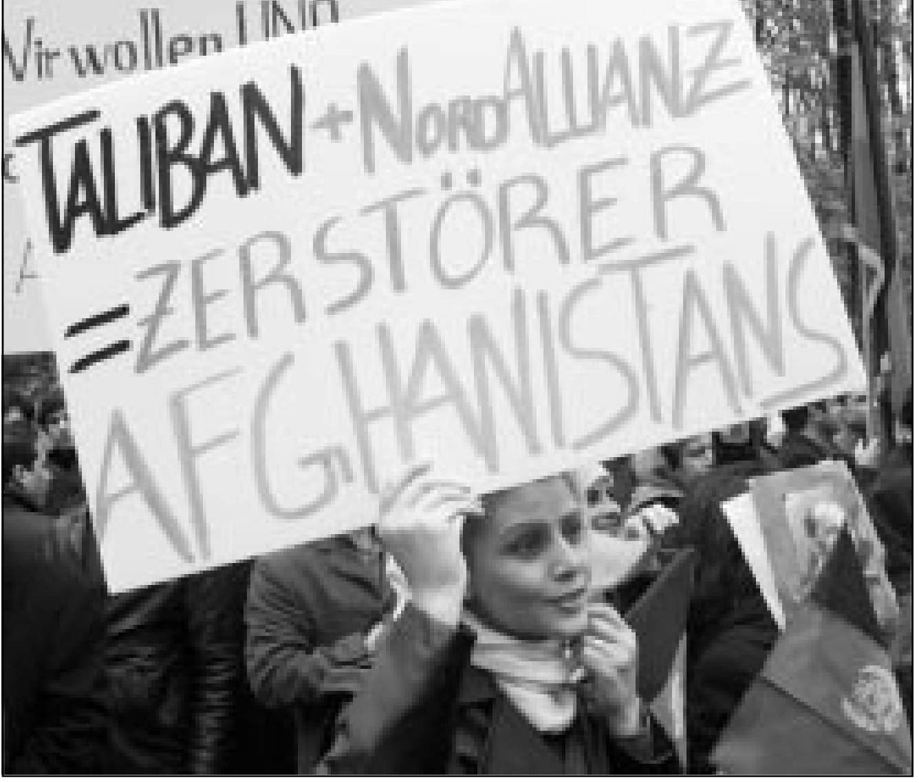
سيادت أفغانيات مؤيدات للملك ظاهر شاه يتظاهرن ضد طالبان وقوات تحالف الشمال في بون أس