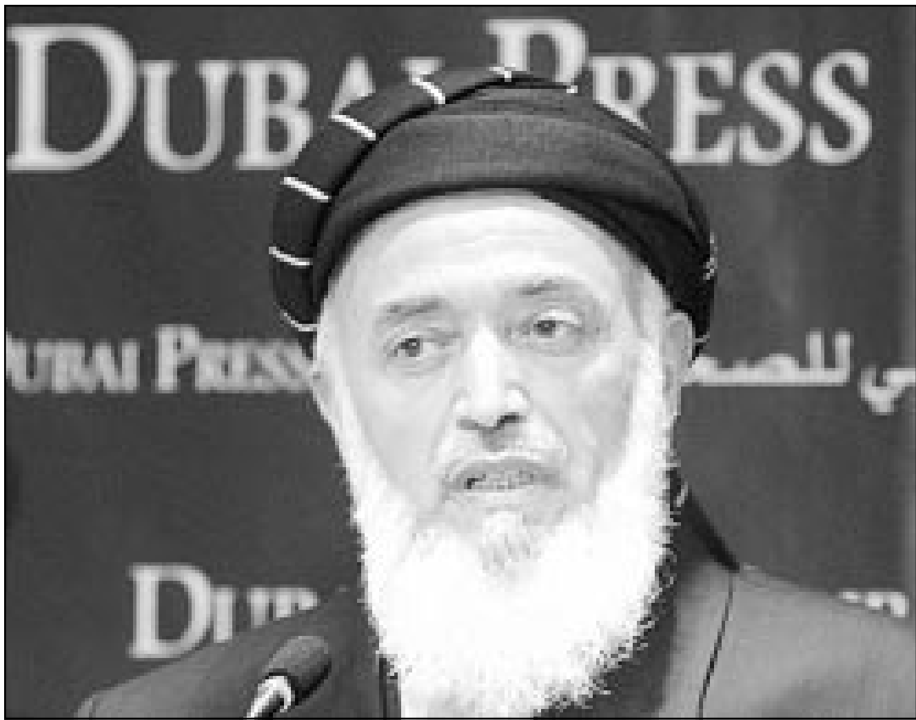
رئيس التحالف الشمالي برهان الدين رباني أثناء مؤتمره الصحافي في دبي

■ دمشق - رويترز: طلب عضو في البرلمان السوري مشيه بمخاطفة الدستور لطلبيته بحريات سياسية اكبر من المحكمة امس الثلاثاء السماح له بالاستعانة بخبراء لغويين لاثبات ان مطالبته السياسية كانت مشروعة. ومأمون الحمصي الذي اعتقل في اب (اغسطس) خلال اضراب عن الطعام واحد من بين عدد من المعارضين الذين اعتقدتهم السلطات السورية في الاشهر الاخيرة فيما يعتبره ديبلوماسيون غربيون تحذيراً لمتنقدي النظام. في جلسة حضرها عدد من الرافقين ديبلوماسيين الغربيين طلب الحمصي من المحكمة السماح له بالاستعانة بخبراء في الابد لتخليد ما اذا كان البيان الذي اصدره تحريضياً كما اعتبرته السلطات السورية، وطلبت الوثيقة امس لطلبه كبح جماح قواتها الامنية الكثيرة ورفع ايدي المسؤولين والباثنيان في فروات البلاد. واستشهد حمصي الحمصي بواقعة حدثت في التاريخ الاسلامي ليجأ فيها احد الحكام الى مشورة الخبراء في تفسير قصيدة معقدة كان يعتقد انها مهينة وحذر المحكمة من ان اطلاق سراح مذنب افضل من اذانة بري.