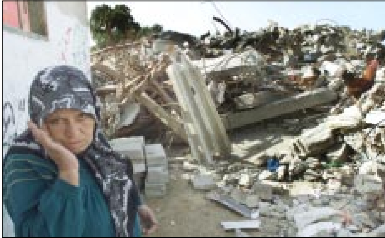
فلسطينية تغف بجانب انقاض منزلها الذي هدمته القوات الاسرائيلية في مخيم رفح جنوب قطاع غزة أمس

واعترى شارون في حضور زيني انه لن يتم التسوية الى اتفاق سلام طالما ان «الارهاب» مستمر. واعلن رئيس اركان الجيش الاسرائيلي الجنرال شاوول موفاز ان الرئيس الفلسطيني هو الذي اعطى «شخصياً» تعليمات لفتح وحماش والجهاد بارتكاب «اعمال ارهابية داخل اسرائيل». وادع الشيوخ احمد ياسين الزعيم الروحي لحركة المقاومة الاسلامية (حماس) عن حق الشعب الفلسطيني في الدفاع عن نفسه، وقال للصحافيين في غزة ان على اسرائيل الا تتوقع ان يستسلم الشعب الفلسطيني «لعدوانها».