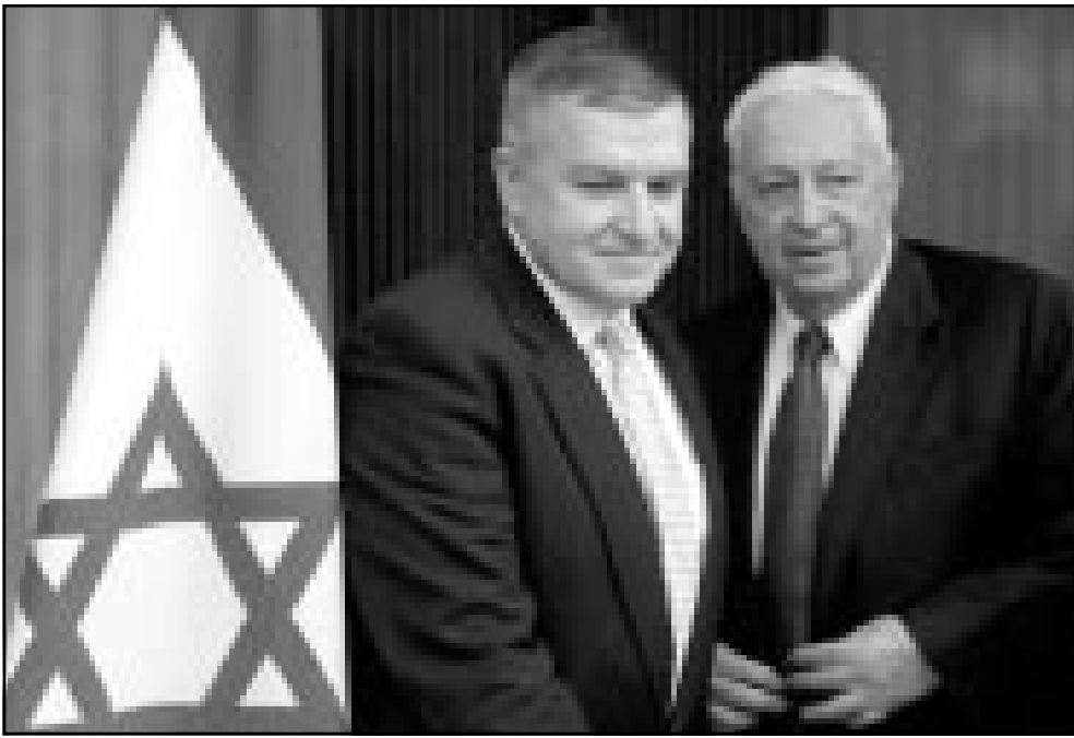
رئيس الوزراء الاسرائيلي ارييل شارون لدى اجتماعه مع المبعوث الامريكاني انتوني زيني

وقام شارون بعدها برفقة ضيفيه بجولة بالروحية خصوصا فوق «الخط الاخضر» الفاصل بين الضفة الغربية فلسطينيان في شمال اسرائيل امس الثلاثاء يعطى مثالا لنسوة التوصل لهدنة لوقف العنف المستمر منذ 14 شهرا.