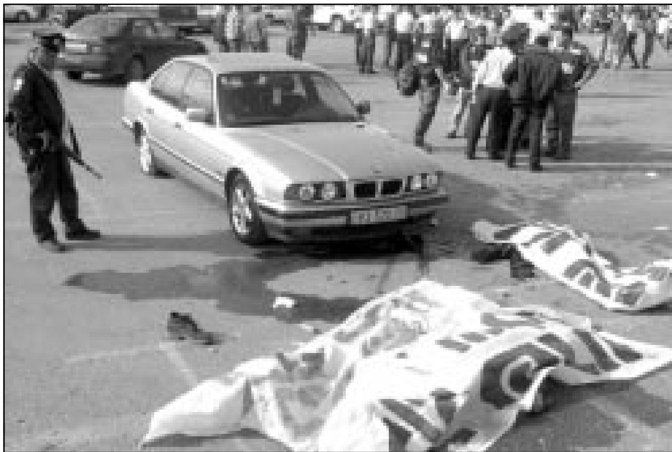
جندي اسرائيلي يحرس جثمانى الشهيدين بعد اطلاق النار عليهما في مدينة العفولة