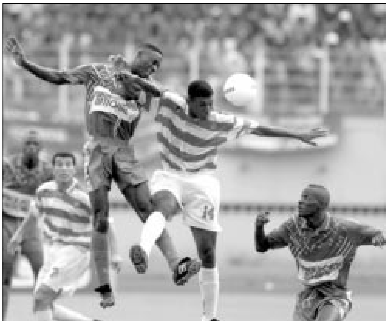
لقطة من إحدى مباريات النادي الأفريقي التونسي