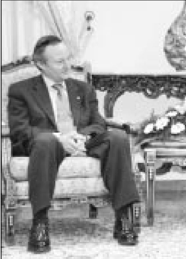
وزير خارجية اسبانيا جوسيب بيكي والرئيس محمد خاتمي بطهران امس

الاسرائيلي الذي نفذته القوات الاسرائيلية على مناطق السلطة الفلسطينية وقال للصحافيين في مطار طهران ان مدريد «تتشجع الحملة الاسرائيلية على نوار غزة».