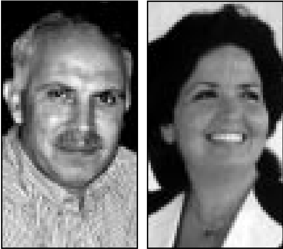
فيصل جلول (القدوس العربي)