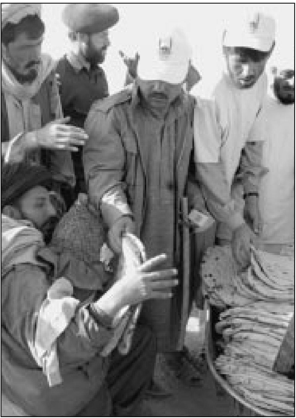
عامل باكستاني يقوم بتوزيع الخبز على اللاجئين الافغان الجدد الذين وصلوا الى مخيم كيلي فيوز على الحدود بين البلدين

وكان الرئيس الامريكي جورج بوش صرح الاسبوع المنصرم ان الرئيس العراقي صدام حسين «سيبري» ماذا سيحصل اذا رفض عودة مفتشي الامم المتحدة.