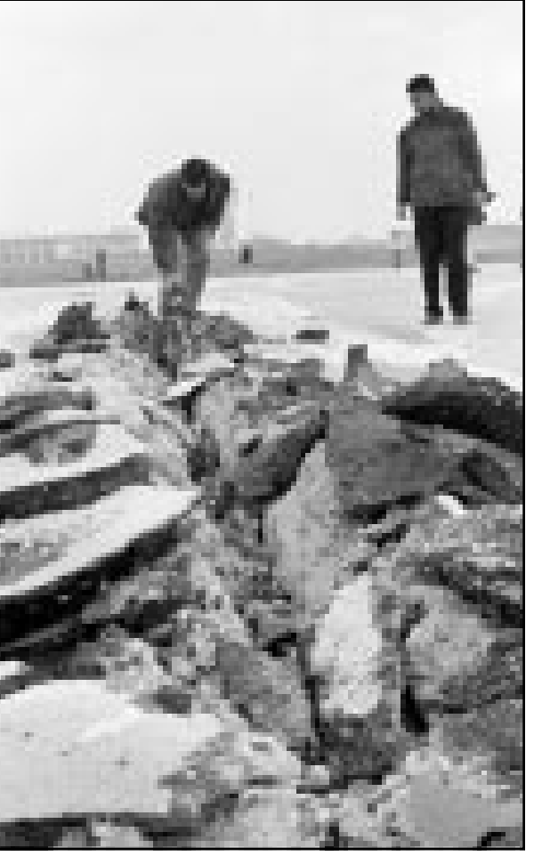
فلسطينيون يتفقدون آثار القصف على غزّة خلال الدوالي

وقالت الوكالة ان مواقف الزعماء العرب جاءت خلال الاتصالات هاتفية اجراها لمنع الرئيس صالح مع كل من الشيخ نهيان وولي العهد السعودي الامير عبد الله بن عبد العزيز حذروا منا وصفوه «النتائج الخطيرة للعدوان المسافر (الذي تشنه اسرائيل) والذي سيقود الى نتائج خطيرة». وقالت الوكالة ان مواقف الزعماء العرب جاءت خلال الاتصالات هاتفية اجراها لمنع الرئيس صالح مع كل من الشيخ نهيان وولي العهد السعودي الامير عبد الله بن عبد العزيز حذروا منا وصفوه «النتائج الخطيرة للعدوان المسافر (الذي تشنه اسرائيل) والذي سيقود الى نتائج خطيرة».