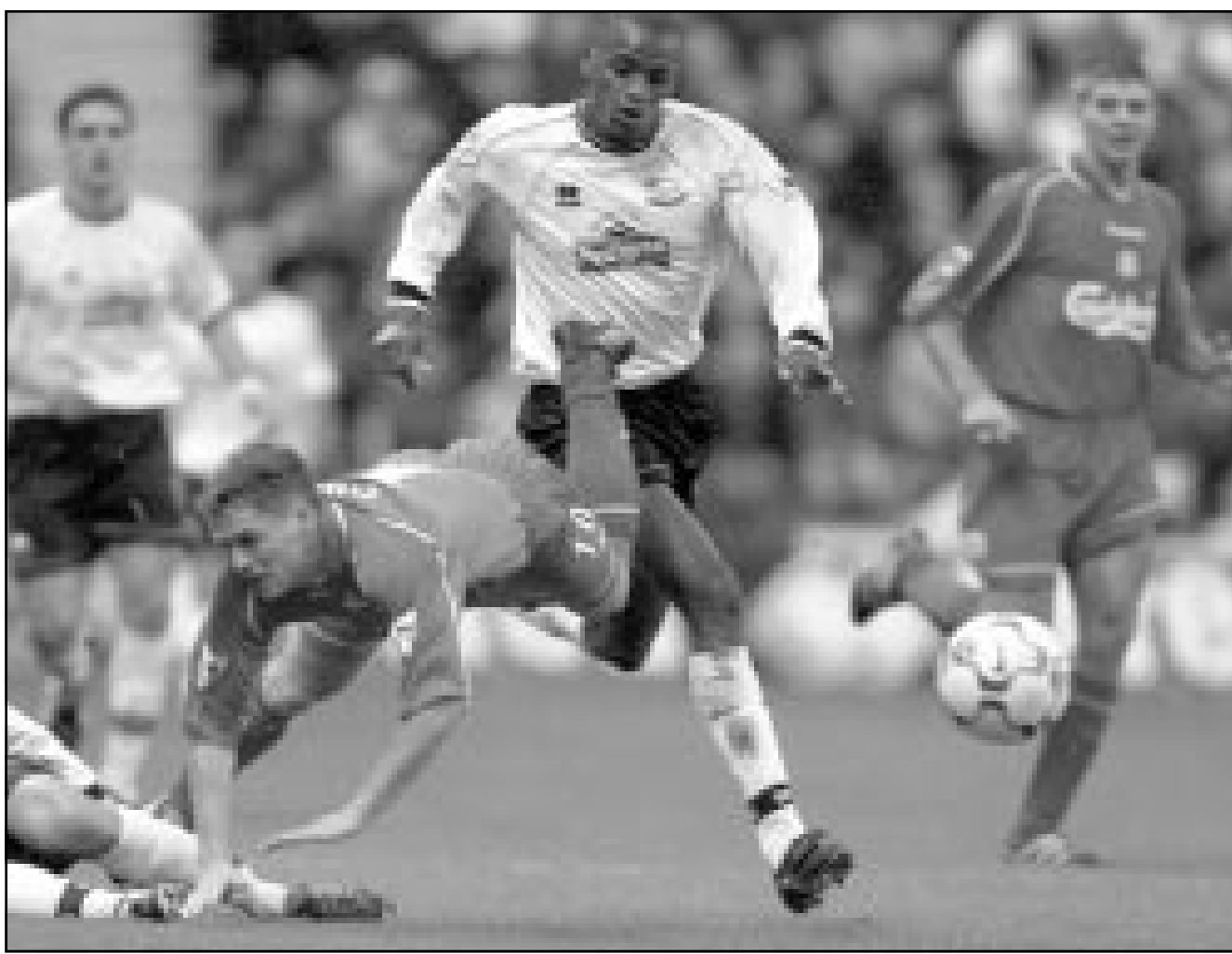
لقطة من إحدى مباريات فريق ليفربول

ولن تكون مهمة مانشستر سهلة خصوصا انه يمر في فترة الاندماج ووزن لم يشهد لها في السنوات الثماني الاخيرة قد يستغلها الفريق البرتغال ليكمل مفاجاته. من جهته، يواجه بايرن ميونيخ الالماني حامل اللقب نانت الفرنسي على