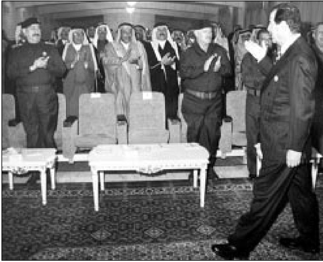
الرئيس صدام حسين يلتقي ممثلي عشائر جنوب العراق امس الاول