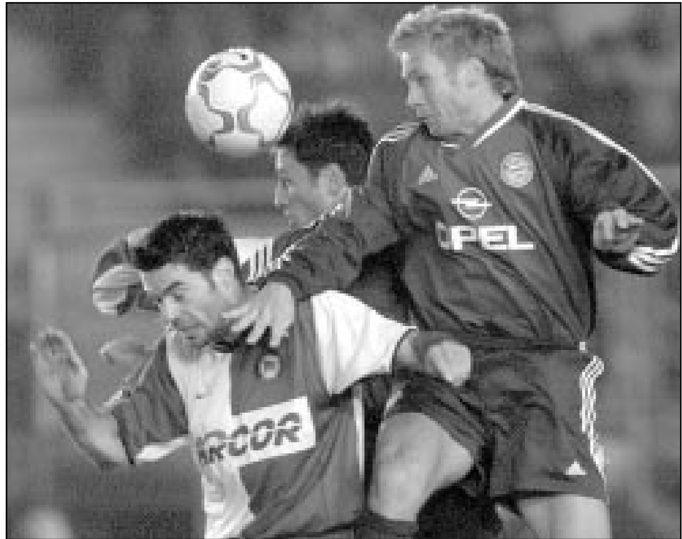
لقطة من إحدى مباريات بايرن ميونخ

■ مدريد - رويترز: قال لاعب خط الوسط الالماني الدولي ستيف مكمانان انه ربما يضطر الى الابتعاد عن الملاعب لاسبوع بسبب اصابة في الظهر. وقال يشارك مكمانان مع فريقه في المباراة المحلية التي فاز فيها على ساسونا 1/2 يوم السبت كما استبعد من تشكيل ريال مدريد الذي سيواجه باثانيايوكوس اليوناني في كأس الالندية الاوربية ابطال الدوري امس الثلاثاء بسبب الام في الظهر. وقال مكمانان «الزلت اعاني من ألم شديد... من المفترض ان اعود الى صفوف الفريق في غضون اسبوعين او ثلاثة». وتترك هذه الاصابة مكمانان في سياق مع الزمن من اجل العودة الى سابق لياقته والمشاركة في مباراة فريقه الاخيرة قبل عطلة عيد الميلاد امام ريال مايوركا يوم 23 من الشهر الجاري.