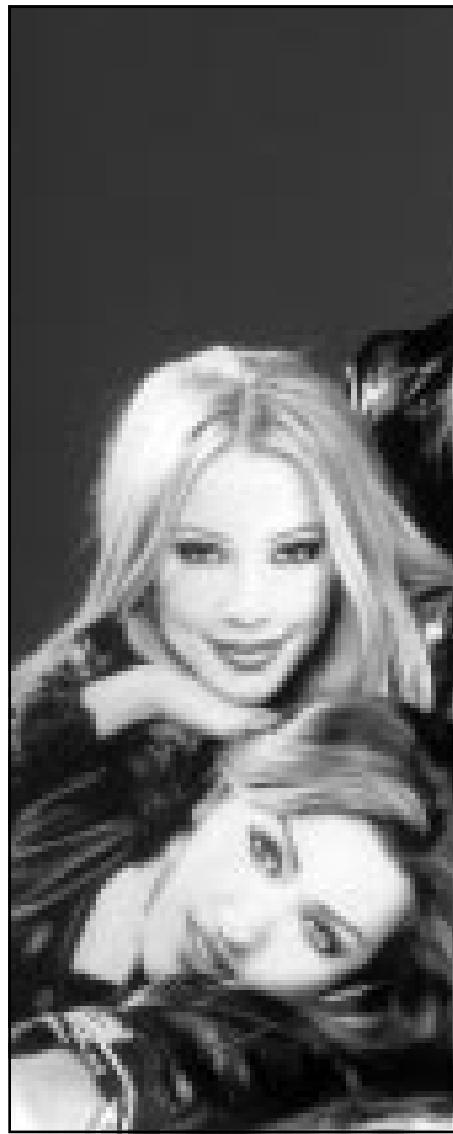
فرقة «فور كاتس» بعد اعادة تأسيسها

واحسدنهم على الهوء الذي يعيشون به. هؤلاء الناس متكيفون مع اوضاعهم ولديهم حلول خاصة للكثير من المشكلات. اما عن افكار الانعجيات فهي متوفرة كفيهما انجتها في هذا الوطن لا سيما في العاصمة. هل تراقب ما يقدمه الفنانون في الطامع والملاهي؟ منذ سنتين اناحتت قرارا بالتوقف عن قبول الدعوات لمثل تلك الحفلات، والسبب ان صوت الموسيقى العربية الحقيقية يرتفع يزعجني خاصة وان كل ما نسعه تقريبا لا يتضمن على ادنى مستوى من النطق، الطلوب، وفوق كل هذا يضاف اليه الايقاع ومن ثم الصناعات. ما يسمى بالموسيقى الايقاعية الحديثة امر مزيج اكثر من النقص. اما عن الغيتن فجميعهم لهم الاصوات المشابهة التي «تزيق» في الموسيقى التي يطلق عليها حديثة. نحن اسام جهل في التاليف والتوزيع. كل هذه المصائب الموجودة في المطاعم والملاهي دفعتني لتشكيل فرقة «فور كاتس» لتقدم الموسيقى والاغنيات المتميزة بمستوى رفيع في الكلمة واللحن.