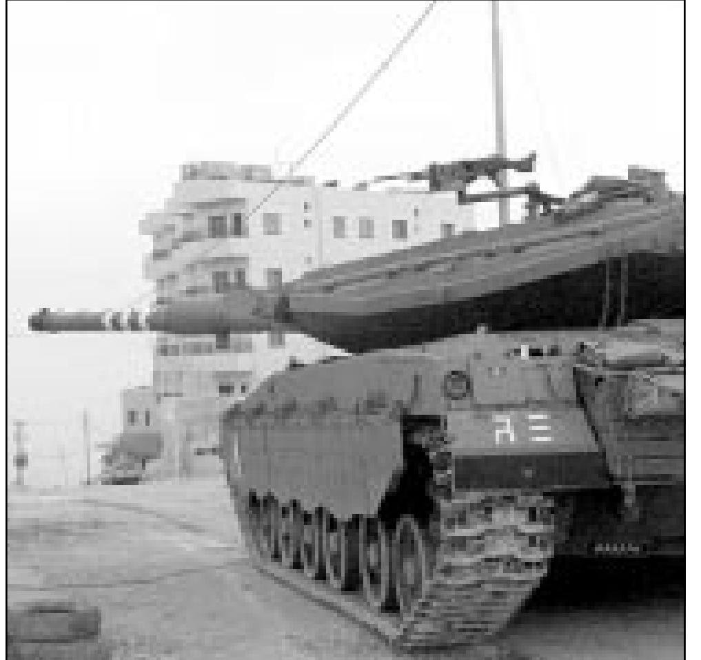
دبابة اسرائيلية تقحم مدينة نابلس