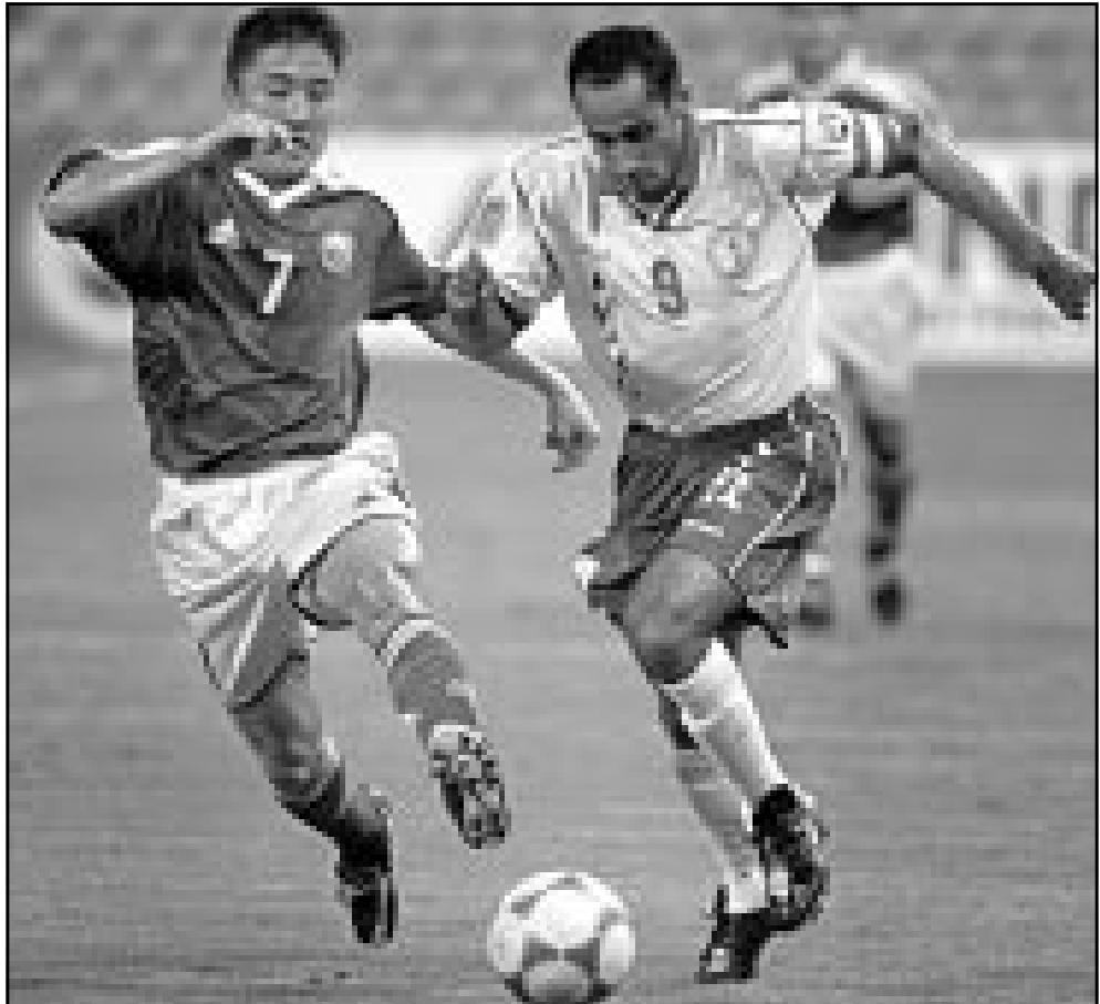
لقطة من إحدى مباريات منتخب السعودية

وضمن الفريق الروسي حصلت اينجكست على الميدالية الذهبية لسباق 100 متر حواجز في بطولة العالم للاعب القوي عام 1991 الا انها اوقت لاربعة اعوام بسبب مخالفة لوائح العقاقير في عام 1993. واحتجت اينجكست على الايقاف قائلة ان زوجها ومدربها السابق وضع لها المواد المحظورة دون علمها وكسبت القضة ورفع الايقاف عنها في عام 1995.