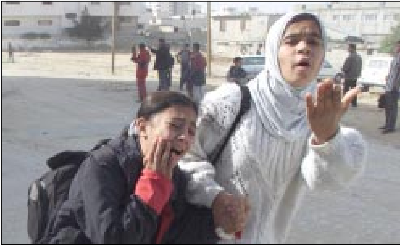
طالبتان فلسطينيتان تهربان من القصف الاسرائيلي قرب مدرستهما في قطاع غزة

من المؤسف، والمؤلم، اننا لسنا امام مرحلة تستشهد بتغيير المناهج الدراسية فقط، وانما اعتماد تفسير الرئيس جورج بوش ومستشاريه للقرآن الكريم والحديث الشريف، وكيفية تطبيق الشريعة الاسلامية. سيأتي اليوم الذي ستوزع فيه السفارات الامريكية خطب الجمعة على امام الحرم المكي الشريف، وكل المساجد الاخرى في العالمين العربي والاسلامي، ولن يعترض احد.