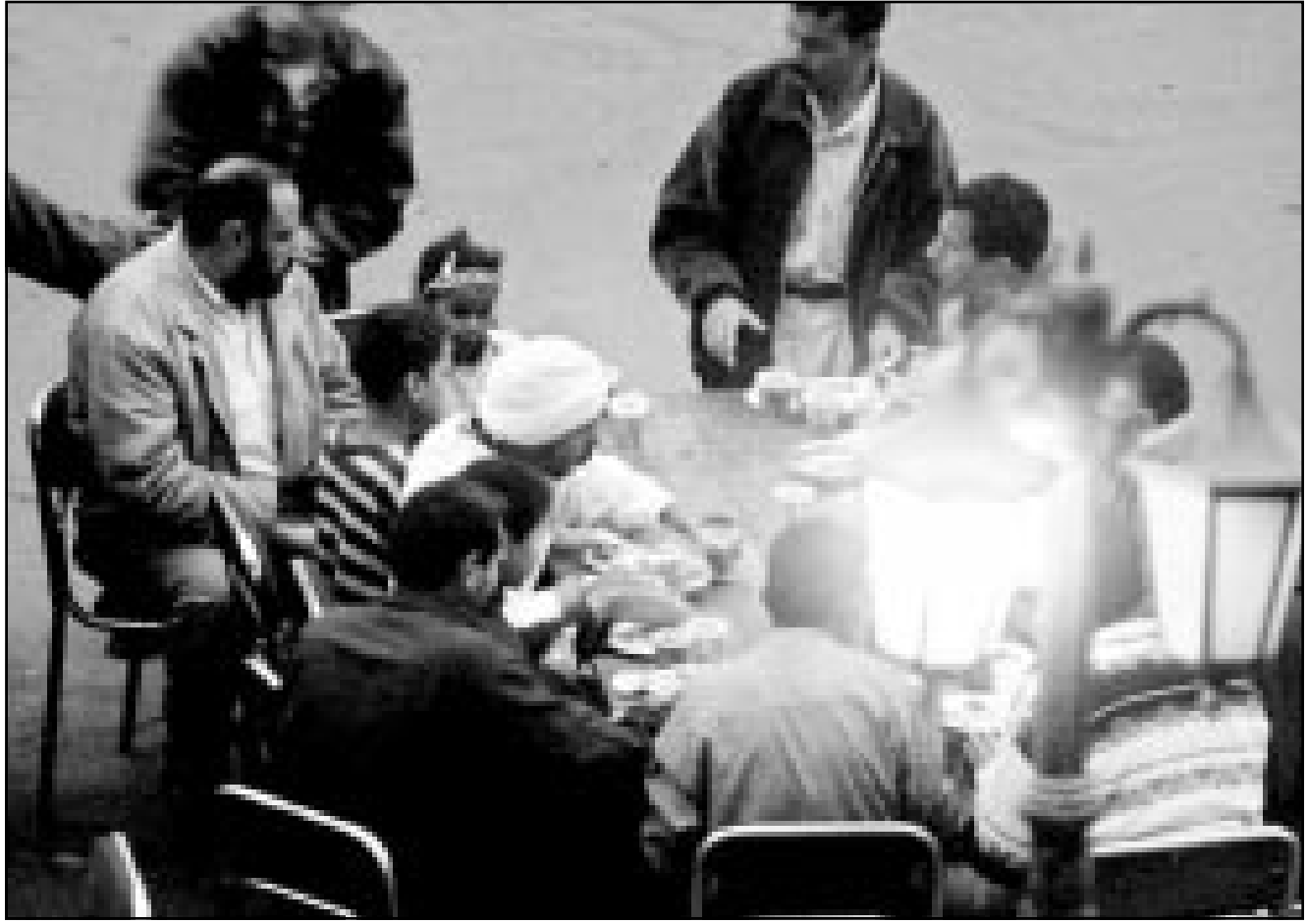
مصريون يتناولون طعام الافطار على موائد الرحمن التي تقدم الطعام مجاناً خلال شهر رمضان

تونس-رويترز: اظهرت بيانات رسمية أمس الثلاثاء ان الاستثمارات الاجنبية المباشرة في تونس بلغت 441 مليون دينار (306.2 مليون دولار) في اول تسعة اشهر من العام الجاري وهو تقريبا نفس المستوى في الفترة ذاتها من العام الماضي. وتعتبر الحكومة اجتذاب الاستثمار الاجنبي احد الاولويات من اجل توفير فرص عمل ودم الصادرات ودم الاستثمار في الميزان المدفوعات. وقالت وكالة دعم الاستثمار الاجنبي التابعة للدولة ان مبلغ 175.5 مليون دينار استثمر في الصناعة التحويلية في