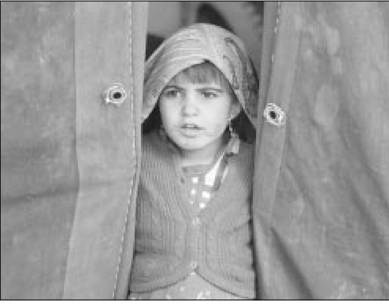
طفلة افغانية في خيمتها في معسكر للاغاثة قرب الحدود الباكستانية (رويترز)