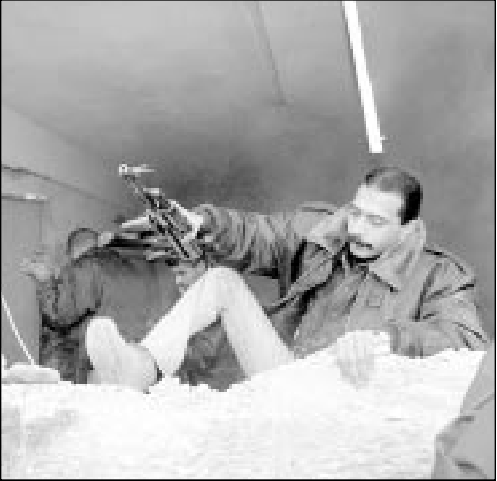
شرطي فلسطيني يحاول الخروج من مقر لقوة 17 في رام الله دمرت طائرات الابانسي الاسرائيلية (ا ف ب)