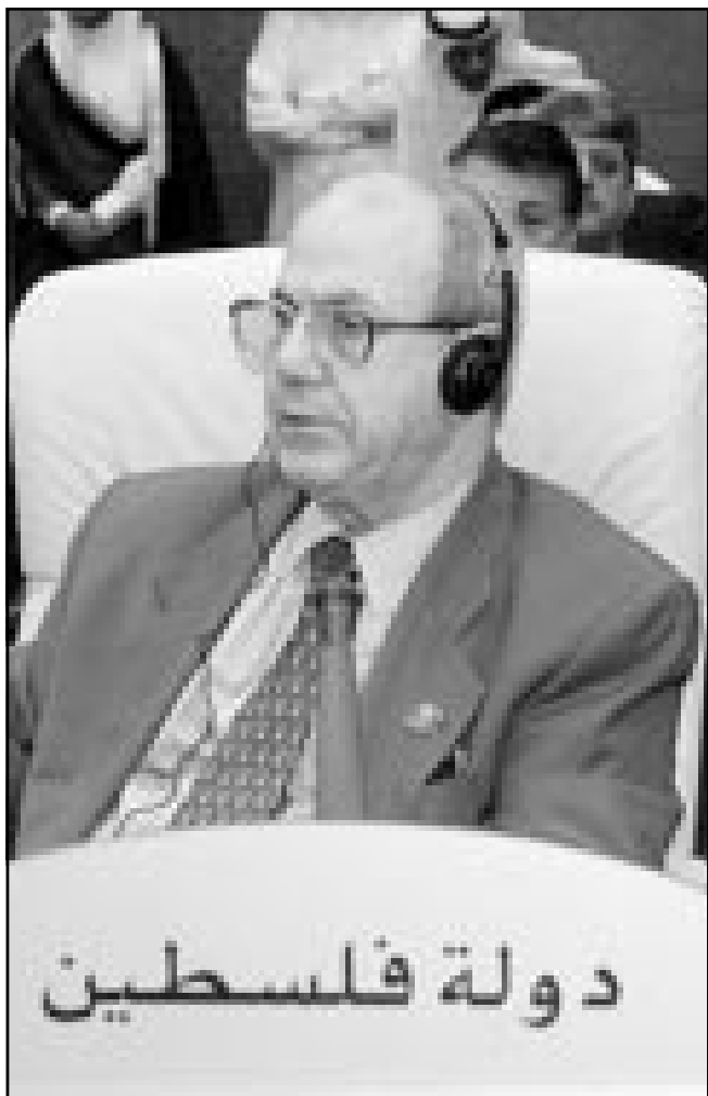
رئيس الدائرة السياسية لمنظمة التحرير الفلسطينية فاروق القدومي في الاجتماع