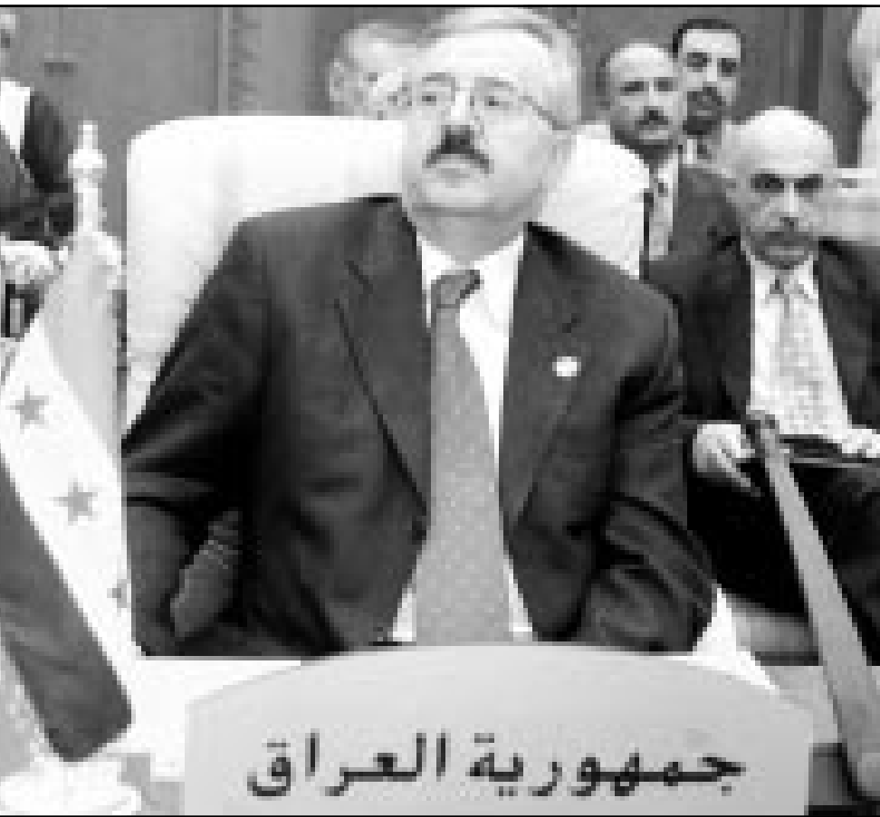
وزير الخارجية العراقي ناجي صبري اثناء مشاركته في المؤتمر الوزاري لمنظمة المؤتمر الإسلامي في الدوحة

■ طهران - أ. ف. ب: بحث وزير الخارجية الإيراني محمد خازني والعراقي ناجي صبري أمس الاثنين في الدوحة في «سبل تعزيز» العلاقات بين البلدين حسب ما أفادت وكالة الأنباء الإيرانية. ونقلت الوكالة عن الوزير العراقي خلال لقائه خازني قبل افتتاح المؤتمر الوزاري لمنظمة المؤتمر الإسلامي في الدوحة أن «العراق عازم على تعزيز علاقاته مع إيران على قاعدة متينة». وأكد صبري للوكالة أنه «سيوزع طهران قريباً». وأضاف أن «اتفاقيات 1975 (الموقعة في الجزائر بين شاه إيران وصدام حسين الذي كان آنذاك نائباً للرئيس العراقي) تشكل القاعدة التي يجب ان يستند التعاون والعلاقات بين البلدين عليها». وأضاف وزير الخارجية العراقي ان «العراق سيبدأ جبهته لازالة آثار الحوادث اليريرة التي شهدتها العلاقات بين البلدين». ومن جانبه، اعتبر الوزير الإيراني ان البلدين «يجب ان تحسدهما ارادة سياسية للتوصل الى ارساء علاقات متينة بين العاصمتين». وأضاف خازني «يجب التخطيط لتطوير العلاقات لان تعاوننا سيساهم في اعادة الاستقرار والسلم والامن في المنطقة ويفيد كل بلدان المنطقة». وكان صبري الذي في تشرين الثاني (نوفمبر) لصحيفة «إيران نيوز» الإيرانية أنه «متسعد» لزيارة طهران «في اوقات». ويعد 13 عاماً على انتهاء الصراع بين