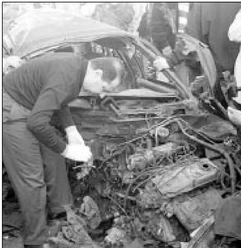
فلسطيني يتفقد سيارة دمرت بالكامل اثر اصابتها بصاروخ اسرائيلي في الخليل