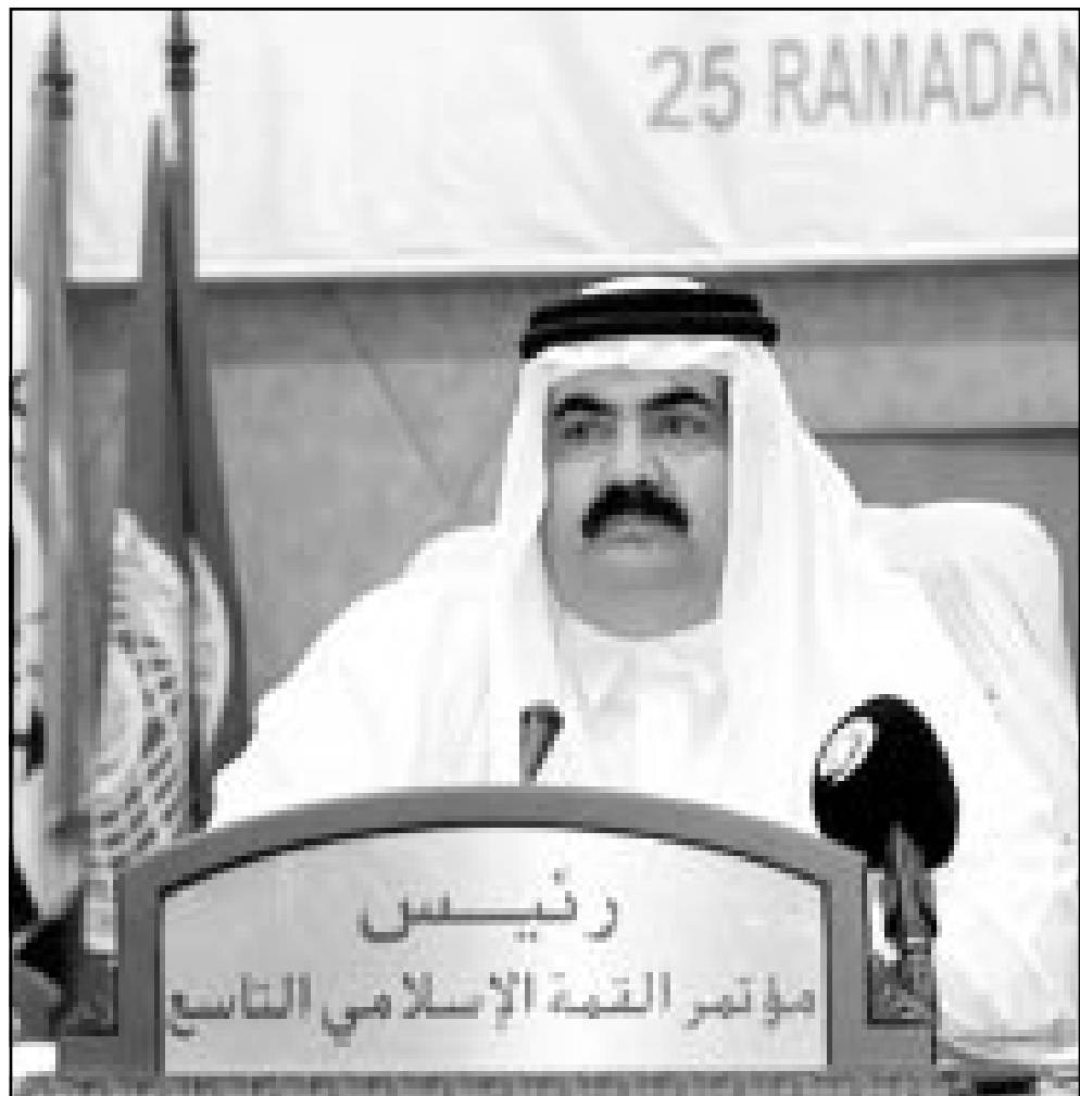
امير قطر الشيخ حمد بن خليفة آل ثاني لدى افتتاحه المؤتمر