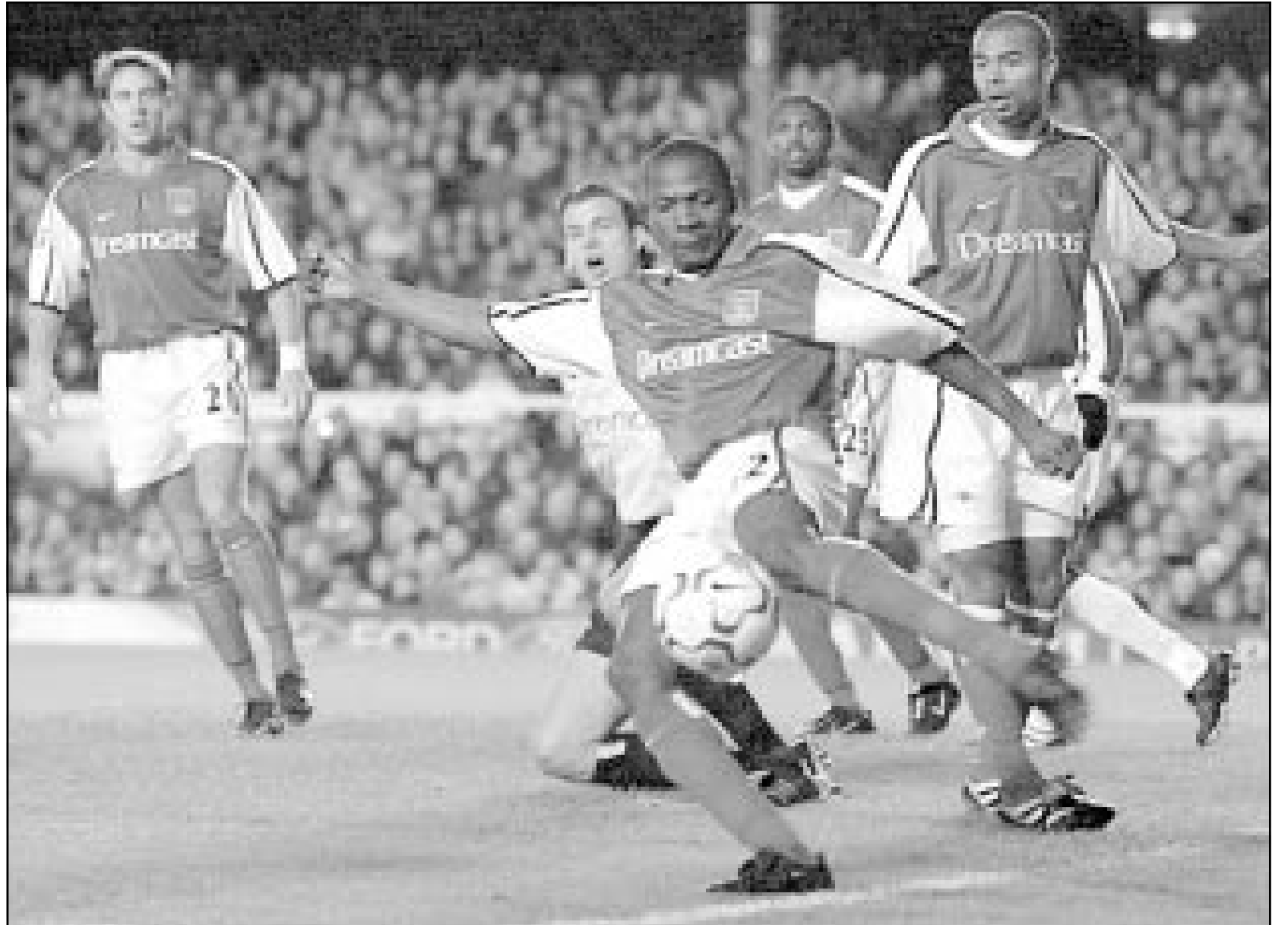
لقطة من احدى مباريات ارسانال الانكليزي