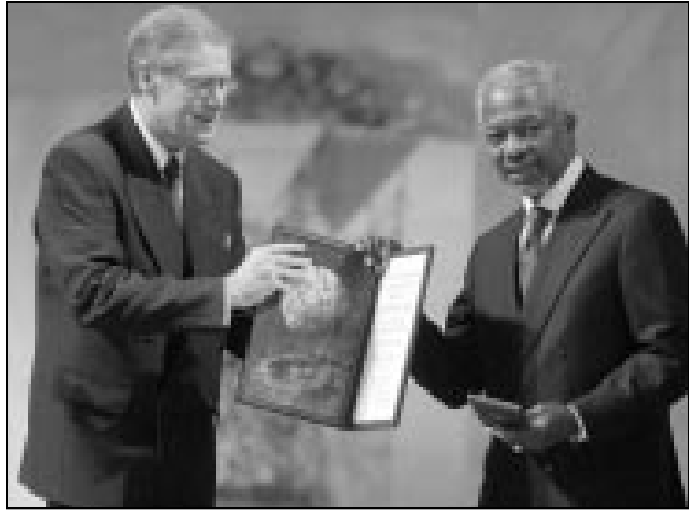
كوفي انان يتسلم جائزة نوبل من رئيس «مؤسسة نوبل» غونار بيرج