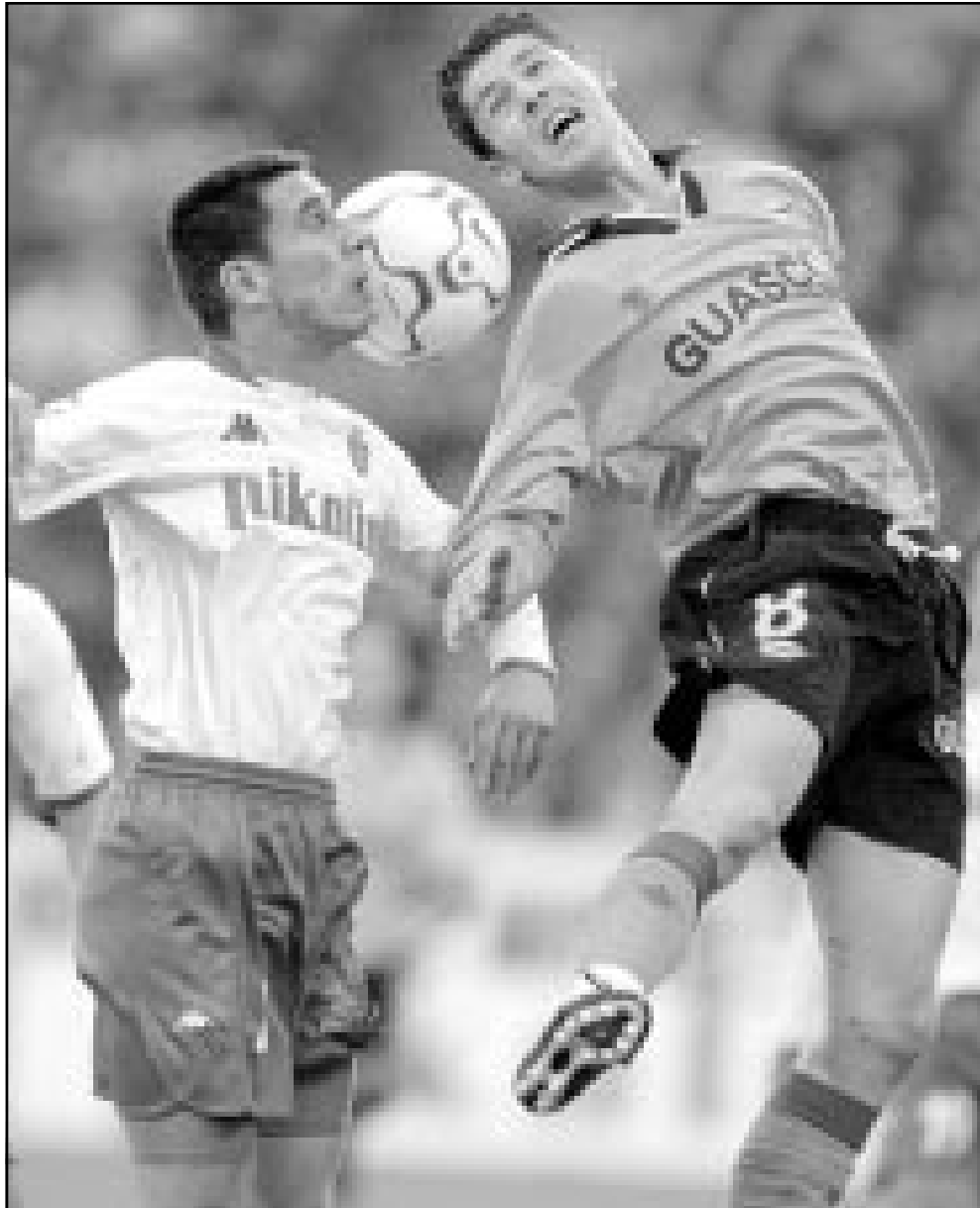
...واخري من احدى مباريات لانس الافيس اسباني