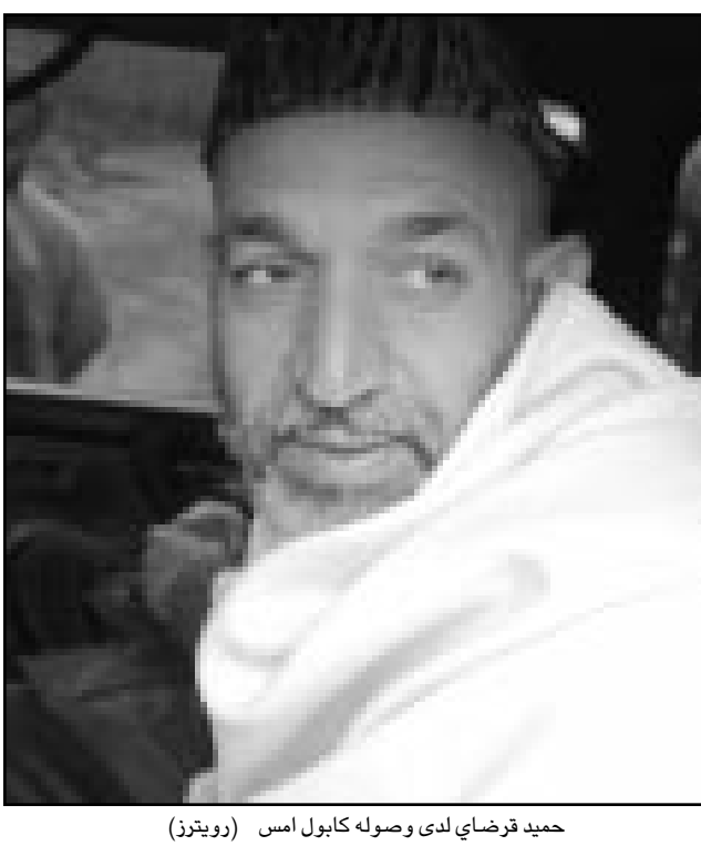
حميد قزواي لدى وصوله كابول امس (رويترز)

الحدود ومنع اعضاء حركة طالبان وتنظيم القاعدة من التسلل عبر الحدود. من جهة اخرى قالت مصادر دفاعية امس الخميس ان الجيش البريطاني سيرسل فريقاً صغيراً الى كابول في مطلع وجهه فترطاً. وتواصل البحث عن مسؤولين افغان في القيام الاجراءات النهائية قبل اتخاذ قرار حول حجم وطبيعة قوة حفظ السلام. وتكرت المصادر انها تتوقع ان يكون قوام القوة الموضوعة من الامم المتحدة «بضعة آلاف من متات»، ومن المتوقع على نطاق واسع ان تقوم بريطانيا المرحلة الاولى لعملية الانتشار التي ترغب الدول المشاركة ان تبدأ عندما تتولى الحكومة الافغانية المؤقتة الحكم في 22 كانون الاول. وقال مصدر دفاعي ان معلومات من الفريق ستستخدم في وضع اللصمات النهائية لخطط قوات حفظ السلام التي من المتوقع اعلانها في اوائل الاسبوع القادم، وازدادت المشاركة من الدول التي من المرجح ان تشارك في المهمة ستجتمع غدا الجمعة لبحث التفاصيل، وهذه الدول هي بريطانيا وفرنسا وإيطاليا واسبانيا وتركيا والاردن.