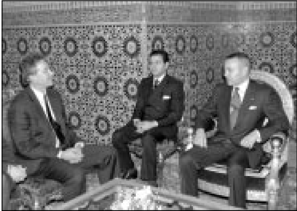
الملك محمد السادس وولي عهده الأمير مولاي الرشيد خلال استقبالهما من قبل المبعوث الأمريكي وليام بيرنز بفاس

الاجراءات اساءت للاهداف النبيلة من نشاطات انسانية. ان لم تعدد الصحف المغربية ان تنتقد أي اجراء يتعلق بنشاط ملكي، وكانت الاجهزة تعتبر هذا النقد اذا وجه فسيكون موجها للملك وليس لجهات اخرى، الا ان الصحف استطاعت ان تضع خطا فاصلا بين رؤية الملك التي تستند الى خطابه في تشرين الثاني (نوفمبر) 1999 حول المفهوم الجديد للسلطة وكيف تكون علاقته مع المواطنين.