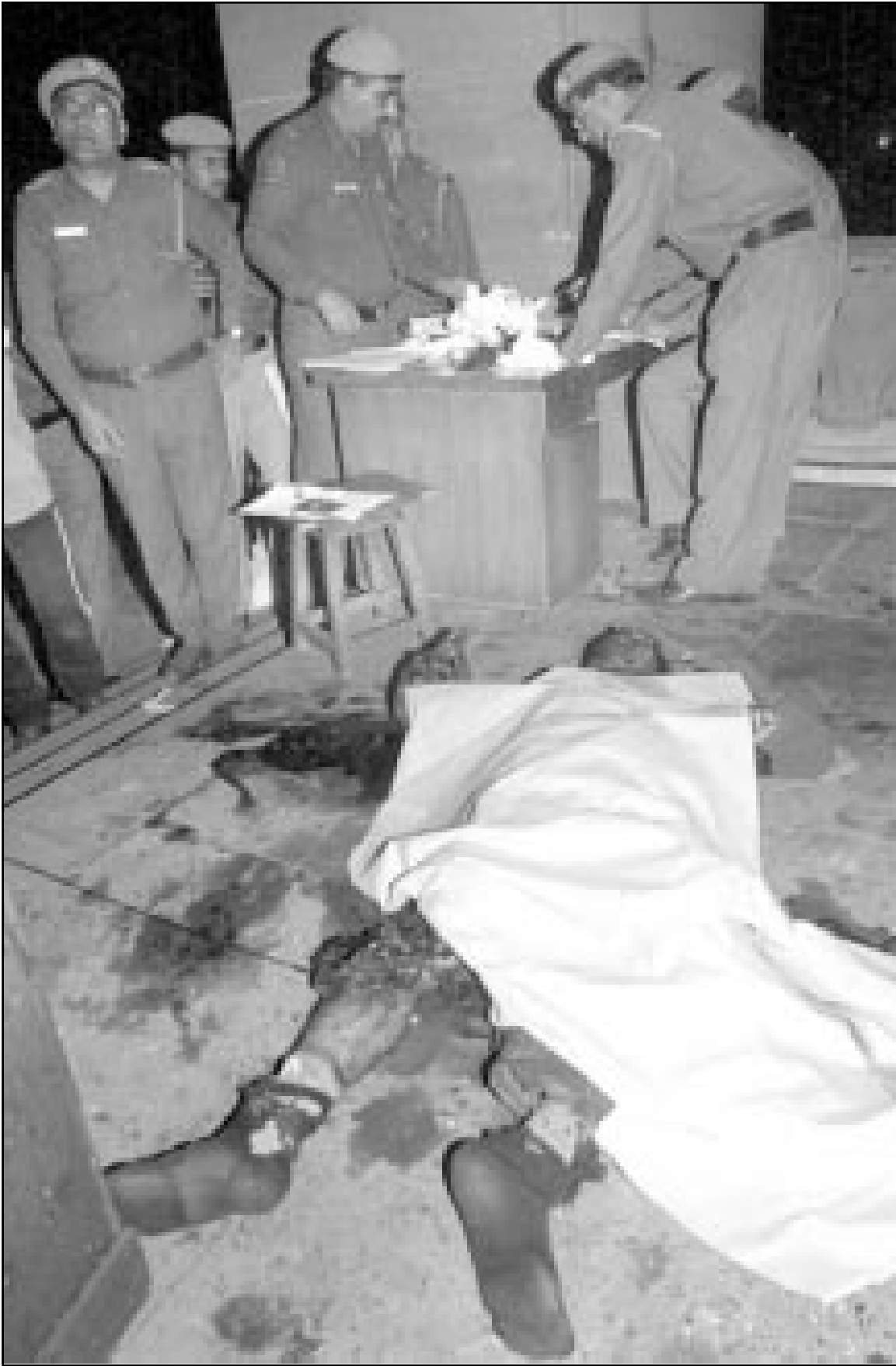
جثة أحد القتلى الـ 12 بالبرلمان الهندي

■ كوالالمبور - رويترز: ادى الملك الماليزي الجديد سيد سراج الدين سيد بوترا جمال الليل بين الولاة له ولبلايه أمس الخميس في اول يوم من تسلمه فخره كملك لمدة خمس سنوات. وبث التلفزيون الرسمي مراسم اداء اليمين التي اقيمت في غرفة العرش بقصر استانا نيجارا بالعاصمة كوالالمبور. ودرس الملك الجديد (58 عاماً) في مدرسة تدريب ضباط الجيش ببريطانيا وخدم في الجيش قبل خلافته لوالده كسلطان لبرليس اصغر الولايات الماليزية. ويتداول سلاطين الولايات الماليزية العرش منذ استقلال البلاد عن بريطانيا عام 1957.