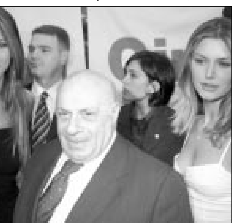
رؤوف دنكاش يتوسط عراضات ازياء بانقراة امس قبيل شروعه في مفاوضات سياسية حول مصير الجزيرة

السلطات القبرصية التركية صادرت ممتلكات هذه الصحيفة اليسارية المعروفة بانتقادها ادارة رؤوف دنكاش. وعزا سينير ليفينث هذا القرار الى عدم دفع 200 مليار ليرة تركية (138 الف دولار) كعطل وضرب وفوائد للزعيم القبرصي التركي رؤوف دنكاش بعد حكم صدر على الصحيفة في العام 1999. واوضح ليفينث ان السلطات صادرت امس الاربعاء اثاث ومعدات مباني الصحيفة وعابثوا الات في المطبعة ستم مصادرتها امس الخميس. واضاف ان محكمة امرت يوم الثلاثاء بمصادرة واردات الصحيفة المقدرة بخمسة مليارات ليرة تركية (3500 دولار) اسبوعياً. واشار الى ان «دنكاش تخلى علناً عن التعويضات ولكنه قرر فجأة الان المطالب بها». وقال ايضاً «انها حملة تهدف الى اسكات صحيفة اوروبا وكم افواه انصار السلام». وكانت قد صدرت في الماضي اجهزة كمبيوتر تابعة للصحيفة وتعرضت لمطبخها للتخريب. كما اعتقل ليفينث واربعه اخرين من الصحافيين ليضعة ايام في تونز (يوليو) 2000 بتهمة التجسس لحساب جمهورية قبرص التي تعترف بها الاسرة الدولية. وجاءت عملية المصادرة اثر تظاهرة امس الثلاثاء ضمت حوالي 350 طالباً ومدرسة احتجاجاً على صرف مدرسة كتبت مقالات تنتقد فيها تركيا في صحيفة «اوروبا». وكانت المدرسة نيلغون اورهون (32 عاماً) قد وصفت في مقالاتها تركيا بانها «قوة احتلال» تعيق الديمقراطية في شمال قبرص حيث يتمركز حوالي 35 الف جندي تركي.