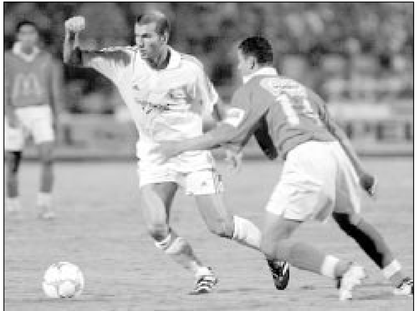
الاهلي في مباراته مع ريال مدريد

القاهرة - أ ف ب: بدأ النادي الاهلي المصري مبكرا استعداداته لتنظيم مباراة الاياب من الدور النهائي لسابقة دوري ابطال افريقيا لكرة القدم التي ستقام في القاهرة يوم 21 كانون الاول/ديسمبر الجاري ضد صنداونز الجنوب افريقي.