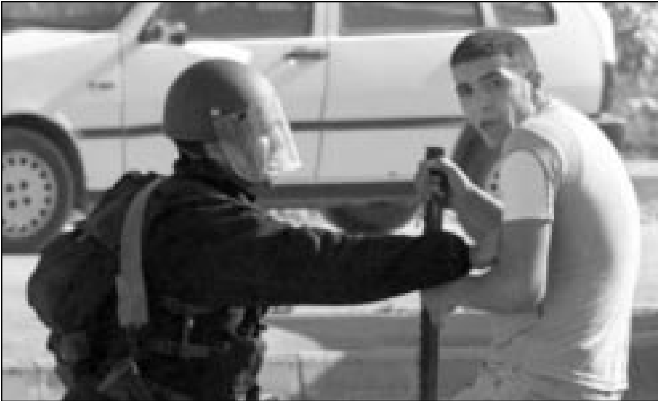
مدرسون بلا تدريب مهني

الازمائية) والروضات الازمائية والنقص في عدد معلمات الروضة القانونية، احد الاسباب من وراء ذلك ان على السلطات المحلية ان تمويل ربع ميزانية صفوف البستان، الامر الذي يصعب على السلطات المحلية العربية ان تقوم به بسبب أزماتها المالية، النقص في الروضات في الوسط العربي بارز بشكل خاص في النقب وخصوصا في التجمعات السكنية غير المعترف بها حيث اخذت الحركة الاسلامية تشي هذا هناك روضات اطفال خاصة في السنوات الاخيرة.