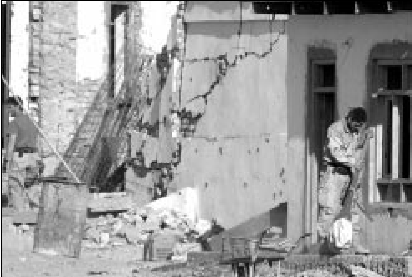
جنديان امريكيان يقيمان داخل منزل زعيم طالبان الملا عمر في قندهار

■ ببشاور - كابول - «القدس العربي» - وكالات: انتشر حوالي اربعة آلاف جندي وعسكري باكستاني على طول الحدود مع افغانستان قبالة منطقة الجبال البيضاء حيث يحاصر مقاتلو القاعدة، وفق ما افاد ضباط باكستانيون لوكالة «فرانس برس» أمس الخميس. وكانت الضباط ان مجموعات من الجيش النظامي والقوات المسلحة الباكستانية انتشرت على طول اربعين كلم في مناطق القبائل شمال غرب باكستان. وتقع هذه المنطقة الجبلية التي تتمتع بحكم ذاتي نسبي في مواجهة منطقة تورا بورا في شرق افغانستان التي كانت تتعرض أمس الخميس لقصف جوي امريكي وهجمات برية للقوات الجوية الافغانية تستهدف منات من المتابعة في لادن المتحصنين هناك. ولم تنتظر الولايات المتحدة نتيجة المفاوضات الجارية بشأن استسلام مقاتلي القاعدة، فاستأنفت القصف المركز على المنطقة في حين اطلقت القوات الافغانية المناهضة لطالبان هجوما برياً على انصار بن لادن وفق ما افاد قادة افغان محلون. وتحسني واشطن فرانس بن لادن وبعض قادة القاعدة في باكستان التي نفت صحة تقرير لصحيفة امريكية عن ان بن لادن عبر الحدود الى البلاد. وقال الميجر جنرال رشيد قرشي كبير المتحدثين العسكريين الباكستانيين في الاتهامين. وقال مستشار اممي على علم بما يجري في الطريق ان هذه الاعداد اكبر من المعتاد وانه يعتقد بانهم من المحتمل ان يكونوا يعودون للضغط على مخابيي القاعدة الى جانب الضغط الامريكي. واوضح محمد هابيل المتحدث باسم التحالف الشمالي ان الزعيم القبلي حامد قزواي وصل الى قاعدة باجرام الجوية شمالي كابول قارماً من قندهار حيث اشرف على استسلام قاسماً من طالبان السابق، وكان في استقباله كبار الوزراء مثل وزير الداخلية يونس قانوني ووزير الدفاع محمد فهيم ووزير الخارجية عبد الله عبد الله واقام في مضيفة رسمية في كابول.