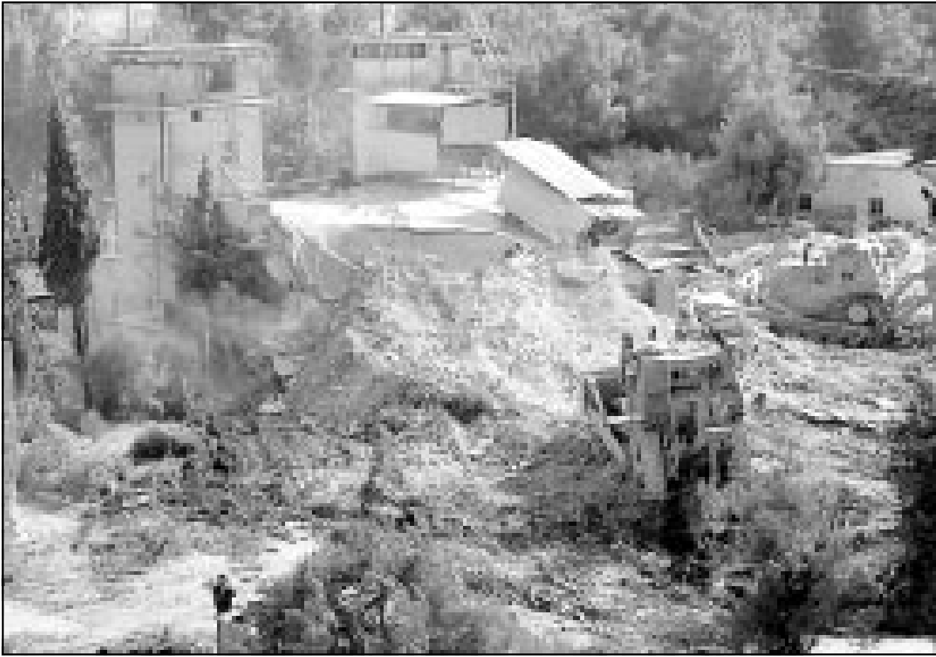
جرفات اسرائيلية تسوي مقر الاذاعة والتلفزيون الفلسطيني الارض امس