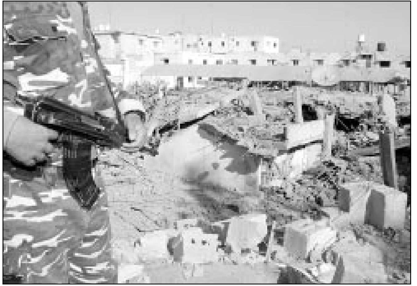
شرطي فلسطيني يتفقد انقاض المقر الرئيسي للشرطة الفلسطينية في غزة بعد تدميره بالقصف الاسرائيلي