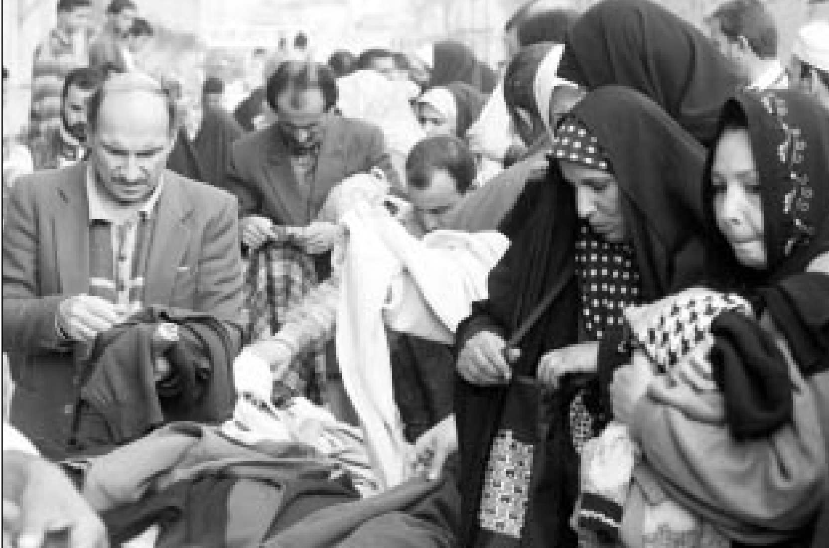
عراقيات يتسوقن من سوق الملابس القديمة استعدادا للعيد

■ دمشق - ق ب: بحضور خبراء بيئة امان انطلقت مؤخرا دورة تدريبية للعاملين ضمن مشروع بنك المعلومات البيئي السوري الأردني اللبناني التي تقيمها وزارة الدولة السورية لشؤون البيئة، ويمثل الخبراء الالمان وزارة البيئة الألمانية وكالة التعاون الألمانية. وترمي الدورة لتدريب العاملين ضمن المشروع على قياس مؤشرات تلوث الهواء والمياه وكيفية تبادل المعلومات بشأن الموارد الحيوية وطرق معالجة المشكلات البيئية المتفاقمة. ويقوم برنامج التدريب على تعليم المعنيين كيفية إدخال البيانات والمعطيات البيئية ضمن إطار معلومات موحدة للدول الثلاث منسجم مع ما تم اقتراحه ضمن الجامعة العربية للمؤشرات البيئية لدى الدول العربية بهدف توحيد هذه المعطيات لتتماشى مع الاستراتيجية العربية في إنشاء السوق العربية المشتركة وبما يتماشى أيضا مع التوجهات العالمية في مجال التجارة والبيئة. ومن المقرر ان تستخدم هذه المؤشرات ضمن الدول الثلاث في إعداد الاستراتيجيات البيئية وخطط التنمية المستدامة. وسيتم تدريب المشاركين على استخدام البرنامج الخاص بإدخال البيانات والمعطيات البيئية ضمن إطار معلومات موحدة تيسر على هذه الدول العناية بالبيئة ضمن رحلة أولية.