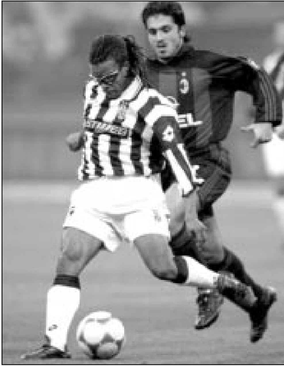
لقطة من إحدى مباريات يوفنتوس