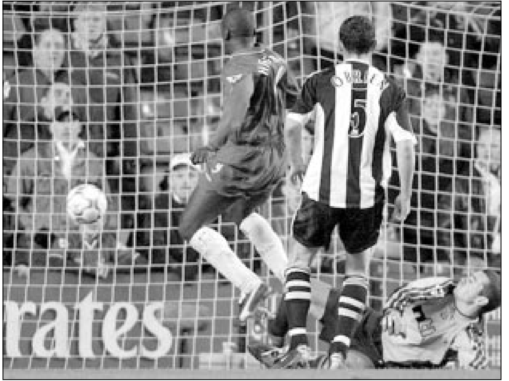
لقطة من إحدى مباريات نيوكاسل

■ براغ - رويترز: عين الاتحاد التشيكي لكرة القدم كاريل بروكتر مدربا للمنتخب الوطني الاول للبلاد خلفا لجوزيف شوفانيتش الذي استقال في نوفمبر تشرين الثاني الماضي بعد فشل البلاد في التأهل لنهائيات كأس العالم المقبلة التي تقام في كوريا الجنوبية واليابان عام 2002. ويعمل بروكتر (62 عاما) حاليا مدربا للمنتخب التشيكي للشباب تحت 21 عاما والذي قاده الى المركز الثاني في البطولة الأوروبية لهذه الفئة العام الماضي. ويتولى بروكتر تدريب المنتخب التشيكي الذي يشعر بخيبة أمل بعد هزيمته امام نظيره البلجيكي في ملحق التصفيات الأوروبية الشهر الماضي. وخسر المنتخب التشيكي بهدف مقابل لا شيء في لقاء الذهاب وبنفس النتيجة في لقاء الاياب.