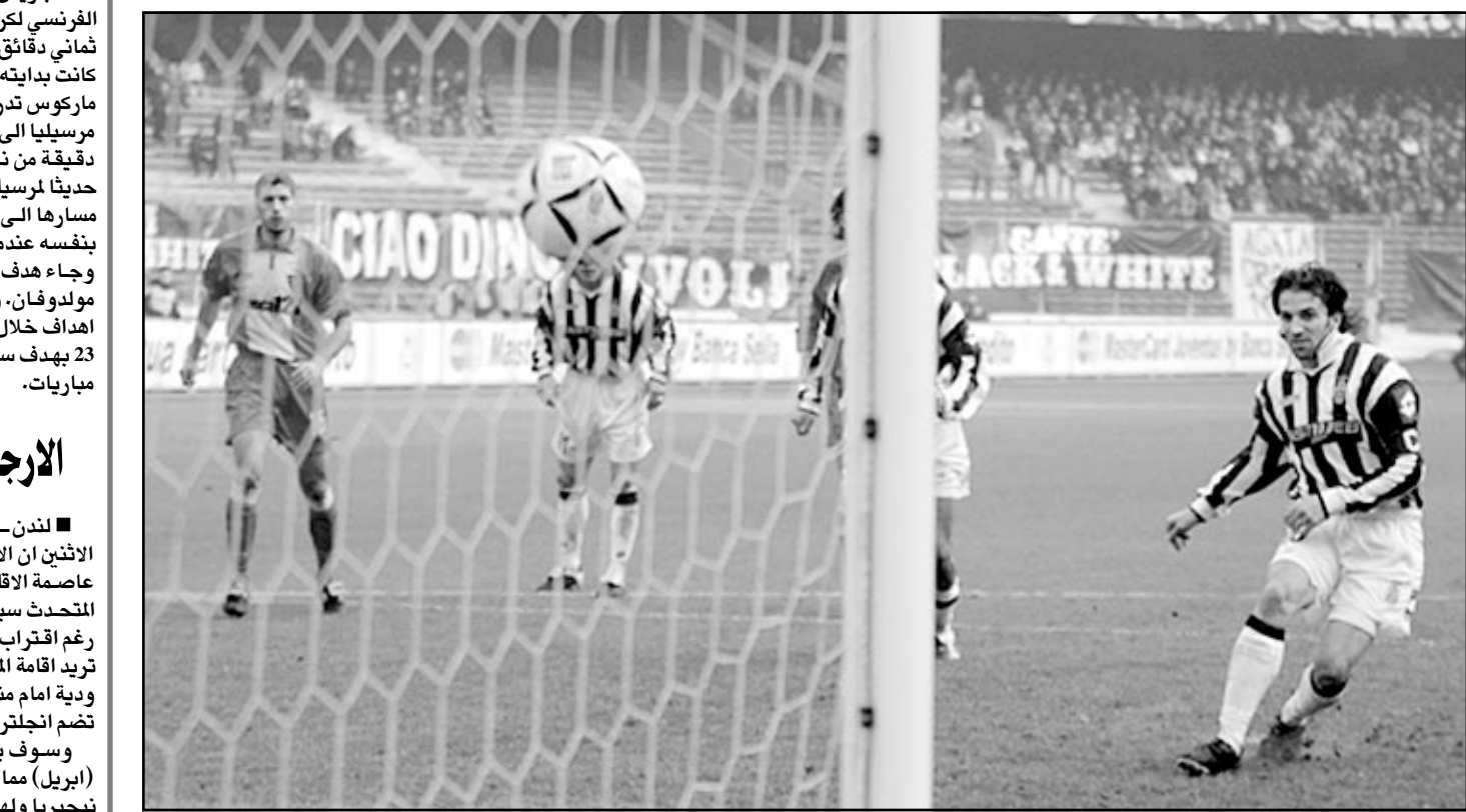
لاعب يوفنتوس اليساندرو دل بييرو يسدد هدفا

■ روما - أف ب: كان يوفنتوس الراج الاكبر في المرحلة الحادية والعشرين من بطولة ايطاليا لكرة القدم لانه لحق بروما واتر ميلان بفوزه السهل على ليتشي في حين اهدر روما نقطتين بتعادله مع فيورنتينا 2 - 2. وكان انتر ميلان سقط في فخ التعادل السلس مع تورينو على ارضه. ويملك روما 44 نقطة مقابل 43 لكل من انتر ميلان ويوفنتوس وبياتسي في المركز الرابع وله 37 نقطة. على ملعب "ارميجيو برانكي، في فلورنسا، قلب روما تخلفه بهدفين نظيفين في الشوط الاول على تعادل 2 - 2 في نهاية المباراة، وتقدم فيورنتينا بهدفه عبر دومينيكو موفيو (15) والبرازيلي اندريانو (17) المعان من انتر ميلان، قبل ان يسجل روما هدفه عبر انطونيو كانانو (58) والبرازيلي اميرسون (76).