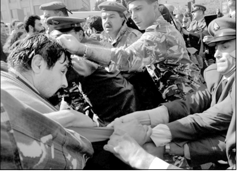
طلاب لبنانيون يشتبكون مع الشرطة خارج مجلس النواب احتجاجا على ضريبة القيمة المضافة

■ بيروت- رويترز: تصاعدت الشرطة اللبنانية امس الاثنين مع مئات الطلاب الذين تظاهروا احتجاجا على فرض ضريبة القيمة المضافة وذلك اثناء مناقشة المجلس النيابي لموازنة عام 2002. وبعرض المظاهرات الذين حاولوا اختراق طوق امني احاطت المداخل المؤدية الى مبنى مجلس النواب بشعارات تدعو الى اسقاط الحكومة ووقف تطبيق الضريبة. واخذ الطلاب الذين حضروا من مختلف فروع الجامعة اللبنانية يرددون الشنديد