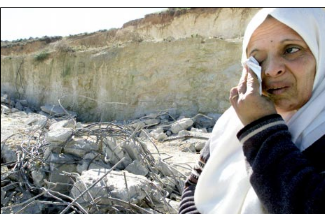
فلسطينية تبكي بجانب انقاض منزلها الذي دمتهه الجرافات الاسرائيلية في مدينة القدس

ورشة الحداثة ذاتها تعرضت لقصف المروحيات العسكرية الإسرائيلية قبل حوالي شهرين. ولم تتمكن طواقم الاطفاء والدفاع المدني من اخماد الحرائق التي اشتعلت في مصنع الاقمشة الملاصق لمصنع الاخشاب شرق مخيم جباليا شمال قطاع غزة الا بعد ست ساعات متواصلة من العمل وسط الدخان الكثيف. كما تضررت العديد من المنازل جراء تطاير شظايا القصف، كذلك شوهت السنة اللهب والدخان من سفاتها بعيدة. وقال مواطنون في مدينة غزة إنهم استيقظوا فجر أمس على دوي انفجارات كبيرة هزت المدينة وأن انفجارات أصيبت بحالة من الخوف والفرح من شدة الانفجارات.