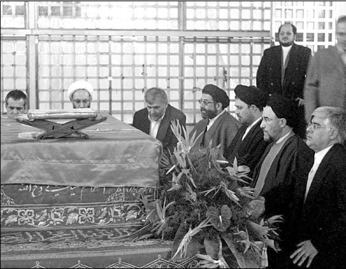
الرئيس الإيراني محمد خاتمي أمام ضريح الامام الخميني في طهران

التيانية في الأراضي الفلسطينية... في غضون ذلك اجتمع السياسيون الألمان على زيادة الاجراءات المعادية للسياسة الإسرائيلية في كتلتهم النيابية في البرلمان الاتحادي «بونديس تاغ» ودواتهم الانتخابية في كافة الأراضي الألمانية، وقال وزير الخارجية الألماني السابق كلاوس كينكل (الحزب الديمقراطي الحر) انه يدرك تغيرا ملحوظا معاديا للسياسة الإسرائيلية في الاوساط الشعبية للمجتمع الألماني، ودعا المسؤول المحافظ لأميرس الى كسر «حجر» اعاق الحكومة الألمانية طويلا من توجيه انتقادات للدولة العبرية، وقال لاميرس في هذا الخصوص اذا كان من الملاحظ زيادة حدة الانتقادات في الكتل النيابية للبرلمان الألماني وفي الاوساط الشعبية للمجتمع، فاننا يجب ان نسال انفسنا عما اذا كان التمسك بهذا «الحرم» صحيحا. وتطرق المسؤول الى تاريخ تأسيس دولة اسرائيل قائلا ان تأسيسها جاء نتيجة فشل السياسة الاندماجية لليهود في المجتمعات الأوروبية في مدى قرابة ألف عام، وان هذه الفترة الزمنية كانت مليئة باضطهاد اليهود في كافة الدول الأوروبية الذي انتهى بارتكاب النازي الألماني الهزلي للمحرقة «الهولوكوست» بحقهم. واضاف «الحكومة الألمانية تتحمل مسؤولية كبيرة بخصوص امن اسرائيل، وسلامة مواطنيها، ولكننا يجب علينا ان نتحمل ايضا المسؤولية عن النتائج التي رافقت تأسيس هذه الدولة كتتهجير الفلسطينيين