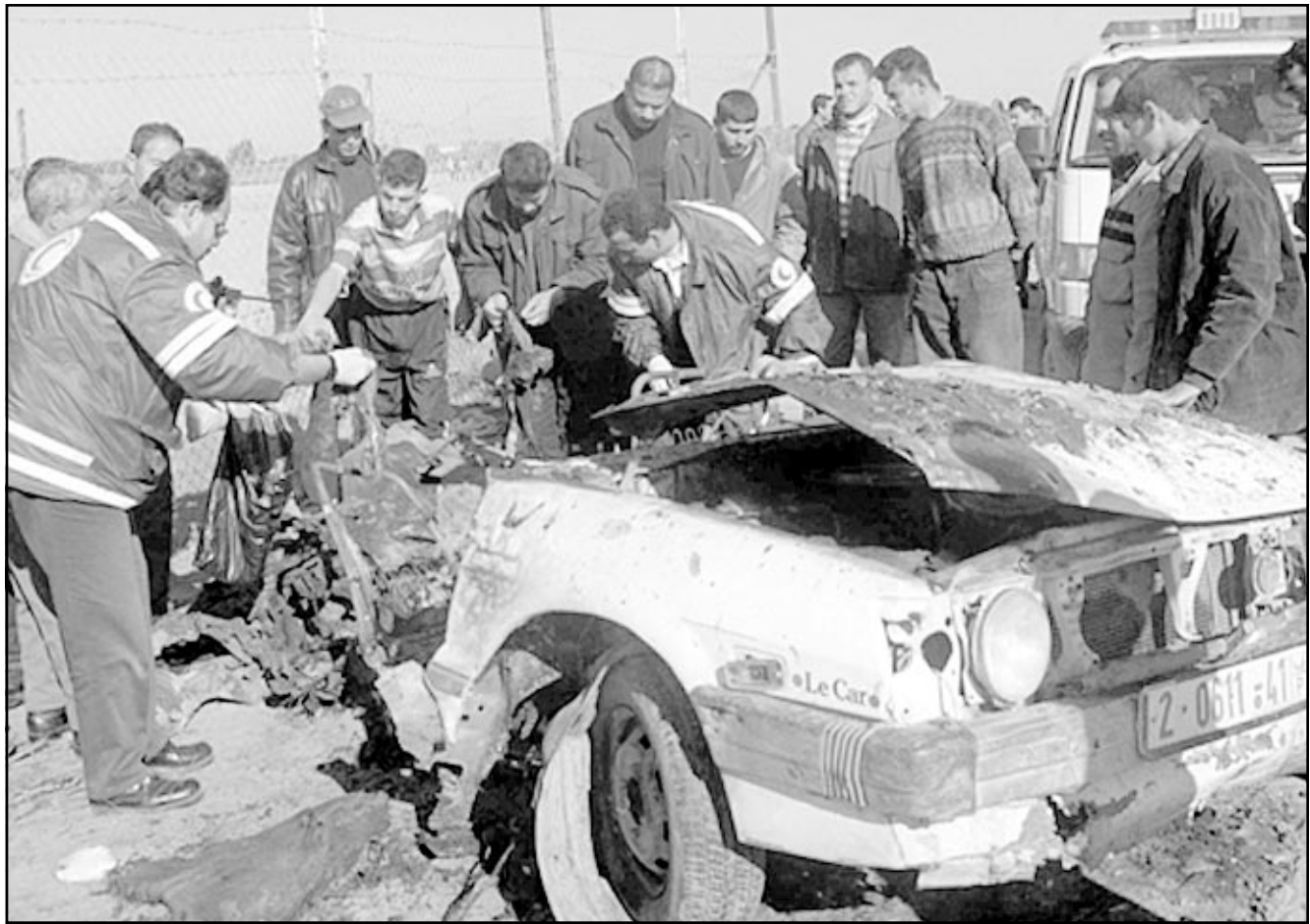
رجال من الهلال الأحمر الفلسطيني يتفقدون بقايا سيارة تعرضت لقصف صاروخي اسرائيلي أدى الى استشهاد خمسة فلسطينيين في رفح

من ناحية أخرى، أعلنت الشرطة الإسرائيلية صباح امس عن قيامها باعتقال ثلاثة فتية من قرية بيت عانوت، منطقة القدس، بحجة أنهم هاجموا سيارات شرطة اسرائيلية بقضبان من الحديد. وقالت الشرطة إنه سيتم تقديم الفتية إلى محكمة عسكرية لتتم محاكمتهم بشكل سريع، وأنها ستقوم بحملة اعتقالات أخرى في القرية في الأيام المقبلة.