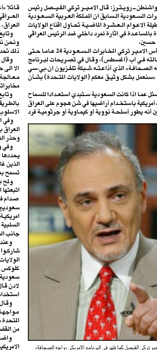
الامير تركي الفيصل كما ظهر في البرنامج الأمريكي «واجه الصحافة»

■ واشنطن - رويترز: قال الامير تركي الفيصل رئيس المخابرات السعودية السابق ان الملكة العربية السعودية ظلت طيلة الاعوام العشرة الماضية تحاول اقناع الولايات المتحدة بالمساعدة في ازالة تمرد داخلي ضد الرئيس العراقي صدام حسين. ورأس الامير تركي المخابرات السعودية 24 عاما حتى استقالته في اب (اغسطس). وقال في تصريحات لبرنامج «واجه الصحافة» الذي اذاعته شبكة تلفزيون ان.بي.سي الاحد «سنعمل بشكل وثيق معكم (الولايات المتحدة) بشأن ذلك». وسئل عما اذا كانت السعودية ستبدي استعدادا للسلامح ل قوات امريكية باستخدام اراضيها في شن هجوم على العراق اذا تبين ان بطور اسلحة نووية او كيميوية او جراثيمية فرد