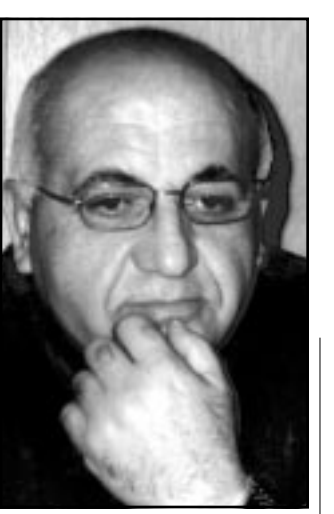
سلمان تاوور (القدس العربي)