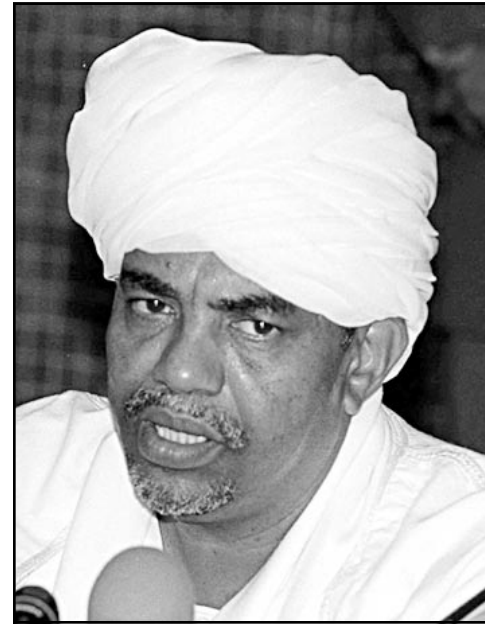
الرئيس عمر البشير

حكومة الخرطوم لأمريكا في اطار حملة مكافحة الارهاب وتقرح الورقة الامريكية ايضا التعامل مع الحكومة السودانية حكومة امر واقع وقيام تنظيمين في الشمال والجنوب في دولة كوتفدالية واحدة وتوحيد الفصائل الجنوبية لقيام الدولة الكونفدرالية وتنص الورقة على ان التجمع المعارض ليس طرفا في هذا السياق وابعاد مناقشة شكل الحكم وعلاقة الدين بالدولة او حق تقرير المصير بجنوب السودان. وتنادي الورقة الامريكية بشروع مفاوضات مع شريكات الارهاب جنوب السودان في وضع الترتيبات العسكرية والادارية عبر اجتماعات مباشرة معقمة لتطبيق الكونفدرالية في السودان.