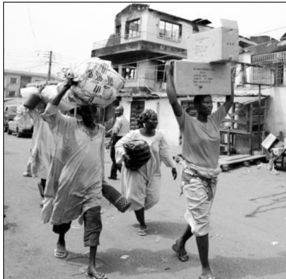
تجيبون يغرون من منازل خشبية اعمال العنف القبلي في لاغوس

■ لاغوس- ا ف ب: افادت حصيلة جديدة اعطاها أمس الاثنتين الصليب الاحمر النيجيري ان المواجهات العرقية الدائرة منذ السبت بين اثنتي الهانوسا واليوروبا في لاغوس اسفرت عن سقوط 55 قتيلا واصابة اكثر من 200 جريح. وكانت حصيلة سابقة وضعها صحافي من وكالة فرانس برس ومصادر طبية الاحد تحدثت عن 21 قتيلا في هذه المواجهات. واكد مراسل وكالة فرانس برس ان آلاف الاشخاص فروا أمس الاثنتين من المدينة فيما احصى الصليب الاحمر اصابة 57 شخصا بجروح بالغة معظمهم اصيبوا بالهراوات والرصاص. وأشار رئيس الصليب الاحمر النيجيري ايمانويل ايجويري الى ان الحصيلة قد ترتفع لان العاملين مع