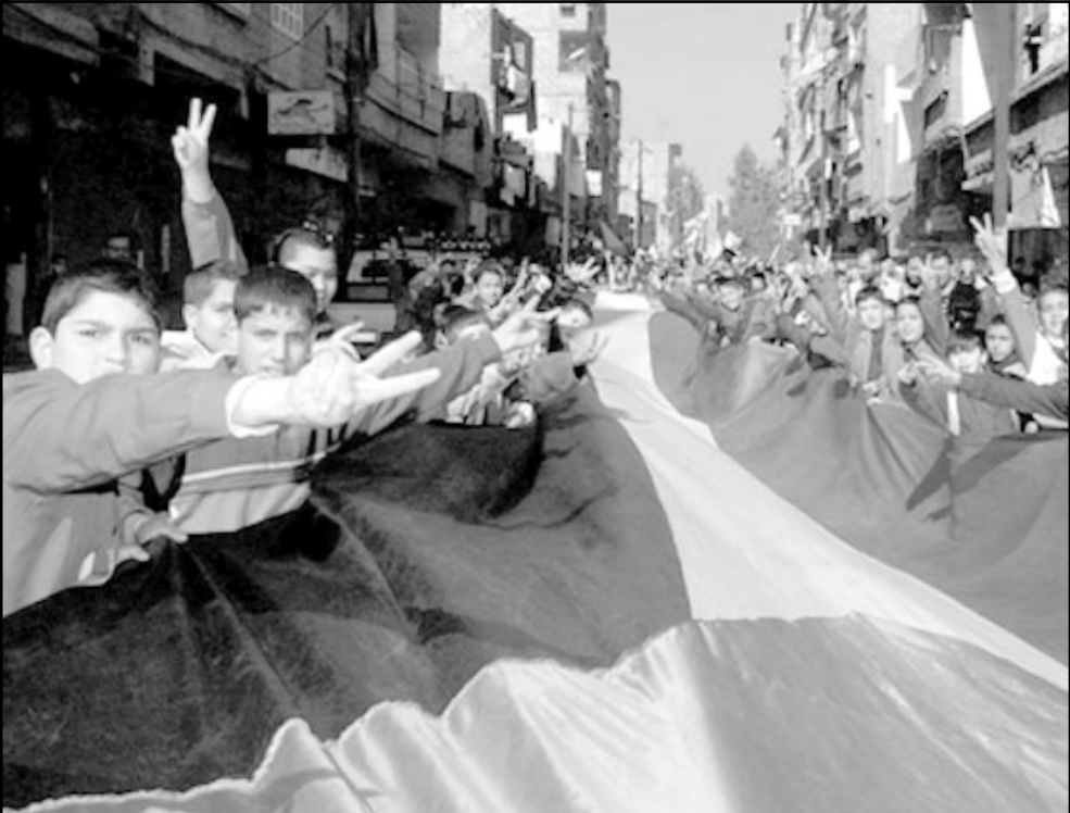
اطفال فلسطينيون يحملون علما فلسطينيا ضخما اثناء تظاهرة دعماً للانتفاضة في دمشق

■ القدس- موسكو - «القدس العربي» - اف ب: قالت مصادر اعلامية اسرائيلية اسمن ان مسؤولاً كبيراً في جهاز الموساد الاسرائيلي اعرب عن اعتقاده بأنه على ضوء التطورات العالية بعد 11 ايلول (سبتمبر) اصبح الرئيس السوري بشار الاسد أكثر انفتاحاً لاجراء مفاوضات مع اسرائيل. وقالت صحيفة «معاريف» الاسرائيلية التي اوردت هذا الخبر وحسب المسؤول المذكور ان القيادة السورية اصبحت معنية بالظهور كقوة منافضة للارهاب واذا اقتنع الامم المتحدة التي صدقت على الانسحاب الاسرائيلي من جنوب لبنان باعتبارها كاملاً تعبيراً عن مزاج شعب اراض سورية احتلتها اسرائيل عام 1967.