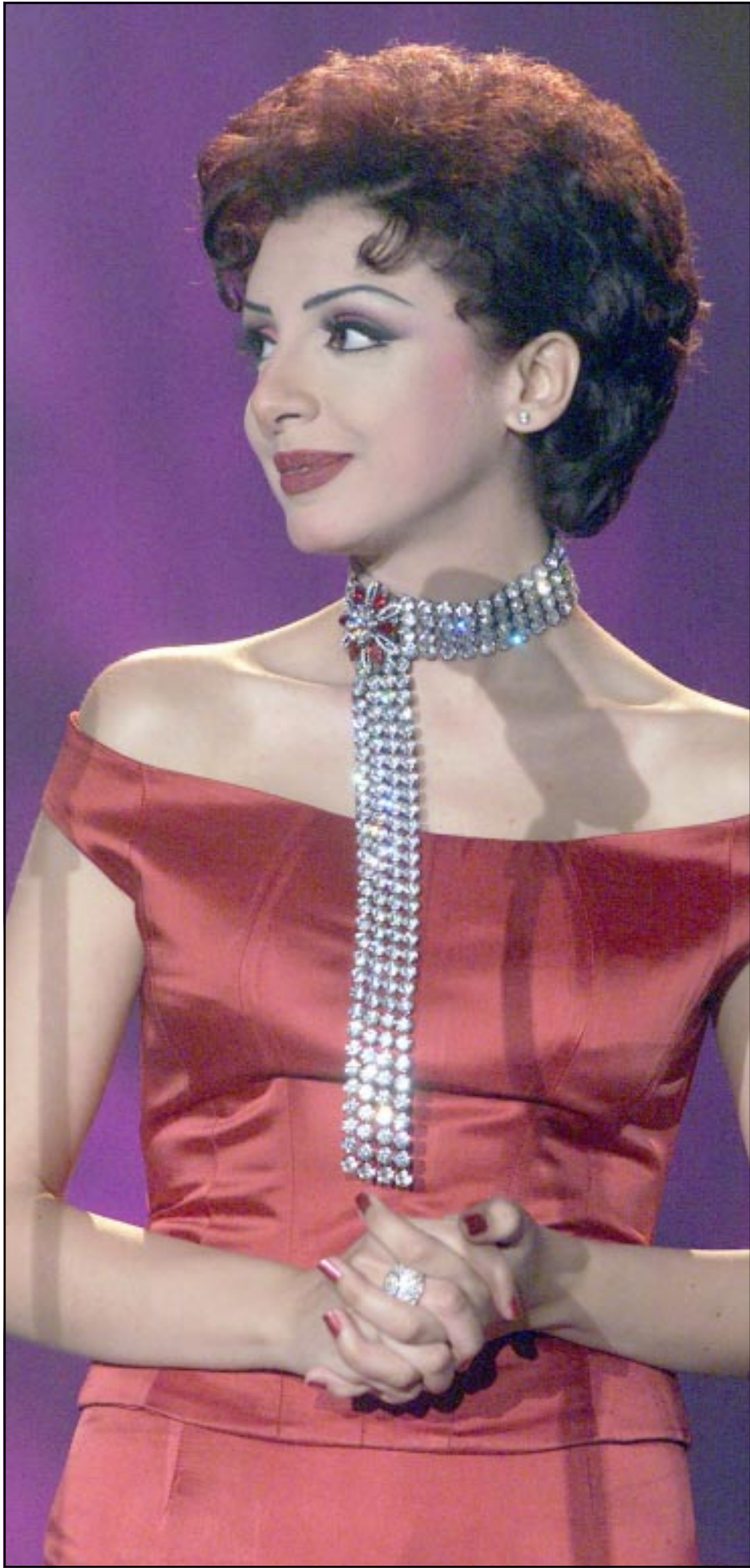
الغنية المصرية انغام أثناء مشاركتها في مهرجان الافنية الثالث في الدوحة يوم الأحد الماضي

لندن - «القدس العربي»: تقدم فنانة المقام العراقي «فريدة» وصلات من هذا الفن الغنائي العراقي المتميز من على قاعة «كوين اليزابيث هول» في لندن يوم السبت القادم. وقد اختيرت فريدة سيدة المقام العراقي من بين افضل اربعة عشر فنانا عالميا للصعود على خشبة عرض ويمكس Womex الدولي بروتيرام (بمناشة المعدل لمهرجان كان السينمائي في الموسيقى) وصنفت خلال عام 2001 ضمن العشرة الاوائل في مجال موسيقى الشعوب من طرف مجلة Songines ذات المرجعية العالمية. وحضر حفلاتها في اوروي وامريكا العام الماضي اكثر من ثلاثين الف متفرج من مشارب واتنماءات ثقافية متعددة. هذه الجاذبية والنجاح المستمر اوصل فريدة الى مسرح Theatre de la Ville الباريسي العريق الاسبوع الماضي امام اكثر من الف ومئتي متفرج جلمهم فرسبون. وتبدأ فريدة المقيبة بصوت النهرين وفرقتها التي تتألف من صفوة العازفين على العود، السانطور، القانون، الرق، الذف والطبلة بقيادة محمد قمر جولة العام الجديد من بلغاست - ايرلندا الشمالية - (الخميس 7 بقاعة Ancuturiam) وديبلن (الجمعة 8 Vicar Street). وتكون المحطة الاخيرة في لندن بقاعة Queen Elizabeth Hall يوم السبت التاسع من شباط (فبراير) على الساعة السابعة وخمس واربعين دقيقة. - اقرب محطة اتفانق: Embankment - Waterloo 02079604242 - لل حجز والمعلومات: خالد فؤاد شريف - او زيارة موقع الفرقة على الانترنت: www.faridamaqam.com