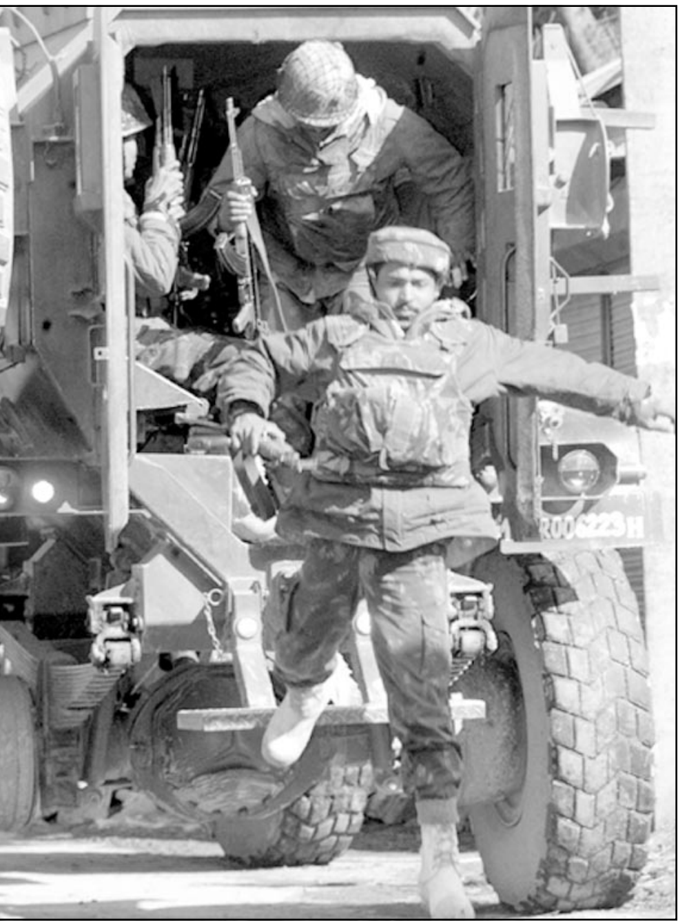
جنود هنود يندفعون نحو المسجد المحاصر في بلدة سوبور بكشمير أمس

وقبقت قوات الامن الهندية أمس الاثنتين ستة ثوار في اشتباكات بكشمير وشددت الحصار حول مسجد يعتقد ان اثنين آخرين من المتشددين يختبئان داخله. وقالت الشرطة في بيان ان اربعة ثوار قتلوا في اشتباكات بشمال غرب سريناجار العاصمة الصيفية لولاية جامو وكشمير. وقال المتحدث باسم الشرطة ان اثنين آخرين احدهما قائد لجماعة حزب المجاهدين الانفصالية قتل في اشتباكات بمنطقة قريبة. وشددت الشرطة ايضا الحصار حول مسجد في شمال كشمير حيث يعتقد ان اثنين على الاقل من الثوار يختبئان داخله. وتسلل الاثنان المشتبه بهما الاقدم الى المسجد عندما كانت الشرطة تقيم عمليات بحث قرب بلدة سوبور شمالي سريناجار. وقال مسؤول بالشرطة «شددت قوات الامن حصارها حول المسجد، وجهنا نداءات عدة للمتشددين للاستسلام لكن الحصار مستمر حتى الآن».