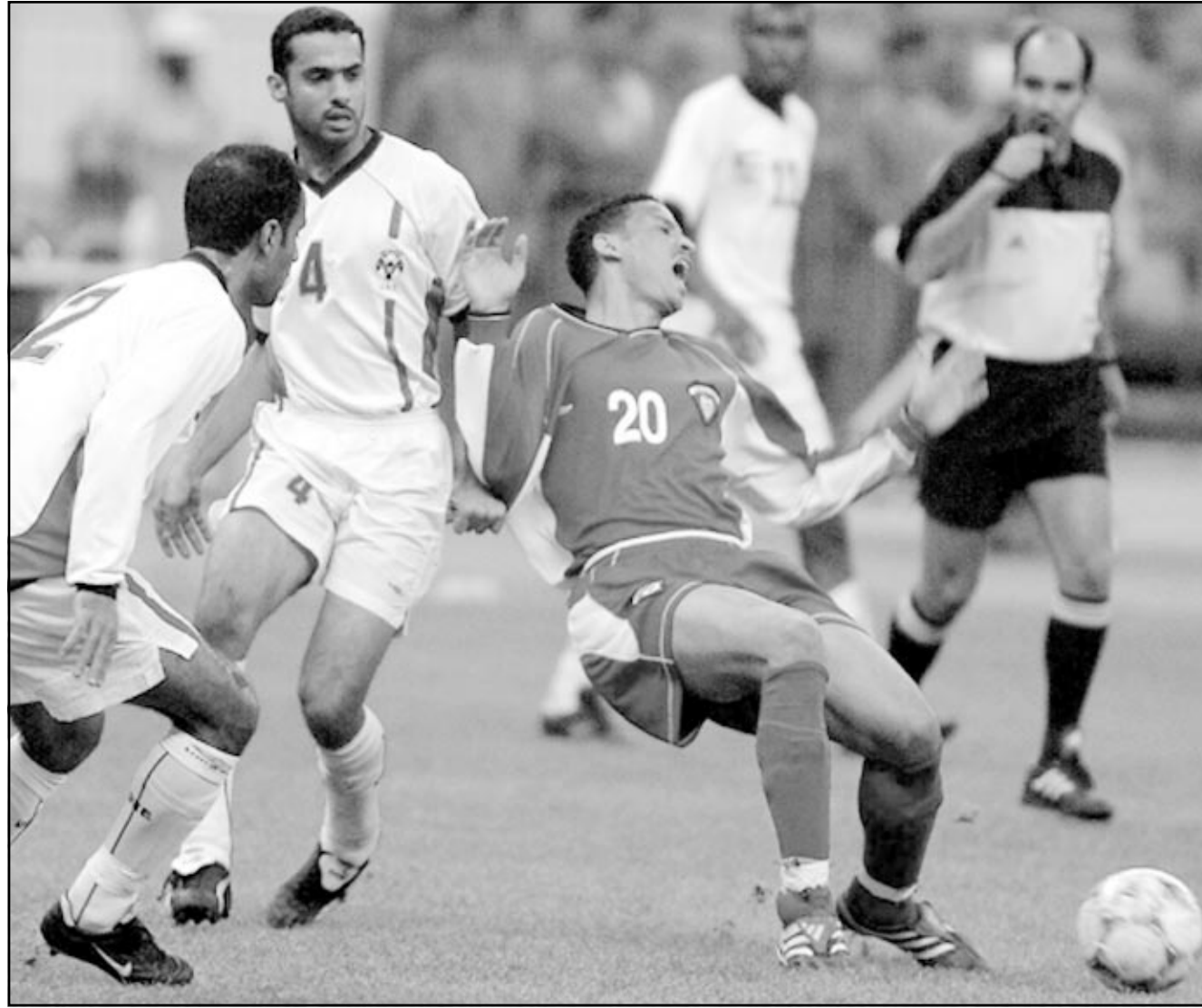
لقطة من إحدى مباريات منتخب الامارات ضمن دورة كأس الخليج

فندق الضيافة البعيد نسبياً عن مركز العاصمة . ومن المرجح ان يكون الدخول الى مباريات البطولة ميجاناً من أجل مضاعفة فرص حضور جماهير كبير يعكس ولو ظاهرياً عودة الثقة بين الشوارع الكروي الاماراتي وممثلي الكرة