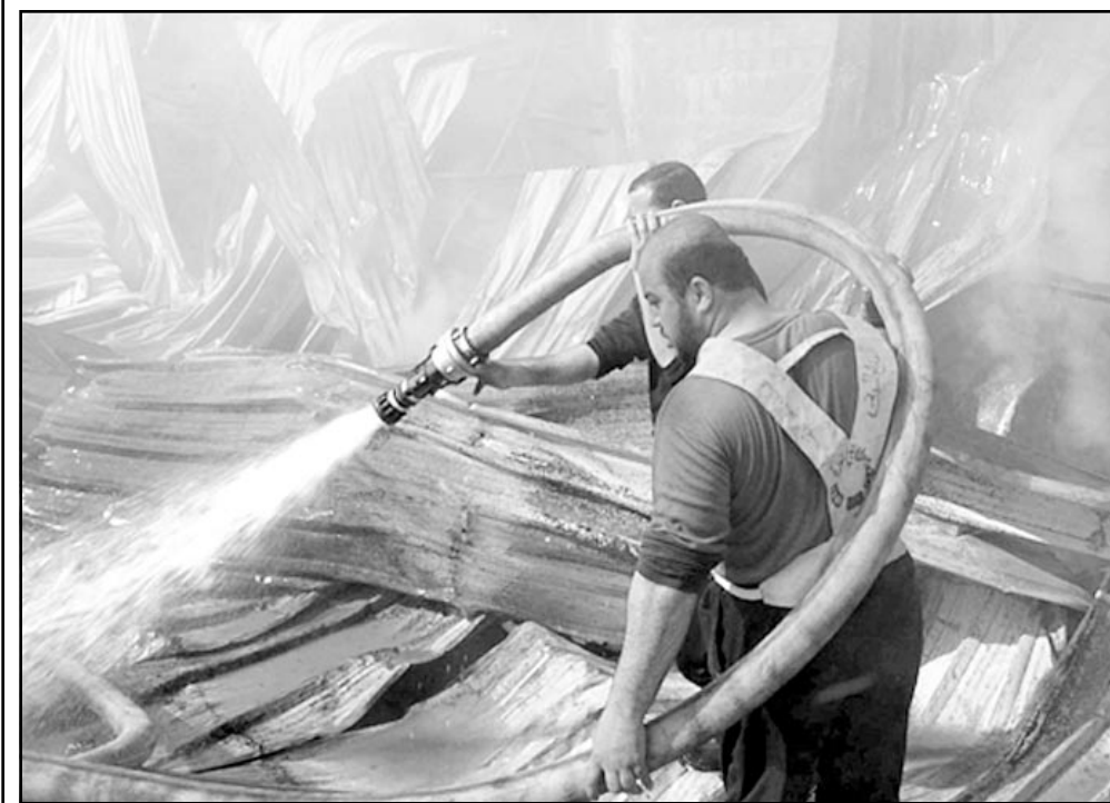
رجال الاطفاء يحاولون ايقاف مصنع للمعمن في جباليا بعد تعرضه للقصف