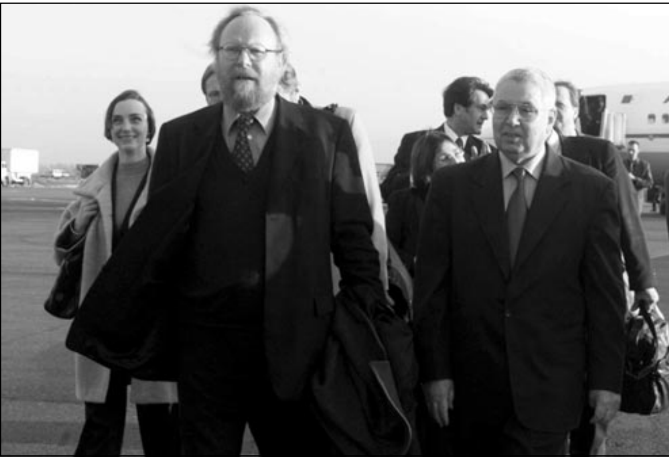
رئيس البرلمان الألماني فولفغانغ تييرسي (يسار) لدى وصوله للجزائر يوم الأحد حيث كان في استقباله نظيره عبد القادر بن صالح

الرياض - القدس العربي - اف ب: غادر العاهل المغربي الملك محمد السادس جدة غرب السعودية أمس الاثنين في ختام زيارة استغرقت يومين أجرى خلالها محادثات مع الملك السعودي الملك فهد بن عبد العزيز تناولت الأوضاع الراهنة في العالم وخصوصا الوضع في الأراضي الفلسطينية. وقد أدى العاهل المغربي مناسك العمرة يوم الأحد في مكة المكرمة (غرب)، قبل أن يغادر جدة أمس متوجها إلى الصين التي سيوزورها للمرة الأولى منذ اعتلائه عرش المغرب في تموز (يوليو) 1999. وكان العاهل المغربي والملك فهد بحثا السبت في «مجمع الأوضاع الراهنة على الساحات العربية والإسلامية والدولية وبخاصة قضية