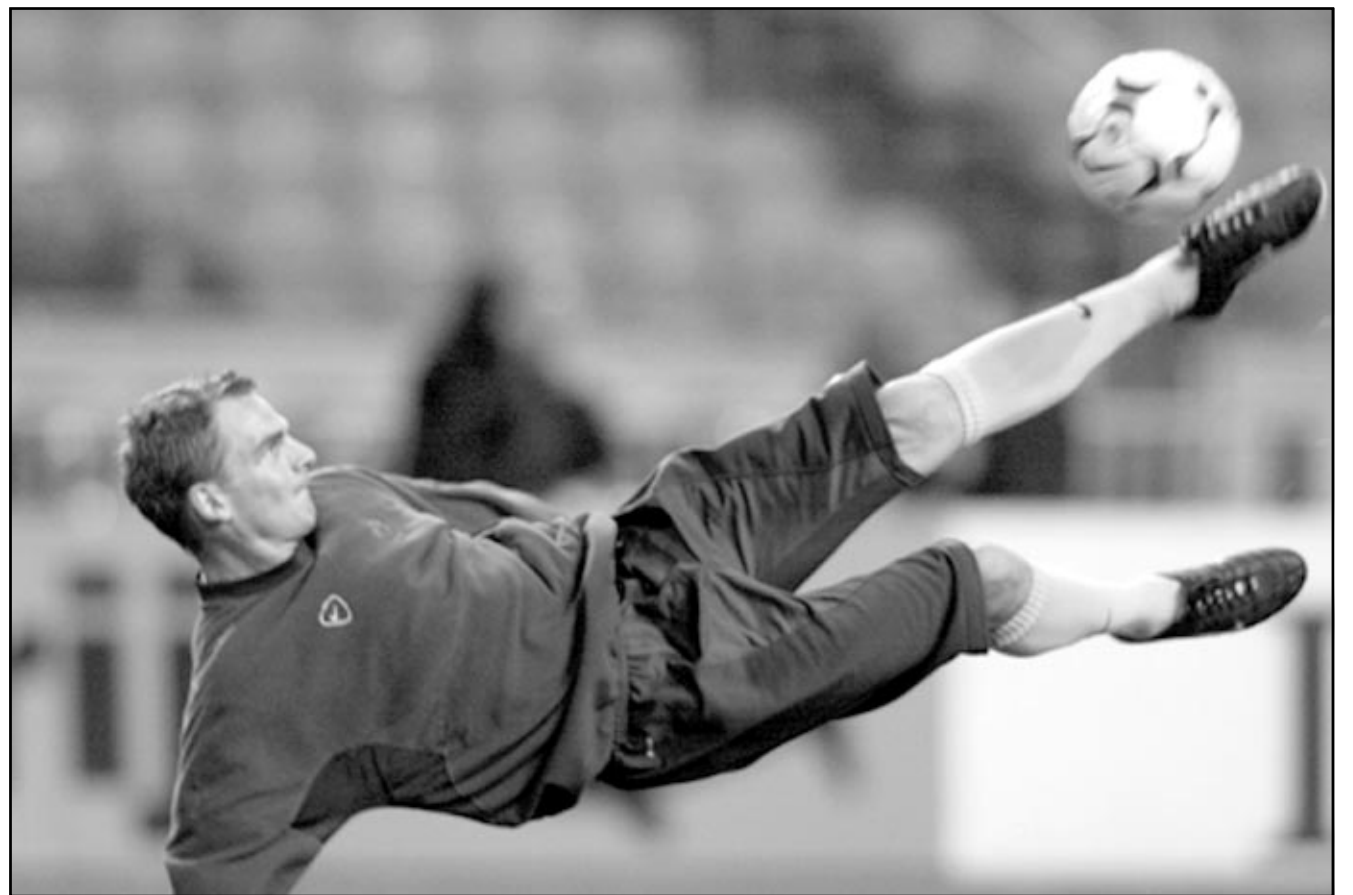
البلندي فرانك ديبيير لاعب برشلونه الهولندي في حركة استعراضية خلال التدريب قبل لقاء منتخب هولندا وانكلترا الودي اليوم في امستردام