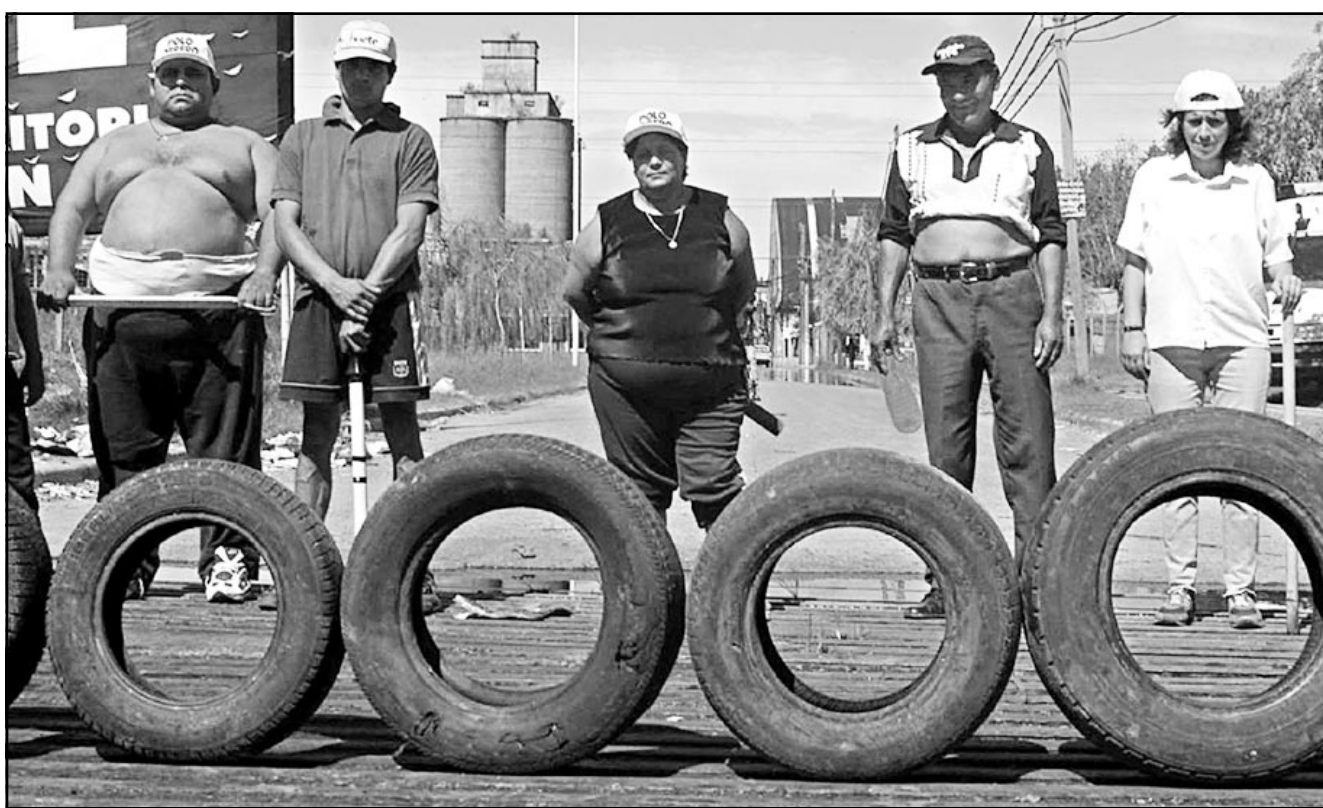
متظاهرون عند حاجز أسد الطريق المؤدي إلى مصفاة سود القربية من العاصمة الأردنية بوش ايرس

■ لندن - رويترز: قال بنك انكلترا امس الاربعاء انه يتوقع ان يظل التضخم تحت السيطرة مخففا من مخاوف احتمالات رفع سعر الفائدة في وقت قريب لوضع حد لارتفاع الاسعار. وتوقع البنك المركزي في تقريره ربع السنوي عن التضخم ان يبلغ معدل التضخم دون ادراج تكاليف قروض الاسكان نحو اثنين في المئة هذا العام وان يرتفع تقريبا من المستوى الذي تستهدفه الحكومة عند 2,5 في المئة. وصدر التقرير في اعقاب بيانات مفاجئة صدرت يوم الثلاثاء اظهرت ارتفاع اسعار تكاليف قروض الاسكان بنسبة 2,6 في المئة من 1,9 في المئة في كانون الاول (ديسمبر) الماضي وهي المرة الاولى التي يرتفع فيها عن المستوى المستهدف منذ آب (اغسطس) عام 2001. لكن ميرفين كينغ نائب محافظ البنك المركزي اكد ان تحركات اسعار تكاليف قروض الاسكان من المتوقع ان تشهد اضطرابات في الاجل القصير. وتبلغ اسعار الفائدة البريطانية حاليا ادنى مستوياتها منذ 38 عاما عند اربعة في المئة لكن اسواق المال تتوقع ان ترتفع الى 5,25 في المئة بحلول نهاية هذا العام مع بدء الانتعاش الاقتصادي بعد تباطؤ الاقتصاد العالمي في العام الماضي. وتراجع سعر الجنيه الاسترليني عن اعلى مستوياته منذ ثلاثة اسابيع امام الدولار مسجلا 1,4340 دولار بعد صدور تقرير البنك المركزي. وكان الاسترليني قد ارتفع الثلاثاء بعد صدور بيانات اسعار تكاليف قروض الاسكان.