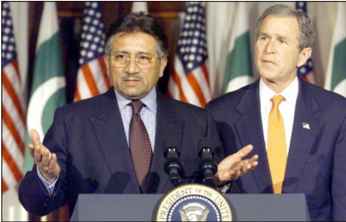
الرئيسان الامريكي والباكستاني أثناء مؤتمرهما الصحافي في واشنطن امس (اف ب)

هددت الولايات المتحدة، وقال بوش في المؤتمر الصحافي «اعتقد ان من اسوأ ما يمكن ان يحدث في دول العالم ان تتعاون دول تطورات اهابية مع دول لها تاريخ سيئ ودول تطور اسلحة الدمار الشامل، واستطرد قائلا «سنستخذ الاجراء الضروري فاعا عن الشعب الامريكي اذا احتجنا الى ذلك». وقال وزير الخارجية التركي اسماعيل جم اس ان تركيا فعلت كل ما بوسعها لاتقاء العراق بالاذعان لمطالب الامم المتحدة لكنه حذر من «سيناريوهات يوم القيامة» التي يجري الحديث عنها اذا اندلعت حرب على حدود بلاده. وقال ان الرد الذي حصل عليه لم يظهر أي مؤشر على حل وسط وان كان قال الثلاثاء ان بغداد ربما كانت تلوح الان في انها قد توافق من اجل تجنب ضربات امريكية، وقال جم لرويترز في مقابلة «اعتقد انها قلنا بواجبنا، تحدثنا الى نظرائنا بصراحة تامة كعادتنا وجيرانا وحثناهم على الالتزام بقرارات الامم المتحدة». واضاف «اعتقد اننا اعطينا جميع الرسائل اللازمة». وسوف تواجه تركيا التي تخشى ان يضر اي عمل عسكري في العراق في نهاية الامر