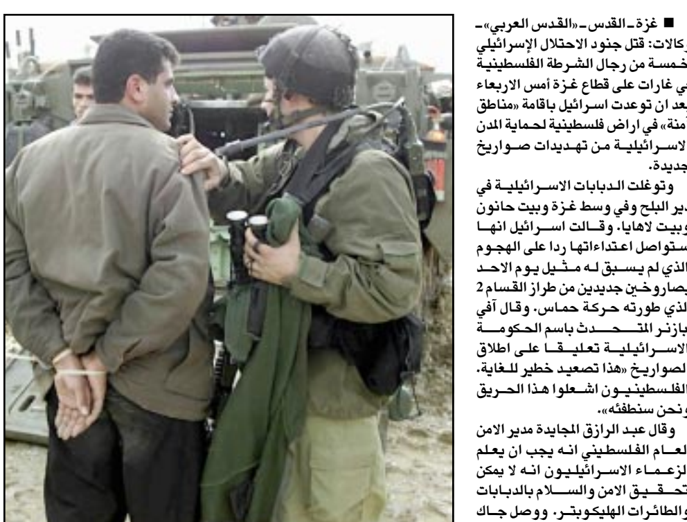
جندي اسرائيلي يعقل شابا فلسطينيا على مدخل قطاع غزة

غزة - القدس - «القدس العربي» - وكالات: قتل جنود الاحتلال الاسرائيلي خمسة من رجال الشرطة الفلسطينية في غارات على قطاع غزة امس الاربعاء بعد ان توعدت اسرائيل باقامة مناطق في اراض فلسطينية لحماية المدن الاسرائيلية من تهديدات صواريخ جديدة. ووثقت الدبابات الاسرائيلية في دير البلح وفي وسط غزة وبيت حانون وبيت لاهايا، وقالت اسرائيل انها ستواصل اعتداءاتها ردا على الهجوم الذي لم يسبق له مثيل يوم الاحد بصرار وخين جديدين من طراز القسام 2 الذي طورت حركة حماس، وقال أفني بارزني المتحدث باسم الحكومة الاسرائيلية تعليقا على اطلاق الصواريخ «هذا تصعيد خطير للغاية. الفلسطينيون اسلحوا هذا الحريق ونحن سنطهله». وقال عبد الرازق المجيدة مدير الامن العام الفلسطيني انه يجب ان يعلم الزعماء الاسرائيليون انه لا يمكن تصديق الامن والسلام الابدانيات والطائرات الهليكوبتر، ووصل جاك سترو وزير الخارجية البريطاني الى الأراضي المحتلة امس، لكنه حمل مسبقا الفلسطينيين مسؤولا عن اندلاع العنف. وقال سترو في مؤتمر صحافي عقب محادثات مع نظيره الاسرائيلي شمعون بيريس في القدس مهما كان التاريخ الحديث والتاريخ الابعد قانا واضح وكلنا في الحكومة البريطانية واضعون فيما يتعلق بالخطوات الاولى التي يتعين اتخاذها وهي ان تجعل حياة شعب اسرائيل اكثر امانا، وهذا يعني اتخاذ اجراء صارمة ضد الارهاب الذي يأتى من الاراضي المحتلة».