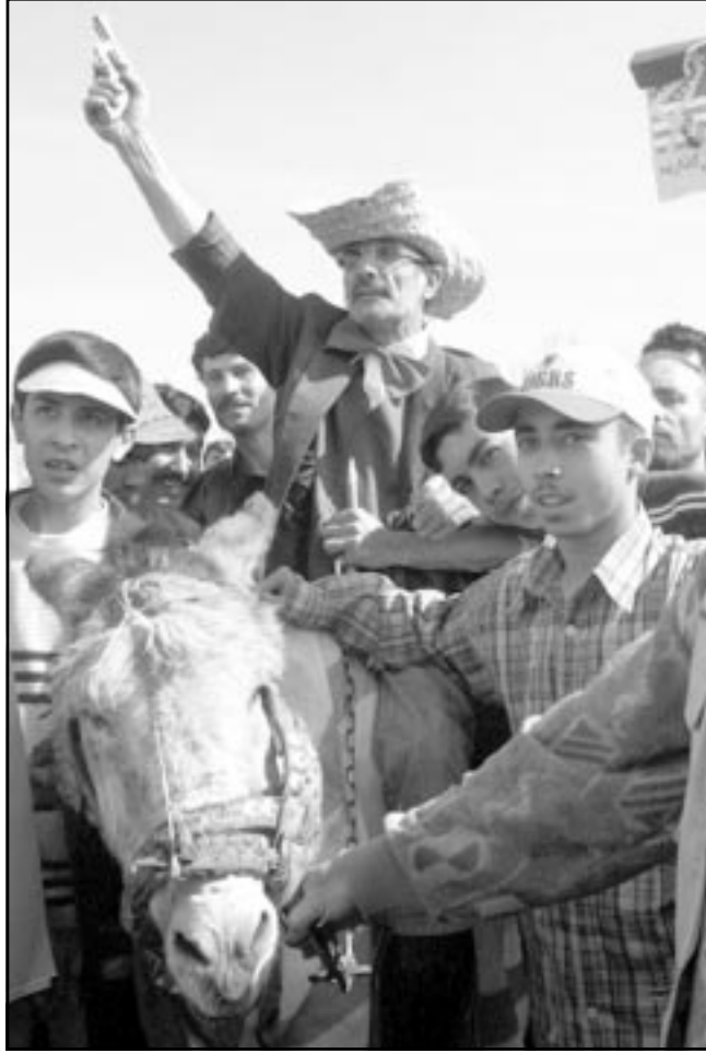
ايراني يحمل مسدسا مزيفا، وبزي كاوبوي امريكي اثناء مسيرة في طهران في الذكرى الثالثة والعشرين لانتصار الثورة الاسلامية الايرانية

جهودها لشراء سلاح الابادة الجماعية. لقد كان من الصعب في واشنطن تمييز الخطر الأكبر الذي يلوح من ايران: فهل هو الاشياء بتقديرها الدعم لبقايا تنظيم القاعدة كما ادعت الـ سي.آي.ايه وقبول بغضب ايراني، أم ان هذا التهديد يتمثل في بيع السلاح للفلسطينيين؟ أم ان تطوير اجهزة سلاح متطورة هو الذي يدفع واشنطن لاعتبار ايران دولة خطيرة؟