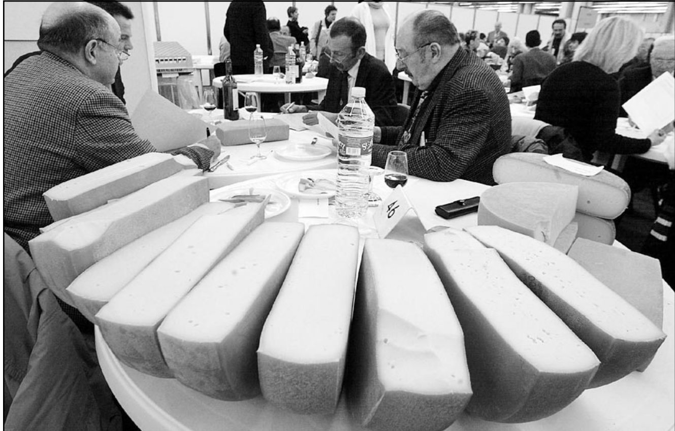
لجنة القضاة المكلفة باختيار افضل نوع من الاجبان العروضة في المعرض الزراعي الدولي في باريس الذي افتتح أمس الاثنين

وبين اسباب التباطؤ، يورد الخبراء اداء تراجعياً في الصادرات الصينية، لا سيما في حجم الصادرات الى الولايات المتحدة واليابان.