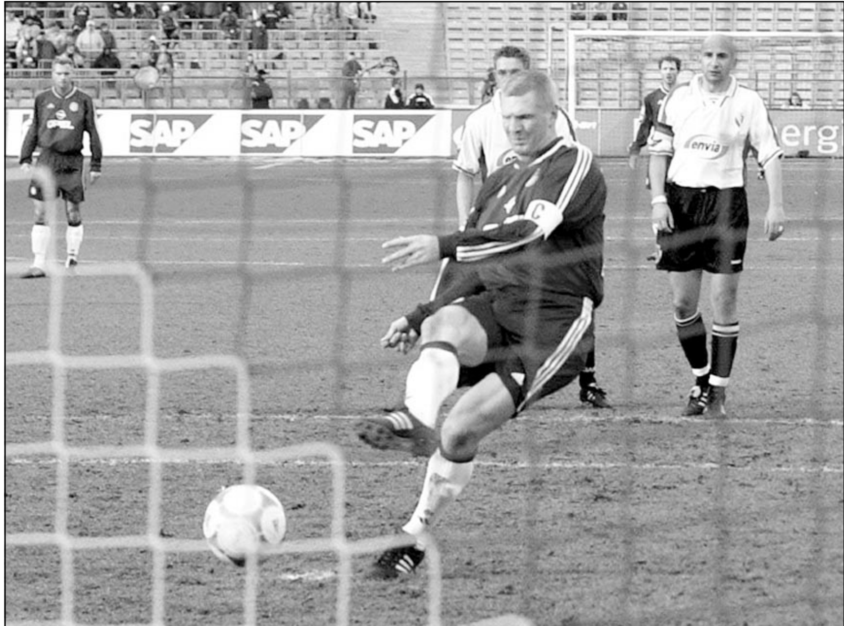
... وأخرى من إحدى مباريات بايرن ميونخ (صور من الأرشيف)