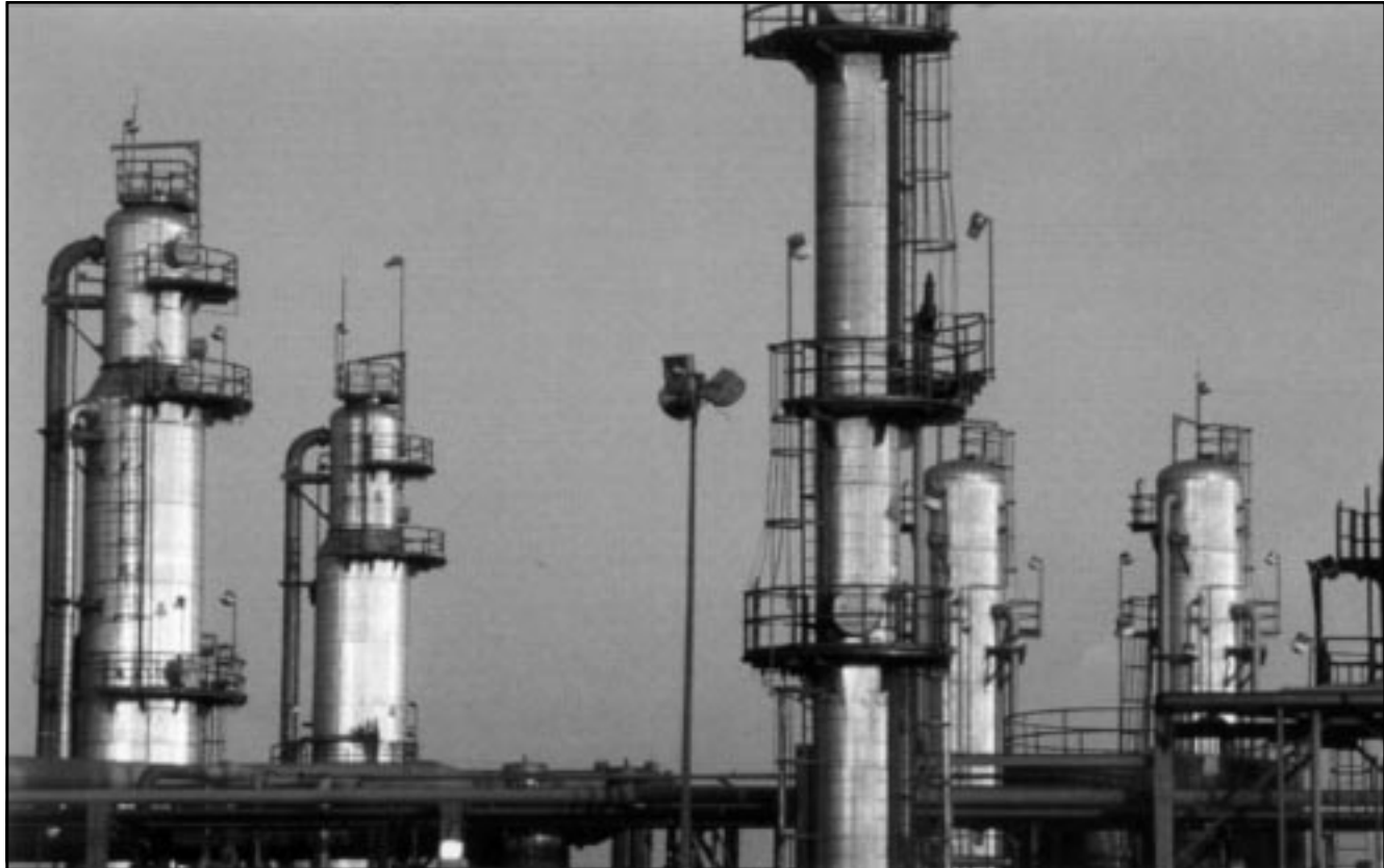
أحدى منشآت شركة بريتش غاز البريطانية في تونس