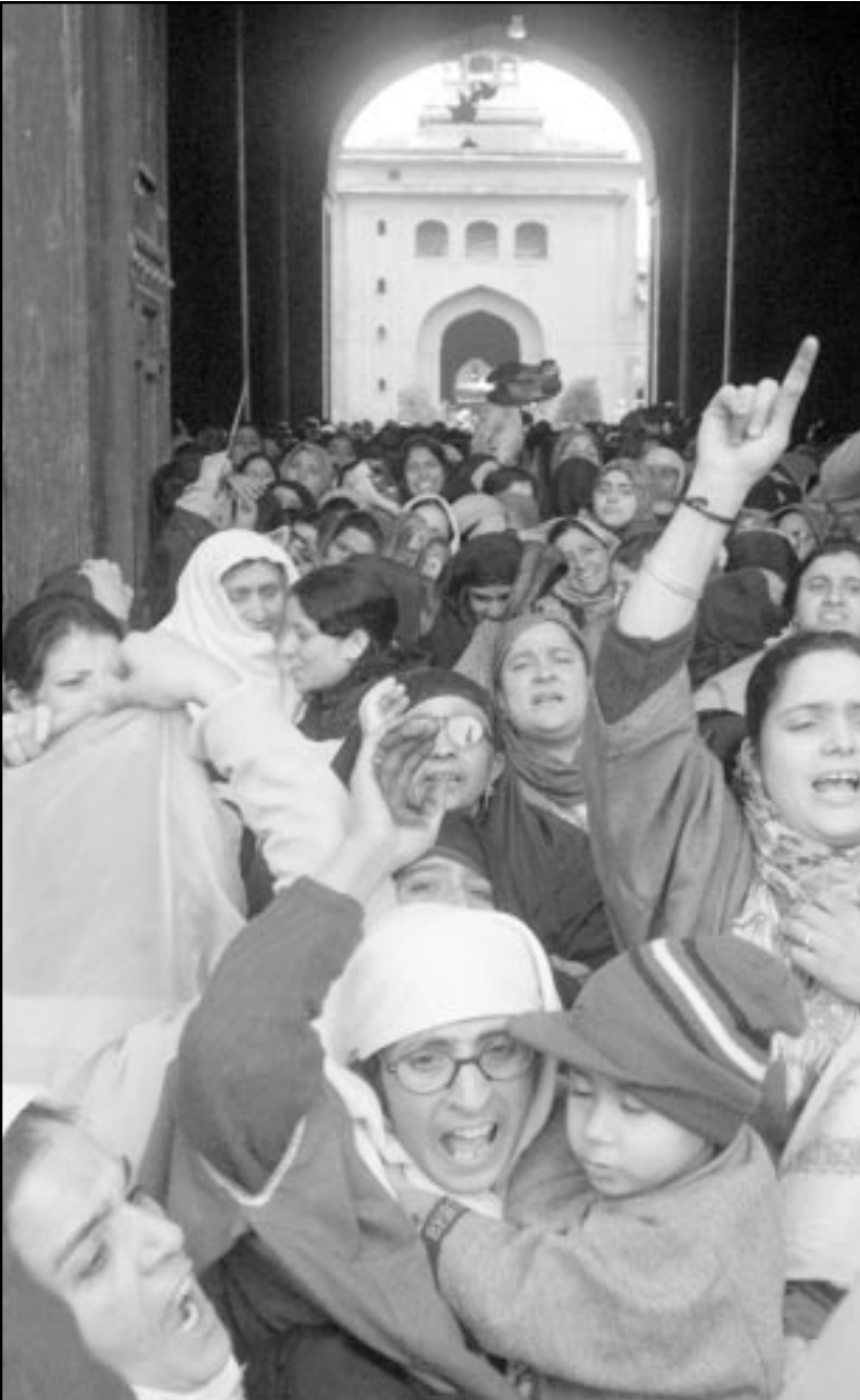
سيدات كشميريات يتظاهرن ضد الاحتلال الهندي في سرينغار

بمفردها تقريبا حماس العديد من الدول الاعضاء فيما يبدو لتوسعة نطاق الحلف. ويرى جورج روبرتسون امين عام الحلف الذي دافع بلا كلل عن جدوى وجوده في مواجهة المنتقدين على مدى الاشهر الخمسة الماضية ان قمة براغ فرصة مناسبة لتكليف الحلف لمواجهة التحديات المنصبة في تهديدات مثل المتشددين الاسلاميين الذين تلقى على عاتقهم مسؤولية هجمات 11 سبتمبر. وقال في كلمة القاها حددته الدول التسع عشرة الاعضاء الحاليين في الحلف حتى اللحظة الاخيرة كما حدث في عام 1997 عندما فتح الحلف ابوابه لأول مرة امام ثلاث دول من الاعضاء البارزين في حلف وارسو الذي كان يقوده الاتحاد السوفيتي في عهد الحرب الباردة. وعلى عكس ما كان عليه الوضع قبل خمس سنوات لم تعد هناك مناقشات عاصفة في الولايات المتحدة اكير قوى الحلف بشأن الحكمة من مد عضواته الامنية وتشجيع تنمية الروسية. فشن واشنطن «حربا ضد الارهاب» عقب هجمات 11 سبتمبر جعلها اكثر حرصا على الدخول في تحالفات جديدة. ومع ميل الرئيس الروسي فلاديمير بوتين للتحالف مع الغرب لم تعد هناك لهجة حادة معادية للحلف بل شأنها التأثير على مناقشات التوسعة رغم ان ضم دول من منطقة البلطيق من شأنه ادخال الحلف مباشرة الى اراضي الاتحاد السوفيتي السابق ذاتها.