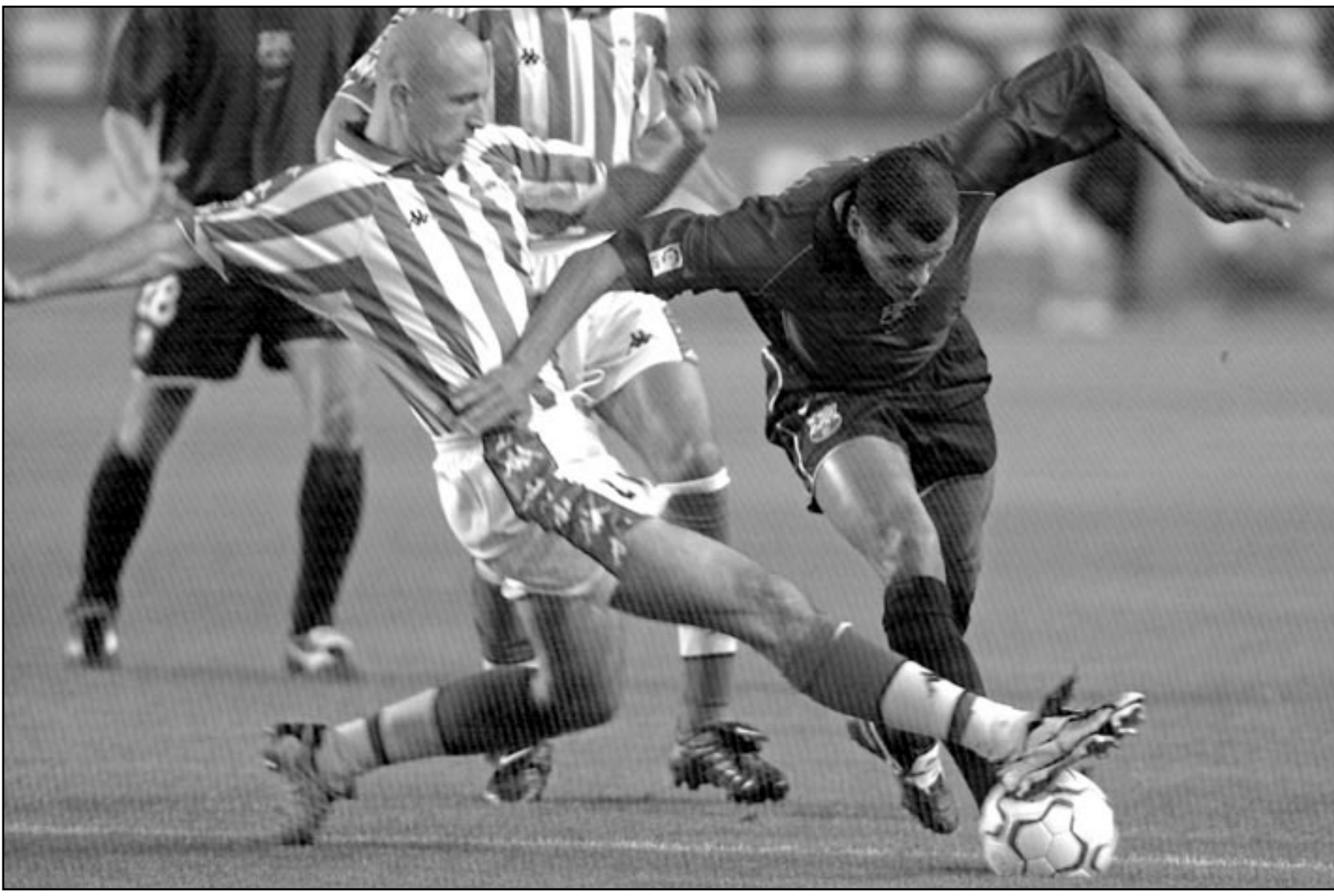
برشلونة (صورة من الارشيف)

■ انديان ويلز (كاليفورنيا) - رويترز: تغلبت المصنفة الثانية -3 هينغيس ماريتيا هينغيس على الامريكية مونيك سيليخ 6/7 و4/6 في بطولة انديان ويلز للتنس للسيدات البالغة من العمر 18 عاما هانتوشوفا البالغة من العمر 29 عاما والتي تغلبت في الدور قبل النهائي على السويصري ايمانويل جالبارني 6/صفر و4/6. وتاهل المصنفة الثانية الروسى يلفغيني كالفينيكوف لدور الثمانية بعد فوز صعب على الارجنتيني خوان اجناسيو شيليا 6/7 و4/6 في بطولة التاهل لنهايتي للمرة الثالثة في خمس مشاركات لها بالبطولة. ولم تستطع سيليخ كسر ارسال هينغيس في المجموعة الاولى ولم