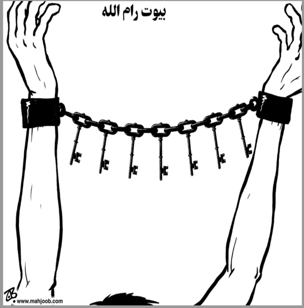
بيوت رام الله