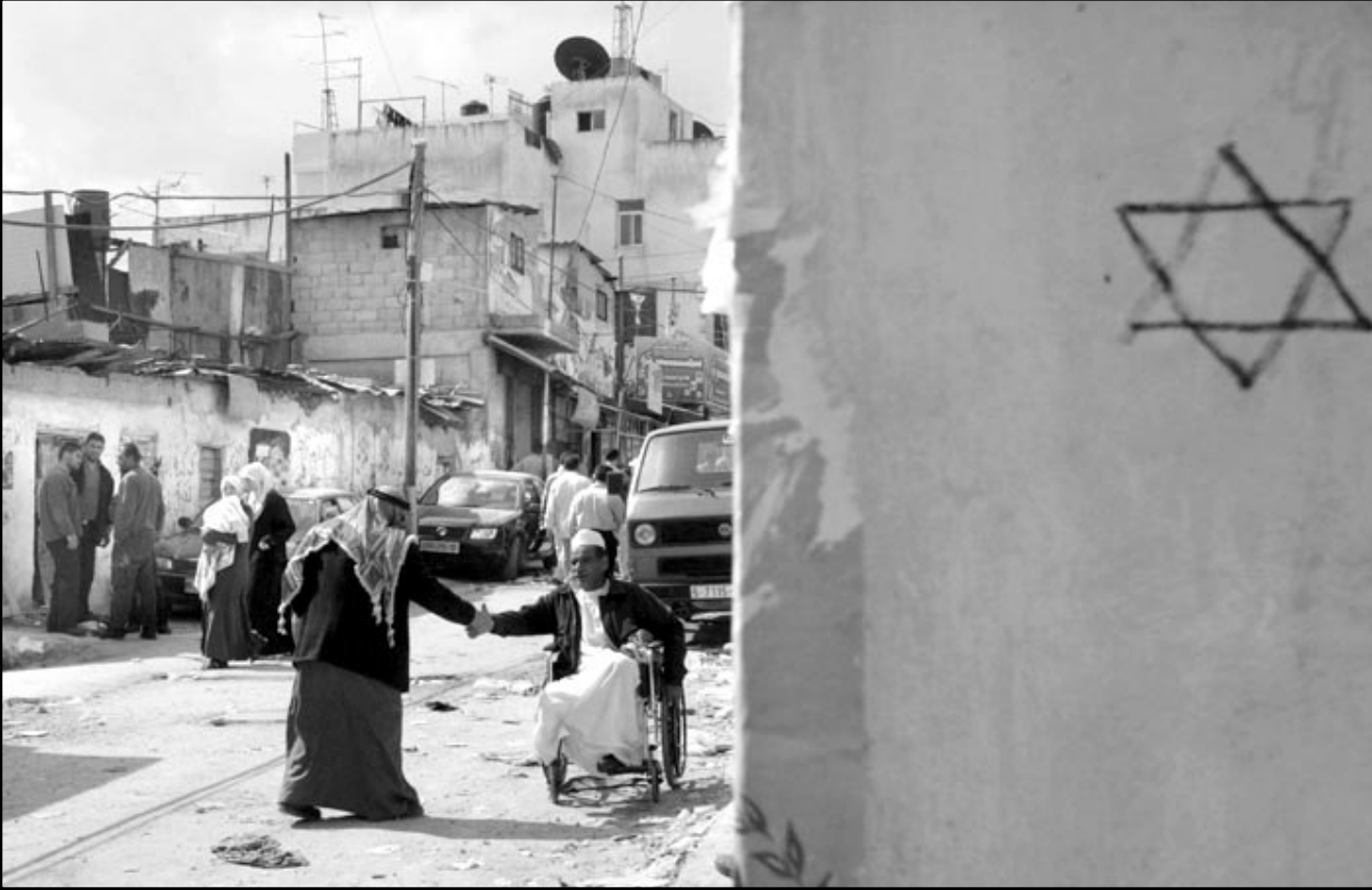
فلسطينيان يقدمان التهنتنة لبعضهما البعض بعد انسحاب الجيش الاسرائيلي من مخيم الامعري في رام الله

حركاته حادة وغير مفهومة.. افراف في الأب أو كفة في الأب.. مظاهر سلوك غير عادي غريب وغير اعتيادي.. يبدو ان الفلسطينيين قد استفادوا من هذه الحاضرة أكثر من استفادة الجيش منها، سبارو كيت، مونت، سي بودماركيت، الاصابات المتفجرة، الحواجز القس وحج العودة من خلال العنف، هو انتصار.. اما عملية الدخول للمدن والمخيمات، جيش الدفاع كان يرد فقط.