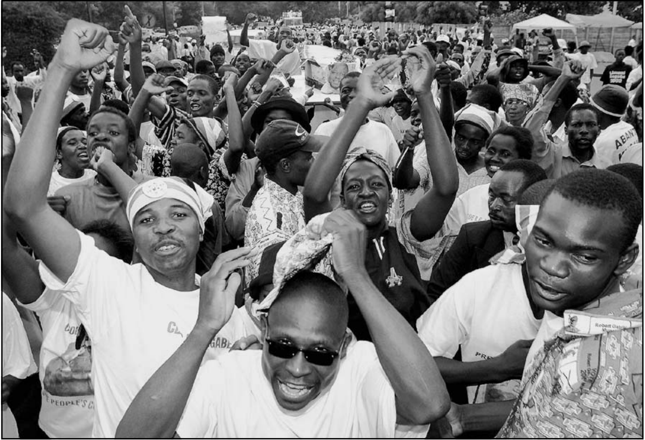
مؤيدو موغابي يحتفلون بغوزه في انتخابات الرئاسة

مكلفة اعتماد الصحافيين المحليين ومنح رخص استغلال كافة اجهزة الاعلام العاملة في زيمبابوي. وسيتم تعيين اعضاء اللجنة ومن بينهم عدد من ممثلي الصحافة من قبل وزير الاعلام جوناثان مويو بالتشاور مع الرئيس موغابي. وقد بات محظورا نشر معلومات مجلس الوزراء وغيره من الاجهزة الحكومية.