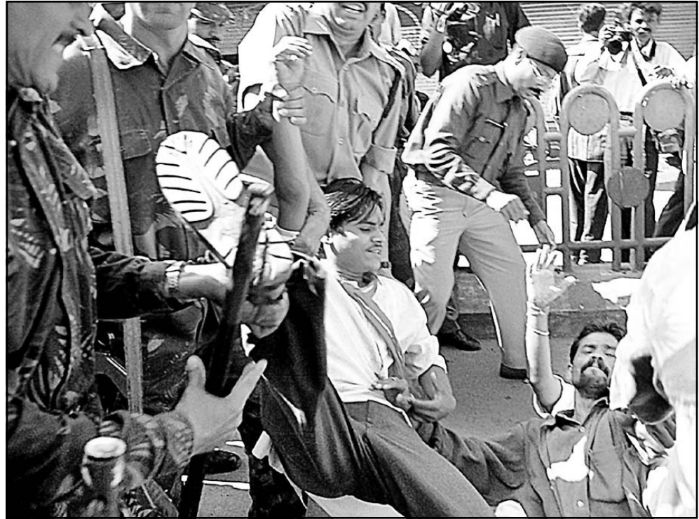
الشرطة الهندية توقف مظاهرة لتطرفين هندوس الجمعة

اشطن - ا ف ب: اظهرت مقطعات من وثيقة حول السياسة النووية الامريكية نشرت الخميس في واشنطن ان الولايات المتحدة قد تتوقف عن احترام قرار تجريد التجارب النووية لتتمكن من انتاج جيل جديد من الاسلحة مضادة للتحصينات. وتشر هذه الوثيقة التي تشير ايضا الى احتمال تنفيذ هجمات نووية امريكية ضد دول لا تملك سلاحا نوويا لكنها تسعى الى تطوير اسلحة الدمار الشامل، منذ اسبوع جدا واسعا في الصحف الامريكية وبين