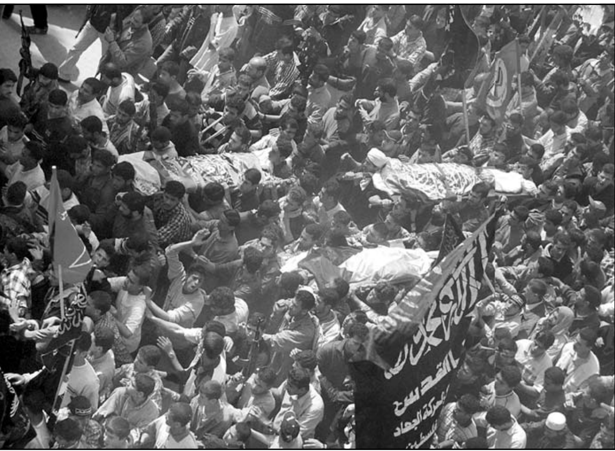
فلسطينيون يشاركون في تشييع جثامين ثلاثة شهداء فلسطينيين في رفح

■ غزة - رام الله - بيت لحم - القدس العربي - وكالات: استشهد ستة فلسطينيين وقتل اسرائيلي في الضفة الغربية وقطاع غزة فيما وصلت اسرائيل عدوانها على الاراض الفلسطينية حيث توغلت الدبابات والجرافات الاسرائيلية في مخيم لاجئين الفلسطينيين بحي البرازيل في وقت مبكر من امس في جنوب قطاع غزة قرب الحدود مع مصر وفي مدينة بيت لحم.