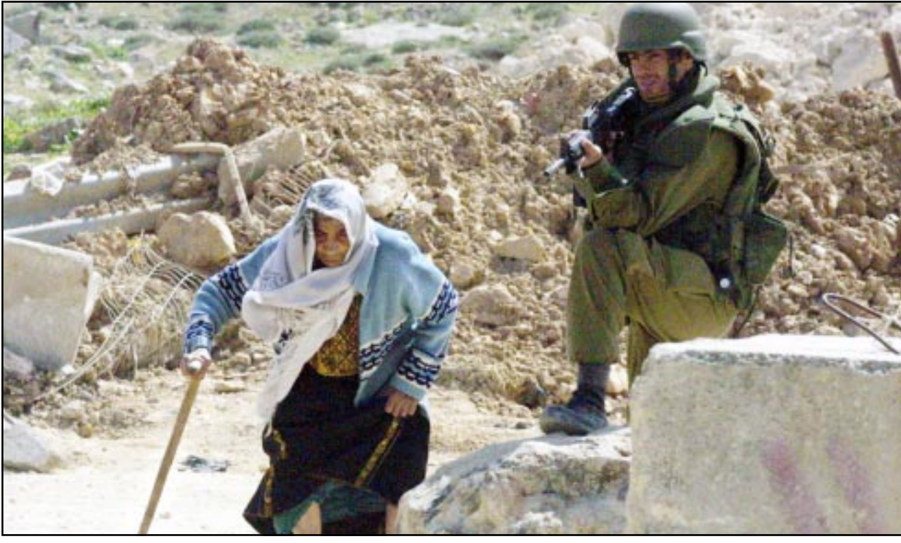
جندي اسرائيلي يمتع عجورا فلسطينية من المرور عبر حاجز قلنديا على مداخل مدينة رام الله

واضاف خلال مؤتمر صحافي في البيت الابيض ان «ثبنت في حصة او حصة مواقع دخلناها وجود عصية الجمره اللعينة في بعضها». وقال «لم يكن هناك كميات كبرى». موضحا ان الآثار التي عثر عليها كانت «طفيفة»، ولم يستبعد ان تكون عصيات الجمره اللعينة ناجمة عن تكاثر طبيعي، مضيفا ان تحاليل اضافية تجري حاليا. وقد اكد الجيش الامريكي السبت العثور في جنوب افغانستان على مخبر قيد البناء لشبكة القاعدة قرب قندهار في جنوب افغانستان من عدان اجل انتاج فؤاد السم، غير ان الصلوات رابعة السنوي من جهة اخرى اعطت السلطات الافغانية مسلحين يعملان لحساب القوات الامريكية أسس الاثنى لاشتباه