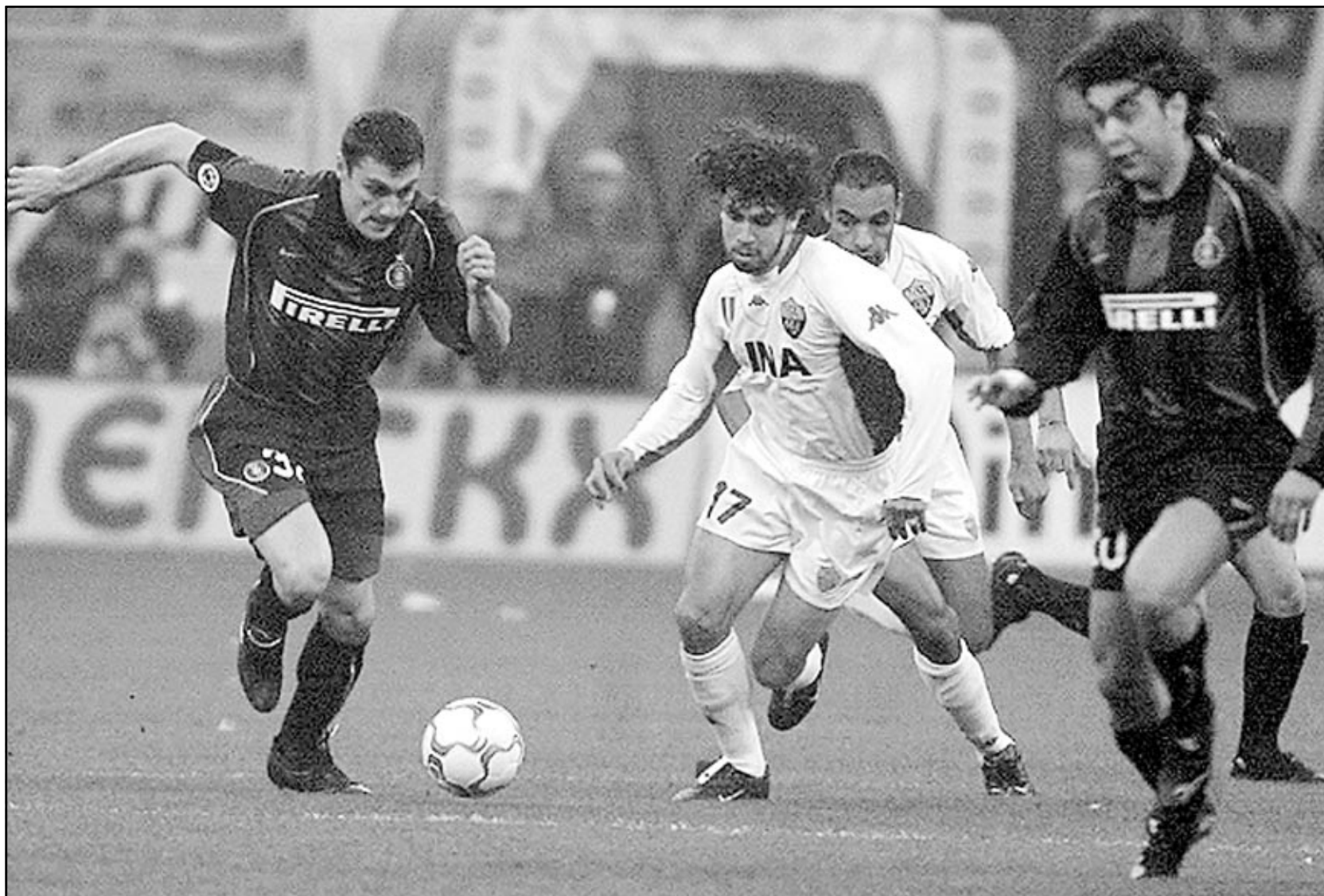
لقطة من إحدى مباريات انترميلان

■ ابيدجان-رويترز: وصل سيب بلاتر رئيس الاتحاد الدولي لكرة القدم (فيفا) الى افريقيا في اول زيارة له منذ ان أعلن عيسى حياتو رئيس الاتحاد الافريقي لكرة القدم ترشيح نفسه امامه في انتخابات رئاسة الفيفا. وقال بلاتر للصحافيين عند وصوله في وقت متأخر من مساء الاحد «لا أقوم بحملة انتخابية لاني الرئيس المنتخب ان يعقد مجلس الاتحاد جلسته