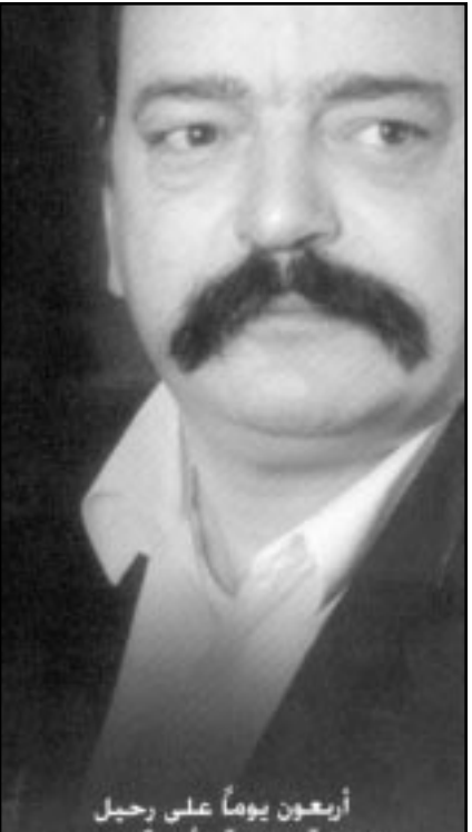
أربعون يوماً على رحيل الروائي العربي الأردني الكبير