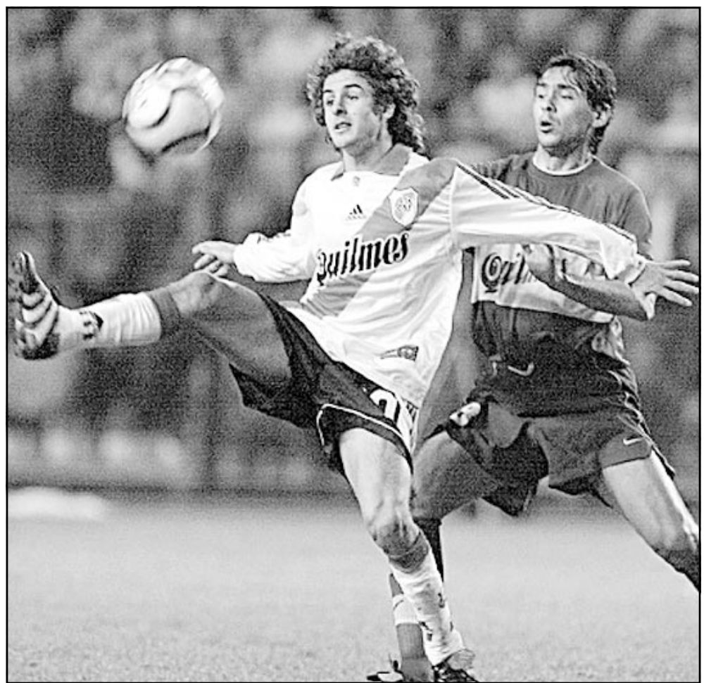
لقطة من إحدى مباريات ريفر بلايت الارجنتيني

■ بروكسل-أ ف ب: انتزع غناك صدارة الدوري البلجيكي لكرة القدم اثر فوزه على ضيفه شارلروا 3-2، وهزيمة المتصدر السابق كلوب بروج امام ضيفه لاغانوا 3-صفر-1 في ختام المرحلة الثامنة والعشرين. ووقع غناك رصيده الى 61 نقطة مقابل 59 لكلوب بروج، و55 لاندراخت حامل اللقب التي تعادل مع ستاندار لياج صفر-صفر في افتتاح المرحلة. وصعد مسكرون الى المركز الرابع على حساب ستاندار لياج بفوزه على مضيغه بيفيرين 1-صفر، فيما فاز انثورب على سان ترون 4-1، ولوكيرين على فيسترولو 2-صفر، وليريس على لوميل 3-6، ولوفير على مونتنيك 1-صفر.