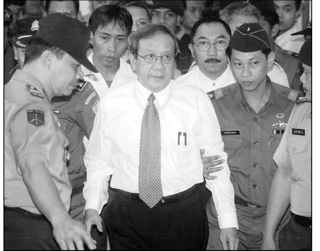
ضباط شرطة يقادون رئيس البرلمان الاندونيسي أكبر تانويونغ إلى المحكمة أمس بجاكرتا

■ جاكرتا - اف ب: بدأ أحد أهم المسؤولين السياسيين في اندونيسيا وهو رئيس البرلمان أكبر تانويونغ المتول أمس الاثنين امام القضاء في قضية فساد. ويشبهه في أكبر تانويونغ وهو ايضا رئيس ثاني حزب في البلاد «غولكار»، في انه حصل سنة 1999 على نحو اربعة ملايين دولار من الاموال العامة التي كانت مخصصة لتسهيل القراءة كما يشبهه في ان هذه الاموال استخدمت لتمويل حملته الانتخابية. وفي حال ادين أكبر تانويونغ الذي اعتقل في السابع من الشهر الجاري، قد يصدر في حقه حكما بالسجن عشرين سنة. وتمثل القضية في الاستحواذ على اربعين مليار روبية (نحو اربعة ملايين دولار) من الوكالة الوطنية للتمويل «بولوغ»، وكان هذا المبلغ مخصصا لبرنامج مساعدات غذائية للقراء. وكان أكبر تانويونغ آنذاك وكيل الدولة للرئيس بي.جي. حبيبي ومسؤول عن استخدام هذه الاموال. ويشبهه القضاء في ان هذه الاموال استخدمت لتمويل الحملة الانتخابية لحزب «غولكار» الذي ينتمي اليه الرئيس السابق سوهارتو. وأكد المنهم من جهته انه سلم هذه الاموال لمؤسسة اسلامية