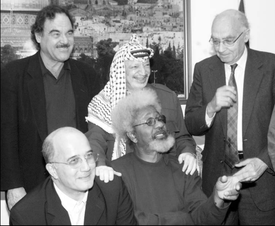
الرئيس الفلسطيني ياسر عرفات يلتقي نخبة من الفنانين والمثقفين العالميين ضمت (من اليسار الى اليمين) المخرج الأمريكي ايليفر ستون، المدير الفني للبرنامج الدولي للكتاب كريستيان سالون، والاديبين الهائزين على جائزة نوبل وول سويكنا وخوسيه ساراماغو

■ رام الله - اف ب: اعتبر الاديبي الفلسطيني وحامل جائزة نوبل للاداب البرتغالي جوزيه ساراماغو امس الاثنين ان الاحتلال الاسرائيلي للمناطق الفلسطينية اشبه ما يكون بمعسكرات النازية في الحرب العالمية الثانية. وقال ساراماغو الذي يزور الاراضي المحتلة ضمن وفد لبرنامج الكتاب العالمي «يجب ان نقر جميع الاجراس في العالم لنقول ان ما يحدث في فلسطين هو جريمة يمكن وقفها ويمكن مقتها بما حدث في اوشفيتز» العتقل النازي في بولندا. واضاف خلال مؤتمر صحافي في رام الله في الضفة الغربية «مع الأخذ بعين الاعتبار تباعد الأزمنة والامكنة فإن الامر هو ذاته وما يحدث قد تم نقله وذلك يعني ان الارض في معسكر اعتقال، ليست هناك معتقلات، ولكن من منظور الجيش، جيش الاحتلال الاسرائيلي، فان (مدينة) رام الله هي المعتقل وانتم جميعا سجناء فيه». وقد بدأ ساراماغو وسبعة ادياء عالمين اخرين من نيجيريا واسبانيا وايطاليا والصين وجنوب افريقيا وفرنسا والولايات المتحدة زيارة تضامنية الى الاراضي الفلسطينية