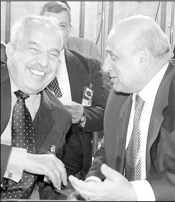
وزيرا خارجية مصر وليبيا يتأديان اطراف الحديث خلال الاجتماع