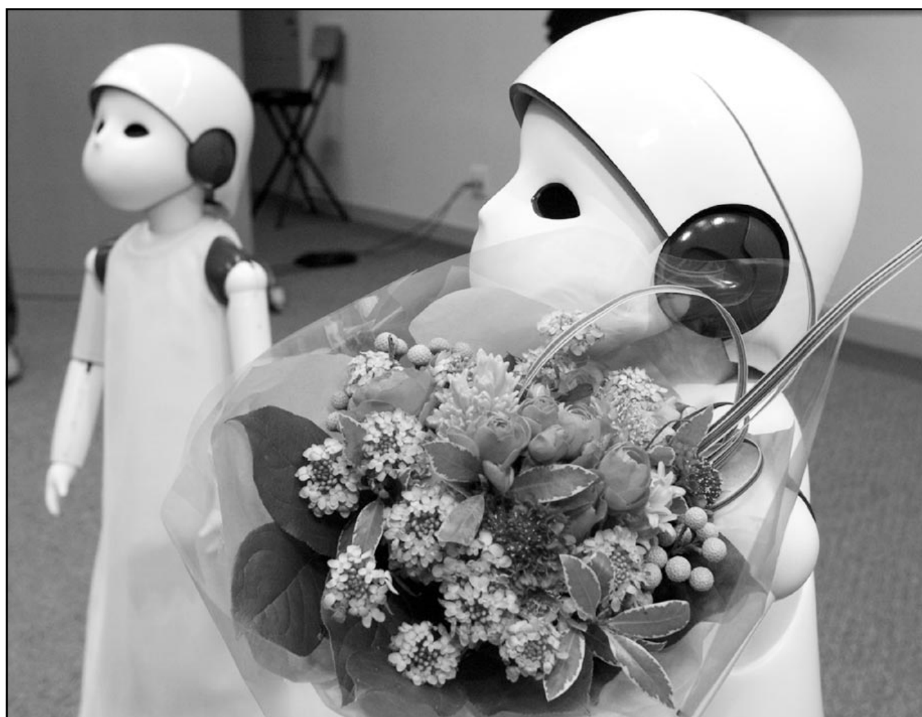
نموذجان من روبوت «بوزي» الذي انتجته شركة سيليكون غرافيكس اليابانية وكشفت عنه امس في طوكيو

وقبل الاعلان عن افلاسه العام 2001. بلغت ديونه 120 مليون ين اي حوالي مليون دولار استدانها من اكثر من 100 دائن. واضاف «اضطرت الى الطلاق لكي لا ازعج زوجتي واطفالي وتم حصل هذا في وقت انهارت فيه البورصة والسوق العقاري الا ان كواغوشي يؤمن بحسن طابعه المستثمر في قروض استهلاكية رسمية او في السوق السوداء بخواتم تتراوح بين 300 و400% سنويا.