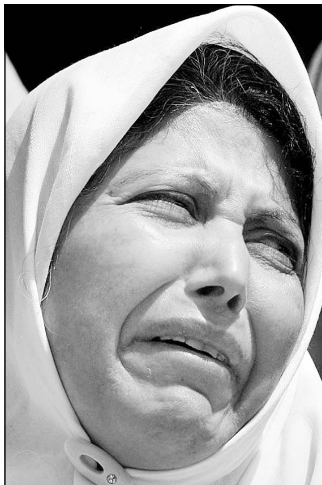
حليلة ابو عاصي تبكي لجيها الشهيد

اسمه «ان مغادرة عرفات لا تزال مرهونة بموافقة على الوراثة الامنية الامريكية وقرار وقف الاطلاق النار». وكان الوفد الامريكي انتوني زيني قدم خلال اجتماع اللجنة الامنية العليا يوم امس الاول ورقة عمل الى سطر في القمة العربية هذا الاسبوع موجهة الى الشعب الاسرائيلي وليس الى رئيس الوزراء الاسرائيلي ارييل شارون الذي لا يتفق فيه الزعماء العرب، وفي مقابلة مع رويترز الاحد قال الحريري الذي تستضيف بلاده القمة العربية يومى الاربعة والخميس المقبلين «لا اعتقد ان المبادرة السعودية موجهة الى اسيد شارون. انها موجهة الى العالم بأسره والى الشعب الاسرائيلي.. اذا كان شارون يريد قبولها فهذا شأنه، واذا كان يريد ان يرفضها فهذا شأنه ايضا، ففي كلا الحالتين سيحتمل مسؤولية القول او الرضا»، وقال الحريري ان ولي العهد