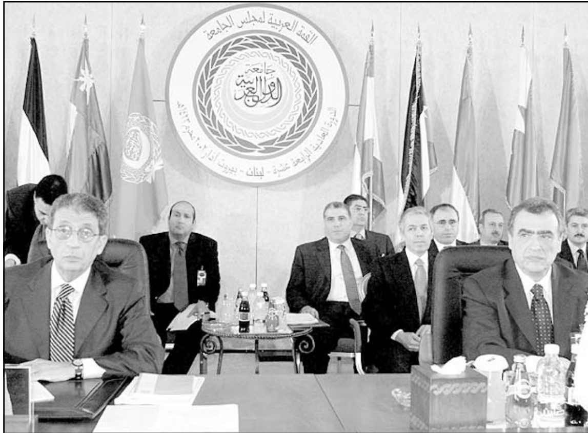
الامين العام لجامعة الدول العربية عمرو موسى (يسار) ووزير الخارجية اللبناني محمود حمود لدى افتتاحهما اجتماع وزراء الخارجية العرب