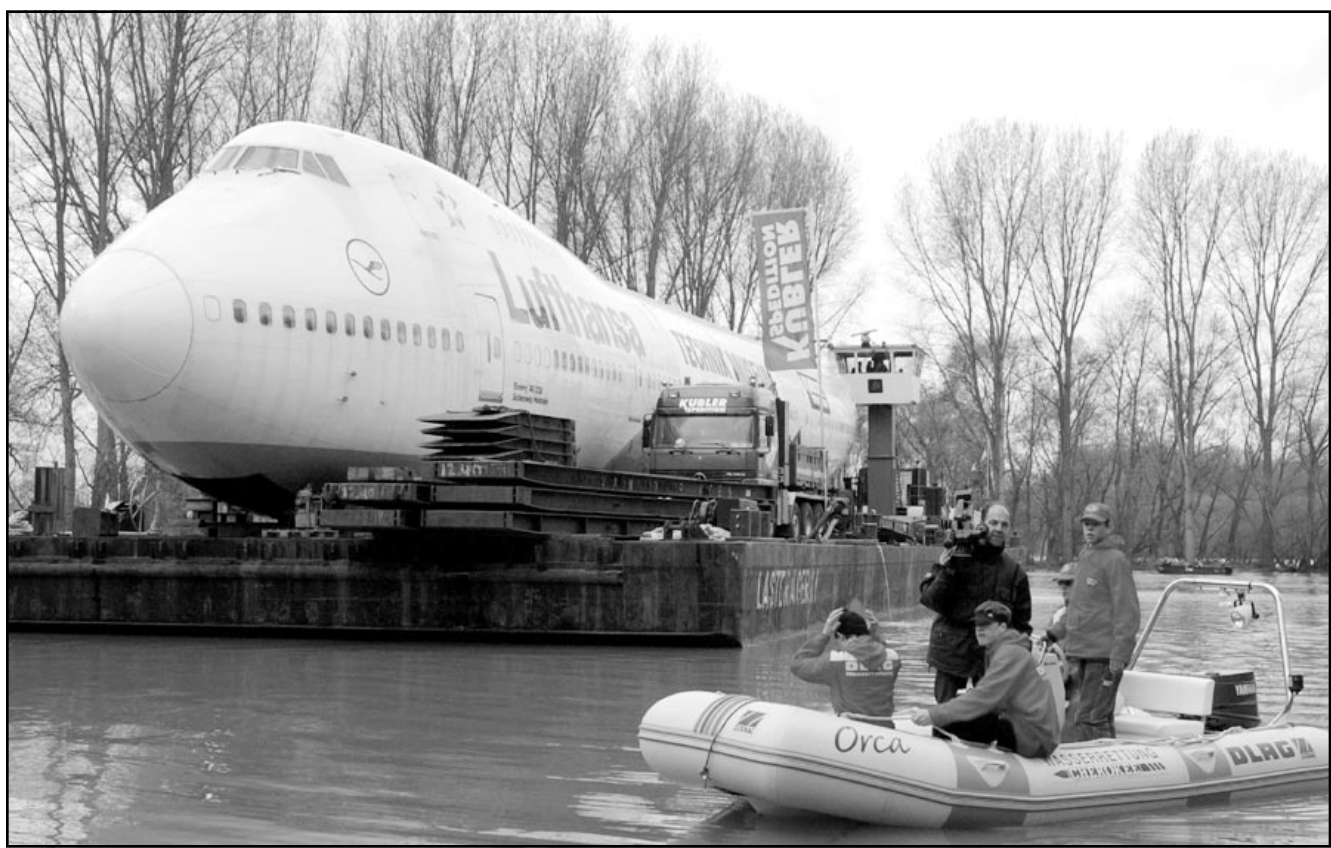
ميكال طائرة قديمة تابعة لشركة لوفتهانزا الالمانية من طراز بوينغ 747 تنقل على بارجة نهرية لتوضع في المتحف التكنولوجي في مدينة سيبير

■ تل ابيب - رويترز: قالت شركة طيران العال الاسرائيلية امس الاثنين ان خسائرها تقلصت في العام الماضي مقارنة بعام 2000 رغم الكساد والانتفاضة الفلسطينية المستمرة منذ 18 شهرا مما أدى لتراجع عدد السائحبن بنسبة 46 بالمئة. وقالت الشركة انها قلصت خسائرها الى 85,2 مليون دولار في عام 2001 من 109,4 مليون في عام 2000 بعد ان خفضت نفقاتها. وتحتت الشركة في تحسين احوالها في الوقت الذي تصارع فيه العديد من شركات الطيران في جميع أنحاء العالم لمواجهة آثار هجمات 11 ايلول (سبتمبر) في الولايات المتحدة، ونزلت ايرادات الشركة في العام الماضي الى 1,1 مليار دولار من 1,3 مليار دولار في العام السابق.