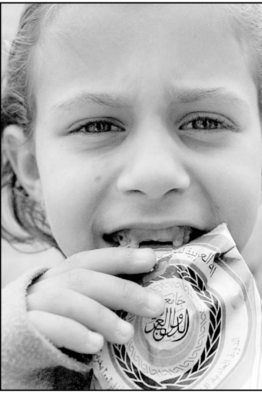
طفلة فلسطينية في مخيم مار الياس تحمل شعار الجامعة العربية (رويترز)

وقال المتحدث «الرئيس يعتقد ان رئيس الوزراء شارون والحكومة الاسرائيلية يجب ان تفكر بجدي في السماح لياسر عرفات بحضور الاجتماع في بيروت».