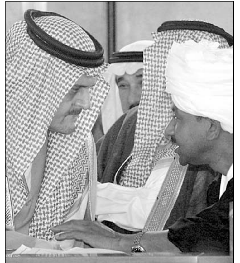
وزير خارجية السعودية يتحدث مع نظيره السوداني