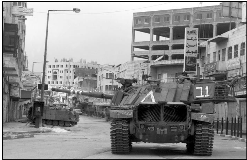
ديابة اسرائيلية تعبر الشوارع المقفرة في مدينة رام الله للاحتضام لأكثر من عشرين ديابة بدأت عمليات محاصرة وقصفها لقمم الرئيس الفلسطيني ياسر عرفات

الكلمة. هذا الاحساس المضمي بالحصار الشخصي الخائف لجمهور مقهور، لدولة على حافة الهاوية، لحكومة مترددة، بان العالم بأسره ضدنا معلما شعرنا عشية حرب الايام الستة، وثمنا في ذلك الحين، اليوم ايضا نتطوق دولة اسرائيل لاحتلال مدن الضفة لكسر طوق الخناق، يدور الحديث عن خطوة عسكرية واسعة النطاق، طويلة، كفيفة بان تتراقف - حسب التطورات - بتجنيد وحدات الاحتياط المقاتلة، وتضمن تلك الحرب اياها ناكها صباح مساء كل يوم، فاي شأر استطعنا الخطوة العسكرية الراهنة؟ وماذا سيكون في غداها؟ عملية عبد الفصح استقبلت في اسرائيل كاعلان حرب رسمية من السلطة الفلسطينية ضد الشعب اليهودي، ودولة اسرائيل - دون ان تعلن عن ذلك - فسررت امس شن الحرب، ومرت اخرى تجدنا تناخر عن منطقة القطار، ففي الوقت الذي يث فيه التلفزيون صور الدبابات المتحررة على الطريق، تسلسل ناشطون الى عن غنض موريه، وفي هذه الساعات بائذات تنطلق الى الدرب، على الارض، نحو 15 عميلة اخرى، ليس عمليات نظرية بل تحذيرات حامية لوطيس، تتدحرج، من كل لمنظماة، تنظيم نابلس، تنظيم رام الله، حماس، الفصائل، الجهاد الاسلامي، الجبهة الشعبية، لجان المقاومة، التحذيرات في قطاع غزة تتحدث عن هجوم على الدبابات والمستوطنات والمواعظ، والتحذيرات في نابلس تتحدث عن عمليات داخل الخط الأخضر: اطلاق نار، انتحار، اجزلة نارية، وكل ما في متناول اليد، المنظمة متواجبة، والعنف في ذروته، ولا توجد اي توجيهات من فوق، من السلطة، بالتوقف، وفي الاخبارات الاسرائيلية «الشاباك» يعترضون ان مثل ذرى الاهراب هذه لم تحصل الاذخول الى مدن الضفة ليومين - ثلاثة، ولهاذا، فان هذا