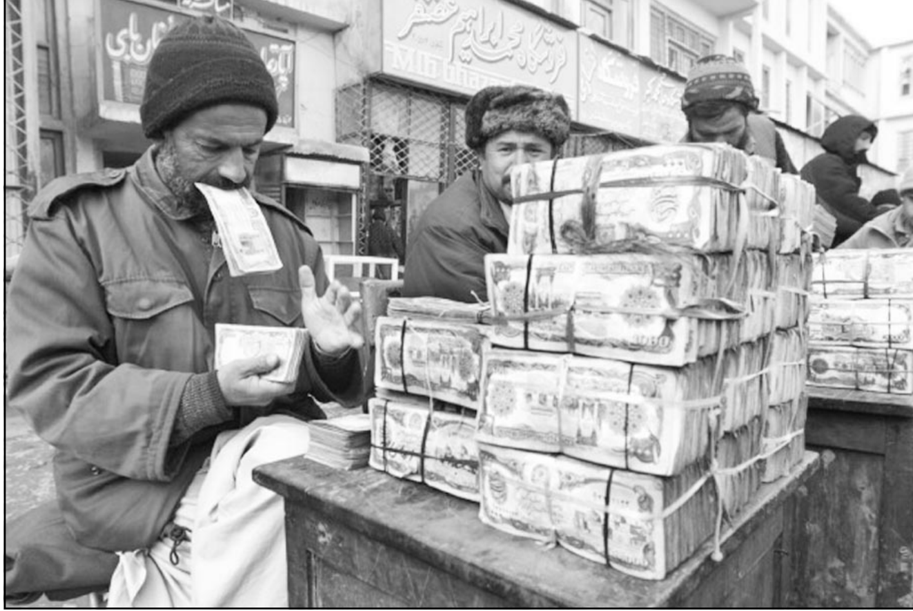
صرافو عملة في العاصمة الافغانية كابول