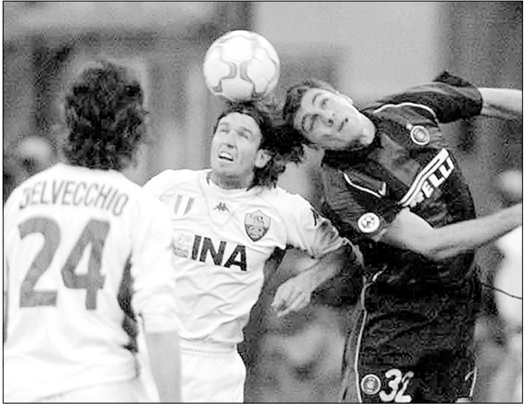
لقطة من إحدى مباريات روما