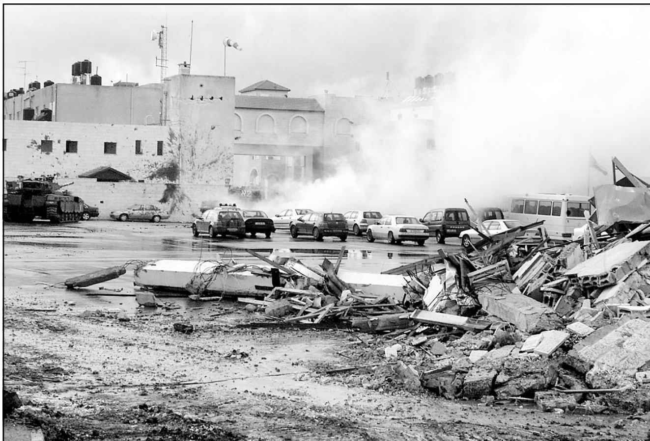
جثمان أحد الشهداء الذي قتل برصاص الجيش الإسرائيلي في رام الله