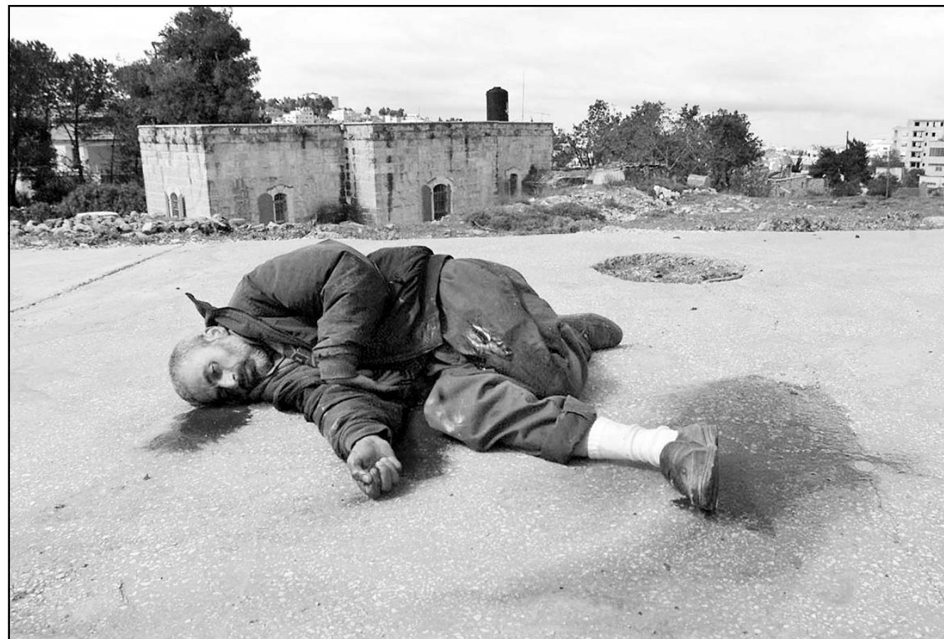
جثمان أحد الشهداء الذي قتل برصاص الجيش الإسرائيلي في رام الله