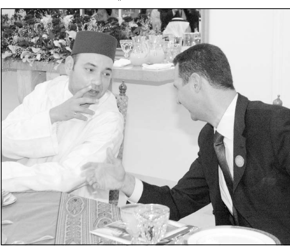
الملك محمد السادس ملك المغرب يتحدث مع الرئيس السوري بشار الاسد اثناء حفل عشاء اقيم على شرف الرؤساء والامراء والملوك العرب المشاركين في قمة بيروت، والتي انتهت اعمالها الخميس الماضي.