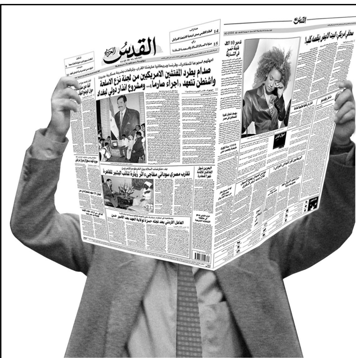
صحيفة الخبر الموضوعي، والرأي المستقل، والثقافة الجادة

خرج الاقتصاد الأمريكي نهاية العام 2001 من انكماش قصير الابد عبر تسجيله نموا اكبر مما كان متوقعا يفترض ان يشهد تسارعا كبيرا خلال الاشهر المقبلة. الخمس ان اجمالي الناتج الداخلي الأمريكي تحسن بنسبة 1,7% سنويا في الفصل الرابع من العام 2001 في حين انها كانت تتوقع ان يرتفع بنسبة 1,4% فقط. وهذه الارقام نهائية وفاجأت المحللين ايجابا إذ كانوا يتوقعون الا