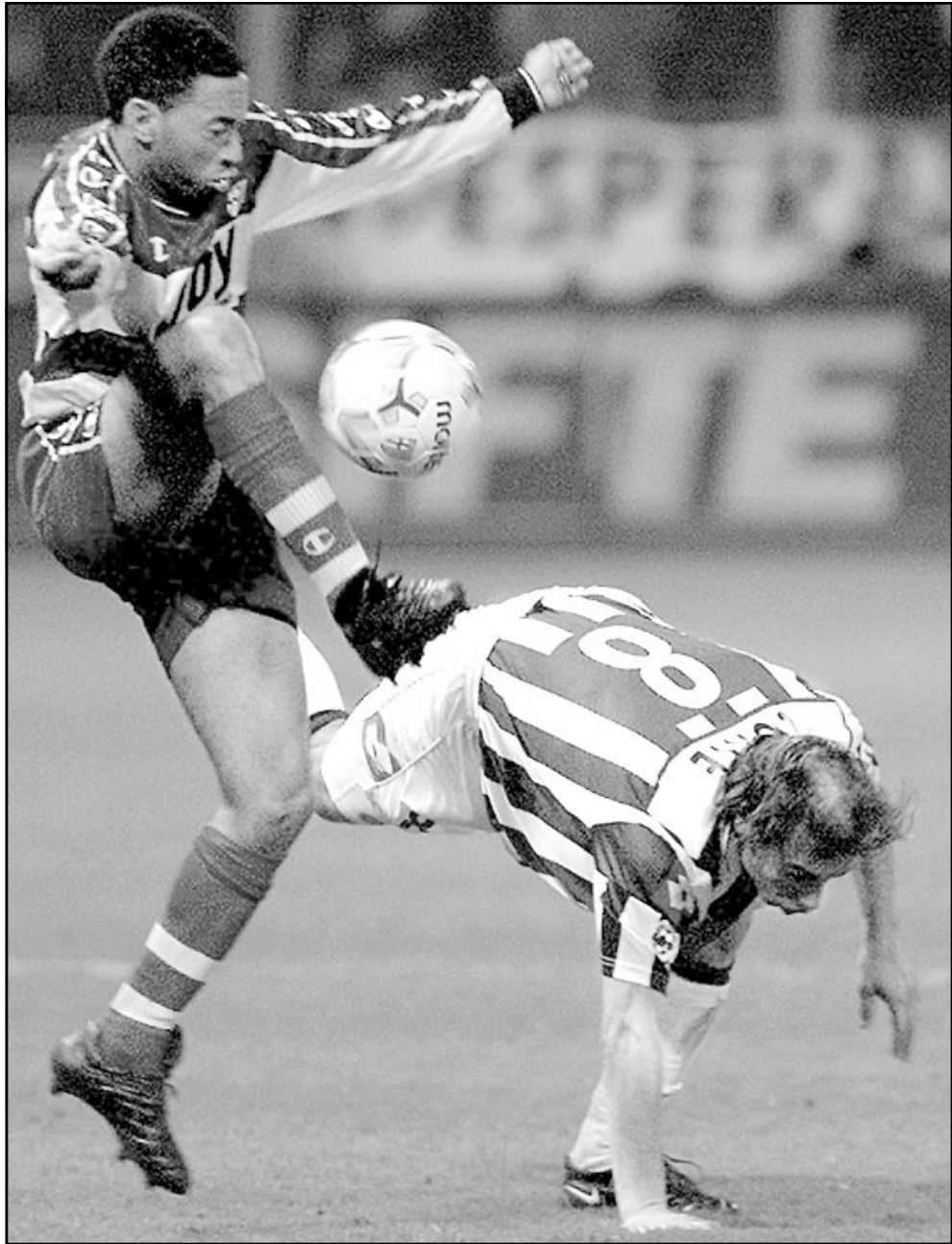
...وأخرى من إحدى مباريات يوفنتوس